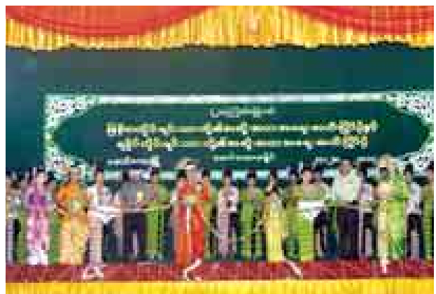
ရခိုင်ပြည်နယ် မောင်တောခရိုင် (၂၁)ကြိမ်မြောက် မြန်မာတိုင်းရင်းသားတို့၏ ရိုးရာယဉ်ကျေးမှု ဆို၊ က၊ ရေး၊ တီးဖြင့်ပွဲနှင့် ရခိုင်တိုင်းရင်းသားတို့၏ ရိုးရာယဉ်ကျေးမှု ဆို၊ က၊ ရေး၊ တီးဖြင့်ပွဲ ဖွင့်ပွဲအခမ်းအနားကို စက်တင်ဘာ ၂၇ ရက်က မောင်တောမြို့ သီရိမင်္ဂလာခန်းမ၌ ကျင်းပစဉ်။ (ခရိုင် ပြန်/ဆက်)

ညစာစားပွဲအပြီးတွင် တပ်မတော်ကာကွယ်ရေးဦးစီးချုပ်၊ ဂျပန်နိုင်ငံရေးပါတီများ၏ ခေါင်းဆောင်အချို့နှင့် The Nippon Foundation ဥက္ကဋ္ဌတို့သည် လက်ဆောင်ပစ္စည်းများ အပြန်အလှန်ပေးအပ်ကြပြီး အဖွဲ့ဝင်များနှင့်အတူ အမှတ်တရ စုပေါင်းဓာတ်ပုံရိုက်ခဲ့ကြကြောင်း သတင်းရရှိသည်။ (မြဝတီ)