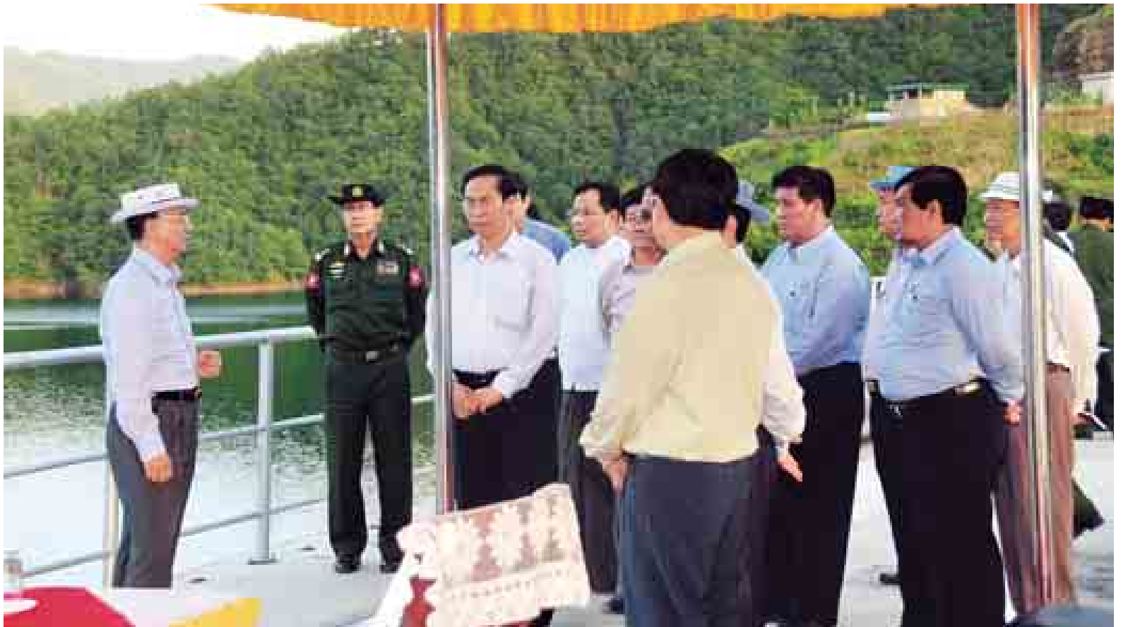
နိုင်ငံတော်သမ္မတ ဦးသိန်းစိန် ရဲရွာရေအားလျှပ်စစ်စီမံကိန်း၌ ကြည့်ရှုစစ်ဆေးစဉ်။

ရှေးဦးစွာ နိုင်ငံတော်သမ္မတသည် စီမံကိန်းရှင်းလင်းဆောင်အနီးရှိ ရှုရပ်နေရာ၌ ခင်းကျင်းပြသထားသည့် မြို့ကြီးရေလှောင်တံတားစီမံကိန်း ပုံစံငယ်စာမျက်နှာ ၈ ကော်လံ ၁