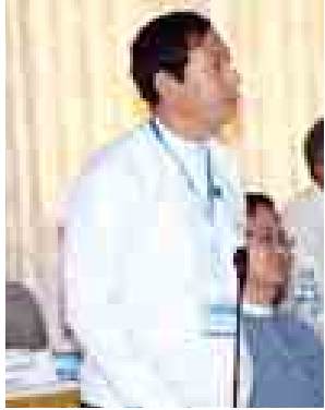
ပြည်ထောင်စုဝန်ကြီး ဦးသန်းဌေး ဆွေးနွေးစဉ်။ (သတင်းစဉ်)

တိုင်းရင်းသား ကိုယ်စားလှယ်များ သာမက အခြားတိုင်းရင်းသား လက်နက်ကိုင်အဖွဲ့အစည်းမှ ခေါင်း ဆောင်များ၊ နိုင်ငံရေးပါတီများ၊ အခြားသက်ဆိုင်ရာ နယ်ပယ်အသီး သီးမှ ကိုယ်စားလှယ်များနှင့် ခေါင်း ဆောင်များက လေ့လာသူအဖြစ် တက်ရောက်ခဲ့ကြသည်။ ဒုတိယအကြိမ် ပြုလုပ်သည့် UPWC၊ NCCTနှင့် နိုင်ငံရေးပါတီ များ၏ ငြိမ်းချမ်းရေးလုပ်ငန်းစဉ်များ နှင့်ပတ်သက်သည့် သုံးပွင့်ဆိုင် တွေ့ဆုံဆွေးနွေးပွဲ အခမ်းအနားသို့ တရားဝင်မှတ်ပုံတင်ထားသည့် ပါတီ ၆၇ ခုကို ဖိတ်ကြားခဲ့ရာ နိုင်ငံရေး ပါတီ ၆၁ ခုမှ ကိုယ်စားလှယ်များ တက်ရောက်ခဲ့သည်။ ၂၀၁၄ ခုနှစ် ဩဂုတ် ၁၈ ရက်က