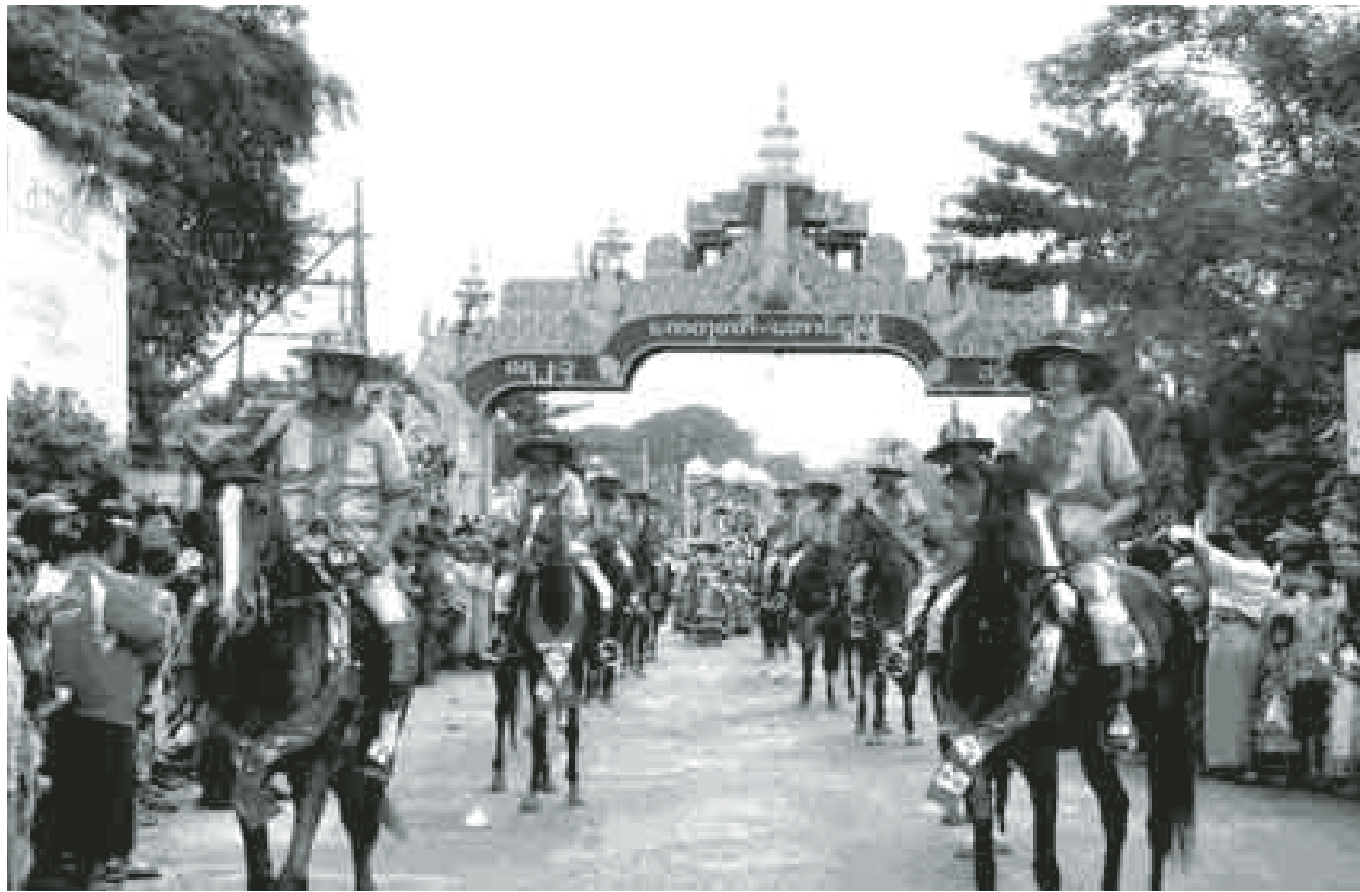
ယမန်နှစ်က ကေတုမတီ(တောင်ငူ)မြို့တည်နန်းတည်ပွဲတော် စည်ကားသိုက်မြိုက်စွာ ဤသို့ကျင်းပခဲ့သည်။