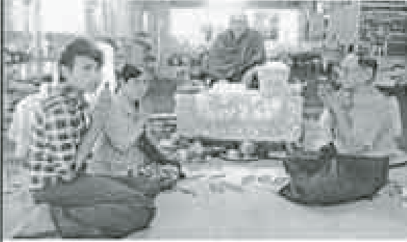
သာသနာ့အဖွဲ့အစည်းတို့၏ ဝမ်းမြောက်စွာ အစားအသောက် အိပ်စက်ခြင်း