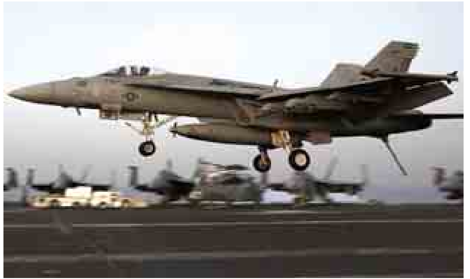
ဆီးရီးယားနိုင်ငံအတွင်း အိုင်အက်စ်တို့အား လေကြောင်းတိုက်ခိုက်ရန် အမေရိကန်တိုက်လေယာဉ်တစ်စင်း ပြေးလမ်းမှ ပြန်တက်စဉ်။

အိုင်အက်စ်တို့အား တိုက်ခိုက်ရာတွင် အရှေ့အလယ်ပိုင်းမှ နိုင်ငံအချို့အပါအဝင် နိုင်ငံပေါင်း ၄၀ မှ ပါဝင်တိုက်ခိုက်လျက်ရှိသည်။ (ဘီဘီစီ)