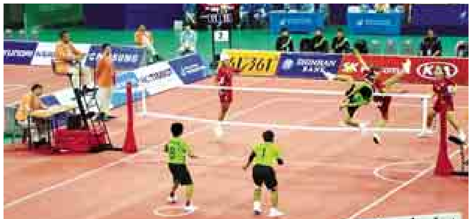
အမျိုးသမီး သုံးယောက်တွဲ ပိုက်ကျော်ခြင်းပြိုင်ပွဲ မြန်မာအသင်း (အစိမ်း)နှင့် အင်ဒိုနီးရှားတို့ ယှဉ်ပြိုင်စဉ်။

နပန်းပြိုင်ပွဲတွင် မြန်မာအသင်းမှ ဝင်ရောက်ယှဉ်ပြိုင်ရာတွင် ၄၈