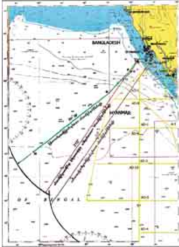
ပင်လယ်ပြင်ဥပဒေဆိုင်ရာ နိုင်ငံတကာခုံရုံး (International Tribunal for the Sea-ITLOS)သို့ မြန်မာနိုင်ငံနှင့် ဘင်္ဂလားဒေ့ရှ်နိုင်ငံတို့မှ အဆိုပြု တင်သွင်းသော ပင်လယ်ပြင်နယ်နိမိတ်မျဉ်းနှင့် ခုံရုံးမှ သတ်မှတ်ပေးသော မျဉ်းများပြပုံ

၁၄။ ITLOS က ၁၄-၇-၂၀၁၂ ရက်နေ့တွင် ပိုင်နက်ပင်လယ်ပြင် နယ်နိမိတ်မျဉ်းကို အောက်ပါတိုင်းရေးဆွဲသတ်မှတ်ပေးခဲ့ပါသည်-