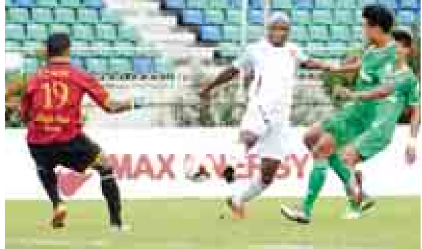
ရော့တီနှင့်ချင်းယူနိုက်တက်တို့ ယှဉ်ပြိုင်ကစားစဉ်။

အောင်ဆန်းကွင်း၌ ကစားသည့် ပွဲတွင် ကမ္ဘောဇက ဇွဲကပင်ကို နှစ်ဂိုး-ဂိုးမရှိဖြင့် အနိုင်ရသည်။ ယနေ့ပွဲအဖြစ် သုဝဏ္ဏတွင်း၌ ဆောက်သမ်းနှင့် ရတနာပုံ၊ အောင်ဆန်းကွင်း၌ GFA နှင့် မနောမြေ၊ YUSC ကွင်း၌ ရန်ကုန်နှင့် မကွေးတို့ ကစားကြမည် ဖြစ်သည်။