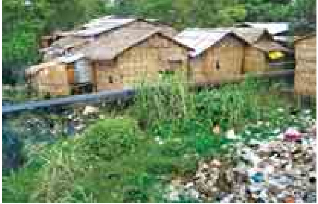
လောင်မှုဖြစ်ပေါ်နိုင်၍ ဂက်စ်ပိုက်လှိုင်းအနီး နေထိုင်သော တဲများရှိ မသိနားမလည်သော ကလေးများ ဆော့ကစားမိရာမှ အန္တရာယ်ဖြစ်နိုင်သည်။ သို့ဖြစ်၍ ကြိုတင်ကာကွယ်သည့်အနေဖြင့် ဂက်စ်ပိုက်လှိုင်းနှင့် မလွတ်သောတဲများကို ရွှေပြောင်းပေးရန် အမှတ်(၃) ရပ်ကွက်နေပြည်သူများက လိုလားလျက်ရှိကြောင်း သိရသည်။ မြင့်မြတ်သစ္စာ

လှိုင်းပေါ် ဆောက်လုပ်ထားသော ဆိုင်တဲများမှ မီးဘေးအန္တရာယ်ကို ရပ်ကွက်သူ ရပ်ကွက်သားများ စိုးရိမ်လျက်ရှိကြောင်း သိရသည်။ လှိုင်သာယာ ဂက်စ်အရောင်းဆိုင် (၁) (၂) သို့ ဆက်သွယ်ထားသော ၁၄ လက်မ အရွယ်ဂက်စ်ပိုက်လှိုင်းသည် ရွှေပြည်သာခွဲရုံမှ ပို့လွှတ်သော ဂက်စ်ပိုက်လှိုင်းဖြစ်ပြီး ဂက်စ်ပိုက်လှိုင်းထိခိုက်မိ၍ ဂက်စ်ပိုက်ပေါ်မှ မီးလောင်မှုသုံးကြိမ် ဖြစ်ပွားခဲ့သည်။ ရွှေလင်ပန်းစက်မှုဇုန်၌ Back Hole ယာဉ်ဖြင့် ထိခိုက်မိသော ဖြစ်စဉ်တွင် မီးလောင်မှုဖြစ်၍ ဂက်စ်ပိုက်လှိုင်းအနီးရှိတဲမှ အမျိုးသမီးတစ်ဦးသေဆုံးမှု ဖြစ်ပွားခဲ့သည်။ ယခုကဲ့သို့ ဂက်စ်ပိုက်လှိုင်းပေါ်ရှိ စားသောက်ဆိုင်နှင့် တဲများမှ စွန့်ပစ်သော အမှိုက်များမှတစ်ဆင့် မီး