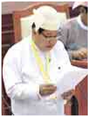
ဒုတိယဝန်ကြီး ဦးခင်ဇော် မြေကြားစဉ်။ (သတင်းစဉ်)

အစိုးရသစ် တာဝန်ယူသည့် အချိန်အတွင်း ရန်ကုန်တိုင်းဒေသကြီး သုံးခွဲမြို့နယ် မုတ္တမပင်လယ်ကမ်းစပ်