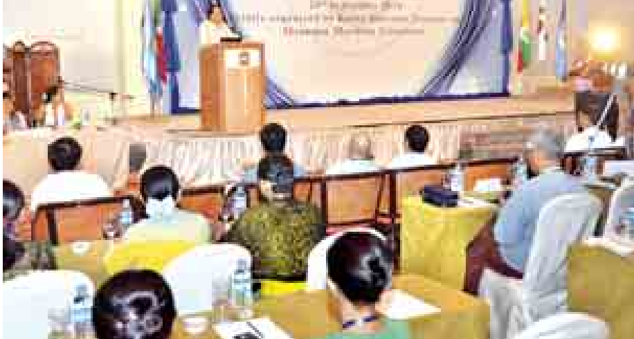
တတိယအကြိမ် Korea Myanmar Ocean Forum စာတမ်းဖတ်ပွဲကျင်းပစဉ်။

သွင်းဆွေးနွေးခဲ့သည်။ ယနေ့အစည်းအဝေးကို နံနက် ပိုင်းတွင် ရပ်နားလိုက်ပြီး အစည်း အဝေး (၁၁) ရက်မြောက်နေ့ကို စက်တင်ဘာ ၂၉ ရက်တွင် ကျင်းပ မည်ဖြစ်ကြောင်း သိရသည်။ (သတင်းစဉ်)