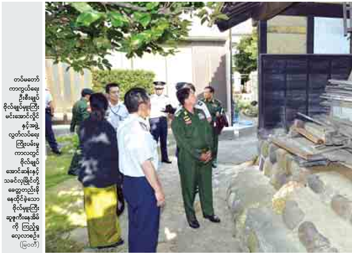
တပ်မတော် ကာကွယ်ရေးဦးစီးချုပ် ဗိုလ်ချုပ်မှူးကြီး မင်းအောင်လှိုင် နှင့်အဖွဲ့ လွတ်လပ်ရေးကြိုးပမ်းမှုကာလတွင် ဗိုလ်ချုပ်အောင်ဆန်းနှင့် သခင်လှမြိုင်တို့ ခေတ္တတည်းခိုနေထိုင်ခဲ့သော ဗိုလ်မှူးကြီး ဆူရူးကီးအိမ်ကို ကြည့်ရှုလေ့လာစဉ်။