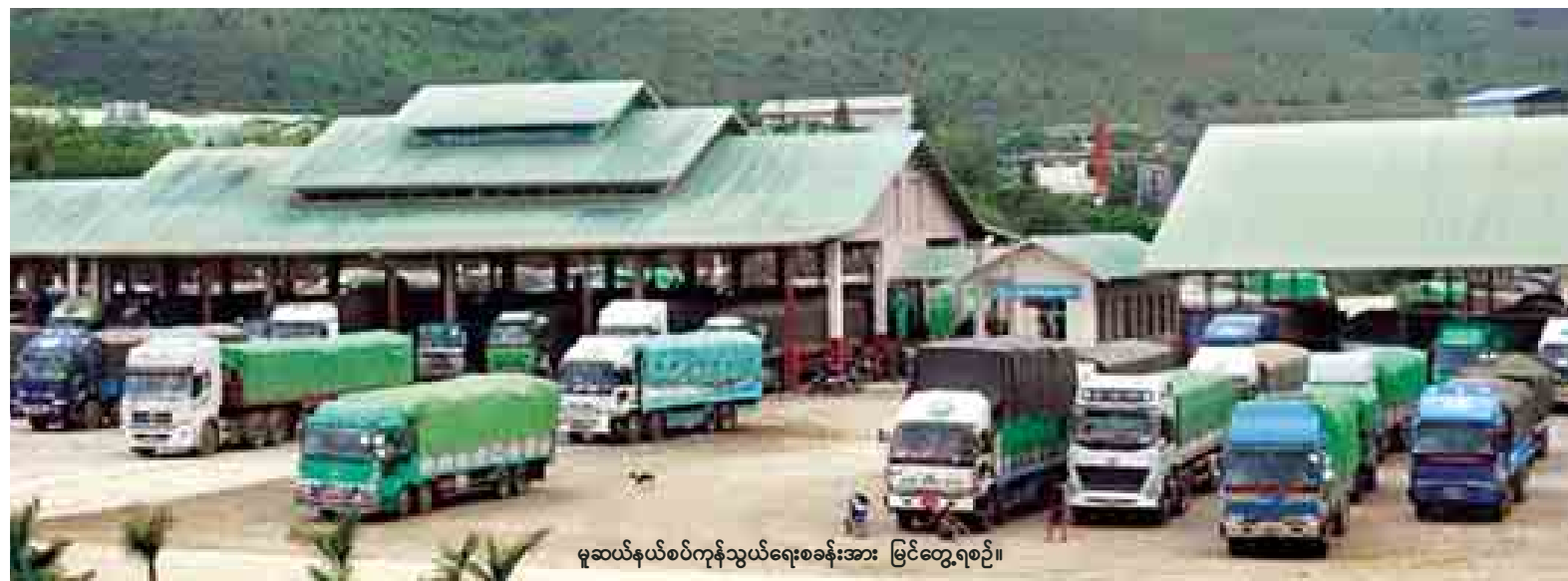
မူဆယ်နယ်စပ်ကုန်သွယ်ရေးစခန်းအား မြင်တွေ့ရစဉ်။