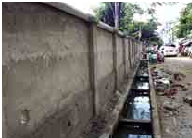
လှည်းတန်းဘူတာနှင့် ကမာရွတ်ဘူတာကြားရှိရထားလမ်းပိုင်းနေရာ တစ်လျှောက်အား အုတ်ခြံစည်းရိုးကာရံခြင်းများ လက်ရှိဆောင်ရွက်ပြီးစီး လှန်းပါးရှိနေသည်ကို တွေ့ရစဉ်။

မြန်မာ့မီးရထား လုပ်ငန်းမှ ရန်ကုန်မြို့ပတ် ရထားလမ်းပိုင်း တစ်လျှောက်သန့်ရှင်းသပ်ရပ် သာယာ လှပစေရေးနှင့်ရထားစီးခရီးသည်များ အတားအဆီးမရှိ အလွယ်တကူ ဖြတ် သန်းသွားလာနိုင်ကြစေရန်အတွက် အုတ်ခြံစည်းရိုးများကို စတင်ကာရံ ခြင်းများ ဆောင်ရွက်နေပြီဖြစ်သည်။