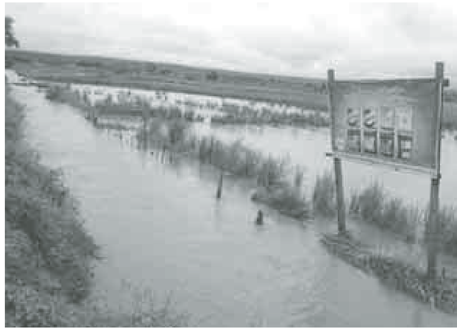
မော်လမြိုင်၊ စက်တင်ဘာ ၂၆

စစ်ကိုင်းတိုင်းဒေသကြီး အင်းတော်မြို့နယ် မော်လမြိုင်မြို့တွင် စက်တင်ဘာ ၂၄ ရက် နံနက်က မိုးသည်းထန်စွာရွာသွန်းခဲ့သဖြင့် နန်ကျဲချောင်း ရေကြီးရေလျှံမှုဖြစ်ကာ စပါးစိုက်ခင်းများ ရေလွှမ်းမှုဖြစ်ပွားခဲ့ကြောင်း သိရသည်။ စက်တင်ဘာ ၂၄ ရက် နံနက် ၃ နာရီ ၄၅ မိနစ်က မိုးသည်းထန်စွာ ရွာသွန်းခဲ့သဖြင့် လေးတန်ချောင်းနှင့်