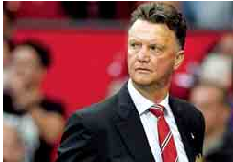
စနေနေ့ ဝက်စ်ဟမ်းနှင့် ကစားမည့် ပရီမီယာလိဂ်ပွဲတွင် မန်ယူအသင်းအတွက် ကစားပေးနိုင်မည့် ခံစစ်မျှတစ်ဦးသာ ကြိုခိုင်မှုရှိကြောင်း နည်းပြ ဗန်ဟားလ်က ပြောကြားလိုက်သည်။ မားကိုစ်ရီဂျီသာ ကြိုခိုင်မှု

ရိုကြောင်း၊ စမောလင်း၊ ဖီးဂျီးစ်နှင့် အီဗန်တို့သည် ဒဏ်ရာအသီးသီး ရရှိထားကြောင်း၊ တိုင်လာဘလက်ကက်မှာလည်း အနီကတ် ထိထားကြောင်း ဗန်ဟားလ်က ဆိုသည်။ “ကျွန်တော်တို့ ဒီပွဲမှာ အဓိကခံစစ်မျှတော့ အနာတရဖြစ်နေတဲ့အတွက် လူငယ်ကစားသမားတွေ ဖြစ်တဲ့ တွန်တော်စ်နဲ့ ပက်ဒီမက်နာယာ တို့ကို ခေါ်ယူ ကစားရဖွယ်ရှိပါတယ်”ဟု ဗန်ဟားလ်က ဆိုသည်။