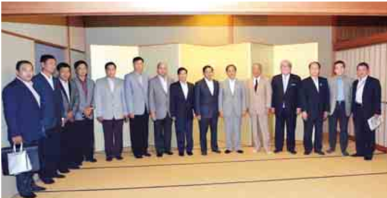
နေပြည်တော် စက်တင်ဘာ ၂၆

တပ်မတော် ကာကွယ်ရေးဦးစီးချုပ် ဗိုလ်ချုပ်မှူးကြီးမင်းအောင်လှိုင် ဦးဆောင်သော မြန်မာ့တပ်မတော် ချစ်ကြည်ရေးကိုယ်စားလှယ်အဖွဲ့အား စက်တင်ဘာ ၂၆ ရက် ဒေသစံတော်ချိန် ည ၇ နာရီတွင် တိုကျိုမြို့ရှိ State Guest House ၌ ဂျပန်အစိုးရအဖွဲ့အတွင်းဝန်ချုပ် Mr. Yoshihede SUGA က ညစာဖြင့် တည်ခင်းစဉ်ခံသည်။