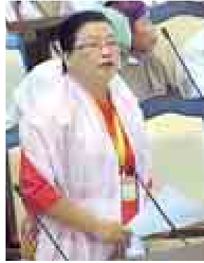
ဒုတိယဝန်ကြီး ဒေါ်ဝင်းမော်ထွန်း ဖြေကြားစဉ်။ (သတင်းစဉ်)

တစ်ခု လိုအပ်ပါကြောင်း နိုင်ငံတကာ ၌လည်း အနည်းဆုံးအခြေခံငွေ သတ်မှတ်ရေးကိစ္စကို နှစ်ပေါင်းများစွာ လေ့လာစိစစ်ပြီးမှ ဆောင်ရွက်ခဲ့ ပါကြောင်းဖြင့် ဖြေကြားသည်။