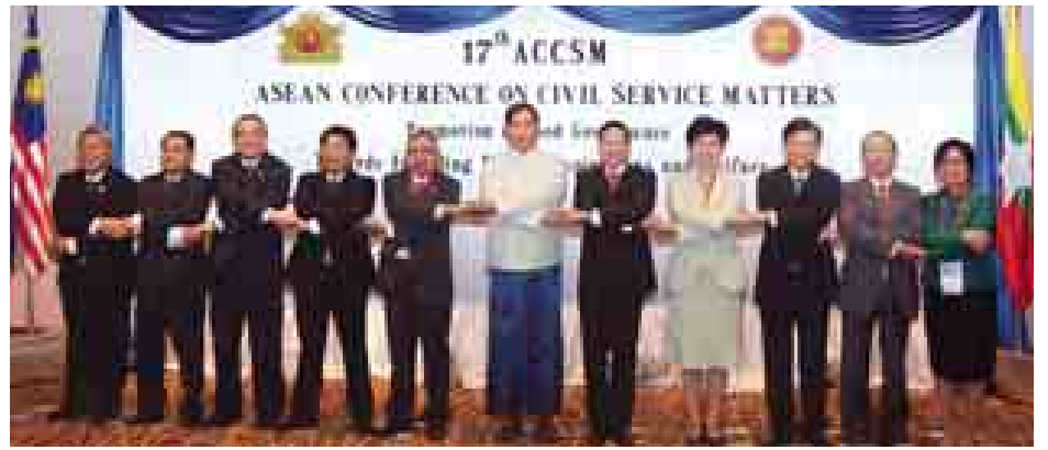
(၁၇)ကြိမ်မြောက် အာဆီယံနိုင်ငံဝန်ထမ်းအဖွဲ့အစည်းအကြီးအကဲများ မှတ်တမ်းတင်ဓာတ်ပုံရိုက်စဉ်။ (သတင်းစဉ်)