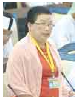
ဒုတိယဝန်ကြီးဒေါ်ဝင်းမော်ထွန်း မြေကြားစဉ်။

ရမ်းပြည်နယ် မဲဆန္ဒနယ် အမှတ်(၂) မှ ဦးစိုင်းကျော်ဇောသန်း ၏ “ပြည်သူများအပေါ် ကျရောက်သော၊ ကျရောက်နိုင်သော လျှပ်စစ် အန္တရာယ်များကို တားဆီးကာကွယ် ပေးနိုင်ရေး အထူးအစီအစဉ်များ ချမှတ်ရေးဆွဲ ဆောင်ရွက်ပေးရန် ပြည်ထောင်စုအစိုးရအား တိုက်တွန်းကြောင်း” အဆိုကို တင်သွင်းခဲ့ရာ လွှတ်တော်၏ သဘောထားကို ရယူပြီး လက်ခံဆွေးနွေးရန် ဆုံးဖြတ်ခဲ့သည်။ (သတင်းစဉ်)