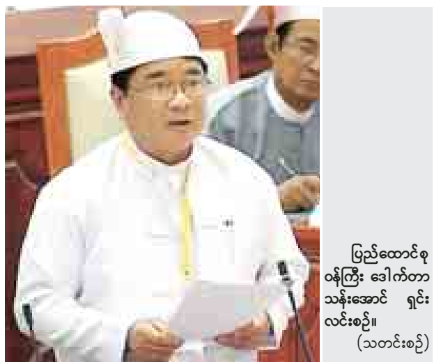
ပြည်ထောင်စုဝန်ကြီး ဒေါက်တာ သိန်းအောင် ရှင်းလင်းစဉ်။

နေပြည်တော် စက်တင်ဘာ ၂၅ ပထမအကြိမ် ပြည်သူ့လွှတ်တော်(၁၁)ကြိမ်မြောက် ပုံမှန်အစည်းအဝေး နဝမနေ့ကို ယနေ့ နံနက် ၁၀ နာရီတွင် ကျင်းပခဲ့သည်။ ကုန်တိုင်းမဲဆန္ဒနယ်မှ ဒေါ်နန်းဝါနု၏ အာရှလမ်းမကြီး တာကော်တံတားကို နှစ်လမ်းသွား သံကူကွန်ကရစ်တံတားအဖြစ် တည်ဆောက်ပေးရန် အစီအစဉ်ရှိ/မရှိ မေးခွန်းနှင့် စပ်လျဉ်း၍ ဆောက်လုပ်ရေးဝန်ကြီးဌာန ဒုတိယဝန်ကြီး ဦးစိုးတင့် က ဆောက်လုပ်ရေးဝန်ကြီးဌာနအနေဖြင့် တောင်ကြီး-ကျိုင်းတုံလမ်းပေါ်ရှိ ယာယီတံတား (ဘေလီ+သစ်သား) များကို နှစ်လမ်းသွား သံကူကွန်ကရစ်တံတားများ အဖြစ် အဆင့်မြှင့်တင်ခြင်းလုပ်ငန်းကို ဦးစားပေးဆောင်ရွက်လျက်ရှိရာ တောင်ကြီး-တာကော် အပိုင်းသည်