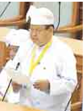
ဒုတိယဝန်ကြီး ဦးသိန်းအောင် ဆွေးနွေးစဉ်။

မြေလွတ် ၂၈၃ ဒသမ ၂၀ ဧက အား မကွေးတိုင်းဒေသကြီး အစိုးရအဖွဲ့သို့ ၂၀၁၃ ခုနှစ် ဒီဇင်ဘာ ၇ ရက်တွင် လွှဲပြောင်းပေးခဲ့ပြီး ဖြစ်ပါကြောင်း၊ မကွေးတိုင်းဒေသကြီး ပခုက္ကူခရိုင် ဆိပ်ဖြူမြို့နယ် သစ်ဆိမ့်ဆိမ့်စက်ရုံနှင့် စိုက်ကွင်းမြေ ၁၉၂၆ ဒသမ ၈၅ ဧက အား မကွေးတိုင်းဒေသကြီး အစိုးရအဖွဲ့သို့ ၂၀၁၃ ခုနှစ် ဒီဇင်ဘာ ၇ ရက်တွင် လွှဲပြောင်းပေးခဲ့ပြီး ဖြစ်ပါကြောင်း၊ အစီရင်ခံစာ အပိုင်း(၃) နောက်ဆက်တွဲ (၁)တွင် စက်မှုဝန်ကြီးဌာနနှင့်သက်ဆိုင်သော မြေယာနှစ်ခုမှ ပါရှိပြီး အဆိုပါ နှစ်ခုအနက် တစ်ခုမှာ ဝန်ကြီးဌာနနှင့် သက်ဆိုင်ခြင်းမရှိဘဲ ကျန်တစ်ခုမှာ ရန်ကုန်တိုင်းဒေသကြီးအင်းစိန်မြို့နယ် တည်းကုန်းရပ်ကွက်ရှိ လယ် ၀ ဒသမ ၅၃ ဧက တွင် အတိတ်စိုက်ပျိုးရေးကော်မရှင်၏ အစီရင်ခံစာအပိုင်း(၃)တွင် မြေယာနှစ်ခုနှင့်သာ သက်ဆိုင်ပြီး ရှင်းလင်းဆောင်ရွက်ပေးခဲ့ပြီး ဖြစ်ပါကြောင်း၊ မကွေးတိုင်းဒေသကြီး ပခုက္ကူမြို့နယ် အမှတ်(၅)အထည်စက်ရုံ (ပခုက္ကူ)၏ မြေ ၆၆၀ ဒသမ ၈၃ ဧကအနက် အချောကိုင်စက်ရုံ စီမံကိန်း ဆောင်ရွက်ခြင်းမရှိတော့သဖြင့်