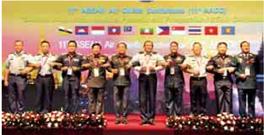
(၁၁) ကြိမ်မြောက် အာဆီယံလေတပ်ဦးစီးချုပ်များ ညီလာခံ (11th AACC) တက်ရောက်ကြသော အာဆီယံ လေတပ်များမှ လေတပ်ဦးစီးချုပ်များ စုပေါင်းဓာတ်ပုံရိုက်စဉ်။

ဘဝမြင့်တင်ပေးခြင်းဖြင့် ပြုပြင်ပြောင်းလဲမှုအောင်မြင်ရန် များစွာ အထောက်အကူဖြစ်ပြီး တည်ငြိမ်မှုကို အာမခံနိုင်ကြောင်း၊ စီးပွားရေးဖွံ့ဖြိုးတိုးတက်မှု အောင်မြင်စေရန်အတွက် နိုင်ငံရေးတည်ငြိမ်မှု ရရှိရန်နှင့် အစိုးရတချုပ်ထားသော စီးပွားရေးမူဝါဒများအတိုင်း ဆောင်ရွက်နိုင်ရန်လိုအပ်ကြောင်း၊ မိမိမြန်မာနိုင်ငံသို့ ချစ်ကြည်ရေးဇိနီအလည်အပတ်လာရောက်စဉ် နိုင်ငံတော် သမ္မတ၊ တပ်မတော်ကာကွယ်ရေးဦးစီးချုပ်နှင့် ပြည်ထောင်စုဝန်ကြီးများနှင့်တွေ့ဆုံခဲ့ကြောင်း၊ တွေ့ဆုံဆွေးနွေးမှုများကို အချိန်တစ်ခန့်နောက်မကျဘဲ အိမ်ရှင်တို့က တိကျစွာဆောင်ရွက်နိုင်သည်ကို တွေ့ရှိရကြောင်း၊ အချိန်တိုကျမှည့် ခေတ်မီနိုင်ငံတော်တစ်ရပ်တည်ဆောက်ရာတွင် အရေးကြီးသော အချက်ဖြစ်ကြောင်း၊ ထို့အပြင် လုံခြုံရေးနှင့် တည်ငြိမ်ရေးသည် အထူးအရေးကြီးကြောင်း၊ သို့သော် နိုင်ငံခြားရင်းနှီးမြှုပ်နှံသူများအနေဖြင့် ယုံကြည်စိတ်ချစွာလာရောက် ရင်းနှီးမြှုပ်နှံနိုင်မည်ဖြစ်ကြောင်း ပြန်လည်ဆွေးနွေးပြောကြားသည်။