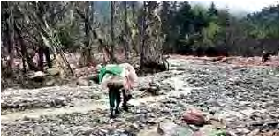
နမားဂျန်ဆင်နှင့်အဖွဲ့ ရှာဖွေကယ်ဆယ်ရေးလုပ်ငန်းများ ဆောင်ရွက်စဉ်။

ကြောင်း၊ နောင်တစ်ချိန် ကြိုတင်ပြင်ဆင်မှုများ ဆောင်ရွက်ပြီးချိန်မှသာ ခါကာဘိုရာဇီတောင်ကို ပြန်လည်တက်ရောက်နိုင်တော့မည် ဖြစ်ကြောင်း၊ သေဆုံးသည်ဟုမယူဆဘဲ ပျောက်ဆုံးနေဆဲအဖြစ်သာ သတ်မှတ်ကြောင်းကို တက္ကသိုလ်ခြေလျင်နှင့် တောင်တက်အသင်း သဘာဝခေါ်သံ ဖောင်ဒေးရှင်းမှ ဥက္ကဋ္ဌ ဦးမျိုးသန့်က ပြောကြားသည်။ (မြန်မာ့အလင်း)