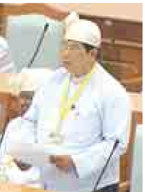
ဒုတိယဝန်ကြီး ဦးစိုးတင့် ဆွေးနွေးစဉ်။

အိမ်ရာစီမံကိန်းသည် မြန်မာနိုင်ငံ ရင်းနှီးမြှုပ်နှံမှုကော်မရှင်၏ ခွင့်ပြုမိန့်အရ စီမံကိန်းဧရိယာ ၆၅၂ ဧက အကောင်အထည်ဖော်ခဲ့ခြင်း ဖြစ်ပါကြောင်း၊ လယ်ယာမြေများ သိမ်းဆည်းခံရမှုကြောင့် နှစ်နာမူကြောင်း လယ်ယာမား ၆၇ ဦးက တင်ပြလာသည့် အတွက် တိုင်ကြားသူတစ်ဦးချင်း၏ သတ်မှတ်ပေးချက်အရ လယ်ခွန်ပြေစာ အထောက်အထားတင်ပြနိုင်သူ ၁၃ ဦးစာရင်းတွင် ပါဝင်သူများကို ၂၀၁၄ ခုနှစ် ဇူလိုင် ၂၉ ရက်မှစ၍ ပေးလျှော်ခဲ့ရာ ယနေ့အထိ လယ်သမားလေးဦး၊ ဧကအားဖြင့် ၃၉ ဒသမ ၅၂ ဧကကို လျော်ကြေးငွေ ကျပ်သိန်း ၃၉၅၂ သိန်းပေးအပ်ပြီး ကျန်ကိန်းမှာ ပိုင်ဆိုင်ခွင့် အငြင်းပွားနေကြသဖြင့် ဆက်လက်စိစစ်ဆောင်ရွက်ဆဲဖြစ်ပါကြောင်း။