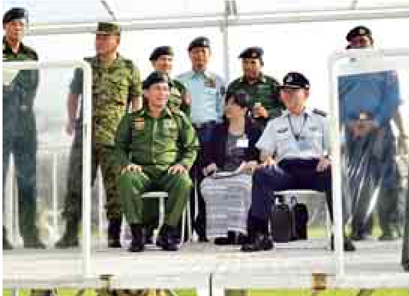
နှင့်ပတ်သက်သော အချက်အလက်များအားတင်ပြသည်။ ထို့နောက် တပ်မတော်ကာကွယ်ရေးဦးစီးချုပ် နှင့် အဖွဲ့ဝင်များသည် ဂျပန်မြေပြင်

ရှေးဦးစွာ တပ်မတော် ကာကွယ်ရေးဦးစီးချုပ် ဗိုလ်ချုပ်မှူးကြီး မင်းအောင်လှိုင် ဦးဆောင်သော မြန်မာ့တပ်မတော်ချစ်ကြည်ရေး ကိုယ်စားလှယ်အဖွဲ့သည် ဂျပန် ကိုယ်ပိုင်ကာကွယ်ရေးတပ်ဖွဲ့ စစ်ဦးစီးချုပ် General Shigeru IWA-SAKI လိုက်ပါလျက် ဂျပန်မြေပြင် ကိုယ်ပိုင် ကာကွယ်ရေးတပ်ဖွဲ့ Narashino တပ်စခန်းသို့ ရဟတ်ယာဉ်ဖြင့် ရောက်ရှိရာ 1st Airborne Brigade, Camp Narashino ၏ Commander ဖြစ်သူ Major General Kimihito IWAMURA နှင့် တာဝန်ရှိသူများက ဂုဏ်ပြု တပ်ဖွဲ့ဖြင့် ကြိုဆိုနှုတ်ဆက်သည်။ ထို့နောက် တပ်မတော် ကာကွယ်ရေးဦးစီးချုပ် ဗိုလ်ချုပ်မှူးကြီး မင်းအောင်လှိုင်သည် ဂျပန် မြေပြင် ကိုယ်ပိုင်ကာကွယ်ရေး တပ်ဖွဲ့ Narashino တပ်စခန်း ဧည့်ခန်းမဆောင်၌ Major General Kimihito IWAMURA နှင့် အထိမ်းအမှတ်တံဆိပ်နှင့် အမှတ်တရ လက်ဆောင်များလဲလှယ်ကြပြီး အစည်းအဝေးခန်းမ၌ 1st Airborne Brigade မှ Colonel Iijima မှ 1st Airborne Brigade