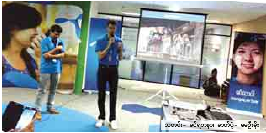
သတင်း- ခင်ရတနာ၊ ဓာတ်ပုံ- မေဦးစိုး

ရန်ကုန် စက်တင်ဘာ ၂၅ ဆက်သွယ်ရေး အော်ပရေတာ တယ်လီနောမြန်မာက မည်သည့် ဂျီအက်စ်အမ် ဟန်းဆက်နှင့်မဆို တွဲဖက်သုံးစွဲနိုင်သည့် သရိုဂျီ၊ တူးဂျီ ဆက်သွယ်ရေးမိုဘိုင်းဖုန်းဆင်းကတ် များကို စက်တင်ဘာ ၂၅ ရက်မှ စတင်ကာ မန္တလေးမြို့တွင် ရောင်းချ ပေးသွားမည်ဖြစ်ကြောင်း စက်တင် ဘာ ၂၅ ရက် ၂၂ နာရီက သတင်း ထုတ်ပြန်ခဲ့သည်။ မိုဘိုင်းကွန်ရက် စတင်ဖွင့်လှစ် ခြင်းကို စက်တင်ဘာ ၂၅ ရက်နောက် ၁၁နာရီတွင် လုပ်ဆောင်ပြီး တစ်ပြိုင် နက်တည်း မန္တလေးမြို့ရှိ မိုဘိုင်း