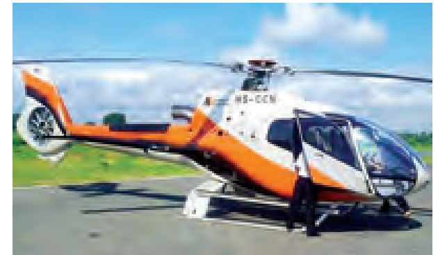
မတော်တဆ ထိခိုက်မှုကြောင့်သာ သူတို့တစ်နေရာရာမှာ တောင့်ခံပြီး ကယ်ဆယ်ရေးကို စောင့်နေတယ်

အထင်ပြောရရင် သူတို့ပျောက်ဆုံးချိန်မှာ ဆိုးရွားတဲ့ ရာသီဥတုအခြေအနေမရှိခဲ့ဘူးလို့ ထင်ပါတယ်။