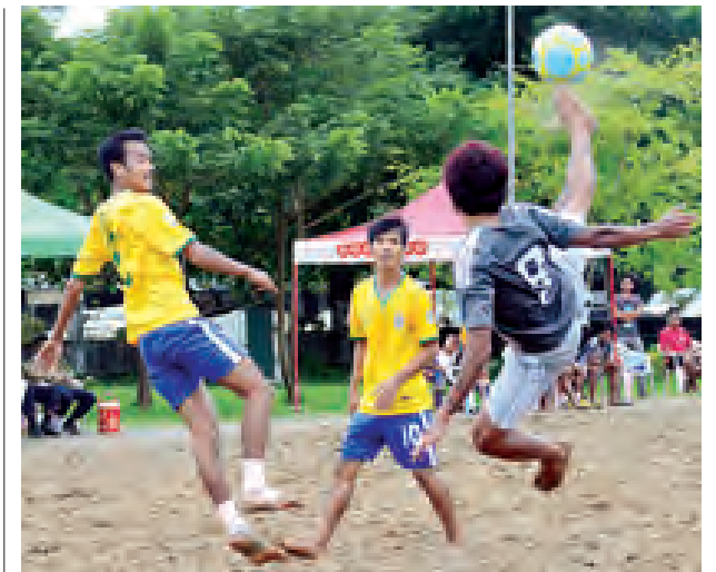
သဲသောင်ပြင်ဘောလုံးပြိုင်ပွဲ လင်းစခေါင်းနှင့် မလိခတို့ ယှဉ်ပြိုင်စဉ်။

သတင်းထောက်တစ်ယောက်၏ ပင်မအလုပ်သည် သတင်းများကိုရှာဖွေ ထောက်လှမ်းရေးသားခြင်းဖြစ်သည်။ သတင်းအချက်အလက်များကို အပိုအလို မရှိ ပြည့်စုံတိကျနိုင်သမျှ ပြည့်စုံတိကျအောင် ရေးသားနိုင်ရမည်။ စာနယ်ဇင်း ကျင့်ဝတ်၊ လုပ်ငန်းစည်းမျဉ်း၊ စာနယ်ဇင်းဆိုင်ရာ ဥပဒေများကို မသိမမြင် သိရှိလိုက်နာရမည်။ သတင်းလိုက်နည်း၊ သတင်းရေးသားနည်းနှင့် သတင်း ပေးပို့မှုပုံစံသစ်စသည်တို့ကို ကျွမ်းကျင်တတ်မြောက်ရမည်။ သို့မှသာ အရည်အသွေးမြင့် သတင်းထောက်ကောင်းတစ်ယောက် ဖြစ်လာနိုင်သည်။