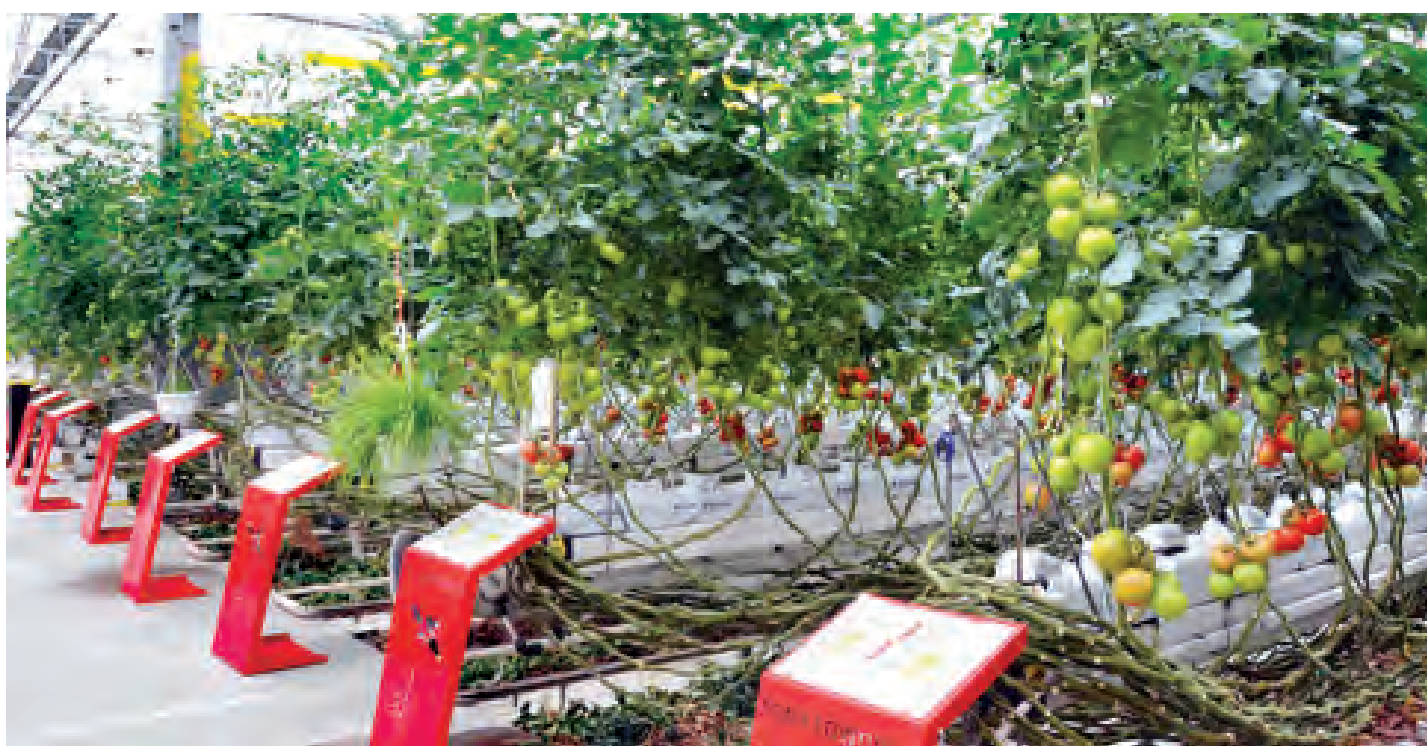
နယ်သာလန်နိုင်ငံရှိ Tomato World တွင် ဖန်လုံအိမ်စိုက်ပျိုးနည်းဖြင့် စနစ်တကျစိုက်ပျိုးထားသည့် ခရမ်းချဉ်သီးများကို တွေ့ရစဉ်။