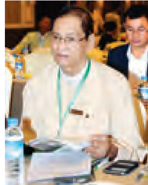
ဦးတင်လှိုင်(လယ်တွင်းသားစောချစ်) မြန်မာနိုင်ငံစာရေးဆရာအသင်းဥက္ကဋ္ဌ

ယနေ့နံနက်ပိုင်းက ရန်ကုန်မြို့၊ ချက်ထရီယမ်ဟိုတယ်တွင်ကျင်းပသည့် တတိယအကြိမ် မြန်မာ့သတင်းမီဒီယာဖွံ့ဖြိုးတိုးတက်ရေးညီလာခံသို့ တက်ရောက်လာသူများအားတွေ့ဆုံ၍ နိုင်ငံတကာမီဒီယာဖွံ့ဖြိုးတိုးတက်မှုအခြေအနေ၊ ကျင့်ဝတ်ဖောက်ဖျက်မှုနှင့် ပြည့်ဆည်းဆောင်ရွက်မှုများ၊ နိုင်ငံတော်အစိုးရသစ်လက်ထက် မီဒီယာကဏ္ဍဖွံ့ဖြိုးတိုးတက်ရေးအတွက် ဆောင်ရွက်မှုများ၊ စာနယ်ဇင်းဆိုင်ရာ အတွေ့အကြုံများနှင့်ပတ်သက်၍ မေးမြန်းခဲ့သည်များကို ဖြန့်လှည့်ရေးသားတင်ပြလိုက်ပါသည်။