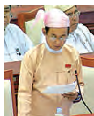
ပုသိမ်မဲဆန္ဒနယ်မှ ဦးဝင်းမြင့် မေးမြန်းစဉ်။ (သတင်းစဉ်)

၏ ပုသိမ်မြို့ ပြည်တော်သာအိမ်ရာများကို ဖျက်သိမ်းရန် စီစဉ်နေခြင်း မေးခွန်းနှင့်စပ်လျဉ်း၍ သမ္မတရုံးဝန်ကြီးဌာန ဒုတိယဝန်ကြီး ဦးအောင်သိမ်းက ရေဝတ်တိုင်းဒေသကြီး ပုသိမ်မြို့ရှိ ပြည်တော်သာ ဝန်ထမ်းအိမ်ရာတွင် ဌာနနှင့် Nine Engin-