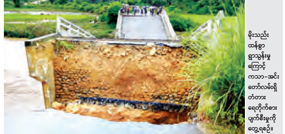
မိုးသည်း ထန်စွာ ရွာသွန်းမှု ကြောင့် ကသာ-အင်း တော်လမ်းရှိ တံတား ရေတိုက်စား ပျက်စီးမှုကို တွေ့ရစဉ်။