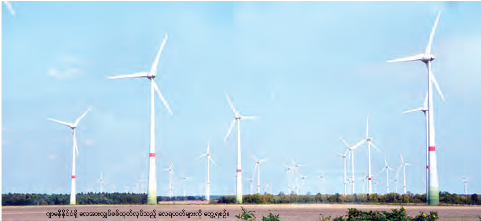
ဂျာမနီနိုင်ငံရှိ လေအားလျှပ်စစ်ထုတ်လုပ်သည့် လေရဟတ်များကို တွေ့ရစဉ်။

စိုက်ပျိုးရေး၊ သစ်တောနှင့် အစားအစာ ဘာသာရပ်များအတွက် စာမျက်နှာ ၉ ကော်လံ ၁ ❖