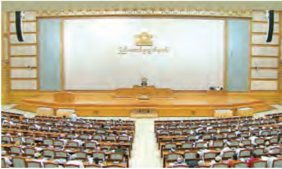
ပထမအကြိမ် ပြည်ထောင်စုလွှတ်တော် (၁၁)ကြိမ်မြောက် ပုံမှန်အစည်းအဝေး တတိယနေ့ကျင်းပစဉ်။ (သတင်းစဉ်)

မြန်မာနိုင်ငံ၏ ပြင်ပကြေးမြီ စုစုပေါင်းသည် ၂၀၁၃ ခုနှစ် ဒီဇင်ဘာ ၃၁ ရက် စာရင်းအရ အမေရိကန်ဒေါ်လာ ၅ ဒသမ ၃၇၉ ဘီလီယံရှိနေပြီး ကြေးမြီနှိုင်းယှဉ်မှုစာရင်းတွင် (၁၁၆) နိုင်ငံမြောက် ဖြစ်နေကြောင်း သိရသည်။ (သတင်းစဉ်)