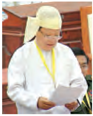
ဒုတိယဝန်ကြီးဦးအောင်သိမ်းဖြေကြားစဉ်။ (သတင်းစဉ်)

နောင်ရိုးတံတားအား သံကူကွန်ကရစ်တံတားအဖြစ် တည်ဆောက်ပေးရန် အစီအစဉ်ရှိ/မရှိ မေးခွန်းနှင့်စပ်လျဉ်း၍ သမ္မတရုံးဝန်ကြီးဌာန(၄) ဒုတိယဝန်ကြီး ဦးအောင်သိမ်းက ပဲခူးတိုင်းဒေသကြီး တောင်ငူမြို့နယ် ကင်းဆိပ်ကျေးရွာနှင့် အုတ်