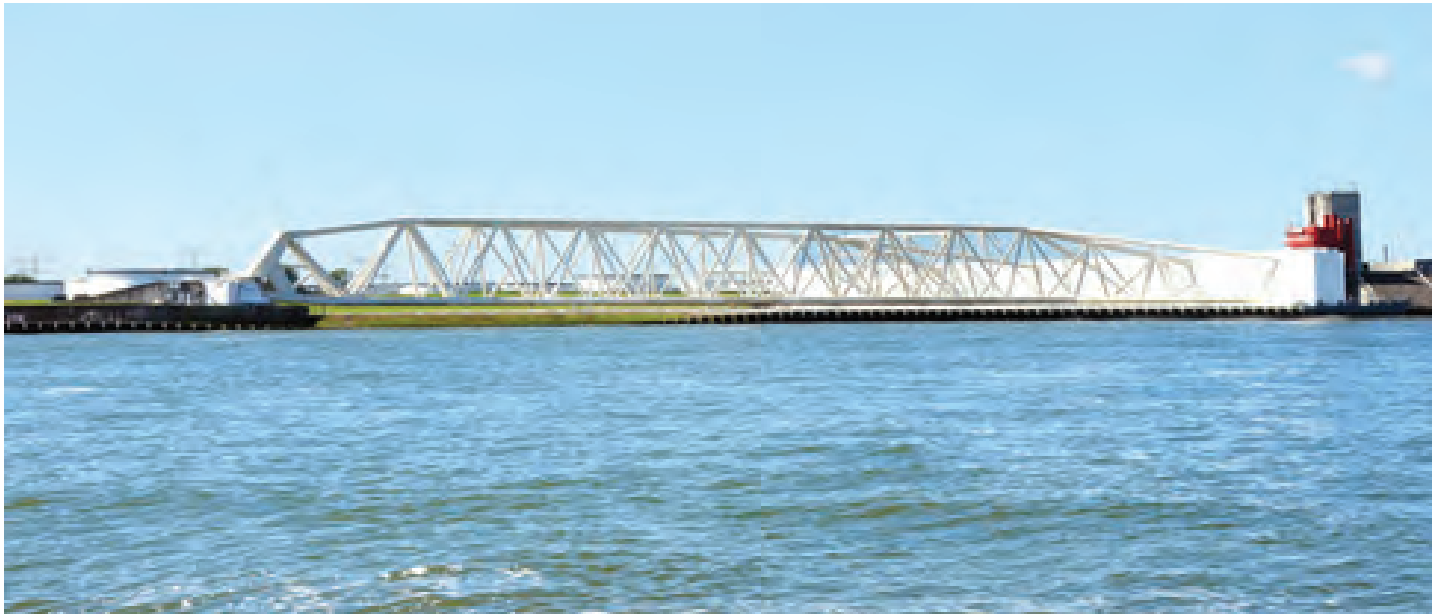
နယ်သာလန်နိုင်ငံရှိ Maeslantkering ရေထိန်းတံခါးကို တွေ့ရစဉ်။

ဆွစ်ဇာလန်နိုင်ငံတွင် ကျင်းပနေသည့် လေကြောင်းပြပွဲကိုလည်း ရောက်ရှိခဲ့ပါသည်။