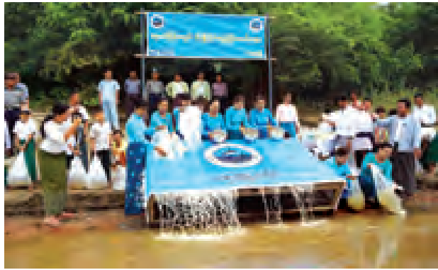
ပခုက္ကူ စက်တင်ဘာ ၁၈ ပခုက္ကူခရိုင် ငါးလုပ်ငန်းဦးစီးဌာနမှ ၂၀၁၄-၂၀၁၅ ဘဏ္ဍာနှစ် ရောဂါတိုမြစ်အတွင်း ငါးမျိုးစိုက်ထည့်ခြင်း အခမ်းအနားကို ယနေ့နံနက် ၈နာရီက ပခုက္ကူမြို့ အမှတ်(၁)ရပ်ကွက် ဗုဒ္ဓ

တိုင်းရန် ဓာတ်မြေဩဇာထည့်ပေးခြင်း၊ မျိုးကောင်းမျိုးသန့်ရွေးချယ်ခြင်း၊ ပိုးမွှားရောဂါကာကွယ်ရန် ပိုးသတ်ဆေးဖျန်းခြင်း၊ သိပ္ပံနည်းကျ စိုက်ပျိုးရန်လိုအပ်ကြောင်း ရှင်းလင်းပြောကြားခဲ့သည်။