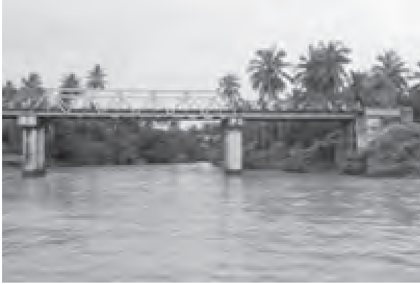
နာဂစ်မုန်တိုင်းကျရောက်ခဲ့ပြီးနောက် မော်လမြိုင်ကျွန်းဒေသဖွံ့ဖြိုးတိုးတက်စေရေးအတွက် နိုင်ငံတော်မှ လမ်း၊ တံတားများဖောက်လုပ်တည်ဆောက်ပေးခဲ့ရာ ဒေသဖွံ့ဖြိုးအလှူတိုးတက်မှုအဖွဲ့မှ ဖြန့်ဖြူးပေးသည့် ပေးငွေများဖြင့် ပြုပြင်ဆင်နွှဲခဲ့ကြောင်း သိရသည်။

တံတားပေါ်မှ နေ့ညဖြတ်သန်းသွားလာလျက်ရှိကြသော ဆိုင်ကယ်များ၊ စက်ဘီးများ၊ ခရီးသွားပြည်သူများနှင့် ကျောင်းသား ကျောင်းသူများအတွက် အချိန်မရွေးဘေးအန္တရာယ် ကျရောက်နိုင်ဖွယ် ရှိနေသည်။ ထို့ကြောင့် အဆိုပါ ထိလေးသိမ်ချောင်းကူးတံတား၏ ပျက်စီးယိုယွင်းမှုအချို့ကို အချိန်မီပြုပြင်ဆောင်ရွက်ပေးနိုင်ပါရန် ဒေသခံပြည်သူများက လိုလားနေကြောင်း သိရသည်။ မော်လမြိုင်ကျွန်း - ထိလေးသိမ်ချောင်းကူးတံတားသည် နာဂစ်မုန်တိုင်းဖြစ်ပြီး နောက်ပိုင်းတွင် တည်ဆောက်ပေးခဲ့သော တံတားများအနက် အရှေ့ပါသော တံတားတစ်စင်းဖြစ်သည်။ မော်လမြိုင်ကျွန်းမြို့တွင်