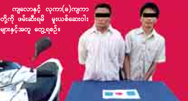
ကျလောနှင့် လူကာ(ခ)ကျကာ တို့ကို ဖမ်းဆီးရမိ မူးယစ်ဆေးဝါးများနှင့်အတူ တွေ့ရစဉ်။

(၃၂နှစ်)တို့နှစ်ဦးကို မူးယစ်ဆေးဝါးနှင့် များဆိုင်ရာဥပဒေအရ အရေးယူစိတ်ကိုပြောင်းလဲစေသော ဆေးဝါး ထားသည်။ (သတင်းစဉ်)