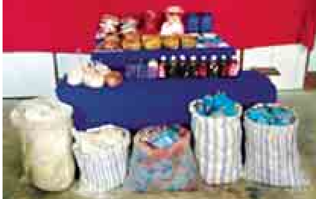
ပိုင်ရှင်မဲ့ သိမ်းဆည်းရမိ မူးယစ်ဆေးဝါးများ တွေ့ရစဉ်။

စက်တင်ဘာ ၁၀ ရက်က မူးယစ်တပ်ဖွဲ့ (၂၈) ကျိုင်းတုံ မူးယစ်ဆေးဝါး တားဆီးနှိမ်နင်းရေးရဲတပ်ဖွဲ့မှ တပ်ဖွဲ့ဝင်များပါဝင်သော ပူးပေါင်းအဖွဲ့သည် မိုင်းပျဉ်းမြို့နယ် တာကော်ကျေးရွာ အုပ်စု တာကော်(၂)မိုင်ကျေးရွာနေ မနန်းဆိုင်အိမ်အိမ်ထောင်စုမှ ရှာဖွေရာ စိတ်ကြွရူးသွပ်ဆေးပြား ၁၀၀၀၀ သိမ်းဆည်းရမိသဖြင့် မနန်းဆိုင်အိမ်(၃၅နှစ်)ကို မူးယစ်ဆေးဝါးနှင့်စိတ်ကို ပြောင်းလဲစေသော ဆေးဝါးများဆိုင်ရာဥပဒေအရ အရေးယူထားသည်။