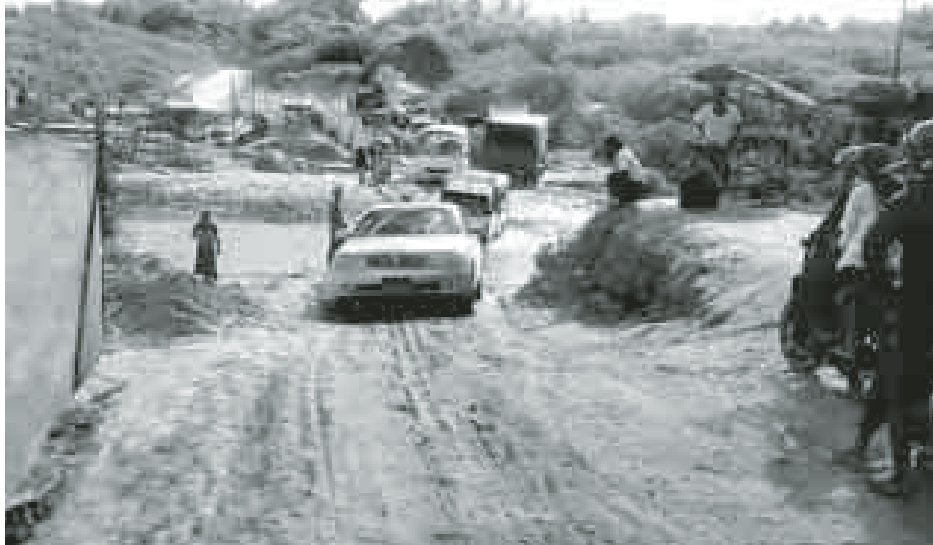
တောင်သာ-ဝဲလောင်ကားလမ်းပေါ်ရှိ ဆီမီးကန်ချောင်း ယာယီလမ်းလွှဲတွင် ဝဲလောင်ဘက်ခြမ်းရှိ ပေ ၄၀၀ ခန့် မြေသားကို ဒုတိယအကြိမ် ကျောက်ကြီး ၁၂ ကျင်း၊ ကျောက်မှုန့်နှင့် သဲကြမ်းများခင်းခြင်းလုပ်ငန်းများ ကို စက်တင်ဘာ ၅ ရက်က ထပ်မံ ပြုပြင်ပေးခဲ့ရာ ပုပ္ပားမှဘိုးတော်ထွက်ပွဲပြန် ဘုရားဖူးယာဉ်များနှင့် ဒေသခံယာဉ်များ စက်တင်ဘာ ၇ ရက် ညနေပိုင်းက ကောင်းမွန်စွာ ဖြတ်သန်းသွားလာနေစဉ်။

တောင်သာ-ဝဲလောင်ကားလမ်း ပေါ်ရှိ ဆီမီးကန်ချောင်း ယာယီ လမ်းလွှဲတွင် ဝဲလောင်ဘက်ခြမ်းရှိ ပေ ၄၀၀ခန့် မြေသားလမ်းကို ဒုတိယ အကြိမ် ကျောက်ကြီး ၁၂ ကျင်း၊ ကျောက်မှုန့်နှင့် သဲကြမ်းများခင်းခြင်း လုပ်ငန်းများကို စက်တင်ဘာ ၅ ရက်က ထပ်မံပြုပြင်ပေးခဲ့ရာ စက်တင်ဘာ ၇ ရက် ညနေပိုင်းက ပုပ္ပားမှ ဘိုးတော်ထွက်ပွဲပြန် ဘုရား ဖူးယာဉ်များနှင့် ဒေသခံယာဉ်များ ကောင်းမွန်စွာ သွားလာနိုင်မည်ဖြစ်ကြောင်း သိရသည်။