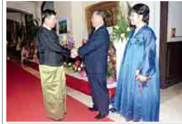
စက်တင်ဘာ ၉ ရက်တွင် ကိုရီးယားဒီမိုကရက်တစ်ပြည်သူ့သမ္မတနိုင်ငံ၏ (GB)ကြိမ်မြောက် နိုင်ငံထူထောင်သည့် အထိမ်းအမှတ် စည်ခံပွဲအခမ်းအနားသို့ တက်ရောက်လာသည့် နိုင်ငံခြားရေးဝန်ကြီးဌာန ဒုတိယဝန်ကြီး ဦးတင်ဦးလွင်အား မြန်မာနိုင်ငံဆိုင်ရာ ကိုရီးယားဒီမိုကရက်တစ်ပြည်သူ့သမ္မတနိုင်ငံ သံအမတ်ကြီး H.E. Mr. Kim Sok Cholနှင့်နီးတို့ ကြိုဆိုနှုတ်ဆက်စဉ်။ (သတင်းစဉ်)

ပြည်သူ့လွှတ်တော် ဥပဒေကြမ်းကော်မတီဥက္ကဋ္ဌနှင့် အဖွဲ့ဝင်များ ၊ ပြည်သူ့လွှတ်တော်ဥပဒေရေးရာနှင့် အထူးကိစ္စရပ်များ လေ့လာဆန်းစစ်သုံးသပ်ရေးကော်မရှင်အဖွဲ့ဝင်များ၊ ဥပဒေပြုရေးဆိုင်ရာ ပူးပေါင်းဆောင်ရွက်ရေးလုပ်ငန်းကော်မတီအဖွဲ့ဝင်များနှင့် စီးပွားရေးနှင့် ကူးသန်းရောင်းဝယ်ရေးဝန်ကြီးဌာနတို့မှ တာဝန်ရှိသူများ တက်ရောက်ခဲ့ကြသည်။ (သတင်းစဉ်)