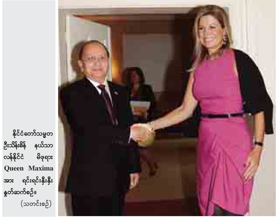
နိုင်ငံတော်သမ္မတ ဦးသိန်းစိန် နယ်သာလန်နိုင်ငံ မိဖုရား Queen Maxima အား ရင်းရင်းနှီးနှီး နှုတ်ဆက်စဉ်။ (သတင်းစဉ်)

တွေ့ဆုံအပြီးတွင် နိုင်ငံတော်သမ္မတနှင့် နယ်သာလန်နိုင်ငံမိဖုရား Queen Maxima တို့သည် အတူတကွ မှတ်တမ်းတင်ဓာတ်ပုံရိုက်ကြသည်။ (သတင်းစဉ်)