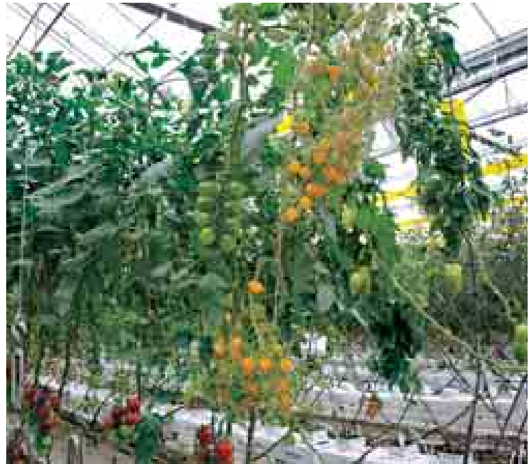
နယ်သာလန်နိုင်ငံ Tomato World ဖန်လုံအိမ်စိုက်ပျိုးရေးပဟိုဠာနှင့် ဖန်လုံအိမ် စိုက်ပျိုးနည်းဖြင့် စနစ်တကျ စိုက်ပျိုးထားသော ခရမ်းချဉ်သီးများကို တွေ့ရစဉ်။ (သတင်းစဉ်)

နိုင်ငံတော်သမ္မတ ဦးသိန်းစိန် နယ်သာလန်နိုင်ငံ Tomato World ဖန်လုံအိမ်စိုက်ပျိုးရေးပဟိုဠာနှင့် ခင်းကျင်းပြသထားသည့် ပြခန်းအတွင်း လှည့်လည်ကြည့်ရှုလေ့လာရာ တာဝန်ရှိသူက ရှင်းလင်းပြသသည်။ (သတင်းစဉ်)