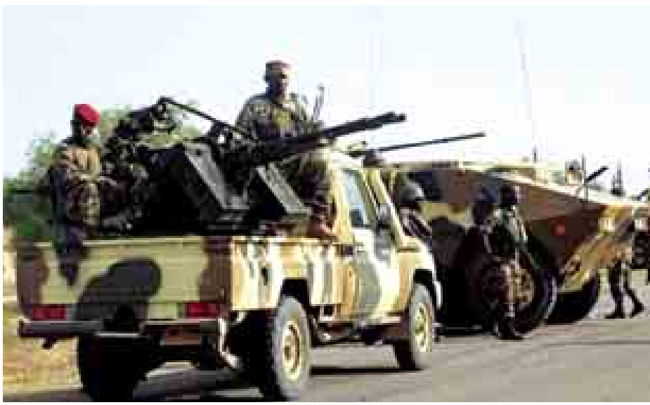
ကြေညာချက်တွင် ဖော်ပြသည်။

“ကျွန်တော်တို့ တပ်ဖွဲ့ဝင်တွေက ဘိုကိုဟာရမ်အကြမ်းဖက်အုပ်စုတွေ နေတဲ့ နေရာတွေကို ပစ်မှတ်ထား တိုက်ခိုက်ခဲ့တာပါ” ဟုလည်း ၎င်း၏