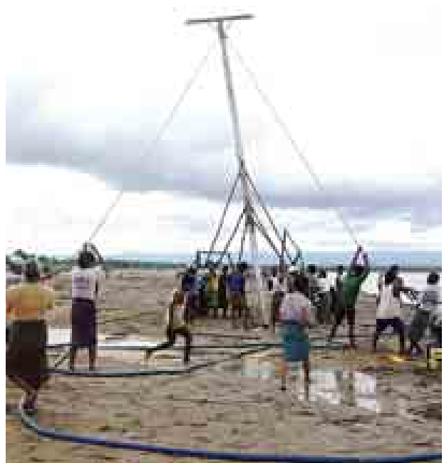
ကျောချောင်းရေကြီး၍လဲကျသော ဓာတ်တိုင်များ နေ့ချင်းပြီး ပြန်လည်စိုက်ထူ