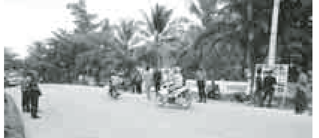
ကျောသောင်းခရိုင် ခမောက်ကြီးမြို့နယ်ခွဲရှိ အခြေခံပညာအထက်တန်းကျောင်းတွင် ကျောင်းတက်ကျောင်းဆင်းချိန်များတွင် ကျောင်းသား ကျောင်းသူများယာဉ်အန္တရာယ် ကင်းရှင်းရေးလုပ်ငန်းများကို မြို့နယ်ခွဲရဲဘဲလ်ဖွဲ့နှင့် နယ်မြေခံတပ်ရင်းများမှ တပ်မတော်သားများ၊ အရန်မီးသတ်တပ်ဖွဲ့ဝင်များ ပူးပေါင်းကာ ဆောင်ရွက်ပေးစဉ်။ (မြို့နယ်ပြန်/ဆက်)

လက်ကိုင်ဖုန်းများဖြင့် လူမှုရေး၊ စီးပွားရေး၊ ပညာရေး၊ ကျန်းမာရေး၊ ရောင်းဝယ်တာဝန်အစ အထွေထွေကိုယ်ရေးကိုယ်တာကိစ္စများကို အလွယ်တကူ အသိပေး၊ သတိပေးဆက်သွယ် အကြောင်းကြားနိုင်မည့် အကျိုးကျေးဇူးများ ရရှိခဲ့သည်မှာ အမှန်ပင်ဖြစ်သည်။ မြန်မာ့ဆက်သွယ်ရေးလုပ်ငန်းမှ တယ်လီဖုန်းဆက်သွယ်ပြောဆိုရာတွင် လွယ်ကူလျင်မြန်သက်သာအဆင်ပြေစေရန် ဝန်ဆောင်မှုကောင်းဖြင့် တစ်ဆင့်ချင်းစီစဉ်ဆောင်ရွက်ပေးနေသည်။ ထို့အတူ မြန်မာ့မီးရထား ရန်ကုန်ဘူတာကြီးတွင်လည်း လက်ကိုင်ဖုန်းအသုံးပြုသူ ခရီးသွားပြည်သူများအတွက် လက်ကိုင်ဖုန်းနှင့် တိုက်ရိုက်သက်ဆိုင်သည့်ဝန်ဆောင်မှုကောင်းတစ်ခု စီစဉ်ပေးထားသည်မှာ ရန်ကုန်ဘူတာကြီး ခရီးသည်များ နားနေဆောင်စုကြို အမှတ်(၁)၌ “ဖုန်း (အခမဲ့) အားသွင်းရန်” လျှပ်စစ်ခလုတ်ခုံနှစ်ခု စီစဉ်ပေးထားသည်ကို တွေ့မြင်ရသည်။ “မပြောပလောက်တဲ့ အသေးအဖွဲ့ဝန်ဆောင်မှုတစ်ခုလို့ဆိုပေမယ့် ခရီးသွားပြည်သူများအတွက် အခုလိုဝန်ဆောင်မှုလေး ဆောင်ရွက်ပေးခြင်းသည် မြန်မာ့မီးရထားအပေါ် ခရီးသွားပြည်သူများအားလုံး အားကိုးယုံကြည်လာစေမည့်အကြောင်း တစ်ချက်ဖြစ်ပါတယ်” ဟု ခရီးသွားများ အချင်းချင်းပြောဆိုနေကြသည်။ “အားသွင်းထားတဲ့ ဖုန်းချင်းမများယွင်းအောင် အချင်းချင်းစောင့်ကြည့် သတိပေးဖို့လည်း လိုပါတယ်” ဟု ဖုန်းအားသွင်းသူတစ်ဦးက ဆိုသည်။ ကိုရစ်