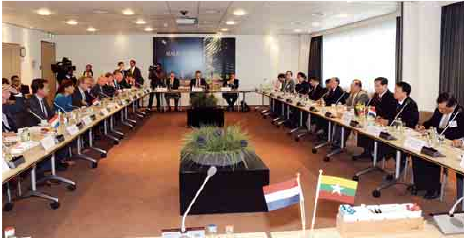
နိုင်ငံတော်သမ္မတ ဦးသိန်းစိန်နှင့်အဖွဲ့ နယ်သာလန်နိုင်ငံ အပြည်ပြည်ဆိုင်ရာကုန်သွယ်ရေးနှင့် ဖွံ့ဖြိုးတိုးတက်မှု ပူးပေါင်းဆောင်ရွက်ရေးဝန်ကြီး Ms. Lillianne Ploumen၊ Confederation of Netherlands Industry and Employers (VNO-NCW) ဥက္ကဋ္ဌ Mr. Ben Van Beurden၊ နယ်သာလန်နိုင်ငံ စီးပွားရေးအသိုက်အဝန်းမှ အမှုဆောင်အရာရှိချုပ်များနှင့် စားပွဲဝိုင်းဆွေးနွေးပွဲကျင်းပစဉ်။