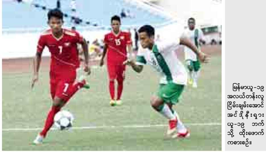
မြန်မာယူ-၁၉ အလယ်တန်းလူငယ်အင်ဒိုနီးရှားယူ-၁၉ ဘက်သို့ ထိုးဖောက်ကစားစဉ်။

အုပ်စု(ခ) နောက်ဆုံးပွဲတွင် ဂျပန်အသင်းက ဗီယက်နမ်အသင်းကို သုံးဂိုး-နှစ်ဂိုးဖြင့် အနိုင်ရရှိသွားသောကြောင့် အုပ်စုပထမရရှိခဲ့ပြီး ဗီယက်နမ်က အုပ်စုဒုတိယရရှိသည်။ ဆီမီးပွဲစဉ်များကို စက်တင်ဘာ ၁၁ ရက်တွင် ကျင်းပမည်ဖြစ်ပြီး မြန်မာနှင့် အိမ်ရှင်ဗီယက်နမ်၊ ဂျပန်နှင့် ထိုင်းတို့ ယှဉ်ပြိုင်ရမည်ဖြစ်သည်။