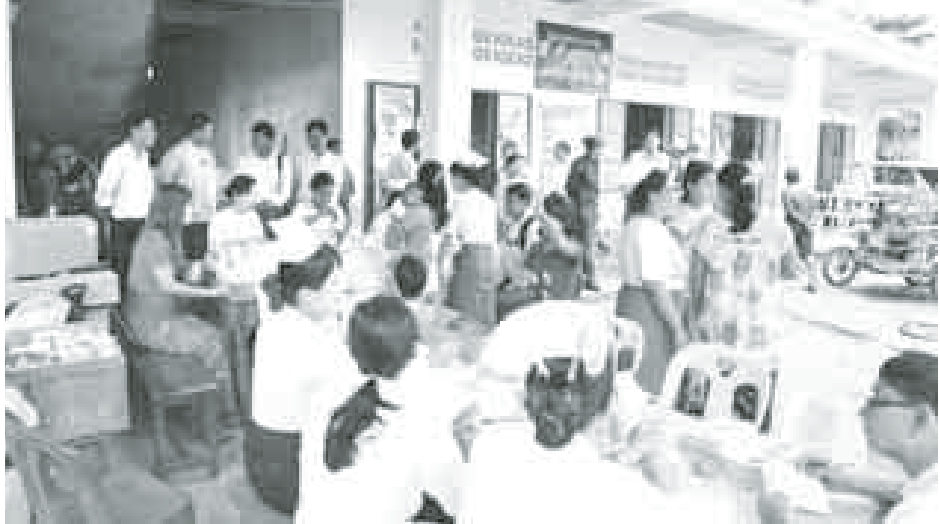
ထို့နောက် အထူးကုဆရာဝန်ကြီး များအဖွဲ့မှ ရပ်ကွက်ပြည်သူ ၂၀၀ ခန့်အား တစ်ဦးချင်းကျန်းမာရေး စစ်ဆေးပေးပြီးလျှင် အများပြည်သူ အကျိုးအတွက် တစ်နေ့တာ အခမဲ့ ကျန်းမာရေးပြုစောင့်ရှောက် ကုသမှုပေးခဲ့ကြောင်း သိရသည်။ (တိုင်းဒေသကြီး မြန်/ဆက်)