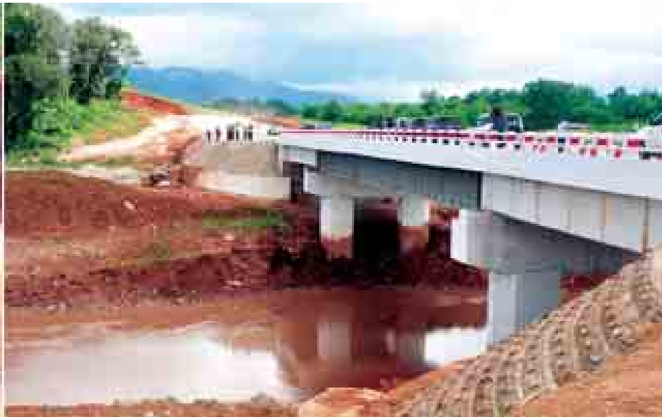
ဒုတိယသမ္မတ ဒေါက်တာစိုင်းမောက်ခမ်း လားရှိုးမြို့ရှောင်လမ်းပေါ်ရှိ အေတီရေကျော်တံတား တည်ဆောက်ရေးလုပ်ငန်းခွင် ကြည့်ရှုစစ်ဆေးစဉ်။