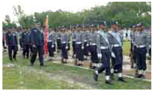
ပဲခူး စက်တင်ဘာ ၉ တွင် မတ် ၁၇ ရက်မှ စက်တင်ဘာ ၅ ရက်ထိ ဖွင့်လှစ်သင်ကြားခဲ့သည့် မြန်မာနိုင်ငံရဲတပ်ဖွဲ့ အမှတ်(၂)ရဲလေ့ကျင့်ရေးကျောင်း (ဝက်ထီးကန်) ရဲတပ်သားသစ် သင်တန်းအမှတ်စဉ်