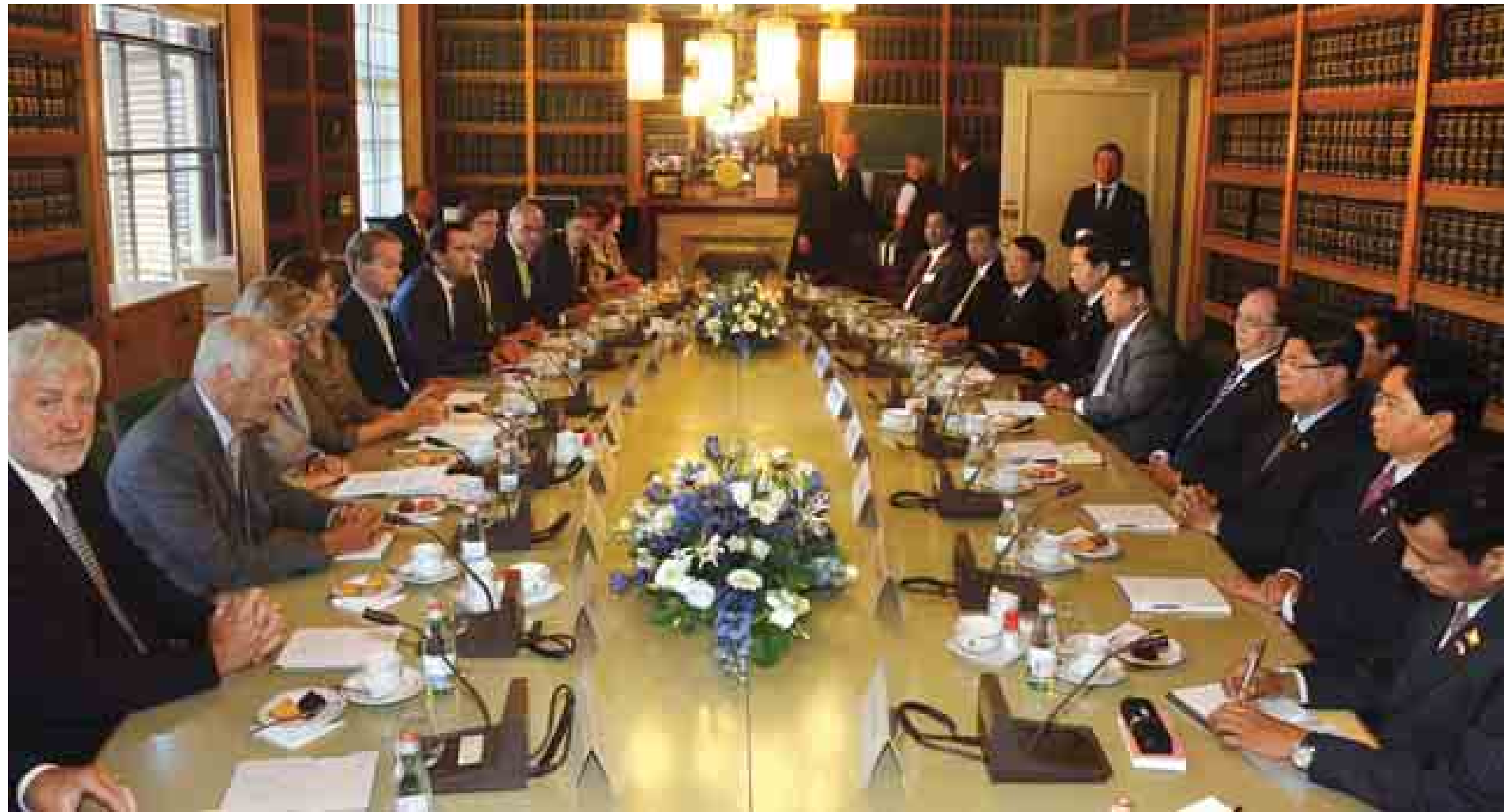
နိုင်ငံတော်သမ္မတ ဦးသိန်းစိန်နှင့်အဖွဲ့ နယ်သာလန်နိုင်ငံ နယ်သာလန်ပါလီမန်တွင် အထက်လွှတ်တော်ဥက္ကဋ္ဌနှင့်အဖွဲ့အား တွေ့ဆုံစဉ်။ (သတင်းစဉ်)

သည့်ဟော် စက်တင်ဘာ ၉ ပြည်ထောင်စုသမ္မတမြန်မာနိုင်ငံတော် နိုင်ငံတော်သမ္မတဦးသိန်းစိန်နှင့် အဖွဲ့သည် စက်တင်ဘာ ၈ ရက် ဒေသစံတော်ချိန် ညနေ ၅ နာရီတွင် နယ်သာလန်နိုင်ငံ နယ်သာလန်ပါလီမန်သို့ ရောက်ရှိပြီး အထက်လွှတ်တော်ဥက္ကဋ္ဌနှင့် အဖွဲ့အား တွေ့ဆုံသည်။