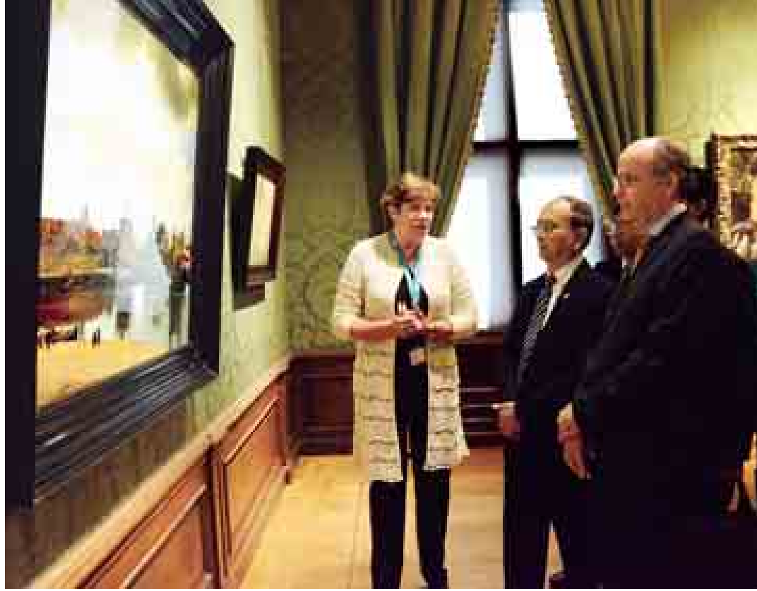
နိုင်ငံတော်နယ်သာလန်နိုင်ငံ ပြတိုက်အတွင်း ထားသည့် ရှေးဟောင်းပန်းချီကားများကို လှည့်လည်ကြည့်ရှုလေ့လာခဲ့သည်။

ယခု ရေထိန်းတံခါးကို မုန်တိုင်းကြောင့်ဖြစ်ပေါ်လာသည့် ရေလွှမ်းမိုးမှုမှ ကာကွယ်ရန်အတွက် ၁၉၉၁ ခုနှစ်တွင် စတင်ဆောက်လုပ်ခဲ့ပြီး