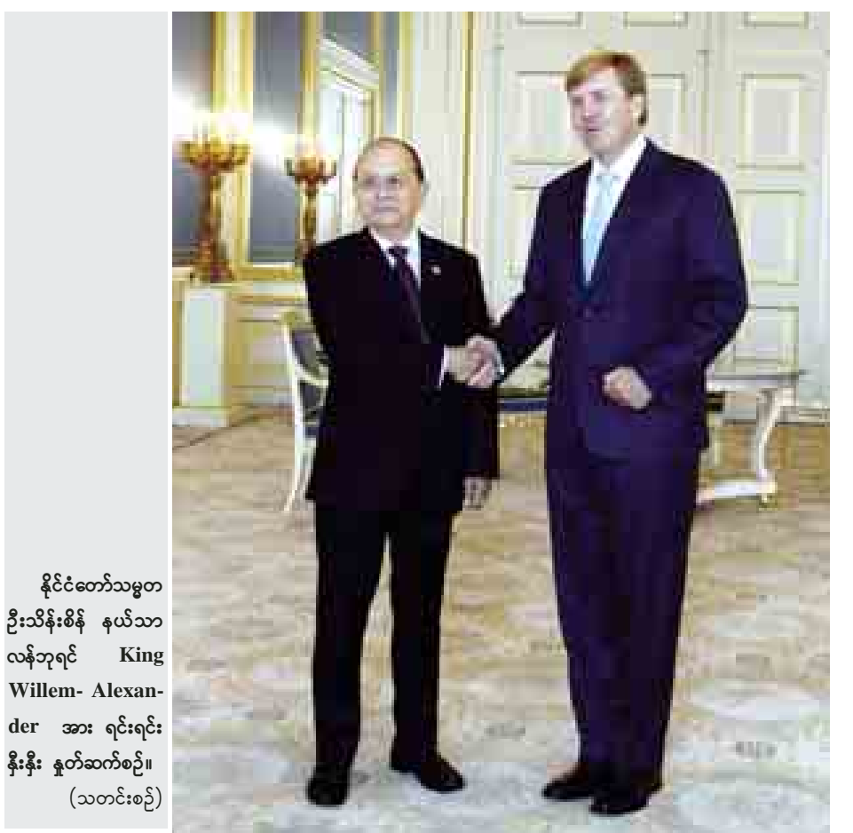
နိုင်ငံတော်သမ္မတ ဦးသိန်းစိန် နယ်သာလန်ဘုရင် King Willem-Alexander အား ရင်းရင်းနှီးနှီး နှုတ်ဆက်စဉ်။ (သတင်းစဉ်)