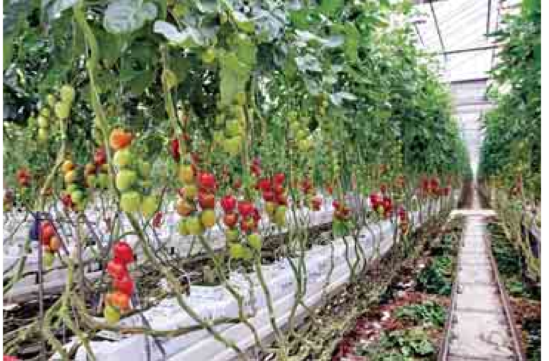
နယ်သာလန်နိုင်ငံ Tomato World ဖန်လုံအိမ်စိုက်ပျိုးရေးပဟိုဠာနှင့် ခရမ်းချဉ်သီးမျိုးစုံအား ဖန်လုံအိမ်စိုက်ပျိုးနည်းဖြင့် စနစ်တကျစိုက်ပျိုးထားရှိမှုကို တွေ့ရစဉ်။ (သတင်းစဉ်)

တင်ဖွင့်လှစ် ကိန်းများရွေးချယ်ခြင်း စသည်ကဏ္ဍ ငါးရပ်တွင် ပူးပေါင်းဆောင်ရွက်ရန် သဘောတူညီခဲ့ကြကြောင်း သိရ သည်။ လက်ရှိအခြေအနေတွင် စီမံ ကိန်းခြောက်ခုကို စမ်းသပ်ဆောင်ရွက် ရန်စီစဉ်လျက်ရှိပြီး ယင်းတို့မှာ မိတ္ထီလာကန် ဖွံ့ဖြိုးတိုးတက်ရေး၊ ပုဂံဒေသ ဘက်စုံရေကြောင်းသွား လာမှုဖွံ့ဖြိုးတိုးတက်ရေး၊ ပန်းလှိုင်မြစ် ရေတံခါးတည်ဆောက်ရေး၊ မန္တလေး နှင့် ပုဂံကြား ဧရာဝတီမြစ်ကြောင်း ဖွံ့ဖြိုးတိုးတက်ရေးအတွက် ဖြစ်နိုင် ခြေလှေ့လာမှု၊ ပဲခူး-စစ်တောင် တူးမြောင်း ဖွံ့ဖြိုးတိုးတက်ရေးအတွက် လေ့လာမှုနှင့် စွမ်းဆောင်ရည် မြှင့်တင်မှုသင်တန်းများ ဖွင့်လှစ်ရေး တို့ဖြစ်သည်။ နိုင်ငံတော်သမ္မတသည် ရော့တာ ဒမ်(Rotterdam) ဆိပ်ကမ်းဖွံ့ဖြိုး တိုးတက်ရေး ဆောင်ရွက်ထားမှုအခြေ အနေများ၊ ဆိပ်ကမ်းနယ်မြေအတွင်း ၁၀၀၀ မဂ္ဂါဝပ်ထုတ်လုပ်နိုင်သည့် ကျောက်မီးသွေး ဓာတ်အားပေး စက်ရုံကို သဘာဝပတ်ဝန်းကျင် ထိခိုက်မှုမရှိစေဘဲ တည်ဆောက် လည်ပတ်နေမှု အခြေအနေများကို သဘောတူ လှည့်လည်လေ့လာခဲ့ကြ သည်။ (သတင်းစဉ်)