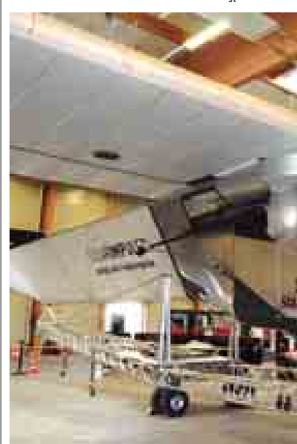
ပိုင်ဆိုင်လေ့လာစခန်းတွင် မြန်မာနိုင်ငံတော်သမ္မတ ဦးသိန်းစိန်နှင့် အဖွဲ့ဝင်များသည် နေရောင်ခြည်စွမ်းအင်သုံး လေယာဉ်ကို ကြည့်ရှုလေ့လာကြသည်။ (သတင်းစဉ်)

ပြည်ထောင်စုသမ္မတ မြန်မာနိုင်ငံတော် နိုင်ငံတော်သမ္မတ ဦးသိန်းစိန်နှင့်အဖွဲ့သည် စက်တင်ဘာ ၆ ရက် ဒေသစံတော်ချိန် နံနက် ၉ နာရီခွဲတွင် ဘန်းမြို့ရှိ Payerne Air Base ပိုင်ဆိုင်လေ့လာစခန်းသို့ သွားရောက်၍ နေရောင်ခြည်စွမ်းအင်သုံး လေယာဉ်ကို ကြည့်ရှုလေ့လာကြသည်။ ရှေးဦးစွာ နိုင်ငံတော်သမ္မတနှင့် အဖွဲ့ဝင်များသည် နေရောင်ခြည်စွမ်းအင်သုံး လေယာဉ်စီမံကိန်း တည်ရှိရာ ပိုင်ဆိုင်လေ့လာစခန်းသို့ ရောက်ရှိကြရာ စီမံကိန်းတာဝန်ခံများက ကြိုဆိုကြသည်။