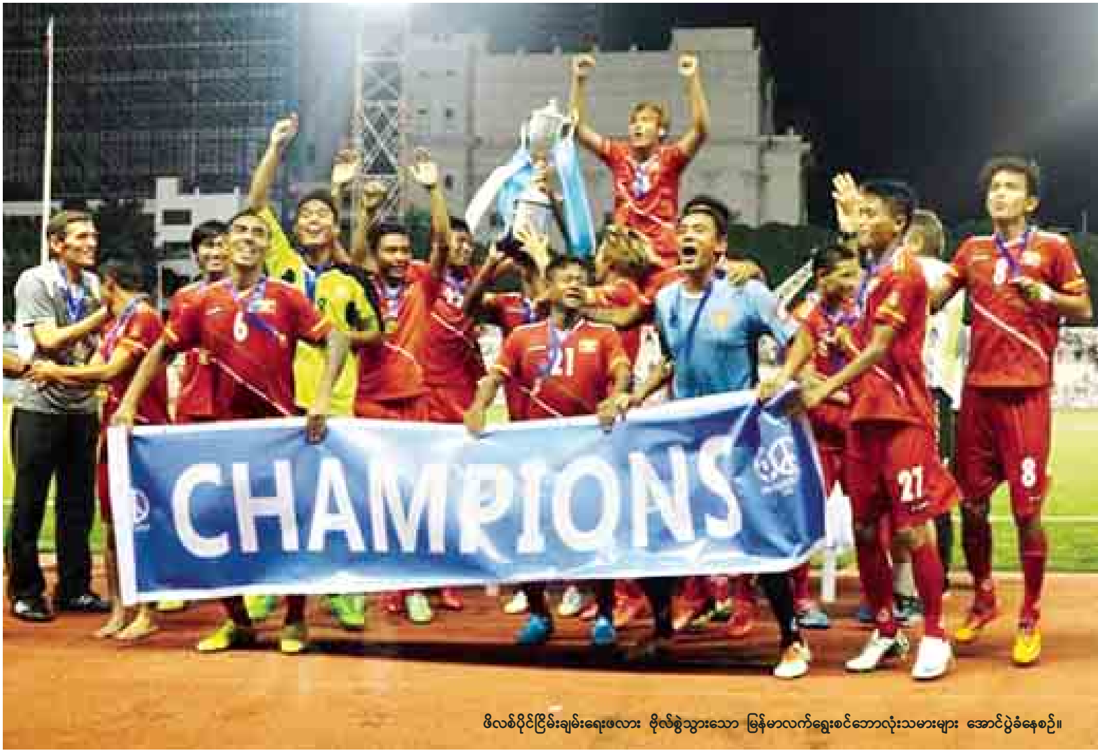
ဖိလစ်ပိုင်ငြိမ်းချမ်းရေးဖလား ပိုလ်စွဲသွားသော မြန်မာလက်ရွေးစင်ဘောလုံးသမားများ အောင်ပွဲခံနေစဉ်။

မနီလာ စက်တင်ဘာ ၆ ဖိလစ်ပိုင်ငြိမ်းချမ်းရေး ဖလား ဖိတ်ခေါ်ဘောလုံးပြိုင်ပွဲ ပိုလ်စွဲပွဲ အဖြစ် မြန်မာအသင်းနှင့်ဖိလစ်ပိုင် အသင်းတို့သည် ယနေ့မြန်မာစံတော်ချိန် ညနေ ၆ နာရီက ယှဉ်ပြိုင်ကစားရာ မြန်မာအသင်းက သုံးဂိုး-နှစ်ဂိုးဖြင့် အနိုင်ရရှိပြီး ချန်ပီယံဆုရရှိသွားသည်။