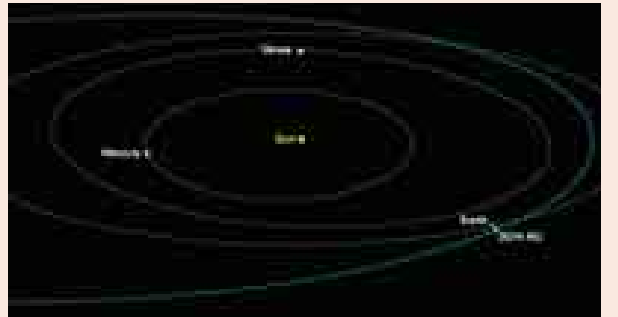
တနင်္ဂနွေနေ့ မွန်းလွဲ ၂ နာရီ ၁၈ မိနစ်) အချိန်တွင် နယူးဇီလန်နိုင်ငံ အထက် ကောင်းကင်ယံကို ဖြတ်သန်းသွား မည် ဖြစ်သည်။ ဘာသာပြန်-ကျော်

မျက်လုံးဖြင့် ကြည့်လျှင် သဲကွဲစွာ မြင်ရမည်မဟုတ်ကြောင်း၊ ဖြတ်သန်း ချိန်မှာ မြန်ဆန်သောကြောင့် သက် တမ်းနည်းသော နက္ခတ္တဗေဒပညာ ရှင်များအနေဖြင့် အဝေးကြည့်မှန် ပြောင်း ငယ်လေးများဖြင့် ကြည့်လျှင် ဖျတ်ခနဲလောက်သာ မြင်နိုင်မည်ဖြစ် ကြောင်း နာဆာက ပြောကြားခဲ့သည်။ အဆိုပါ ပြိုဟ်သိမ်ပြိုဟ်မွှားသည် ယင်း၏အနီးကပ်ဆုံး ချဉ်းကပ်မှုအဖြစ် တနင်္ဂနွေနေ့ဒေသစံတော်ချိန် နံနက် ၆ နာရီ ၁၈ မိနစ် (ကမ္ဘာ့စံတော်ချိန်