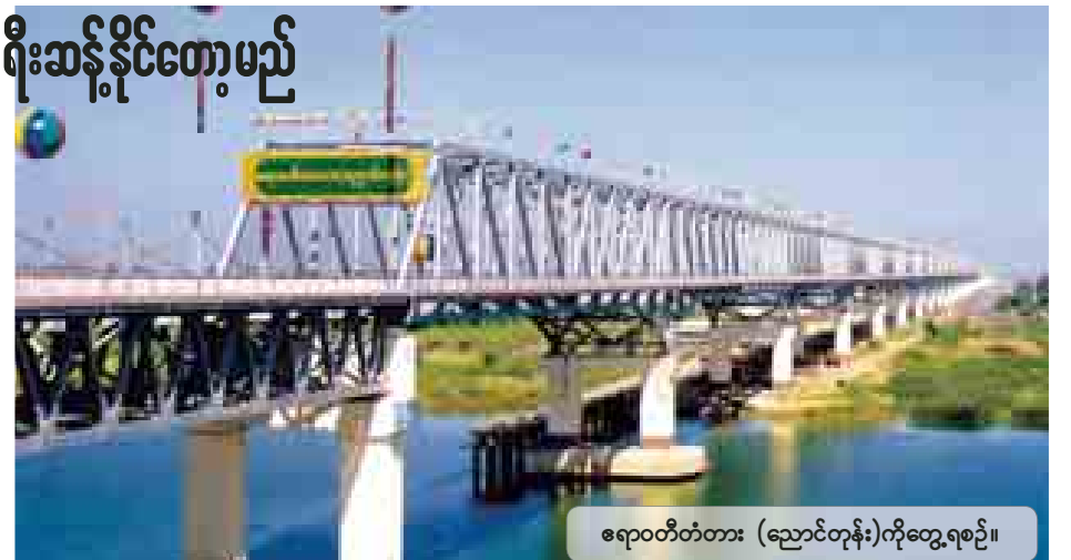
ဧရာဝတီတံတား (ညောင်တုန်း)ကိုတွေ့ရစဉ်။

သတင်းဆောင်းပါးနှင့်ဓာတ်ပုံ ခရမ်းစိုးမြင့် ..... လမ်း၊ မိုင်ပေါင်း ၁၅၈၂ မိုင် ခြောက် ဖာလုံ ရှိသည်။ ထိုလမ်းများအနက်မှ လမ်းပေါင်း ၃၁ လမ်း၊ မိုင်ပေါင်း ၁၁၂ မိုင် ငါးဖာလုံကို ပြည်ထောင်စု အစိုးရ ဆောက်လုပ်ရေးဝန်ကြီးဌာနက စီမံခန့်ခွဲလျက်ရှိသလို လမ်းပေါင်း ၃၆ လမ်း၊ မိုင်ပေါင်း ၄၈၀ ကို ဧရာဝတီ စာမျက်နှာ ၇ ကော်လံ ၅