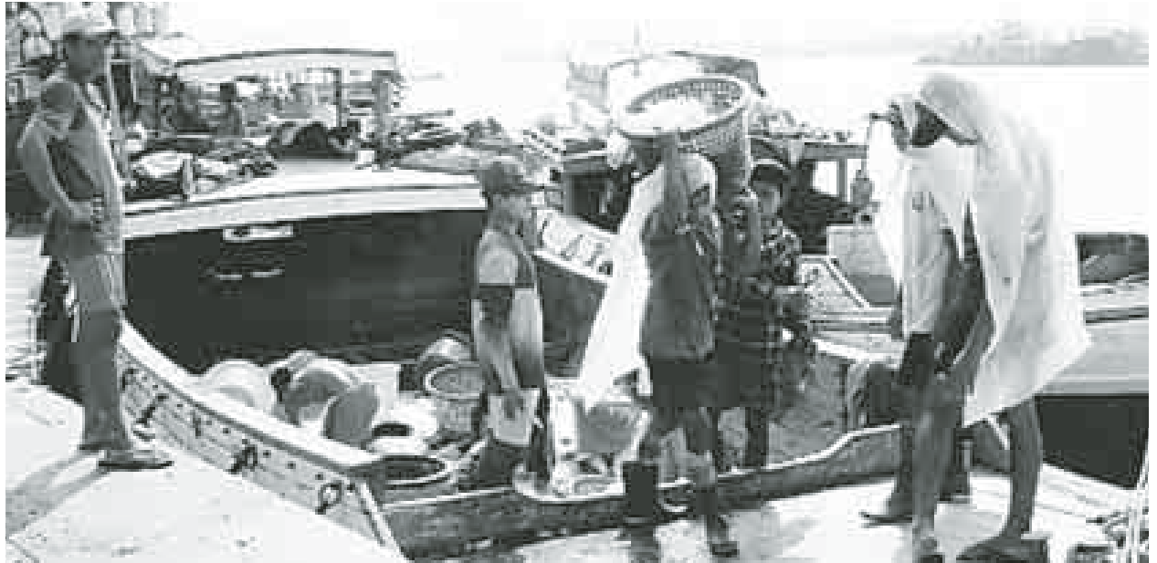
ဗဟိုစံပြ ငါးဈေးသို့ အနယ်နယ်အရပ်ရပ်မှ ငါးသင်္ဘောများ လာရောက်ရောင်းဝယ်နေကြစဉ်။