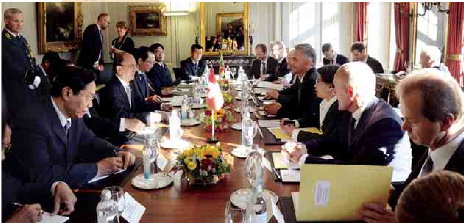
နိုင်ငံတော်သမ္မတဦးသိန်းစိန်နှင့် ဆွစ်ဇာလန်နိုင်ငံသမ္မတ Mr. Didier Burkhalter တို့ ဆွစ်ဇာလန်နိုင်ငံသမ္မတအိမ်တော် Grand Salon ၌ နှစ်နိုင်ငံဆွေးနွေးပွဲကျင်းပစဉ်။