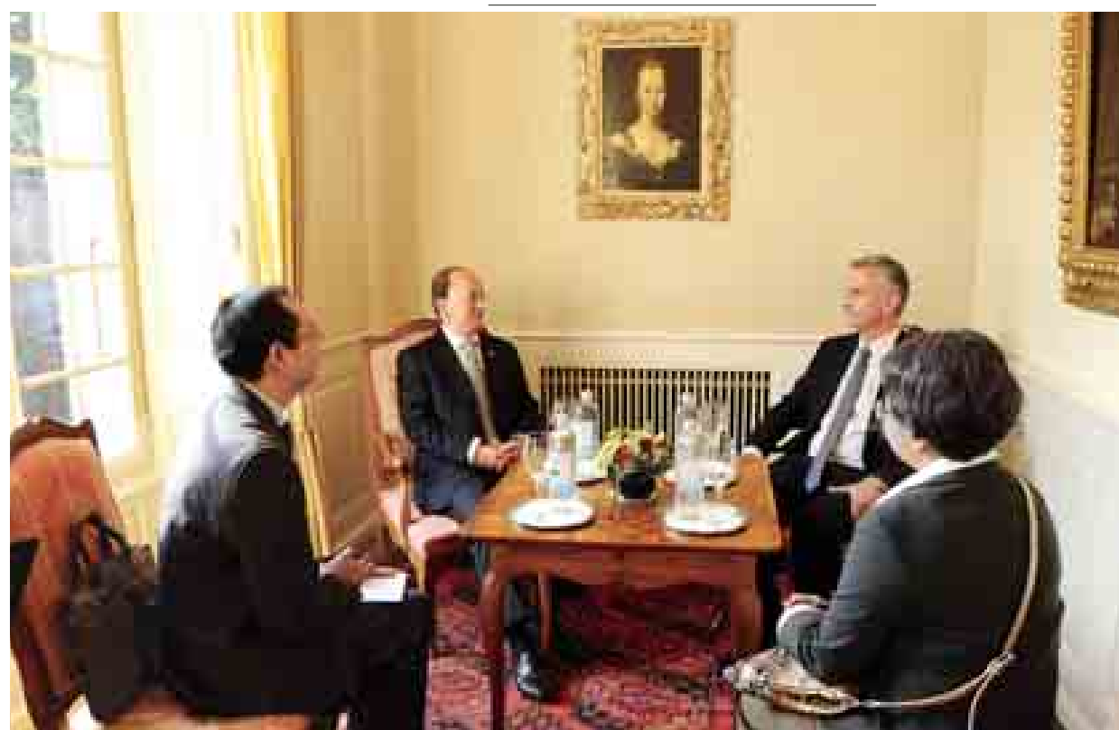
နိုင်ငံတော်သမ္မတ ဦးသိန်းစိန်နှင့် ဆွစ်ဇာလန်နိုင်ငံသမ္မတ Mr. Didier Burkhalter တို့ သမ္မတအိမ်တော်၌ တွေ့ဆုံဆွေးနွေးစဉ်။ (သတင်းစဉ်)

ဆွေးနွေးပွဲအတွင်း နှစ်နိုင်ငံ ချစ်ကြည်ရင်းနှီးမှု တိုးမြှင့်ရေး အတွက် နှစ်နိုင်ငံ နိုင်ငံခြားရေး ဝန်ကြီးဌာနများအကြား ဒုတိယ ဝန်ကြီးအဆင့် ညှိနှိုင်းဆွေးနွေးမှု Foreign Office Consultations (FOC) ယန္တရား ထူထောင်ရေး၊ ဆွစ်ဇာလန်နိုင်ငံမှ မြန်မာနိုင်ငံ ဖွံ့ဖြိုးတိုးတက်ရေးအတွက် ၂၀၁၃-၂၀၁၇ ခုနှစ်အထိ ငါးနှစ်စီမံကိန်း အဖြစ် အမေရိကန်ဒေါ်လာ ၁၆၄ သန်း အကူအညီပေးရေးကိစ္စများကို သဘောတူညီခဲ့ကြသည်။