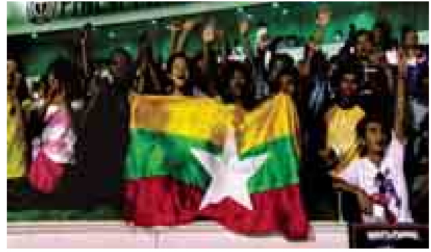
ဖိလစ်ပိုင်ငြိမ်းချမ်းရေးဖလား မြန်မာအသင်းယှဉ်ပြိုင်နေမှုကို အားပေးနေကြသည့် မြန်မာပရိသတ်များကို တွေ့ရစဉ်။

မြန်မာအသင်းမှာ အိမ်ရှင်ဖိလစ်ပိုင်အသင်း၏ သုံးနှစ်ဆက် ချန်ပီယံ ဖြစ်မည့် အိမ်မက်ကို အဆုံးသတ်ကာ ပထမဆုံး ယှဉ်ပြိုင်သည့်ပြိုင်ပွဲမှာပင် အောင်မြင်မှုရခဲ့ခြင်းဖြစ်သည်။ မြန်မာ