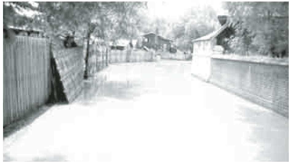
မေတ္တာစော(ရေစကြို)