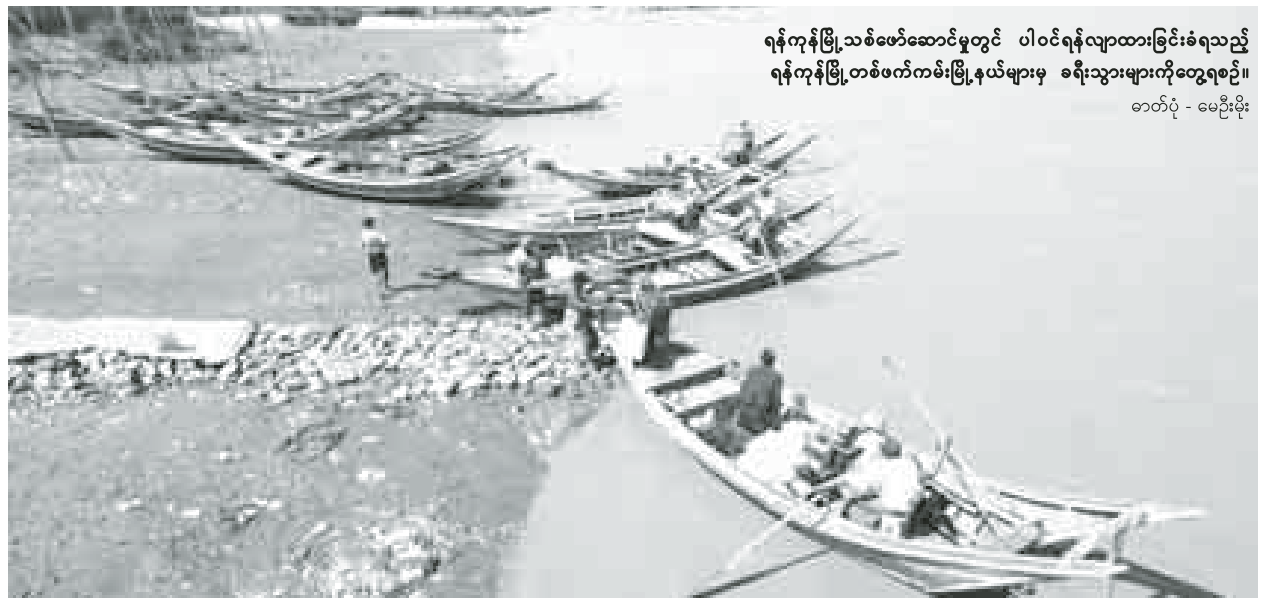
ရန်ကုန်မြို့သစ်ဖော်ဆောင်မှုတွင် ပါဝင်ရန်လျာထားခြင်းခံရသည့် ရန်ကုန်မြို့တစ်ဖက်ကမ်းမြို့နယ်များမှ စရီးသွားများကိုတွေ့ရစဉ်။

“တင်ဒါခေါ်တယ် ထားပါတော့။ တင်ဒါအောင်မြင်သူက မြေဈေးတွေ ကို သူတို့ တောင်းတဲ့ဈေးအတိုင်း ပေးပြီးဝယ်နိုင်ဖို့ဆိုတာ အခက်အခဲ ဖြစ်လာမှာပါ။ အဲဒီအခါ တိုက်ခန်း ဈေးနှုန်းတွေ၊ အိမ်ရာဈေးနှုန်းတွေ ကရော အခြေခံလူတန်းစားတွေ တတ်နိုင်တဲ့ ဈေးနှုန်းတစ်ခုမှာ ကျန်ရှိ နေပါ့မလား” လို့ အိမ်ခြံမြေအကျိုး ဆောင် ဦးသန်းဦးက တွက်ချက်ပြပါ