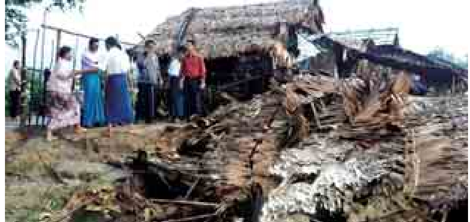
ပဲခူး စက်တင်ဘာ ၆ ပဲခူးမြို့ ကလျာဏီရပ်ကွက် သီရိမင်္ဂလာလမ်းတွင် စက်တင်ဘာ

၆ ရက် ညနေ ၄ နာရီခန့်က မိုးသည်း ထန်စွာရွာသွန်းပြီး လေပြင်းများ တိုက်ခတ်သဖြင့် သီရိမင်္ဂလာလမ်းရှိ