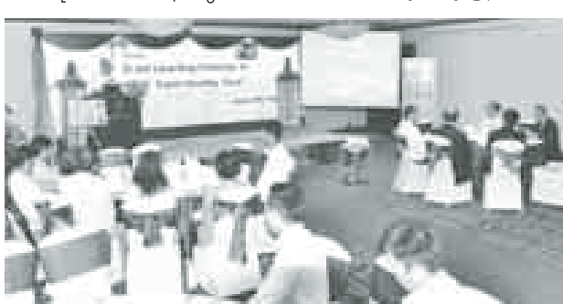
သတင်း-စေ့မိုး

သူပေါင်း သန်း ၄၃၀၀ရှိနေပြီး ငွေပေးချေနိုင်သည့် POS စက်အလုံး ၁၆ ဒသမ ၈ သန်းနှင့် ငွေထုတ်နိုင်သည့် ATM စက် ၁ ဒသမ ၆၄ သန်းရှိနေရာ မြန်မာပြည်သူများလည်း ယင်းကတ်ဖြင့် နိုင်ငံတကာတွင် အသုံးပြုနိုင်တော့မည်ဖြစ်သည်။