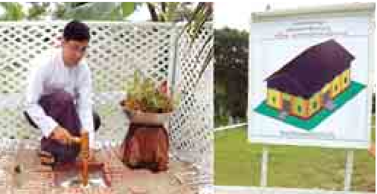
ဒေသကြီး၊ မကွေးတိုင်းဒေသကြီး၊ ပခုက္ကူခရိုင်နှင့် ချင်းပြည်နယ်တို့သို့ မြန်မာ့သွားမည်ဖြစ်ကြောင်း သိရှိရသည်။ (တိုင်းဒေသကြီး ပြန်/ဆက်)

အဆိုပါ သတင်းစာတိုက်စက်ရုံအဆောက်အအုံအား အင်ကြင်း သွေးဆောက်လုပ်ရေးကုမ္ပဏီမှ တာဝန်ယူဆောင်လုပ်မည်ဖြစ်ပြီး ကိုယ်ပွားသတင်းစာတိုက်(မုံရွာ) ပြီးစီးသွားပါက စစ်ကိုင်းတိုင်း