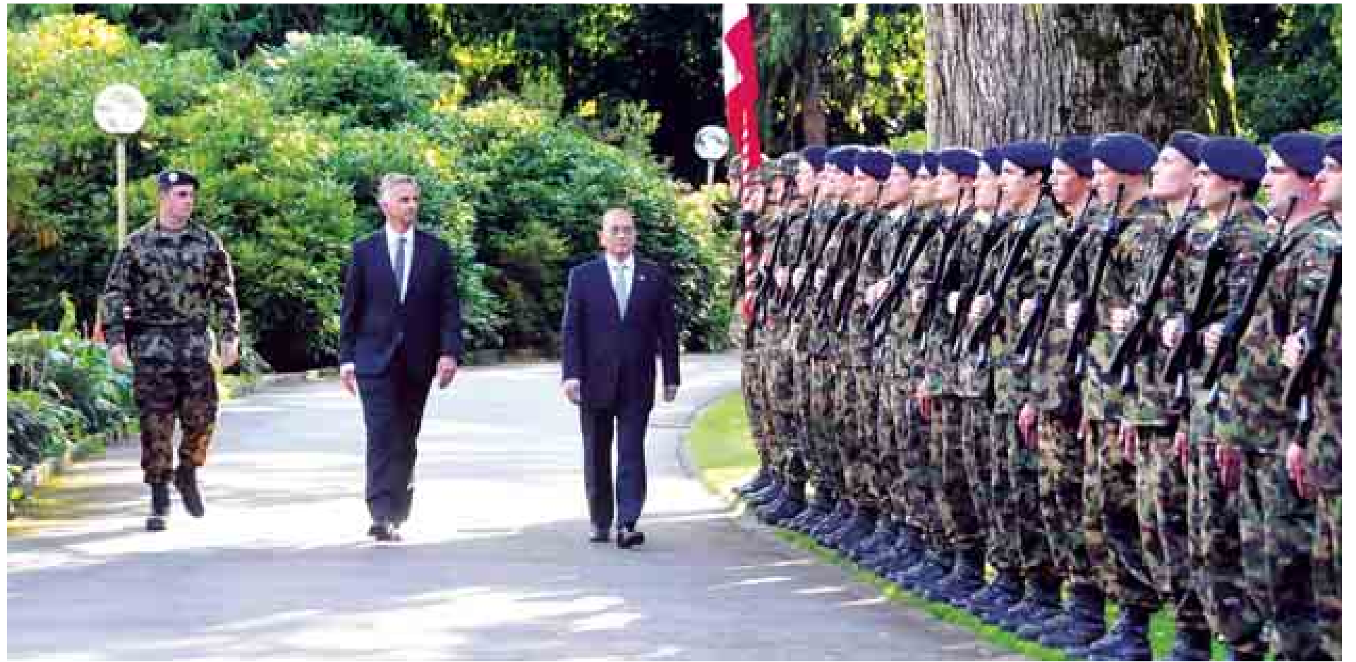
နိုင်ငံတော်သမ္မတ ဦးသိန်းစိန်နှင့် ဆွစ်ဇာလန်နိုင်ငံသမ္မတ Mr. Didier Burkhalter တို့ ဂုဏ်ပြုတပ်ဖွဲ့ကို စစ်ဆေးစဉ်။ (သတင်းစဉ်)