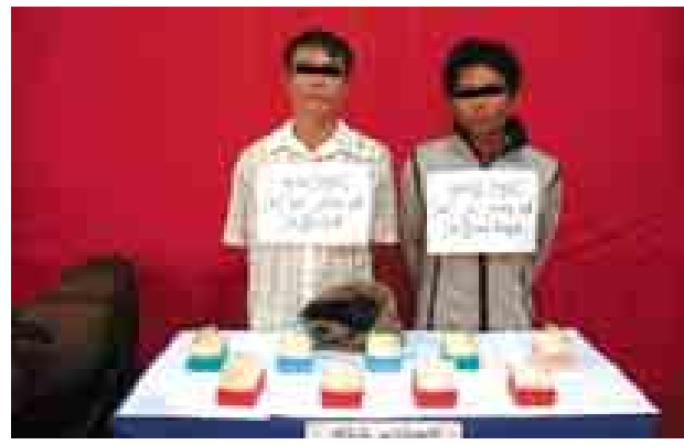
ကူးလနှင့် လွမ်းရှိုးတို့ကို ဖမ်းဆီးရမိ ဘိန်းဖြူများနှင့်အတူ တွေ့ရစဉ်။