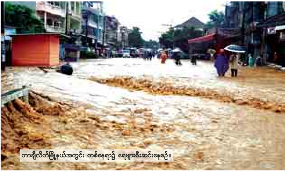
တာချီလိတ်မြို့နယ်အတွင်း တစ်နေရာ၌ ရေများစီးဆင်းနေစဉ်။

ရေနဲ့ အစားအသောက်များကိုလည်း ပြန်ဖြူးပေးခဲ့ပါတယ်။ နံနက် ၁၀ နာရီ ကျော်လောက်မှာ နံမ့်ယွန်းချောင်းရေ စတင်ကျဆင်းလာခဲ့ပြီး မယ်ဆိုင် ချောင်းရေကတော့ ၁၁ နာရီကျော် လောက်မှာ ကျဆင်းခဲ့ပါတယ်။ ဒါပေ မယ့် မွန်းလွဲပိုင်းမှာ မယ်ဆိုင်ချောင်း ရေက တစ်ဖန်တက်လာပါတယ်။ ရေ တက်မှုနှုန်းက အနိမ့်ဆုံးလေးပေ ကနေ အချို့နေရာတွေမှာ ခြောက် ပေကျော်အထိ တက်ခဲ့ပါတယ်”ဟု