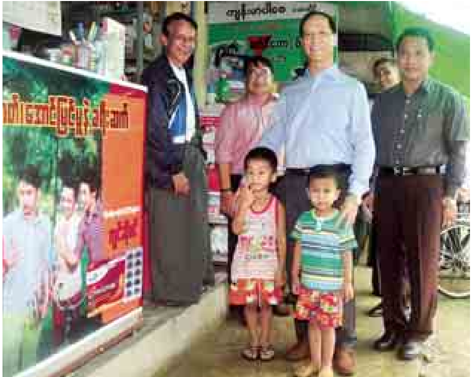
ဒုတိယသမ္မတ ဒေါက်တာစိုင်းမောက်ခမ်း သံတွဲမြို့ မြို့မဈေး၌ ဈေးသူ ဈေးသားများနှင့်အတူ တရင်းတနှီး ဓာတ်ပုံရိုက်စဉ်။

များ ကြိုတင်ပြင်ဆင်ခြင်းလုပ်ငန်း၊ မြစ်ရေလွှဲခြင်း လုပ်ငန်း၊ ပင်မတံခံ လုပ်ငန်း၊ ရေယူအဆောက်အအုံ လုပ်ငန်း၊ ရေထိန်းတံခါးပြန်လုပ်ငန်း၊ ရေပိုလွှဲလုပ်ငန်း၊ ဥမင်လိုက်အထွက် မြောင်းလုပ်ငန်း၊ ဓာတ်အားပေး စက်ရုံလုပ်ငန်းများ ဆောင်ရွက်နေမှု၊ ပြီးစီးမှုနှင့် ဆက်လက်ဆောင်ရွက် မည့်အခြေအနေများ၊ နှစ်အလိုက် ဘဏ္ဍာငွေလိုအပ်ချက်နှင့် ဘဏ္ဍာ ငွေရရှိမှုအခြေအနေများကို အသေး စိတ် ရှင်းလင်းတင်ပြကြသည်။ ယင်းနောက် ဒုတိယသမ္မတ ဒေါက်တာ စိုင်းမောက်ခမ်းသည် စီမံကိန်းလုပ်ငန်းများ ဆောင်ရွက် နေမှုအခြေအနေများကို လှည့် လည် ကြည့်ရှုစစ်ဆေးပြီး လုပ်ငန်း ဆိုင်ရာ လိုအပ်သည်များကို တာဝန် ဖြစ်သည်။ အဆိုပါစီမံကိန်း၏ စက်တင် ဆင်အားသည် ၁၁၁ မဂ္ဂါဝပ် (၃x၃၇)ဖြစ်ပြီး စီမံကိန်းလုပ်ငန်းများ ပြီးစီးသွားပါက နှစ်စဉ် လျှပ်စစ် ဓာတ်အား ၃၈၆ သန်းကီလိုဝပ်နာရီ ပျမ်းမျှထုတ်လုပ်နိုင်မည် ဖြစ်သည်။ ယင်းနောက် ဒုတိယသမ္မတ ဒေါက်တာ စိုင်းမောက်ခမ်းသည် သံတွဲမြို့သို့ရောက်ရှိပြီး မြို့မဈေး၌ ဆိုင်ခန်း ဖွင့်လှစ်ရောင်းချလျက်ရှိ သည့် ဈေးသူဈေးသားများနှင့် ဒေသခံပြည်သူများအား ရင်းရင်း နှီးနှီးတွေ့ဆုံ၍ ရောင်းဝယ်မှုအခြေ အနေများကို မေးမြန်းကာ အားပေး နှုတ်ဆက်စကား ပြောကြားခဲ့သည်။ ဆက်လက်၍ ဒုတိယသမ္မတ သည် ငပလီသို့ရောက်ရှိပြီး ဒေသ