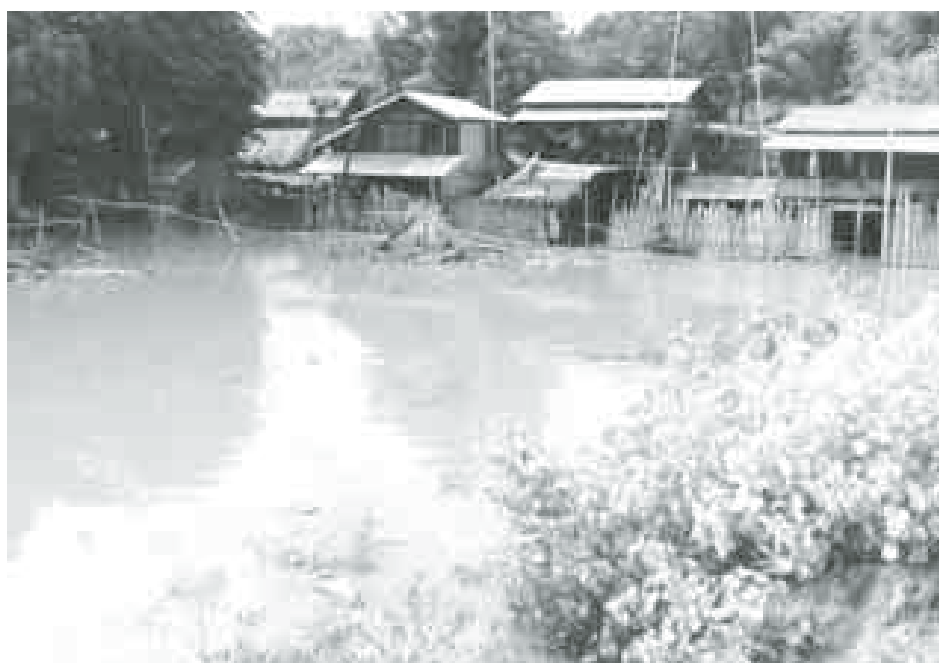
ပေမယ့် အချိန်မီမတားဆီးနိုင်တော့ လေးငါးတောင်လောက် ကျိုးရာကနေ အခုတော့ ၁၀ တောင်၊ ၁၅ တောင်လောက်ဖြစ်သွားတယ်” ဟု ပြောသည်။ ရေဘေးကြောင့် လူနှင့် ကျွဲ၊ နွားများ ဆုံးရှုံးမှုမရှိသော်လည်း ရေဘေးသင့်အိမ်ထောင်စုများမှာ ပြောင်းရွှေ့နေထိုင်ရခြင်းကြောင့် နေရာအခက်အခဲနှင့် စားသောက်ရေးအဆင်မပြေမှုများ ကြုံတွေ့နေကြောင်းနှင့် ကျန်းမာရေးစောင့်ရှောက်မှုအပါအဝင် အကူအညီများ လိုအပ်လျက်ရှိနေကြောင်း သိရသည်။ ပေထွန်းစော်(ရေစကြို)

ရေစကြို၊ စက်တင်ဘာ ၅ ရေစကြိုမြို့တွင် ချင်းတွင်းမြစ်ရေသည် စက်တင်ဘာ ၂ ရက် နေ့လယ်ပိုင်းက မြို့၏စိုစွတ်မှုအထိ မြင့်တက်ခဲ့ပြီး အောင်ချမ်းသာရေကာတာ ကျိုးပေါက်သွားသဖြင့် အမှတ်(၆) အောင်ချမ်းသာရပ်ကွက်နှင့် အမှတ်(၂) ပခန်းရပ်ကွက်များမှ အနိမ့်ပိုင်းနေရာများတွင် အိမ်များအတွင်းသို့ ရေဝင်ရောက်ကာ အိမ်ခြေ ၃၀ ခန့်မှာ ရေလွတ်ရာသို့ ပြောင်းရွှေ့နေရကြောင်း သိရသည်။ “ကျွန်မတို့က ပခန်းရပ်ကွက်မှာ နေတာပါ။ ရေတွေဝင်လာတော့ နေမရလို့ တောင်သာဘုန်းတော်ကြီးကျောင်းနဲ့ ပခန်းရပ်မိန်းကင်းအနီးကို ကိုယ့်အစီအစဉ်နဲ့ ကိုယ် ပြောင်းရွှေ့နေရပါတယ်။ လူတချို့လည်း တုပ်တွေးဖျား ဖျားနေတယ်” ဟု ရေဘေးကြောင့် ပြောင်းရွှေ့နေရသူ အမျိုးသမီးတစ်ဦးက စက်တင်ဘာ ၃ ရက်တွင် ပြောသည်။ “မနေ့က အောင်ချမ်းသာတာပေါင်ကျိုးခါစမှာ ရပ်ကွက်သားတွေ စုပြီး ပိတ်ကြတာပဲ။ မရဘူး။ ဆည်မြောင်းက လာကြည့်ပြီး လုပ်ပေးမယ် ပြော