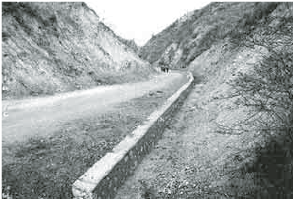
စစ်ကိုင်းမြို့နယ် မယ်ဇလီချောင်းကျေးရွာအဝင်လမ်း မြေထိန်းနံရံပြုပြင်တည်ဆောက်ပြီးစီးပုံ။

စစ်ကိုင်းတိုင်းဒေသကြီး စစ်ကိုင်းမြို့နယ်အတွင်း ဖွံ့ဖြိုးရေးလုပ်ငန်းများ ဆောင်ရွက်ရန်အတွက် ၂၀၁၃-၂၀၁၄ ဘဏ္ဍာရေးနှစ်တွင် ပြည်ထောင်စုလွှတ်တော်မှ ဖွံ့ဖြိုးရေးရန်ပုံငွေကျပ်သိန်းတစ်ထောင် ခွဲဝေချထားပေးခဲ့ရာ စစ်ကိုင်းမြို့နယ် ပြည်သူ့လွှတ်တော်ကိုယ်စားလှယ် အမျိုးသားလွှတ်တော်ကိုယ်စားလှယ်နှင့် တိုင်းဒေသကြီးလွှတ်တော်ကိုယ်စားလှယ်များ ဦးဆောင်ပြီး လုပ်ငန်းကော်မတီဖွဲ့စည်း၍ မြို့နယ်ဖွံ့ဖြိုးရေးလုပ်ငန်းအကောင်အထည်ဖော်ရေးကော်မတီ၏ကြီးကြပ်မှုဖြင့် မြို့နယ်ဖွံ့ဖြိုးရေးလုပ်ငန်းများ ဆောင်ရွက်ခဲ့ရာ ကျေးရွာနေဒေသခံပြည်သူများ သွားလာရေး အဆင်ပြေချောမွေ့စေရေးအတွက် ကျေးရွာချင်းဆက်လမ်းဖောက်လုပ်ခြင်း၊ ကျောက်ခင်းလမ်းအဆင့်မြှင့်လုပ်ငန်းများ၊ ပျက်စီးယိုယွင်းနေသောတံတားများ ပြုပြင်တည်ဆောက်ခြင်း၊ မြေထိန်းနံရံများ တည်ဆောက်ခြင်းလုပ်ငန်း(၂၉)ခု၊ ရေရှားပါးသော ကျေးရွာများတွင် သန့်ရှင်းသောသောက်သုံးရေရရှိရေးအတွက် ရေတွင်းရေလှောင်ကန်များ