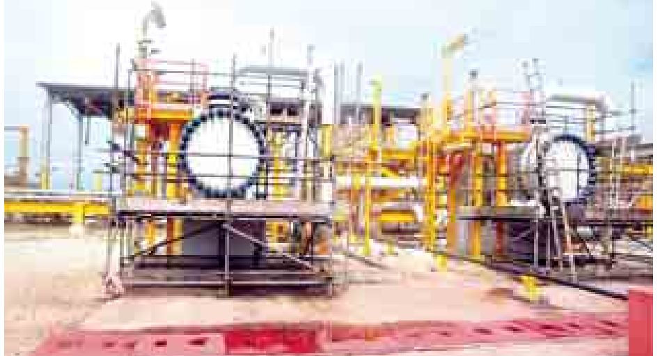
ရွှေသဘာဝဓာတ်ငွေ့စီမံကိန်း ကျောက်ဖြူသဘာဝဓာတ်ငွေ့ထိန်းဖြန့်စနစ်(OGT) ကို တွေ့ရစဉ်။ (သတင်းစဉ်)

ဆက်လက်၍ ဒုတိယသမ္မတ ဒေါက်တာစိုင်းမောက်ခမ်းနှင့်အဖွဲ့ သည် ကျောက်ဖြူမြို့၏ ဖွံ့ဖြိုးတိုး တက်မှု အခြေအနေများကို လှည့် လည်ကြည့်ရှုစစ်ဆေးပြီး ပညာရေး ကောလိပ်လေ့ကျင့်ရေး အလယ်တန်း ကျောင်းမှ ဆရာ ဆရာမများ၊ ကျောင်းသား ကျောင်းသူလေးများ၊ ပညာရေးကောလိပ်မှ သင်တန်းသား သင်တန်းသူများ၊ ဆရာ ဆရာမများ အား ရင်းရင်းနှီးနှီးတွေ့ဆုံ၍ ပညာ သင်ကြားမှု၊ သင်ယူမှုအခြေအနေများ ကို မေးမြန်းကာ အားပေးနှုတ်ဆက် စကား ပြောကြားသည်။ ထို့နောက် ဒုတိယသမ္မတနှင့် အဖွဲ့သည် သူဌေးရေအားလျှပ်စစ် စီမံကိန်းသို့ ရောက်ရှိကြပြီး