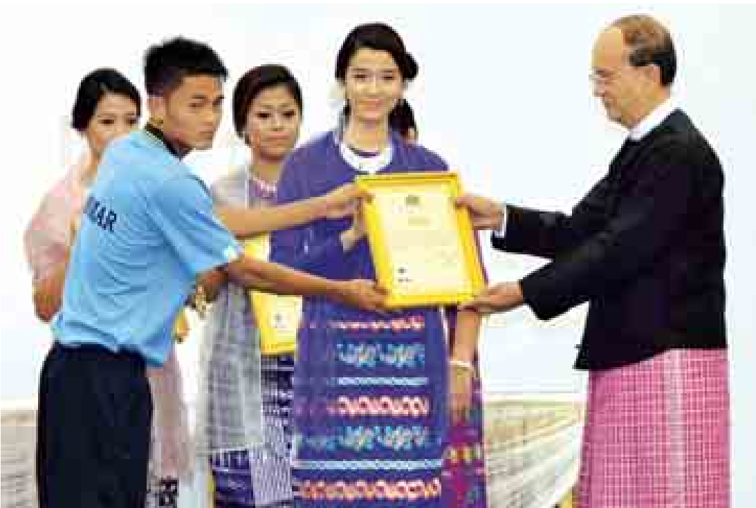
နိုင်ငံတော်သမ္မတ ဦးသိန်းစိန် အောင်ပွဲရမြန်မာ့လက်ရွေးစင် အသက် ၁၉ နှစ်အောက် ဘောလုံးအသင်းမှ အားကစားသမားများအား ဂုဏ်ပြုမှတ်တမ်းလွှာများ ပေးအပ်ချီးမြှင့်စဉ်။ (သတင်းစဉ်)