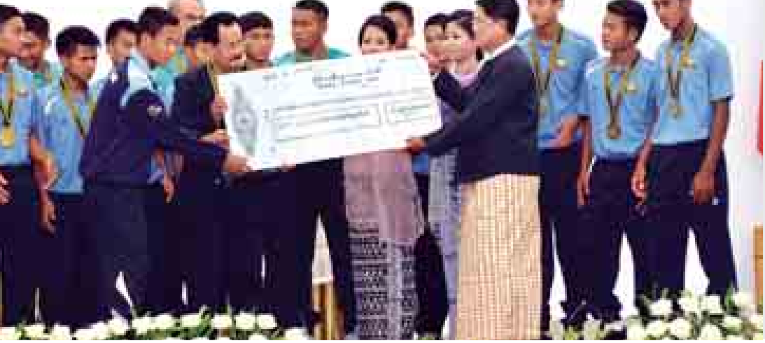
ပြည်ထောင်စု ဝန်ကြီး ဦးတင့် ဆန်း အောင်ပွဲရ မြန်မာ့ လက် ရွေးစင် အသက် ၁၉ နှစ် အောက် ဘောလုံး အသင်း မှ အားကစား သ မား များ အတွက် ဂုဏ်ပြု ဆုငွေ ပေးအပ် စဉ်။ (သတင်းစဉ်)