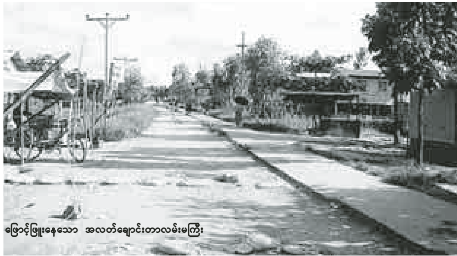
ဖြောင့်ဖြူးနေသော အလတ်ချောင်းတာလမ်းမကြီး

ယခုအခါ ရန်ကုန်တိုင်းဒေသကြီး အစိုးရအဖွဲ့အနေဖြင့် ရန်ကုန်မြို့၏ လူဦးရေနှင့် လူမှုစီးပွားရေးအခြေ အနေများ လျင်မြန်စွာ ဖွံ့ဖြိုးတိုးတက် ပြောင်းလဲမှုကြောင့် မြို့တိုးချဲ့တည် ဆောက်ပေးရန် လိုအပ်ချက်အရ ရန်ကုန်မြို့အနောက်ဘက်ခြမ်းတွင်ရှိ သော မြေဧက ၃၀၀၀၀ပေါ်၌ မြို့သစ် စီမံကိန်းတစ်ခု အကောင်အထည်ဖော် သွားတော့မည်ဖြစ်ကြောင်း ဩဂုတ် ၂၂ ရက်တွင် ကျင်းပခဲ့သော ပထမ