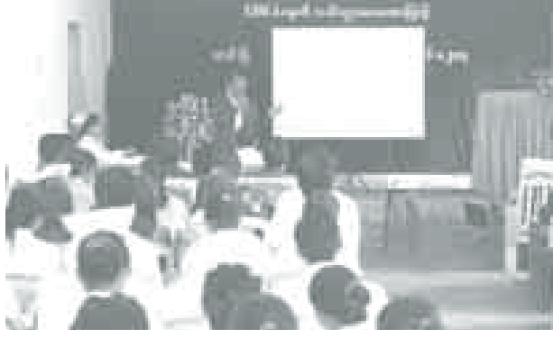
ကြောင်း ရှင်းလင်းပြောကြားသည်။ ဟောပြောပွဲသို့ မြို့နယ်အုပ်ချုပ်ရေးမှူး ဦးဆွေခန့်ထံမှ မြို့နယ်အဆင့်ဌာနဆိုင်ရာတာဝန်ရှိသူများ၊ ကြီးကြပ်-၂ သင်တန်းသား သင်တန်းသူများနှင့် ကျန်းမာရေးဝန်ထမ်းများ တက်ရောက်ခဲ့ကြောင်း သိရသည်။ (ပြည့်နယ် မြန်/ဆက်)

အစားများနှင့် ရောဂါကူးစက်ပုံ၊ ကူးစက်နည်းနှင့် ကာကွယ်ရန်၊ ရောဂါရှိသူကို ကိုင်တွယ်ရမည့် နည်းစနစ်များ၊ ရောဂါကူးစက်ခြင်းစက်ကွင်းများကို အသေးစိတ်ရှင်းလင်းပြီး အဆိုပါ ရောဂါဖြင့် ကမ္ဘာပေါ်တွင် လူအမြောက်အမြား သေဆုံးပြီးဖြစ်ကြောင်း၊ ကူးစက်မှုမြန်ဆန်သော ရောဂါဖြစ်သော်လည်း ကြောက်စရာမလိုကြောင်း၊ သို့ရာတွင် မပေါ့ဆသင့်ကြောင်း၊ ကိုယ်ပတ်ဝန်းကျင်၌ လည်း ကူးစက်နိုင်သည်ဖြစ်၍ အသိပညာပေးကြရမည် ဖြစ်ကြောင်း၊ ရောဂါဖြစ်ပွားပါက ထိန်းချုပ်နိုင်ရန် ရောဂါရှိသူကို စနစ်တကျ အထူးဂရုစိုက် ကိုင်တွယ် ပြုစုရမည်ဖြစ်