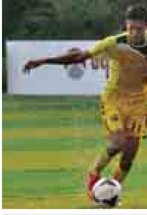
မြန်မာ ယူ -၁၉ လူငယ်ဘောလုံးသမားများ လေ့ကျင့်နေမှုကိုတွေ့ရစဉ်။

ရန်ကုန် ဩဂုတ် ၂၉ ဘရူနိုင်း ဘုရင့်ဖလားပြိုင်ပွဲ တွင် ဝိုလ်ခွဲခဲ့သည့် မြန်မာယူ-၁၉