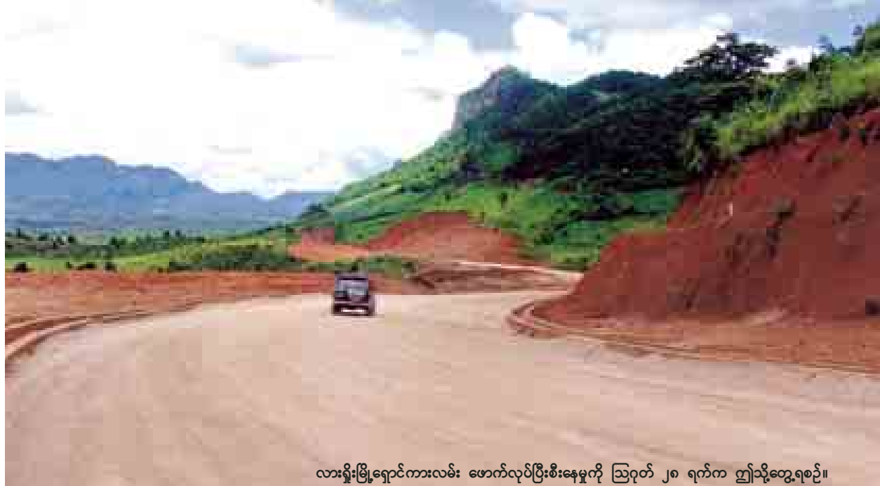
လားရှိုးမြို့ရှောင်ကားလမ်း ဖောက်လုပ်ပြီးစီးနေမှုကို ဩဂုတ် ၂၈ ရက်က ဤသို့တွေ့ရစဉ်။