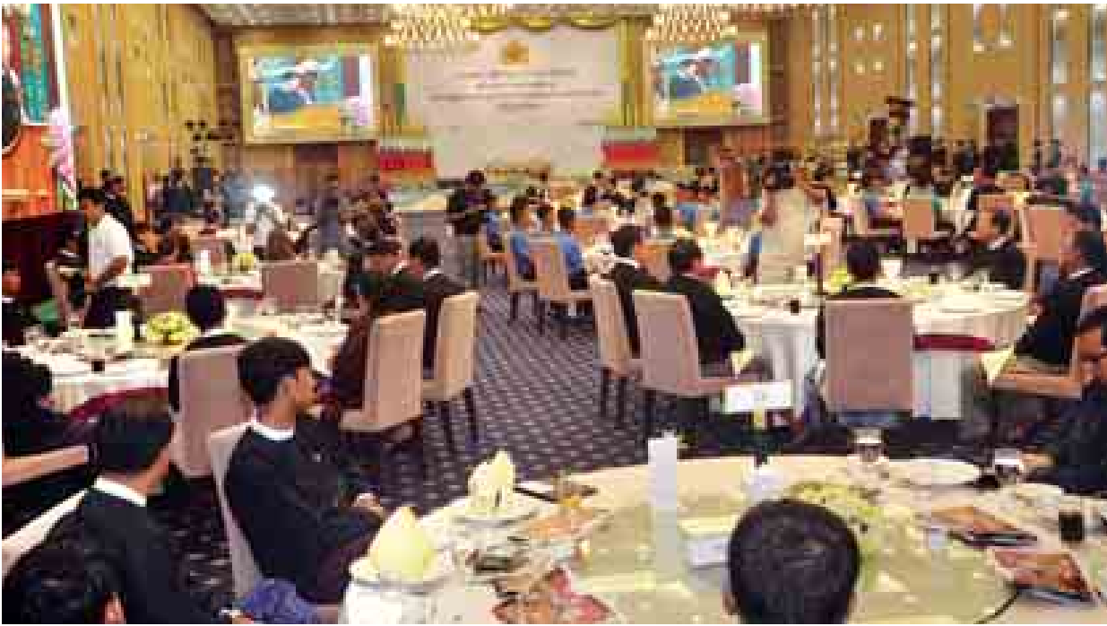
၂၀၁၄ ခုနှစ် ဘရူနိုင်းဘုရင့်ဖလားဘောလုံးပြိုင်ပွဲတွင် ချန်ပီယံဆုပေး ဆွတ်ခူးရရှိခဲ့သည့် အောင်ပွဲရ မြန်မာ့လက်ရွေးစင် အသက် ၁၉ နှစ်အောက် ဘောလုံးအသင်းအား ဂုဏ်ပြုပွဲအခမ်းအနားကျင်းပစဉ်။

ယနေ့အောင်မြင်မှုရရှိခဲ့သည့် မြန်မာ့လက်ရွေးစင် အသက် ၁၉ နှစ်အောက် ဘောလုံးအသင်း၏ အခြေအနေကို ပြန်ကြည့်လျှင် ယခုကဲ့သို့ အောင်မြင်မှုရရှိရန် မြန်မာ့လူငယ်ဘောလုံးအသင်းသည် လွန်ခဲ့သည့် တစ်နှစ်ခွဲလောက် ကတည်းက ကြိုတင်ပြင်ဆင်ခဲ့ ကြပါကြောင်း၊ ဂျာမနီနည်းပြ မစ္စတာဂတ်ကို တာဝန်ပေးအပ်၍ အသင်းကို စိတ်ကြိုက်ဖွဲ့စည်းစေခဲ့ ပါကြောင်း၊ အတွေ့အကြုံရအောင် MNL-2ပွဲတွင် ထည့်သွင်းယှဉ်ပြိုင် စေခဲ့ပါကြောင်း၊ နိုင်ငံတကာပွဲ အတော်များများကိုလည်း သွားပြီး ကစားခဲ့ပါကြောင်း၊ ဂျာမနီနှင့် ချက်သမ္မတ နိုင်ငံများကိုလည်း တစ်လခန့်စေလွှတ်ပြီး ထိပ်တန်း နိုင်ငံများ၊ ကလပ်အသင်းများကို လူငယ်အသင်းများနှင့် ခြေစမ်းပွဲ များ စေလွှတ်ကစားစေခဲ့ပါ ကြောင်း၊ ရန်ကုန်မြို့တွင်လည်း ဂျပန်အသက် ၁၉ နှစ်အောက် အသင်းကို ဖိတ်ခေါ်ပြီး ခြေစမ်းပွဲ ကစားစေခဲ့ပါကြောင်း။ မြန်မာ့ဘောလုံးအဆင့်အတန်း