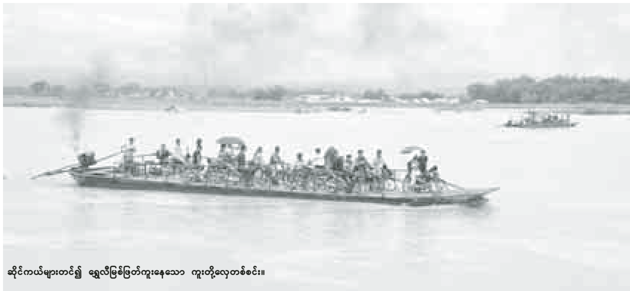
ဆိုင်ကယ်များတင်၍ ရွှေလီမြစ်ဖြတ်ကူးနေသော ကူးတို့လှေတစ်စင်း။