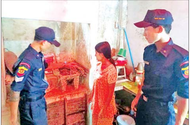
ရာတို့ကို အသိပညာပေးဆွေးနွေးကာ လိုအပ်သည်များ ကူညီဆောင် ရွက်ပေးခဲ့ကြောင်း သိရသည်။ ခရိုင်(ပြန်/ဆက်)

သထုံမြို့နယ်အတွင်း လိပ်အင်း၊ နန်းခဲ၊ အောက်ကျင်းနှင့် သိမ်ကုန်း ရပ်ကွက်တို့ရှိ အိမ်ခြေ ၂၉၅ အိမ်၊ အိမ်ထောင်စုပေါင်း ၃၁၈ စုတို့ကို မြို့နယ် မီးသတ်ဦးစီးဌာနမှ သန္ဓေနှင့် အရန်မီးသတ်တပ်ဖွဲ့ဝင်များက တစ်အိမ် တက်ဆင်း လိုက်လံစစ်ဆေးကာ မီးလောင်မှုဖြစ်ပွားရသည့် အဓိက အချက်များ၊ ပြည်သူများအနေဖြင့် မီးလောင်မှုဖြစ်ပွားအောင် လိုက်နာ ဆောင်ရွက်ရမည့်အချက်များ၊ မီးဘေးကြိုတင်ကာကွယ်ရေး လိုက်နာ ရမည့်အချက်များ၊ ဆောင်ရန်/ရှောင်ရန်အချက်များ စသည့် သိမှတ်ဖွယ်