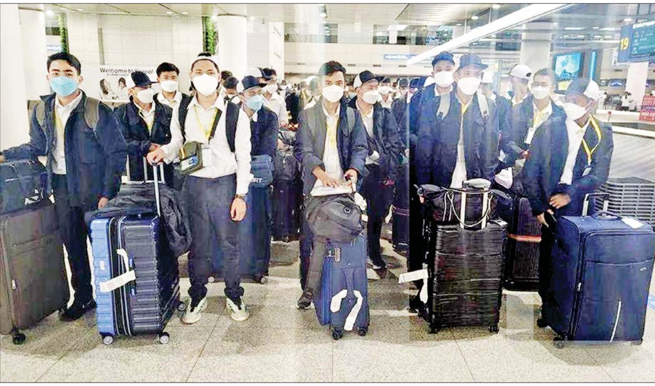
၂၀၂၃ ခုနှစ်က ဂျပန်နိုင်ငံသို့ သွားရောက်လုပ်ကိုင်သည့် မြန်မာလုပ်သားအချို့ကို တွေ့ရစဉ်။

နေပြည်တော် မေ ၁ မြန်မာနိုင်ငံအရပ်ရပ်တွင် မိုးကြိုကာလဖြစ်သည့် မေလမှ မြန်မာနိုင်ငံသို့ အနောက်တောင်မှတ်သုံလေမဝင်ရောက်မီကာလအတွင်း လေထုမငြိမ်မသက်မှုများ ကြောင့်လည်းကောင်း၊ နေအပူချိန်များ တဖြည်းဖြည်း မြင့်တက်လာရာမှ အပူပြန်တက်တိမ်များဖြစ်ထွန်း၍ မွန်လုံး/ညနေပိုင်းတို့တွင် မိုးတိမ်တောင်များ ဖြစ်ထွန်းခြင်းကြောင့်လည်းကောင်း၊ လေပြင်းများ တိုက်ခတ်ခြင်း၊ လေပြင်းနှင့်အတူ ထစ်ချွန်းခြင်း၊ မိုးကြိုးပစ်ခြင်း၊ လျှပ်စီးလက်ခြင်း၊ မိုးသီးကြွေခြင်းနှင့် နေရာကွက်ကျား မိုးထစ်ချွန်းရွာခြင်း စသည့် မိုးလေဝသဖြစ်စဉ်များ ဖြစ်ပေါ်နိုင်ပါသည်။ လေပြင်းတိုက်ခတ်စဉ် မြေပြင်/ရေပြင်လေသည် တစ်နာရီလျှင် မိုင် ၄၀ မှ မိုင် ၅၀ အထိ တိုက်ခတ်နိုင်ပါသည်။ အကြံပြုချက် သို့ဖြစ်ပါ၍ ပြည်သူများအနေဖြင့် မိုးကြိုကာလဖြစ်သည့် မေလမှ မြန်မာနိုင်ငံသို့ အနောက်တောင်မှတ်သုံလေမဝင်ရောက်မီကာလအတွင်း ဖြစ်ပေါ်လာနိုင်သည့် မိုးလေဝသဖြစ်စဉ်များနှင့် ပတ်သက်၍ အထူးဂရုပြုနေထိုင်သွားကြပါရန်နှင့် ပြည်တွင်းလေကြောင်းပျံသန်းရေးနှင့် ရေကြောင်း ခရီးစဉ်များအနေဖြင့်လည်း ကြိုတင်သတိပြုနိုင်ပါရန် အသိပေးနှိုးဆော်အပ်ပါသည်။ မိုး/လေ