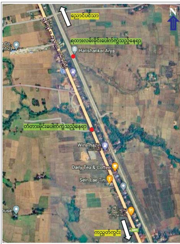
KNLA အဖွဲ့မှ အကြမ်းဖက်မှုကို လိုလားသူများနှင့် PDF အမည်ခံ အကြမ်းဖက်သမားများက တံတားနှင့် မီးရထားလမ်းတို့အား မိုင်းထောင်ဖောက်ခွဲခဲ့သည့် နေရာပြပုံ။

အကျယ် ၆၄ ပေ ငနုသန်းသံကူ ကွန်ကရစ်တံတားအား KNLA အဖွဲ့မှ အကြမ်းဖက်မှုလိုလားသူ များနှင့် PDF အမည်ခံ အကြမ်းဖက်သမားများက မိုင်းထောင် ဖောက်ခွဲမှုကြောင့် တံတား၏ အလယ် အလျားပေ ၅၀ ခန့်နှင့် အကျယ်ပေ ၅၀ ခန့် ပြိုကျပျက်စီး ခဲ့သည်။ အလားတူ KNLA အဖွဲ့မှ အကြမ်းဖက်မှု လိုလားသူများနှင့် PDF အမည်ခံ အကြမ်းဖက်သမား များက ၎င်းတံတား၏ အနောက် မြောက်ဘက် မီတာ ၇၀၀ ခန့် အကွာရှိ ရန်ကုန်-မန္တလေး မီးရထားလမ်းအား မိုင်းထောင် ဖောက်ခွဲမှုကြောင့် ရထားလမ်း ဟောင်း၌ ရထားလမ်းသံပေါင် နှစ်ခုမှာ ၁၀ ပေခန့် ပြုတ်ထွက် ပျက်စီး၍ ရထားလမ်းသစ် သံပေါင်နှစ်ခုမှာ ပေ ၂၀ ခန့် ပြုတ်ထွက်ပျက်စီးခဲ့သည်။ အကြမ်းဖက် သမားများအနေ ဖြင့် ကျေးရွာသူ ကျေးရွာသားများ အား သွားလာမှုခက်ခဲစေရန် နှင့် အထိတ်တလန့်ဖြစ်ပြီး ကြောက်ရွံ့လာစေရန်၊ ကုန်စည် စီးဆင်းမှုကို ထိခိုက်ဆုံးရှုံးမှုဖြစ်စေ ပြီး တည်ငြိမ်မှုပျက်ပြားစေရန် ရည်ရွယ်၍ စစ်ရေးနှင့်မသက်ဆိုင်