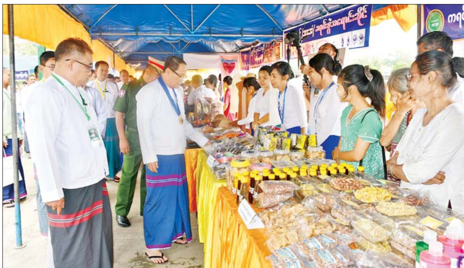
အားဖြင့် ရွှေကရင်အဖွဲ့၏ ဒိုးပတ်ဝိုင်း၊ ကျောင်းသား ကျောင်းသူများက အလုပ်သမားနေ့သီချင်းဖြင့် တီးမှုတ်သီဆိုကပြဖျော်ဖြေကြရာ ပြည်နယ်

ထို့နောက် ပြည်နယ်ဝန်ကြီးချုပ်က ပြည်နယ် အတွင်း ဝန်ဆောင်မှုကဏ္ဍနှင့် ထုတ်လုပ်မှုကဏ္ဍတို့ တွင် ထူးချွန်ဆုရရှိကြသူများအား ဂုဏ်ပြုဆုများပေး အပ်ချီးမြှင့်ပြီး အလုပ်သမားနေ့ကို ဂုဏ်ပြုသော