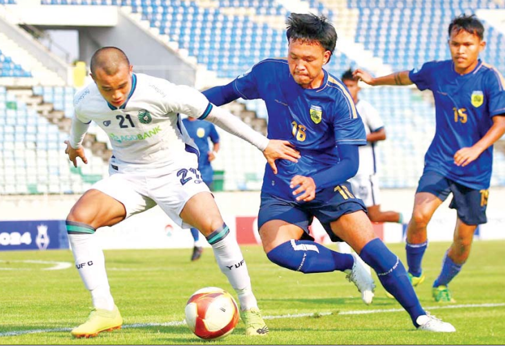
ရန်ကုန်ယူနိုက်တက်နှင့် တက္ကသိုလ်အသင်းတို့ ယှဉ်ပြိုင်ကစားကြစဉ်။

ရန်ကုန် မေ ၁ ၂၀၂၄ MNL Cup ပြိုင်ပွဲ အုပ်စု(က) ပွဲစဉ်(၇)ကို ယနေ့တွင် ဆက်လက်ကျင်းပရာ ရန်ကုန်အသင်း ခြောက်ပွဲဆက်အနိုင်ရပြီး ရွှေပြည်သာယူနိုက်တက် အသင်း ပထမဆုံး နိုင်ပွဲရရှိခဲ့သည်။ လေးဂိုး-တစ်ဂိုးဖြင့် အနိုင်ရ သုဝဏ္ဏကွင်း၌ ကျင်းပသည့်ပွဲတွင် ရန်ကုန် ယူနိုက်တက်အသင်းက တက္ကသိုလ်အသင်းကို လေးဂိုး- တစ်ဂိုးဖြင့် အနိုင်ရခဲ့သည်။ ရန်ကုန်ယူနိုက်တက်အသင်း သည် အုပ်စုတွင်း ရာနန်းပြည့်နိုင်ပွဲနှင့်အတူ ဆက်လက် ဦးဆောင်နိုင်ခဲ့ပြီး ဆီမီးဖိုင်နယ်တက်ရောက်ရန် ပိုမို နီးစပ်လာခဲ့သည်။ တက္ကသိုလ်အသင်းမှာမူ ပထမပိုင်းတွင် တစ်ဂိုးစီသရေကစားနိုင်သော်လည်း ဒုတိယပိုင်းတွင် ဂိုးများပေးခဲ့ရသဖြင့် ဂိုးပြတ်အရေးနိမ့်ခဲ့ခြင်းဖြစ်သည်။ စာမျက်နှာ ၂၂ ကော်လံ ၁ သို့ ၀