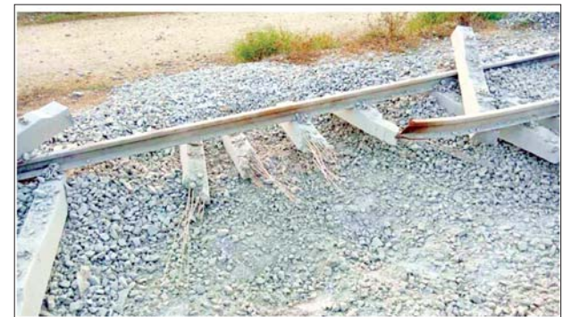
KNLA အဖွဲ့မှ အကြမ်းဖက်မှုကို လိုလားသူများနှင့် PDF အမည်ခံ အကြမ်းဖက်သမားများက မိုင်းထောင်ဖောက်ခွဲမှုကြောင့် ငနုသန်း သံကူကွန်ကရစ်တံတား ပျက်စီးနေပုံပုံ။

သော အများပြည်သူအသုံးပြု အဆိုပါ မိုင်းခွဲဖျက်ဆီးမှုကြောင့် လျက်ရှိသည့် လမ်း၊ တံတားများ အား ဖောက်ခွဲဖျက်ဆီးခြင်း သည် စစ်ရာဇဝတ်မှု (War Crime) ကို ကျူးလွန်ခြင်းဖြစ်သည်။