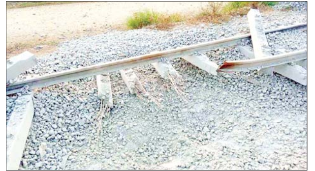
ရန်ကုန်-မန္တလေးရထားလမ်းပိုင်းအတွင်း ဖြူးမြို့နယ် ကညွတ်ကွင်းနှင့် ညောင်ပင်သာဘူတာအကြား ရထားလမ်းအား အကြမ်းဖက်သောင်းကျန်းသူများ၏ မိုင်းထောင်ဖောက်ခွဲဖျက်ဆီးခံထားရခြင်းကြောင့် ကုန်ရထားဖြတ်သန်းစဉ် ရထားလမ်းချော်ကျမှုဖြစ်ပွားစဉ်။