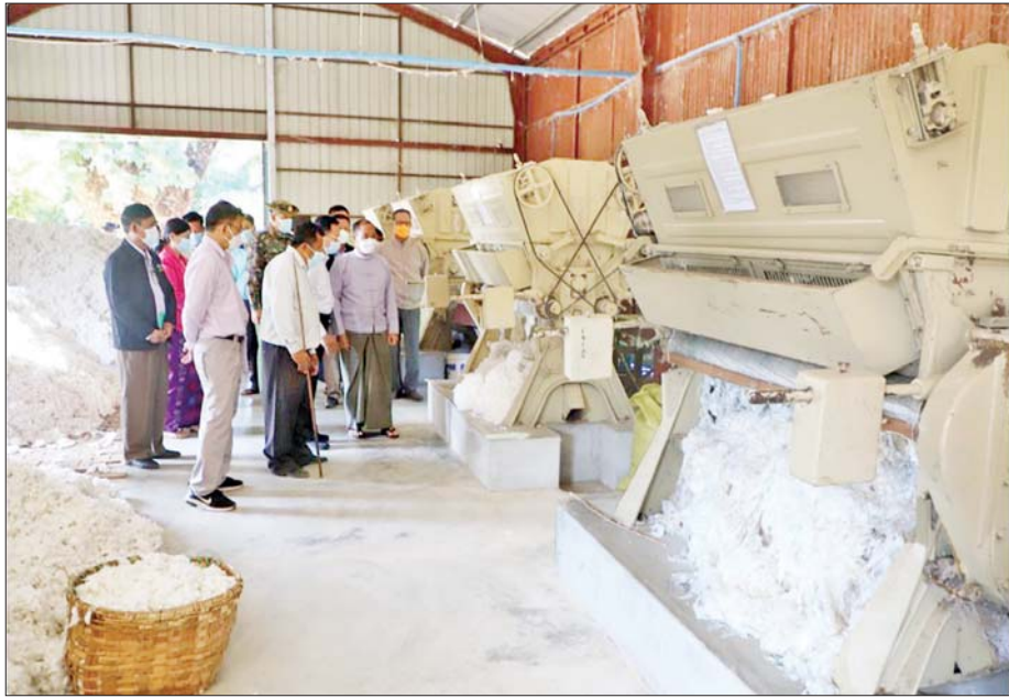
အတွေ့အကြုံရှိသော နည်းပညာရှင် တစ်ဦး လိုအပ်ပါသည်။

ချည်မျှင်ရှည် (Lint) ထွက်ရှိမှုတွင် ကြိတ်လုံးပါ ဝါကြိတ်စက်များမှ ချည်မျှင်ရှည် (Lint) ထွက်ရှိမှုထက် ပို၍နည်းပါးပါသည်။ လွှဲသွားပါ ဝါကြိတ်စက်သည် အထူးတည်ဆောက်ထားသော ရွေ့လျားနေသည့် အစိတ်အပိုင်းများစွာပါဝင်ပြီး အစိတ်အပိုင်းများအား ရရှိရန် အကြိမ်များစွာ အဆင်သင့်မဖြစ်နိုင်သောကြောင့် ပြုပြင်ထိန်းသိမ်းခြင်းအတွက် ကုန်ကျစရိတ် အလွန်များပါသည်။ ထို့အပြင် ဝါစေ့များကို ကြိတ်ခွဲရာတွင် အကောင်းမွန်ဆုံး ထွက်ရှိစေရန်နှင့် ဟောင်းနွမ်းနေသော အစိတ်အပိုင်းများကို အစားထိုးပြီး ဝါကြိတ်စက်ကို တစ်ပြေးညီ စီမံဆောင်ရွက်ပေးရန်အတွက် လွှဲသွားပါ ဝါကြိတ်စက်လည်ပတ်မှုနှင့် ပတ်သက်၍ ကျွမ်းကျင်ပြီး