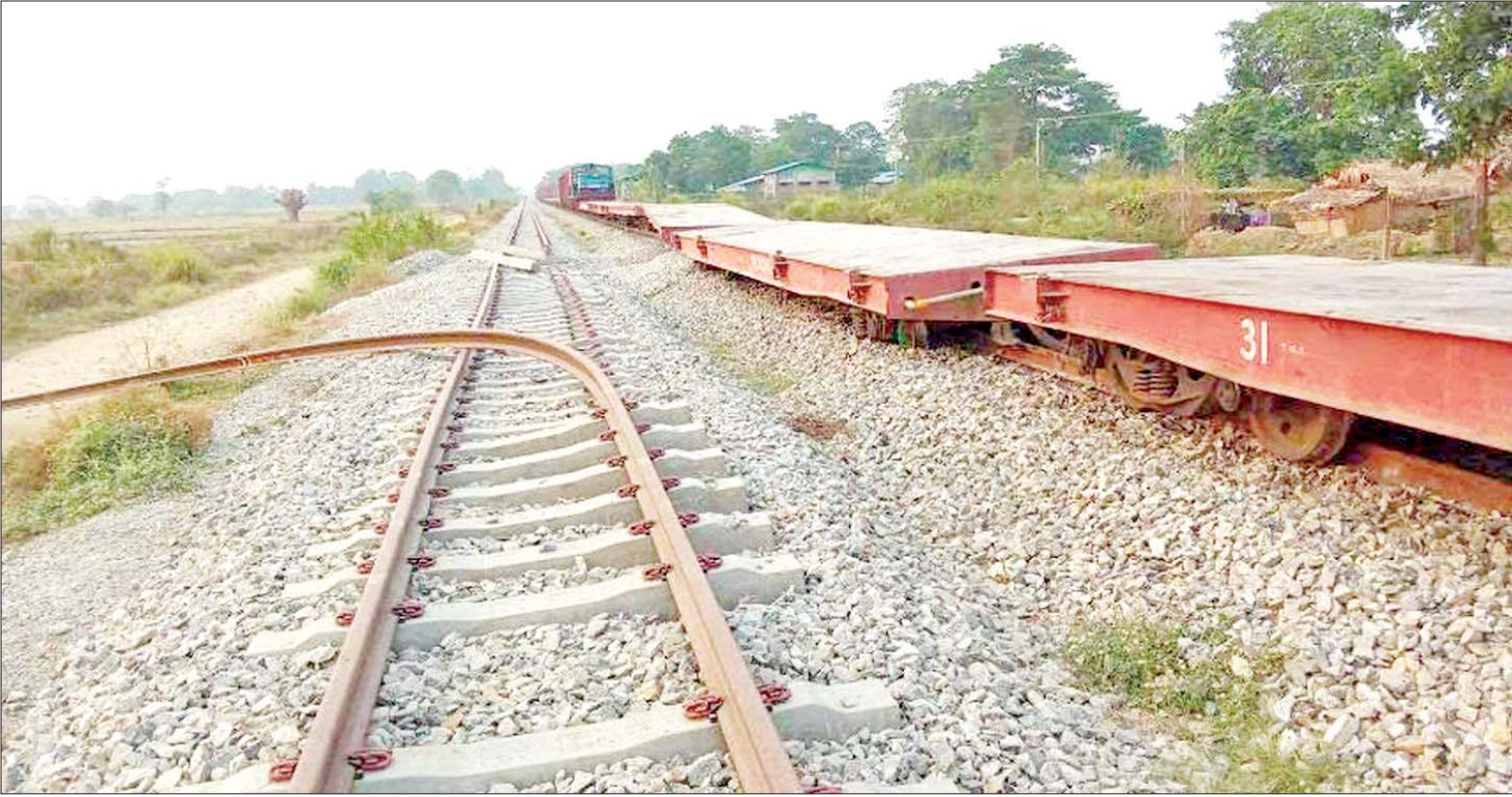
ရန်ကုန်-မန္တလေးရထားလမ်းပိုင်းအတွင်း ဖြူးမြို့နယ် ကညွတ်ကွင်းနှင့် ညောင်ပင်သာဘူတာအကြား ရထားလမ်းအား အကြမ်းဖက်သောင်းကျန်းသူများ၏ မိုင်းထောင် ဖောက်ခွဲဖျက်ဆီးခံထားရခြင်းကြောင့် ကုန်ရထားဖြတ်သန်းစဉ် ရထားလမ်းချော်ကျမှုဖြစ်ပွားစဉ်။

နေပြည်တော် မေ ၁ ရန်ကုန်-မန္တလေး ရထားလမ်းပိုင်း အတွင်း ယနေ့ မလ္လာကုန်း-မြစ်ငယ် ခရီးစဉ်အတွင်း ထွက်ခွာလာသည့် အမှတ်(၉၀၁) အဆန်ကုန်ရထားသည် ပဲခူးတိုင်းဒေသကြီး ဖြူးမြို့နယ် ကညွတ် ကွင်းဘူတာမှ နံနက် ၅ နာရီ ၁၅ မိနစ် တွင် ဖြတ်သန်းထွက်ခွာခဲ့ရာ ကညွတ်ကွင်း ဘူတာနှင့် ညောင်ပင်သာဘူတာအကြား မိုင်တိုင်အမှတ်(၁၂၅/၁-၄) အတွင်း ရထား မဖြတ်သန်းမီအချိန်က သောင်းကျန်းသူ အဖွဲ့က ရထားသံလမ်းအား မိုင်းထောင် ဖောက်ခွဲဖျက်ဆီးထားသဖြင့် ရထား ဖြတ်သန်းစဉ် ရထား လမ်းချော်ကျမှု ဖြစ်ပွားခဲ့ပြီး ရထားစက်ခေါင်းအပါအဝင် စက်ခေါင်းမောင်းနားနေထွဲနှင့် ကုန်တွဲ တွဲလွတ် သုံးတွဲ စုစုပေါင်းစက်ခေါင်းနှင့်တွဲ လေးတွဲတို့ လမ်းချော်ကျမှုဖြစ်ပွားခဲ့သည်။ အဆိုပါဖြစ်စဉ်ကြောင့် ရန်ကုန်မှ ထွက်ခွာလာသည့် ခရီးသွားပြည်သူ ၂၈၈ ဦး လိုက်ပါလာသည့် အမှတ်(၁၁)အဆန် လူစီးအမြန်ရထားသည် ကျောက်တန်း ဘူတာသို့ နံနက် ၇ နာရီ ၉ မိနစ်တွင် စာမျက်နှာ ၁၅ ကော်လံ ၁ သို့ ❁