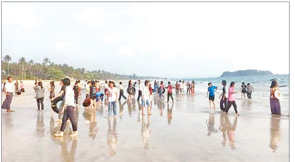
နေ့လယ်စာ သုံးဆောင်ကာ ထွက်ခွာပြီး စုရပ် ရပ်နားစခန်းမှ ထွက်ခွာမည်ဖြစ်ကြောင်း သိရ ရန်ကုန်စုရပ် ရပ်နားစခန်းသို့ နေရပ်အသီးသီးသို့ ပြန်လည် သည်။ တိုင်းဒေသကြီး(ပြန်/ဆက်)

မတန်း လူရည်ချွန်မောင်မယ် ၁၃၇ ဦးသည် ဧပြီ ၂၇ ရက်တွင် ငွေဆောင် လူရည်ချွန်စခန်းသို့ စတင်ရောက်ရှိကာ ငွေဆောင် ဒေသရှိ ဆင်စခန်း၊ ယနေ့ပုစွန် မွေးမြူရေးစခန်း၊ ငွေဆောင် ဈေးတန်းနှင့် ပုသိမ်မြို့ရှိ မြို့တော် ခန်းမ၊ ရွှေမော်ဓောဘုရား၊ ရွှေမြင်း ဟာလဝါလုပ်ငန်း၊ ရွှေမြင်းပျံ ဟာလဝါလုပ်ငန်း၊ ရွှေစာပုသိမ်ထီး လုပ်ငန်းတို့အပြင် ရွှေသောင်ယံ မြို့ရှိ Sea & Lake နှင့် ချောင်းသာ လူရည်ချွန်စခန်း၊ ချောင်းသာ