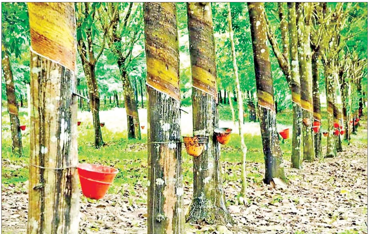
မွန်ပြည်နယ်အတွင်းရှိ ရော်ဘာစိုက်ခင်းတစ်ခုကို တွေ့ရစဉ်။