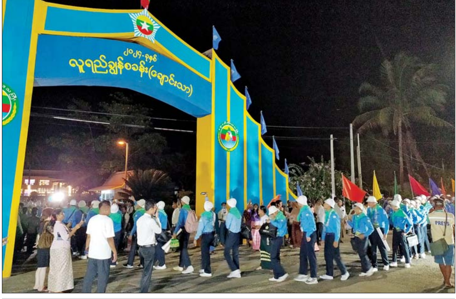
ဒွါဒသမတန်း လူရည်ချွန်မောင်မယ်များ လူရည်ချွန်စခန်း(ချောင်းသာ)သို့ ရောက်ရှိစဉ်။