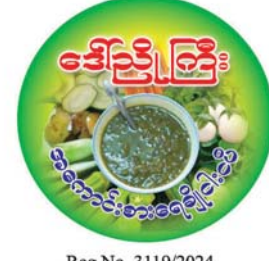
Reg No. 3119/2024