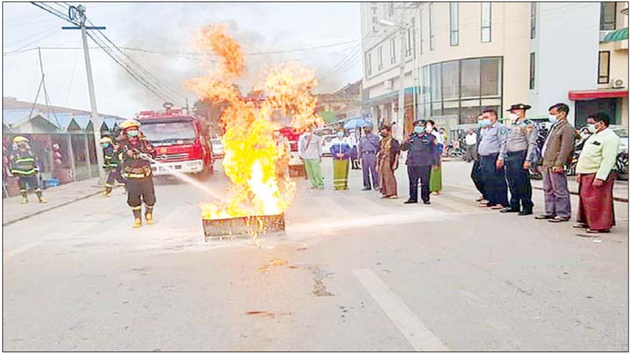
ရှမ်းပြည်နယ်(မြောက်ပိုင်း) ကျောက်မဲခရိုင် သီပေါမြို့နယ်အတွင်းရှိ ဈေးများတွင် မီးဘေးအန္တရာယ်ကင်းဝေးစေရေး မီးသတ်ဦးစီးဌာနက လက်တွေ့မီးငြိမ်းသတ် သရုပ်ပြဇာတ်တိုက်လေ့ကျင့်ခြင်းဆောင်ရွက်စဉ်။

အသိပညာပေး ပြည်ထဲရေးဝန်ကြီးဌာန မီးသတ်ဦးစီးဌာန အနေဖြင့် နိုင်ငံတော်အတွင်း မီးလောင်မီးလန့်မှုများ မဖြစ်ပွားစေရေးအတွက် မီးဘေးလုံခြုံရေးဆိုင်ရာ လုပ်ငန်းများကို နိုင်ငံတစ်ဝန်း အရှိန်အဟုန်မပြတ် အကောင်အထည်ဖော် ဆောင်ရွက်လျက်ရှိသည်။ ၂၀၂၄ ခုနှစ် ဇန်နဝါရီလ ၂၂ ရက်နေ့မှ ၂၉ ရက်နေ့ အထိ နေပြည်တော်အပါအဝင် တိုင်းဒေသကြီးနှင့် ပြည်နယ်များရှိ မြို့နယ် ၁၂၅ မြို့နယ်မှ အိမ်ခြေ ၃၄၀၀၀ တွင် နေထိုင်လျက်ရှိသည့် ပြည်သူ ၁၂၀၀၀၀ ကျော်အား မီးဘေးလုံခြုံရေးဆိုင်ရာ အသိပညာပေးဆောင်ရွက်ခဲ့သည်။ ထိုသို့ လုပ်ဆောင်ရာတွင် မီးသတ်မှုရေးဆိုင်ရာနည်းပညာပေးခြင်း၊ မီးဘေးလုံခြုံရေးဆိုင်ရာ သိမှတ်ဖွယ်ရာများကို တစ်အိမ်တက်ဆင်းစစ်ဆေးခြင်း၊ လက်ကမ်းစာစောင်ဖြန့်ဝေခြင်းနှင့် ဇာတ်တိုက်လေ့ကျင့်ပညာပေးခြင်းများ လုပ်ဆောင်ခဲ့သည်။