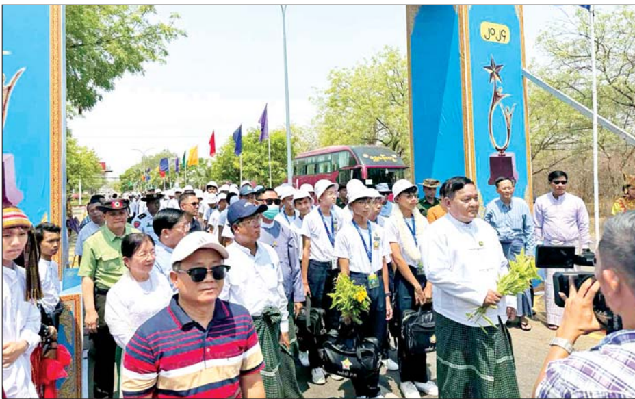
နဝမတန်း လူရည်ချွန်မောင်မယ်များ ပုဂံလူရည်ချွန်စခန်းသို့ ရောက်ရှိစဉ်။