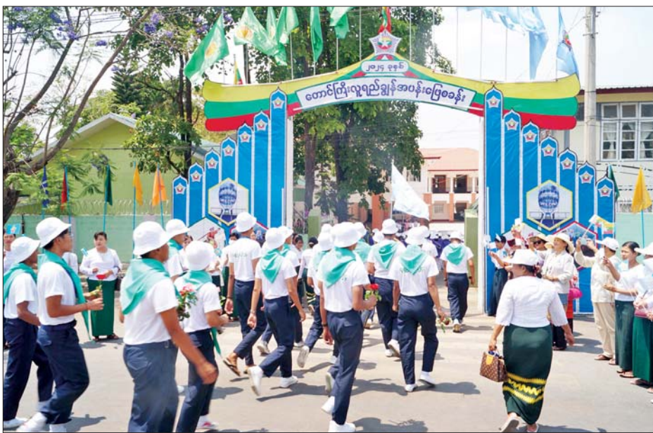
ဒသမတန်း လူရည်ချွန်မောင်မယ်များ တောင်ကြီးလူရည်ချွန်အပန်းဖြေစခန်းသို့ ရောက်ရှိစဉ်။