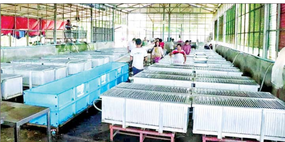
မွန်ပြည်နယ်အတွင်းရှိ ရော်ဘာထုတ်လုပ်သည့်စက်ရုံတစ်ခု၏ လုပ်ငန်းခွင်ကို တွေ့ရစဉ်။

● ရှေးဦးစွာ ပြည်တွင်း ထုတ်ကုန်များ အနက် ရော်ဘာထုတ်ကုန်သည် နိုင်ငံခြားငွေများစွာ ရရှိသည့် ဒေသထွက်ကုန်တစ်ခု ဖြစ်ရာ မွန်ပြည်နယ်သည် ရော်ဘာစိုက်ပျိုးထုတ်လုပ်မှု အများဆုံးဖြစ်ကြောင်း၊ ရော်ဘာများ ပိုမိုထွက်ရှိရေးအတွက် ရော်ဘာမျိုးများကို သုတေသနပြု ဖြန့်ဖြူးပေးနေပြီး မျိုးကောင်းမျိုးသန့် ရော်ဘာဖူးဆက်ပျိုးပင်များ ထုတ်လုပ်ဖြန့်ဖြူးပေးလျက် ရှိကြောင်း၊ ရေမြေဒေသနှင့် ကိုက်ညီသည့် အထွက်နှုန်း ကောင်းမွန်သော ရော်ဘာ မျိုးကောင်းမျိုးသန့်များ ပေါ်ထွက်လာစေရေး သုတေသန