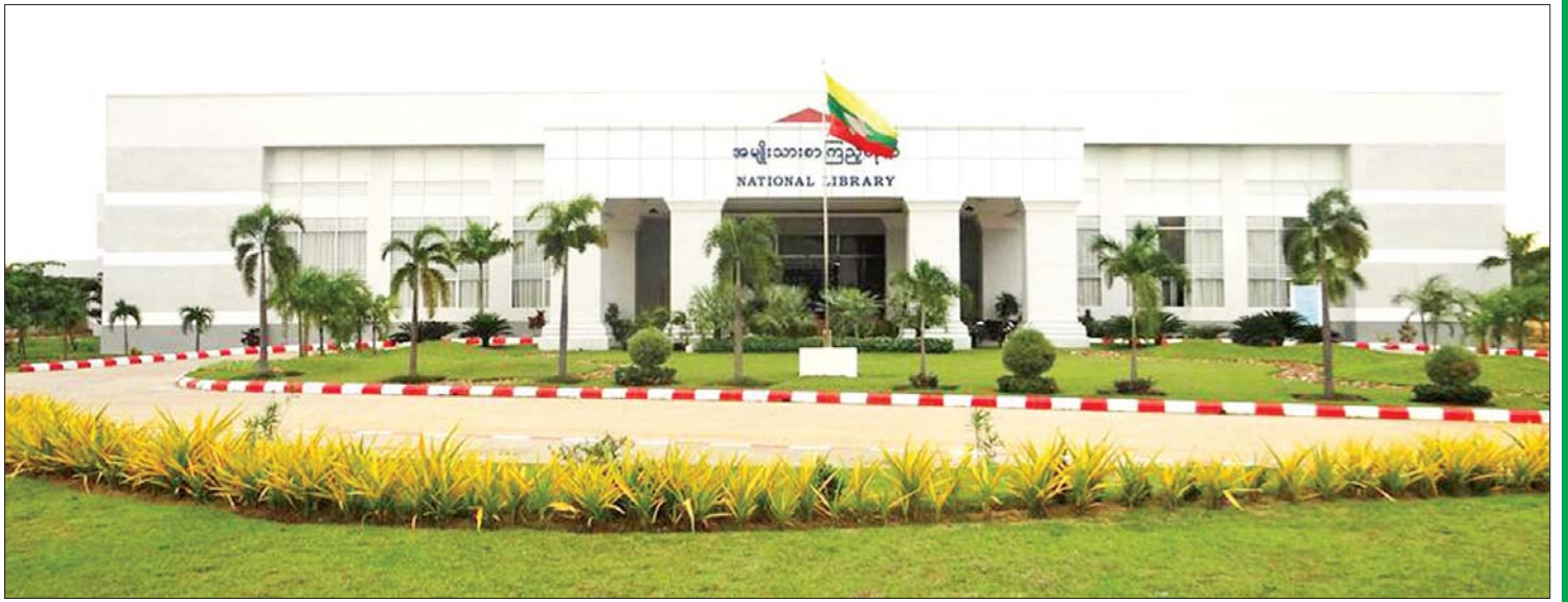
အမျိုးသားစာကြည့်တိုက်(နေပြည်တော်)အား တွေ့ရစဉ်။

စာပေမြင့်လျှင် လူမျိုးတင့်သည် အထက်ပါဆိုရိုးစကား (စကားပုံ) ဆောင်ပုဒ်ကို စွဲမှတ်ထားပြီး မိမိတို့နိုင်ငံ စာပေအဆင့်အတန်း တိုးတက်မြင့်မားလာစေရန် စာပေရေးသားပြုစုသူများကလည်း ကြိုးပမ်းအားထုတ်၊ စာဖတ်ပရိသတ်ပြည်သူတို့ကလည်း လူထုအား၊ စာဖတ်အား၊ စာသိအားဖြင့် ဝေဖန်ထောက်ပြ လမ်းညွှန်ပေးနိုင်အပ်ပေသည်။ ထိုသို့ စာရေးဆရာများကို ပြည်သူက ငါဆရာလုပ်နိုင်အောင် ဝေဖန်ဆန်းစစ်ပြနိုင်ရန် စာဖတ်သူတို့ စာဖတ်နာရပေမည်။