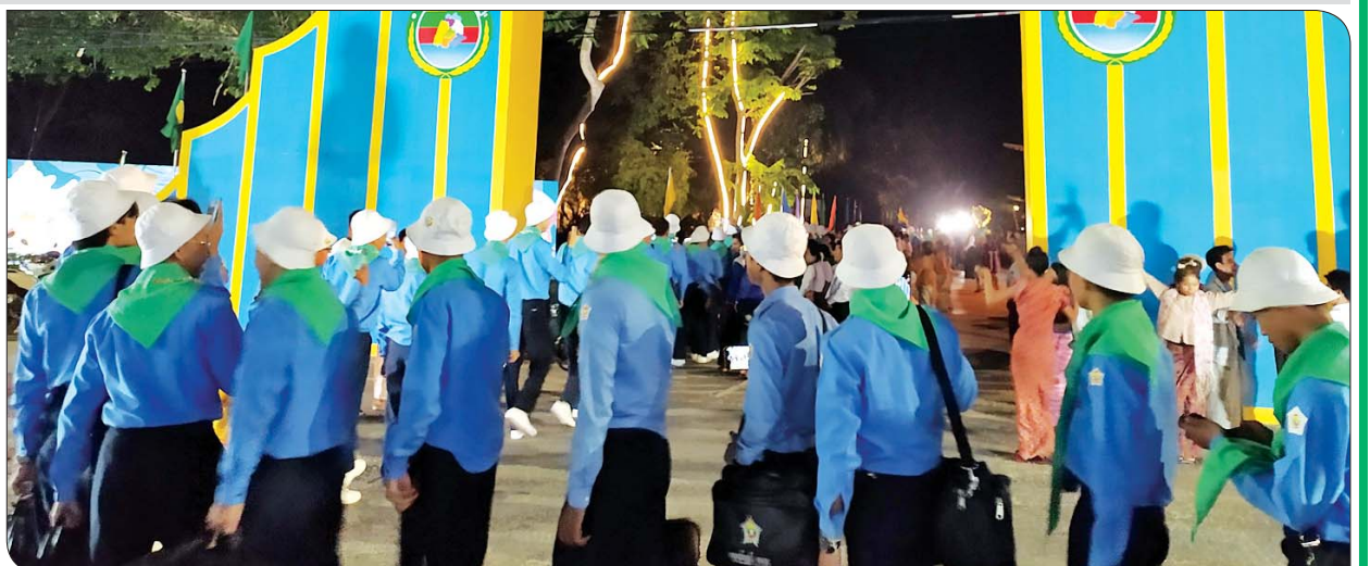
ဒွါဒသမတန်း လူရည်ချွန်မောင်မယ်များ လူရည်ချွန်စခန်း(ချောင်းသာ)သို့ ရောက်ရှိရာ တာဝန်ရှိသူများနှင့် ဒေသခံပြည်သူများက သောင်းသောင်းဖြူဖြူ ကြိုဆိုကြစဉ်။