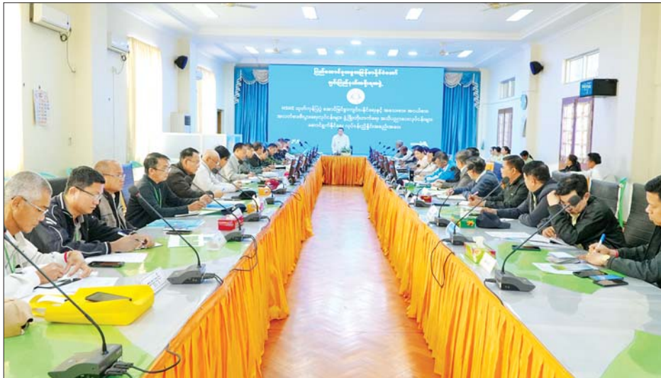
ဦးနေလင်းအောင်နှင့် စစ်ဗျူဟာ(ဟားခါးအခြေချ) ထုတ်ကုန်ပြပွဲ အောင်မြင်စွာကျင်းပနိုင်ရေးနှင့် စစ်ဗျူဟာမှူး ဗိုလ်မှူးကြီးစိုးဝင်းထွန်းတို့က MSME အသေးစား၊ အငယ်စား၊ အလတ်စား စီးပွားရေးလုပ်ငန်းများ ဖွံ့ဖြိုးတိုးတက်ရေး အသိပညာပေးလုပ်ငန်းများ ဆောင်ရွက်နိုင်ရေးအတွက် ဆောင်ရွက်ရမည့် အချက်များကို ဆွေးနွေးတင်ပြကြသည်။

ဆက်လက်၍ ပြည်နယ်လုံခြုံရေးနှင့် နယ်စပ်ရေးရာဝန်ကြီး ဗိုလ်မှူးကြီးသိန်းထွန်းအောင်၊ ချင်းပြည်နယ် အသေးစား၊ အငယ်စားနှင့် အလတ်စား စီးပွားရေးလုပ်ငန်းများဖွံ့ဖြိုးတိုးတက်ရေး အေဂျင်စီအဖွဲ့ဥက္ကဋ္ဌ ပြည်နယ်စီးပွားရေးရာဝန်ကြီး ဦးဟန်ကျင့်ဇော်၊ ပြည်နယ်လမ်းပန်းဆက်သွယ်ရေးဝန်ကြီး