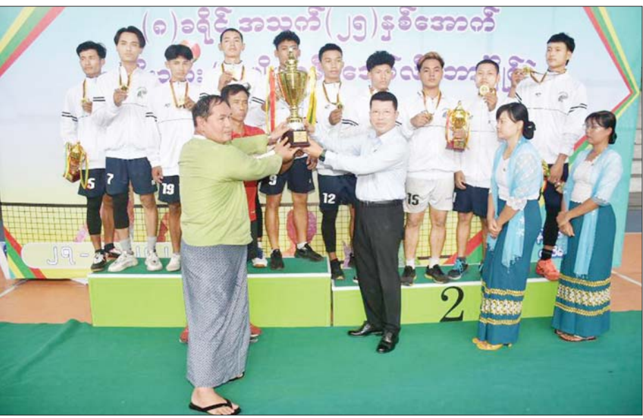
ပထမဆုရရှိသည့် မြောင်းမြခရိုင်အသင်းအား ပထမ ဆုဖလားကို တိုင်းဒေသကြီးဝန်ကြီးချုပ်၏ ဇနီးက လည်းကောင်း ပေးအပ်ခဲ့ကြပြီး အမျိုးသား ဘော်လီဘောပြိုင်ပွဲတွင် ပထမဆုဖလားကို တိုင်းဒေသကြီး ဝန်ကြီးချုပ်က ဆက်လက် ပေးအပ်ချီးမြှင့်ခဲ့ကြောင်း သိရသည်။ တိုင်းဒေသကြီး(ပြန်/ဆက်)

ယှဉ်ပြိုင်ကစားနေမှုကိုလည်းကောင်း ကြည့်ရှု အားပေးခဲ့ရာ အမျိုးသားဘော်လီဘောပြိုင်ပွဲ ဗိုလ်လု ပွဲစဉ်တွင် ပုသိမ်ခရိုင်အသင်းမှ မြောင်းမြခရိုင်အသင်း အား သုံးပွဲ တစ်ပွဲဖြင့်လည်းကောင်း၊ အမျိုးသမီး ဘော်လီဘောပြိုင်ပွဲ ဗိုလ်လုပွဲစဉ်တွင် မြောင်းမြ ခရိုင်အသင်းမှ ကျိုပျော်ခရိုင်အသင်းအား သုံးပွဲ တစ်ပွဲဖြင့်လည်းကောင်း အနိုင်ရရှိခဲ့ကြသည်။ ဆက်လက်၍ ဆုချီးမြှင့်ပွဲအခမ်းအနားပြုလုပ် ရာ အမျိုးသမီးဘော်လီဘောပြိုင်ပွဲတွင် ပထမဆုရရှိ သည့် မြောင်းမြခရိုင်အသင်းအား တစ်ဦးချင်း ဆုတံဆိပ်များနှင့် ငွေသားဆုများကို တိုင်းဒေသကြီး ဥပဒေချုပ်ကလည်းကောင်း၊ အမျိုးသား ဘော်လီဘောပြိုင်ပွဲတွင် ပထမဆုရရှိသည့် ပုသိမ် ခရိုင်အသင်းအား တစ်ဦးချင်းဆုတံဆိပ်များနှင့် ငွေသားဆုများကို တိုင်းဒေသကြီး တရားသူကြီးချုပ် ကလည်းကောင်း၊ အမျိုးသမီး ဘော်လီဘောပြိုင်ပွဲတွင်