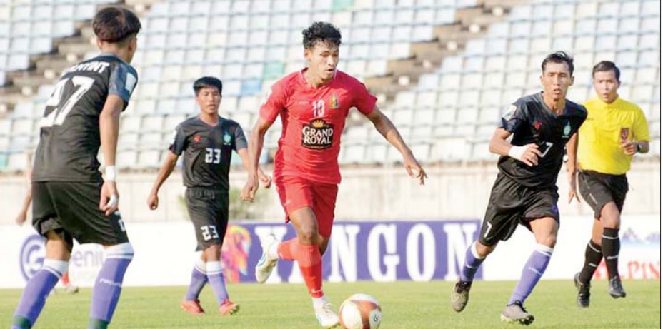
ဟံသာဝတီနှင့် ငွေကြယ်ပွင့်အသင်းတို့ ယှဉ်ပြိုင်ကစားကြစဉ်။

ရန်ကုန် ဧပြီ ၂၇ ၂၀၂၄ MNL Cup ပြိုင်ပွဲ အုပ်စု (ဂ)ပွဲစဉ်များကို ဧပြီ ၂၇ ရက်က ဆက်လက်ကျင်းပရာ ဟံသာဝတီအသင်း နိုင်ပွဲပြန်ရပြီး ဒဂုံစတားအသင်း နိုင်ပွဲရပ်တန့်ခဲ့သည်။ သုဝဏ္ဏကွင်း၌ ကျင်းပသည့် ပွဲတွင် ဟံသာဝတီအသင်းက ငွေကြယ်ပွင့်အသင်းကို ခြောက်ဂိုး ပြတ်အနိုင်ရခဲ့သည်။ ဟံသာဝတီအသင်းသည် နှစ်ပွဲဆက်နိုင်ပွဲ ပျောက်ဆုံးမှုကို အဆုံးသတ်နိုင်ခဲ့ပြီး နိုင်ပွဲပြန်ရှာတွေ့ခဲ့သလို စာမျက်နှာ ၁၉ ကော်လံ ၁ သို့ ❖