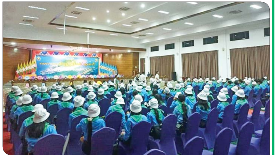
ကောဒသမတန်း လူရည်ချွန်မောင်မယ်များ ငွေဆောင်လူရည်ချွန်စခန်းသို့ ရောက်ရှိစဉ်။