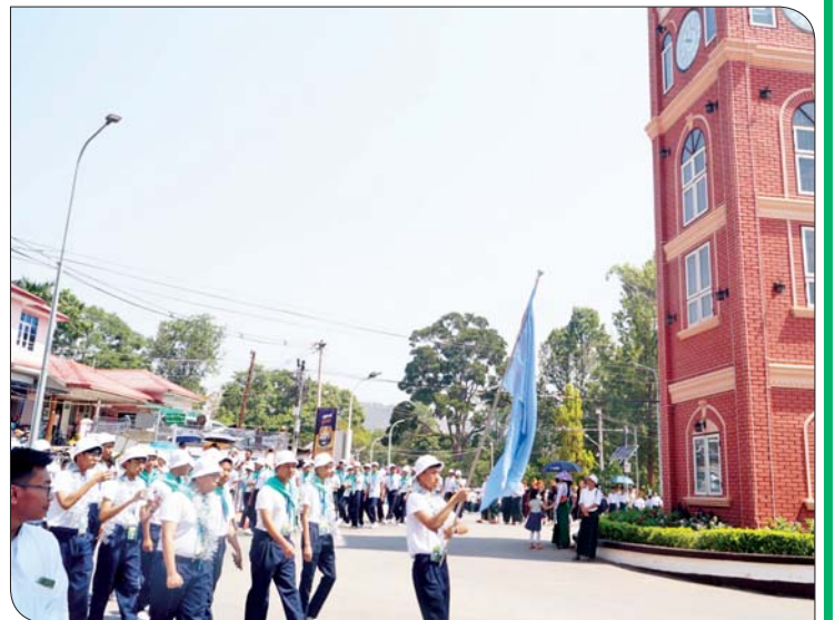
ဒသမတန်း လူရည်ချွန်မောင်မယ်များ တောင်ကြီးလူရည်ချွန်စခန်းသို့ ရောက်ရှိရာ တာဝန်ရှိသူများနှင့် ဒေသခံပြည်သူများက သောင်းသောင်းဖြူဖြူ ကြိုဆိုကြစဉ်။