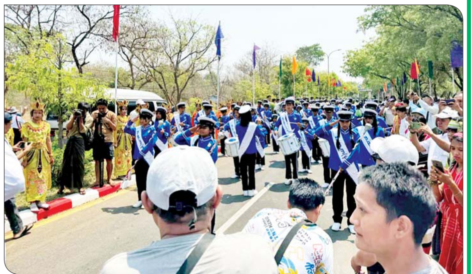
နဝမတန်း လူရည်ချွန်မောင်မယ်များ ပုဂံလူရည်ချွန်စခန်းသို့ ရောက်ရှိရာ တာဝန်ရှိသူများနှင့် ဒေသခံပြည်သူများက သောင်းသောင်းဖြူဖြူ ကြိုဆိုကြစဉ်။