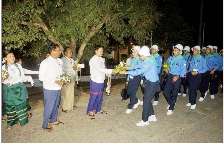
ဧကဒသမတန်း လူရည်ချွန်မောင်မယ်များ ငွေဆောင်လူရည်ချွန်စခန်းသို့ ရောက်ရှိစဉ်။