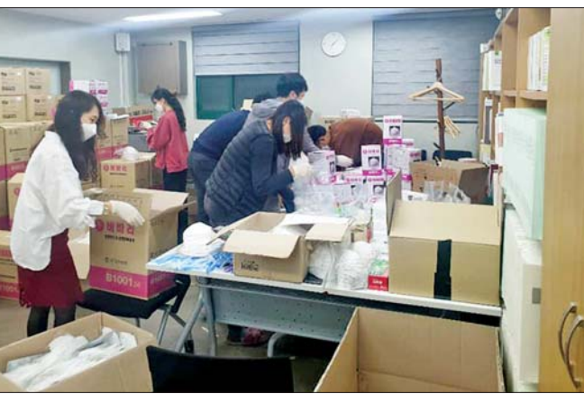
လုပ်ငန်းအတွက် ဧပြီ ၃၀ ရက်မှ မေ ၁၀ ရက်အထိ လည်းကောင်း၊ ဝန်ဆောင်မှုလုပ်ငန်းအုပ်စု(၁)/(၂)အတွက် မေ ၁၀ ရက်မှ ၂၉ ရက်အထိ သတ်မှတ်ထားပြီး ကုန်ထုတ်လုပ်ငန်းအတွက် စာမေးပွဲကျင်းပမည့်နေ့ရက်အား ဆက်လက်ကြေညာမည်ဟု အစိုးရပြည်ပအလုပ်အကိုင်အေဂျင်စီက ဧပြီ ၁၈ ရက်တွင် အသိပေးကြေညာထားသည်။ ကိုရီးယားဘာသာ အရည်အချင်း

(၁၆)ကြိမ်မြောက် EPS-TOPIK စာမေးပွဲကျင်းပမည့် နေ့ရက်အနေဖြင့် စိုက်ပျိုး/မွေးမြူရေးနှင့် ဆောက်လုပ်ရေး