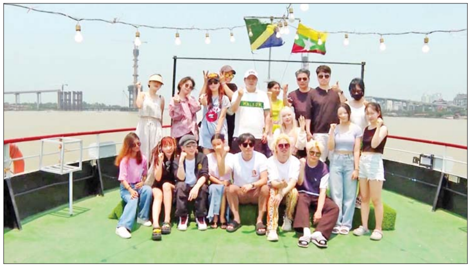
ကိုရီးယား K- Pop အနုပညာရှင်များ ရန်ကုန်မြစ်တစ်လျှောက်ရှုခင်းများကို အပျော်စီးသဘောဖြင့် လှည့်လည်ကြည့်ရှုလေ့လာကြစဉ်။