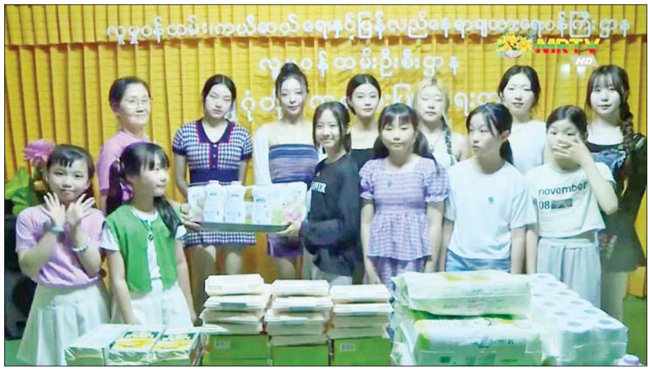
ကိုရီးယား K- Pop အနုပညာရှင်များ ဗဟန်းမြို့နယ် လူမှုဝန်ထမ်းဦးစီးဌာနရှိ ကလေးငယ်များအတွက် နို့မှုန့်နှင့် အသုံးအဆောင်ပစ္စည်းများ ပေးအပ်ကြစဉ်။