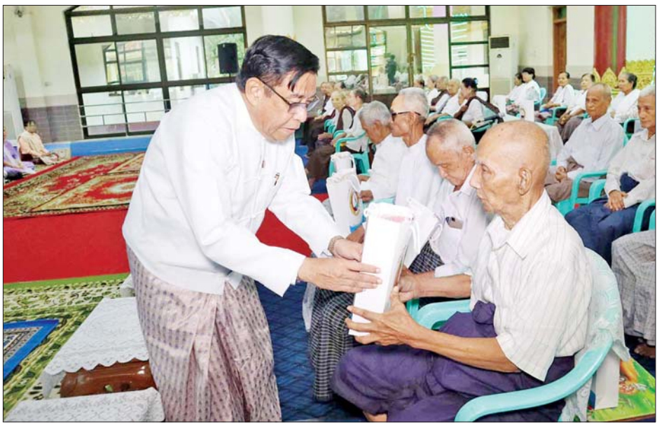
လှူဒါန်းခဲ့ကြပြီး ပူဇော်ပွဲအခမ်းအနားသို့မတက်ရောက် လက်ဆောင်ပစ္စည်းများ ပေးအပ်မည်ဖြစ်ကြောင်း နိုင်သော အဘိုးအဘွားများအား တာဝန်ရှိသူများက သိရသည်။ အိမ်တိုင်ရာရောက် အလှူငွေများနှင့် ကန်တော့ တိုင်းဒေသကြီး(ပြန်/ဆက်)

တိုင်းဒေသကြီးအစိုးရအဖွဲ့က ကန်တော့ခံဘိုးဘွား ၃၅ ဦးနှင့် ထားဝယ်မြို့နယ်အတွင်းရှိ အသက် ၉၀ နှင့်အထက် အဘိုးအဘွား ၄၅၆ ဦး စုစုပေါင်း ၄၉၁ ဦးအတွက် တစ်ဦးလျှင် ငွေကျပ် ၄၀၀၀ နှုန်းဖြင့် စုစုပေါင်း ငွေကျပ် ၁၉၆ သိန်း ၄ သောင်းအားလည်းကောင်း၊ ကန်တော့ခံအဘိုးအဘွား ၃၅ဦးအတွက် တိုင်းဒေသကြီး လူမှုဝန်ထမ်းဦးစီးဌာနက လှူဒါန်းငွေကျပ် သုံးသိန်းအား လည်းကောင်း