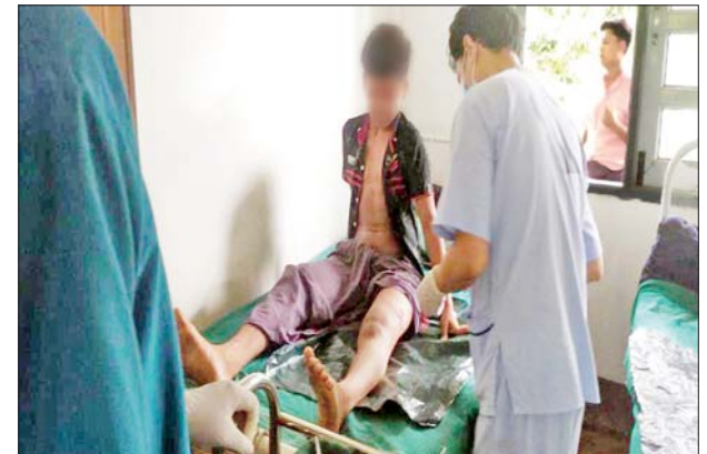
AA အကြမ်းဖက်သောင်းကျန်းသူများ ပစ်ခတ်လိုက်သည့် လက်နက်ကြီးကျည်များ ကျရောက်ပေါက်ကွဲမှုကြောင့် ထိခိုက်ဒဏ်ရာရရှိခဲ့သည့် ဒေသခံပြည်သူများအား လိုအပ်သည့်ဆေးဝါးကုသမှုများ ဆောင်ရွက်နေစဉ်။