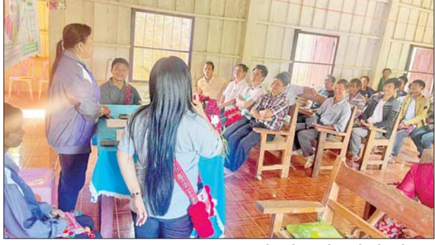
ရရှိလာမည့် အကျိုးကျေးဇူးများ၊ အတိုးနှုန်းကာလ သတ်မှတ်ချက် များနှင့် စပ်လျဉ်း၍ မိတ်ဆက် ရှင်းလင်းပြောကြားသည်။ ရွေးချယ်ဖွဲ့စည်း ဆက်လက်၍ စီမံကိန်း တာဝန်ခံနှင့် ဝန်ထမ်းများက ကျေးရွာလုပ်ငန်းအဖွဲ့ ဖွဲ့စည်း ရာတွင် လိုက်နာရမည့်စည်းကမ်း သတ်မှတ်ချက်များ၊ ကျေးရွာမှ ဆောင်ရွက်ရမည့် လုပ်ငန်းစဉ်များ နှင့်ပတ်သက်၍ ကဏ္ဍအလိုက် ရှင်းလင်းဆွေးနွေးကာ တက် ရောက်လာကြသော ဟေ့ဂုန်း ကျေးရွာမှ ရပ်မိရပ်ဖများ၊ ကျေးရွာ သူ ကျေးရွာသားများက ကျေးရွာ ဖွံ့ဖြိုးရေးလုပ်ငန်းများကို အမှန် တကယ် ဆောင်ရွက်နိုင်သည့် မြစ်ရောင် ကျေးရွာစီမံကိန်း လုပ်ငန်း အဖွဲ့ဝင် ခုနစ်ဦးကို အများ

သဘောဆန္ဒနှင့်အညီ မဲစနစ်ဖြင့် ရွေးချယ်ဖွဲ့စည်းပေးခဲ့သည်။ တာချီလိတ်မြို့နယ် ကျေးလက် ဒေသ ဖွံ့ဖြိုးတိုးတက်ရေးဦးစီး ဌာနအနေဖြင့် ကျေးလက်နေပြည် သူများ အလုပ်အကိုင်အခွင့် အလမ်းနှင့် မိသားစုဝင်ငွေတိုးပွား လာစေရန်၊ တစ်နိုင်တစ်ပိုင် စိုက် ပျိုးရေး၊ မွေးမြူရေးလုပ်ငန်းများ ပိုမိုတိုးချဲ့ လုပ်ကိုင်လာနိုင်စေရန်၊ တိုးပွားလာသော ရန်ပုံငွေများဖြင့် ကျေးရွာဖွံ့ဖြိုးရေးလုပ်ငန်းများကို အကောင်အထည် ဖော်ဆောင် ရွက်နိုင်ရန်စသည့် ရည်ရွယ် ချက်များဖြင့် ဟေ့ဂုန်းကျေးရွာ တွင် မြစ်ရောင်ကျေးရွာစီမံကိန်း Type- 3 အရင်းမပျောက် လည်ပတ်ရန်ပုံငွေ ကျပ်သိန်း ၁၀၀ ဖြင့် စီမံကိန်းနှင့် အကျိုးဝင် သည့် လုပ်ငန်းများတွင် အတိုးနှုန်း သက်သာစွာဖြင့် ထုတ်ချေးပေး သွားမည်ဖြစ်ကြောင်း သိရသည်။ ၂၂၂