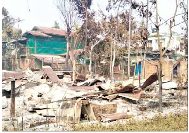
ရခိုင်ပြည်နယ် ဘူးသီးတောင်မြို့ အမှတ်(၅)ရပ်ကွက်ရှိ လူနေအိမ်များ မီးလောင်ပျက်စီးဆုံးရှုံးခဲ့သည့် မှတ်တမ်းဓာတ်ပုံများ။