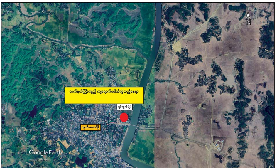
AA အကြမ်းဖက်သောင်းကျန်းသူများ၏ လက်နက်ကြီးဖြင့် ပစ်ခတ်မှုကြောင့် ဘူးသီးတောင်မြို့နယ် အမှတ်(၂)ရပ်ကွက်အတွင်း လက်နက်ကြီးကျည်ကျရောက်ပေါက်ကွဲခဲ့ပြီး အပြစ်မဲ့ပြည်သူများ သေဆုံး၊ ဒဏ်ရာရရှိ ဖြစ်စဉ်နေရာပြပုံ။

တို့အရ စစ်ရာဇဝတ်မှု(War Crime)ကို ကျူးလွန်ခြင်းဖြစ်ပြီး အဆိုပါ အကြမ်းဖက်သမားများအား အမြန်ဆုံးဖော်ထုတ်ဖမ်းဆီးနိုင်ရေး လုံခြုံရေးတပ်ဖွဲ့ဝင်များက လုံခြုံရေးလုပ်ငန်းများ တိုးမြှင့်ဆောင်ရွက်လျက်ရှိကြောင်းနှင့် ဒေသကောင်းစားရေးဟုသုံးနှုန်း၍ အမှန်တကယ်တွင် အပြစ်မဲ့ပြည်သူများ သေဆုံး၊ ထိခိုက်ခဲ့ရသည်အထိ ဆင်ခြင်တုံတရားကင်းမဲ့စွာ လုပ်ဆောင်ခြင်းသည် အရပ်ဆိုး အကျည်းတန်သော လုပ်ရပ်ဖြစ်ပြီး အဆိုပါ လုပ်ရပ်အပေါ် ဝိုင်းဝန်းဆန့်ကျင်၍ လုံခြုံရေးတပ်ဖွဲ့ဝင်များနှင့် ပူးပေါင်းကာ မြို့ရွာများ အမြန်ဆုံး တည်ငြိမ်အေးချမ်းရေးအတွက် ပြည်သူတစ်ရပ်လုံး ပူးပေါင်းပါဝင်၍ အကြမ်းဖက်သမား များအား