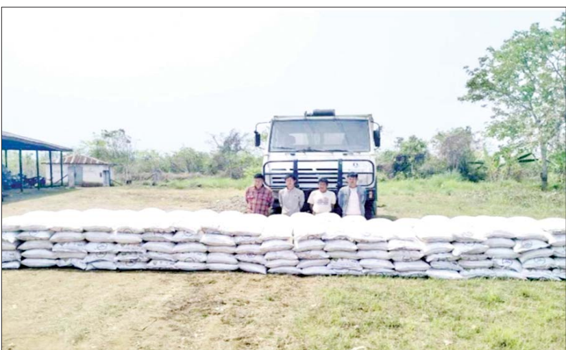
ကချင်ပြည်နယ်၌ ဖမ်းဆီးရမိမှု။

တရားမဝင်ကုန်သွယ်မှု တိုက်ဖျက်ရေး ဦးဆောင်ကော်မတီ၏ ကြီးကြပ်ကွပ်ကဲမှုဖြင့် တရားမဝင် ကုန်သွယ်မှုများကို ဥပဒေနှင့်အညီ ထိရောက်စွာ တားဆီးအရေးယူနိုင်ရေး ဆောင်ရွက်လျက်ရှိရာ ဧပြီ ၁၇ ရက်တွင် ပဲခူးတိုင်းဒေသကြီး တရားမဝင် ကုန်သွယ်မှု တိုက်ဖျက်ရေးအထူးအဖွဲ့၏ စီမံခန့်ခွဲမှုဖြင့် တာဝန်ကျပေးပေါင်းအဖွဲ့များက စစ်ဆေးမှုများ ဆောင်ရွက်ခဲ့ရာ ပဲခူးခရိုင်နှင့် ပြည်ခရိုင်တို့ အတွင်း၌ တရားမဝင် ကျွန်းသစ်(၁ ဒသမ ၅၆၉)တန်၊ သစ်မာ(၁ ဒသမ ၀၅၁)တန်နှင့် အခြားသစ် (၃ ဒသမ ၈၄၁)တန် (စုစုပေါင်း ခန့်မှန်းတန်ဖိုး ငွေကျပ် ၃၅၆၃၅၃၄) ကို သိမ်းဆည်းရမိခဲ့ပြီး သစ်တောဥပဒေနှင့် အညီ အရေးယူဆောင်ရွက်လျက်ရှိသည်။