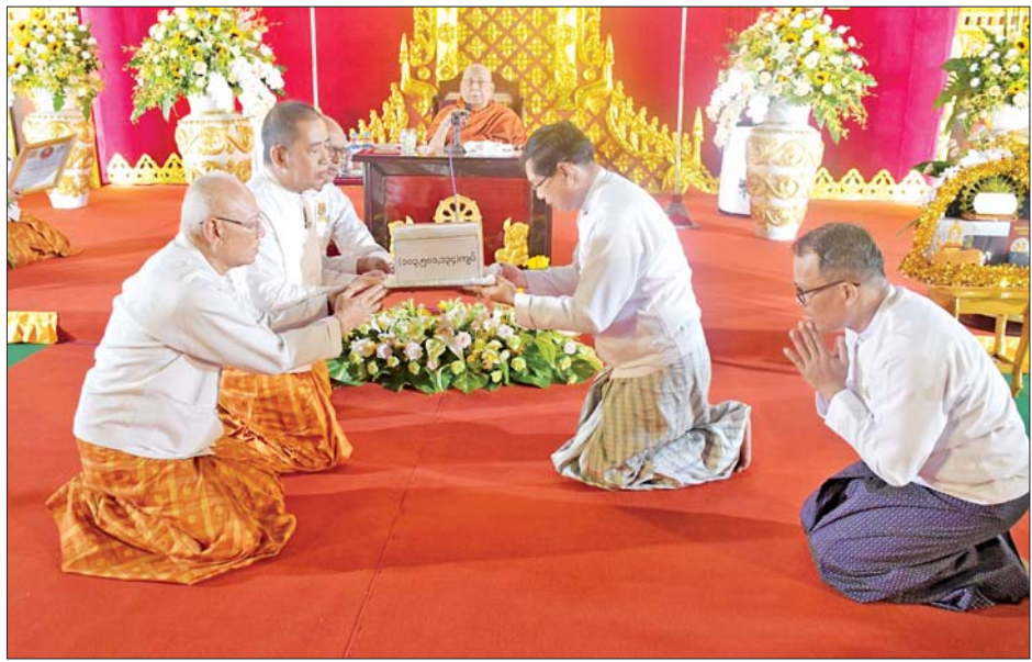
၁၀၃၅၀၁၁၃၄ ကျပ်ရရှိခဲ့ကြောင်းနှင့် တရားပွဲသို့ တရားနာပရိသတ် ရှစ်ထောင်ကျော် တရားတော်နာလာရောက်ခဲ့ကြောင်းနှင့် တရားနာပရိသတ်များအတွက် ရန်ကုန်တိုင်းဒေသကြီးအစိုးရအဖွဲ့၏ အစီအစဉ်ဖြင့် မိမိတို့နေထိုင်သည့်အနီးဆုံးနေရာအထိ ယာဉ်များဖြင့် အသွား/အပြန်စီစဉ်ပေးထားကြောင်း သိရသည်။ တိုင်းဒေသကြီး(ပြန်/ဆက်)

ဘဒ္ဒန္တဉာဏိဿရ သီတဂူဆရာတော်ကြီးကြွရောက်လာချိန်တွင် သာသနာ့အလံများခြံရံ၍ ထီးဖြူမိုးကာဓမ္မပလ္လင်ထက်သို့ ပင့်ဆောင်တော်မူကြပြီး ဆရာတော်ကြီး၏တရားတော်များကို ကြည်ညိုစွာ နာယူတော်မူကြသည်။ ထို့နောက် ဆရာတော်ကြီးက မေတ္တာဓာတ်ဖြင့် ရန်သူမိတ်ဆွေမခွဲခြားဘဲ မည်သူကိုမဆို အမြဲတမ်း အေးချမ်းမှုပေးနိုင်သောရေကဲ့သို့ ကျင့်ကြံနေထိုင်ရန်၊ မည်သူဘာလုပ်လုပ် လုပ်သမျှကိုသည်းခံခြင်းများစွာဖြင့် ငြိမ်သက်ပေးနေသောမြေကြီးကဲ့သို့ ခန္တီတရားလက်ကိုင်ထား၍ ကျင့်ကြံနေထိုင်နိုင်ရန်၊ ဂေါတမမြတ်စွာဘုရားရှင်၏ အောင်ခြင်းရုပ်ပါးအား ထုတ်နုတ်၍ ရန်ကုန်တိုင်းဒေသကြီးနှင့်ပြည်ထောင်စုသမ္မတမြန်မာနိုင်ငံတော်ကြီး အေးချမ်းသာယာမှုရှိစေရေး ဟောကြားတော်မူသည်။ ထို့နောက် တရားပွဲတွင် လှူဒါန်းမှုအစုစုအတွက် ရေစက်သွန်းချအမျှပေးဝေကြပြီး သီတဂူအဓိဋ္ဌာန်ဖြင့် ဆုတောင်းမေတ္တာပို့သခဲ့ကြောင်း သိရသည်။ အဆိုပါတရားပွဲတွင် နဝကမ္မအလှူငွေ