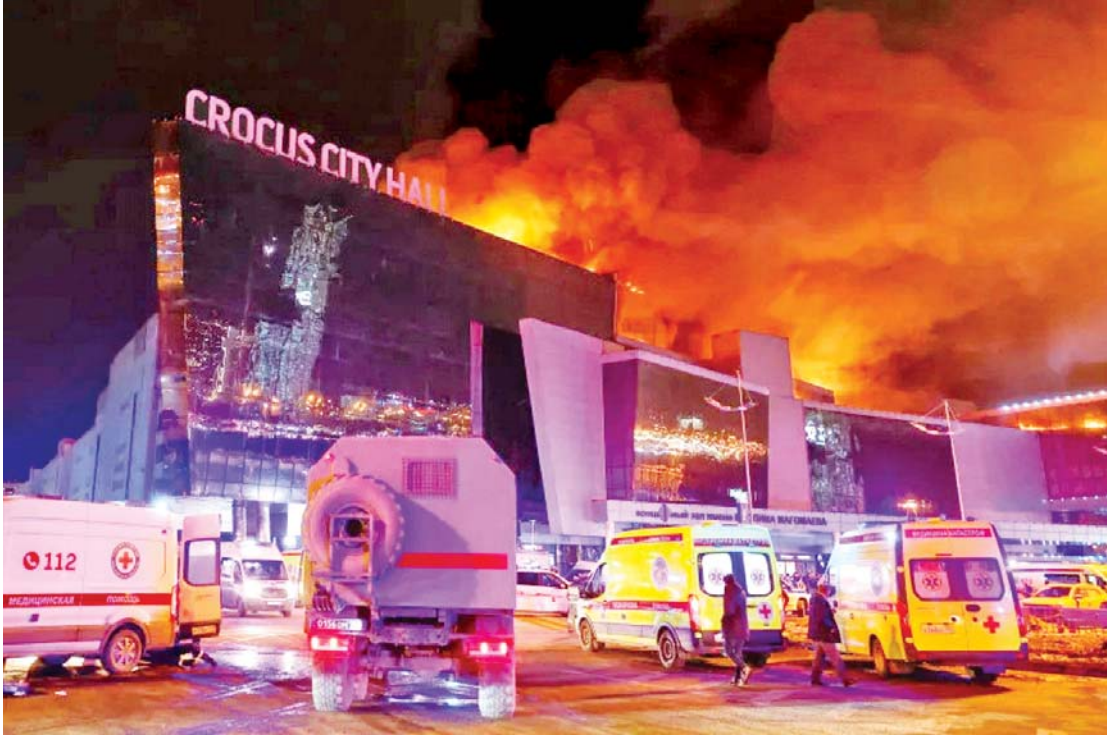
မတ်လ ၂၂ ရက်နေ့က ရုရှားနိုင်ငံ မော်စကိုမြို့တော်ဆင်ခြေဖုံးရှိ Crocus City Hall ခန်းမ၌ ပြုလုပ်သည့်ကပွဲကို အကြမ်းဖက်သမားများ၏ တိုက်ခိုက်မှုကြောင့် ပေါက်ကွဲမှုများ ဖြစ်ပေါ်စဉ်။

အကြမ်းဖက်သမားများနှင့် ဆက်နွယ်ပတ်သက်သူများကို ရုရှားထောက်လှမ်းရေး (FSB) က ဖော်ထုတ်ဖမ်းဆီးခဲ့ရာ ဖမ်းဆီးရမိသူ အကြမ်းဖက်သမားလေးယောက်သည် တာဂျစ်ကစ္စတန်နိုင်ငံသားလူငယ်များဖြစ်ကြပြီး အာဖဂန်နစ္စတန်အခြေစိုက် ISIS-K အကြမ်းဖက်အဖွဲ့က ၎င်းတို့လက်ချက်ဖြစ်ကြောင်း ထုတ်ဖော်ကြေညာခဲ့သည်။ ဖမ်းဆီးရမိသူများထံမှ ရရှိသတင်းအရ အဆိုပါတရားခံများသည် IS ကဲ့သို့ ဘာသာရေးအစွန်းရောက်သမားများ မဟုတ်ဘဲ ဆင်းရဲ၍ ငွေပေးပြီးအခိုင်းခံရသူများ ဖြစ်ကြောင်း ရုရှားကဆိုသည်။