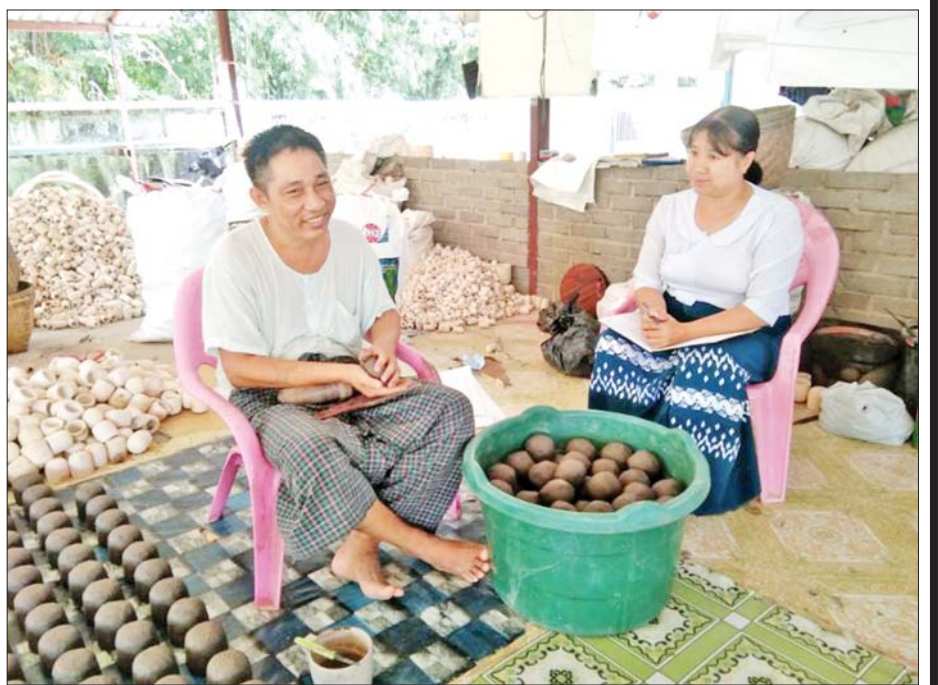
အချိန်မှ ဒုတိယတစ်ပြန်ရိုက်တယ်။ အချောအနေနဲ့ တတိယတစ်ပြန်ထပ်ရိုက်ပြီး အပွင့်ဖော်တယ်။ တံဆိပ်တပ်တယ်။ ပြီးတော့နေပူလှန်းတယ်။ နေပူ

ဖြေ။ ။ လုံအိုးကို ရွှေပန်းထိမ်တွေ၊ ရွှေကျိုတဲ့ နေရာမှာ အသုံးပြုတယ်။ သံ၊ သတ္တုတွေ သန့်စင်ဖို့ ကျိုတဲ့နေရာမှာ မီးခံအိုးအဖြစ်နဲ့လည်း အသုံးပြုပါတယ်။