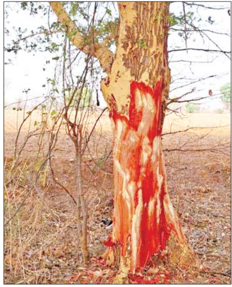
အခေါက်ခွာထားသော ထနောင်းပင်များကို တွေ့ရစဉ်။

အထက်ပါ သဘာဝပတ်ဝန်းကျင်အရေးဆောင်ရွက်သူက ဆိုသည်။ ရာသီဥတုနှင့် သဘာဝ ပတ်ဝန်းကျင်အတွက် များစွာအကျိုးဖြစ်ထွန်းသည့်အပင်လည်းဖြစ် ထနောင်းရိပ်များကြောင့် ခရီးသွားပြည်သူများ အပါအဝင် ဒေသခံများအတွက် နွေရာသီကာလတွင် အရိပ်ကောင်းစွာရသဖြင့် ရာသီဥတုနှင့် သဘာဝပတ်ဝန်းကျင်အတွက် များစွာအကျိုးဖြစ်ထွန်းသည့် အပင်လည်းဖြစ်ကြောင်း သိရသည်။ “ထနောင်းပင်တွေမရှိရင်နေပူမှာ။ အဓိက ထနောင်းပင်တွေမရှိတော့ရင် နားစရာနေရာမရှိတော့ဘူး။ အပင်နည်းရင် ရာသီဥတုကပိုဆိုးလာမယ်။ ဘာမှပိုက်ဆံလည်း ထွေထွေထူးထူး ရတာမဟုတ်တော့ ခွာမရောင်းတာအကောင်းဆုံးပေါ့။ ဒါရောင်းလိုချမ်းသာသွားရင်တော့ တစ်မျိုးပေါ့ဗျာ” ဟု ၎င်းကသူ၏အမြင်ကို ဖွင့်ဟသည်။ Thit Taw