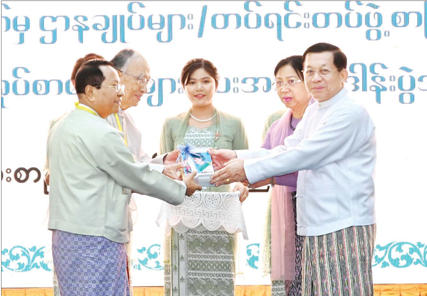
နိုင်ငံတော်စီမံအုပ်ချုပ်ရေးကောင်စီဥက္ကဋ္ဌ နိုင်ငံတော်ဝန်ကြီးချုပ် ဗိုလ်ချုပ်မှူးကြီး မင်းအောင်လှိုင်နှင့် ဇနီးဒေါ်ကြူကြူလှ ဧပြီ ၃ ရက်က မြန်မာနိုင်ငံ စာကြည့်တိုက်များဖောင်ဒေးရှင်းသို့ စာအုပ်စာစောင်များ ပေးအပ်လှူဒါန်းစဉ်။

သို့ရာတွင် ၂၀၁၃ ခုနှစ် ဖေဖော်ဝါရီလတွင် ဒုတိယအကြိမ် ပြန်လည်ထုတ်ဝေသောအခါ တန်ဖိုးမှာ မူလပထမအကြိမ်တန်ဖိုးထက် ထက်ဝက်သာကျခဲ့သည်။