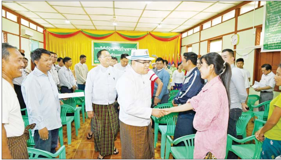
ထောက်ပံ့ရာတွင် ပြည်နယ်ဝန်ကြီးချုပ်က လတ်တလောနယ်မြေအခြေအနေအရ နေရပ်ကျေးရွာများကို စွန့်ခွာပြီး တိမ်းရှောင်လာနေထိုင်စားသောက်မှု အဆင်ပြေကြသည့် မိသားစုများအား စေရေး၊ ယခုလို တတိယအကြိမ် စိတ်ဓာတ်ခွန်အားရရှိစေရေးနှင့် လာရောက် ထောက်ပံ့ပေးခြင်း

မြစ်ကြီးနား ဧပြီ ၃ ကချင်ပြည်နယ်ဝန်ကြီးချုပ်ခွဲခွဲကော်မတီဝန်ထမ်းများနှင့် အတူ မွန်းလွဲပိုင်းတွင် ကချင်ပြည်နယ် ဝိုင်းမော်မြို့နယ်အတွင်း လတ်တလောနယ်မြေ အခြေအနေအရ ဝိုင်းမော်မြို့နှင့် မိုင်းနားကျေးရွာ၊ နောင်ချိန်းကျေးရွာတို့ရှိ ဘာသာရေးကျောင်းများ၊ နီးစပ်ရာ ဆွေမျိုးနေအိမ်များတွင် ယာယီတိမ်းရှောင်လာခဲ့ကြသော အိမ်ထောင်စုများအား မြို့နယ် အထွေထွေအုပ်ချုပ်ရေး ဦးစီးဌာနရုံး ဆဲးမားခန်းမ၌ တတိယအကြိမ် အဖြစ် သွားရောက်တွေ့ဆုံ အားပေးထောက်ပံ့သည်။ ထိုသို့ တွေ့ဆုံအားပေး