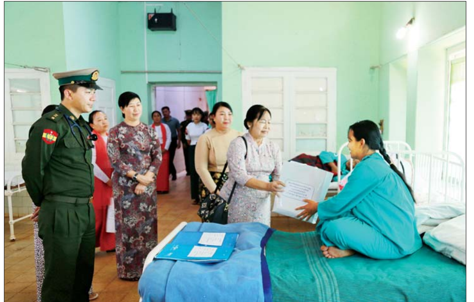
နိုင်ငံတော်စီမံအုပ်ချုပ်ရေးကောင်စီ ဒုတိယဥက္ကဋ္ဌ ဒုတိယတပ်မတော်ကာကွယ်ရေးဦးစီးချုပ် ကာကွယ်ရေးဦးစီးချုပ်(ကြည်း) ဒုတိယဗိုလ်ချုပ်မှူးကြီး စိုးဝင်း၏ဇနီး ဒေါ်သန်းသန်းနွယ် အမျိုးသမီးနှင့် ကလေးကုသဆောင်၌ တက်ရောက်ကုသလျက်ရှိသည့် လူနာတစ်ဦးအား ထောက်ပံ့ပစ္စည်းများ ပေးအပ်စဉ်။