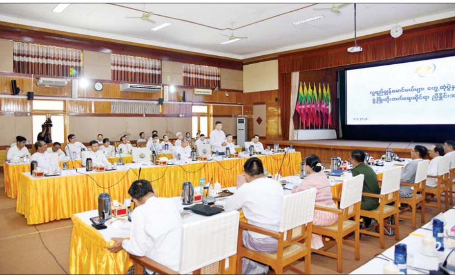
ပြည်ထောင်စုဝန်ကြီး ဦးမင်းသိန်းဇံ လူ့အခွင့်အရေးမဏ္ဍိုင်များ တွေ့ဆုံပွဲနှင့် လူငယ်များ ဖွံ့ဖြိုးတိုးတက်ရေးဆိုင်ရာ ညှိနှိုင်းအစည်းအဝေးတွင် ဆွေးနွေးစဉ်။

ဆက်လက်၍ ပြည်ထောင်စု ဝန်ကြီး ဒေါက်တာသက်ခိုင်ဝင်းက ငယ်စဉ်က လူ့အခွင့်အရေး ဖြစ်ခဲ့သော ကျန်းမာရေး ဝန်ကြီးဌာနတွင် တာဝန် ထမ်းဆောင်နေသော ဆရာကြီး၊ ဆရာမကြီးများ၏ ငယ်ဘဝမှတ်တမ်းများကိုလည်း လေ့လာကြည့်ရှုခြင်းဖြင့် လက်ရှိ လူ့အခွင့်အရေးမဏ္ဍိုင်များအား ကျွန်ုပ်တို့အဖွဲ့အစည်းအတွက် လိုအပ်သည့် အချက်များ ပေါ်ပေါက်လာအောင် ရည်ရွယ်ချက်ဖြင့် ထည့်သွင်းပြသသွားမည်ဖြစ်ပါ