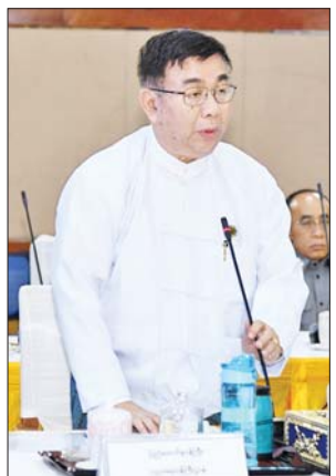
ပြည်ထောင်စု ဝန်ကြီး ဒေါက်တာညွန့်ဖေ ဆွေးနွေးစဉ်။