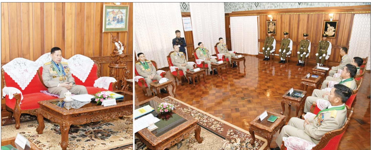
နိုင်ငံတော်စီမံအုပ်ချုပ်ရေးကောင်စီ ဒုတိယဥက္ကဋ္ဌ ဒုတိယတပ်မတော်ကာကွယ်ရေးဦးစီးချုပ် ကာကွယ်ရေးဦးစီးချုပ်(ကြည်း) ဒုတိယဗိုလ်ချုပ်မှူးကြီး သီရိယုံချို မဟာသရေစည်သူ စိုးဝင်း ထူးချွန်ဆုရ ဗိုလ်လောင်းများအား တွေ့ဆုံ၍ ဂုဏ်ပြုအမှာစကားပြောကြားစဉ်။

ထိုသို့ ဆောင်ရွက်ရာတွင် ညီနောင်မိတ်ဖက် အဖွဲ့အစည်းများဖြစ်သည့် မြန်မာနိုင်ငံရဲတပ်ဖွဲ့၊ ပြည်သူ့စစ်တပ်ဖွဲ့ဝင်များအပါအဝင် လုံခြုံရေးနှင့်သက်ဆိုင်သည့် အဖွဲ့အစည်းများ၊ စစ်မှုထမ်းဟောင်းအဖွဲ့များနှင့် ပေါင်းစပ်ပြီး ပြည်သူ့လူထု၏ လူမှုစီးပွားဘဝ ဖွံ့ဖြိုးတိုးတက်ရေးကို ဖော်ဆောင်ပေးခြင်းအားဖြင့် တပ်ပြင်စည်းရုံးရေးအားကောင်းအောင်လုပ်ဆောင်သွားရမည်ဖြစ်ကြောင်း၊ တပ်ပြင်စည်းရုံးရေးလုပ်ငန်းများကို ထိခိုက်စေမည့် မည်သည့်အပြုအမူ လုပ်ရပ်မျိုးကိုမဆို မိမိကိုယ်တိုင်နှင့် လက်အောက်ငယ်သားများကပါ လုံးဝမလုပ်မိစေရန် တာဝန်ယူမှု၊ တာဝန်ခံမှုတို့ဖြင့် အမြင်ကျယ်ကျယ်အလေးအနက်ထား ဆောင်ရွက်ရန်နှင့်