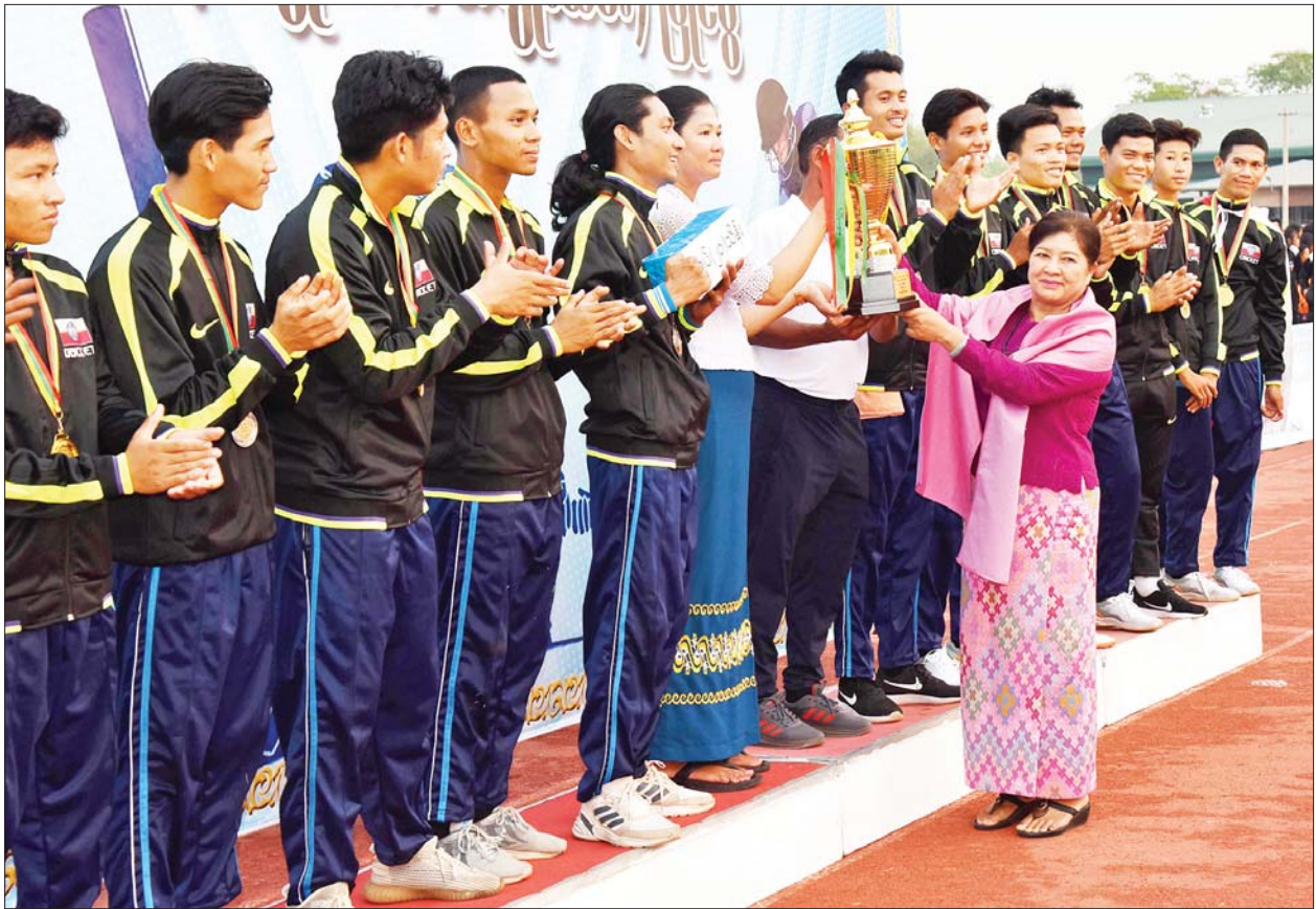
နိုင်ငံတော်စီမံအုပ်ချုပ်ရေးကောင်စီအဖွဲ့ဝင် ဒေါ်ဒွဲဘူ အမျိုးသားအသင်းလိုက်ပြိုင်ပွဲတွင် ပထမဆုရရှိသည့် ရခိုင်ပြည်နယ်အသင်းကို တံခွန်စိုက်ဆုဖလား ပေးအပ်ချီးမြှင့်စဉ်။

ယင်းနောက် ပြည်ထောင်စုဝန်ကြီး ဒေါက်တာမျိုးသိန်းကျော်နှင့် ဦးမင်းသိန်းဇံတို့က အမျိုးသမီးအသင်းလိုက်ပြိုင်ပွဲတွင် ပူးတွဲတတိယ ဆုရရှိကြသည့် ပြည်ထောင်စုနယ်မြေ နေပြည်တော်အသင်းနှင့် ကရင် ပြည်နယ်အသင်းတို့ကိုလည်းကောင်း၊ ပြည်ထောင်စုဝန်ကြီး ဦးကိုကိုလှိုင် နှင့် ဒုတိယဗိုလ်ချုပ်ကြီး ထွန်းထွန်းနောင်တို့က အမျိုးသားအသင်းလိုက် ပြိုင်ပွဲတွင် ပူးတွဲတတိယဆုရရှိကြသည့် ပဲခူးတိုင်းဒေသကြီးအသင်းနှင့် ရန်ကုန်တိုင်းဒေသကြီးအသင်းတို့ကိုလည်းကောင်း၊ နိုင်ငံတော်စီမံ အုပ်ချုပ်ရေးကောင်စီအဖွဲ့ဝင် ဦးရွှေကြိမ်းက အမျိုးသမီးအသင်းလိုက် ပြိုင်ပွဲတွင် ဒုတိယဆုရရှိသည့် ရခိုင်ပြည်နယ်အသင်းကိုလည်းကောင်း၊ နိုင်ငံတော်စီမံအုပ်ချုပ်ရေးကောင်စီအဖွဲ့ဝင် ဒေါက်တာဘရွှေက