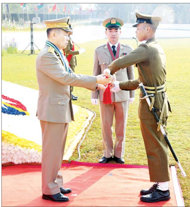
နိုင်ငံတော်စီမံအုပ်ချုပ်ရေးကောင်စီ ဒုတိယဥက္ကဋ္ဌ ဒုတိယတပ်မတော်ကာကွယ်ရေးဦးစီးချုပ် ကာကွယ်ရေးဦးစီးချုပ်(ကြည်း) ဒုတိယဗိုလ်ချုပ်မှူးကြီး သီရိပျံချို မဟာသရေစည်သူ စိုးဝင်း အကောင်းဆုံးဗိုလ်လောင်းဆုရရှိသူ ဗိုလ်လောင်းအမှတ်(၃၁) ဗိုလ်လောင်းပိုင်ဟိန်းသူအား ငွေစားဆုချီးမြှင့်ပေးအပ်စဉ်။

ဆက်လက်၍ နိုင်ငံတော်စီမံအုပ်ချုပ်ရေးကောင်စီဥက္ကဋ္ဌ တပ်မတော်ကာကွယ်ရေးဦးစီးချုပ် ဗိုလ်ချုပ်မှူးကြီး သတိုးမဟာသရေစည်သူ သတိုးသီရိသုဓမ္မမင်းအောင်လှိုင် ကိုယ်စား နိုင်ငံတော်စီမံအုပ်ချုပ်ရေးကောင်စီဒုတိယဥက္ကဋ္ဌ ဒုတိယတပ်မတော် ကာကွယ်ရေးဦးစီးချုပ် ကာကွယ်ရေးဦးစီးချုပ်(ကြည်း)က သင်တန်းဆင်းမိန့်ခွန်း ပြောကြားရာတွင်