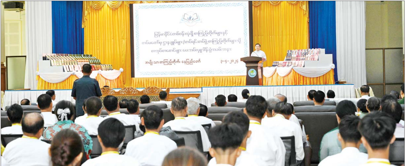
နိုင်ငံတော်စီမံအုပ်ချုပ်ရေးကောင်စီဥက္ကဋ္ဌ နိုင်ငံတော်ဝန်ကြီးချုပ် ဗိုလ်ချုပ်မှူးကြီး မင်းအောင်လှိုင် မြန်မာနိုင်ငံတစ်ဝန်းလုံးရှိ စာကြည့်တိုက်များနှင့် တပ်မတော် ဌာနချုပ်များ/ တပ်ရင်းတပ်ဖွဲ့ စာကြည့်တိုက်များသို့ စာအုပ်စာစောင်များ ပေးအပ်လှူဒါန်းပွဲအခမ်းအနားတွင် အမှာစကားပြောကြားစဉ်။

★ ရှေးဦးမှ နေပြည်တော်တိုင်း စစ်ဌာနချုပ် တိုင်းမှူး၊ ဒုတိယဝန်ကြီးများ၊ မြန်မာနိုင်ငံတော်အစိုးရကောင်စီ ဥက္ကဋ္ဌနှင့် အဖွဲ့ဝင်များ၊ မြန်မာနိုင်ငံ စာကြည့်တိုက်များ ဖောင်ဒေးရှင်း နာယကနှင့် အဖွဲ့ဝင်များ၊ ဌာန ဆိုင်ရာတာဝန်ရှိသူများနှင့် ဆရာ ဆရာမများ၊ ကျောင်းသား ကျောင်းသူများ တက်ရောက် ကြသည်။