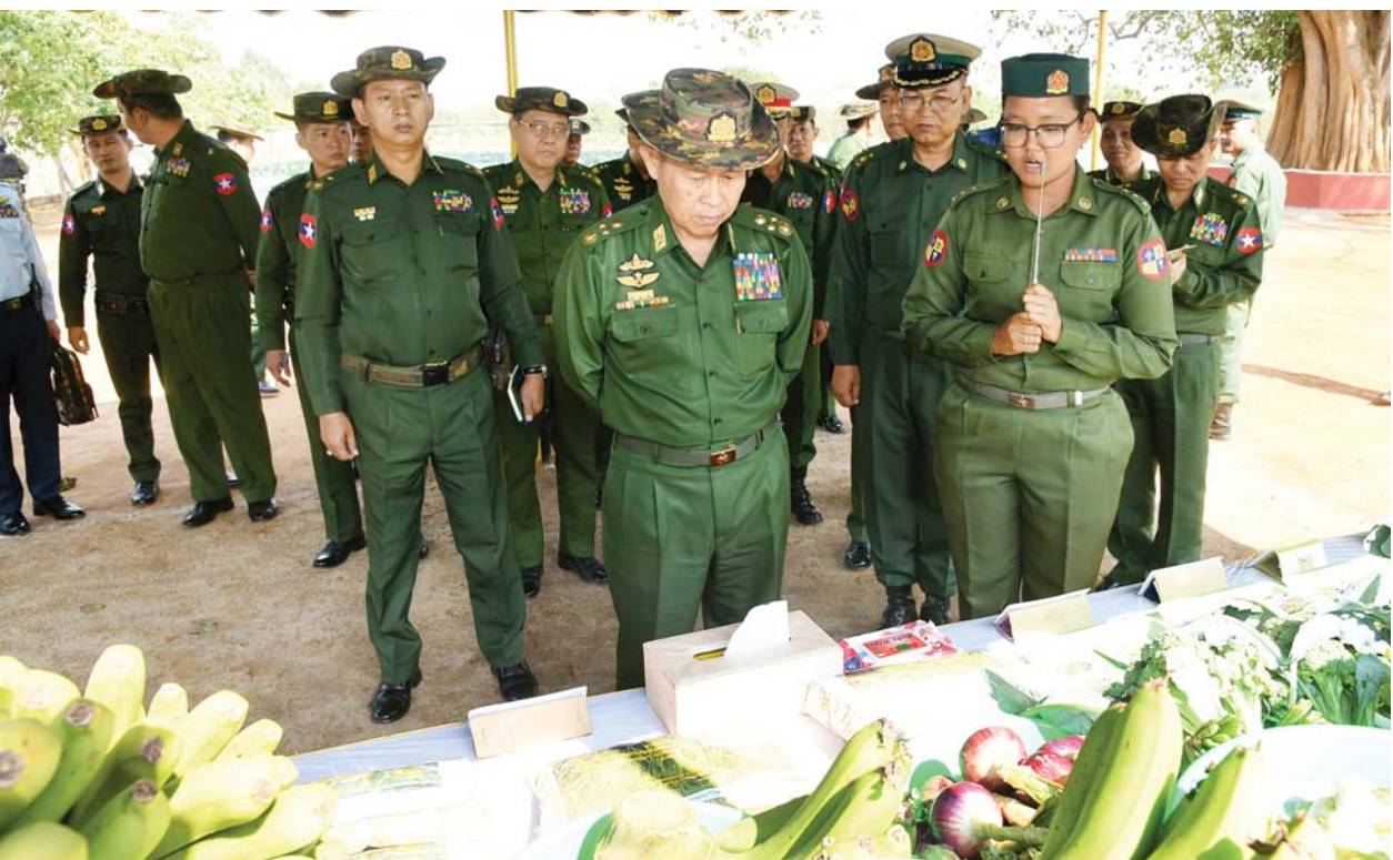
နိုင်ငံတော်စီမံအုပ်ချုပ်ရေးကောင်စီ ဒုတိယဥက္ကဋ္ဌ ဒုတိယတပ်မတော်ကာကွယ်ရေးဦးစီးချုပ် ကာကွယ်ရေးဦးစီးချုပ်(ကြည်း) ဒုတိယဗိုလ်ချုပ်မှူးကြီး စိုးဝင်း တိရစ္ဆာန်မွေးမြူရေးနှင့် လေ့ကျင့်ရေးတပ်ရင်းရှိ စံပြစိုက်ပျိုးမွေးမြူရေးဇုန်မှထွက်ရှိသည့် သီးနှံများကို ကြည့်ရှုစစ်ဆေးစဉ်။

ကြည့်ရှုစစ်ဆေးယင်းနောက် စိုက်ပျိုးမွေးမြူရေးဇုန်အတွင်း ခင်းကျင်းပြသထားသည့် ရွှေဖရုံ၊ ဘူး၊ တိုင်ထောင်ပဲ၊ ငရုတ်၊ ရုံးပတီ၊ မုန့်ညင်း၊ ခရမ်း စသည်များကို မျိုးကောင်းမျိုးသန့်များ အဖြစ်အဆင့်ဆင့် မျိုးစေ့ထုတ်လုပ်ပြီး တပ်ရင်း၊ တပ်ဖွဲ့များနှင့်ပြင်ပသို့ သက်သာသော ဈေးနှုန်းဖြင့် ဖြန့်ဝေ ရောင်းချပေးနေမှုနှင့် တပ်ရင်းမှ ထွက်ရှိသော လား/မြင်းချေးနှင့် စံပြမွေးမြူရေးဇုန်မှ ထွက်ရှိသော ကြက်၊ ဝက်၊ နွားချေးကုန်ကြမ်း ပစ္စည်းများအား အာဟာရတန်ဖိုးမြင့် သဘာဝမြေဆွေးအဖြစ် အသုံးပြုနိုင်ရန် စမ်းသပ် ထုတ်လုပ်နေမှုများနှင့် တိရစ္ဆာန်ရောဂါ ကာကွယ်ဆေးများ ထုတ်လုပ်နေမှုများကို လိုက်လံကြည့်ရှု စစ်ဆေးရာ သက်ဆိုင်ရာ တာဝန်ရှိသူများက ရှင်းလင်းတင်ပြကြသည်။