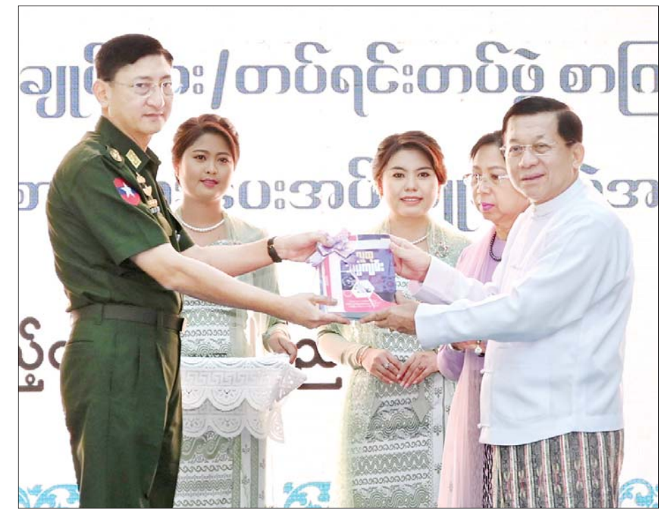
နိုင်ငံတော်စီမံအုပ်ချုပ်ရေးကောင်စီဥက္ကဋ္ဌ နိုင်ငံတော်ဝန်ကြီးချုပ် ဗိုလ်ချုပ်မှူးကြီး မင်းအောင်လှိုင်နှင့် ဇနီးဒေါ်ကြူကြူလှ တပ်မတော် ဌာနချုပ်များ/ တပ်ရင်း တပ်ဖွဲ့ စာကြည့်တိုက်များသို့ စာအုပ်စာစောင်များ ပေးအပ်လှူဒါန်းစဉ်။

ကို အုပ်ချုပ်ရေးနှင့် တပ်မတော် ဌာနချုပ်များ၊ တပ်ရင်းတပ်ဖွဲ့ စာကြည့်တိုက်များ အတွက် အုပ်ချုပ်ရေး ၁၅၀၀ လှူဒါန်းသွားမည် ဖြစ်ကြောင်း၊ အလားတူ ပြန်ကြား ရေးဝန်ကြီးဌာနကလည်း သုတ ရသစာအုပ် ၅၅၀၀ ကို တစ်ပါ တည်း လှူဒါန်းမည်ဖြစ်ကြောင်း၊ လူထုသိပ္ပံကျမ်းအတွဲ (၄)နှင့် (၅) ထုတ်ဝေပြီးပါကလည်း ဆက်လက် လှူဒါန်းသွားမည်ဖြစ်ကြောင်း။