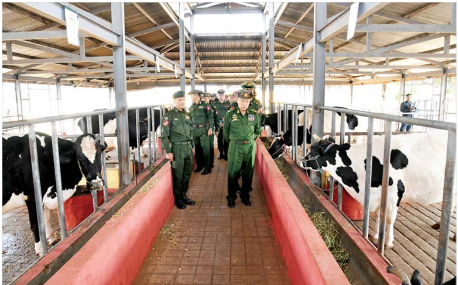
နိုင်ငံတော်စီမံအုပ်ချုပ်ရေးကောင်စီ ဒုတိယဥက္ကဋ္ဌ ဒုတိယတပ်မတော်ကာကွယ်ရေးဦးစီးချုပ် ကာကွယ်ရေးဦးစီးချုပ်(ကြည်း) ဒုတိယဗိုလ်ချုပ်မှူးကြီး စိုးဝင်း တိရစ္ဆာန်မွေးမြူရေးနှင့် လေ့ကျင့်ရေးတပ်ရင်းရှိ မွေးမြူရေးခြံများအတွင်း ကြည့်ရှုစစ်ဆေးစဉ်။