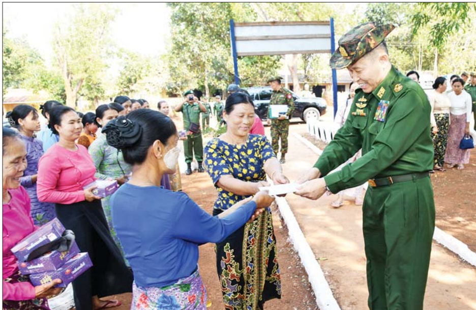
နိုင်ငံတော်စီမံအုပ်ချုပ်ရေးကောင်စီ ဒုတိယဥက္ကဋ္ဌ ဒုတိယတပ်မတော်ကာကွယ်ရေးဦးစီးချုပ် ကာကွယ်ရေးဦးစီးချုပ်(ကြည်း) ဒုတိယဗိုလ်ချုပ်မှူးကြီး စိုးဝင်း ဗထူးတပ်နယ်ရှိ နယ်မြေခံတပ်ရင်း/တပ်ဖွဲ့များမှ မိသားစုများအား စားသောက်ဖွယ်ရာများနှင့် ထောက်ပံ့ငွေများ ပေးအပ်စဉ်။