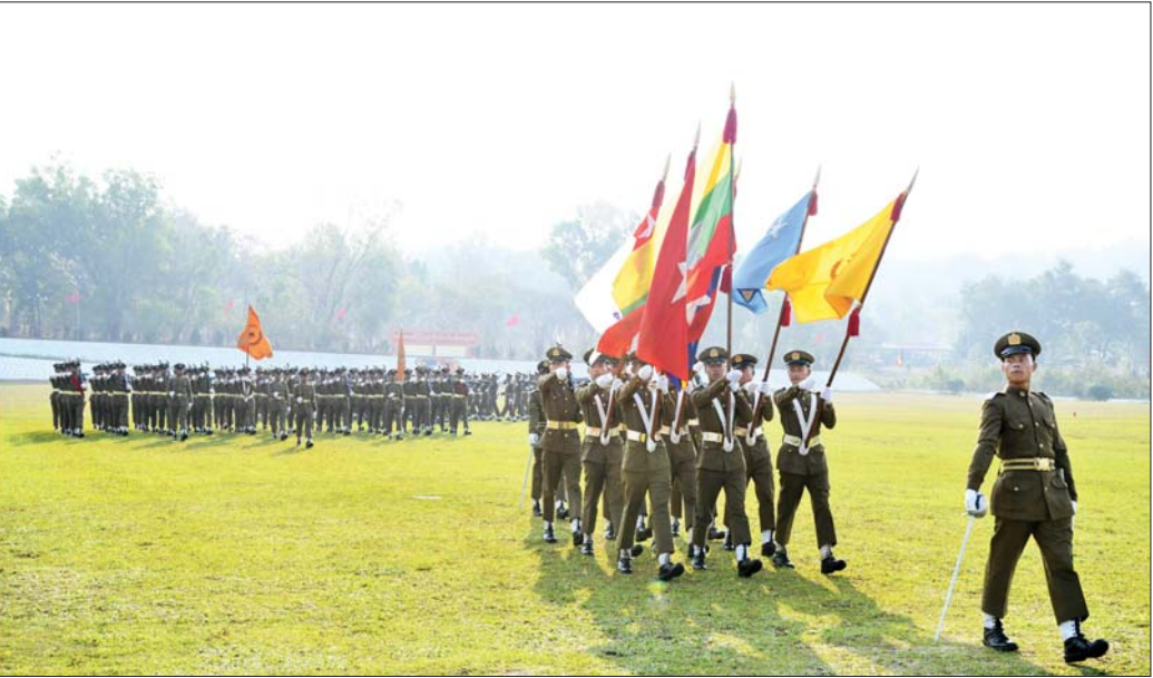
နိုင်ငံတော်စီမံအုပ်ချုပ်ရေးကောင်စီ ဒုတိယဥက္ကဋ္ဌ ဒုတိယတပ်မတော်ကာကွယ်ရေးဦးစီးချုပ် ကာကွယ်ရေးဦးစီးချုပ်(ကြည်း) ဒုတိယဗိုလ်ချုပ်မှူးကြီး သီရိပျံချီမဟာသရေစည်သူ စိုးဝင်း အား ကျောင်းဆင်းဗိုလ်လောင်းတပ်ခွဲများက အနှေးလျှောက်၊ အမြန်လျှောက်ဖြင့် ချီတက်အလေးပြုကြစဉ်။

ကြောင်း၊ ထို့ပြင် တန်းပြည့်စစ်မှုထမ်းဆောင်ချိန်တွင်လည်း နိုင်ငံတကာစစ်ပွဲဆိုင်ရာဥပဒေနှင့် ထိတွေ့တိုက်ခိုက်မှုစည်းမျဉ်း (Rule of Engagement-ROE)များကိုလည်း တိကျစွာလိုက်နာသွားရမည်ဖြစ်ကြောင်း၊ စည်းကမ်းကောင်းမွန်သည့် အဖွဲ့အစည်းသည် ရေရှည်တည်တံ့ခိုင်မြဲပြီး ရည်မှန်းချက်တာဝန်များကို ပြီးမြောက်အောင်မြင်အောင် ဆောင်ရွက်နိုင်မည်ဖြစ်ကြောင်း၊ ထို့ကြောင့် စည်းကမ်းကောင်းပြီး အမိန့်နာခံမှုကောင်းသည့် ခေါင်းဆောင်ကောင်းများ ဖြစ်အောင် ကြိုးစားရမည်ဖြစ်ပြီး မိမိကွပ်ကဲရသည့် တပ်ဖွဲ့ကိုလည်း တပ်ဖွဲ့ကောင်းတစ်ရပ် ဖြစ်အောင် တည်ဆောက်သွားကြရန် မှာကြားလိုကြောင်း။