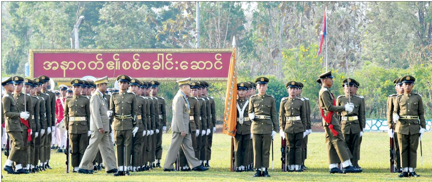
နိုင်ငံတော်စီမံအုပ်ချုပ်ရေးကောင်စီ ဒုတိယဥက္ကဋ္ဌ ဒုတိယတပ်မတော်ကာကွယ်ရေးဦးစီးချုပ် ကာကွယ်ရေးဦးစီးချုပ်ကြီး(ကြည်း) ဒုတိယဗိုလ်ချုပ်မှူးကြီး သီရိပျံချိ မဟာသရေစည်သူ စိုးဝင်း ဗိုလ်လောင်းတပ်ခွဲများအား စစ်ဆေးစဉ်။

နေပြည်တော် ဧပြီ ၃ တပ်မတော်(ကြည်း) ဗိုလ်သင်တန်း ကျောင်း(ဗထူး) ဗိုလ်လောင်းသင်တန်း အမှတ်စဉ်(၁၂၇) သီဟတပ်ခွဲ သင်တန်း ဆင်း ဂုဏ်ပြုစစ်ရေးပြအခမ်းအနားကို ယနေ့နံနက်ပိုင်းတွင် ဗထူးမြို့ တပ်မတော် (ကြည်း) ဗိုလ်သင်တန်းကျောင်း(ဗထူး) စစ်ရေးပြကွင်း၌ ကျင်းပရာ နိုင်ငံတော်စီမံ အုပ်ချုပ်ရေးကောင်စီဥက္ကဋ္ဌ တပ်မတော် ကာကွယ်ရေးဦးစီးချုပ် ဗိုလ်ချုပ်မှူးကြီး သတိုးမဟာသရေစည်သူ သတိုးသီရိ သုဓမ္မ မင်းအောင်လှိုင်ကိုယ်စား နိုင်ငံတော် စီမံအုပ်ချုပ်ရေးကောင်စီ ဒုတိယဥက္ကဋ္ဌ ဒုတိယတပ်မတော်ကာကွယ်ရေးဦးစီးချုပ် ကာကွယ်ရေးဦးစီးချုပ်ကြီး(ကြည်း) ဒုတိယ ဗိုလ်ချုပ်မှူးကြီး သီရိပျံချိ မဟာသရေ စည်သူ စိုးဝင်း တက်ရောက်မိန့်ခွန်း ပြောကြားသည်။ စာမျက်နှာ ၆ ကော်လံ ၁ သို့ ၀