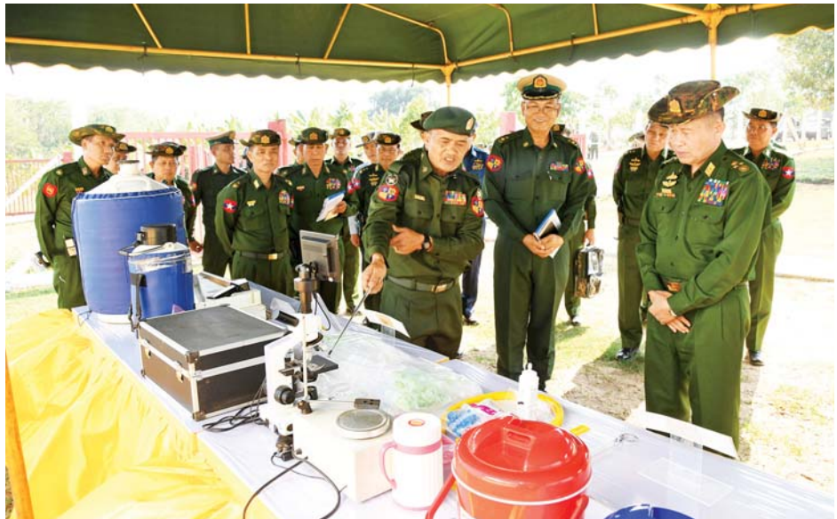
နိုင်ငံတော်စီမံအုပ်ချုပ်ရေးကောင်စီ ဒုတိယဥက္ကဋ္ဌ ဒုတိယတပ်မတော်ကာကွယ်ရေးဦးစီးချုပ် ကာကွယ်ရေးဦးစီးချုပ်(ကြည်း) ဒုတိယဗိုလ်ချုပ်မှူးကြီး စိုးဝင်း နွားမေထုန်မဲ့ သားစပ်ခြင်းပြုလုပ်ရန်အတွက် သားစပ်ကိရိယာများ ခင်းကျင်းပြသထားရှိမှုကို ကြည့်ရှုစစ်ဆေးစဉ်။