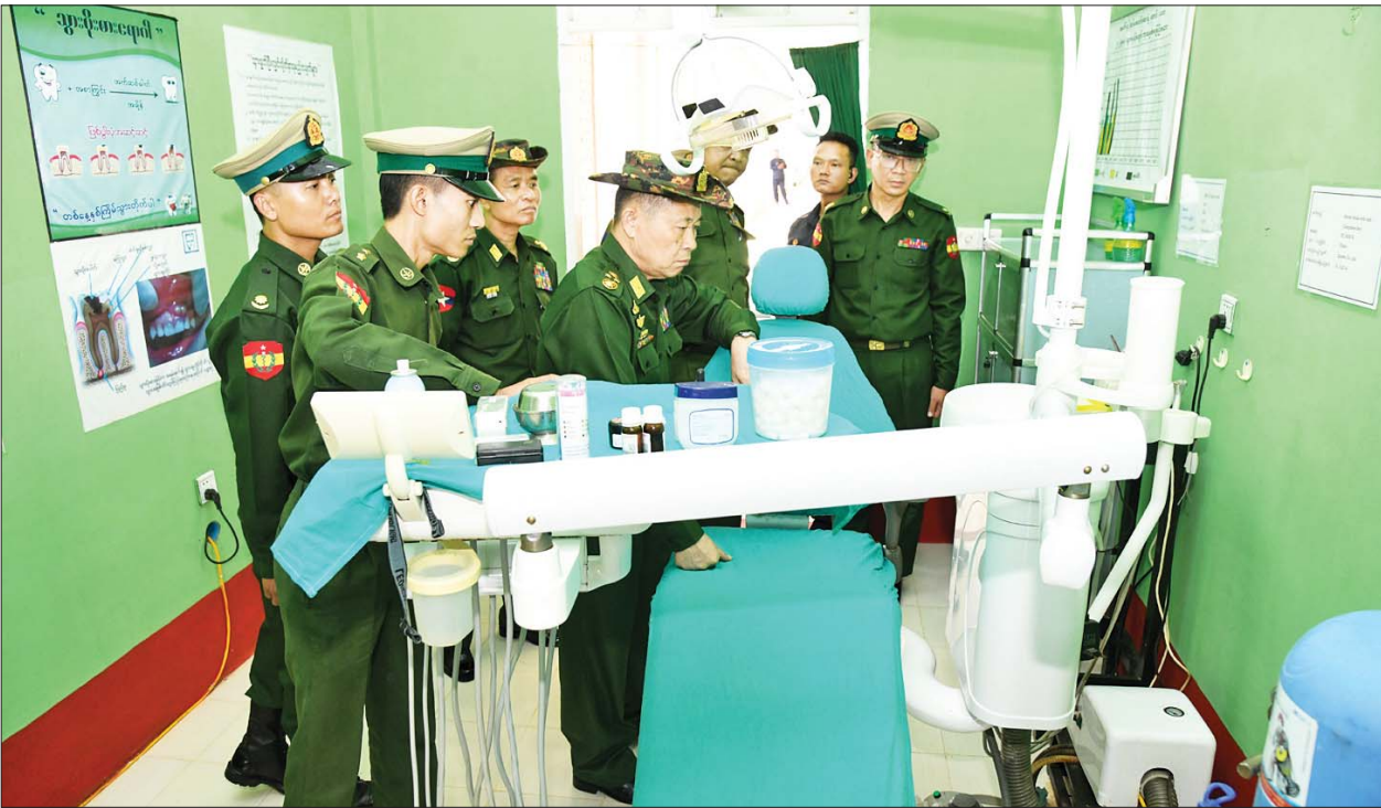
နိုင်ငံတော်စီမံအုပ်ချုပ်ရေးကောင်စီ ဒုတိယဥက္ကဋ္ဌ ဒုတိယတပ်မတော်ကာကွယ်ရေးဦးစီးချုပ် ကာကွယ်ရေးဦးစီးချုပ်(ကြည်း) ဒုတိယဗိုလ်ချုပ်မှူးကြီး စိုးဝင်း ဗထူးတပ်မြို့ရှိ တပ်မတော်ဆေးရုံတွင် ကြည့်ရှုစစ်ဆေးစဉ်။

နေပြည်တော် ဧပြီ ၃ နိုင်ငံတော်စီမံ အုပ်ချုပ်ရေးကောင်စီ ဒုတိယဥက္ကဋ္ဌ ဒုတိယတပ်မတော် ကာကွယ်ရေးဦးစီးချုပ်ကာကွယ်ရေးဦးစီးချုပ်(ကြည်း) ဒုတိယဗိုလ်ချုပ်မှူးကြီး စိုးဝင်းသည် အဖွဲ့ဝင်များလိုက်ပါ၍ ယနေ့မုန်းလွဲပိုင်းတွင် ဗထူးတပ်မြို့ရှိ တပ်မတော်ဆေးရုံ၌ တက်ရောက် ဆေးကုသလျက်ရှိသော အရာရှိ၊ စစ်သည်၊ မိသားစုဝင်များ၊ မြန်မာနိုင်ငံရဲတပ်ဖွဲ့ဝင်များ၊ ပြည်သူ့စစ်(ဌာန)တပ်ဖွဲ့ဝင်များနှင့် ဒေသခံပြည်သူများအား သွားရောက် ကြည့်ရှုအားပေးစကားပြောကြားသည်။