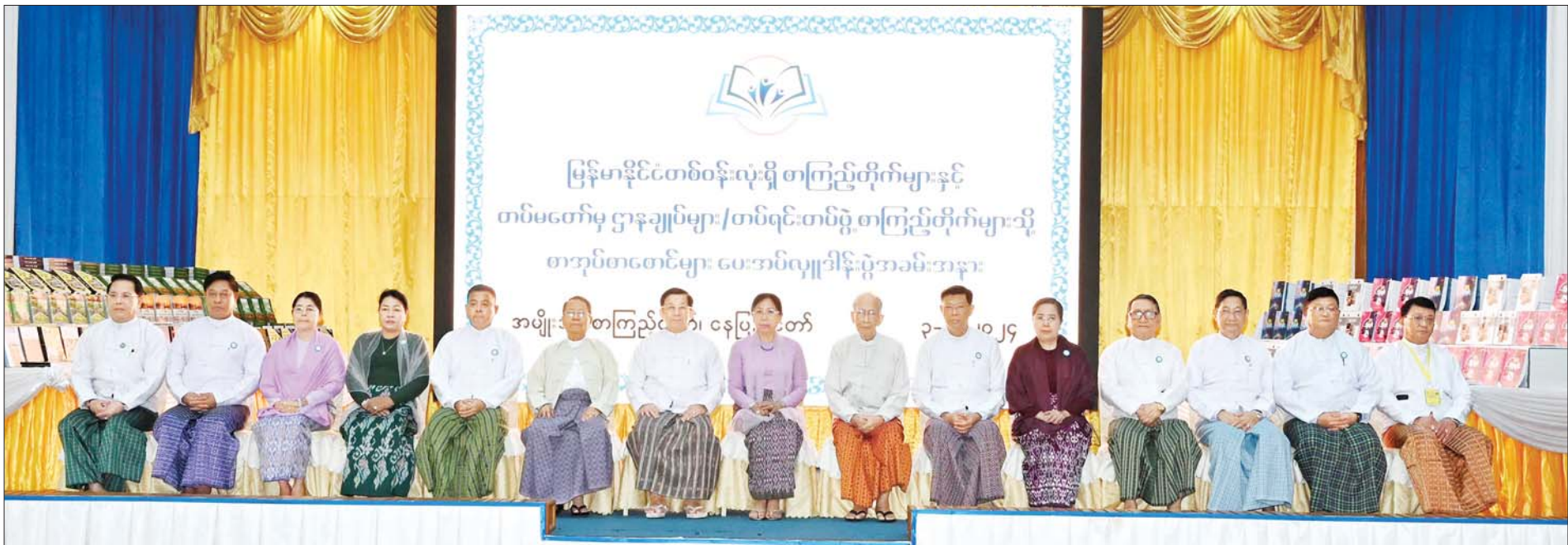
နိုင်ငံတော်စီမံအုပ်ချုပ်ရေးကောင်စီဥက္ကဋ္ဌ နိုင်ငံတော်ဝန်ကြီးချုပ် ဗိုလ်ချုပ်မှူးကြီး မင်းအောင်လှိုင်နှင့် ဇနီးဒေါ်ကြူကြူလှတို့ အခမ်းအနားတက်ရောက်လာကြသူများနှင့်အတူ စုပေါင်းမှတ်တမ်းတင် ဓာတ်ပုံရိုက်စဉ်။