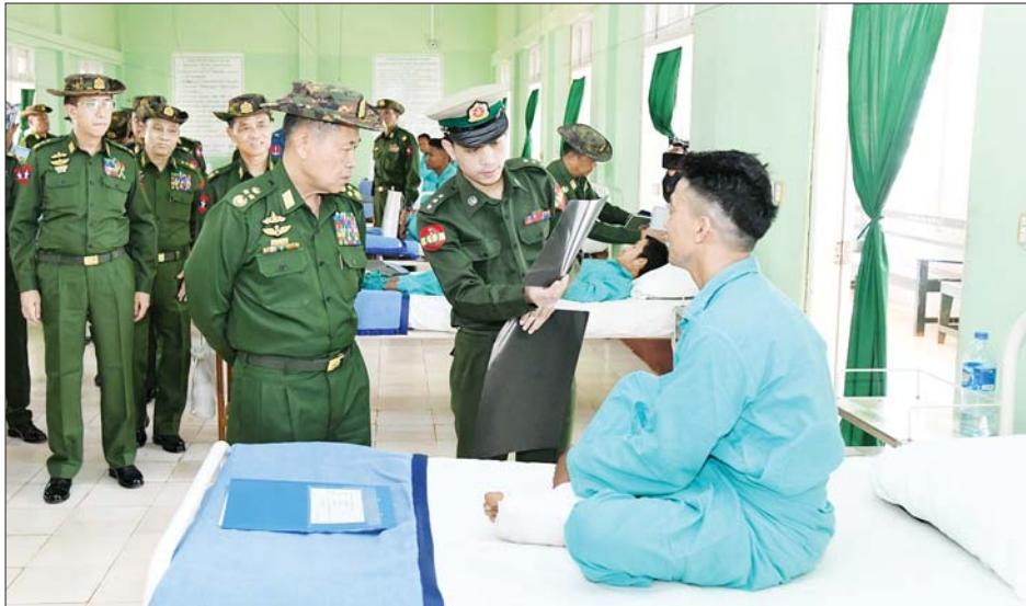
နိုင်ငံတော်စီမံအုပ်ချုပ်ရေးကောင်စီ ဒုတိယဥက္ကဋ္ဌ ဒုတိယတပ်မတော်ကာကွယ်ရေးဦးစီးချုပ် ကာကွယ်ရေးဦးစီးချုပ်(ကြည်း) ဒုတိယဗိုလ်ချုပ်မှူးကြီး စိုးဝင်း ဗထူးတပ်မြို့ရှိ တပ်မတော်ဆေးရုံ၌ တက်ရောက်ဆေးကုသမှုခံယူနေသူတစ်ဦးအား ရင်းရင်းနှီးနှီးမေးမြန်းအားပေးစကားပြောကြားစဉ်။

ထို့နောက် နိုင်ငံတော် စီမံအုပ်ချုပ်ရေးကောင်စီ ဒုတိယဥက္ကဋ္ဌ ဒုတိယတပ်မတော်ကာကွယ်ရေးဦးစီးချုပ်(ကြည်း)နှင့်အဖွဲ့ဝင်များသည် ဗထူးတပ်နယ်ရှိ နယ်မြေခံ တပ်ရင်း/တပ်ဖွဲ့များအား မော်တော်ယာဉ်များဖြင့် လိုက်လံ ကြည့်ရှုစစ်ဆေးပြီး မိသားစုများနှင့်တွေ့ဆုံ၍ ရင်းရင်းနှီးနှီးလိုက်လံနှုတ်ဆက် အားပေးစကားပြောကြားကာ တင်ပြချက်များအပေါ် လိုအပ်သည်များကို တာဝန်ရှိသူများနှင့် ပေါင်းစပ်ညှိနှိုင်း ဆောင်ရွက်ပေးကာ စားသောက် ဖွယ်ရာများနှင့် ထောက်ပံ့ငွေများ ပေးအပ်ခဲ့ကြောင်း သိရသည်။