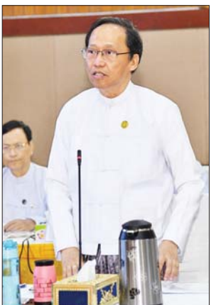
ပြည်ထောင်စုဝန်ကြီး ဒေါက်တာ သက်ခိုင်ဝင်း ဆွေးနွေးစဉ်။