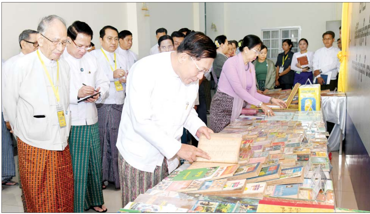
နိုင်ငံတော်စီမံအုပ်ချုပ်ရေးကောင်စီဥက္ကဋ္ဌ နိုင်ငံတော်ဝန်ကြီးချုပ် ဗိုလ်ချုပ်မှူးကြီး မင်းအောင်လှိုင်နှင့် ဇနီးဒေါ်ကြူကြူလှ ခင်းကျင်း ပြသထားသည့် စာအုပ်စာစောင်များကို စိတ်ပါဝင်စားစွာဖြင့် လှည့်လည်ကြည့်ရှုစဉ်။

အသိပညာ မြှင့်မားအောင် လုပ်ဆောင်ကြရန် အတွက် စာကြည့်တိုက်များ၏ အခန်းကဏ္ဍ နှင့် စာကြည့်တိုက်ယဉ်ကျေးမှု ထွန်းကားရေးကို လုပ်ဆောင်ကြ ရန်လည်း လိုအပ်မည်ဖြစ်ကြောင်း။