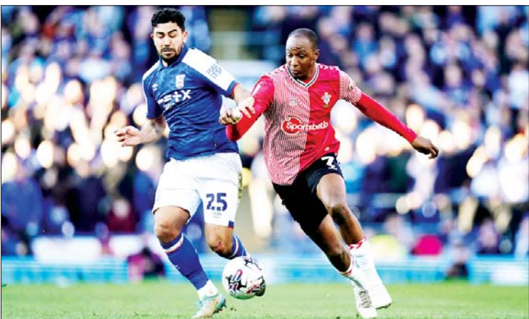
အစ်ဆွစ်အသင်းနှင့် ဆောက်သမ်တန်အသင်းတို့ ယှဉ်ပြိုင်နေစဉ်။

အစ်ဆွစ်အသင်းနဲ့ ဆောက်သမ်တန်အသင်းတို့ ဧပြီ ၁ ရက်ညပိုင်းက ယှဉ်ပြိုင်ကစားခဲ့တဲ့ ချန်ပီယံရှစ်ပွဲစဉ် ၄၀ မှာ အစ်ဆွစ်အသင်းက ဆောက်သမ်တန်အသင်းကို သုံးဂိုး-နှစ်ဂိုးနဲ့ အနိုင်ရရှိခဲ့တာကြောင့် အစ်ဆွစ်အသင်းဟာ ဇယားထိပ်ဆုံးမှာ ဦးဆောင်ခွင့် ရရှိခဲ့ပါတယ်။ အစ်ဆွစ်အသင်းနဲ့ ဆောက်သမ်တန်အသင်းတို့ပွဲစဉ်မှာ အိမ်ရှင်အသင်းအတွက် သွင်းဂိုးတွေကို ပွဲကစားချိန် ၁၃ မိနစ်မှာ ဒေးဗစ်ကတစ်ဂိုး၊ ၆၈ မိနစ်မှာ ဘရုတ်ဟက်ဒ်က တစ်ဂိုး၊ သာမန်ပွဲကစားချိန် စာမျက်နှာ ၁၂ ကော်လံ ၁ သို့ *