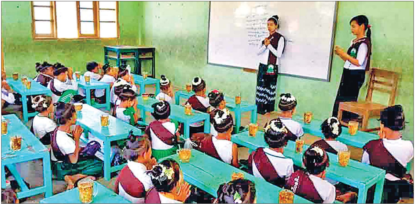
မကွေးတိုင်းဒေသကြီး ပွင့်ဖြူမြို့နယ် ရေပုတ်ကြီးကျေးရွာ အခြေခံပညာအလယ်တန်းကျောင်း၌ နွေရာသီကျောင်းပိတ်ရက်တွင် ယဉ်ကျေးလိမ္မာသင်တန်း ဖွင့်လှစ်စဉ်။

သူငယ်တန်းမှ သတ္တမတန်း (Grade-7) အထိ ကျောင်းသားကျောင်းသူများအတွက်မှာမူနွေရာသီ ကာလအတွင်း တစ်ဆင့်မြင့်အတန်းအတွက် ကြိုတင်သင်ယူမှုလုပ်ဆောင်ရန် ကျောင်းသား ကျောင်းသူများကိုယ်တိုင်နှင့် မိဘဆရာများက တွန်းအားပေးခြင်းနှင့် အားစိုက်လုပ်ဆောင်ခြင်း မပြုလုပ်သင့်လှပါ။ သူတို့ကိုယ်တိုင်အပင်ပန်းခံနိုင် သည့်တိုင် မိဘများအနေဖြင့် ယခုကဲ့သို့ ပူပြင်းလှ သောရာသီဥတုတွင် အာရုံစူးစိုက်ပညာသင်ကြားရန် ကိစ္စအတွက်ကို သေချာစွာ စဉ်းစားသင့်ကြပါသည်။ အထူးသဖြင့်မြန်မာနိုင်ငံ၏ရာသီဥတုသည် အအေး ပိုင်းနိုင်ငံများ၏ ရာသီဥတုနှင့် မတူညီသည့်အပြင် လူတစ်ဦးတစ်ယောက်စီ၏ခံနိုင်ရည်အားသည်လည်း မတူကြပါ။ ပညာရေးစနစ်ကိုပင်အနောက်တိုင်း၏ ပညာရေးစနစ်အတိုင်းပုံတူကူးချပြီးကျင့်သုံး၍မရ ပါ။ ထို့ကြောင့်ကလေးငယ်များပညာသင်ကြားရေး တွင်နွေရာသီကျောင်းပိတ်ရက်ကာလရှည်အတွင်း မည်သို့ဆောင်ရွက်ကြမည်ကို မိဘများအနေဖြင့်