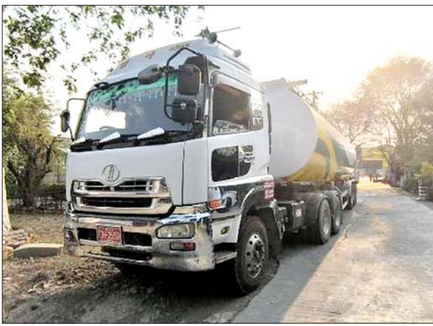
မန္တလေးတိုင်းဒေသကြီး၌ သိမ်းဆည်းရမိမှုမှတ်တမ်းဓာတ်ပုံ။

နေပြည်တော် ဧပြီ ၂ တရားမဝင် ကုန်သွယ်မှု တိုက်ဖျက်ရေးဦးဆောင်ကော်မတီ ၏ ကြီးကြပ်ကွပ်ကဲမှုဖြင့် တရားမဝင်ကုန်သွယ်မှုများကို ဥပဒေနှင့်အညီ ထိရောက်စွာ တားဆီးအရေးယူနိုင်ရေး ဆောင်ရွက်လျက်ရှိရာ ဧပြီ ၁ ရက်တွင် မကွေးတိုင်းဒေသကြီး တရားမဝင်ကုန်သွယ်မှု တိုက်ဖျက်ရေးအထူးအဖွဲ့၏ စီမံခန့်ခွဲမှုဖြင့် တာဝန်ကျပူးပေါင်းအဖွဲ့များက စစ်ဆေးမှုများ ဆောင်ရွက်ခဲ့ရာ ဧရာဝတီတံတားစစ်ဆေးရေးဂိတ်၌ လိုင်စင်မဲ့ Honda Fit ယာဉ်တစ်စီး (ခန့်မှန်းတန်ဖိုးငွေကျပ် ၇၃၀၀၀၀)ကို ပို့ကုန်သွင်းကုန် ဥပဒေအရ လည်းကောင်း၊ မင်းလှမြို့နယ် အောက်တိုင်းကျေးရွာ၌ တရားမဝင် စက်သုံးဆီ ဓာတ်ဆီ ဂါလန် ၅၀၀ (ခန့်မှန်းတန်ဖိုးငွေကျပ် ၅၅၀၀၀၀)၊ အဆိုပါစက်သုံးဆီ များ တင်ဆောင်လာသည့် Canter Truck တစ်စီး (ခန့်မှန်းတန်ဖိုးငွေကျပ် ၂၀၀၀၀၀၀)နှင့် မင်းတုန်းမြို့နယ် ညောင်ကြပ်ကျေးရွာအနီး၌ တရားမဝင် စက်သုံးဆီ ဒီဇယ်ဆီ ၂၁ ဂါလန် (ခန့်မှန်းတန်ဖိုးငွေကျပ် ၂၃၉၄၀၀) နှင့် အဆိုပါစက်သုံးဆီများ တင်ဆောင်လာသည့် Luojia 110 ဆိုင်ကယ်တစ်စီး (ခန့်မှန်းတန်ဖိုးငွေကျပ် ၆၅၀၀၀၀)တို့ကို ရေခဲခန်း