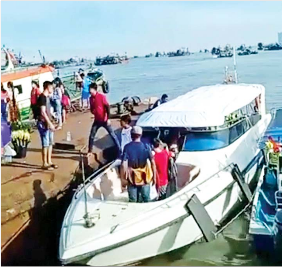
ကျွန်းများသို့ သွားရောက်လည်ပတ်ကြမည့် ခရီးသွားများကို တွေ့ရစဉ်။

မြိတ် ဧပြီ ၂ မြန်မာ့ရိုးရာနှစ်သစ်ကူး မဟာသင်္ကြန်ကာလအတွက် ကျွန်းခရီးစဉ်များတွင် မြိတ်ကျွန်းစုခရီးစဉ်ထက် ကော့သောင်းရှိကျွန်းများသို့ လည်ပတ်မည့်သူ ပိုမိုများပြားနေကြောင်း ခရီးသွားဝန်ဆောင်မှုပေးနေသူများက ပြောသည်။ ကော့သောင်းမြို့နယ် အတွင်းရှိ ခရီးစဉ်များကို ယခုနှစ်တွင် ခရီးသွားများ ပိုမိုစိတ်ဝင်စားမှုများပြားနေသည့်အပြင် ကြိုတင်တိုက်ရည်ထားသူများ ပြည့်နေကြောင်းသိရသည်။ “ကော့သောင်းကို ဒီနှစ်လာရောက် လည်ပတ်မယ့်သူတွေ အတော်ကိုများတယ်လို့ ကြားသိရပါတယ်။ နယ်မြေအေးချမ်းတာက တစ်ကြောင်း၊ ကိုယ်ပိုင်ကျွန်းတွေကို ဝန်ဆောင်မှုကောင်းကောင်းနဲ့ လုပ်ပေးထားတယ်။ အကျိုးအမြတ်ထက် ကျွန်းတွေကို ခရီးသွားများအကြား စိတ်ဝင်စားမှု မြင့်တက်စေဖို့ လုပ်ဆောင်ပေးကြစာမျက်နှာ ၁၂ ကော်လံ ၁ သို့ ။”