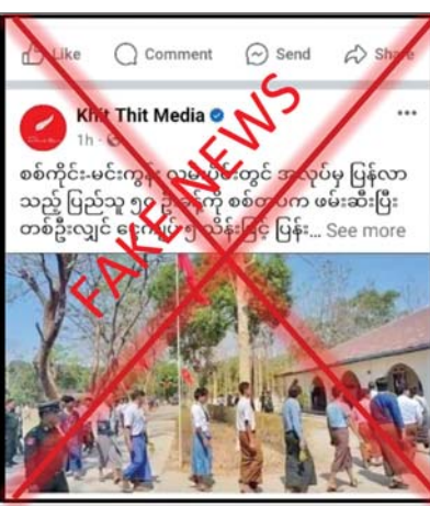
လုပ်ကြံဖန်တီးရေးသားခြင်းများ ဆောင်ရွက်နေ ခြင်းသာဖြစ်ကြောင်း သိရသည်။ သတင်းစဉ်

အန္တရာယ်၊ လမ်းအန္တရာယ် ကင်းရှင်းစေရေး အတွက် အသိပညာပေးခြင်း နှင့် ယာဉ်စည်း ကမ်း၊ လမ်းစည်းကမ်း လိုက်နာဆောင်ရွက်မှု စစ်ဆေးခြင်းများ ဆောင်ရွက်ခဲ့ကြောင်းနှင့် ပြည်သူအချို့အား ဖမ်းဆီးထားသည်ဆိုသည် မှာ မှန်ကန်မှုမရှိကြောင်း သက်ဆိုင်ရာမြို့နယ် အုပ်ချုပ်မှုဆိုင်ရာ တာဝန်ရှိသူတစ်ဦး၏ ပြောကြားချက်အရ သိရသည်။ ပြည်သူ့စစ်မှုထမ်းဥပဒေ စတင်အာဏာ တည်သည့်နေ့မှစ၍ တရားမဝင် ပြည်ဖျက် မိဒီယာများက ပြည်သူများစိုးရိမ်ထိတ်လန့် စေရန် လုပ်ကြံသတင်းမျိုးစုံအား ဖြန့်ဝေခြင်း၊ သတင်းတု၊ သတင်းအမှားများဖြင့် မဟုတ်မမှန် စွပ်စွဲ၍ ယုတ်မာအောက်တန်းကျစွာဖြင့်