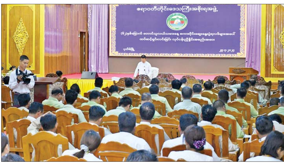
တိုင်းဒေသကြီးဝန်ကြီးချုပ်၊ တိုင်းဒေသကြီး အစိုးရအဖွဲ့ဝင်များ၊ ဧရာဝတီတိုင်းဒေသကြီး ကျေးလက်ဒေသနေပြည်သူများနှင့် တိုင်းရင်းသားပြည်သူများအတွက် အခြေခံစာတတ်မြောက်ရေး လုပ်ငန်းကော်မတီဝင်များ တက်ရောက်ခဲ့ကြသည်။ တိုင်းဒေသကြီး(ပြန်/ဆက်)

လည်းကောင်း ဆွေးနွေးတင်ပြကြသည်။ ယင်းနောက် ခရိုင်စိုက်ပျိုးရေးဦးစီးဌာနများက သက်ဆိုင်ရာ ခရိုင်အလိုက် သီးနှံများ ပန်းတိုင်အထွက်နှုန်း ရရှိစေရေးဆောင်ရွက်နေမှု၊ စားသုံးဆီ ဖူလုံစေရေး ဆောင်ရွက်နေမှုများအား ဆွေးနွေးတင်ပြကြသည်။ ဆက်လက်၍ ဝယ်ယူကြိုတင်ချွဲ တင်ပို့မှုနှင့် သွင်းအားစု အစုအဖွဲ့များက ဝယ်ယူကြိုတင်ချွဲဆိုင်ရာ များအား ဆွေးနွေးတင်ပြမှုအပေါ် လုံခြုံရေးနှင့် နယ်စပ်ရေးရာဝန်ကြီးက ဖြည့်စွက်ရင်းလင်းတင်ပြခဲ့ပြီး တိုင်းဒေသကြီးဝန်ကြီးချုပ်က လိုအပ်သည်များ ဖြည့်ဆည်းဆွေးနွေးခဲ့ကြောင်းသိရသည်။ ဆက်လက်၍ ဧပြီလတွင် ဆောင်ရွက်မည့် ဧရာဝတီတိုင်းဒေသကြီး ကျေးလက်ဒေသနေပြည်သူများနှင့် တိုင်းရင်းသားပြည်သူများအတွက် အခြေခံစာတတ်မြောက်ရေးလုပ်ငန်း ဆောင်ရွက်မည့် အစီအစဉ်အား တိုင်းဒေသကြီးအစိုးရအဖွဲ့ရုံး အစည်းအဝေးခန်းမ(၁)၌ ညနေပိုင်းတွင် ကျင်းပရာ