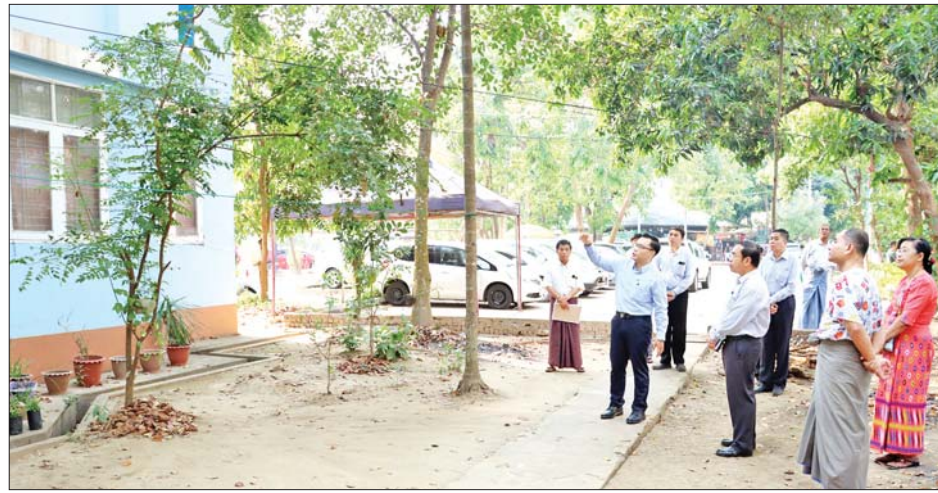
တိုက်တာဝန်ခံများနှင့် ဒုတိယဝန်ကြီးအဖွဲ့ဝင်များ၊ အရာထမ်းများ၊ အမှုထမ်းများနှင့် တွေ့ဆုံနှုတ်ဆက်၍ နေပြည်တော်စည်ပင်သာယာရေး ကော်မတီမှ သတ်မှတ်ထားသော အိမ်ရာစည်းကမ်းများအတိုင်း ပြုပြင်ရာ မီးဘေးအန္တရာယ် ကြိုတင်ကာကွယ်ရေး စီမံချက်အတိုင်း ဆောင်ရွက်ရန်၊ အယ်လ်နီညီဖြစ်စဉ် ရှိနေရာ ရေကိုစနစ်တကျ ချွေတာသုံးစွဲကြရန်၊ မိလ္လာ

နေပြည်တော် မတ် ၃၀ သိပ္ပံနှင့်နည်းပညာဝန်ကြီးဌာန ဒုတိယဝန်ကြီး ဒေါက်တာအောင်ဇေယျသည် အမြဲတမ်းအတွင်းဝန်၊ ညွှန်ကြားရေးမှူးချုပ်များ၊ ဒုတိယအမြဲတမ်းအတွင်းဝန် ဒေါက်တာစည်သူကျော်၊ ဒုတိယညွှန်ကြားရေးမှူးချုပ်များနှင့် တာဝန်ရှိသူများနှင့်အတူ ယနေ့တွင် ပြည်ထောင်စုနယ်မြေ နေပြည်တော် ဧမ္မာသီရိမြို့နယ် မင်္ဂလာသိဒ္ဓိရပ်ကွက်နှင့် ဗလသိဒ္ဓိရပ်ကွက်တို့ရှိ အရာထမ်းများ၊ အမှုထမ်းများ နေထိုင်ရာ ဝန်ထမ်းအိမ်ရာများတွင် စည်းကမ်းများနှင့်အညီ နေထိုင်မှုရရှိ/မရှိ လှည့်လည်ကြည့်ရှုစစ်ဆေးသည်။ ကြည့်ရှုစစ်ဆေးစဉ် ဒုတိယဝန်ကြီးသည် အိမ်ရာကြီးကြပ်သူ တိုက်တာဝန်ခံများ၊ နေထိုင်သူ ဝန်ထမ်းများနှင့် ရင်းရင်းနှီးနှီး တွေ့ဆုံနှုတ်ဆက်၍ နေပြည်တော်စည်ပင်သာယာရေး ကော်မတီမှ သတ်မှတ်ထားသော အိမ်ရာစည်းကမ်းများအတိုင်း