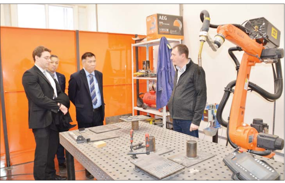
များ၊ သိပ္ပံနှင့်နည်းပညာ ဘာသာ သင်ကြားမှု၊ သင်ယူမှု အထောက် အကူပစ္စည်းများကို လှည့်လည် သုတေသနပြု တွေ့ရှိချက်များနှင့် ကြည့်ရှုလေ့လာကြသည်။

တာဝန်ရှိသူများက တက္ကသိုလ် ဆိုင်ရာ အချက်အလက်များ၊ လေ့ကျင့်သင်ကြားပေးလျက်ရှိ သည့် ဘာသာရပ်များ၊ ပြည်ပမှ သင်တန်းသားများအား လက်ခံ သင်ကြားနေမှု၊ စာပေသင်ကြား ပို့ချပေးနေမှုနှင့် သုတေသန လုပ်ငန်းများ ဆောင်ရွက်နေမှု အခြေအနေကို Video Clip ဖြင့် ရှင်းလင်းပြသကြပြီး သိပ္ပံနှင့် နည်းပညာဆိုင်ရာ ကိစ္စရပ်များ၊ သုတေသနလုပ်ငန်းများ ပူးပေါင်း ဆောင်ရွက်သွားရေးနှင့် ပညာ တော်သင်များ စေလွှတ်နိုင်ရေး ကိစ္စရပ်များကို အပြန်အလှန် ဆွေးနွေးကြသည်။