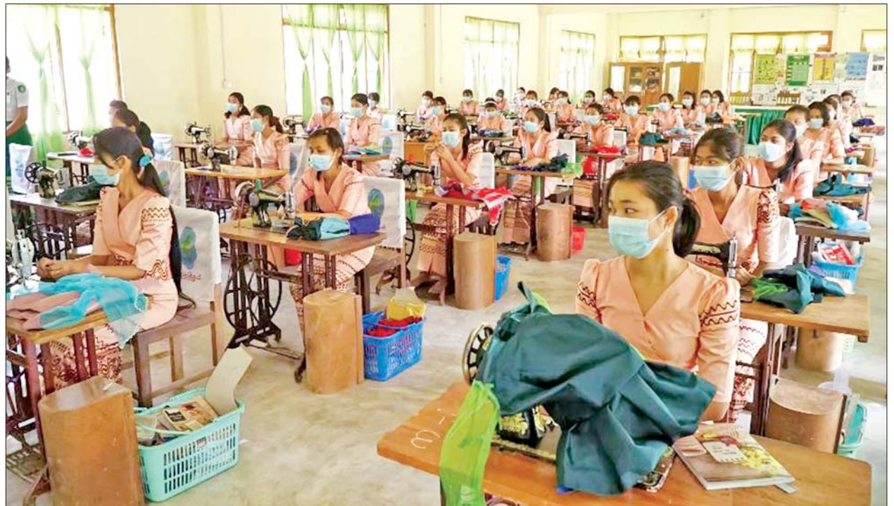
နယ်စပ်ရေးရာဝန်ကြီးဌာန ပညာရေးနှင့် လေ့ကျင့်ရေးဦးစီးဌာန အမျိုးသမီးအိမ်တွင်းမှု သက်မွေးလုပ်ငန်းပညာသင်တန်းကျောင်း(ပခုက္ကူ)၌ အသက်မွေးဝမ်းကျောင်းအထောက်အကူပြုသင်တန်း ဖွင့်လှစ်သင်ကြားပေးစဉ်။

ယနေ့ ဖတ်စရာ မြန်မာ့သမိုင်းစဉ်တစ်လျှောက်တွင် နိုင်ငံတော်၌ အကျပ်အတည်းများနှင့် အရေးပေါ်အခြေအနေများ ပေါ်ပေါက်လာသည့်အခါတိုင်း မြန်မာ့တပ်မတော် ခေါင်းဆောင်များက စစ်ရေးခေါင်းဆောင်တာဝန် အပြင် အုပ်ချုပ်ရေးခေါင်းဆောင်၊ စည်းရုံးရေး ခေါင်းဆောင်၊ စီးပွားရေးခေါင်းဆောင်တာဝန်များ ဖြင့် နိုင်ငံ့ခေါင်းဆောင် တာဝန်အရပ်ရပ်ကို မလွှဲ မရှောင်သာဘဲ တာဝန်သိသိ သစ္စာရှိရှိတာဝန်ယူကြရ သည်မှာ မြန်မာ့သမိုင်းရေးနှင့် အမျိုးသားရေး တောင်းဆိုမှုများနှင့် လိုအပ်ချက်များ (Historical and national necessities) က သက်သေခံလျက်ရှိ ဆောင်းပါး စာမျက်နှာ » ၁၀