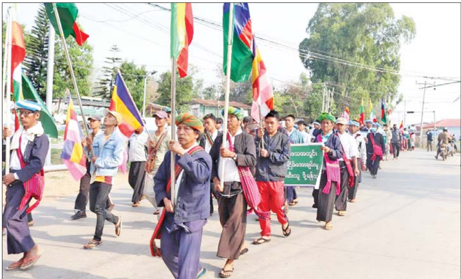
အလိုမရှိ၊ ဒေသတည်ငြိမ်အေးချမ်းမှု ဖျက်ဆီးသူ ကို သံပြိုင်ကြေးကြော်ခွဲကြပြီး ဆန္ဒထုတ်ဖော်ပွဲကို ခွဲရန်သူအမျိုးဘာသာသာသနာ ဖျက်ဆီးသည့်အကြမ်း အောင်မြင်စွာကျင်းပခဲ့ကြောင်း သိရသည်။ ဖက်အဖွဲ့အား ချေမှုန်းကြ ” စသည့် ကြေးကြော်သံများ သတင်းစဉ်

သားပြည်သူများအနေဖြင့် လုံးဝလက်ခံနိုင်မှုမရှိဘဲ ပြင်းပြင်းထန်ထန် ကန့်ကွက်ရှုတ်ချလျက်ရှိသည်။ ထိုသို့ကန့်ကွက်ရှုတ်ချလျက်ရှိရာ ယနေ့နံနက် ၈ နာရီခန့်တွင် ရှမ်းပြည်နယ် (တောင်ပိုင်း) ဟိုပုံးမြို့ မှ ဒေသတည်ငြိမ်အေးချမ်းရေးကို လိုလားသည့် သံဃာတော်များနှင့် ဒေသခံတိုင်းရင်းသားပြည်သူ အင်အား ၁၁၀၀ ကျော်ခန့်သည် အဆိုပါမြို့၊ မြို့မ အားကစားကွင်း၌ စုဝေးပြီး ၎င်းစုရပ်နေရာမှ ဟိုပုံး- ဆီဆိုင်လမ်းမကြီးအတိုင်း မွေတော်ဘုရားရှေ့ ကျောက်တိုင်ကွင်းသို့ ငြိမ်းချမ်းစွာ စီတန်းလှည့်လည် ချီတက်၍ ဆန္ဒဖော်ထုတ်ကြကာ နံနက် ၉ နာရီခန့် တွင် အေးချမ်းစွာလူစုခွဲခဲ့ကြသည်။ ချီတက်ရာ လမ်းတစ်လျှောက်တွင် “KNDF ၊ PDF အမည်ခံ အကြမ်းဖက်အဖွဲ့ အလိုမရှိ၊ NUG ၊ CRPH အကြမ်းဖက်အဖွဲ့ အလိုမရှိ၊ TNLA အကြမ်း ဖက်အဖွဲ့ အလိုမရှိ၊ ကျေးရွာနေအိမ်များ မီးရှို့ဖျက်ဆီး နေကြသည့် အကြမ်းဖက်အဖွဲ့ အလိုမရှိ၊ ပြည်သူ့လူထု လူမှုစီးပွားဘဝ ဖျက်ဆီးနေသည့် အကြမ်းဖက်အဖွဲ့