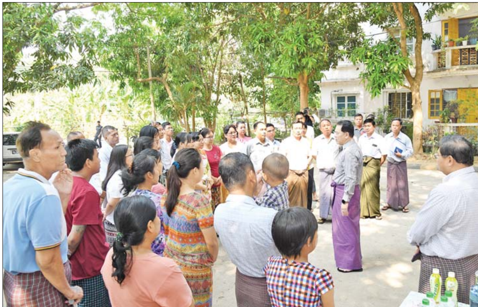
များအနေဖြင့်လည်း စည်းမျဉ်းစည်းကမ်းများနှင့်အညီ နေထိုင်ကြရန်၊ ဝန်ထမ်းအိမ်ရာများတွင် နေထိုင်သော ဝန်ထမ်းများအနေဖြင့် အိမ်ရာနှင့် အဆောင်လုံခြုံရေး အတွက် အသိသတိဖြင့် ဧည့်သည်များ၊ မသက်ဆိုင်သူ များ လက်ခံထားရှိခြင်းမပြုရန်နှင့် မိသားစုဝင်များ၊ ဆွေမျိုးသားချင်းများ လာရောက်တည်းခိုနေထိုင်ပါက ခွင့်ပြုချက်ရရှိမှသာ တည်းခိုနေထိုင်စေရန်နှင့် ဧည့်စာရင်းတိုင်ကြားရန်၊ အမှုကြိုများစွန့်ပစ်ရာတွင်

ပြန်ကြားရေးဝန်ကြီးဌာန ပြည်ထောင်စုဝန်ကြီး ဦးမောင်မောင်အုန်းနှင့် ဒုတိယဝန်ကြီး ဦးရဲတင့်တို့ သည် အမြဲတမ်းအတွင်းဝန်၊ ညွှန်ကြားရေးမှူးချုပ်များ နှင့်အတူ ယနေ့နံနက်ပိုင်းတွင် ဇေယျသီရိမြို့နယ် ပညာသိဒ္ဓါရပ်ကွက်၊ မင်္ဂလာသိဒ္ဓါရပ်ကွက်၊ ဘောဂသိဒ္ဓါ ရပ်ကွက်၊ ဓနသိဒ္ဓါရပ်ကွက်နှင့် ဝဏ္ဏသိဒ္ဓါရပ်ကွက်တို့ရှိ ဝန်ကြီးဌာနမှ အရာထမ်း၊ အမှုထမ်းများ နေထိုင်သည့် အိမ်ရာများ၊ လူပျိုနှင့် အပျိုဆောင်များသို့ သွားရောက် ၍ အိမ်ရာ၊ အဆောင်စည်းကမ်းချက်များနှင့်အညီ နေထိုင်ရေး၊ အဆောက်အအုံများ ပြုပြင်ထိန်းသိမ်း ရေး၊ ရေ၊ မီးနှင့် ရေဆိုးနုတ်မြောင်းစနစ်များ ကောင်းမွန် ရေး၊ သန့်ရှင်းသာယာရေး၊ လုံခြုံရေးအခြေအနေတို့ကို ကြည့်ရှုစစ်ဆေးပြီး ဝန်ထမ်းမိသားစုများ၏ တင်ပြ ချက်များအပေါ် ဖြေရှင်းဆောင်ရွက်ပေးကာ မိသားစု ဝင်များအား ထောက်ပံ့ငွေများ ပေးအပ်သည်။