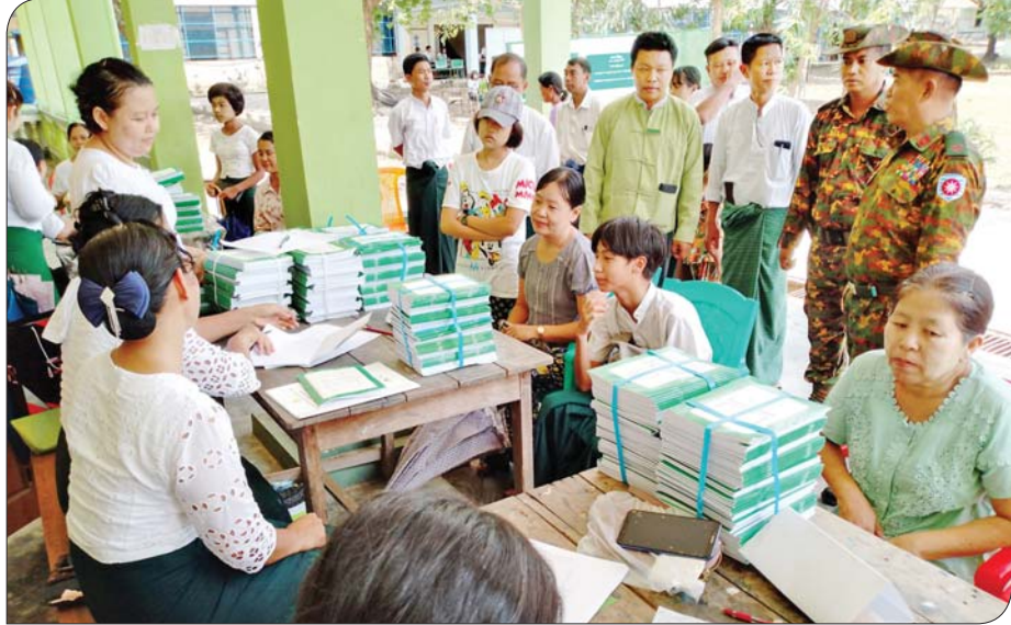
ရခိုင်ပြည်နယ် အထက(မြေပုံ)၌ ကျောင်းအပ်လက်ခံရေး ဆောင်ရွက်ပေးစဉ်။

အမိုးအကာအောက် အမြန်ဆုံး အေးအေးချမ်းချမ်း သာယာယာနေနိုင် အောင် ဆောင်ရွက်ပေးတယ်။ ဒါတွေ အားလုံးဟာ စိတ်ကောင်းစေတနာမပါဘဲ လုပ်နိုင်မှာ မဟုတ်ပါဘူး။ တကယ့်ကိုပဲ ကောင်းမွန်တဲ့ စေတနာ၊ ချစ်ခင်တဲ့ စိတ်ဓာတ်အပြည့်အဝနဲ့ ကူညီဆောင်ရွက် ပေးခဲ့တယ်ဆိုတာ မိုခါမုန်တိုင်း ကူညီ ကယ်ဆယ်ရေးလုပ်ငန်းတွေက သက်သေ ပြနေတယ်ဆိုတာ အသေအချာပါပဲ ခင်ဗျား။ ။