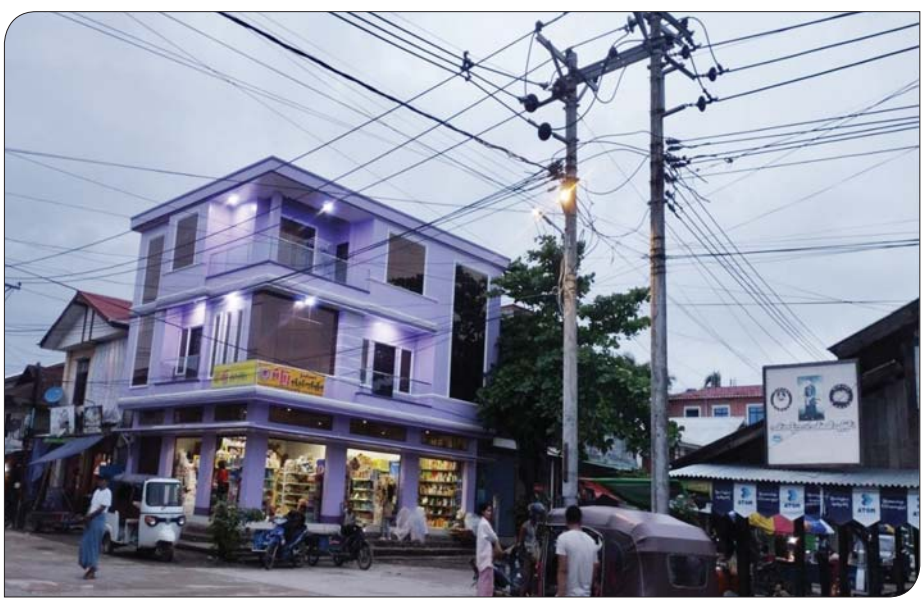
ရခိုင်ပြည်နယ် မြေပုံမြို့နယ်၌ လျှပ်စစ်မီး ရရှိနေသည်ကို တွေ့ရစဉ်။