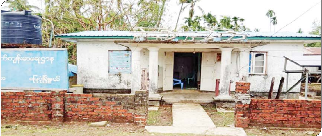
ရခိုင်ပြည်နယ် မြေပုံမြို့နယ်၌ မိုခါ မုန်တိုင်းဒဏ်ကြောင့် ပျက်စီးသွားသည့် ကျွန်းသာယာ ကျေးလက်ကျန်းမာရေး ဌာနကို တွေ့ရစဉ်။

ကြိုတင်ပြင်ဆင် မုန်တိုင်းဝင်လုဆဲဆဲ မေလ ၁၄ ရက် နေ့ နံနက်စောစောမှာတော့ နိုင်ငံတော် စီမံအုပ်ချုပ်ရေးကောင်စီဥက္ကဋ္ဌ နိုင်ငံတော် ဝန်ကြီးချုပ် ဦးစိန်စိန်ကြီး မင်းအောင်လှိုင် အမှူးပြုတဲ့ အကြီးအကဲ ပုဂ္ဂိုလ်တွေဟာ မြန်မာနိုင်ငံဘက်ကို ဝင်ရောက်တော့မယ့် မုန်တိုင်းအခြေအနေရှိနေတာကြောင့် သဘာဝဘေးအန္တရာယ် မကျရောက်မိနဲ့ ကျရောက်ပြီးအချိန်မှာ လိုအပ်တဲ့ အရေးပေါ်စီမံခန့်ခွဲခြင်း၊ တုံ့ပြန်ခြင်း၊ ကယ်ဆယ်ရေးနဲ့ ပူးပေါင်းဆောင်ရွက် ခြင်း၊ အသင့်ပြင်ဆင်စုဖွဲ့ထားရှိခြင်းနဲ့ ပြန်လည်ထူထောင်ရေးဆိုင်ရာ ကိုယ်စီ လုပ်ငန်းတာဝန်တွေ ဆောင်ရွက်ပေးနိုင်ဖို့ သဘာဝဘေးအန္တရာယ်ဆိုင်ရာ စီမံခန့်ခွဲ ရေး အရေးပေါ် အစည်းအဝေးတစ်ရပ် ကာကွယ်ရေးဦးစီးချုပ်ရုံး စုဝေးခန်းမမှာ ပြုလုပ်ခဲ့ပါတယ်။