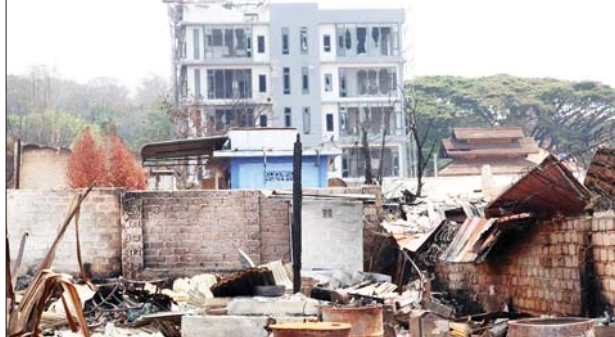
PNLO၊ KNDF၊ PDF အကြမ်းဖက်သောင်းကျန်းသူများက ဆီဆိုင် မြို့အတွင်းရှိ အဆောက်အအုံများအား မီးရှို့ဖျက်ဆီးထားသည့် မှတ်တမ်းဓာတ်ပုံ။

အကြမ်းဖက်သောင်းကျန်းသူ အလောင်းအချို့နှင့် လက်နက်၊ ခဲယမ်း၊ ဆက်စပ်ပစ္စည်းများ သိမ်းဆည်း ရရှိခဲ့ပြီး စစ်သည်အချို့၊ ပြည်သူ့စစ်(ဌာန) တပ်ဖွဲ့ဝင်အချို့နှင့် ဒေသခံတိုင်းရင်းသားအချို့ ထိခိုက်ဒဏ်ရာရရှိခဲ့သည်။ ယခုကဲ့သို့ ဆီဆိုင်ဒေသအား PNLO၊ KNDF၊ KPDF အကြမ်းဖက်ပူးပေါင်းအဖွဲ့များ၏ လက်မှ အမြန်ဆုံးပြန်လည်ရယူထိန်းချုပ်နိုင်ခဲ့ပြီး နိုင်ငံတော် အစိုးရ၏ ပြန်လည်ထူထောင်ရေးလုပ်ငန်းများ ဆောင်ရွက်နိုင်ခဲ့ခြင်းသည် ဒေသခံတိုင်းရင်းသား ပြည်သူများအနေဖြင့် တပ်မတော်၊ ပြည်သူ့စစ်(ဌာန) တပ်ဖွဲ့ဝင်များနှင့် အားတက်သရော အသက်စွန့်၍ ဒေသအကျိုးအတွက် ပူးပေါင်းဆောင်ရွက်ခဲ့ခြင်း ကြောင့်ပင်ဖြစ်ကြောင်း သိရသည်။ သတင်းစဉ်