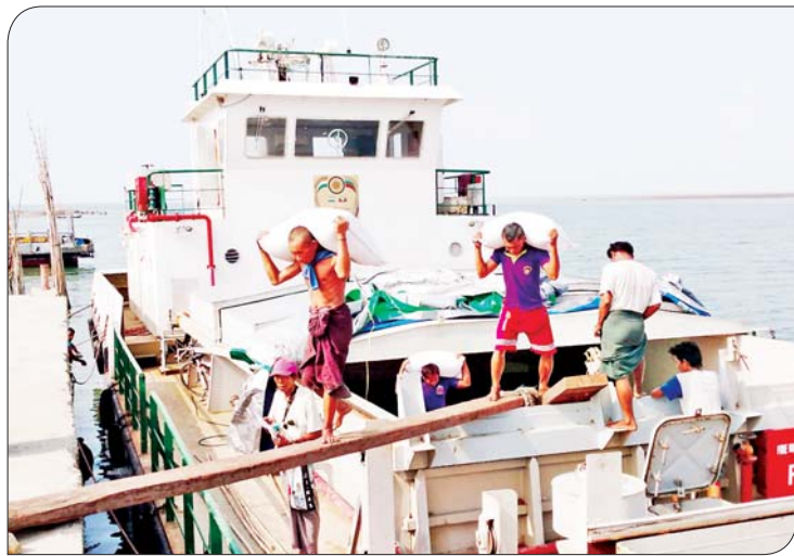
ရခိုင်ပြည်နယ် မြေပုံမြို့နယ် ငှက်ပင်လယ်ဆိပ်ကမ်းသို့ ရောက်ရှိလာသော စားရေရိက္ခာများအား ပြောင်းရွှေ့နိုင်ရေး ဆောင်ရွက်နေစဉ်။

မိုခါမုန်တိုင်းဒဏ်ခံရတဲ့ မြို့နယ်တွေထဲမှာ မြေပုံမြို့နယ်လည်း အပါအဝင်ဖြစ်ပါတယ်။ မုန်တိုင်းအပြီး ထိခိုက်ပျက်စီးမှုစာရင်း ကောက်ကြည့်လိုက်တော့ လူသေဆုံးမှု တစ်ဦးသာ ရှိပါတယ်။ တိရစ္ဆာန်သေဆုံးမှု အနေနဲ့ကတော့ ကျွဲ ၃၇ ကောင်၊ နွား အကောင် ၂၀၊ ဝက် ၁၅ ကောင်ဆိုတော့ အခြားမြို့နယ်တွေနဲ့စာရင် ထိခိုက်မှု အနည်းဆုံးလို့ ဆိုနိုင်ပါတယ်။