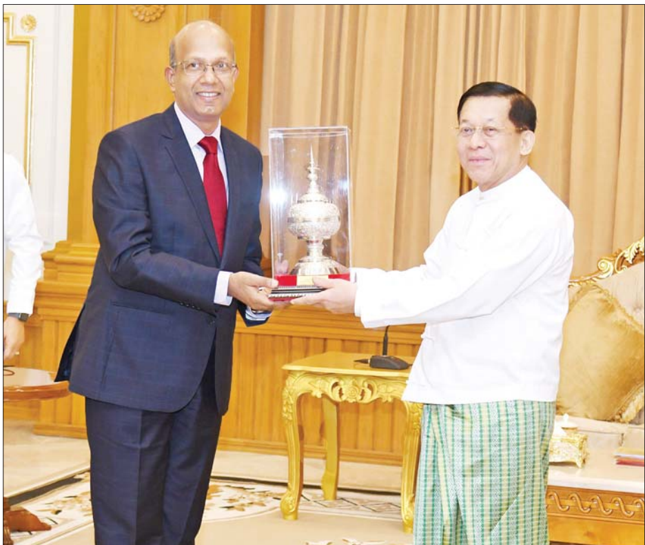
နိုင်ငံတော်စီမံအုပ်ချုပ်ရေးကောင်စီဥက္ကဋ္ဌ နိုင်ငံတော်ဝန်ကြီးချုပ် ဗိုလ်ချုပ်မှူးကြီး မင်းအောင်လှိုင် မြန်မာနိုင်ငံဆိုင်ရာ အိန္ဒိယနိုင်ငံသံအမတ်ကြီး H.E. Mr. Vinay Kumar အား ရင်းရင်းနှီးနှီးနှုတ်ဆက်စဉ်။