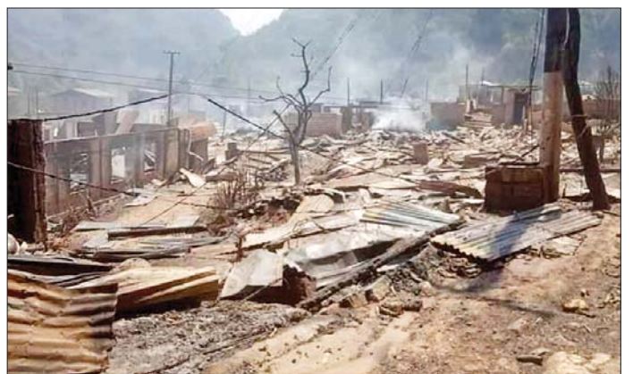
ရှမ်းပြည်နယ်(တောင်ပိုင်း) ဟိုပုံးမြို့နယ် မဲနယ်တောင်ဒေသရှိ ပအိုဝ်းတိုင်းရင်းသားများနေထိုင်သည့် ကျေးရွာများအား PNLO၊ KDNF၊ PDF အကြမ်းဖက် သောင်းကျန်းသူများက နေအိမ်အဆောက်အအုံများအား မီးရှို့ဖျက်ဆီးခဲ့သည့် မှတ်တမ်းဓာတ်ပုံများ။

သည့် မြို့၊ ရွာများ သန့်ရှင်းသာယာလှပရေးအတွက် မြန်မာနိုင်ငံရဲတပ်ဖွဲ့ဝင်များ၊ ဌာနဆိုင်ရာဝန်ထမ်းများ၊ ပြည်သူ့စစ်(ဌာန)တပ်ဖွဲ့ဝင်များ၊ ဒေသခံတိုင်းရင်း သားများနှင့်အတူ ပြန်လည်ထူထောင်ရေးလုပ်ငန်း များနှင့် စုပေါင်းသန့်ရှင်းရေးလုပ်ငန်းများကို ပိုင်းဝန်း ကူညီဆောင်ရွက်ပေးပြီး သက်ဆိုင်ရာ တာဝန်ရှိသူ များက ထောက်ပံ့ပစ္စည်းများနှင့် ထောက်ပံ့ငွေများ ပေးအပ်လျက်ရှိသည်။