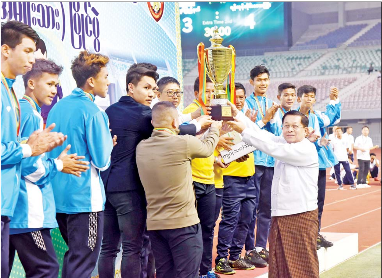
နိုင်ငံတော်စီမံအုပ်ချုပ်ရေးကောင်စီဥက္ကဋ္ဌ နိုင်ငံတော်ဝန်ကြီးချုပ် ဗိုလ်ချုပ်မှူးကြီး မင်းအောင်လှိုင် ပထမဆုရရှိသည့် ရန်ကုန်တိုင်းဒေသကြီးအသင်းအား ဂုဏ်ပြုချီးမြှင့်ငွေနှင့် တံခွန်စိုက်ဖလားတို့ကို ပေးအပ်ချီးမြှင့်စဉ်။

၂၀၂၄ ခုနှစ် ပြည်နယ်နှင့်တိုင်းဒေသကြီး U-25 ဘောလုံးပြိုင်ပွဲ(အမျိုးသား) ဗိုလ်လုပွဲစဉ်အဖြစ် ကချင်ပြည်နယ်အသင်းနှင့် ရန်ကုန်တိုင်းဒေသကြီးအသင်းတို့ ယှဉ်ပြိုင်ကစားခဲ့ကြသည်။ အချိန်ကြာရာ အဆိုပါအသင်းများသည် ဗိုလ်လုပွဲသို့တက်ရောက်လာကြသည့် အသင်းများဖြစ်သည်နှင့်အညီ တစ်ဖက်နှင့်တစ်ဖက်အပြန်အလှန်ဖိအားပေး အကြိတ်အနယ်ယှဉ်ပြိုင်ခဲ့ကြသော်လည်း သာမန်ပွဲကစားချိန် ပြီးဆုံးသည်အထိ