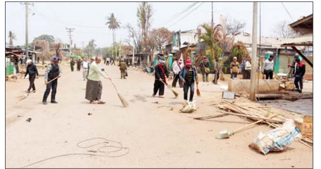
တပ်မတော်သားများ၊ မြန်မာနိုင်ငံရဲတပ်ဖွဲ့ဝင်များ၊ ဌာနဆိုင်ရာဝန်ထမ်းများ၊ ပြည်သူ့စစ်(ဌာန)တပ်ဖွဲ့ဝင်များ၊ ဒေသခံတိုင်းရင်းသားပြည်သူများ ဆီဆိုင်မြို့တွင်း စုပေါင်းသန့်ရှင်းရေးလုပ်ဆောင်နေသည့် မှတ်တမ်းဓာတ်ပုံများ။