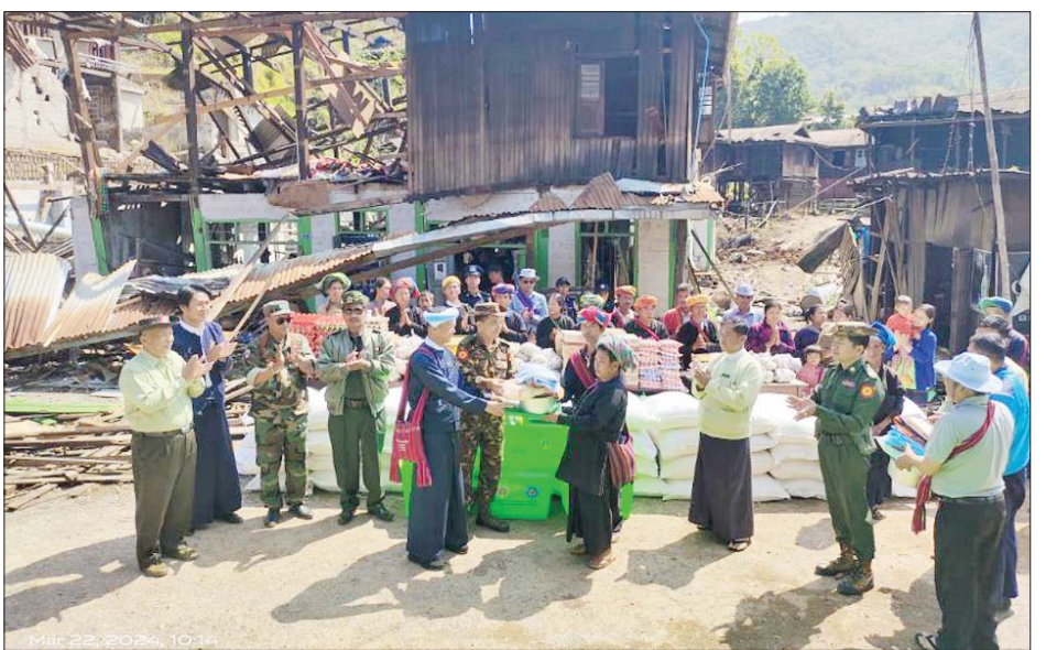
ရှမ်းပြည်နယ်(တောင်ပိုင်း) ဟိုပုံးမြို့နယ် ကျောက်ကချားကျေးရွာအတွင်းနေထိုင်သည့် ဒေသခံ တိုင်းရင်းသားပြည်သူများအား တာဝန်ရှိသူများက ထောက်ပံ့ပစ္စည်းများ ပေးအပ်စဉ်။

ထို့ပြင် ကာကွယ်ရေးဦးစီးချုပ်ရုံး(ကြည်း)မှ ဗိုလ်ချုပ် နိုင်နိုင်ဦး၊ တိုင်းမှူးနှင့် အဖွဲ့ဝင်များသည် မြို့နယ်အထွေထွေအုပ်ချုပ်ရေး ဦးစီးဌာနခန့်မည့် ဒေသခံတိုင်းရင်းသား ပြည်သူများ၊ ဌာနဆိုင်ရာ ဝန်ထမ်းများအား တွေ့ဆုံအမှာစကားပြောကြားပြီး တင်ပြချက်များအပေါ် လိုအပ်သည်များ ပေါင်းစပ် ညှိနှိုင်းဆောင်ရွက်ပေးကာ မြို့ဂုဏ်ဆောင် မွေတော် ဘုရားကြီးအတွက် အလှူငွေများ၊ ဌာနဆိုင်ရာဝန်ထမ်း