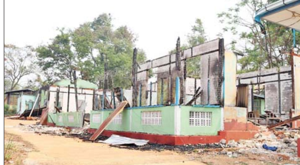
PNLO၊ KNDF၊ PDF အကြမ်းဖက်သောင်းကျန်းသူများက ဆီဆိုင် မြို့အတွင်းရှိ မြို့နယ်ကျန်းမာရေးဦးစီးမှူးရုံးအား ဖျက်ဆီးထား သည့် မှတ်တမ်းဓာတ်ပုံ။