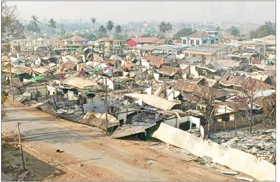
အကြမ်းဖက်သောင်းကျန်းသူများ မိုင်းထောင်ဖောက်ခွဲ မီးရှို့ဖျက်ဆီးခဲ့သည့် ဆီဆိုင်မြို့မှတ်တမ်းဓာတ်ပုံ။

နေပြည်တော် မတ် ၂၉ ရှမ်းပြည်နယ်(တောင်ပိုင်း) ဆီဆိုင်မြို့သည် ပင်လယ်ရေမျက်နှာပြင်အထက် ပေ ၃၃၁၀ တွင် တည်ရှိပြီး မြောက်ဘက်တွင် ဟိုပုံးမြို့နယ်၊ အရှေ့ဘက်တွင် မောက်မယ်မြို့နယ်၊ တောင်ဘက်တွင် ကယားပြည်နယ်၊ အနောက်ဘက်တွင် ဖယ်ခုံမြို့နယ်၊ ညောင်ရွှေမြို့နယ်၊ တောင်ကြီးမြို့နယ်တို့နှင့် နယ်နိမိတ်ချင်း ထိစပ်လျက်ရှိပြီး ပအိုဝ်းတိုင်းရင်းသား အများစု အေးချမ်းစွာနေထိုင်လုပ်ကိုင်စားသောက်ကြ သည့် မြို့တစ်မြို့ဖြစ်သည်။