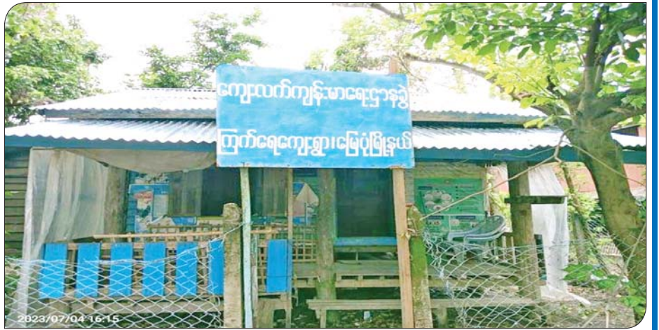
ရခိုင်ပြည်နယ် မြေပုံမြို့နယ်၌ မိုခါမုန်တိုင်းဒဏ်ကြောင့် ပျက်စီးသွားသည့် ကြက်ရေကျေးရွာ ကျန်းမာရေးဌာနခွဲ(ဝဲပုံ)နှင့် ပြန်လည်ပြုပြင်ပြီးစီးမှု(ယာပုံ)တို့ကို တွေ့ရစဉ်။

»» စာမျက်နှာ ၁၄ မှ ဆိုတာလည်း ပြိုတဲ့အိမ်တွေကပြီ၊ အမိုးလန်တဲ့အိမ်တွေက လန်ကျနဲ့ တကယ့်ကို စိတ်ချောက်ချားစရာ မြို့ပျက်ကြီးတွေ ဖြစ်နေပါလား။