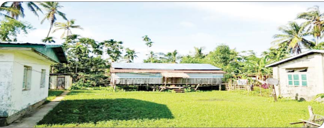
ရခိုင်ပြည်နယ် မြေပုံမြို့နယ်၌ မိုခါ မုန်တိုင်းဒဏ်ကြောင့် ပျက်စီးသွားသည့် ကျွန်းသာယာ ကျေးလက်ကျန်းမာရေး ဌာန ပြန်လည်ပြုပြင်ပြီးစီးမှုကို တွေ့ရ စဉ်။

ဦးတည်ထွက်ခွာသွားကြပါတယ်။ ကူညီကယ်ဆယ်ရေး ပစ္စည်းတွေဖြစ် တဲ့ အစားအသောက်၊ အဝတ်အထည်၊ ပန်းကန်ခွက်ယောက်နဲ့ ဆေးဝါးများပါ မကျန် တင်ဆောင်ထားတဲ့ မော်တော် ယာဉ်တန်းတွေ၊ သင်္ဘောကြီးတွေဆိုတာ လည်း စစ်တွေမြို့ကို ဦးတည်ထွက်ခွာကြ ပါတယ်။ ဒါ့အပြင် အိမ်ဆောက်ပစ္စည်းတွေ ဖြစ်တဲ့ သွပ်၊ သံ၊ သစ်၊ ဘီလပ်မြေအိတ်တွေ တင်ဆောင်ထားတဲ့ သင်္ဘောကြီးတွေဆို လည်း မနည်းမနော့ မုန်တိုင်းမကျရောက် မီနဲ့ ကျရောက်ပြီးကာလတွေမှာ နေ့စဉ် ရက်ဆက် ထွက်ခွာသွားတာ သတိပြုမိပါ တယ်။