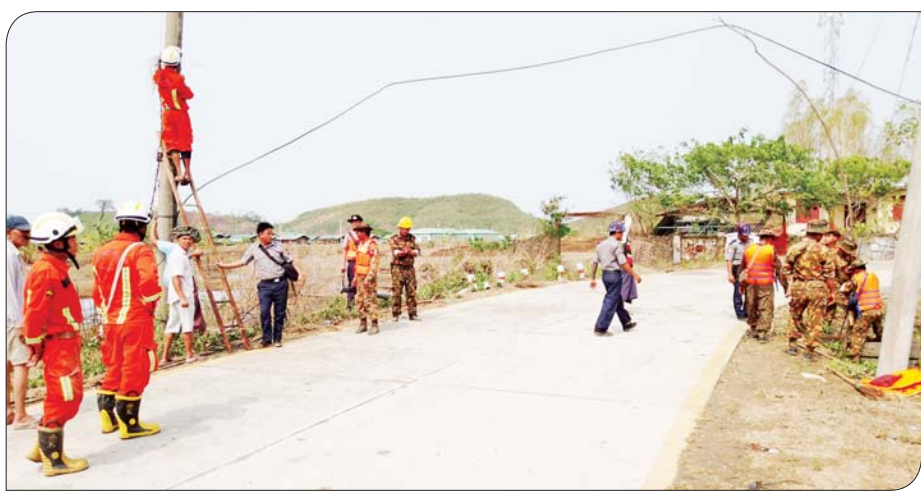
ရခိုင်ပြည်နယ် မြေပုံမြို့နယ်၌ လျှပ်စစ်မီး ရရှိရေး ဆောင်ရွက်နေသည်ကို တွေ့ရစဉ်။