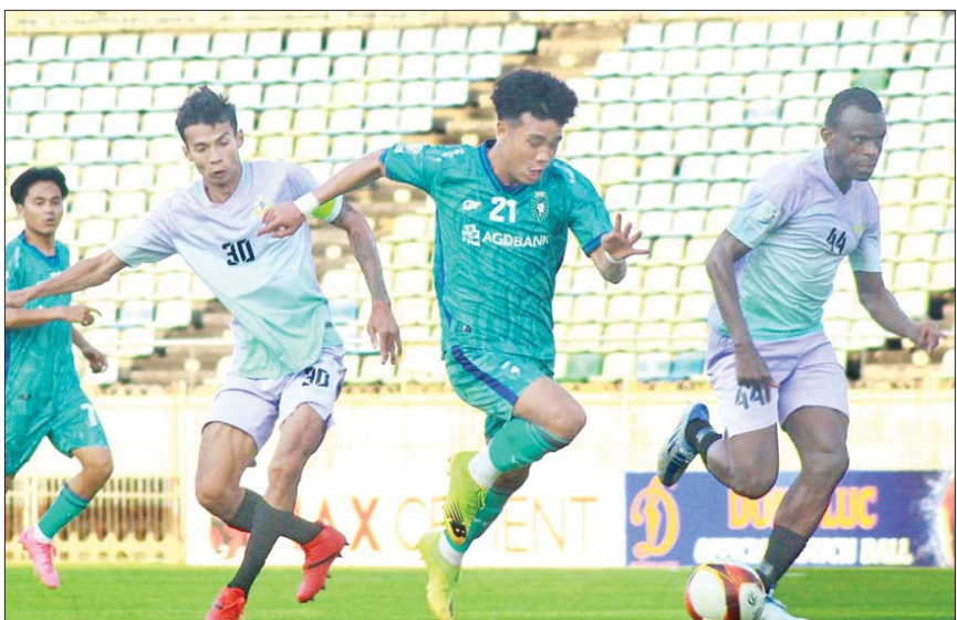
ရန်ကုန်ယူနိုက်တက်အသင်းနှင့် ရွှေပြည်သာအသင်းတို့ ယှဉ်ပြိုင်ကစားကြစဉ်။