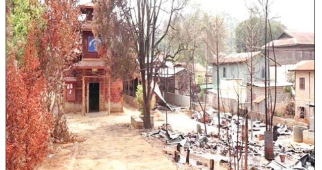
PNLO၊ KNDF၊ PDF အကြမ်းဖက်သောင်းကျန်းသူများက ဆီဆိုင် မြို့အတွင်းရှိ ခရစ်ယာန်ဘုရားရှိခိုးကျောင်းအား ဖျက်ဆီးထား သည့် မှတ်တမ်းဓာတ်ပုံ။