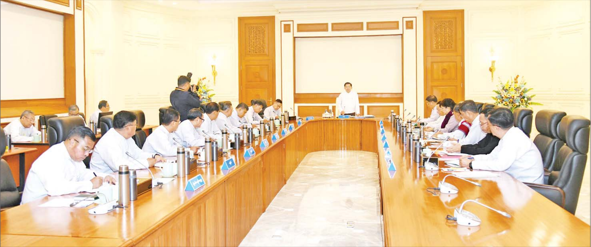
နိုင်ငံတော်စီမံအုပ်ချုပ်ရေးကောင်စီဥက္ကဋ္ဌ နိုင်ငံတော်ဝန်ကြီးချုပ် ဗိုလ်ချုပ်မှူးကြီး မင်းအောင်လှိုင် နိုင်ငံတော်စီမံအုပ်ချုပ်ရေးကောင်စီအစည်းအဝေး(၂/၂၀၂၄)တွင် အမှာစကားပြောကြားစဉ်။