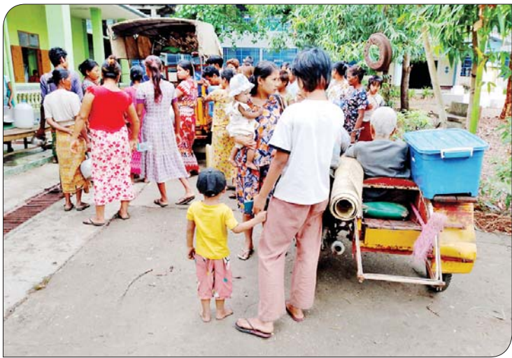
ရခိုင်ပြည်နယ် မြေပုံမြို့နယ် မုန်တိုင်းအန္တရာယ်ကျရောက်နိုင်သည့် နေရာများမှ ပြည်သူများအား ဘေးလွတ်ရာသို့ ရွှေ့ပြောင်းပေးစဉ်။

ဒီအထဲ သစ်ပင်ပိလို့ အိမ်ပေါက်ပြုတ်ကျလို့ ရေနစ်လို့ စတဲ့ ထိခိုက်သူတွေ ဆိုတာတွေလည်းရှိတော့ငိုကြွေးအော်ဟစ်သူတွေဆိုတာလည်း နေရာအနှံ့ မြင်ရတော့ရ ကြားရတော့ တကယ့်အနိဋ္ဌာရုံ မြင်ကွင်းတွေပါပဲ။ ဒီကြားထဲ နေရာဆီတော့မရှိ၊ စားစရာဆိုတာ နတ္ထိဆိုတော့ ခိုင်မာတဲ့ တိုက်အိမ်သွား နားခိုမိလို့ တိုက်ပြို အုတ်နံရံပိတ်သူတွေဆိုလည်း ရှိသေး။ မုန်တိုင်းရဲ့ ရက်စက်ကြမ်းကြုတ်မှုကတော့ ပြောမကုန်အောင်ပါဘဲ။