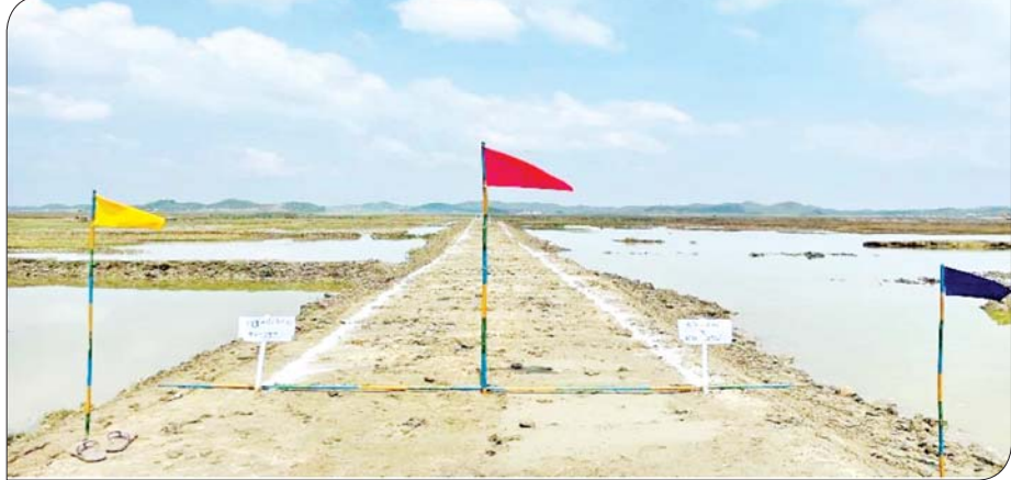
ရခိုင်ပြည်နယ် မြေပုံမြို့နယ် ကုလားပုန်းကျွန်း ရေငန်တားတာ ပြန်လည်ပြုပြင်ပြီးစီးမှုကို တွေ့ရစဉ်။