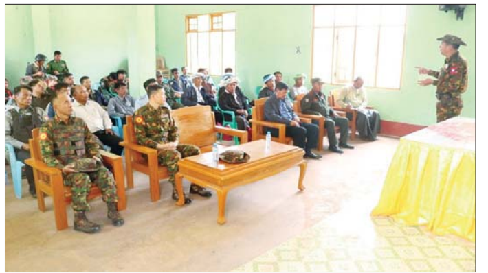
ကာကွယ်ရေးဦးစီးချုပ်ရုံး(ကြည်း)မှ ဗိုလ်ချုပ်နိုင်နိုင်ဦး ဌာနဆိုင်ရာ ဝန်ထမ်းများ၊ လုံခြုံရေးတပ်ဖွဲ့ဝင်များနှင့် တွေ့ဆုံအမှာစကားပြောကြားစဉ်။

အဆိုပါဖြစ်စဉ်များတွင်လည်း ပအိုဝ်းကိုယ်ပိုင် အုပ်ချုပ်ခွင့်ရဒေသအစိုးရအဖွဲ့၏ အုပ်ချုပ်မှုအောက် ပအိုဝ်းတိုင်းရင်းသားကျေးရွာတိုင်းမှ ကျေးရွာလူထု အားလုံးနီးပါးက လုံခြုံရေးတပ်ဖွဲ့ဝင်များ၊ ပြည်သူ့ စစ်(ဌာန)တပ်ဖွဲ့ဝင်များဖြင့် ပူးပေါင်းလက်တွဲ၍ ဆောင်ရွက်ခဲ့ခြင်းကြောင့်လည်း ယခုကဲ့သို့ အချိန်တို အတွင်း အကြမ်းဖက်သောင်းကျန်းသူများအား တိုက်ခိုက်ချေမှုန်းနိုင်ခဲ့ခြင်း ဖြစ်သည်။ ပြန်လည်ထိန်းချုပ်နိုင်ခဲ့ NCA လက်မှတ်ရေးထိုးသော်လည်း ဒေသခံ မဟုတ်သည့် အခြားသော အကြမ်းဖက်သောင်းကျန်း သူများ၏ မြောက်ပိုင်းစည်းရုံးမှုအပေါ် အာဏာတည် ဆောက်နိုင်ရေး စိတ်ကူးယဉ်မှုနှင့်အတူ PNLO အကြမ်းဖက်အဖွဲ့၏ မိမိလူမျိုးချင်းအပေါ် သစ္စာမဲ့စွာ လုပ်ဆောင်ခဲ့သည့် အကြမ်းဖက်လုပ်ရပ်များအပေါ်