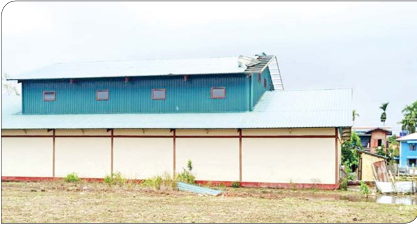
ရခိုင်ပြည်နယ် မြေပုံမြို့နယ်၌ မိုခါမုန်တိုင်းဒဏ်ကြောင့် ပျက်စီးသွားသည့် အားကစားခန်းမ ခေါင်မိုး(ဝဲပုံ)နှင့် ပြန်လည်ပြုပြင်ပြီးစီးမှု(ယာပုံ)တို့ကို တွေ့ရစဉ်။

နောက်ပိုင်း ရက်များမှာလည်း ဗိုလ်မှူးချုပ်ကျော်ကျော်စိုးနဲ့ မြို့နယ် တာဝန်ရှိသူတွေဟာ ရခိုင်ပြည်နယ်