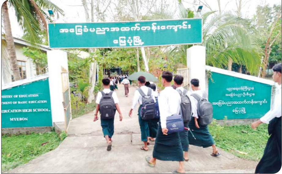
ရခိုင်ပြည်နယ် အထက(မြေပုံ)၌ ကျောင်းသား ကျောင်းသူများ ကျောင်းတက်ရောက်မှုကို တွေ့ရစဉ်။