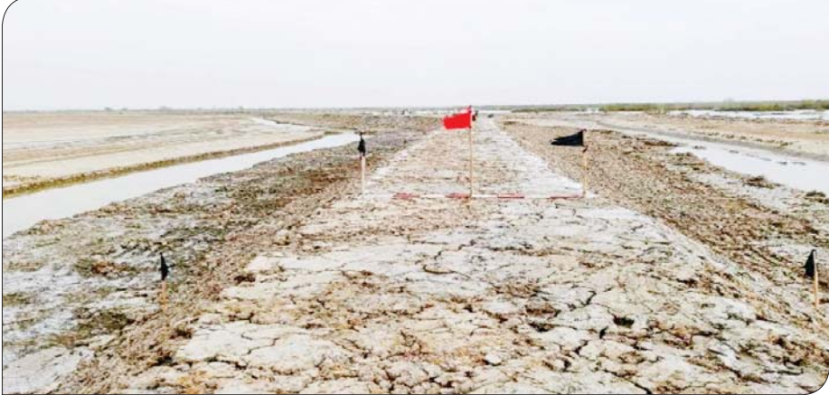
ရခိုင်ပြည်နယ် မြေပုံမြို့နယ် ငမန်းရဲကျွန်းရေငန်တားတာ ပြန်လည်ပြုပြင်ပြီးစီးမှုကို တွေ့ရစဉ်။