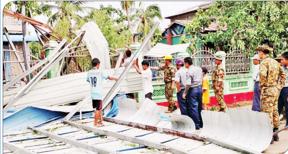
ရခိုင်ပြည်နယ် မြေပုံမြို့နယ်၌ စုပေါင်းသန့်ရှင်းရေးလုပ်ငန်းများ ဆောင်ရွက်နေစဉ်။

ဗိုလ်မှူးချုပ်ကျော်ကျော်စိုးနဲ့ တာဝန် ရှိသူတွေဟာ မေလ ၂၇ ရက်နေ့မှာတော့ ရခိုင်ပြည်နယ်အစိုးရရဲ့ သဘာဝဘေး ပြန်လည်ထူထောင်ရေး ကော်မတီနဲ့ အလှူရှင်တွေ ထောက်ပံ့တဲ့ ဆန် ၁၀၄၅ အိတ်၊ ဆီ ငါးလီတာဘူး ၂၅၇ ဘူး၊ ခေါက်ဆွဲ ခြောက် ၆၅ ဖာ၊ ဘဲဥအလုံး ၂၅၅၀၊ သွားတိုက်ဆေးဘူး ၂၂၀၀၊ သွားတိုက်တံ ၂၄၀ တို့ကို လေဘေးသင့်ပြည်သူတို့ထံ အမြန်ဆုံးရောက်ရှိရေး ညှိနှိုင်းပေးစီမံ ဆောင်ရွက်ခဲ့ကြောင်း၊ မေလ ၂၈ ရက်နေ့ မှာလည်း ရခိုင်ပြည်နယ်အစိုးရနှင့် စာမျက်နှာ ၁၆ သို့ »»