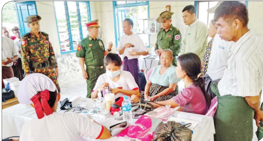
ရခိုင်ပြည်နယ် မြေပုံမြို့နယ်၌ လေဘေးသင့်ပြည်သူများအား ဆေးကုသပေးစဉ်။