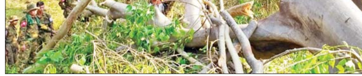
ရခိုင်ပြည်နယ် မြောက်ဦးမြို့နယ်၌ မိုခါမုန်တိုင်းဒဏ်ကြောင့် ကျိုးပဲ့နေသည့် သစ်ပင်သစ်ကိုင်းများအား တပ်မတော်သားများက ခုတ်ထွင်ရှင်းလင်းခြင်းလုပ်ငန်း များ ဆောင်ရွက်နေစဉ်။