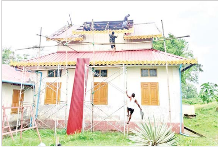
ရခိုင်ပြည်နယ် မြောက်ဦးမြို့နယ်၌ မိုခါမုန်တိုင်းဒဏ်ကြောင့် ပျက်စီးသွားသည့် မြောက်ဦးပြတိုက်ဘုရားခန်းခေါင်မိုးကို တွေ့ရစဉ်။

အမျိုးသား သဘာဝဘေးအန္တရာယ်ဆိုင်ရာ စီမံခန့်ခွဲမှုကော်မတီကွပ်ကဲမှုအောက်ရှိ ရှာဖွေကယ်ဆယ်ရေးလုပ်ငန်းကော်မတီများအနေဖြင့် မုန်တိုင်းဘေးအန္တရာယ် ကျရောက်နိုင်သည့် လမ်းကြောင်းပေါ်တွင် နေထိုင်ကြသည့် စာမျက်နှာ ၁၃ သို့။»