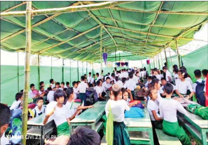
ရခိုင်ပြည်နယ် မြောက်ဦးမြို့နယ်၌ မိုခါမုန်တိုင်းဒဏ်ကြောင့် ကျောင်းသား ကျောင်းသူများ ပညာသင်ကြားမှု အဆင်ပြေစေရန်အတွက် အထက(နတ်ချောင်း)နှင့် အထက(အောင်စည်မောင်း)တို့တွင် ယာယီစာသင်ဆောင်များ ဆောက်လုပ်၍ ပညာသင်ကြားပေးခဲ့သည်ကို တွေ့ရစဉ်။

အခက်အခဲဖြစ် မြောက်ဦးမြို့နယ်တွင် ဆေးရုံ၊ ဆေးခန်း ရှစ်ခု၊ ကျေးလက်ကျန်းမာရေးစာမျက်နှာ ၁၄ သို့ »»