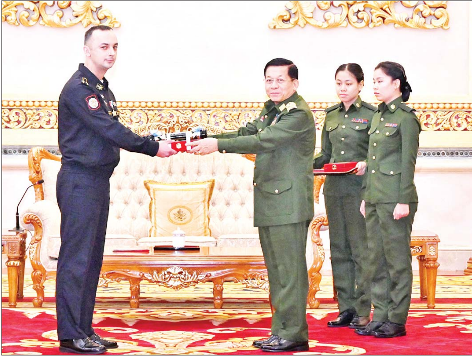
နိုင်ငံတော်စီမံအုပ်ချုပ်ရေးကောင်စီဥက္ကဋ္ဌ တပ်မတော်ကာကွယ်ရေးဦးစီးချုပ် ဗိုလ်ချုပ်မှူးကြီး မင်းအောင်လှိုင် “သီရိသီဟကျော်တံဆိပ်” ရရှိသူ Captain 2 nd rank SHILKOV Vitaly Vasilyevich အား ဘွဲ့တံဆိပ်နှင့် အဆောင်အယောင် ချီးမြှင့်အပ်နှင်းစဉ်။