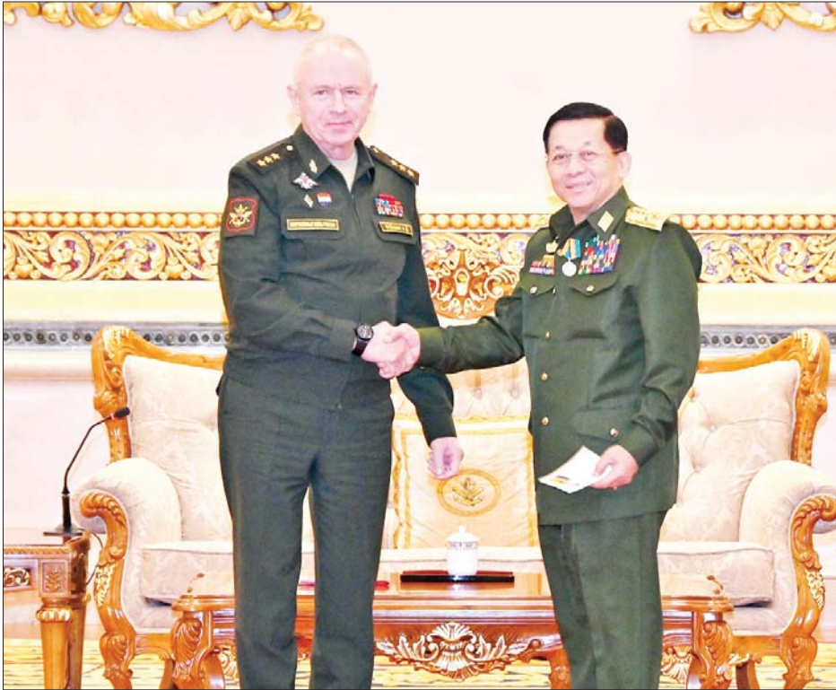
နိုင်ငံတော်စီမံအုပ်ချုပ်ရေးကောင်စီဥက္ကဋ္ဌ တပ်မတော်ကာကွယ်ရေးဦးစီးချုပ် ဗိုလ်ချုပ်မှူးကြီး မင်းအောင်လှိုင်ထံ ရုရှားဖက်ဒရေးရှင်းနိုင်ငံ ကာကွယ်ရေးဝန်ကြီးဌာန ဒုတိယဝန်ကြီး Colonel General Alexander Vasilievich Fomin က “နိုင်ငံတကာ စစ်ဘက်ပူးပေါင်းဆောင်ရွက်မှု ဖွံ့ဖြိုးတိုးတက်ရေး စွမ်းဆောင်ရည်ဆိုင်ရာ” ဂါရဝပြုချီးမြှင့်အပ်နှင်းစဉ်။