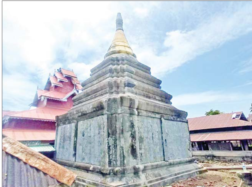
ရခိုင်ပြည်နယ် မြောက်ဦးမြို့နယ်၌ မိုခါမုန်တိုင်းဒဏ်ကြောင့် ပျက်စီးသွားသည့် မဟာထီးစေတီ ထီးတော် ပြန်လည်ပြုပြင်ပြီးစီးမှုကို တွေ့ရစဉ်။

မြောက်ဦးမြို့နယ်အတွင်းရှိ ရုံးအဆောက်အအုံများ၊ လူနေအိမ်များများသောအားဖြင့် အမိုးလန်ပြိုကျပျက်စီးသွားခဲ့သည်။ ထို့အပြင် ဓာတ်တိုင်များ၊ သစ်ပင်များ ကျိုးကျပြိုလဲခြင်း၊ ဆက်သွယ်ရေးလှိုင်းများ ပြတ်တောက်ခြင်း၊ သာသနိက အဆောက်အအုံများ ဖြစ်သည့် ဘုရား၊ စေတီ၊ ပုထိုးများနှင့် ဘုန်းတော်ကြီးကျောင်းများ ပျက်စီးခြင်း၊ စာသင်ကျောင်းများ၊ ကျန်းမာရေးဆေးခန်းများ၊ တိုက်နယ်ဆေးရုံများ၊ ယာယီခိုလှုံရာ စခန်းများ၊ ဆန်စက်များ၊ မွေးမြူရေး ကြက်ခြံများ၊ မြို့မဈေးကြီးအတွင်းရှိ ဈေးဆိုင်ခန်းများ စသည်ဖြင့် တစ်မြို့နယ်လုံးရှိ အဆောက်အအုံများ ကြေမှုပျက်စီးသွားခဲ့သည်။