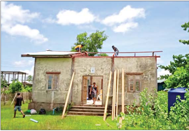
ရခိုင်ပြည်နယ် မြောက်ဦးမြို့နယ်၌ မိုခါမုန်တိုင်းဒဏ်ကြောင့် ကျောက်ကျပ်ဆေးခန်း အဆောက်အအုံ ပျက်စီးမှု(အပေါ်ပုံ)နှင့် ပြန်လည်ပြုပြင်ပြီးစီးမှု(အောက်ပုံ)တို့ကို တွေ့ရစဉ်။

ပြည်သူများအား ဘေးလွတ်ရာ နေရာများသို့ ကူညီရွှေ့ပြောင်းပေးထားသဖြင့် မြောက်ဦးမြို့နယ်အတွင်းမှ ပြည်သူများ ထိခိုက် သေဆုံးမှုအန္တရာယ်မှ ကင်းဝေးခဲ့ကြသည်။ မုန်တိုင်းသင့်ဒေသများတွင် မုန်တိုင်းမကျရောက်မီ၊ မုန်တိုင်းကျရောက်စဉ်နှင့် မုန်တိုင်းကျရောက်ပြီး ကာလတစ်လျှောက်တွင် တပ်မတော်သားများ၊ မြန်မာနိုင်ငံရဲတပ်ဖွဲ့ဝင်များ၊ သန္ဓေမီးသတ်တပ်ဖွဲ့ဝင်များ၊ စေတနာ့ဝန်ထမ်းများ၏ ဂုဏ်ယူဝင်ကြွား စေတနာထက်သန်စွာဖြင့် ကူညီကယ်ဆယ်စောင့်ရှောက်ပေးမှုများသည် မုန်တိုင်းသင့်ပြည်သူများအတွက် အားဖြစ်စေသည်။