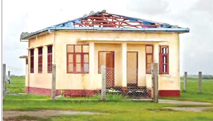
ရခိုင်ပြည်နယ် မြောက်ဦးမြို့နယ်၌ မိုခါမုန်တိုင်းဒဏ်ကြောင့် နတ်ချောင်းနှစ်ခန်းတွဲ ဝန်ထမ်းနေအိမ်ပျက်စီးမှုကို တွေ့ရစဉ်။