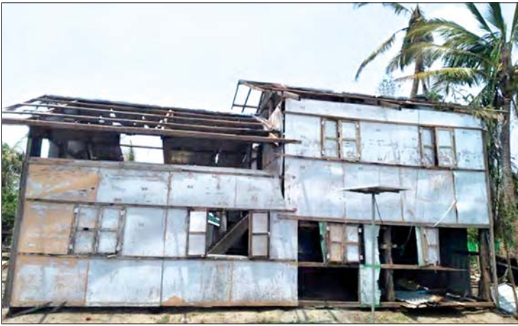
ရခိုင်ပြည်နယ် မြောက်ဦးမြို့နယ်၌ မိုခါမုန်တိုင်းဒဏ်ကြောင့် ညောင်ပင်လယ် ဆေးခန်းပျက်စီးမှု(အပေါ်ပုံ)နှင့် ပြန်လည်ပြုပြင်ပြီးစီးမှု(အောက်ပုံ)တို့ကို တွေ့ရစဉ်။

ဆေးခန်း ၂၀ စုစုပေါင်း ကျန်းမာရေး အဆောက်အအုံ ၂၈ ခု ပျက်စီးဆုံးရှုံးခဲ့သည်။ မြောက်ဦးမြို့နယ်တိုင်းရင်းဆေးကု ဌာနကလည်း မြို့နယ်အတွင်းရှိ ကျေးရွာ နေပြည်သူများအား ကျန်းမာရေး အသိပညာပေးခြင်း၊ တိုင်းရင်းဆေးဝါး များ လှူဒါန်းခြင်းတို့ကို ပြုလုပ်ပေးခဲ့ သည်။ ကျန်းမာရေးဝန်ထမ်းများက ကုသ ပေးကြသည်။ မိုခါမုန်တိုင်းတိုက်ခတ်မှု ကြောင့် မြောက်ဦးမြို့နယ်အတွင်းရှိ ရေအရင်းအမြစ်များ ဆုံးရှုံးပျက်စီးသွား ခဲ့သည်။ မြို့နယ်အတွင်းရှိ တာအရှည်ပေ ၈၀၁၁၉ ပေ၊ ရေတွင်း လေးတွင်း၊ ရေကန် ၈၇ ကန် ပျက်စီးသွားခဲ့သည်။ ပြည်သူများ အားထားသောကန်များ ရေတွင်း၊ ရေကန် များ ပျက်စီးသွားသဖြင့် များစွာအခက် အခဲဖြစ်ကြရသည်။