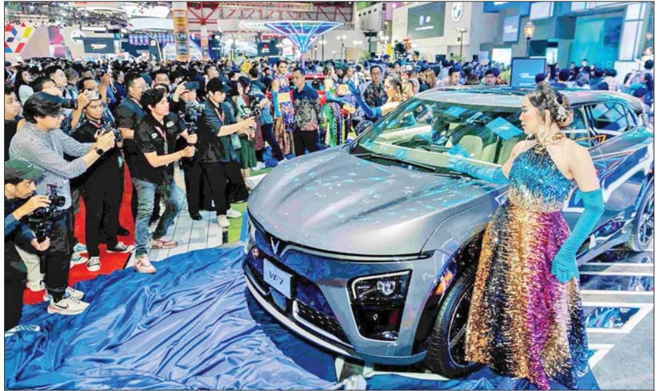
နာမည်ကြီးသည့် လျှပ်စစ်ပစ်ကပ် ထရပ်ကား၏ အမျိုးအစားကို စတင်ထုတ်လုပ်ရန် Isuzu Motors ရှေ့ပြေးပုံစံသစ်တစ်မျိုးကို ထုတ်ဖော်ပြသခဲ့ ကုမ္ပဏီက စီစဉ်ထားကြောင်း သိရသည်။ ကိုးကား - အင်န်အိတ်ချီကော ဘာသာပြန် - အောင်ကျော်ကျော် ၂၀၂၅ ခုနှစ်တွင် ထိုင်းနိုင်ငံတွင်း၌ အဆိုပါ

ပြသခဲ့သည်။ ဗီယက်နမ် လျှပ်စစ်ကားထုတ်လုပ် ရေး ကုမ္ပဏီ VinFast သည် ယခုနှစ်အတွင်း ထိုင်းဈေးကွက်အတွင်းသို့ စတင်ဝင်ရောက်ခြင်း ဖြစ်သည်။ ထုတ်ဖော်ပြသ အလားတူ တောင်ကိုရီးယား လျှပ်စစ်ကား ထုတ်လုပ်ရေးကုမ္ပဏီ Hyundai Motor သည် ၎င်း၏ လျှပ်စစ်ကား အမျိုးမျိုးကို ပြပွဲတွင် ထုတ်ဖော်ပြသ ခဲ့သည်။ ဂျပန်မော်တော်ကား ထုတ်လုပ်ရေးကုမ္ပဏီ များသည် ထိုင်းနိုင်ငံ၌ ဈေးကွက်ဝေစု ၉၀ ရာခိုင်နှုန်း ခန့်ကို ကာလအတန်ကြာ ထိန်းသိမ်းထားနိုင်ခဲ့သော် လည်း ပမာဏအားဖြင့် ယမန်နှစ်အတွင်း ၈၀ ရာခိုင် နှုန်းအောက်သို့ လျော့ကျခဲ့ကြောင်း Toyota Motor မှ တာဝန်ရှိသူတစ်ဦးက ဆိုသည်။ Isuzu Motors ကုမ္ပဏီသည် ထိုင်းနိုင်ငံတွင်