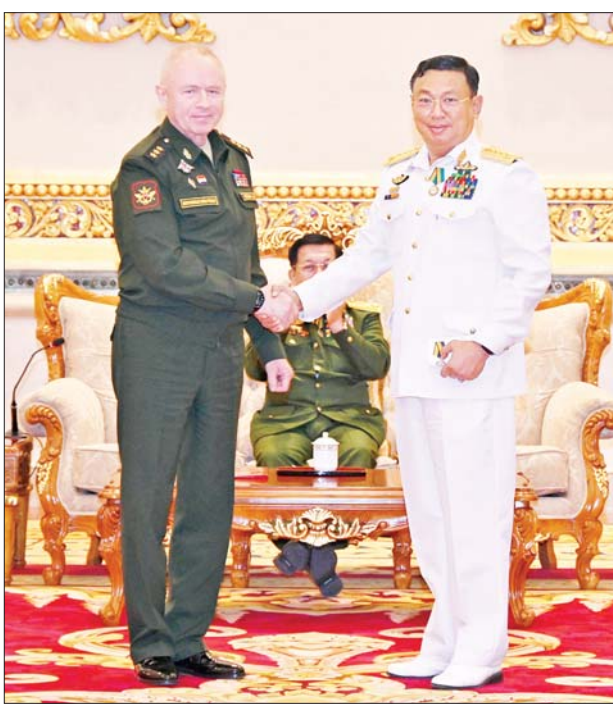
ရုရှားဖက်ဒရေးရှင်းနိုင်ငံ ကာကွယ်ရေးဝန်ကြီးဌာန ဒုတိယဝန်ကြီး Colonel General Alexander Vasilievich Fomin က ဗိုလ်ချုပ်ကြီး မိုးအောင်ထံ “နိုင်ငံတကာ စစ်ဘက်ပူးပေါင်းဆောင်ရွက်မှု ဖွံ့ဖြိုးတိုးတက်ရေး စွမ်းဆောင်ရည်ဆိုင်ရာ” ချီးမြှင့်အပ်နှင်းစဉ်။

ယင်းနောက် ရုရှားဖက်ဒရေးရှင်းနိုင်ငံ ကာကွယ်ရေးဝန်ကြီးဌာန ဒုတိယဝန်ကြီးက “တိုက်ပွဲဝင် သွေးသောက်စိတ် မြှင့်တင်မှု ဆုတံဆိပ်” ချီးမြှင့်ခြင်းခံရသည့် ဗိုလ်ချုပ်ကြီး ထွန်းအောင်နှင့် အဆင့်မြင့်တပ်မတော်အရာရှိကြီးများကို ဆုတံဆိပ်များ တစ်ဦးချင်း ချီးမြှင့်အပ်နှင်းသည်။