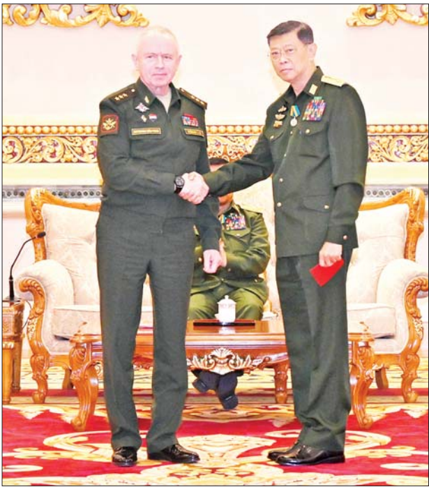
ရုရှားဖက်ဒရေးရှင်းနိုင်ငံ ကာကွယ်ရေးဝန်ကြီးဌာန ဒုတိယဝန်ကြီး Colonel General Alexander Vasilievich Fomin က ဗိုလ်ချုပ်ကြီး မြထွန်းဦးထံ “နိုင်ငံတကာ စစ်ဘက်ပူးပေါင်းဆောင်ရွက်မှု ဖွံ့ဖြိုးတိုးတက်ရေး စွမ်းဆောင်ရည်ဆိုင်ရာ” ချီးမြှင့်အပ်နှင်းစဉ်။