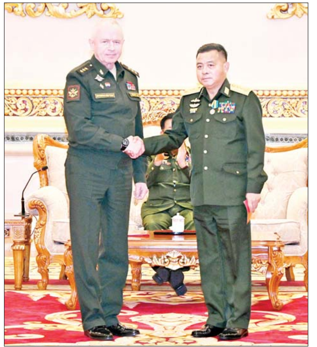
ရုရှားဖက်ဒရေးရှင်းနိုင်ငံ ကာကွယ်ရေးဝန်ကြီးဌာန ဒုတိယဝန်ကြီး Colonel General Alexander Vasilievich Fomin က ဒုတိယဗိုလ်ချုပ်ကြီး ရဲဝင်းဦးထံ “နိုင်ငံတကာ စစ်ဘက်ပူးပေါင်းဆောင်ရွက်မှု ဖွံ့ဖြိုးတိုးတက်ရေး စွမ်းဆောင်ရည်ဆိုင်ရာ” ချီးမြှင့်အပ်နှင်းစဉ်။

☆ စာမျက်နှာ ၃ မှ ဆက်လက်၍ ရုရှားဖက်ဒရေးရှင်းနိုင်ငံ ကာကွယ်ရေးဝန်ကြီးဌာန ဒုတိယဝန်ကြီး Colonel General Alexander Vasilievich Fomin က “နိုင်ငံတကာ စစ်ဘက်ပူးပေါင်းဆောင်ရွက်မှု ဖွံ့ဖြိုးတိုးတက်ရေး စွမ်းဆောင်ရည်ဆိုင်ရာ” ချီးမြှင့်အပ်နှင်းခြင်းခံရသည့် နိုင်ငံတော်စီမံအုပ်ချုပ်ရေးကောင်စီဥက္ကဋ္ဌ တပ်မတော်ကာကွယ်ရေးဦးစီးချုပ် ဗိုလ်ချုပ်မှူးကြီး မင်းအောင်လှိုင်ထံ ဆုတံဆိပ်ကို ဂါရဝပြု ချီးမြှင့်အပ်နှင်းသည်။