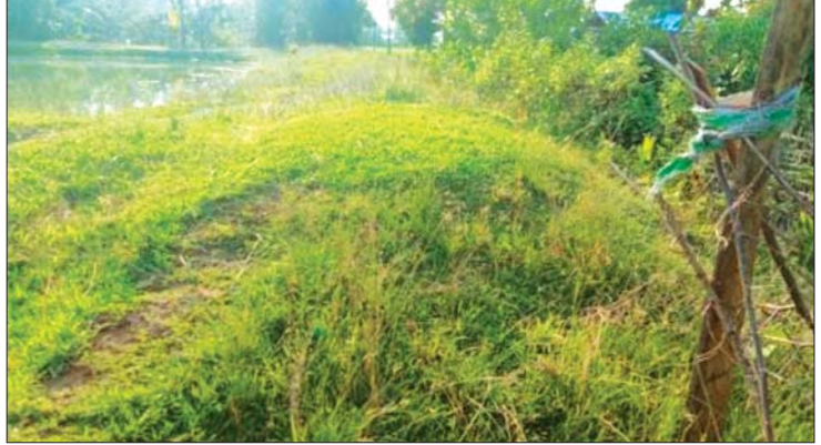
ရခိုင်ပြည်နယ် မြောက်ဦးမြို့နယ် ကျောက်ကျပ်ကျေးရွာ သောက်သုံးရေကန် တာပေါင်မြင့်တင်ခြင်းလုပ်ငန်း မဆောင်ရွက်မီ(အပေါ်ပုံ)နှင့် ဆောင်ရွက်ပြီးစီးမှု (အောက်ပုံ)တို့ကို တွေ့ရစဉ်။

ပုဏ္ဏားကျွန်း၊ ကျောက်တော်၊ မင်းပြား၊ မြေပုံ၊ ပေါက်တောနှင့် ရေသေတောင်မြို့တို့ ရှိ လျှပ်စစ်မီးတိုင်များအားလုံး ပျက်စီးသွား ခဲ့ပြီး မီးများပြတ်တောက်သွားခဲ့သည်။ ပြတ်တောက်သွားသော လျှပ်စစ်ပိုင်း ဆိုင်ရာတို့ကို ဝန်ထမ်းများက အင်တိုက် အားတိုက် ဆောင်ရွက်ခဲ့ကြသောကြောင့် ဇွန်လ ၂၃ ရက်နေ့ နံနက် ၁၁ နာရီ ၂၃ မိနစ်မှစ၍ မြောက်ဦးမြို့နှင့် ပတ်ဝန်းကျင် ကျေးရွာများတွင် လျှပ်စစ်မီး ရာနန်းပြည့် ရရှိသဖြင့် ကျောင်းသား ကျောင်းသူများ၊ စီးပွားရေးလုပ်ငန်းရှင်များနှင့် ဒေသခံ ပြည်သူများ ဝမ်းမြောက်ပျော်ရွှင်ခဲ့ကြ သည်။