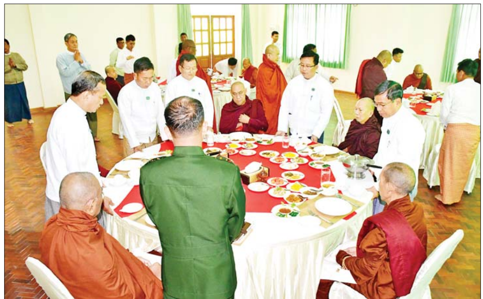
မြတ်ထံ လှူဖွယ်ပစ္စည်းများနှင့် ဆွမ်းစားစရိတ်အလှူငွေများကို ဆက်ကပ်လှူဒါန်းရာ ဆရာတော်ကြီးက အလှူရှင်ဂုဏ်ပြုမှတ်တမ်းလွှာ ပြန်လည်ချီးမြှင့်သည်။ ယင်းနောက် နေပြည်တော်ကောင်စီဝင်များနှင့် ဌာနဆိုင်ရာတာဝန်ရှိသူများက ဆရာတော်၊ သံဃာတော်များထံ လှူဖွယ်ပစ္စည်းများ ဆက်ကပ်လှူဒါန်းကြသည်။

ထို့နောက် နေပြည်တော်ကောင်စီဥက္ကဋ္ဌက ပျဉ်းမနားမြို့ ပါဠိတက္ကသိုလ် မင်္ဂလာဇေယျူကျောင်းတိုက် ပဓာနနာယကဆရာတော် အဂ္ဂမဟာပဏ္ဍိတ အဂ္ဂမဟာသဒ္ဓမ္မဇောတိကဇေ ဘဒ္ဒန္တဝိမလဗုဒ္ဓိ မထေရ်