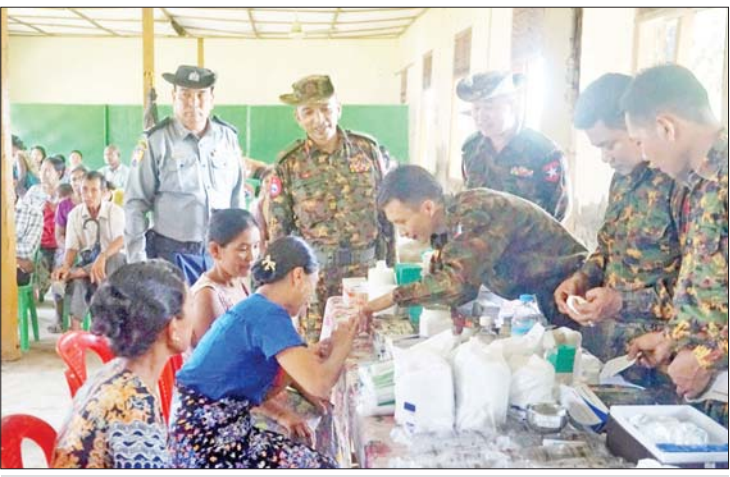
ရခိုင်ပြည်နယ် မြောက်ဦးမြို့နယ်၌ မိုခါမုန်တိုင်း တိုက်ခတ်ခဲ့ပြီးနောက် အနောက်ပိုင်းတိုင်းစစ်ဌာနချုပ် နယ်လှည့်ဆေးကုသရေးအဖွဲ့ ဒေသခံပြည်သူများအား ကျန်းမာရေးစောင့်ရှောက်မှုလုပ်ငန်းများ(အခမဲ့)ဆောင်ရွက်ပေးစဉ်။

အစိုးရအဖွဲ့က ထောက်ပံ့ပေးအပ်သော ဆန်အိတ် ၆၂၁ အိတ်နှင့် ဆီ၊ ဆား၊ ငပိတို့ကို မြောက်ဦးမြို့နယ် အလယ်ချောင်းကျေးရွာ၊ ဇီပင်ကြီးကျေးရွာ၊ ရဲဖျားကျေးရွာစသည့် ကျေးရွာအုပ်စု ၁၉ အုပ်စု၊ ကျေးရွာ ၅၆ ရွာရှိ ပြည်သူ ၁၀၀၀၀ ကျော်အား ထောက်ပံ့ပေးအပ်ခဲ့သည်။ အလားတူ သဘာဝဘေးအန္တရာယ် စီမံခန့်ခွဲမှုဦးစီးဌာနကလည်း ကျေးရွာအုပ်စု လေးအုပ်စုမှ လုံးဝပျက်စီးသွားသော နေအိမ်များ ပြန်လည် တည်ဆောက်ရန်အတွက် ထောက်ပံ့ရေး ပစ္စည်း ၁၇ မျိုးကို ကျေးရွာအုပ်ချုပ်ရေးမှူးများမှတစ်ဆင့် ထောက်ပံ့ခဲ့ပြီး ကျန်ရှိသော ကျေးရွာအုပ်စုများကိုလည်း ဆက်လက်ထောက်ပံ့ပေးအပ်ခဲ့သည်။