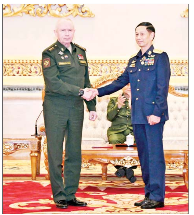
ရုရှားဖက်ဒရေးရှင်းနိုင်ငံ ကာကွယ်ရေးဝန်ကြီးဌာန ဒုတိယဝန်ကြီး Colonel General Alexander Vasilievich Fomin က ဗိုလ်ချုပ်ကြီး ထွန်းအောင်ထံ “တိုက်ပွဲဝင်သွေးသောက်စိတ်မြှင့်တင်မှု ဆုတံဆိပ်” ချီးမြှင့်အပ်နှင်းစဉ်။

ကြီးများနှင့် တက်ရောက်လာကြသူများသည် အမှတ်တရ လက်ဆောင်ပစ္စည်းများ အလှန် ပေးအပ်ကြသည်။