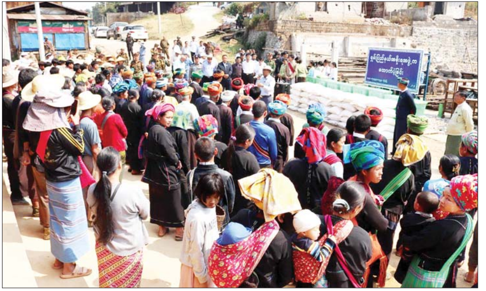
ရန်အတွက် အလှူငွေနှင့် လှူဖွယ်ပစ္စည်းများ ဆက်ကပ်လှူဒါန်းသည်။ ယင်းနောက် ပြည်နယ်ဝန်ကြီးချုပ်၊ တိုင်းမှူး နှင့်အဖွဲ့ဝင်များသည် ကျောက်ကချားကျေးရွာသို့ သွားရောက်၍ ဒေသခံတိုင်းရင်းသားပြည်သူများအား တွေ့ဆုံအားပေးစကားပြောကြားပြီးထောက်ပံ့ငွေနှင့် ထောက်ပံ့ပစ္စည်းများ ပေးအပ်ခဲ့ကြောင်း သိရသည်။ သတင်းစဉ်

ပအိုဝ်းကိုယ်ပိုင်အုပ်ချုပ်ခွင့်ရဒေသ ဦးစီးဥက္ကဋ္ဌနှင့် ဌာနဆိုင်ရာ တာဝန်ရှိသူများက သွားရောက်တွေ့ဆုံ သည်။ ဦးစွာ ပြည်နယ်ဝန်ကြီးချုပ်က အားပေးစကား ပြောကြားသည်။ ထို့နောက် ပြည်နယ်ဝန်ကြီးချုပ်၊ တိုင်းမှူးနှင့် တာဝန်ရှိသူများက ထောက်ပံ့ပစ္စည်းများ နှင့် ထောက်ပံ့ငွေများ ပေးအပ်ရာ ဒေသခံတိုင်းရင်းသား ပြည်သူတစ်ဦးက ကျေးဇူးတင်စကား ပြန်လည် ပြောကြားသည်။ ဆက်လက်၍ ပြည်နယ်ဝန်ကြီးချုပ်၊ တိုင်းမှူးနှင့် တာဝန်ရှိသူများသည် ပန်လျန်းကျေးရွာ ဘုန်းတော်ကြီးကျောင်းသို့ သွားရောက်၍ ဒေသခံ တိုင်းရင်းသားပြည်သူများအတွက် ထောက်ပံ့ငွေနှင့် ထောက်ပံ့ပစ္စည်းများ ပေးအပ်ပြီး ကျောင်းဆောက်လုပ်