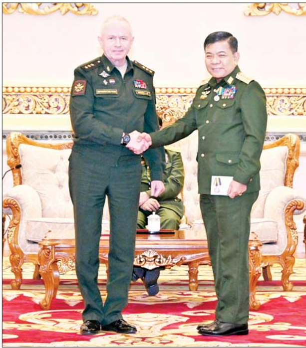
ရုရှားဖက်ဒရေးရှင်းနိုင်ငံ ကာကွယ်ရေးဝန်ကြီးဌာန ဒုတိယဝန်ကြီး Colonel General Alexander Vasilievich Fomin က ဗိုလ်ချုပ်ကြီး မောင်မောင်အေးထံ “နိုင်ငံတကာ စစ်ဘက်ပူးပေါင်းဆောင်ရွက်မှု ဖွံ့ဖြိုးတိုးတက်ရေးစွမ်းဆောင်ရည်ဆိုင်ရာ” ချီးမြှင့်အပ်နှင်းစဉ်။