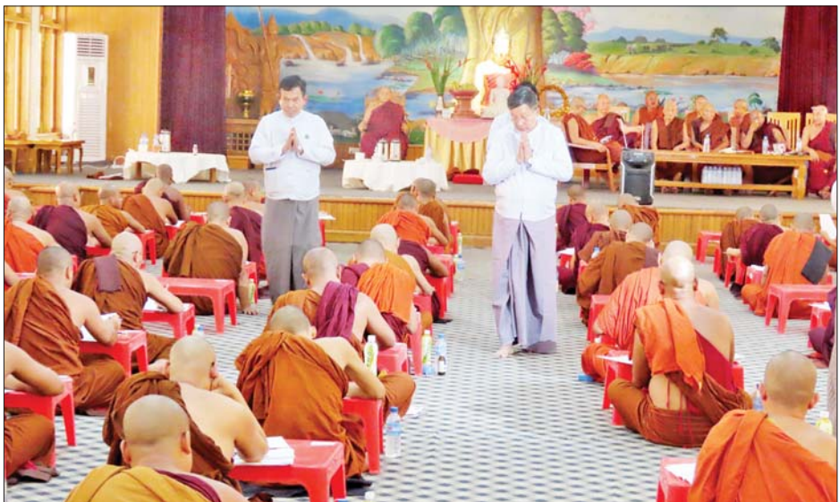
နေပြည်တော်၊ တိုင်းဒေသကြီး/ ပြည်နယ်အသီးသီးရှိ ပါဠိပထမပြန် စာဖြေဌာန ၂၁၃ ဌာနတို့တွင် ဧပြီ ၃ ရက်မှ ၉ ရက်အထိ ကျင်းပသွားမည်ဖြစ်ကြောင်း သိရသည်။ ယင်းနောက် ပြည်ထောင်စုဝန်ကြီးနှင့်အဖွဲ့

၂၀၂၄ ခုနှစ် အစိုးရဓမ္မာစရိယစာမေးပွဲများကို နေပြည်တော်၊ တိုင်းဒေသကြီး/ ပြည်နယ် အသီးသီးရှိ ဓမ္မာစရိယစာဖြေဌာန ၆၆ ဌာနတို့တွင် မတ် ၂၈ ရက်မှ စတင်၍ ကျင်းပဖြေဆိုလျက်ရှိပြီး ဧပြီ ၅ ရက်အထိ ကျင်းပသွားမည်ဖြစ်ကာ ယနေ့ ဓမ္မာစရိယစာမေးပွဲ ပါရာဇိကဏ် (ပထမနေ့) စတင်ဖြေဆိုခြင်းဖြစ်သည်။ ၂၀၂၄ ခုနှစ် ပါဠိပထမပြန်စာမေးပွဲများကိုလည်း