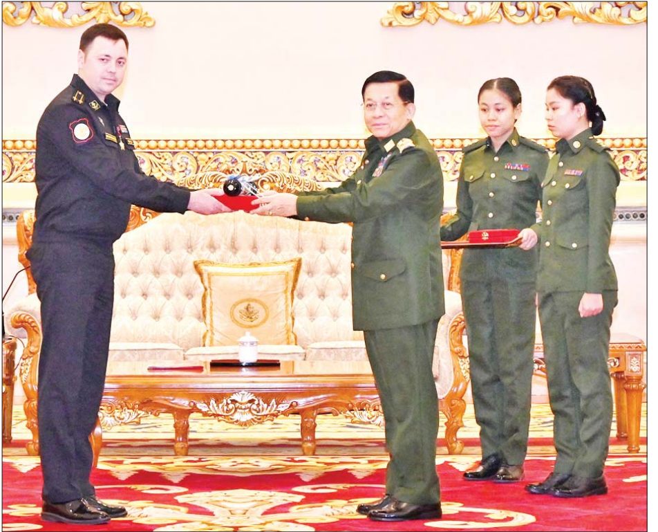
နိုင်ငံတော်စီမံအုပ်ချုပ်ရေးကောင်စီဥက္ကဋ္ဌ တပ်မတော်ကာကွယ်ရေးဦးစီးချုပ် ဗိုလ်ချုပ်မှူးကြီး မင်းအောင်လှိုင် “သီရိသီဟကျော်တံဆိပ်” ရရှိသူ Captain 2 nd rank YASHIN Dmitry Valerievich အား ဘွဲ့တံဆိပ်နှင့် အဆောင်အယောင် ချီးမြှင့်အပ်နှင်းစဉ်။