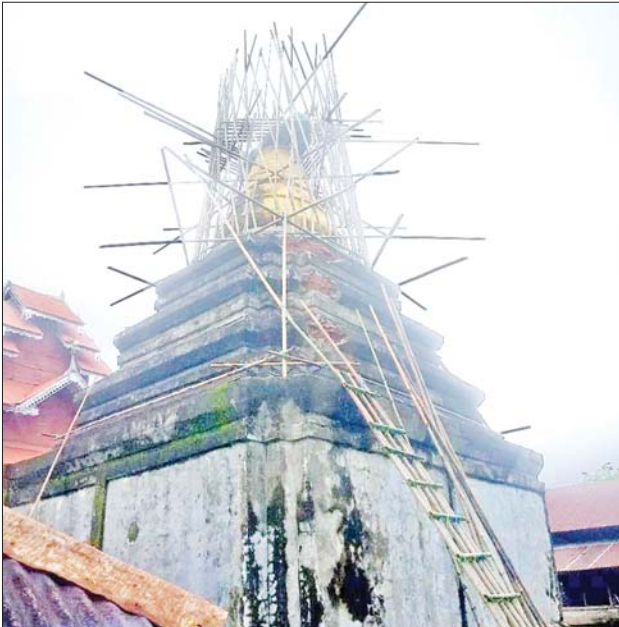
ရခိုင်ပြည်နယ် မြောက်ဦးမြို့နယ်၌ မိုခါမုန်တိုင်းဒဏ်ကြောင့် မဟာထီးစေတီ ထီးတော်ပျက်စီးမှုကို တွေ့ရစဉ်။

အလွန်အလွန် အားကောင်းသော ဆိုင်ကလုန်းမုန်တိုင်း “မိုခါ”တိုက်ခတ်မှုကြောင့် ရခိုင်ပြည်နယ်အတွင်းရှိ မြို့နယ် ၁၇ မြို့နယ်စလုံး ထိခိုက်ကြေမှုပျက်စီးသွားခဲ့သည်။ ဆိုင်ကလုန်းမုန်တိုင်းတိုက်ခတ်မှုကြောင့် ရခိုင်ပြည်နယ်အတွင်းရှိ မြောက်ဦးမြို့နယ်သည်လည်း အခြားမြို့နယ်များနည်းတူ ပျက်စီးဆုံးရှုံးမှု များပြားခဲ့သည်။