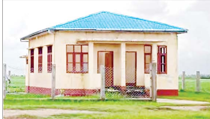
ရခိုင်ပြည်နယ် မြောက်ဦးမြို့နယ်၌ မိုခါမုန်တိုင်းဒဏ်ကြောင့် ပျက်စီးသွားသည့် နတ်ချောင်းနှစ်ခန်းတွဲ ဝန်ထမ်းနေအိမ် ပြန်လည်ပြုပြင်ပြီးစီးမှုကို တွေ့ရစဉ်။