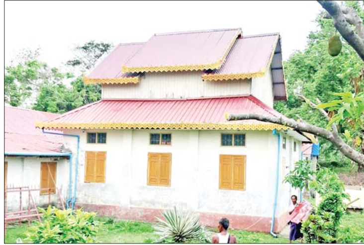
ရခိုင်ပြည်နယ် မြောက်ဦးမြို့နယ်၌ မိုခါမုန်တိုင်းဒဏ်ကြောင့် ပျက်စီးသွားသည့် မြောက်ဦးပြတိုက်ဘုရားခန်းခေါင်မိုး ပြန်လည်ပြုပြင်ပြီးစီးမှုကို တွေ့ရစဉ်။