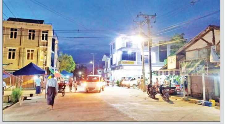
ရခိုင်ပြည်နယ် မြောက်ဦးမြို့နယ်၌ မိုခါမုန်တိုင်းဒဏ်ကြောင့် ပျက်စီးသွားသော လျှပ်စစ်ကွန်ရက်များကို လျှပ်စစ်စွမ်းအားဝန်ကြီးဌာနမှ ဝန်ထမ်းများနှင့် မြို့နယ် လျှပ်စစ်ဝန်ထမ်းများက နေ့မအားညမနား ပြန်လည်တည်ဆောက်ခဲ့ကြရာ အချိန်တိုအတွင်း လျှပ်စစ်မီးပြန်လည်ဖြန့်ဖြူးပေးနိုင်ခဲ့သည်။

ထိခိုက်မှုအနည်းဆုံး ဆိုင်ကလုန်းမုန်တိုင်းမိုခါ တိုက်ခတ် မှုနှင့်ပတ်သက်၍ မိုးလေဝသတင်းများကို အချိန်နှင့်တစ်ပြေးညီ အလေးထားပြီး အမျိုးသားသဘာဝဘေးအန္တရာယ်ဆိုင်ရာ စီမံခန့်ခွဲမှုကော်မတီ၏ ကြီးကြပ် ကွပ်ကဲမှု၊ သက်ဆိုင်ရာဝန်ကြီးဌာနများ၊ ပြည်နယ်သဘာဝဘေးအန္တရာယ်ဆိုင်ရာ စီမံခန့်ခွဲမှုအဖွဲ့အစည်းများ၊ တပ်မတော် သားများ၊ မြန်မာနိုင်ငံရဲတပ်ဖွဲ့ဝင်များ၊ မီးသတ်တပ်ဖွဲ့ဝင်များ၊ လူမှုရေးအသင်း အဖွဲ့များ ပူးပေါင်းဆောင်ရွက်မှုဖြင့်