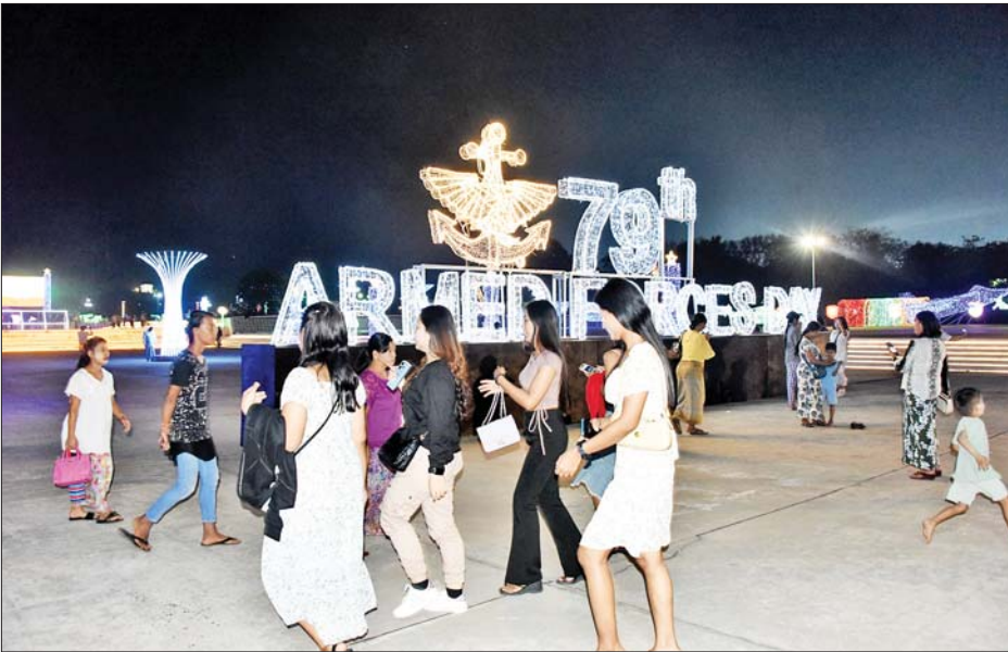
(၇၉)နှစ်မြောက် တပ်မတော်နေ့အား ဂုဏ်ပြုသောအားဖြင့် နေပြည်တော်စစ်ရေးပြကွင်းကြီးရှေ့ရှိ တပ်မတော်ပန်းခြံတွင် မီးအလှများဖြင့် ဖန်တီးပုံဖော်ထားသည်ကို တွေ့ရစဉ်။