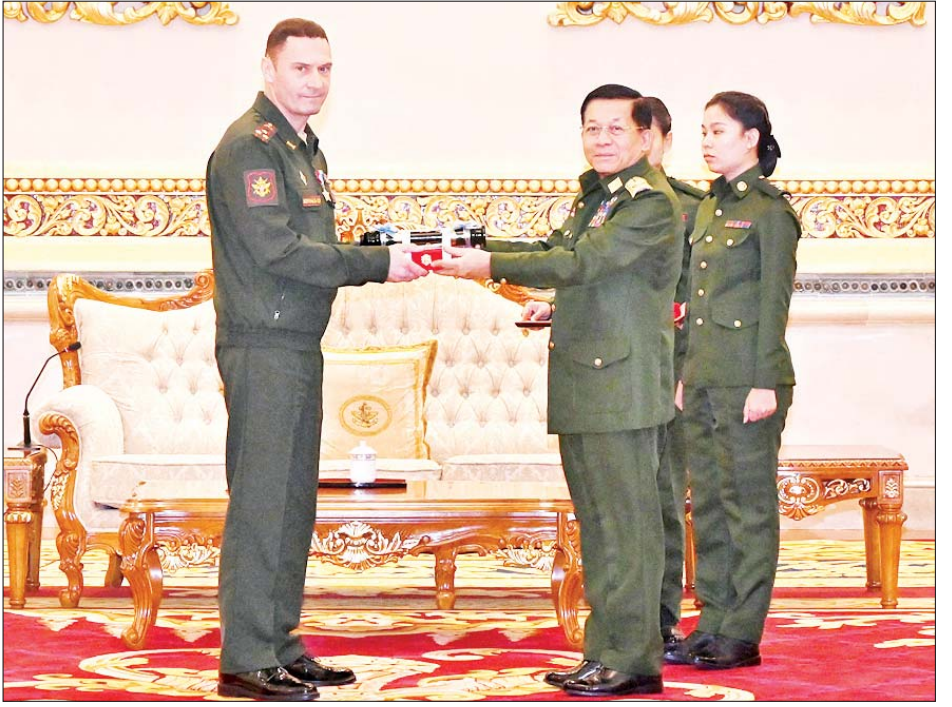
နိုင်ငံတော်စီမံအုပ်ချုပ်ရေးကောင်စီဥက္ကဋ္ဌ တပ်မတော်ကာကွယ်ရေးဦးစီးချုပ် ဗိုလ်ချုပ်မှူးကြီး မင်းအောင်လှိုင် “သီရိသီဟကျော်တံဆိပ်” ရရှိသူ Colonel(Rtd) SARATOV Sergei Nikolaevich အား ဘွဲ့တံဆိပ်နှင့် အဆောင်အယောင် ချီးမြှင့်အပ်နှင်းစဉ်။

☆ ရှေးဦးမှ ဦးစွာ ပြည်ထဲရေးဝန်ကြီးဌာန ဒုတိယဝန်ကြီး ဗိုလ်ချုပ် တိုးရီက မတ် ၂၇ ရက် ရက်စွဲဖြင့် ထုတ်ပြန်သည့် ပြည်ထောင်စုသမ္မတ မြန်မာနိုင်ငံတော် နိုင်ငံတော်စီမံအုပ်ချုပ်ရေး ကောင်စီ အမိန့်ကြော်ငြာစာအမှတ် ၆၄/၂၀၂၄ ဖြင့် ခေတ်မီတပ်မတော် တည်ဆောက်နိုင်ရန် နိုင်ငံတကာစစ်ဘက်ပူးပေါင်းဆောင်ရွက် ရေးကိစ္စရပ်များတွင် စွမ်းစွမ်းတမံ ဆောင်ရွက်ခဲ့ကြသည့် ရုရှားဖက်ဒရေးရှင်း နိုင်ငံမှပုဂ္ဂိုလ်များအား စွမ်းဆောင်မှု ဆိုင်ရာ ဂုဏ်ထူးဆောင်တံဆိပ်များပေး အပ်သည့်အမိန့်ကို ဖတ်ကြားတင်ပြ သည်။ ထို့နောက် နိုင်ငံတော်စီမံအုပ်ချုပ် ရေးကောင်စီဥက္ကဋ္ဌ တပ်မတော်ကာကွယ် ရေးဦးစီးချုပ် ဗိုလ်ချုပ်မှူးကြီး မင်းအောင်လှိုင်က စွမ်းဆောင်မှုဆိုင်ရာ ဂုဏ်ထူးဆောင်တံဆိပ်များချီးမြှင့်ခံရသူ များအနက် “သီရိသီဟကျော်တံဆိပ်”