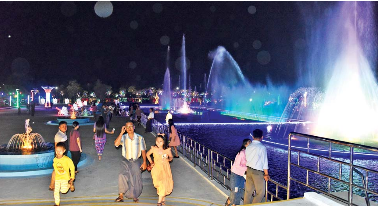
(၇၉)နှစ်မြောက် တပ်မတော်နေ့အား ဂုဏ်ပြုသောအားဖြင့် နေပြည်တော်စစ်ရေးပြကွင်းကြီးရှေ့ရှိ တပ်မတော်ပန်းခြံတွင် မီးအလှများဖြင့် ဖန်တီးပုံဖော်ထားသည်ကို တွေ့ရစဉ်။