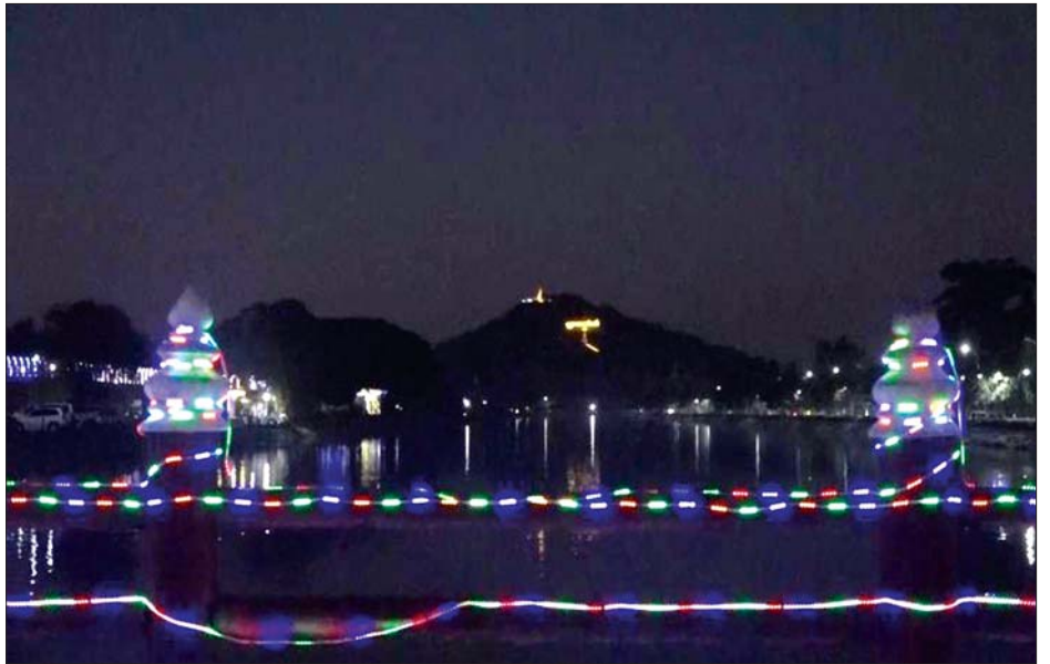
(၇၉)နှစ်မြောက် တပ်မတော်နေ့အား ဂုဏ်ပြုသောအားဖြင့် မန္တလေးမြို့၌ မီးရောင်စုံများ၊ မီးအလှများဖြင့် ဂုဏ်ပြုထွန်းညှိထားသည်ကို တွေ့ရစဉ်။