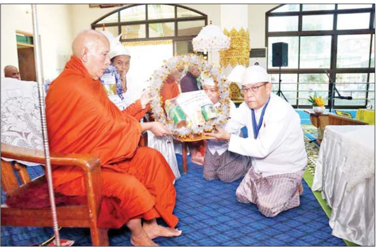
တနင်္သာရီတိုင်းဒေသကြီးဝန်ကြီး ချုပ် ဦးမြတ်ကို ၂၀၂၄ ခုနှစ် သာသနာ တော်ဆိုင်ရာ ဘွဲ့တံဆိပ်တော်ရဆရာ တော်ကြီးအား လှူဖွယ်ပစ္စည်းများ ဆက်ကပ်လှူဒါန်းစဉ်။