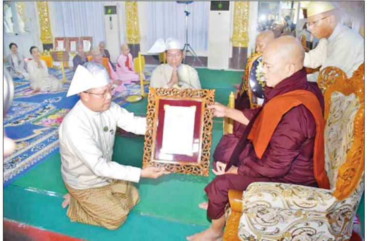
ဧရာဝတီတိုင်းဒေသကြီး ဝန်ကြီး ချုပ် ဦးတင်မောင်ဝင်း ၂၀၂၄ ခုနှစ် သာသနာတော်ဆိုင်ရာ ဘွဲ့တံဆိပ် တော်ရဆရာတော်ကြီးအား ဘွဲ့တံဆိပ် တော် ဆက်ကပ်လှူဒါန်းစဉ်။