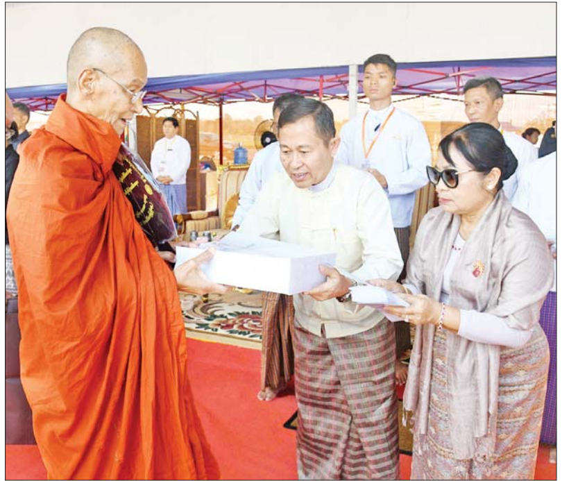
နိုင်ငံတော်စီမံအုပ်ချုပ်ရေးကောင်စီဒုတိယဥက္ကဋ္ဌ ဒုတိယဝန်ကြီးချုပ် ဒုတိယ ဗိုလ်ချုပ်မှူးကြီး စိုးဝင်းနှင့်ဇနီး ဒေါ်သန်းသန်းနွယ် ဆရာတော်အား ဆွမ်းဆန်စိမ်းနှင့် လှူဖွယ်ဝတ္ထုပစ္စည်းများ ဆက်ကပ်လောင်းလှူစဉ်။