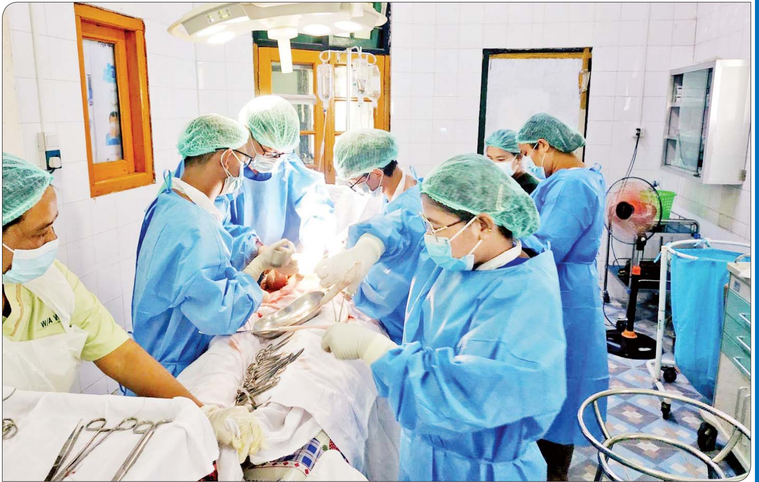
ပေါက်တောမြို့နယ်၌ အထူးကုဆရာဝန်ကြီးများအဖွဲ့ ခွဲစိတ်ကုသပေးစဉ်။

မိုခါမုန်တိုင်းမတိုက်ခတ်မီအချိန်က ပေါက်တောမြို့နယ်တွင် ဆက်သွယ်ရေးအော်ပရေတာ လေးခုရှိခဲ့ပြီး ဒေသခံပြည်သူများ အဆင်ပြေစွာ အသုံးပြုနိုင်ခဲ့သည်။ မုန်တိုင်းတိုက်ခတ်ပြီးသည့်အချိန်တွင် ဆက်သွယ်ရေးစနစ်များ ပြတ်တောက်သွားခဲ့ရာ မုန်တိုင်းတိုက်ခတ်ပြီး မွန်းလွဲပိုင်းတွင်ပင် ဆက်သွယ်ရေးစနစ်တစ်ခုကို