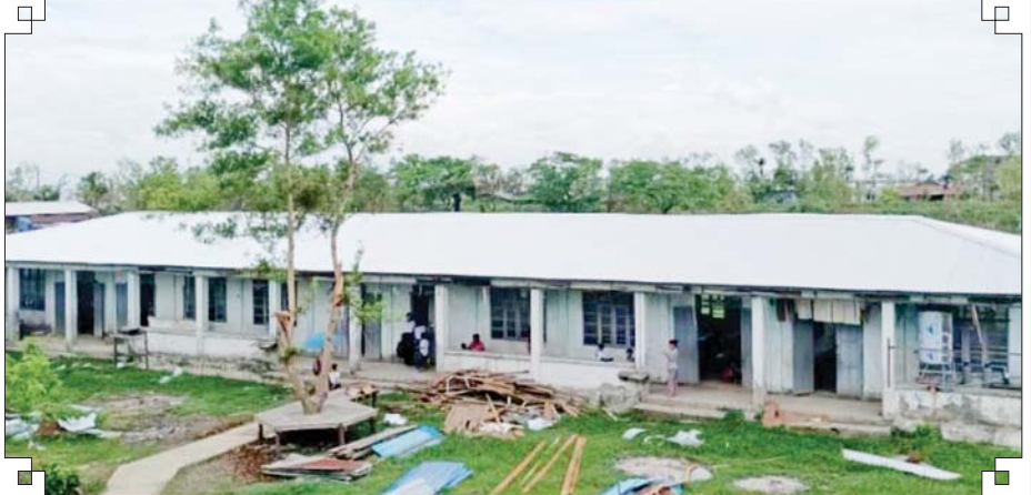
မိုခါမုန်တိုင်းဒဏ်ကြောင့် ပျက်စီးသွားသည့် ပေါက်တောမြို့နယ် အထက(အဆောင်-၅) ပြန်လည် ပြုပြင်ပြီးစီးမှုကို တွေ့ရစဉ်။