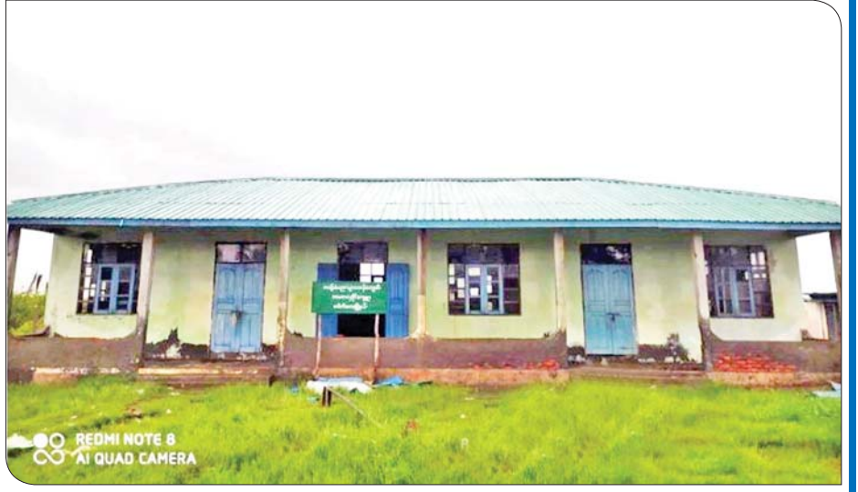
မိုခါမုန်တိုင်းဒဏ်ကြောင့် ပျက်စီးသွားသည့် ပေါက်တောမြို့နယ် အမကလှိုင်ကျေးရွာကျောင်း ပင်မဆောင် ပြန်လည်ပြုပြင်ပြီးစီးမှုကို တွေ့ရစဉ်။