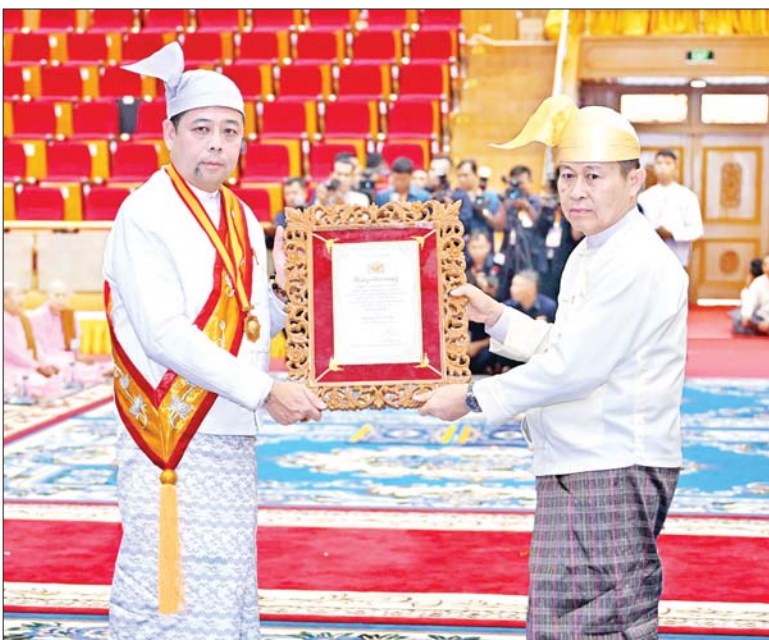
နိုင်ငံတော်စီမံအုပ်ချုပ်ရေးကောင်စီဒုတိယဥက္ကဋ္ဌ ဒုတိယဝန်ကြီးချုပ် ဒုတိယ ဗိုလ်ချုပ်မှူးကြီး စိုးဝင်း သီရိသုဓမ္မဇောတိကဘွဲ့ရရှိသူ ဦးအောင်ကိုဇော်အား ဘွဲ့တံဆိပ်နှင့် အဆောင်အယောင်များ ချီးမြှင့်အပ်နှင်းစဉ်။

ထို့နောက် နိုင်ငံတော်စီမံ အုပ်ချုပ်ရေးကောင်စီ ဥက္ကဋ္ဌ နိုင်ငံတော်ဝန်ကြီးချုပ်၏ ဇနီးက အဂ္ဂမဟာ ဂန္ထဝါစက ပဏ္ဍိတ ဘွဲ့တံဆိပ်တော်ရ စစ်ကိုင်းမြို့