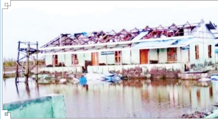
မိုခါမုန်တိုင်းဒဏ်ကြောင့် ပျက်စီးသွားသည့် ပေါက်တောမြို့နယ် အလက(ခွဲ) ဆည်သုံးတန် အဆောင်(၁)ကို တွေ့ရစဉ်။