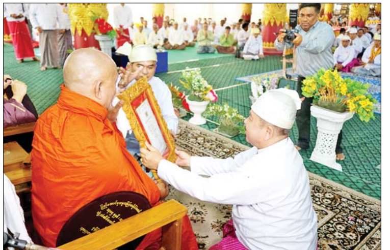
မွန်ပြည်နယ်ဝန်ကြီးချုပ် ဦးအောင် ကြည်သိန်း ၂၀၂၄ ခုနှစ် သာသနာတော် ဆိုင်ရာ ဘွဲ့တံဆိပ်တော်ရ ဆရာတော် ကြီးအား ဘွဲ့တံဆိပ်တော် ဆက်ကပ် လှူဒါန်းစဉ်။