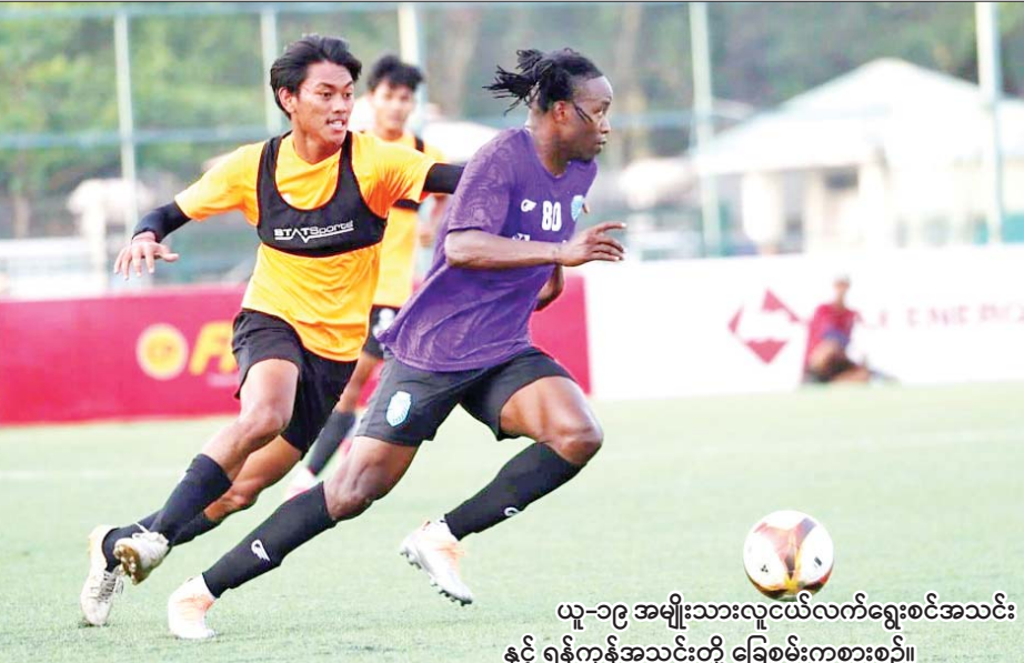
ယူ-၁၉ အမျိုးသားလူငယ်လက်ရွေးစင်အသင်းနှင့် ရန်ကုန်အသင်းတို့ ခြေစမ်းကစားစဉ်။

ရန်ကုန် မတ် ၂၄ နိုင်ငံတကာပြိုင်ပွဲများအတွက် စခန်းဝင် လေ့ကျင့်နေသည့် မြန်မာလူငယ်လက်ရွေးစင် အမျိုးသားအသင်းများသည် ပြည်တွင်းခြေစမ်းပွဲများ ယှဉ်ပြိုင်ကစားခဲ့သည်။ မြန်မာ ယူ-၁၉ အမျိုးသားလူငယ်လက်ရွေးစင် အသင်းသည် မတ် ၂၃ ရက်က MNL ကလပ် ရန်ကုန် ယူနိုက်တက်အသင်းနှင့် YUSC ကွင်း၌ ခြေစမ်းကစားရာ နှစ်ဂိုး-တစ်ဂိုးဖြင့် ရှုံးနိမ့်ခဲ့သည်။ မြန်မာ ယူ-၁၉ အသင်းသည် ပြီးခဲ့သည့်ရက်ပိုင်းက ဟံသာဝတီအသင်းနှင့် ခြေစမ်းကစားပြီးနောက် ရန်ကုန်အသင်းနှင့် ထပ်မံခြေစမ်းခြင်းဖြစ်သည်။ မြန်မာ ယူ-၁၉ အသင်းသည် ဟံသာဝတီကို နှစ်ဂိုး-တစ်ဂိုးဖြင့် အနိုင်ရခဲ့သော်လည်း ရန်ကုန်အသင်းကို အရေးနိမ့်ခဲ့ခြင်းဖြစ်သည်။ စာမျက်နှာ ၂၃ ကော်လံ ၁ သို့ ၀