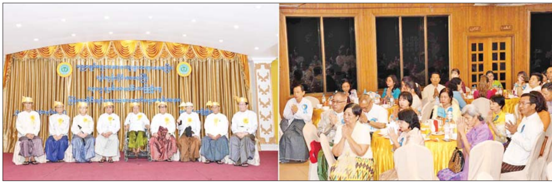
စကားပြောကြားသည်။

ဦးစွာ တိုင်းရင်းဆေးပညာရပ်ဆိုင်ရာ အကြံပေးအဖွဲ့ဥက္ကဋ္ဌ(ငြိမ်း) ဆရာကြီး ဒေါက်တာအောင်နိုင်က နှုတ်ခွန်းဆက်