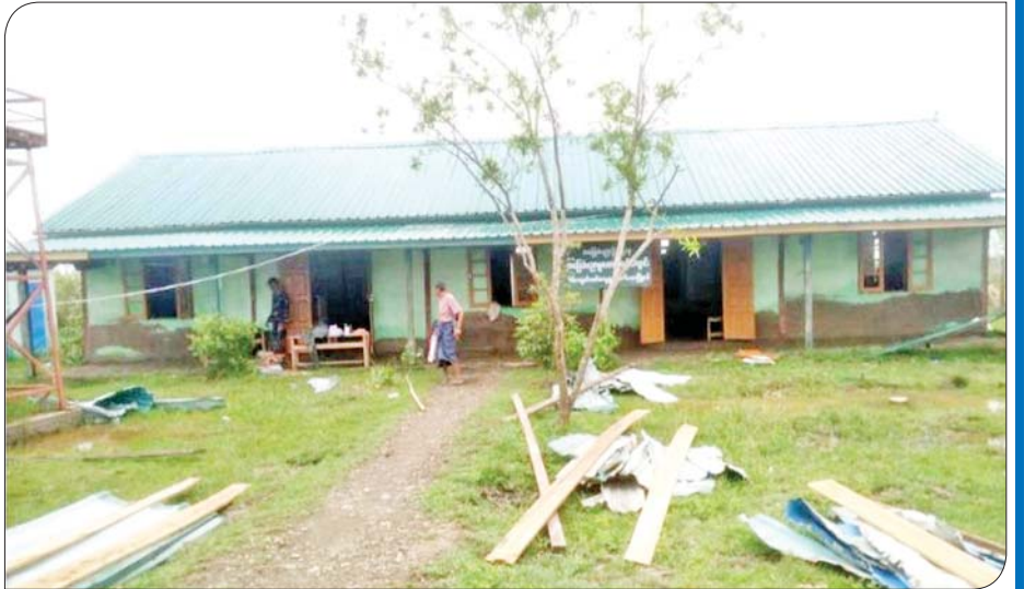
မိုခါမုန်တိုင်းဒဏ်ကြောင့် ပျက်စီးသွားသည့် ပေါက်တောမြို့နယ် မူလွန် သိမ်ကျောင်းမော်ပင်မဆောင် ပြန်လည်ပြုပြင်ပြီးစီးမှုကို တွေ့ရစဉ်။