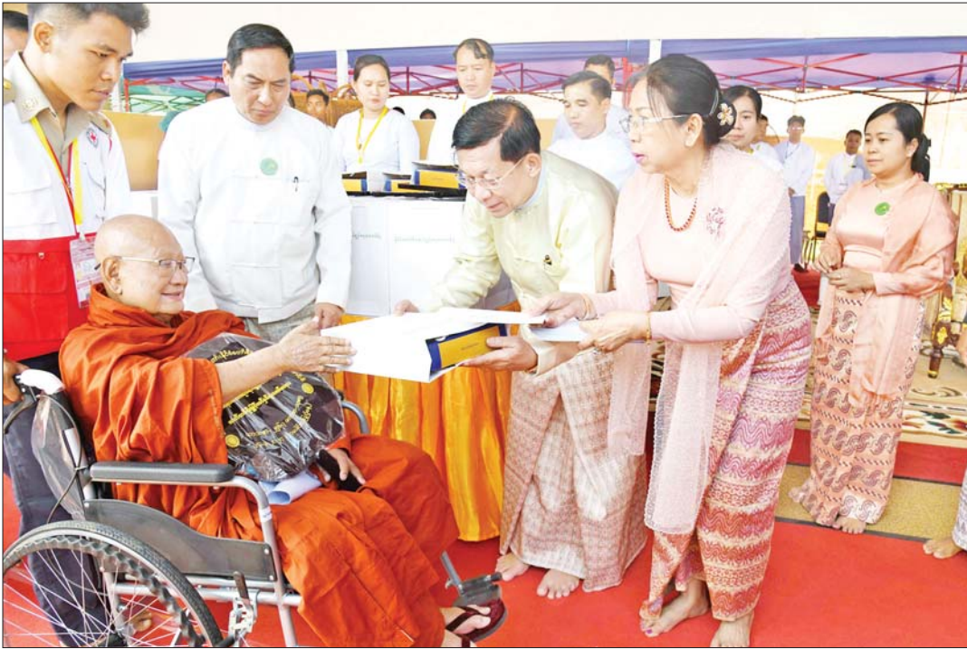
နိုင်ငံတော်စီမံအုပ်ချုပ်ရေးကောင်စီဥက္ကဋ္ဌ နိုင်ငံတော်ဝန်ကြီးချုပ် ဗိုလ်ချုပ်မှူးကြီး မင်းအောင်လှိုင်နှင့်ဇနီး ဒေါ်ကြူကြူလှ ဆရာတော်အား ဆွမ်းဆန်စိမ်းနှင့် လှူဖွယ်ဝတ္ထုပစ္စည်းများ ဆက်ကပ်လောင်းလှူစဉ်။