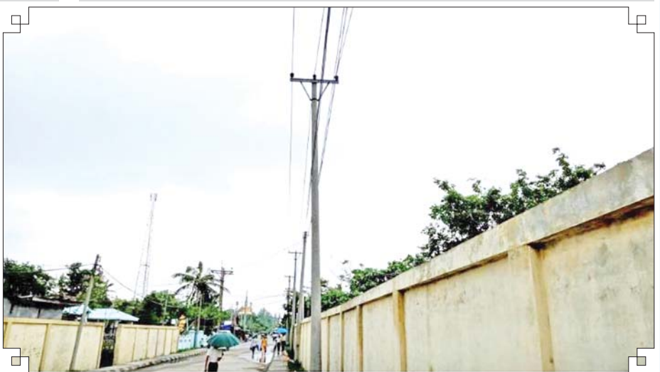
ရခိုင်ပြည်နယ် ပေါက်တောမြို့နယ်အတွင်းရှိ ဓာတ်အားလိုင်းများ ပြုပြင်ပြီးစီးမှုကို တွေ့ရစဉ်။