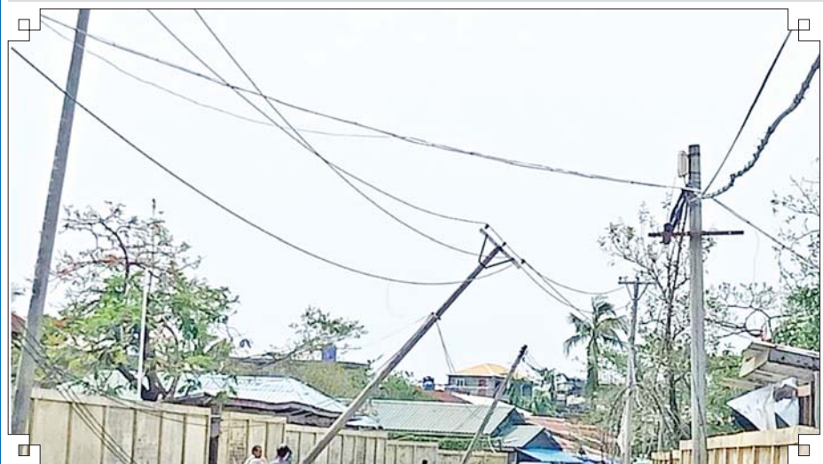
ရခိုင်ပြည်နယ် ပေါက်တောမြို့နယ်အတွင်းရှိ ဓာတ်အားလိုင်းများ ပျက်စီးမှုကို တွေ့ရစဉ်။