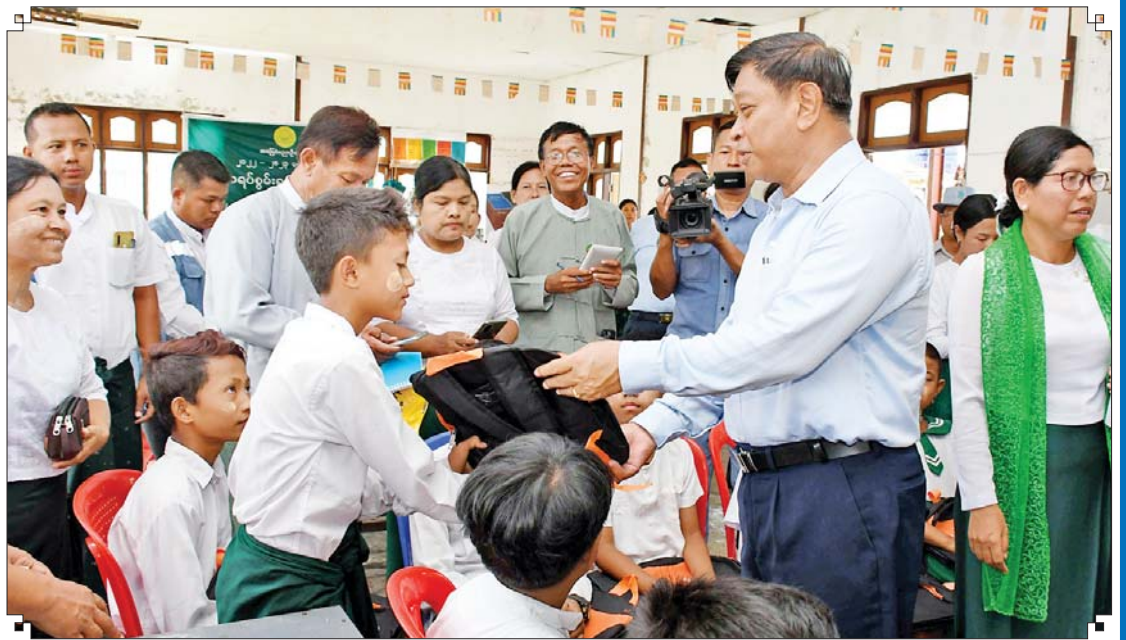
နိုင်ငံတော်စီမံအုပ်ချုပ်ရေးကောင်စီအဖွဲ့ဝင် ဒုတိယဝန်ကြီးချုပ်နှင့် ပြည်ထောင်စုဝန်ကြီး ဗိုလ်ချုပ်ကြီးတင်အောင်စန်း ၂၀၂၃ ခုနှစ် မေ ၂၄ ရက်က ပေါက်တောမြို့ အခြေခံပညာအထက်တန်းကျောင်းတွင် ကျောင်းသားများအား အမှတ်တရ လက်ဆောင်ပေးအပ်စဉ်။

ဝမ်းသာမဆုံး ပေါက်တောမြို့နယ်အတွင်း နေထိုင် ကြသော ပြည်သူများသည် ၂၀၂၃ ခုနှစ် မေလ ၁၄ ရက်နေ့ကို ၎င်းတို့ဘဝအတွက် ကြောက်မက်ဖွယ်ရာ နေ့တစ်နေ့အဖြစ်ခံယူ ခဲ့ကြသည်။ ထိုနေ့တစ်နေ့တာလုံး ၎င်းတို့ အတွက် ငရဲတမျှအလား ဒုက္ခဆင်းရဲများ ခံစားခဲ့ကြရသည်။ တစ်မြို့နယ်လုံး စိမိ ညက်ညက်ကျေပြီး နေရေး၊ ထိုင်ရေး၊ စားသောက်ရေးပါမကျန် အခက်အခဲများ ဖြစ်ကြရသည်။ မေလ ၁၅ ရက်နေ့သို့ရောက် သည်နှင့် နိုင်ငံတော်အစိုးရက အလျင် အမြန် စီမံခန့်ခွဲပေးမှုကြောင့် ကယ်ဆယ် ကူညီစောင့်ရှောက်မှုများ စတင်ရောက်ရှိ လာခဲ့သည်။ စာမျက်နှာ ၁၂ သို့ »»