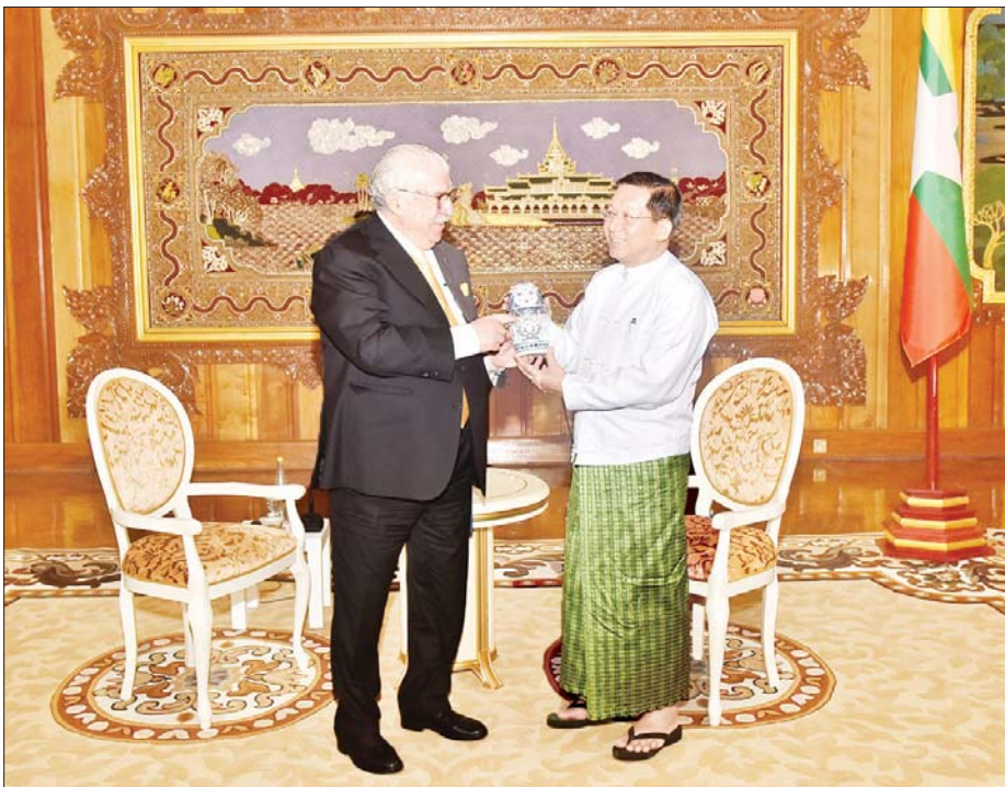
နိုင်ငံတော်စီမံအုပ်ချုပ်ရေးကောင်စီဥက္ကဋ္ဌ နိုင်ငံတော်ဝန်ကြီးချုပ် ဗိုလ်ချုပ်မှူးကြီး မင်းအောင်လှိုင်အား ရုရှားနိုင်ငံ ITAR-TASS Media က အမှတ်တရလက်ဆောင်ပစ္စည်းပေးအပ်စဉ်။

နောက်တစ်ခုကတော့ ကျွန်တော်တို့ရဲ့ နိုင်ငံ တော်စီမံအုပ်ချုပ်ရေးကောင်စီတက်လာခြင်းဟာ မဲမသမာမှုကြောင့်ဖြစ်လာတဲ့ အကျိုးဆက်တစ်ခု ဖြစ်ပါတယ်။ ဒါကြောင့်ကျွန်တော်တို့က ဒီရွေးကောက် ပွဲပေါ့လေ၊ ရွေးကောက်ပွဲ မဲမသမာမှုကနေဖြစ်လာ တဲ့ အကျိုးဆက်တစ်ခုဖြစ်ပါတယ်။ ဒါကြောင့် ကျွန်တော်တို့က လွတ်လပ်ပြီး တရားမျှတမှုရှိတဲ့ ရွေးကောက်ပွဲတစ်ခု ပြန်လည်ကျင်းပရေးကတော့ ကျွန်တော်တို့ရဲ့ နောက်ဆုံးရည်မှန်းချက်ဖြစ်ပါ တယ်။ အရေးပေါ်ကာလဆိုင်ရာ ပြဋ္ဌာန်းချက်တွေ ပြီးသွားပြီဆိုတာနဲ့ ရွေးကောက်ပွဲ ကျွန်တော်တို့ ပြန်လုပ်မှာဖြစ်ပါတယ်။ အဲဒီတော့ ကျွန်တော်တို့က ဒီအရေးပေါ်ကာလတွေပြီးလို့ရင် အမျိုးသား ကာကွယ်ရေးနှင့် လုံခြုံရေးကောင်စီကို ကျွန်တော်တို့ က အာဏာပြန်လွှဲမယ်။ ပြန်လွှဲပြီးတော့ အဲဒီရဲ့ ဦးဆောင်မှုနဲ့ (၆)လအတွင်းမှာ ကျွန်တော်တို့ ရွေးကောက်ပွဲ ပြန်လုပ်မှာဖြစ်ပါတယ်။ အဲဒီတော့ ဒီရွေးကောက်ပွဲလုပ်နိုင်ဖို့ဆိုရင် မဲစာရင်းတွေ မှား ယွင်းမှုကြောင့်ဖြစ်လာတဲ့အတွက်ကြောင့် မဲစာရင်း မှန်ကန်ရေးကိုလည်း ကျွန်တော်တို့က အဓိကထား လုပ်ရမှာ။ မဲစာရင်းမှန်ကန်ရေးကလည်း ဒီနှစ်ထဲမှာ