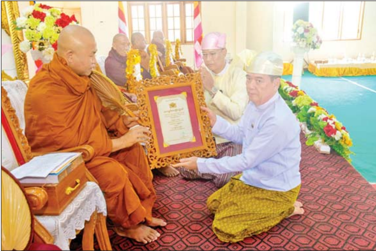
ရခိုင်ပြည်နယ် ဝန်ကြီးချုပ် ဦးထိန်လင်း ၂၀၂၄ ခုနှစ် သာသနာတော် ဆိုင်ရာ ဘွဲ့တံဆိပ်တော်ရ ဆရာတော် ကြီးအား ဘွဲ့တံဆိပ်တော် ဆက်ကပ် လှူဒါန်းစဉ်။

ရေစက်သွန်းချအမျှပေးဝေခဲ့ကြသည်။ ထို့ပြင် တိုင်းဒေသကြီးနှင့်ပြည်နယ် အသီးသီး တို့တွင်လည်း တိုင်းဒေသကြီးနှင့် ပြည်နယ်ဝန်ကြီး ချုပ်များ၊ တိုင်းမှူးများနှင့် စေတနာရှင်အလှူရှင် များကသံဃာတော်များနှင့်သာသနာ့နွယ်ဝင်သီလရှင် များအား သတ်မှတ်နေရာများ၌ ဆွမ်းဆန်စိမ်းနှင့် လှူဖွယ်ပစ္စည်းများ လောင်းလှူပူဇော်ခဲ့ကြကြောင်း သိရသည်။ သတင်းစဉ်