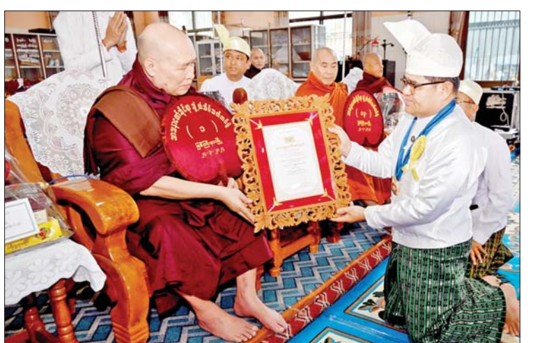
ကချင်ပြည်နယ် ဝန်ကြီးချုပ် ဦးခက်ထိန်နန် ၂၀၂၄ ခုနှစ် သာသနာ တော်ဆိုင်ရာ ဘွဲ့တံဆိပ်တော်ရ ဆရာတော်ကြီးအား ဘွဲ့တံဆိပ်တော် ဆက်ကပ်လှူဒါန်းစဉ်။