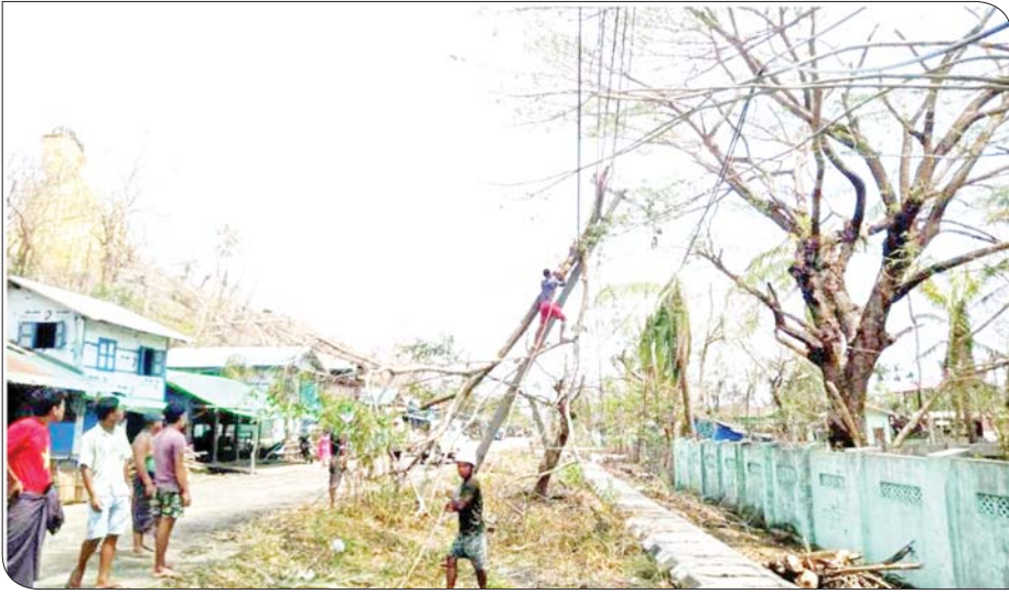
ရခိုင်ပြည်နယ် ပေါက်တောမြို့နယ်အတွင်းရှိ ဓာတ်အားလိုင်းများ ပျက်စီးမှုကို တွေ့ရစဉ်။