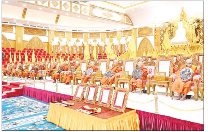
နိုင်ငံတော်စီမံအုပ်ချုပ်ရေးကောင်စီဥက္ကဋ္ဌ နိုင်ငံတော်ဝန်ကြီးချုပ် ဗိုလ်ချုပ်မှူးကြီး မင်းအောင်လှိုင်နှင့် ဇနီး ဒေါ်ကြူကြူလှ၊ ဧည့်ပရိသတ်များက နိုင်ငံတော်သံဃမဟာနာယကအဖွဲ့ဥက္ကဋ္ဌ သန့်လျင်မင်းကျောင်း ဆရာတော်ထံမှ ငါးပါးသီလခံယူဆောက်တည်ကြစဉ်။