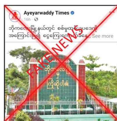
ထုတ်လွှင့်ချက်များကို စဉ်ဆက်မပြတ် ထုတ်လွှင့် အသိပေးလျက်ရှိပြီး https:// mod.gov.mm/node/74 တို့တွင် ဝင်ရောက်ကြည့်ရှုလေ့လာနိုင်ကြောင်း သိရသည်။ သတင်းစဉ်

မြို့နယ်အုပ်ချုပ်မှုဆိုင်ရာ တာဝန်ရှိသူများက စစ်မှုထမ်းဆိုင်ရာ အသိပညာပေး လုပ်ငန်းများကို ဆောင်ရွက်ပေးလျက်ရှိကြောင်း၊ ငွေကျပ် ၅၀၀၀၀ မရှိကြောင်းနှင့် တရားမဝင် ပြည်ဖျက်မိဒီယာများက မဟုတ်မမှန် သတင်းအမှားများဖြင့် ဝါဒဖြန့်ဝေမှုကြောင့် ရေးသားခြင်းသာဖြစ်ကြောင်း သိရသည်။ ပြည်သူ့စစ်မှုထမ်းဥပဒေနှင့်ပတ်သက်၍ တရားမဝင်ပြည်ဖျက်မိဒီယာများက သတင်းတု၊ သတင်းအမှားများကို ရည်ရွယ်ချက်ရှိရှိ လုပ်ကြံရေးသားလျက်ရှိသဖြင့် မိဘပြည်သူများနှင့် လူငယ် လူရွယ်များအနေဖြင့် ပြည်သူ့စစ်မှုထမ်းဆိုင်ရာ သတင်းအချက်အလက်များကို နိုင်ငံပိုင် မီဒီယာများမှတစ်ဆင့် စစ်မှုထမ်းဆိုင်ရာ အသိပညာပေး သတင်းများ၊