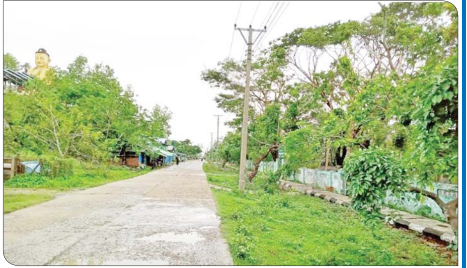
ရခိုင်ပြည်နယ် ပေါက်တောမြို့နယ်အတွင်းရှိ ဓာတ်အားလိုင်းများ ပြုပြင်ပြီးစီးမှုကို တွေ့ရစဉ်။

»» စာမျက်နှာ ၁၂ မှ ပြန်လည်အစားထိုး တည်ဆောက်နိုင်ရန်အတွက် ပေါက်တောမြို့နယ်ကို တာဝန်ယူကြီးကြပ် ဆောင်ရွက်ပေးနေသည့် ကာကွယ်ရေးဝန်ကြီးဌာနမှ ဗိုလ်မှူးချုပ်ဆန်အုန်းနှင့် သက်ဆိုင်ရာအဖွဲ့အစည်းများ၊ ပေါက်တောမြို့နယ်မှ ဌာနဆိုင်ရာအဖွဲ့အစည်းများအတူတကွ နေ့ညမပြတ် ဆောင်ရွက်ပေးခဲ့ရာ တစ်လအတွင်း ပုံမှန်အခြေအနေသို့ ပြန်လည်ရောက်ရှိအောင် ဆောင်ရွက်နိုင်ခဲ့သည်။ ဦးစားပေးအလိုက်