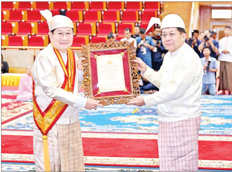
နိုင်ငံတော်စီမံအုပ်ချုပ်ရေးကောင်စီဥက္ကဋ္ဌ နိုင်ငံတော်ဝန်ကြီးချုပ် ဗိုလ်ချုပ်မှူးကြီး မင်းအောင်လှိုင် အဂ္ဂမဟာသီရိသုဗ္ဗမ္မ မဏိဇောတရေဘွဲ့ရရှိသူ ဒေါက်တာမောင်မောင်ဦးအား ဘွဲ့တံဆိပ်နှင့် အဆောင်အယောင်များ ချီးမြှင့်အပ်နှင်းစဉ်။