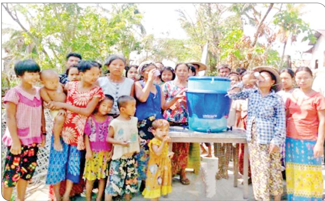
ပေါက်တောမြို့နယ် ဂြင်းချောင်းကျေးရွာတွင် Life Straw ရေသန့်စက်ဖြင့် သောက်သုံးရေများ ဖြန့်ဝေနေစဉ်။

မြို့နယ်အတွင်း ပျက်စီးမှုအခြေအနေများကို နိုင်ငံတော်အကြီးအကဲ၏ လမ်းညွှန်မှုနှင့်အညီ ပထမဦးစားပေးအနေဖြင့် အခြေခံပညာစာသင်ကျောင်းများအားလည်းကောင်း၊ ဒုတိယဦးစားပေးအနေဖြင့် ဆေးရုံ၊ ဆေးခန်းများအားလည်းကောင်း၊ တတိယဦးစားပေးအနေဖြင့် သာသနိကအဆောက်အအုံများကို လည်းကောင်း၊ စတုတ္ထဦးစားပေးအနေဖြင့် ဌာနဆိုင်ရာ အဆောက်အအုံများကိုလည်းကောင်း ပြင်ဆင်ဆောင်ရွက်ပေးခဲ့သည်။ စစ်တွေမြို့မှတစ်ဆင့် ကယ်ဆယ်ရေး၊ ထောက်ပံ့ရေးပစ္စည်းများ နေ့စဉ်ရောက်ရှိခဲ့ပြီး ရောက်ရှိလာသည့် ပစ္စည်းများကို မြို့နယ်အတွင်းရှိ အိမ်ထောင်စုများအား ပျံ့ဝေထောက်ပံ့ပေးခဲ့သည်။ ပေါက်တောမြို့နယ်အတွင်းရှိ မုန်တိုင်းဒဏ်သင့် ပြည်သူများအား ကူညီထောက်ပံ့ရေး ဆောင်ရွက်ရာတွင် အဆင်ပြေချမ်းသာသူ၊ အတင့်အတင့်ရှိသူ၊ ဆင်းရဲနွမ်းပါးသူဟူ၍ ဦးစားပေးအဆင့်အလိုက် ဆောင်ရွက်ပေးခဲ့သည်။