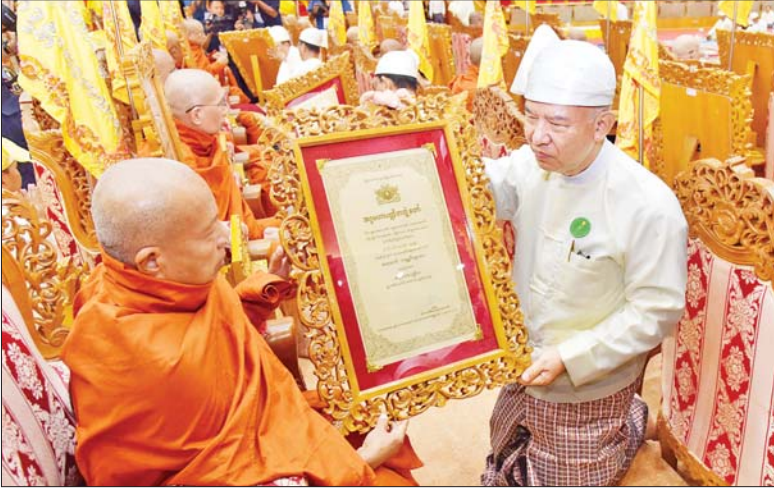
နိုင်ငံတော်ဖွဲ့စည်းပုံအခြေခံဥပဒေဆိုင်ရာခုံရုံးဥက္ကဋ္ဌ ဦးအောင်ဇော်သိန်း အဂ္ဂမဟာပဏ္ဍိတဘွဲ့တံဆိပ်တော်ရ မဟာဇောတိကာရာမကျောင်းတိုက်ဆရာတော် ဘဒ္ဒန္တဝိဇ္ဇောဒယထံ ဘွဲ့တံဆိပ်တော်နှင့် အဆောင်အယောင်များ ဆက်ကပ်ပူဇော်စဉ်။