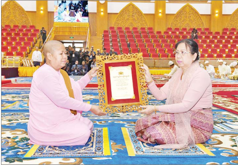
နိုင်ငံတော်စီမံအုပ်ချုပ်ရေးကောင်စီဥက္ကဋ္ဌ နိုင်ငံတော်ဝန်ကြီးချုပ် ဗိုလ်ချုပ်မှူးကြီး မင်းအောင်လှိုင်၏ ဇနီး ဒေါ်ကြူကြူလှ အဂ္ဂမဟာဂန္ထဝါစကပဏ္ဍိတ ဘွဲ့တံဆိပ်တော်ရ စစ်ကိုင်းမြို့ ဝေယျသီကီသီလရှင်စာသင်တိုက် သီလရှင်ဆရာကြီး ဒေါ်ဂုဏဝတီထံ ဘွဲ့တံဆိပ်တော်နှင့် အဆောင်အယောင်များ ဆက်ကပ်ပူဇော်စဉ်။

စီမံအုပ်ချုပ်ရေးကောင်စီ ဥက္ကဋ္ဌ နိုင်ငံတော်ဝန်ကြီးချုပ်က အဘိဓမ္မဟာရဋ္ဌဂုရု ဘွဲ့တံဆိပ်တော်ရ မော်လမြိုင်မြို့ ဗုဒ္ဓသာသနသိပ္ပံကျောင်းနှင့် စိန်မမပါဠိတက္ကသိုလ်ကျောင်းတိုက်ဆရာတော် ဘဒ္ဒန္တ သုမန ထံ ဘွဲ့တံဆိပ်တော်နှင့် အဆောင်အယောင်များကို ဆက်ကပ်ပူဇော်သည်။ စာမျက်နှာ ၄ သို့ ❖