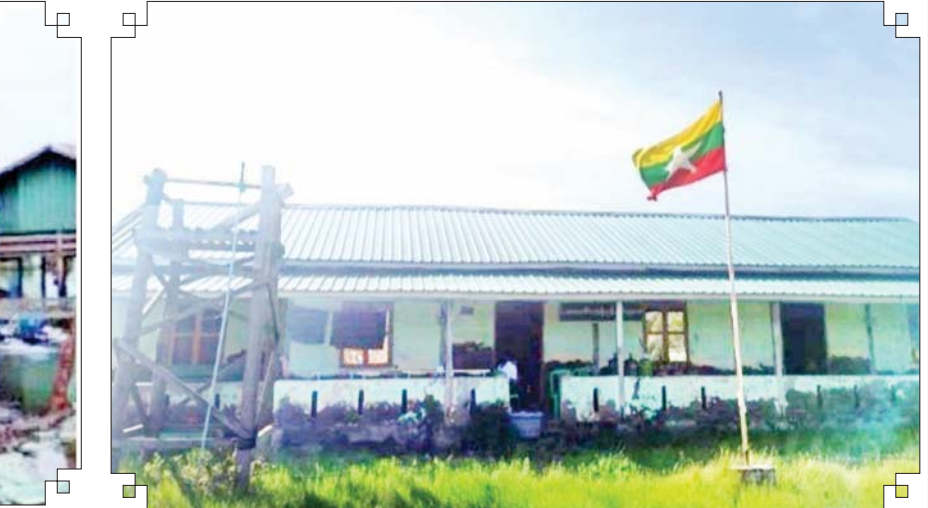
မိုခါမုန်တိုင်းဒဏ်ကြောင့် ပျက်စီးသွားသည့် ပေါက်တောမြို့နယ် အလက(ခွဲ) ဆည်သုံးတန် အဆောင်(၁) ပြန်လည်ပြုပြင်ပြီးစီးမှုကို တွေ့ရစဉ်။