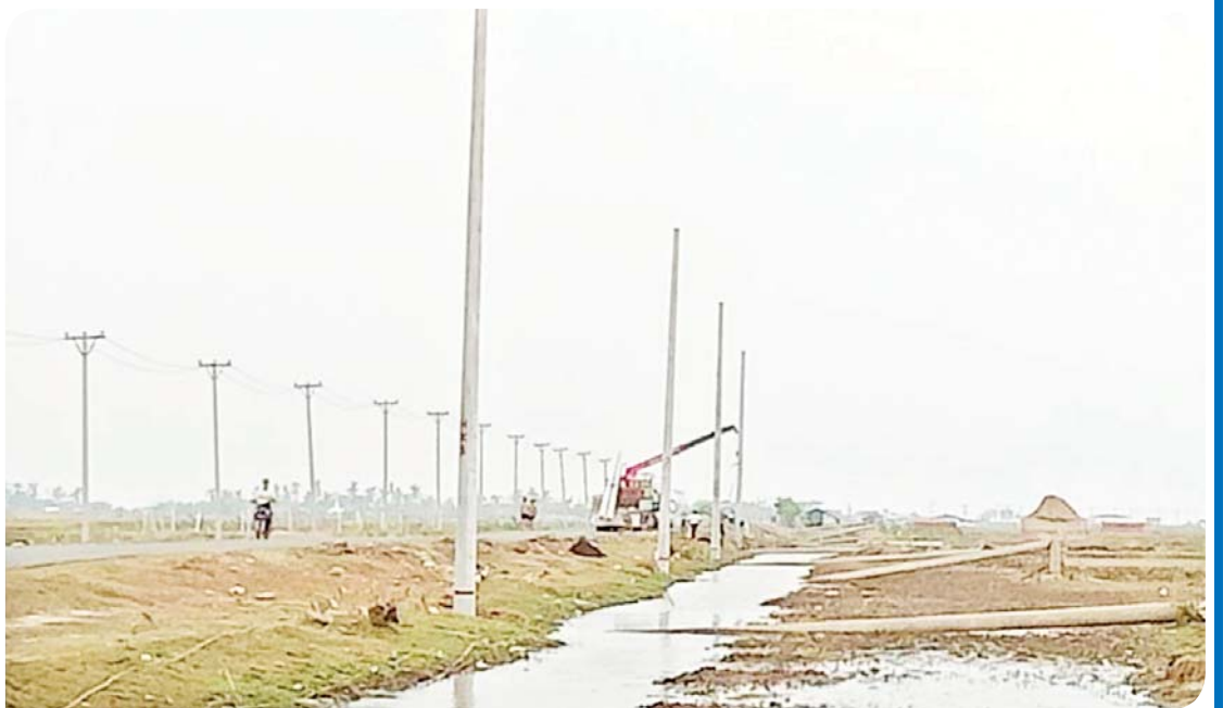
၃၃ ကေဗီ ပေါက်တော ဓာတ်အားလိုင်း ပြင်ဆင်ခြင်းလုပ်ငန်းများ ဆောင်ရွက်နေစဉ်။

ပေါက်တောမြို့နယ်တွင် အခြေခံပညာ ဆရာ ဆရာမ ၁၆၈၅ ဦးရှိပြီး ကျောင်းသား ကျောင်းသူ ၂၀၀၀၀ ကျော်ရှိသည်။ တစ်မြို့နယ်လုံးတွင် အခြေခံပညာ ကျောင်းပေါင်း ၁၇၀ ရှိပြီး မိုခါမုန်တိုင်းတိုက်ခတ်မှုကြောင့် ကျောင်းခြောက်ကျောင်းသာ မပျက်စီးခဲ့ဘဲ မူလတန်းကျောင်း၊ အလယ်တန်း၊ အထက်တန်းကျောင်း အခြေခံပညာကျောင်း စုစုပေါင်း ၁၆၄ ကျောင်းမှာ လုံးဝပျက်စီးသွားခဲ့သည်။ မေလ ၁၄ ရက်နေ့တွင် မိုခါမုန်တိုင်း တိုက်ခတ်ခဲ့ရာ ပျက်စီးသွားသောကျောင်းများ ဇွန်လ ၁