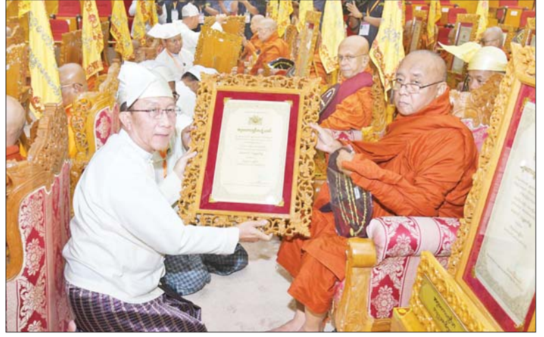
ဒုတိယဝန်ကြီးချုပ်နှင့် ပြည်ထောင်စုဝန်ကြီး ဦးဝင်းရှိန် အဂ္ဂမဟာပဏ္ဍိတဘွဲ့တံဆိပ်တော်ရ ကန်တော်မင်းစာသင်တိုက်ဆရာတော် ဘဒ္ဒန္တသုစိတ္တထံ ဘွဲ့တံဆိပ်တော်နှင့် အဆောင်အယောင်များ ဆက်ကပ်ပူဇော်စဉ်။

တော်များ ဆက်ကပ်ပေးအပ်ချီးမြှင့်ခဲ့ကြကြောင်း သိရသည်။ ဆက်လက်ပြီး ဆွမ်းဆန်စိမ်းလောင်းလှူပွဲကို ကျင်းပရာ နိုင်ငံတော် စီမံအုပ်ချုပ်ရေးကောင်စီဥက္ကဋ္ဌ နိုင်ငံတော်ဝန်ကြီးချုပ်ဗိုလ်ချုပ်မှူးကြီး မင်းအောင်လှိုင်နှင့် ဇနီး ဒေါ်ကြူကြူလှတို့နှင့်အတူ ကောင်စီဒုတိယဥက္ကဋ္ဌ ဒုတိယဝန်ကြီးချုပ် ဒုတိယဗိုလ်ချုပ်မှူးကြီး စိုးဝင်းနှင့်ဇနီး ဒေါ်သန်းသန်းနွယ်၊ ကောင်စီအတွင်းရေးမှူးနှင့်ဇနီး၊ တွဲဖက်အတွင်းရေးမှူးနှင့်ဇနီး၊ ကောင်စီအဖွဲ့ဝင်များနှင့်ဇနီးများ၊ ပြည်ထောင်စုအဆင့် ပုဂ္ဂိုလ်များ၊ ပြည်ထောင်စုဝန်ကြီးများနှင့် ဇနီးများ၊ ကာကွယ်ရေး ဦးစီးချုပ်ရုံးမှ ၂၀၂၄ ခုနှစ် သာသနာတော် ပြည်ပဆရာတော်၊ သံဃာတော် ရာမဏ္ဍပ်များမှ ဆွမ်းဆန်စိမ်းနှင့် အဆင့်မြင့် တပ်မတော်အရာရှိကြီး ဆိုင်ရာ ဘွဲ့တံဆိပ်တော်များ လှူဒါန်းပေးအပ်ပူဇော်ခံယူ များနှင့်ဇနီးများ၊ ဌာနဆိုင်ရာများမှ ဆက်ကပ်ကော်ရော် အပူဇော်ခံယူ ဝန်ထမ်းများ၊ အလှူရှင်များက တော်မူခဲ့ကြသည့် ပြည်တွင်း၊