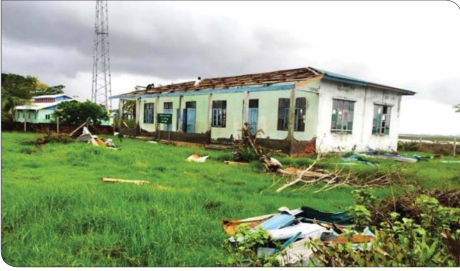
မိုခါမုန်တိုင်းဒဏ်ကြောင့် ပျက်စီးသွားသည့် ပေါက်တောမြို့နယ် အမကလှိုင်ကျေးရွာကျောင်း ပင်မဆောင်ကို တွေ့ရစဉ်။

ခဲ့သည်။ လျှပ်စစ်စွမ်းအားဝန်ကြီးဌာနမှ ဝန်ထမ်းများက နေ့မနားညမအား ကြိုးပမ်းဆောင်ရွက်ပေးမှုကြောင့် ၂၀၂၃ ခုနှစ် ဇူလိုင်လကုန်တွင် တစ်မြို့နယ်လုံးအတွက် လျှပ်စစ်ဓာတ်အားများ ပုံမှန် ပြန်လည် ပေးဝေနိုင်သည့်အတွက် ဒေသခံ တိုင်းရင်းသားပြည်သူများ ဝမ်းမြောက်ပျော်ရွှင်ခဲ့ကြသည်။ မူလအခြေအနေရောက် ဆိုင်ကလုန်းမုန်တိုင်း “မိုခါ” တိုက်ခတ်မှုကြောင့် ပေါက်တော တစ်မြို့နယ်လုံး၏ ပျက်စီးဆုံးရှုံးမှု ခန့်မှန်း တန်ဖိုးမှာ ကျပ်သန်းပေါင်း ၂၆၄၄၅ ကျော် ရှိသည်ဟု သိရသည်။ တည်ငြိမ်အေးချမ်းပြီး လူမှုစီးပွားဘဝနှင့် အလုပ်အကိုင် အဆင်ပြေခဲ့သည့် ပေါက်တောမြို့နယ်သည် မုန်တိုင်းဒဏ်ကြောင့် ကြေမှုပျက်စီးခဲ့သော်လည်း မုန်တိုင်းအန္တရာယ်ကို ထိခိုက်မှုအနည်းဆုံးဖြင့် ကျော်လွှားနိုင်ရန် နိုင်ငံတော်အကြီးအကဲကိုယ်တိုင် မျက်ခြည်မပြတ်စောင့်ကြည့်ပြီး အချိန်နှင့်တစ်ပြေးညီ လိုအပ်ချက်များကို ဖြည့်ဆည်းပေးနိုင်သည့်အတွက် ရခိုင်ပြည်နယ်အတွင်းမှ မုန်တိုင်းဒဏ်သင့် မြို့နယ်များအားလုံး မူလအခြေအနေသို့ ရောက်ရှိအောင် အချိန်တိုအတွင်း တက်ညီလက်ညီ ကြိုးပမ်းဆောင်ရွက်နိုင်ခဲ့သည်။ ပေါက်တောမြို့နယ်မှ ပြည်သူများ ဘေးဒုက္ခရောက်နေချိန်တွင် ပြည်ထောင်စုသားချင်း ရိုင်းပင်းကူညီဖေးမစောင့်ရှောက်မှုဖြင့် မူလအခြေအနေသို့ ပြန်လည်ရောက်ရှိအောင် နိုင်ငံတော်အစိုးရက ဆောလျင်စွာ ဆောင်ရွက်ပေးနိုင်ခဲ့ပါကြောင်း။ ။