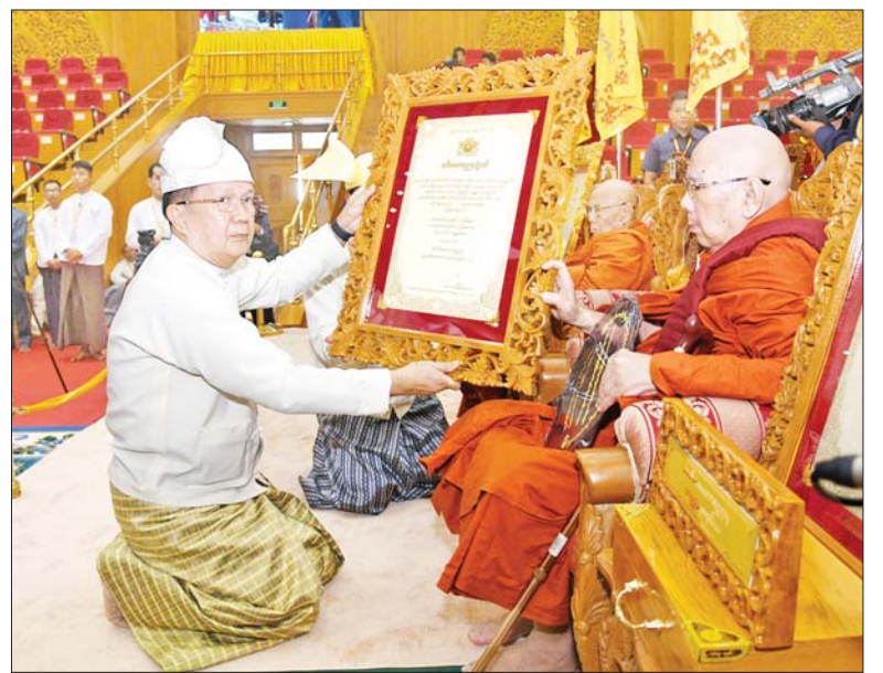
နိုင်ငံတော်စီမံအုပ်ချုပ်ရေးကောင်စီအတွင်းရေးမှူး ဒုတိယဗိုလ်ချုပ်ကြီး အောင်လင်းဒွေး အဘိဓမ္မာမဟာရဋ္ဌဂုရုဘွဲ့တံဆိပ်တော်ရ ဗဟန်းမြို့နယ် မဟာစည် သာသနာ့ရိပ်သာ မဟာနာယက ဘဒ္ဒန္တဝါသဝထံ ဘွဲ့တံဆိပ်တော်နှင့် အဆောင်အယောင် များ ဆက်ကပ်ပူဇော်စဉ်။