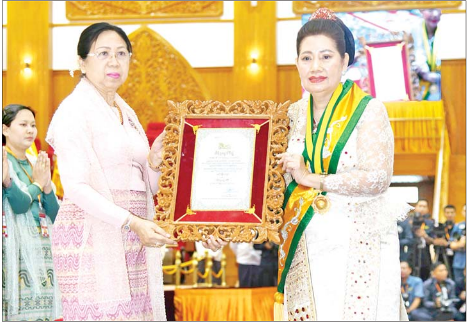
နိုင်ငံတော်စီမံအုပ်ချုပ်ရေးကောင်စီဥက္ကဋ္ဌ နိုင်ငံတော်ဝန်ကြီးချုပ် ဗိုလ်ချုပ်မှူးကြီး မင်းအောင်လှိုင်၏ ဇနီး ဒေါ်ကြူကြူလှ သီရိသုဗ္ဗမ္မသီကီဘွဲ့ရ ဒေါ်နီနီကျော်အား ဘွဲ့တံဆိပ်နှင့် အဆောင်အယောင်များ ချီးမြှင့်အပ်နှင်းစဉ်။