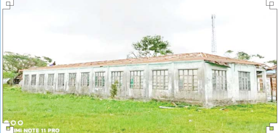
မိုခါမုန်တိုင်းဒဏ်ကြောင့် ပျက်စီးသွားသည့် ပေါက်တောမြို့နယ် အထက(အဆောင်-၅)ကို တွေ့ရစဉ်။