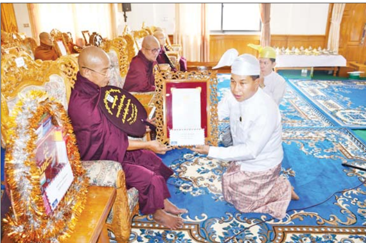
စစ်ကိုင်းတိုင်းဒေသကြီးဝန်ကြီး ချုပ် ဦးမြတ်ကျော် ၂၀၂၄ ခုနှစ် သာသနာ တော်ဆိုင်ရာ ဘွဲ့တံဆိပ်တော်ရ ဆရာတော်ကြီးအား ဘွဲ့တံဆိပ်တော် ဆက်ကပ်လှူဒါန်းစဉ်။