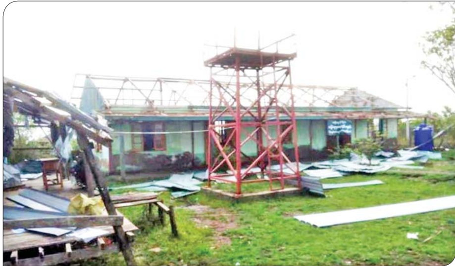
မိုခါမုန်တိုင်းဒဏ်ကြောင့် ပျက်စီးသွားသည့် ပေါက်တောမြို့နယ် မူလွန် သိမ်ကျောင်းမော်ပင်မဆောင်ကို တွေ့ရစဉ်။

ဆေးခန်းများ၊ ဆည်မြောင်းတာဝန်များ၊ လမ်းတံတားများနှင့် အိမ်မွေးတိရစ္ဆာန်များ၊ မွေးမြူရေးတိရစ္ဆာန်များ သေကျေပျက်စီးခဲ့ရသည်။ အဆိုပါ ပျက်စီးဆုံးရှုံးမှုများကို စာမျက်နှာ ၁၃ သို့ »»