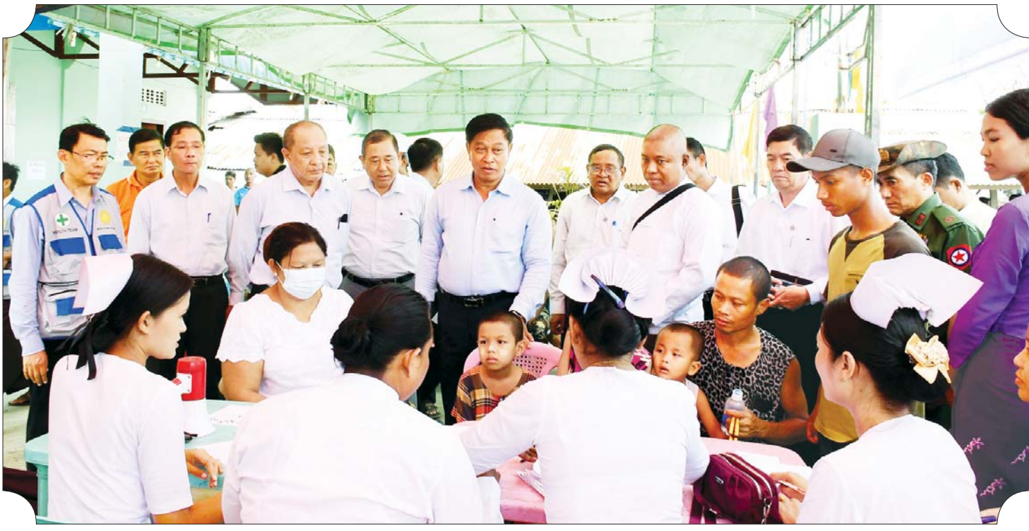
နိုင်ငံတော်စီမံအုပ်ချုပ်ရေးကောင်စီအဖွဲ့ဝင် ဒုတိယဝန်ကြီးချုပ်နှင့် ပြည်ထောင်စုဝန်ကြီး ဗိုလ်ချုပ်ကြီးတင်အောင်စန်းနှင့် အဖွဲ့ဝင်များ ၂၀၂၃ ခုနှစ် မေ ၂၄ ရက်က ပေါက်တောမြို့နယ်အတွင်း အခမဲ့ ကွင်းဆင်းဆေးကုသမှုလုပ်ငန်းများ ဆောင်ရွက်နေမှုအား ကြည့်ရှုအားပေးစဉ်။

အလွန်အလွန် အင်အားပြင်းထန်သော ဆိုင်ကလုန်းမုန်တိုင်း “မိုခါ”သည် ဘင်္ဂလားဒေ့ရှ်နိုင်ငံ ကော့ဘာဇားမြို့နှင့် မြန်မာနိုင်ငံ ကျောက်ဖြူမြို့တို့အကြား စစ်တွေမြို့အနီးမှ ဖြတ်ကျော်ဝင်ရောက်နိုင်သည်ဟု အမျိုးသားသဘာဝဘေးအန္တရာယ်ဆိုင်ရာ စီမံခန့်ခွဲမှုကော်မတီက ခန့်မှန်းခဲ့ပြီး မုန်တိုင်းဖြတ်သန်းတိုက်ခတ်နိုင်သည့် အခြေအနေ၊ သဘာဝဘေးအန္တရာယ်ကြောင့် ထိခိုက်ခံရနိုင်မှု အခြေအနေတို့အပေါ်မူတည်၍ စစ်တွေမြို့နယ်၊ ကျောက်ဖြူမြို့နယ်၊ မောင်တောမြို့နယ်၊ ရသေ့တောင်မြို့နယ်၊ မြေပုံမြို့နယ်၊ မာန်အောင်မြို့နယ်တို့ကို ဘေးအန္တရာယ်ကျရောက်နိုင်ခြေမြင့်မားသည့် အနီရောင်အဆင့်ဒေသများအဖြစ် အသိပေး