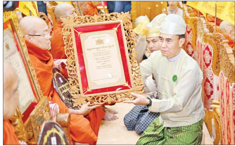
ပြည်ပဆရာတော်၊ သံဃာတော် ရာမဏ္ဍပ်များမှ ဆွမ်းဆန်စိမ်းနှင့် ဘွဲ့သံသီလရှင်ဆရာကြီး လှူဒါန်းပေးအပ်ပူဇော်ခံယူ များအား မာရဝိဇယဗုဒ္ဓဥယျာဉ် တော်ပရိဂုဏ်အတွင်းရှိ သက်ဆိုင်သည်။ သတင်းစဉ်