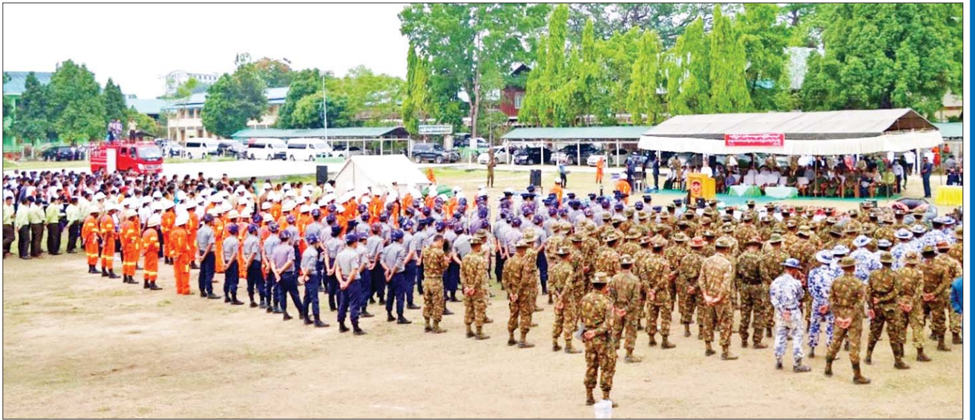
အားကောင်းသော မိုခါဆိုင်ကလုန်းမုန်တိုင်း မြန်မာနိုင်ငံရခိုင်ကမ်းရိုးတန်းသို့ မဝင်ရောက်မီ ၉ ရက်အလိုကပင် ကူညီကယ်ဆယ်ရေးလုပ်ငန်းများ ဆောင်ရွက်နိုင်ရန် ကြိုတင်စုဖွဲ့ ဇာတ်တိုက်လေ့ကျင့်မှုများကို ပြည်နယ်နှင့် တိုင်းဒေသကြီးများတွင် ကြိုတင်ဆောင်ရွက်ခဲ့ကြစဉ်။

ထိခိုက်မှုနည်းပါး ဘယ်လိုပဲဖြစ်ဖြစ် ရခိုင်ပြည်နယ်ဟာ