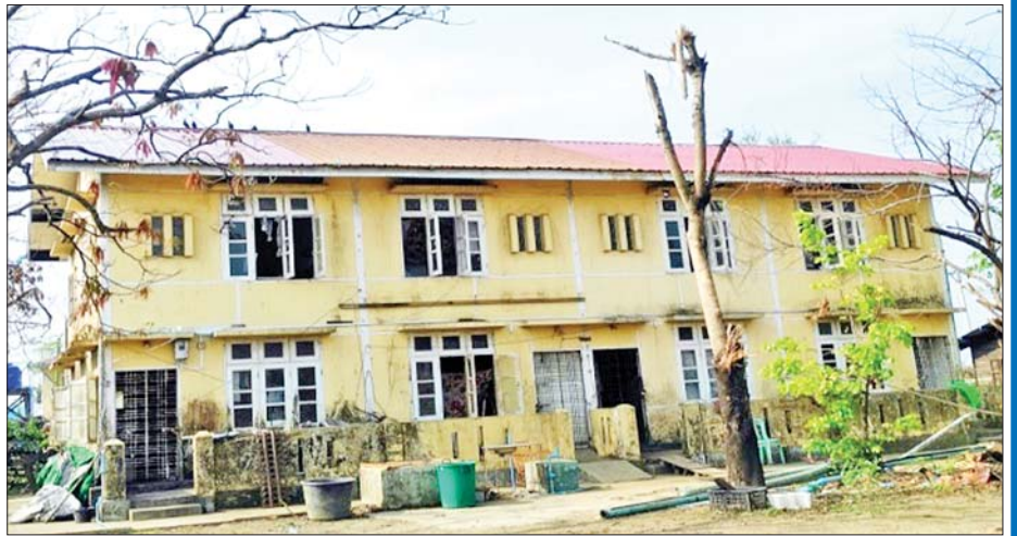
ပုဏ္ဏားကျွန်းမြို့နယ်ရှိ အဆောက်အအုံများ ပြန်လည်ပြုပြင်ပြီးစီးမှုကို တွေ့ရစဉ်။

»» စာမျက်နှာ ၈ မှ ရခိုင်ပြည်နယ်အတွင်း မုန်တိုင်းဒဏ်သင့် မြို့ရွာတွေ သန့်ရှင်းသောသောက်သုံးရေ ရရှိစေရေးအတွက် ရွှေလျားရေသန့်ကားတွေ၊ Life Straw (ရေနောက်မှ ရေကြည်သို့ သန့်စင်ပေးသည့်) ရေသန့်စက်တွေ၊ ဆိုလာစနစ်သုံး ရွှေလျားရေသန့်စက်တွေနဲ့ ဖြန့်ဝေ ပေးလျက်ရှိပါတယ်။ လျှပ်စစ်ဓာတ်အားမလိုအပ်တဲ့ တစ်နာရီလျှင် သုံးဂါလန်ခန့် သန့်စင်ပေးနိုင်တဲ့ Life Straw ရေသန့်စက်တွေကို ပုဏ္ဏားကျွန်းမြို့နယ် အတွင်းရှိ ကျေးရွာတွေကို ဖြန့်ဝေပေးပို့ထားပြီး ယင်း ရေသန့်စက်တစ်လုံးဟာ လူဦးရေ ၁၀၀ အတွက် တစ်နေ့တာသောက်သုံးရေကိုလုံလောက်စွာသန့်စင် ပေးနိုင်ကြောင်း သိရပါတယ်။