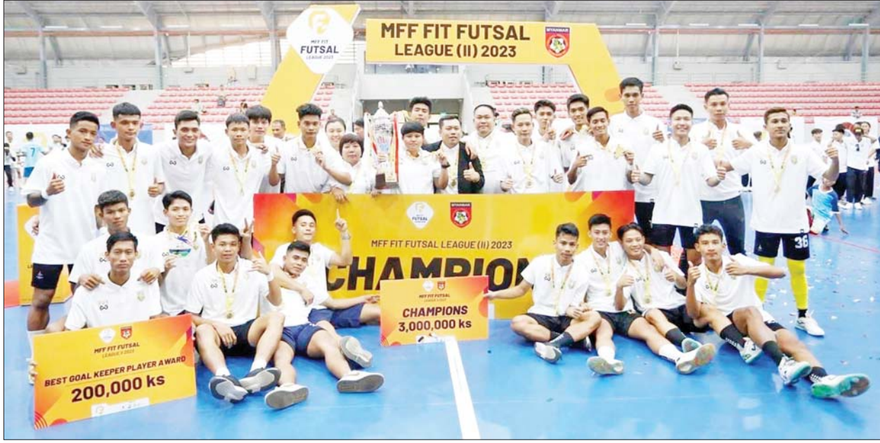
YRG အသင်း ကစားသမားများ အောင်ပွဲခံနေစဉ်။