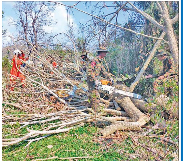
ပုဏ္ဏားကျွန်းမြို့နယ်အတွင်း မိုခါဆိုင်ကလုန်း မုန်တိုင်းကြောင့် ထိခိုက်ပျက်စီးမှုများကို တပ်မတော်သားများ၊ ရဲတပ်ဖွဲ့ဝင်များ၊ မီးသတ်တပ်ဖွဲ့ဝင်များ ပူးပေါင်း၍ အားကြီးမာန်တက်ရှင်းလင်းဆောင်ရွက်နေကြစဉ်။