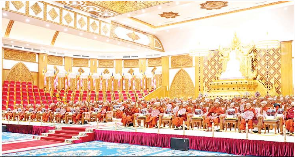
နိုင်ငံတော်စီမံအုပ်ချုပ်ရေးကောင်စီဥက္ကဋ္ဌ နိုင်ငံတော်ဝန်ကြီးချုပ် ဗိုလ်ချုပ်မှူးကြီး မင်းအောင်လှိုင်နှင့်ဇနီး ဒေါ်ကြူကြူလှ နိုင်ငံတော်သံဃမဟာနာယကအဖွဲ့ ဥက္ကဋ္ဌ သန့်လျင်မင်းကျောင်းဆရာတော်ကြီးထံမှ ငါးပါးသီလခံယူဆောက်တည်ကြစဉ်။

◆ ရှေ့ဖုံးမှ ပြည်တွင်း၊ ပြည်ပဘွဲ့ခံ ဆရာတော် ၁၀၈ ပါးနှင့် ဘွဲ့ခံသီလရှင်ဆရာကြီး နှစ်ပါးတို့ ကြွရောက်ချီးမြှင့်တော် မူကြပြီး နိုင်ငံတော်စီမံအုပ်ချုပ်ရေး ကောင်စီဥက္ကဋ္ဌ နိုင်ငံတော်ဝန်ကြီး ချုပ်နှင့်ဇနီးတို့နှင့်အတူ နိုင်ငံတော် စီမံအုပ်ချုပ်ရေးကောင်စီဒုတိယ ဥက္ကဋ္ဌ ဒုတိယဝန်ကြီးချုပ် ဒုတိယ ဗိုလ်ချုပ်မှူးကြီး စိုးဝင်းနှင့်ဇနီး ဒေါ်သန်းသန်းနွယ်၊ ကောင်စီ အတွင်းရေးမှူးနှင့်ဇနီး၊ တွဲဖက် အတွင်းရေးမှူးနှင့် ဇနီး၊ ကောင်စီဝင်များနှင့် ဇနီးများ၊ ပြည်ထောင်စုအဆင့် ပုဂ္ဂိုလ်များ၊ ပြည်ထောင်စု ဝန်ကြီးများနှင့် ဇနီးများ၊ နေပြည်တော်ကောင်စီ ဥက္ကဋ္ဌ ကာကွယ်ရေးဦးစီးချုပ်ရုံးမှ အဆင့်မြင့်တပ်မတော်အရာရှိကြီး များနှင့်ဇနီးများ၊ နေပြည်တော် တိုင်းစစ်ဌာနချုပ် တိုင်းမှူးနှင့်