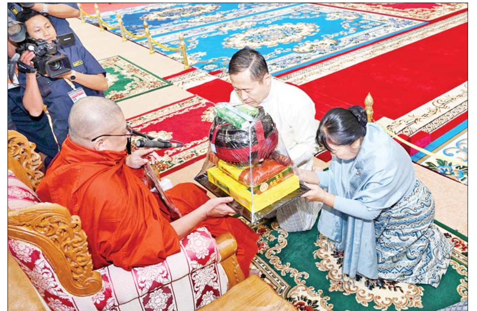
နိုင်ငံတော်စီမံအုပ်ချုပ်ရေးကောင်စီ ဒုတိယဥက္ကဋ္ဌ ဒုတိယဝန်ကြီးချုပ် ဒုတိယဗိုလ်ချုပ်မှူးကြီး စိုးဝင်းနှင့်ဇနီး ဒေါ်သန်းသန်းနွယ် နိုင်ငံတော်သံဃမဟာနာယကအဖွဲ့ အကျိုးတော်ဆောင် မန္တလေးမြို့ မစိုးရိမ်တိုက်သစ် မဟာနာယက ဆရာတော်ကြီးထံ လှူဖွယ်ဝတ္ထုပစ္စည်းများကို ဆက်ကပ်လှူဒါန်းကြစဉ်။

တာဝန်ရှိသူများ တက်ရောက် ကြည့်ညိုကြသည်။ အခမ်းအနား မစတင်မီ နိုင်ငံတော်စီမံ အုပ်ချုပ်ရေး ကောင်စီဥက္ကဋ္ဌ နိုင်ငံတော်ဝန်ကြီး ချုပ်က အဂ္ဂိဗိပတိသာသနာ့ ဗိမာန် တော်ကြီးအတွင်းရှိ မာရဝိဇယ နောင်တော်ကြီး ဗုဒ္ဓရုပ်ပွားတော် မြတ်အား မြသပိတ်ဆွမ်းတော်၊