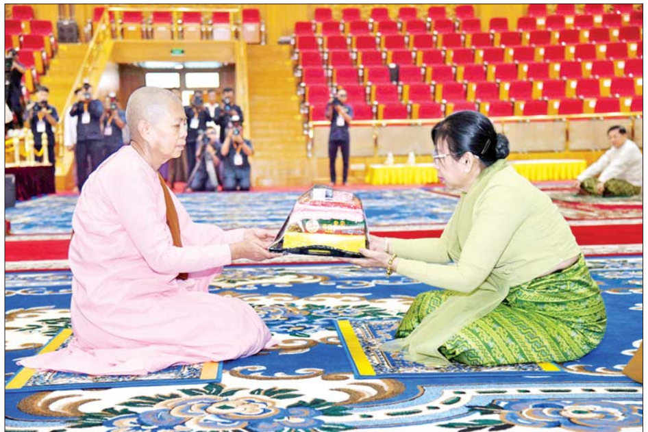
နိုင်ငံတော်စီမံအုပ်ချုပ်ရေးကောင်စီဥက္ကဋ္ဌ နိုင်ငံတော်ဝန်ကြီးချုပ် ဗိုလ်ချုပ်မှူးကြီး မင်းအောင်လှိုင်၏ ဇနီး ဒေါ်ကြူကြူလှ ဘွဲ့တံဆိပ်တော်ဆက်ကပ်ခံယူမည့် သီလရှင်ဆရာကြီးအား လှူဖွယ်ဝတ္ထုပစ္စည်းများ ဆက်ကပ်လှူဒါန်းစဉ်။