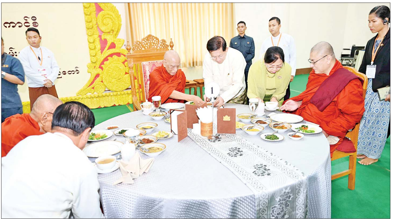
နိုင်ငံတော်စီမံအုပ်ချုပ်ရေးကောင်စီဥက္ကဋ္ဌ နိုင်ငံတော်ဝန်ကြီးချုပ် ဗိုလ်ချုပ်မှူးကြီး မင်းအောင်လှိုင်နှင့်ဇနီး ဒေါ်ကြူကြူလှ ဆရာတော် ကြီးများအား နေ့ဆွမ်းဆက်ကပ်လှူဒါန်းစဉ်။

သစ်သီး၊ ပန်းမန်၊ သောက်တော် ရေချမ်းနှင့် ဆီမီးကပ်လှူပူဇော် သည်။ နာယူကြည်ညို ထို့နောက် အခမ်းအနားကို “နမော တဿ” သုံးကြိမ်ရွတ်ဆို ဘုရားကန်တော့ ဖွင့်လှစ်၍ နိုင်ငံ တော်စီမံအုပ်ချုပ်ရေးကောင်စီ ဥက္ကဋ္ဌ နိုင်ငံတော်ဝန်ကြီးချုပ်နှင့် ဇနီး အမှူးပြုသော ဧည့်ပရိသတ် များက နိုင်ငံတော် သံဃမဟာ နာယကအဖွဲ့ ဥက္ကဋ္ဌ သန့်လျင် မင်းကျောင်း ဆရာတော်ဘုရား ကြီးထံမှ ငါးပါးသီလခံယူဆောက် တည်ကြပြီး သံဃာတော် အရှင် သုမြတ်များ ရွတ်ပွားသရဇ္ဈာယ် တော်မူသော မေတ္တသုတ်ပရိတ် တရားတော်များကို နာယူကြည်ညို ကြသည်။ ယင်းနောက် နိုင်ငံတော်စီမံ အုပ်ချုပ်ရေးကောင်စီဥက္ကဋ္ဌ နိုင်ငံ