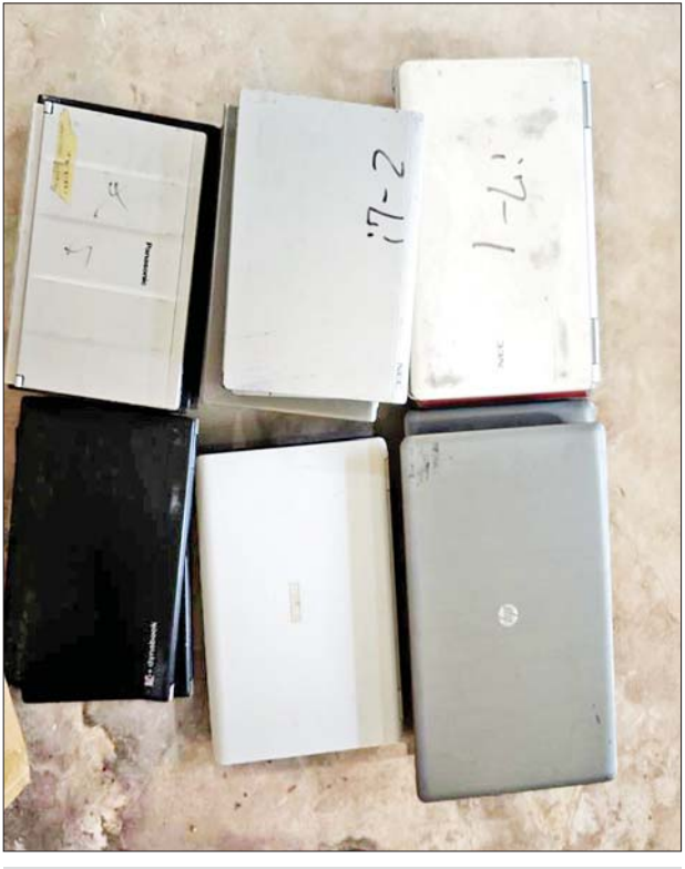
ကရင်ပြည်နယ်၌ သိမ်းဆည်းရမိမှု

တရားမဝင် ကုန်သွယ်မှု တိုက်ဖျက်ရေး ဦးဆောင် ကော်မတီ၏ ကြီးကြပ်ကွပ်ကဲမှု ဖြင့် တရားမဝင် ကုန်သွယ်မှုများကို ဥပဒေနှင့်အညီ ထိရောက်စွာ တားဆီးအရေးယူနိုင်ရေး ဆောင်ရွက်လျက်ရှိရာ အကောက်ခွန်ဦးစီးဌာန၏ စီမံခန့်ခွဲမှုဖြင့် တာဝန်ကျ ပူးပေါင်းအဖွဲ့များက စစ်ဆေးမှုများ ဆောင်ရွက်ရာ မတ် ၂၀ ရက်တွင် ကုန်းတွင်းဆိပ်ကမ်း ရွာသာကြီး (Dry Port)၌ ကုန်သေတ္တာတစ်လုံးအတွင်းမှ ကုန်ပစ္စည်းများ မှုစွန့်လွှတ်ကြောင်း လျှောက်ထားလာသည့် Bickford's သစ်သီးဖျော်ရည် ဘူး ၄၈၀ အပါအဝင် ကုန်ပစ္စည်း ၂၃ မျိုး (ခန့်မှန်းတန်ဖိုး ၆၅၀၄၅၉၅၄ ကို လည်းကောင်း၊ မြန်မာ့စက်မှုဆိပ်ကမ်း၌ ကုန်သေတ္တာလေးလုံး အတွင်းမှ သွင်းကုန် ကြေညာလွှာတွင် ကြေညာထားသည့် ကွလွဲစွာပါရှိလာသည့် Freedom Craft Solar Battery အလုံး ၂၈၀၊ Xingfa Aluminium Profiles ကီလိုဂရမ် ၃၉၃၀ အပါအဝင် ကုန်ပစ္စည်း ၁၇ မျိုး ခန့်မှန်းတန်ဖိုး ၅၅၀၀၀၀ ကို လည်းကောင်း စုစုပေါင်း ခန့်မှန်းတန်ဖိုး ၅၀၀၀၀၀ ကို သိမ်းဆည်းရမိခဲ့ပြီး အကောက်ခွန် လုပ်ထုံးလုပ်နည်းများနှင့်အညီ အရေးယူ ဆောင်ရွက်လျက်ရှိပါသည်။ ထို့ပြင် မတ် ၂၁ ရက်တွင် ကရင်ပြည်နယ် တရားမဝင်ကုန်သွယ်မှု