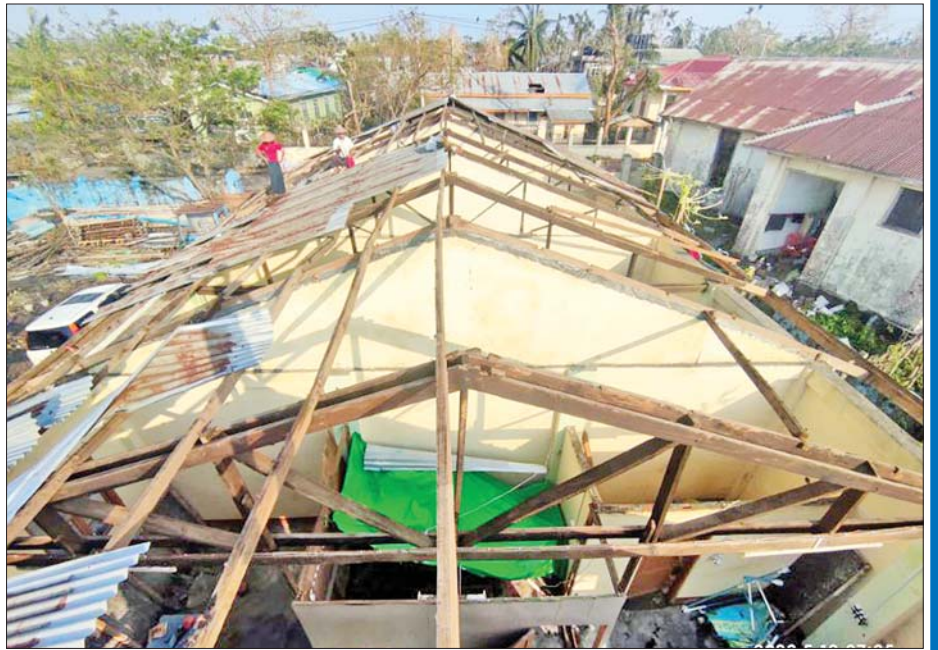
ပုဏ္ဏားကျွန်းမြို့နယ်အတွင်း အပျက်အစီးများကို ဖယ်ရှားခြင်းနှင့် ပြန်လည်ထူထောင်ရေးလုပ်ငန်းများကို အင်တိုက်အားတိုက်ဆောင်ရွက်ခဲ့ကြသည်။