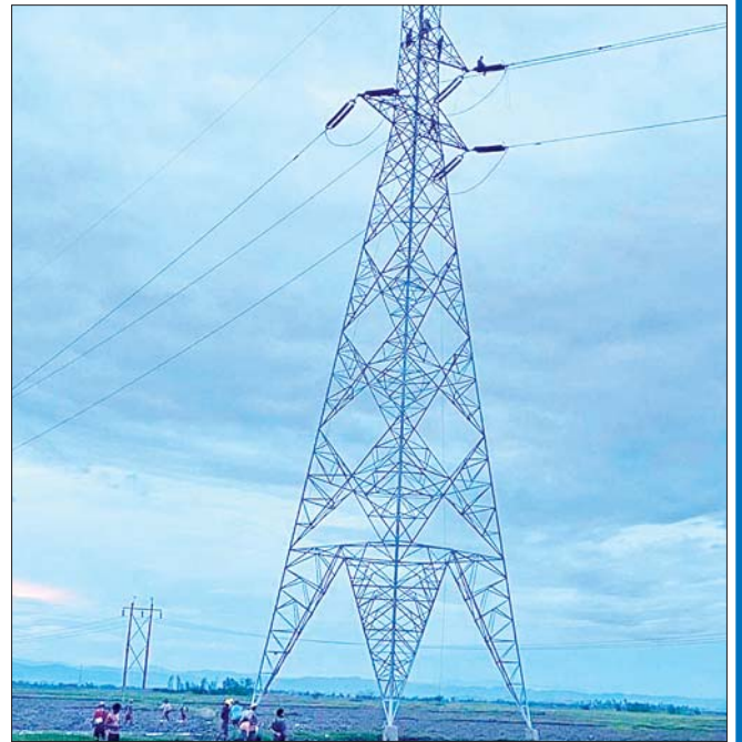
ပုဏ္ဏားကျွန်း ပင်မဓာတ်အားခွဲရုံ ပြန်လည်ပြုပြင်ပြီးစီးမှုကို တွေ့ရစဉ်။(ဝဲပုံ) နှင့် ၂၃၀ ကေပီ အမ်း-ပုဏ္ဏားကျွန်း ဓာတ်အားလိုင်းရှိ တိုင်အမှတ်-၄၂၅ ပြုပြင်ဆောင်ရွက်ပြီးစီးမှုကို တွေ့ရစဉ်။(ယာပုံ)