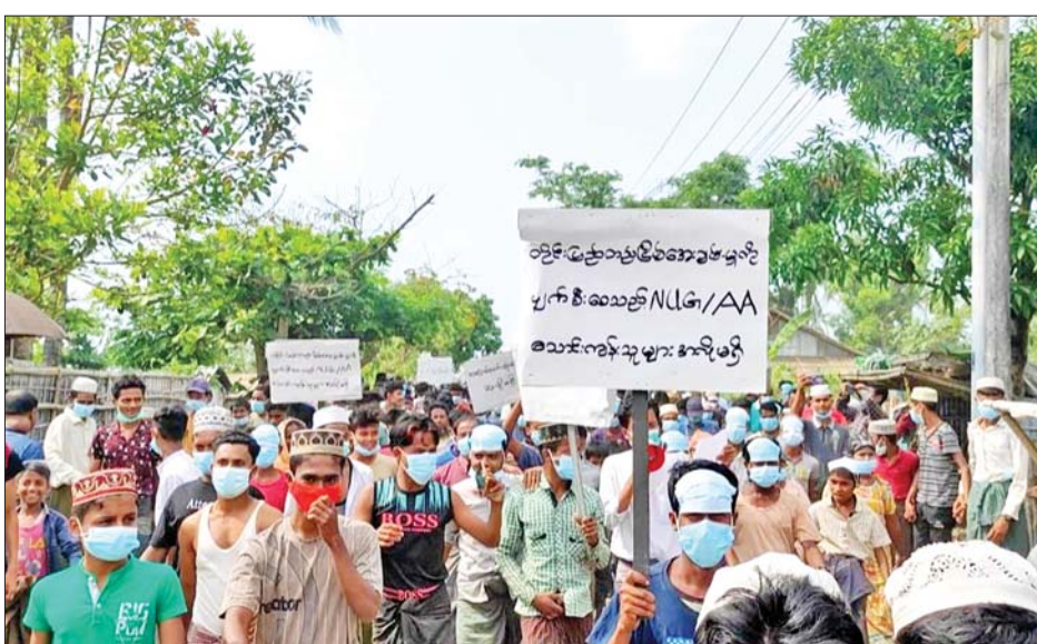
အကြမ်းဖက်တိုက်ခိုက်မှုအလိုမရှိ စသည့် ကြွေးကြော် ကြွေးကြော်ခဲ့ကြပြီး ဆန္ဒထုတ်ဖော်ပွဲကို အောင်မြင်သံများကို မြန်မာ-ဘင်္ဂါလီ နှစ်ဘာသာဖြင့် သံပြိုင်စွာ ကျင်းပခဲ့ကြကြောင်း သိရသည်။ သတင်းစဉ်

ထိုသို့ ကန့်ကွက်ရှုတ်ချလျက်ရှိရာ ယနေ့နံနက် ၉ နာရီခွဲခန့်တွင် ရခိုင်ပြည်နယ် စစ်တွေမြို့နယ် ဘုမေကျေးရွာနှင့် ဘာဆာရာကျေးရွာတို့မှ ဒေသတည်ငြိမ်အေးချမ်းရေးကိုလိုလားသည့် ဘင်္ဂါလီလူမျိုးအင်အား ၁၅၀၀ ကျော်သည် ဘုမေကျေးရွာရှိ သတ်မှတ်စုရပ်နေရာ၌ စုဝေးပြီး ၎င်းစုရပ်နေရာမှ ဘုမေကျေးရွာနှင့် ဘာဆာရာကျေးရွာခြင်းဆက်လမ်းကြောင်းအတိုင်း ငြိမ်းချမ်းစွာ စီတန်းလှည့်လည်ချီတက်၍ ဆန္ဒဖော်ထုတ်ကြကာ နံနက် ၁၀ နာရီခွဲခန့်တွင် အေးချမ်းစွာ လူစုခွဲခဲ့ကြသည်။ ချီတက်ရာ လမ်းတစ်လျှောက်တွင် “AA အလိုမရှိ၊ စစ်တွေမြို့ကိုကာကွယ်ကြ၊ တိုက်ပွဲအလိုမရှိ၊ လူနေရပ်ကွက်ထဲကို လက်နက်ကြီးနှင့် ပစ်ခတ်နေသည့် AA သောင်းကျန်းသူအလိုမရှိ၊ စစ်တွေမြို့ တည်ငြိမ်အေးချမ်းရေးကို ဖျက်ဆီးနေသော AA သောင်းကျန်းသူအဖွဲ့အလိုမရှိ၊ တိုင်းပြည်တည်ငြိမ်အေးချမ်းမှုကို ဖျက်ဆီးနေသော NUG၊ AA အလိုမရှိ”