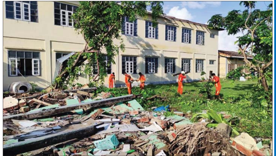
ပုဏ္ဏားကျွန်းမြို့နယ်အတွင်း မိုခါဆိုင်ကလုန်း မုန်တိုင်းကြောင့် ထိခိုက်ပျက်စီးမှုများကို ရှင်းလင်းဆောင်ရွက်နေစဉ်။