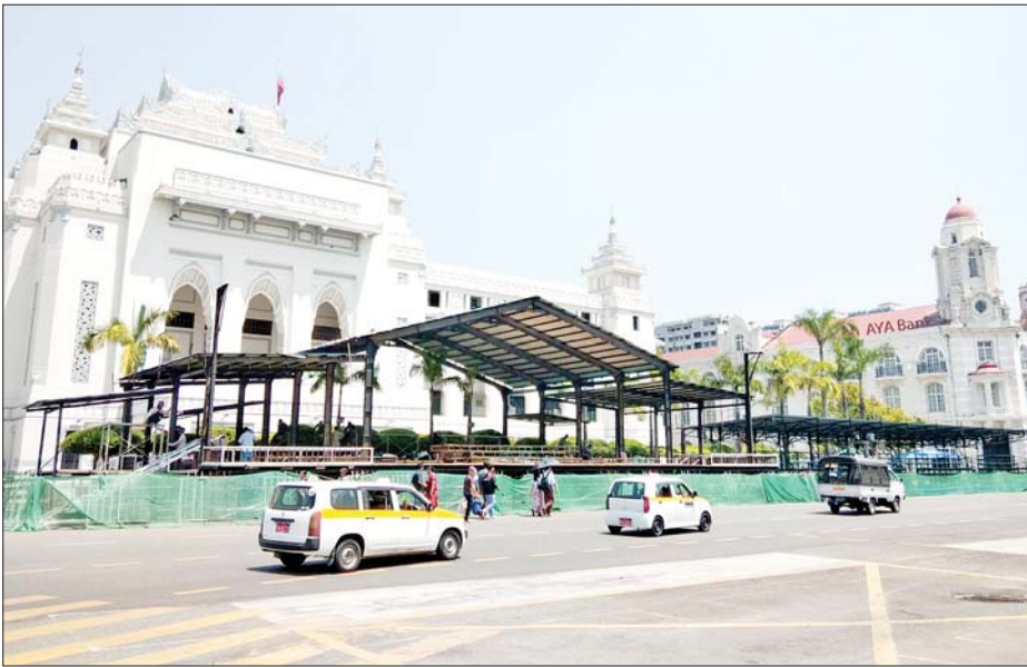
ရန်ကုန်မြို့တော် မဟာသင်္ကြန်မဏ္ဍပ် တည်ဆောက်ပြီးစီးနေမှုကို မတ် ၂၃ ရက် နံနက်ပိုင်းက တွေ့ရစဉ်။

ရန်ကုန်မြို့တော် မဟာသင်္ကြန်မဏ္ဍပ်အား ရန်ကုန်မြို့တော်စည်ပင်သာယာရေး ကော်မတီ၏ ကြီးကြပ်မှုဖြင့် ပြင်ပပညာရှင်လုပ်သားများက တည်ဆောက်နေကြခြင်းဖြစ်ပြီး ဖျော်ဖြေရေးမဏ္ဍပ်၏ အကျယ်အဝန်း(၉၄x၄၈)ပေ ရှိမည်ဖြစ်ကာ ရေကစားမဏ္ဍပ်၏ စာမျက်နှာ ၂၃ ကော်လံ ၁ သို့ ○