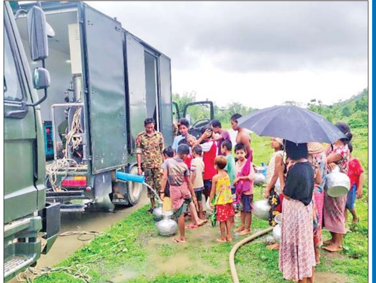
ပုဏ္ဏားကျွန်းမြို့နယ်အတွင်းရှိ ပြည်သူများ အရေးတကြီးလိုအပ်လျက်ရှိသော သောက်သုံးရေများကို ကျေးရွာများအရောက် ရေကားများဖြင့် ဤသို့ ဖြန့်ဝေပေးခဲ့ကြသည်။