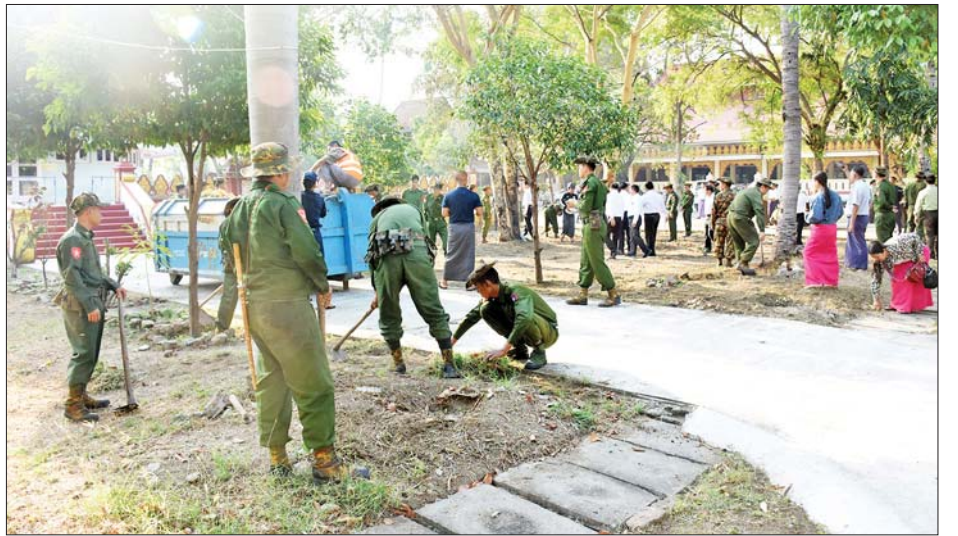
သားများနှင့် မိသားစုဝင်များ၊ မြန်မာနိုင်ငံရဲတပ်ဖွဲ့ဝင်များ၊မီးသတ်တပ်ဖွဲ့ဝင်များ၊ကြက်ခြေနီတပ်ဖွဲ့ဝင်များ၊ဌာနဆိုင်ရာဝန်ထမ်းများ၊ စစ်မှုထမ်းဟောင်းအဖွဲ့ဝင်များ၊ ပြည်သူ့စစ်တပ်ဖွဲ့ဝင်များ၊ စေတနာ့ဝန်ထမ်း

မန္တလေးတိုင်းဒေသကြီးအတွင်း မြို့နယ်အသီးသီးရှိ ဘုရား၊စေတီပုထိုးများ၊ဘုန်းကြီးကျောင်းများ၊ ဆေးရုံများ၊ အခြေခံပညာစာသင်ကျောင်းများ၊ တက္ကသိုလ်များ၌ သန့်ရှင်းသာယာလှပရေးအတွက် တိုင်းစစ်ဌာနချုပ်မှ နယ်မြေခံတပ်မတော်