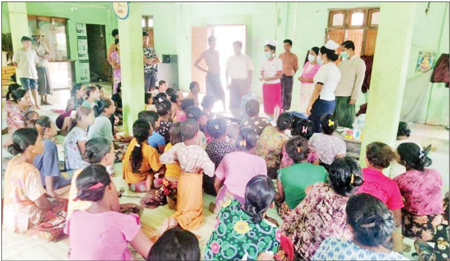
ပုဏ္ဏားကျွန်းမြို့နယ်အတွင်းရှိ ဒေသခံပြည်သူများအား ကျန်းမာရေးစောင့်ရှောက်မှုများ ဆောင်ရွက်ပေးစဉ်။

ပုဏ္ဏားကျွန်း မြို့ပေါ်ရပ်ကွက်တွေမှာ မိုခါဆိုင်ကလုန်းမုန်တိုင်းကြောင့် သောက်သုံးရေအခက်အခဲဖြစ်နေတဲ့ ပြည်သူတွေအတွက် သောက်သုံးရေပြတ်လပ်မှုတွေ မဖြစ်ပေါ်စေဖို့ နယ်မြေခံတပ်မတော်မှ ရေဂါလန် ၂၀၀၀ ဆုံ ယာဉ်နဲ့ နေ့စဉ်လှူဒါန်းပေးခဲ့ပါတယ်။ မိုခါမုန်တိုင်းကြောင့် ရေရှားပါးမှုနဲ့ ကြုံတွေ့ခဲ့တဲ့ ရပ်ကွက်/ကျေးရွာတွေကို သန့်ရှင်းတဲ့ သောက်သုံးရေတွေကို စဉ်ဆက်မပြတ် ဆက်လက်ဖြန့်ဝေပေးနိုင်ခဲ့ပါတယ်။ နယ်စပ်ရေးရာဝန်ကြီးဌာနနဲ့ သမဝါယမနှင့် ကျေးလက်ဖွံ့ဖြိုးရေးဝန်ကြီးဌာနတို့အနေနဲ့ စာမျက်နှာ ၉ သို့ »»