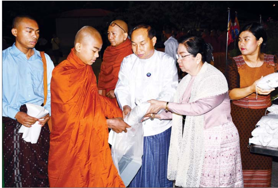
အလှူရှင်များက ဝတ္ထုငွေနှင့် ဆွမ်းဆန်စိမ်းများ လောင်းလှူကြသည်။ ဆက်လက်၍ တိုင်းဒေသကြီးဝန်ကြီးချုပ်နှင့် တာဝန်ရှိသူများက ဆွမ်းဆန်စိမ်းများ လောင်းလှူနေမှုကို ကြည့်ရှုအားပေးသည်။ ယင်းနောက် အဆိုပါကျောင်းတိုက်ကြီးအတွင်းရှိ သီတဂူသံဝေဇနိယဓမ္မဗိမာန်တော်ကြီး၌ စစ်ကိုင်း

စစ်ကိုင်းတိုင်းဒေသကြီး စစ်ကိုင်းမြို့ စစ်ကိုင်းတောင်ရိုး သီတဂူကမ္ဘာ့ဗုဒ္ဓတက္ကသိုလ်များ၏ အဓိပတိဆရာတော် ဒေါက်တာဘဒ္ဒန္တဉာဏိဿရ ကြီးမှူး၍ စစ်ကိုင်းတောင်ရိုးရှိ သံဃာအပါး ၁၀၀၀ ဆွမ်းဆန်စိမ်းလောင်းလှူပွဲ မင်္ဂလာအခမ်းအနားကို မတ် ၂၃ ရက် နံနက်ပိုင်းတွင် စစ်ကိုင်းမြို့ စစ်ကိုင်းတောင်ရိုး သီတဂူဝိပဿနာအကယ်ဒမီကျောင်းတိုက်ကြီးအတွင်း ကျင်းပရာ ဆွမ်းဆန်စိမ်းလောင်းလှူပွဲသို့ သီတဂူကမ္ဘာ့ဗုဒ္ဓတက္ကသိုလ်များ၏ အဓိပတိဆရာတော် ဒေါက်တာဘဒ္ဒန္တဉာဏိဿရ၊ ပင့်သံဃာဆရာတော်၊ သံဃာတော်များ၊ တိုင်းဒေသကြီးဝန်ကြီးချုပ် ဦးမြတ်ကျော်နှင့် ဇနီး၊ တိုင်းဒေသကြီးအစိုးရအဖွဲ့ဝင်များ၊ တိုင်းဒေသကြီး/ခရိုင်/မြို့နယ်အဆင့် ဌာနဆိုင်ရာ၊ မြို့မိမြို့ဖများနှင့် အလှူရှင်များ တက်ရောက်ကြသည်။