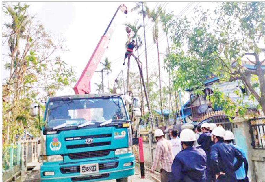
ပုဏ္ဏားကျွန်းမြို့နယ်အတွင်း ဓာတ်အားလိုင်းနှင့် ထရန်စဖော်မာများ ပြန်လည်ပြုပြင်ဆောင်ရွက်နေသည်ကို တွေ့ရစဉ်။

မိုခါမုန်တိုင်းတိုက်ခတ်မှုကြောင့် ပျက်စီးသွားခဲ့တဲ့ ရခိုင်ပြည်နယ် ပုဏ္ဏားကျွန်းမြို့မှာရှိတဲ့ ၂၃၀ ကေစီ ပင်မဓာတ်အားခွဲရုံ ပြန်လည်ထူထောင်ရေးလုပ်ငန်းကို လျှပ်စစ်စွမ်းအားဝန်ကြီးဌာနမှ အင်ဂျင်နီယာတွေနဲ့ ကျွမ်းကျင်လုပ်သားတွေက ပြန်လည်တည်ဆောက်ရေး လုပ်ငန်းတွေကို ဆောင်ရွက်ခဲ့ရာမှာ မေ ၂၅ ရက်နေ့မှာပဲ ၉၀ ရာခိုင်နှုန်းအထိ ပြီးစီးခဲ့ကြောင်းသိပါတယ်။ လျှပ်စစ်စွမ်းအင်ဝန်ကြီးဌာနမှ အင်ဂျင်နီယာနဲ့ ကျွမ်းကျင်