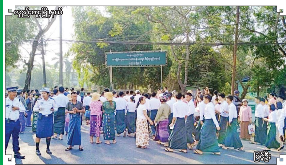
လှည်းကူးမြို့နယ်