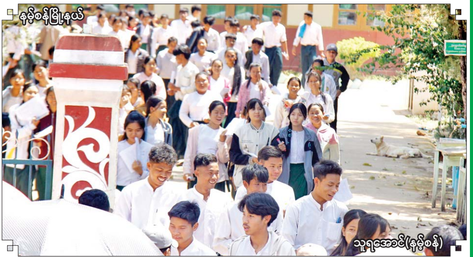
နမ့်စန်မြို့နယ်