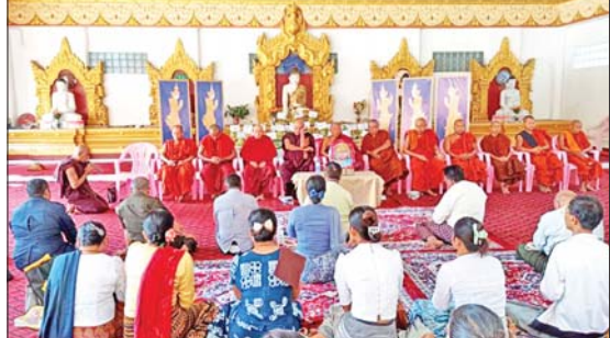
ရွတ်ဖတ်ပူဇော်သွားမည်ဖြစ်ကြောင်း သိရသည်။

သဲကုန်း မတ် ၁၂ ပဲခူးတိုင်းဒေသကြီး သဲကုန်းမြို့နယ်အတွင်းရှိ ပြည်သူများ ဘေးဥပဒ်အန္တရာယ်အပေါင်းမှ ကင်းဝေးစေရန်အတွက် ယနေ့ နံနက် ၉ နာရီက အသံမစွဲပွါတသန္တိသုတ်တော်ရွတ်ဖတ်ပူဇော်ပွဲ အခမ်းအနားကို မြို့မရပ်ကွက် မိုးကောင်းဘုရားကြီးဓမ္မာရုံ၌ ကျင်းပသည်။