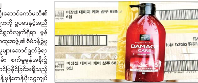
မန္တလေးတိုင်းဒေသကြီး၌ ဖမ်းဆီးရမိမှု။

နေပြည်တော် မတ် ၁၂ တရားမဝင်ကုန်သွယ်မှုတိုက်ဖျက်ရေး ဦးဆောင်ကော်မတီ၏ ကြီးကြပ်ကွပ်ကဲမှုဖြင့် တရားမဝင်ကုန်သွယ်မှုများကို ဥပဒေနှင့်အညီ ထိရောက်စွာတားဆီးအရေးယူနိုင်ရေး ဆောင်ရွက်လျက်ရှိရာ မွန် ပြည်နယ် တရားမဝင်ကုန်သွယ်မှုတိုက်ဖျက်ရေးအထူးအဖွဲ့၏ စီမံခန့်ခွဲမှု ဖြင့် တာဝန်ကျပူးပေါင်းအဖွဲ့များက စစ်ဆေးမှုများဆောင်ရွက်ခဲ့ရာ မတ် ၇ ရက်တွင် မော်လမြိုင်-ဘားအံကားလမ်း စက်မှုဇုန်အနီး၌ တရားဝင်စာရွက်စာတမ်း အထောက်အထားတင်ပြနိုင်ခြင်းမရှိသည့် ရော်ဘာနေလုပ်ပေးပြား ကီလိုဂရမ် ၈၀၀၀ (ခန့်မှန်းတန်ဖိုးငွေကျပ် ၂၉၉၀၀၀၀)ကို ပို့ကုန်သွင်းကုန်ဥပဒေအရလည်းကောင်း၊ မတ် ၁၁ ရက်တွင် သထုံမြို့နယ် လေးတိုင်ကျေးရွာအနီး၌ တရားမဝင်အခြားသစ် ၁ ဒသမ ၂၀၆ တန် (ခန့်မှန်းတန်ဖိုးငွေကျပ် ၈၄၄၂၀)ကို သစ်တောဥပဒေ အရလည်းကောင်း စုစုပေါင်းခန့်မှန်းတန်ဖိုးငွေကျပ် ၂၉၉၈၄၄၂၀ ကို သိမ်းဆည်းအရေးယူဆောင်ရွက်လျက်ရှိသည်။