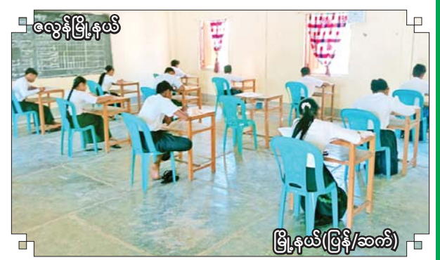
လွန်မြို့နယ်