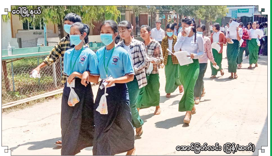
ဝေါမြို့နယ်