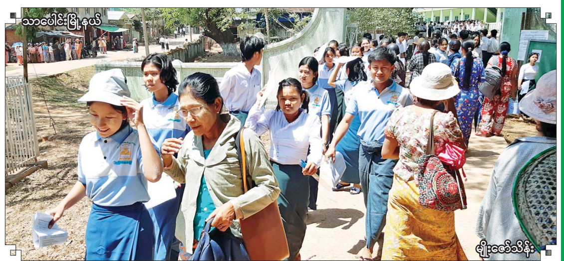
သာပေါင်းမြို့နယ်