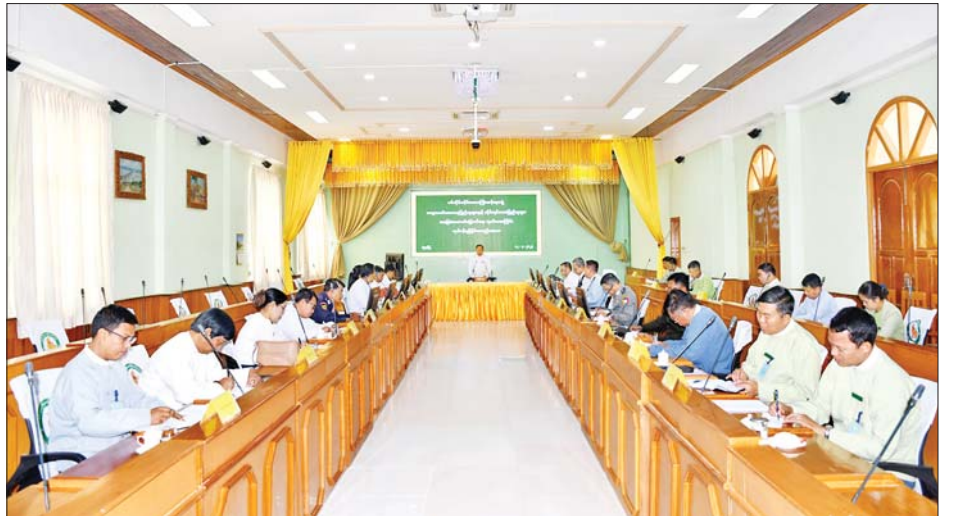
ပတ်သက်၍ ရှင်းလင်းတင်ပြကြသည်။ ယင်းနောက် တိုင်းဒေသကြီးအစိုးရအဖွဲ့ဝင်များ နှင့် အစည်းအဝေးသို့ တက်ရောက်လာသူများက တိုင်းဒေသကြီးအတွင်း ကျေးလက်ဒေသနေပြည်သူ များနှင့် တိုင်းရင်းသားပြည်သူများအတွက် အခြေခံ စာတတ်မြောက်ရေးလုပ်ငန်းများနှင့် ပတ်သက်၍ ဖြည့်စွက်အကြံပြု ဆွေးနွေးတင်ပြရာ တိုင်းဒေသကြီး ဝန်ကြီးချုပ်က လိုအပ်သည်များကို တာဝန်ရှိသူများ နှင့် ဖြည့်ဆည်းပေးစေဆောင်ရွက်ပေးခဲ့ကြောင်း သိရသည်။ တိုင်းဒေသကြီး(ပြန်/ဆက်)

လုပ်ငန်းများ ဆောင်ရွက်ထားရှိမှုများနှင့် ဆက်လက် ဆောင်ရွက်သွားမည့် လုပ်ငန်းအခြေအနေများကို ရှင်းလင်းဆွေးနွေးတင်ပြသည်။ ဆက်လက်ပြီး တိုင်းဒေသကြီးအတွင်းရှိ ခရိုင် စီမံအုပ်ချုပ်ရေးအဖွဲ့ဥက္ကဋ္ဌများက ဗီဒီယိုကွန်ဖရင့် စနစ်ဖြင့် မိမိတို့ခရိုင်အတွင်းရှိ မြို့နယ်များအတွင်း ကျေးလက်ဒေသနေပြည်သူများနှင့် တိုင်းရင်းသား ပြည်သူများအတွက် အခြေခံစာတတ်မြောက်ရေး လုပ်ငန်းများ ဆောင်ရွက်ထားရှိမှုများကိုလည်း ကောင်း၊ မုံရွာခရိုင် ဒုတိယအုပ်ချုပ်ရေးမှူးက ခရိုင် အတွင်း ကျေးလက်ဒေသနေပြည်သူများနှင့် တိုင်းရင်း သားပြည်သူများအတွက် အခြေခံစာတတ်မြောက် ရေးလုပ်ငန်းများ ဆောင်ရွက်နေမှုအခြေအနေများနှင့်