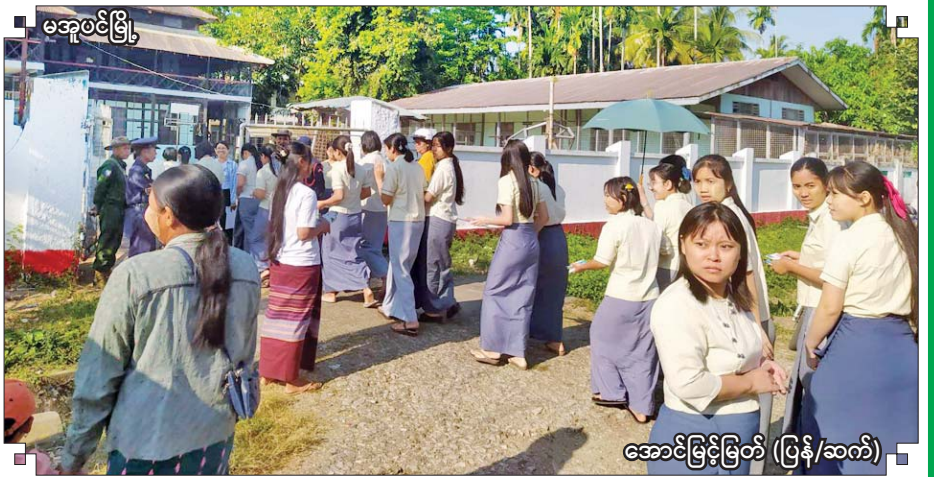
မအူဝင်မြို့