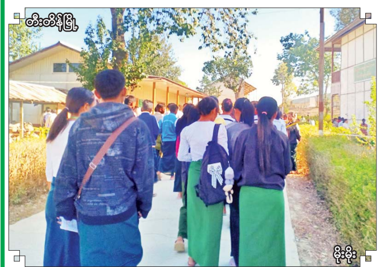
တီးတိန်မြို့