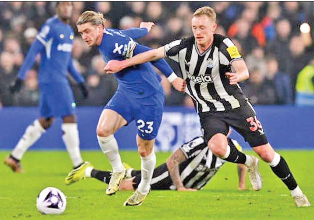
နယူးကာဆယ်အသင်းနှင့် ချယ်လ်ဆီးအသင်းတို့ ယှဉ်ပြိုင်ကစားကြစဉ်။

ချယ်လ်ဆီးအသင်းနဲ့ နယူးကာဆယ်အသင်းတို့ မတ် ၁၁ ရက် ညပိုင်းက ပရီမီယာလိဂ်ပွဲစဉ်(၂၈)အဖြစ် ယှဉ်ပြိုင်ကစားခဲ့ရာ အိမ်ကွင်းစတမ်းဖိုဒ်ဘရစ်ချ်မှာ ဧည့်ခံကစားခဲ့ရာတွင် ချယ်လ်ဆီးအသင်းက နယူးကာဆယ်အသင်းကို သုံးဂိုး-နှစ်ဂိုးနဲ့ အနိုင်ရရှိခဲ့ပါတယ်။ အဲဒီပွဲစဉ်မှာ ချယ်လ်ဆီးအသင်းအတွက် သွင်းဂိုးတွေကို ပထမပိုင်းပွဲကစားချိန် ခြောက်မိနစ်မှာ ဂျက်ဆင်၊ ၅၅ မိနစ်မှာ ပယ်လ်မာနဲ့ ၇၆ မိနစ်မှာ မူဒရစ်တို့က သွင်းယူပေးခဲ့ပြီး နယူးကာဆယ်အသင်းအတွက် သွင်းဂိုးတွေကိုတော့ ၄၃ မိနစ်မှာ အီဆက်က တစ်ဂိုးနဲ့ မိနစ် ၉၀ မှာ မာဖီက တစ်ဂိုးသွင်းယူပေးခဲ့တာဖြစ်ပါတယ်။ ချယ်လ်ဆီးအသင်းနဲ့ နယူးကာဆယ်အသင်းတို့ပွဲစဉ်မှာ ချယ်လ်ဆီးအသင်းအနိုင်ရရှိရေးအတွက် အကောင်းဆုံး ခြေစွမ်းပြစာမျက်နှာ ၁၇ ကော်လံ ၁ သို့