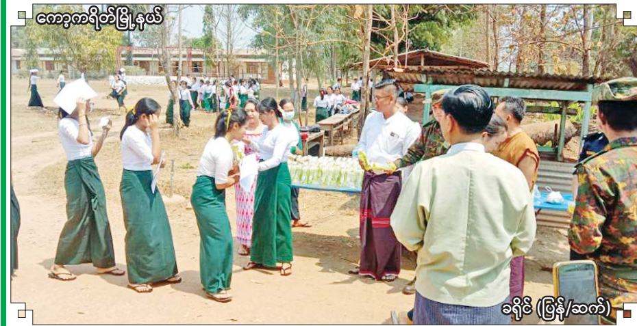
ကော့ကရိတ်မြို့နယ်