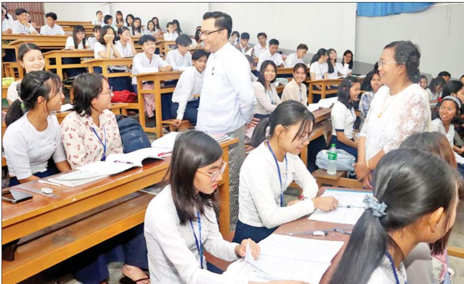
ရေး ဆက်စပ်ဌာန/ အဖွဲ့အစည်း များနှင့် မြှင့်တင်ပူးပေါင်း ဆောင်ရွက်သွားရန် တိုက်တွန်း မှာကြားသည်။ ကြည့်ရှုစစ်ဆေး ဆက်လက်၍ ဒုတိယဝန်ကြီး သည် အင်ဂျင်နီယာဌာနများရှိ အလုပ်ရုံများနှင့် လက်တွေ့ခန်း များကို ကြည့်ရှုစစ်ဆေးကာ လိုအပ်သည်များကို မှာကြား သည်။ ထို့နောက် ဒုတိယဝန်ကြီး သည် ဘာသာရပ်နှင့် သင်တန်းနှစ် တို့အလိုက် အေးချမ်းပျော်ရွှင်စွာ သင်ကြား၊ သင်ယူလျက်ရှိကြသော ကျောင်းသား ကျောင်းသူများအား ကြည့်ရှုအားပေးပြီး လိုအပ်သည် များကို ဖြည့်စွက်မှာကြားသည်။ ယင်းနောက် ဒုတိယဝန်ကြီး သည် ဝန်ထမ်းများနှင့် ရင်းရင်း နီးနီးတွေ့ဆုံပြီး နိုင်ငံ့ဝန်ထမ်း သစ္စာအဓိဋ္ဌာန်(၆)ချက်ကို လေးစား လိုက်နာကြရင်း ပြည်သူများ၏ အကျိုးစီးပွားအတွက် အမှန် တကယ် အလုပ်အကျွေးပြုနိုင် သည့် စွမ်းရည်မြှင့် အင်ဂျင်နီယာ များ၊ နိုင်ငံ့ဝန်ထမ်းကောင်းများ ဖြစ်စေရေးတို့အတွက် အလေး ထားဆောင်ရွက်ရန် မှာကြားကာ လိုအပ်သည်များကို ဖြည့်ဆည်း ဆောင်ရွက်ပေးသည်။ သတင်းစဉ်

မန္တလေး မတ် ၁၂ သိပ္ပံနှင့်နည်းပညာ ဝန်ကြီးဌာန ဒုတိယဝန်ကြီး ဒေါက်တာ အောင်ဇေယျသည် မတ် ၁၀ ရက် မွန်းလွဲပိုင်းတွင် မန္တလေးနည်းပညာ တက္ကသိုလ်၌ ကျင်းပသော မဲခေါင်-လန်ချန်း ပူးပေါင်း ဆောင်ရွက်ရေး အထူးရန်ပုံငွေ စီမံကိန်း ၂၀၂၁ ဖြင့် ဆောင်ရွက် လျက်ရှိသော စွန့်ပစ်ပစ္စည်း ပြန်လည်လည်ပတ် အသုံးပြုမှု နည်းပညာဆိုင်ရာ သုတေသီများ တွေ့ဆုံပွဲနှင့် သုတေသနပေါင်း ဆောင်ရွက်ရေး အစည်းအဝေးသို့ တက်ရောက်ရာ မန္တလေးနည်းပညာ တက္ကသိုလ် ဒုတိယပါမောက္ခချုပ် နှင့် တာဝန်ရှိသူများက စီမံကိန်း ဆိုင်ရာ အချက်အလက်များကို ရှင်းလင်းတင်ပြကြပြီး ပါမောက္ခ ချုပ်များ၊ ပါမောက္ခများ၊ သုတေသီ များက စိတ်ပါဝင်စားစွာ ဆွေးနွေး ကြသည်။ ဆွေးနွေးမှုများအပေါ် ဒုတိယ ဝန်ကြီးက နိုင်ငံတော်နှင့် ပြည်သူများအတွက် ရေရှည် စဉ်ဆက်မပြတ် ဖွံ့ဖြိုးတိုးတက် သော အနာဂတ်ကို ဖော်ဆောင် တည်ဆောက်ရာတွင် လက်တွေ့ ကျကျ အထောက်အကူပြုနိုင် မည့် သုတေသနရလဒ်များ ရရှိစေ