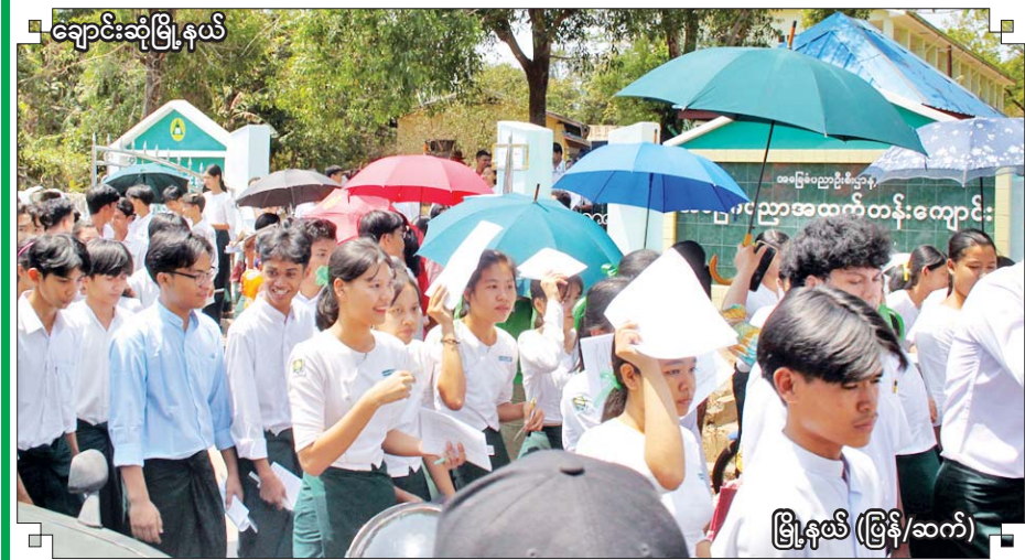
ချောင်းဆုံမြို့နယ်