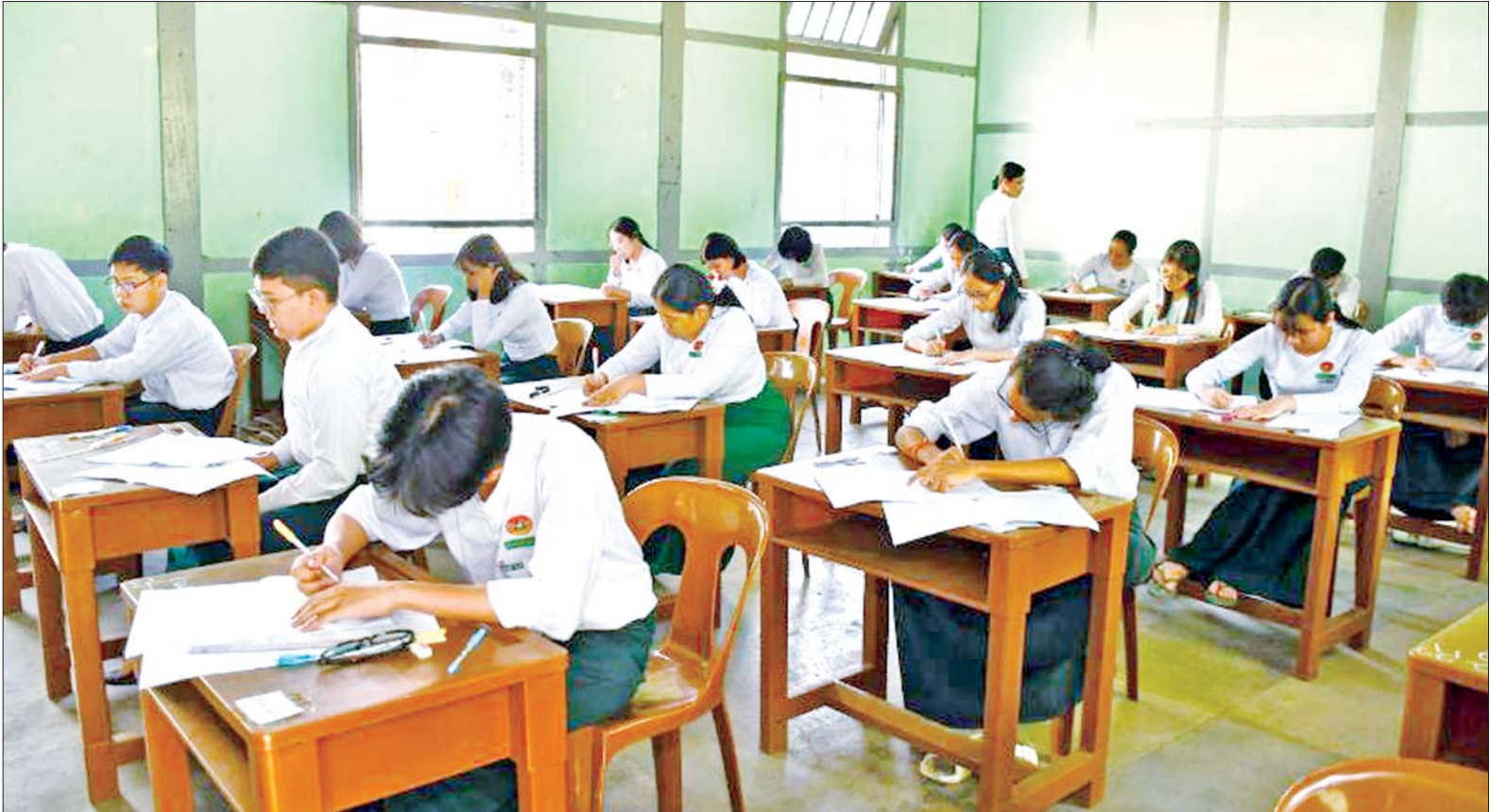
ဗဟန်းမြို့နယ် အမှတ်(၁)အခြေခံပညာအထက်တန်းကျောင်း၌ ကျောင်းသား ကျောင်းသူများ ၂၀၂၃-၂၀၂၄ ပညာသင်နှစ် တက္ကသိုလ်ဝင်စာမေးပွဲ အင်္ဂလိပ်စာဘာသာရပ် ဖြေဆိုနေကြစဉ်။