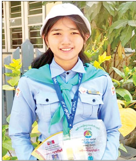
အထက(၁) G-10 မှ နှစ်ထပ်ကွမ်းလူရည်ချွန် မဖြိုးဖြိုးသွယ်

မောင်ကျော်ဇော်သိုက်ထွန်း။ ။ ကျွန်တော် က Grade-9 တုန်းက လူရည်ချွန်မရခဲ့ပါဘူး။ ဒါကြောင့် အခု Grade-10