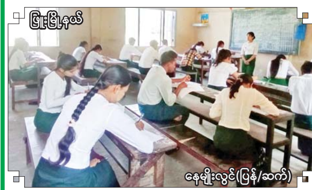
မြို့မြို့နယ်