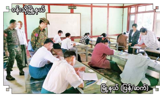
ဝန်းသိုမြို့နယ်