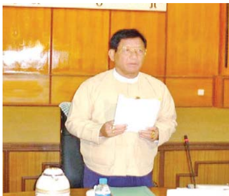
ပြည်ထောင်စုရွေးကောက်ပွဲကော်မရှင်ဥက္ကဋ္ဌ ဦးတင်အေး နိုင်ငံရေးပါတီများနှင့် တွေ့ဆုံစဉ်။

ကိုယ်စားလှယ်လောင်းများအား စိစစ်အတည်ပြု ခြင်း၊ မဲလက်မှတ်များရိုက်နှိပ်ခြင်း၊ ဖြန့်ဝေခြင်း၊ မဲဆန္ဒရှင်ပြည်သူများအား ပညာပေးဆောင်ရွက်ခြင်း စသည့် များပြားလှသောလုပ်ငန်းစဉ်များကို အချိန် နှင့်တစ်ပြေးညီပြီးစီးအောင် ဆောင်ရွက်ခဲ့ရပြီး ရွေးကောက်ပွဲ အောင်မြင်စွာကျင်းပနိုင်ရန် ဆောင်ရွက်ခဲ့ရပါသည်။ ရွေးကောက်ပွဲတွင် နိုင်ငံရေး ပါတီ ၃၇ ပါတီ ဝင်ရောက်ယှဉ်ပြိုင်ခဲ့ရာ နိုင်ငံရေး ပါတီ ၂၂ ပါတီ အနိုင်ရရှိခဲ့ပြီး ၂၀၁၀ ပြည့်နှစ် အထွေထွေရွေးကောက်ပွဲကိုလည်း အောင်မြင်စွာ ကျင်းပပေးနိုင်ခဲ့ပါသည်။