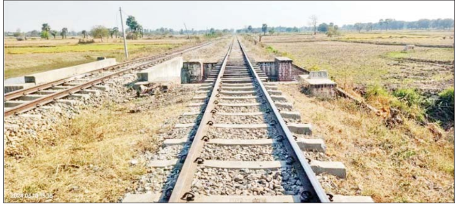
အကြမ်းဖက်သောင်းကျန်းသူများ၏ မိုင်းဖောက်ခွဲမှုကြောင့် ကျောက်ဆည်-မင်းစုဘူတာအကြား တံတားအမှတ် (၇၃၈) ၏ အစုန်/အဆန် ရထားလမ်းများပြန်လည်ပြုပြင်ပြီးစီးမှုကို တွေ့ရစဉ်။

ကျောပုံးမှ မြန်မာ့မီးရထားဝန်ထမ်းများကလည်း ရထားလမ်းပိုင်းအား အမြန်ဆုံးပြန်လည်ဖွင့်လှစ်နိုင်ရေးအတွက် ပျက်စီးသွားသော ရထားလမ်းပိုင်းအား ချက်ချင်း ပြုပြင်မွမ်းမံဆောင်ရွက်နိုင်ခဲ့သဖြင့် ကျောက်ဆည်-မင်းစု အဆန်လမ်းပိုင်းကို မွန်းလွဲ ၁ နာရီ ၆ မိနစ်နှင့် အစုန်လမ်းပိုင်းအား မွန်းလွဲ ၃ နာရီ ၆ မိနစ် ၂၀ တို့တွင် ပြန်လည်ဖွင့်လှစ်ပေးနိုင်ခဲ့သည်။ အဆိုပါဖြစ်စဉ်ကြောင့် လူစီးရထားများ ကြန့်ကြာမှုမရှိသော်လည်း ကုန်ရထားများ ကြန့်ကြာမှု