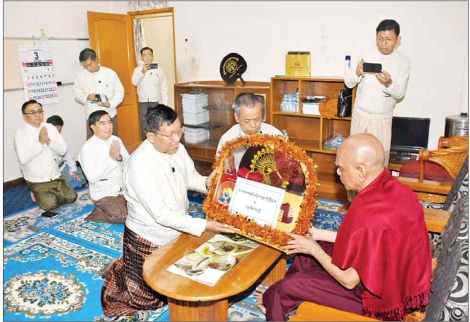
ပြည်ထောင်စုဝန်ကြီး ဦးတင်ဦးလွင် နိုင်ငံတော်သံဃမဟာနာယကအဖွဲ့ဥက္ကဋ္ဌ ဆရာတော်အဖြစ် ရွေးချယ်တင်မြှောက်ခြင်းခံရသော သန်လျင်မြို့ မင်းကျောင်းပထမပြန်စာသင်တိုက် ပဓာနနာယက ဆရာတော် အဂ္ဂမဟာပဏ္ဍိတ အဂ္ဂမဟာသဒ္ဓမ္မဇောတိကဓဇ ဒေါက်တာ ဘဒ္ဒန္တစန္ဒိမာဘိဝံသထံ လှူဖွယ်ဝတ္ထု ပစ္စည်းများဆက်ကပ်လှူဒါန်းစဉ်။

ချုပ်၊ အပြည်ပြည်ဆိုင်ရာထေရဝါဒ ဗုဒ္ဓသာသနာပြုတက္ကသိုလ် ဒုတိယ ပါမောက္ခချုပ်(စီမံ)နှင့် အရာထမ်း၊ အမှုထမ်းများ၊ တိုင်းဒေသကြီး/ ပြည်နယ် သာသနာရေးမှူးများ တက်ရောက်ကြည့်ညိကြသည်။ အစည်းအဝေးတွင် သဘာပတိ ဆရာတော်အဖြစ် နိုင်ငံတော်ဗဟို သံဃာ့ဝန်ဆောင်အဖွဲ့ဥက္ကဋ္ဌ အဂ္ဂ မဟာပဏ္ဍိတ အဂ္ဂမဟာသဒ္ဓမ္မ ဇောတိကဓဇ ဒေါက်တာဘဒ္ဒန္တ စန္ဒိမာဘိဝံသက ဆောင်ရွက်တော် မူပြီး အခမ်းအနားမှူးဆရာတော် အဖြစ် တွဲဖက်အကျိုးတော်ဆောင် ဆရာတော် အဂ္ဂမဟာဂန္ထဝါစက ပဏ္ဍိတ ဘဒ္ဒန္တစန္ဒဝံသာ လင်္ကာရာ