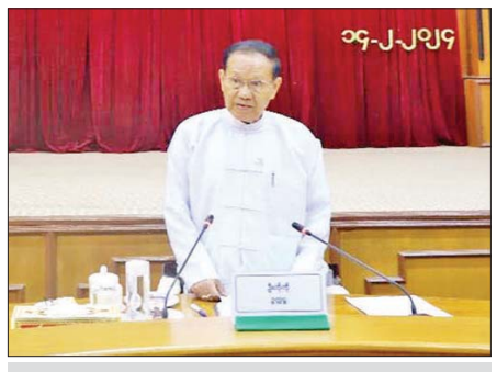
ပြည်ထောင်စုရွေးကောက်ပွဲကော်မရှင်ဥက္ကဋ္ဌ ဦးကိုကို နိုင်ငံရေးပါတီများနှင့်တွေ့ဆုံစဉ်။

ရွေးကောက်ပွဲကော်မရှင်၏ မြို့နယ်အဆင့်မဲဆန္ဒရှင် စာရင်းစီမံခန့်ခွဲမှုစနစ် (Admin DEO, DEO Software) နှင့် ဗဟိုမဲဆန္ဒရှင် စာရင်းစီမံခန့်ခွဲမှုစနစ် (CVLMS) တို့ကို အသုံးပြုဆောင်ရွက်လျက်ရှိပါသည်။ အဆိုပါ စနစ်များကို ကော်မရှင်၏သီးခြား Network အတွင်း ကိုယ်ပိုင် Server များဖြင့် ထိန်းသိမ်းထားရှိပါသည်။ မဲသမားမူဖြစ်စဉ်များ မဖြစ်ပေါ်စေရေးနှင့် ဆန္ဒမဲလက်မှတ်များ ဖောင်းပွမှုမဖြစ်စေရေးတို့ အတွက် ရည်ရွယ်၍ Electronic မဲပေးစက် EVM ကို အသုံးပြုပေးနိုင်ရန်နှင့် မဲဆန္ဒရှင်ပြည်သူလူထု ၏ စာတတ်မြောက်မှုနှုန်း၊ နားလည်နိုင်မှုအခြေ အနေတို့နှင့်ကိုက်ညီမည့် မြန်မာအိလက်ထရွန်နစ် မဲပေးစက် (MEVM) ကို တီထွင်ဆောင်ရွက်ခဲ့ပါ သည်။