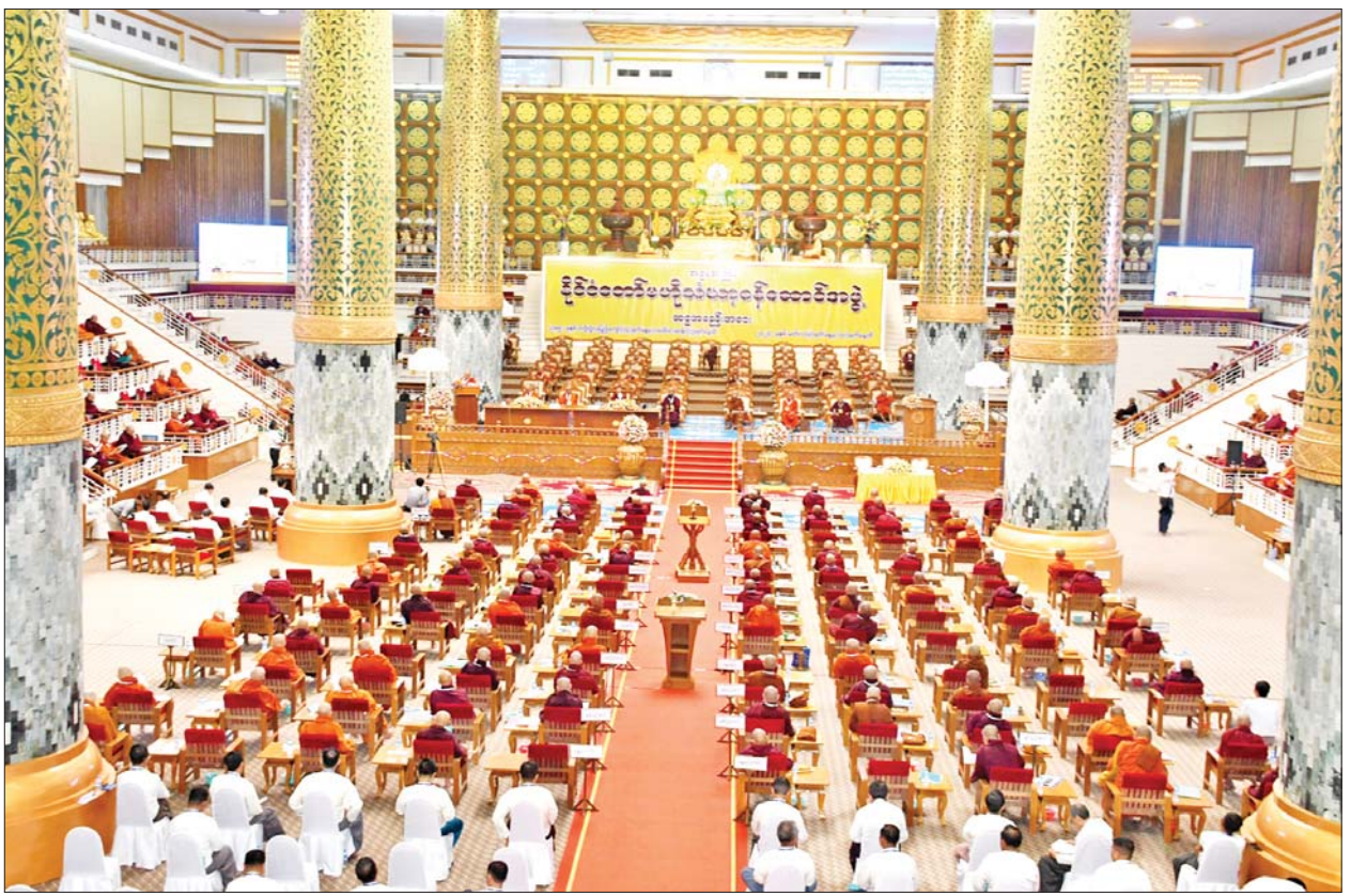
အဋ္ဌမအကြိမ် နိုင်ငံတော်ဗဟိုသံဃာ့ဝန်ဆောင်အဖွဲ့ ဆဋ္ဌအစည်းအဝေး တတိယနေ့ကျင်းပစဉ်။