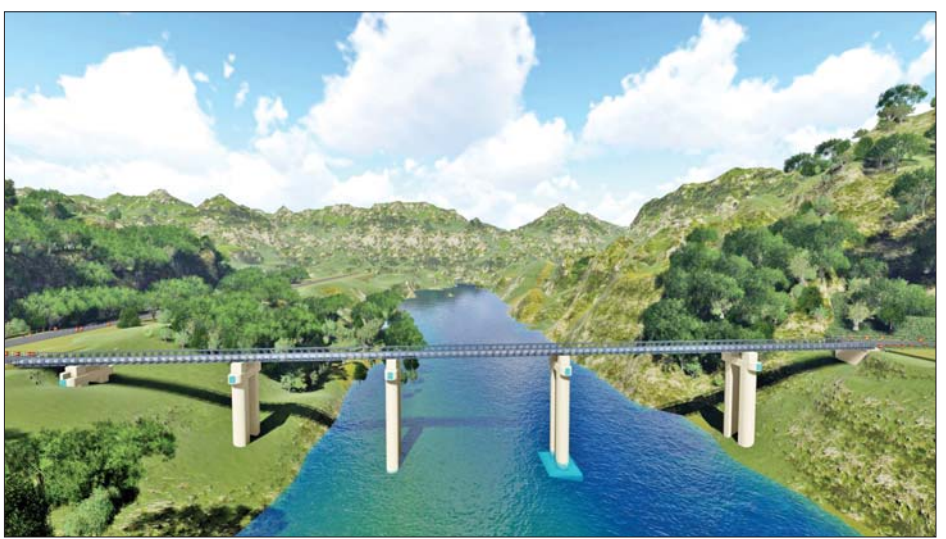
ခေါင်လန်ဖူးမြို့နယ်၌ တည်ဆောက်နေသော ရီဒမ်းတံတားသစ် ဒီဇိုင်းပုံစံကို တွေ့ရစဉ်။

မေခမြစ်ကိုဖြတ်သန်း၍ မူလကြိုးတံတား အရှည် ပေ ၃၆၀ ရှိသော ရီဒမ်းကြိုးတံတားဟောင်း နှင့် ရေစုန်ဘက် ပေ ၂၅၀၀ အကွာ၌ အဆိုပါ ရီဒမ်း တံတားသစ်အား တည်ဆောက်နေခြင်းဖြစ်ပြီး ပူတာအိုမြို့၊ မချမ်းဘောမြို့နှင့် နောင်မွန်မြို့နယ် တို့ကိုဖြတ်၍ စာမျက်နှာ ၄ ကော်လံ ၁ သို့ ❖