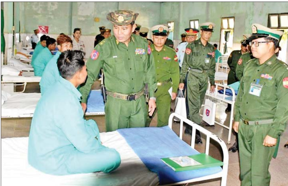
ရာများ ပေးအပ်ကြသည်။ ထို့နောက် တိုင်းမှူးနှင့် တာဝန်ရှိသူများက ဆေးရုံအတွင်း များ ညှိနှိုင်းဆောင်ရွက်ပေးခဲ့ကြောင်း သိရသည်။ သတင်းစဉ်

နေပြည်တော် မတ် ၁၀ စစ်ကိုင်းတိုင်း ဒေသကြီး ဟုမ္မလင်းမြို့ရှိ တပ်မတော်ဆေးရုံ၌ တက်ရောက်ဆေးကုသမှုခံယူနေသော အရာရှိ၊ စစ်သည်၊ မိသားစုဝင်များ၊ စစ်မှုထမ်းဟောင်းအဖွဲ့ဝင်များ၊ မြန်မာနိုင်ငံရဲတပ်ဖွဲ့ဝင်များနှင့် ဒေသခံပြည်သူများအား ယနေ့တွင် အနောက်မြောက်တိုင်း စစ်ဌာနချုပ် တိုင်းမှူး ဗိုလ်ချုပ်သန်းထိုက်နှင့် တာဝန်ရှိသူများက သွားရောက်ကြည့်ရှု၍ တစ်ဦးချင်း၏ ရောဂါဖြစ်ပွားမှု၊ ဆေးဝါး ကုသပေးထားမှုနှင့် ကျန်းမာရေး တိုးတက်ကောင်းမွန်မှုအခြေအနေများကို ရင်းရင်းနှီးနှီး မေးမြန်းအားပေးစကား ပြောကြားပြီး အာဟာရဖြည့်စားသောက်ဖွယ်