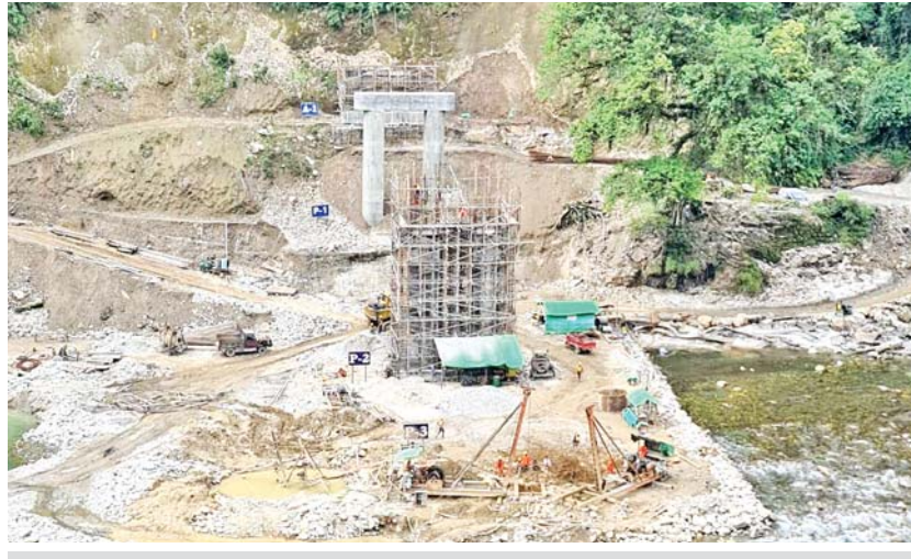
ရီဒမ်းတံတားသစ် တည်ဆောက်ပြီးစီးမှုကို တွေ့ရစဉ်။

❖ ခေါင်လန်ဖူးမြို့နယ်မှ ခေါင်လန်ဖူးမြို့ကို ဆက်သွယ်လျက်ရှိသော မဂ္ဂေဇ - ခေါင်လန်ဖူးလမ်းပေါ်၌ ရှိသည့် တံတားအမှတ်(၁/၄၄) ရီဒမ်းတံတားသစ်အား ဆောက်လုပ်ရေးဝန်ကြီးဌာန တံတားဦးစီးဌာန တံတားအထူးအဖွဲ့(၁)မှ ကျွမ်းကျင်အင်ဂျင်နီယာ ငါးဦးနှင့် ကာယဉာဏလုပ်သား ၅၀ တို့က တည်ဆောက်ရေးလုပ်ငန်းများဆောင်ရွက်လျက်ရှိသည်။ ယခုအခါ ကမ်းကပ်ခုံကိုယ်ထည် A1 Cap၊ P1 နှင့် P2 တိုင်လုပ်ငန်းများ ဆောင်ရွက်ပြီးစီးနေပြီဖြစ်ပြီး P3 Bored Pile ဖောင်ဒေး