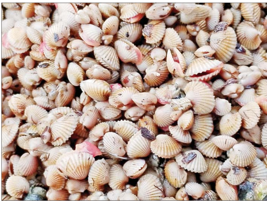
မယ်ဆိုရင် ဂျင်းသေနှုန်းလျော့ကျပြီး အလားအလာ ပိုကောင်းနိုင်ပါတယ်။

ဖြေ။ ။ လက်ရှိအနေအထားကတော့ ထိုင်းကိုပဲ ပို့နေတယ်။ ထိုင်းနိုင်ငံကတော့ အခြား