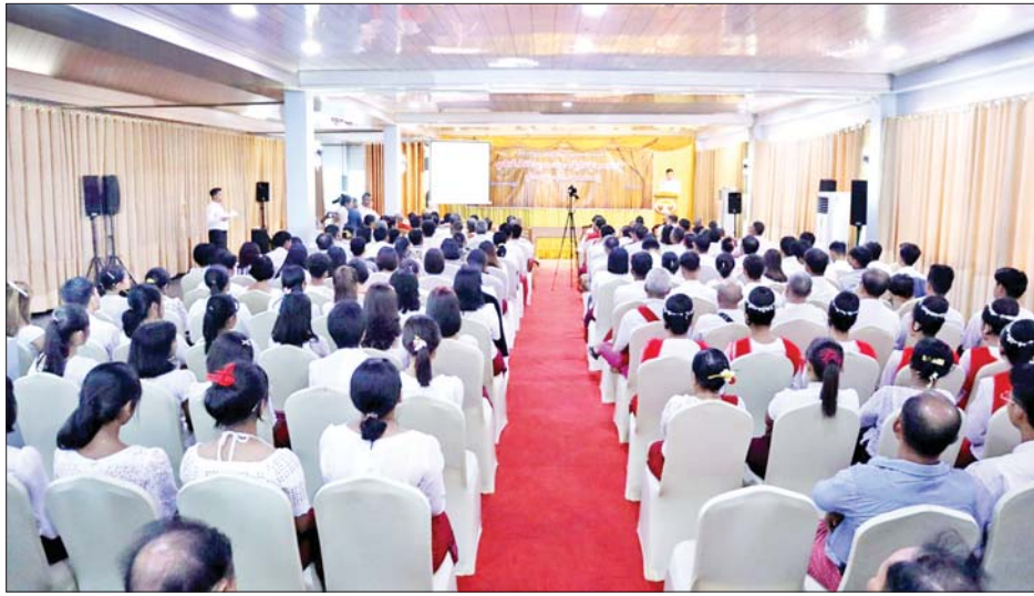
အမွေအနှစ်များ ဖော်ထုတ်နိုင်ရေးနှင့် ထိန်းသိမ်း မြှင့်တင်ရေးလုပ်ငန်းများအတွက် အထောက်အကူ ပြုနိုင်စေရန်၊ မျိုးဆက်သစ်သုတေသနပညာရှင်များ မွေးထုတ်ပေးနိုင်ရန် ရည်ရွယ်ချက်ကောင်းများဖြင့် ယခုစာတမ်းဖတ်ပွဲကို ကျင်းပခြင်းဖြစ်ကြောင်း၊ မွန်တို့၏ ရှေးကျသည့်ကိုးကွယ်ယုံကြည်မှုများကို သိရှိနားလည်စေရန်နှင့် ပြည်သူများ အသိပညာ တိုးပွားစေရန် ဆောင်ရွက်သွားကြရန် လိုအပ်ကြောင်း ပြောကြားသည်။

၂၀၂၄ ခုနှစ် မတ် ၁၉ ရက်တွင် ကျရောက်မည့် နှစ်(၅၀)ပြည့် ရွှေရတု မွန်ပြည်နယ်နေ့အထိမ်းအမှတ် မွန်ခေလေမွန်မူ သုတေသနစာတမ်းဖတ်ပွဲ အခမ်းအနားကို ယနေ့နံနက်ပိုင်းက မော်လမြိုင်မြို့ ရာမညဟိုတယ်၌ ကျင်းပရာ မွန်ပြည်နယ်ဝန်ကြီးချုပ် ဦးအောင်ကြည်သိန်း၊ ပြည်နယ်တရားလွှတ်တော် တရားသူကြီးချုပ်၊ ပြည်နယ်ဝန်ကြီးများ၊ မွန်တိုင်း ရင်းသားစာပေနှင့် ယဉ်ကျေးမှုကော်မတီဝင်များနှင့် ဖိတ်ကြားထားသူများ တက်ရောက်ကြသည်။