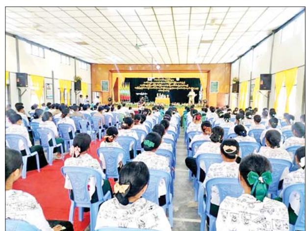
ကော်မတီဥက္ကဋ္ဌ ဦးဇော်ဌေးက အဖွင့်အမှာစကား ပြောကြားပြီး ထို့နောက် သင်တန်းကျန်း ပညာရေးဒီဂရီကောလိပ်မှ ကျောင်းအုပ်လူဝင်မှုကြီးကြပ်ရေးနှင့် ပြည်သူ့အင်အားဝန်ကြီးဌာန ခရိုင်ကြက်ခြေနီ အသင်းခွဲအနေဖြင့် သင်တန်းဖွင့်လှစ်ခွင့် ရရှိသည့်

ရန်ကုန်တိုင်းဒေသကြီး သင်တန်းကျန်းခရိုင် ကြက်ခြေနီကြီးကြပ်မှုကော်မတီက ကြီးမှူးပြီး သင်တန်းကျန်း ပညာရေးဒီဂရီကောလိပ် ကြက်ခြေနီအသင်းခွဲနှင့် သင်တန်းကျန်းမြို့နယ် ကြက်ခြေနီအသင်းခွဲတို့ ပူးပေါင်းစီစဉ် ဖွင့်လှစ်သည့် ရှေးဦးပြုစုခြင်း(အခြေခံ)သင်တန်း အမှတ်စဉ် (၈/၂၀၂၄)နှင့် ရှေးဦးပြုစုခြင်း (သာမန်)သင်တန်း အမှတ်စဉ်(၁/၂၀၂၄) သင်တန်းဆင်းပွဲအခမ်းအနားကို ယနေ့နံနက် ၁၀ နာရီက သင်တန်းကျန်းမြို့နယ်ရှိ သင်တန်းကျန်းပညာရေးဒီဂရီကောလိပ် ပညာရေးဌာနခန်းမ၌ ကျင်းပသည်။