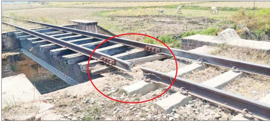
အကြမ်းဖက်သောင်းကျန်းသူများ၏ မိုင်းဖောက်ခွဲမှုကြောင့် ကျောက်ဆည်-မင်းစုဘူတာအကြား တံတားအမှတ် (၇၃၈) ၏ အဆန်ရထားလမ်း ပျက်စီးဆုံးရှုံးမှုအခြေအနေကို တွေ့ရစဉ်။