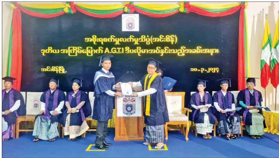
လက်မှတ်ရယူမည့် မောင်မယ်များကို လှိုက်လှဲစွာ ဂုဏ်ပြုပါကြောင်းနှင့် မောင်မယ်များအနေဖြင့် မိမိတတ်မြောက်ထားသော နည်းပညာရပ်များကို အသုံးပြုပြီး တိုင်းပြည်ဖွံ့ဖြိုးရေးကဏ္ဍများတွင်

အစိုးရစက်မှုလက်မှုသိပ္ပံအသီးသီးမှ ၂၀၂၂-၂၀၂၃ ပညာသင်နှစ်တွင် သင်ကြားသင်ယူ အောင်မြင်ခဲ့ကြသော A.G.T.I ဒီပလိုမာရရှိသူများကို သိပ္ပံနှင့် နည်းပညာဝန်ကြီးဌာန ပြည်ထောင်စုဝန်ကြီး ဒေါက်တာမျိုးသိန်းကျော်က Video Message ဖြင့် ဂုဏ်ပြုအမှာစကားပြောကြားရာတွင် A.G.T.I ဒီပလိုမာအပ်နှင်းသည့် အခမ်းအနားများတွင် ဒီပလိုမာ