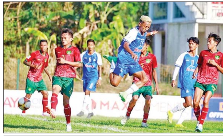
ရတနာပုံအသင်းနှင့် မြဝတီအသင်းတို့ ယှဉ်ပြိုင်ကစားကြစဉ်။

သုံးဂိုး-တစ်ဂိုး၊ SGF အသင်းက Golden Yoma အသင်းကို သုံးဂိုး-တစ်ဂိုး၊ KKY အသင်းက M-Million အသင်းကို ငါးဂိုး-လေးဂိုး၊ ရွှေပြည်သာအသင်းက Seven အသင်းကို လေးဂိုး-တစ်ဂိုးဖြင့် အနိုင်ရပြီး Maryar အသင်းနှင့် Noka United အသင်းတို့ နှစ်ဂိုးစီသရေကျခဲ့သည်။ စာမျက်နှာ ၁၅ ကော်လံ ၅ သို့ ၀