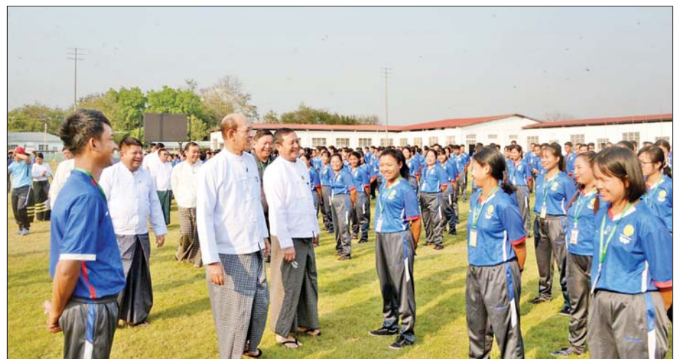
ဆရာမများ၏အခန်းကဏ္ဍမှာ အဓိကကျသည်ကို မမေ့လျော့ကြရန် အထူးမှာကြားလိုပါကြောင်း။

ပညာရေးဝန်ကြီးဌာနအနေဖြင့် အခြေခံပညာကျောင်းများတွင် လစ်လပ်နေသည့် ကာယပညာဆရာ ဆရာမများကို ဖြည့်ဆည်းပေးနိုင်ရန် ကာယပညာနှင့် အားကစားအခြေခံနည်းပြ သင်တန်းများကို စဉ်ဆက်မပြတ်ဖွင့်လှစ်၍ ဒုတိယအလယ်တန်းပြ (ကာယ)ဆရာ ဆရာမများအဖြစ် ခန့်အပ်ပေးလျက်ရှိကြောင်း၊ ယခုဖွင့်လှစ်ခဲ့သည့် ကာယပညာနှင့် အားကစားနည်းပြ မှမ်းမံသင်တန်း(၁/၂၀၂၄)ကို ဘော်လီဘော၊ ဘော်လီဘော၊ ပြေးခုန်ပစ်၊ ပိုက်ကျော်ခြင်း၊ ဘတ်စကက်ဘော၊ စားပွဲတင်တန်းနှင့် ကြက်တောင်အစရှိသည့် အားကစားနည်း ခုနစ်နည်းအတွက် သင်တန်းသား ၃၁၅ ဦးကို ပို့ချသင်ကြားခဲ့ကြောင်း၊ နိုင်ငံတော်၏တာဝန်များကို ပံ့ပိုးပြောင်း တာဝန်ယူကြမည့် ကျောင်းသား ကျောင်းသူများကို ကိုယ်ရောစိတ်ပါကြံ့ခိုင်ကောင်းမွန်သည့် နိုင်ငံ့သားကောင်း ရတနာများ ဖြစ်ပေါ်လာရန် ပြုစုပျိုးထောင်ပေးသည့် နေရာတွင် အရည်အသွေးမြင့် ကာယပညာ ဆရာ