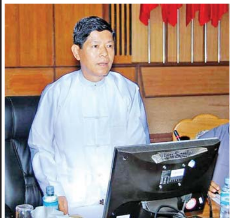
ပြည်ထောင်စုရွေးကောက်ပွဲကော်မရှင်ဥက္ကဋ္ဌ ဦးသိန်းစိုး နိုင်ငံရေးပါတီများနှင့်တွေ့ဆုံစဉ်။

ရုံးအမည်ကိုလည်း ယခင်က ပါတီစုံဒီမိုကရေစီ အထွေထွေရွေးကောက်ပွဲကျင်းပရေးကော်မရှင်ရုံး ဟုခေါ်ဆိုရာမှ ပြည်ထောင်စုရွေးကောက်ပွဲ ကော်မရှင်ရုံးအဖြစ် နိုင်ငံတော်အေးချမ်းသာယာရေး နှင့် ဖွံ့ဖြိုးရေးကောင်စီက ၂၀၁၀ ပြည့်နှစ် မတ်လ ၁၁ ရက်နေ့ ရက်စွဲပါ စာအမှတ် ၁၀၆/ နယက (၃)/ တ၀-၂ ဖြင့် ပြင်ဆင်သတ်မှတ်ခဲ့ခြင်းဖြစ်ပါသည်။