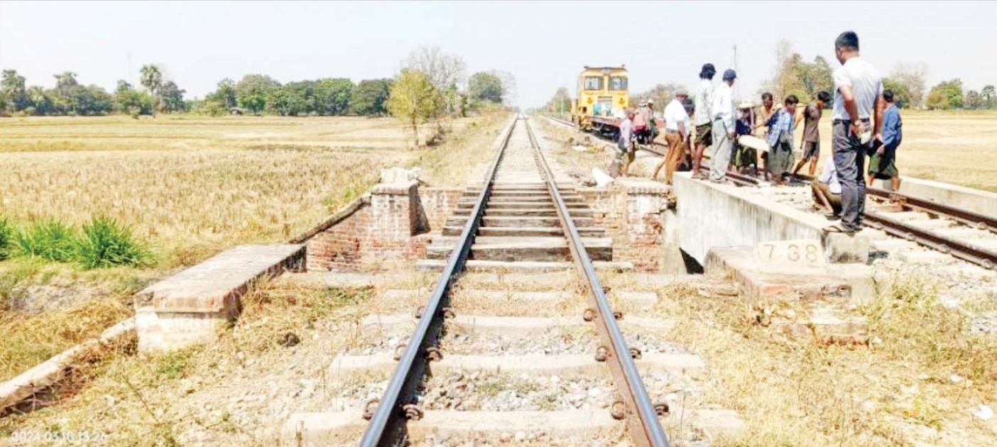
အကြမ်းဖက်သောင်းကျန်းသူများ၏ မိုင်းဖောက်ခွဲမှုကြောင့် ကျောက်ဆည်-မင်းစုဘူတာအကြား တံတားအမှတ် (၇၃၈) ၏ အစုန်/အဆန် ရထားလမ်းများ ပြန်လည်ပြုပြင်ဆောင်ရွက်နေမှုကို တွေ့ရစဉ်။

နေပြည်တော် မတ် ၁၀ မန္တလေးတိုင်းဒေသကြီး ကျောက်ဆည်မြို့နယ် ရန်ကုန်-မန္တလေး ရထားလမ်းပိုင်းအတွင်း ကျောက်ဆည်-မင်းစုဘူတာအကြား မိုင် ၃၅၃/၂၄ နှင့် ၃၅၄/၁ အကြား တံတားအမှတ် (၇၃၈) ၏ အစုန်/အဆန် ပေ ၂၀ သံပေါင်တံတားနှင့် ကွန်ကရစ်တံတားများ ပေါ်တွင် ယနေ့နံနက် ၈ နာရီ မိနစ် ၄၀ ခန့်တွင် မိုင်းပေါက်ကွဲမှုဖြစ်ပွားခဲ့ကြောင်း သတင်းအရ နယ်မြေခံလုံခြုံရေးအဖွဲ့က သွားရောက်စစ်ဆေးခဲ့ရာ တံတားများရှိ အရှေ့ဘက်ခြမ်းသံလမ်းများ နှစ်ပေခန့် စီ ပြတ်ထွက်နေပြီး မကွဲသေးသော လက်ကျန်မိုင်း တစ်လုံးအား တွေ့ရှိခဲ့သဖြင့် မင်းစု-ကျောက်ဆည် အစုန်/အဆန် လမ်းပိုင်းများအား နံနက် ၈ နာရီ မိနစ် ၅၀ တွင် ခေတ္တပိတ်ခဲ့ရသည်။ မိုင်းပေါက်ကွဲမှုဖြစ်စဉ် ဖြစ်ပွားရာနေရာသို့ နယ်မြေဒေသတာဝန်ရှိသူများ၊ နယ်မြေခံလုံခြုံရေး တပ်ဖွဲ့ဝင်များက အချိန်နှင့်တစ်ပြေးညီ နယ်မြေ ရှင်းလင်းစစ်ဆေးခြင်း၊ မပေါက်ကွဲသေးသည့်မိုင်း အား သက်မဲ့ပြုလုပ်ရှင်းလင်းခြင်းများ ဆောင်ရွက် ခဲ့ပြီး စာမျက်နှာ ၁၅ ကော်လံ ၁ သို့ ❁