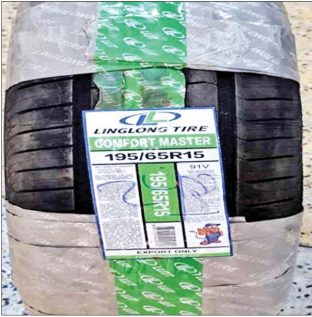
မရမ်းချောင်း အမြဲတမ်းစစ်ဆေးရေးစခန်း၌ သိမ်းဆည်းရမိမှု။

နေပြည်တော် မတ် ၁၀ တရားမဝင် ကုန်သွယ်မှု တိုက်ဖျက်ရေး ဦးဆောင်ကော်မတီ ၏ ကြီးကြပ်ကွပ်ကဲမှုဖြင့် တရားမဝင် ကုန်သွယ်မှုများကို ဥပဒေနှင့်အညီ ထိရောက်စွာ တားဆီး အရေးယူနိုင်ရေး ဆောင်ရွက်လျက်ရှိရာ မတ် ၈ ရက် တွင် အကောက်ခွန်ဦးစီးဌာန၏ စီမံခန့်ခွဲမှုဖြင့် တာဝန်ကျပူးပေါင်း အဖွဲ့များက စစ်ဆေးမှုများ ဆောင်ရွက်ရာတွင် မြန်မာ့စက်မှု ဆိပ်ကမ်း၌ ကုန်သေတ္တာ ၁၇ လုံး အတွင်းမှ သွင်းကုန်ကြေညာလွှာ တွင် ကြေညာထားခြင်း မရှိသည့် Crystal One Piece Toilet အခု ၇၀၊ တရုတ်နိုင်ငံထုတ် Ceramic Tiles ၁၂၆၅၅ ဒဿမ ၂ စတုရန်း မီတာ အပါအဝင် ကုန်ပစ္စည်း နှစ်မျိုး (ခန့်မှန်းတန်ဖိုး ၁၀၅၅၅၅၅၂) ကို လည်းကောင်း၊ မရမ်းချောင်း အမြဲတမ်းစစ်ဆေးရေးစခန်း၌ ဘားအံမှ ရန်ကုန်သို့ ထွက်ခွာလာသော ယာဉ်နှစ်စီး ပေါ်မှ တရားမဝင် စာရွက်စာတမ်း အထောက်အထား တင်ပြနိုင်ခြင်း မရှိသည့် Linglong ကားတာယာ အလုံး ၁၅၀၊ Smart အမွှေးဆီ အထုပ် ၂၄၀၀ အပါအဝင် ကုန်ပစ္စည်း သုံးမျိုး (ခန့်မှန်းတန်ဖိုး ၄၅၀၀၀၀)နှင့် အဆိုပါ ပစ္စည်းများ တင်ဆောင်လာသည့် Yutong Bus တစ်စီး၊ Dong Feng Tractor Head တစ်စီးနှင့် နောက်တွဲယာဉ် တစ်စီး (ခန့်မှန်း တန်ဖိုး ၉၀၀၀၀၀)ကို လည်းကောင်း စုစုပေါင်း (ခန့်မှန်း တန်ဖိုး ၂၀၆၅၂၀၂၃)ကို သိမ်းဆည်းရမိခဲ့ပြီး အကောက်ခွန် လုပ်ထုံးလုပ်နည်းများနှင့် အညီ အရေးယူဆောင်ရွက်လျက်ရှိသည်။