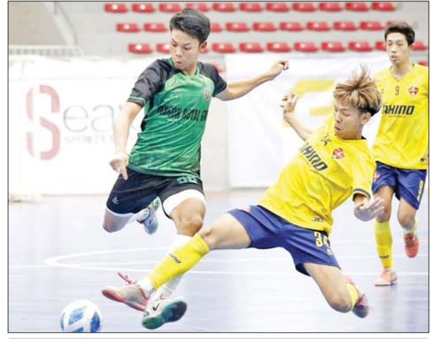
TG United အသင်းနှင့် YRG အသင်းတို့ ယှဉ်ပြိုင်ကစားကြစဉ်။

○ MFF မှ ပွဲစဉ် (၁၉) အပြီးတွင် YRG အသင်း ရှုံးပွဲကြုံတွေ့သော်လည်း ၄၃ မှတ်ဖြင့် ဆက်လက်ဦးဆောင်နေပြီး SGF အသင်းက ၄၂ မှတ်၊ TG United အသင်းက ရမှတ် ၄၀၊ Sun Far အသင်းက ၃၈ မှတ်၊ Black Cross အသင်းက ၃၆ မှတ်၊ KKY အသင်းက ၃၁ မှတ်၊ ရွှေပြည်သာ အသင်းက ရမှတ် ၃၀၊ Maryar အသင်းက ၂၂ မှတ်၊ Golden Yoma အသင်းက ၁၉ မှတ်၊ Seven အသင်းနှင့် Noka United အသင်းတို့က ကိုးမှတ်စီ၊ M-Million အသင်းက ခြောက်မှတ် ရရှိထားသည်။ သတင်း-ကိုညီလေး၊ ဓာတ်ပုံ -MFF