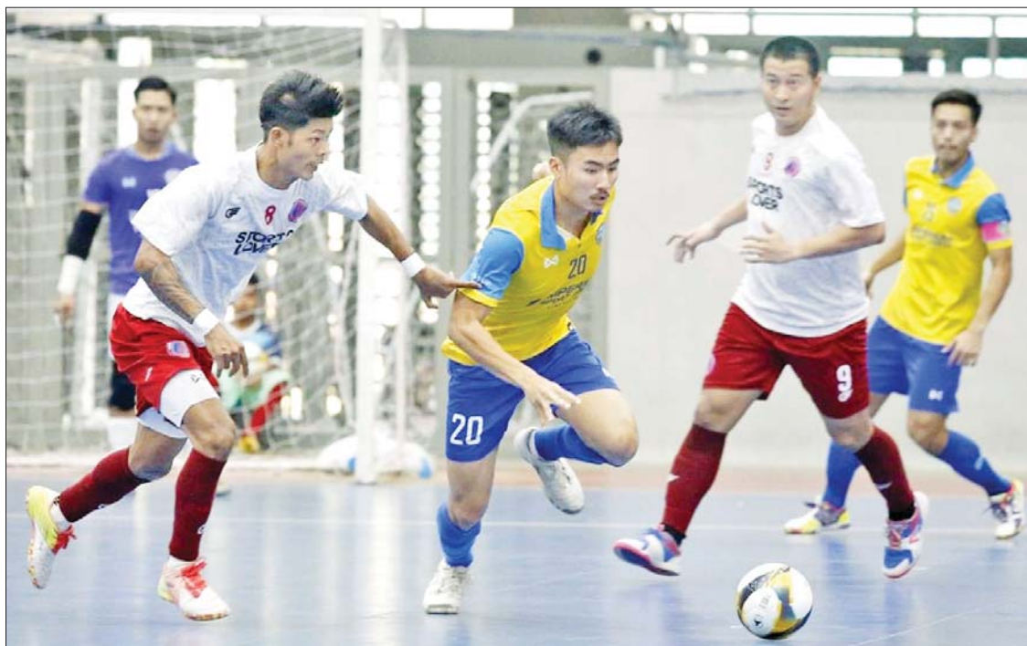
MIU အသင်းနှင့် Generations အသင်းတို့ ယှဉ်ပြိုင်ကစားကြစဉ်။

ရန်ကုန် မတ် ၈ MFF ဖူဆယ်လိဂ်-၁ ပြိုင်ပွဲ Play-off ဆီမီးဖိုင်နယ်ပွဲစဉ်ကို မတ် ၈ ရက်က ရန်ကုန်မြို့ သုဝဏ္ဏဘောလုံးကွင်းရှိ MFF ဖူဆယ်အားကစားရုံ၌ကျင်းပရာ MIU အသင်း အနိုင်ရပြီး ဗိုလ်လုပွဲ တက်ရောက်သွားသည်။