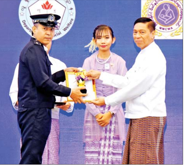
ပြည်ထောင်စုဝန်ကြီး ဒေါက်တာစိုးဝင်း ၂၀၂၄ ခုနှစ် အပြည်ပြည် ဆိုင်ရာအမျိုးသမီးများနေ့အထိမ်းအမှတ် ဂုဏ်ပြုဆောင်းပါးပြိုင်ပွဲ တွင် နှစ်သိမ့်ဆုရရှိသူတစ်ဦးအား ဂုဏ်ပြုဆုတံဆိပ်၊ ဂုဏ်ပြုမှတ်တမ်း လွှာနှင့် ဂုဏ်ပြုဆုငွေ ပေးအပ်ချီးမြှင့်စဉ်။

ဒုတိယဆု၊ တတိယဆုနှင့် နှစ်သိမ့် ဆုရရှိကြသူများကို ဂုဏ်ပြု ဆုတံဆိပ်များ၊ ဂုဏ်ပြုမှတ်တမ်း လွှာနှင့် ဂုဏ်ပြုဆုငွေများ ပေးအပ် ချီးမြှင့်ကြသည်။