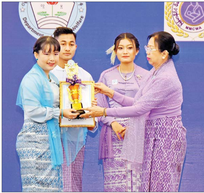
နိုင်ငံတော်စီမံအုပ်ချုပ်ရေးကောင်စီဥက္ကဋ္ဌ နိုင်ငံတော်ဝန်ကြီးချုပ်၏ဇနီး ဒေါ်ကြာကြာလှ ၂၀၂၄ ခုနှစ် အပြည်ပြည်ဆိုင်ရာအမျိုးသမီးများနေ့ အထိမ်းအမှတ် ဂုဏ်ပြုဆောင်းပါးပြိုင်ပွဲတွင် ပထမဆုရရှိသူကို ဂုဏ်ပြုဆုတံဆိပ်၊ ဂုဏ်ပြုမှတ်တမ်း လွှာနှင့် ဂုဏ်ပြုဆုငွေ ပေးအပ်ချီးမြှင့်စဉ်။

စပ်လျဉ်း၍ ရှင်းလင်းပြောကြား ရာတွင် အမျိုးသမီးများကဏ္ဍ ဖွံ့ဖြိုး တိုးတက်ရေးအတွက် စွမ်းဆောင် ရည်မြင့်မားရေးဆိုင်ရာ လုပ်ငန်း များ၏ အရေးကြီးမှုကို ပြည်သူ လူထုကသိရှိနားလည်ပြီး ပူးပေါင်း ပါဝင်ဆောင်ရွက်လာနိုင်စေရန် ရည်ရွယ်၍ မြန်မာအမျိုးသမီးများ နေ့ အခမ်းအနားများကို နှစ်စဉ် ကျင်းပလျက်ရှိပါကြောင်း၊ မြန်မာ နိုင်ငံလုံးဆိုင်ရာ အမျိုးသမီး ကော်မတီအနေဖြင့် နေပြည်တော် အပါအဝင်၊ တိုင်းဒေသကြီးနှင့် ပြည်နယ် အမျိုးသမီးကော်မတီ များအကြား သက်ဆိုင်ရာဒေသ အလိုက် အကောင်အထည်ဖော် ဆောင်ရွက်မည့် အမျိုးသမီးဖွံ့ဖြိုး တိုးတက်ရေးဆိုင်ရာ လုပ်ငန်းများ ကို ညှိနှိုင်းပေါင်းစပ်နိုင်ရေး အတွက် ကော်မတီ၏အစည်း အဝေးကို ဘဏ္ဍာရေးနှစ်တစ်နှစ် လျှင် နှစ်ကြိမ်ကျင်းပဆောင်ရွက် လျက်ရှိပြီး အမျိုးသမီးများ ဖွံ့ဖြိုး တိုးတက်ရေးလုပ်ငန်းအစီအစဉ် များကို ပြန်လည်သုံးသပ်ခြင်း၊ ဒေသအလိုက် အကောင်အထည် ဖော် ဆောင်ရွက်မှုများအပေါ် လိုအပ်သည့် ကြီးကြပ်လမ်းညွှန်မှု များ ဆောင်ရွက်ခြင်းနှင့် ရှေ့လုပ် ငန်းစဉ်များ ချမှတ်ခြင်းများကို ဆောင်ရွက်လျက်ရှိပါကြောင်း။