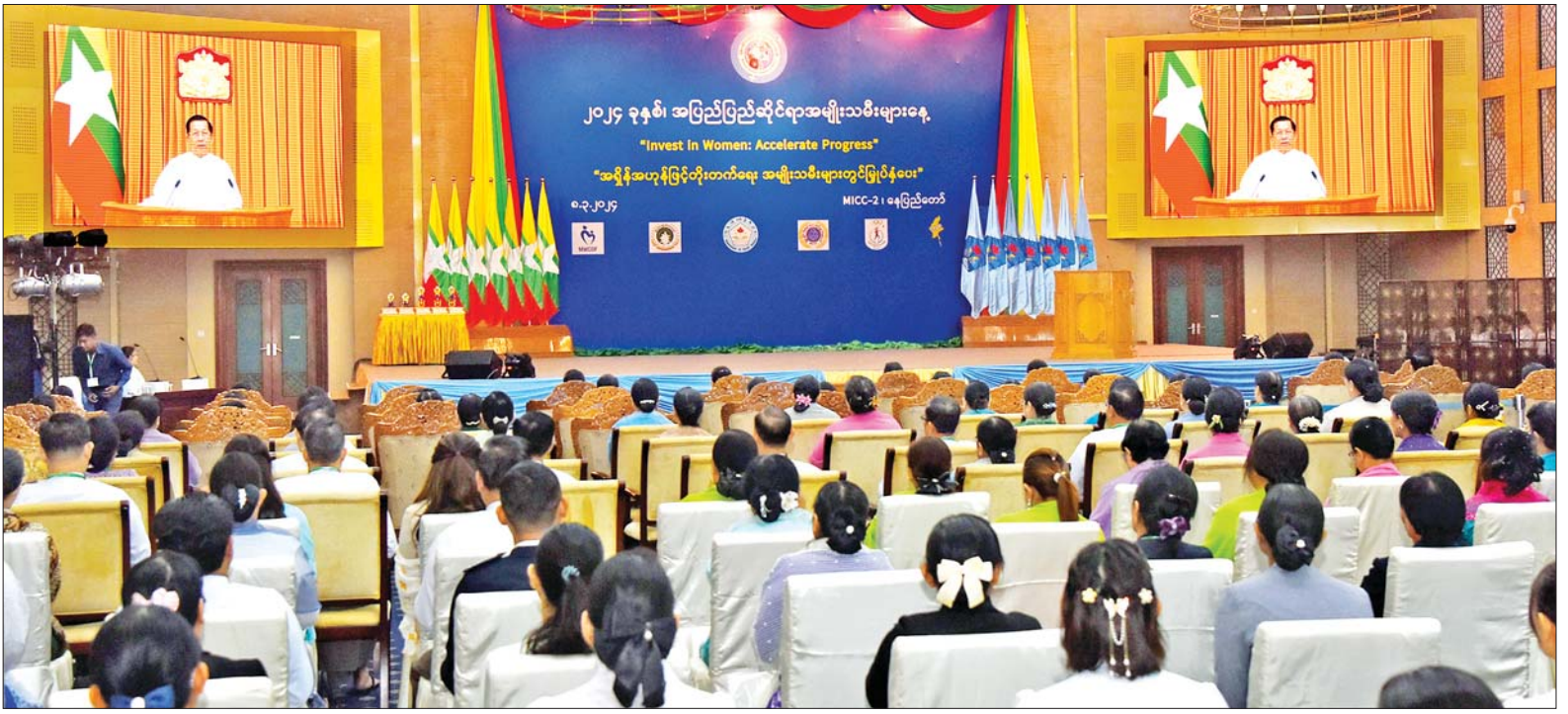
နိုင်ငံတော်စီမံအုပ်ချုပ်ရေးကောင်စီဥက္ကဋ္ဌ နိုင်ငံတော်ဝန်ကြီးချုပ် ဗိုလ်ချုပ်မှူးကြီးမင်းအောင်လှိုင် အပြည်ပြည်ဆိုင်ရာအမျိုးသမီးများနေ့အခမ်းအနားတွင် Video Message ဖြင့် အဖွင့်မိန့်ခွန်းပြောကြားစဉ်။

၀ ရှေ့ဖုံးမှ နိုင်ငံတော် စီမံအုပ်ချုပ်ရေး ကောင်စီအဖွဲ့ဝင် ဒေါ်ခွဲဘူ၊ ကောင်စီဝင်များ၏ ဇနီးများ၊ ပြည်ထောင်စုအဆင့်ပုဂ္ဂိုလ်များ၊ ပြည်ထောင်စု ဝန်ကြီးများနှင့် ၎င်းတို့၏ ဇနီးများ၊ တပ်မတော် အဆင့်မြင့်အရာရှိကြီးများ၏ ဇနီးများ၊ နေပြည်တော်ကောင်စီဥက္ကဋ္ဌ၊ မြန်မာနိုင်ငံတော် ဗဟိုဘဏ် ဥက္ကဋ္ဌ၊ ပြည်ထောင်စုတရား လွှတ်တော်ချုပ် တရားသူကြီးများ၊ နိုင်ငံတော်ဖွဲ့စည်းပုံအခြေခံဥပဒေ ဆိုင်ရာခုံရုံးအဖွဲ့ဝင်များ၊ ဒုတိယ ဝန်ကြီးများနှင့် ဇနီးများ၊ နေပြည်တော်တိုင်းစစ်ဌာနချုပ် တိုင်းမှူး၏ဇနီး၊ ဒုတိယစာရင်းစစ် ချုပ်၊ ပြည်ထောင်စုရာထူးဝန် အဖွဲ့ဝင်များ၊ အကတ်လိုက်စားမှု တိုက်ဖျက်ရေးကော်မရှင် အဖွဲ့ဝင် များ၊ မြန်မာနိုင်ငံအမျိုးသား လူ့အခွင့်အရေးကော်မရှင်အဖွဲ့ဝင် များ၊ ဌာနဆိုင်ရာအကြီးအကဲများ၊ အမျိုးသမီးများဆိုင်ရာ အသင်း အဖွဲ့များမှ ဥက္ကဋ္ဌများ၊ ဒုတိယ ဥက္ကဋ္ဌများနှင့် အဖွဲ့ဝင်များ၊ အထူး ဖိတ်ကြားထားသူများနှင့် တာဝန်