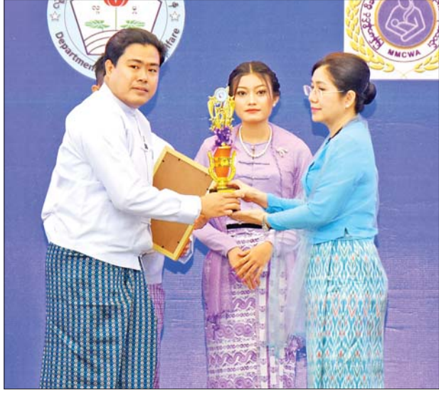
နိုင်ငံတော်စီမံအုပ်ချုပ်ရေးကောင်စီအတွင်းရေးမှူး၏ဇနီးက ၂၀၂၄ ခုနှစ် အပြည်ပြည်ဆိုင်ရာအမျိုးသမီးများနေ့အထိမ်းအမှတ် ဂုဏ်ပြုဆောင်းပါးပြိုင်ပွဲတွင် တတိယဆုရရှိသူအား ဂုဏ်ပြုဆုတံဆိပ်၊ ဂုဏ်ပြုမှတ်တမ်းလွှာနှင့် ဂုဏ်ပြုဆုငွေ ပေးအပ်ချီးမြှင့်စဉ်။

ယင်းနောက် ကုလသမဂ္ဂ အထွေထွေအတွင်းရေးမှူးချုပ်ထံ မှ ပေးပို့လာသည့် သဝဏ်လွှာ Video Clip နှင့် အမျိုးသမီးများ ဖွံ့ဖြိုးတိုးတက်ရေးဆိုင်ရာ သမိုင်း မှတ်တိုင်များ Video Clip တို့ကို ပြသသည်။