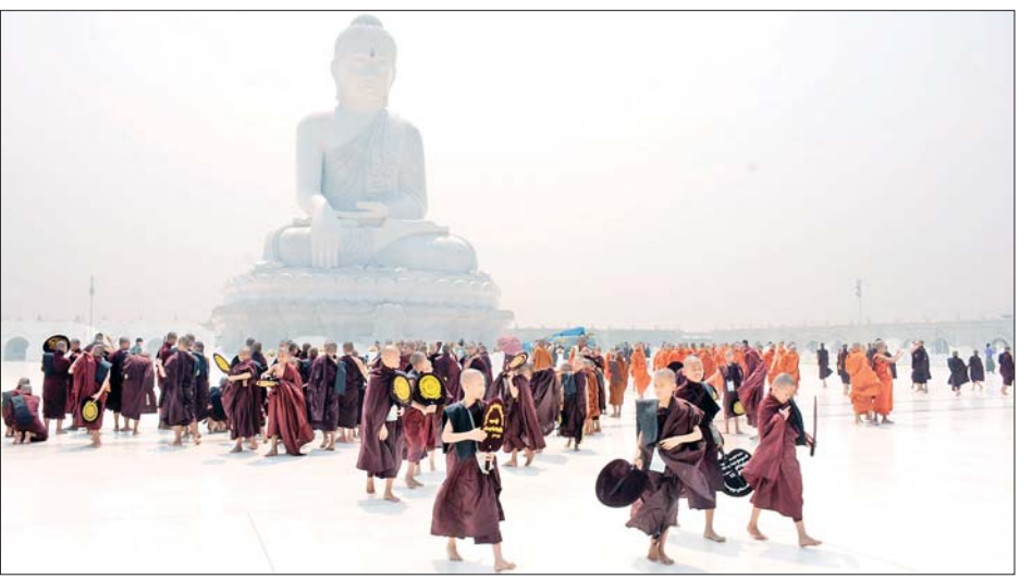
ဝိဇယဗုဒ္ဓရုပ်ပွားတော်မြတ်ကြီး ရှင်းလင်းလျှောက်ထားကြသည်။ ပြည်သူများ လာရောက်ဖူးမြော် အောင်မြင်စွာ တည်ထားပူဇော်နိုင် ထိုပြင် မာရဝိဇယဗုဒ္ဓရုပ်ပွား ကြည်ညိုလျက်ရှိကြောင်း သိရ ရန် အဆင့်ဆင့် ဆောင်ရွက်ခဲ့ပုံ တော်မြတ်ကြီးအား အနယ်နယ် သည်။ များကို ဗီဒီယိုမှတ်တမ်းများဖြင့် အရပ်ရပ်မှ ရဟန်းရှင်လူ ဘုရားဖူး သတင်းစဉ်

ပူဇော်ထားသည့် အဂ္ဂိမိပတိ သာသနာဗိမာန်တော်ကြီး၊ ကျောက် စာရုံစေတီတော်များ၊ သုဓမ္မာဇရပ် များ၊ မုစလိန္ဒအိုင်နှင့် အခြား သာသနိက အဆောက်အအုံများ ကို ဆက်လက်ဖူးမြော်လေ့လာ ကြည့်ညိုခဲ့ကြသည်။ ထိုကဲ့သို့ ပဲခူးတိုင်းဒေသကြီး ပဲခူးမြို့နယ်နှင့် သနပ်ပင်မြို့နယ် တို့မှ လာရောက် ဖူးမြော်ကြည်ညို ကြသည့် ဆရာတော်၊ သံဃာ တော်များအား မာရဝိဇယဗုဒ္ဓ ရုပ်ပွားတော်မြတ်ကြီး ဂေါပက အဖွဲ့ နှင့် ဗုဒ္ဓရုပ်ပွားတော်မြတ် ကြီး တည်ဆောက်ပူဇော်ခြင်း နှင့် ထိန်းသိမ်းခြင်းလုပ်ငန်းများ တွင် ပါဝင်ဆောင်ရွက်ခဲ့ကြသည့် ကျွမ်းကျင်ပညာရှင်များက မာရ