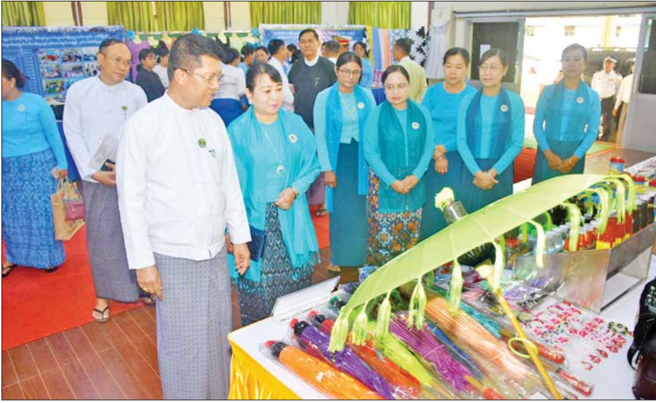
တို့ကို ကြည့်ရှုအားပေးခဲ့ပြီး စုပေါင်းမှတ်တမ်း တိုင်းဒေသကြီးဝန်ကြီးချုပ်နှင့် ဧည့်သည်တော်များ တင်ဓာတ်ပုံများ ရိုက်ကူးခဲ့သည်။ ထို့နောက် သည် ခန်းမအတွင်း ခင်းကျင်းပြသထားရှိသည့်

ပုသိမ် မတ် ၈ အပြည်ပြည်ဆိုင်ရာအမျိုးသမီးများနေ့ အခမ်း အနားကို ပုသိမ်မြို့ ရောဂါတိုင်းဒေသကြီး ဝန်ကြီးချုပ် ဦးတင်မောင်ဝင်းနှင့်ဇနီး၊ အစိုးရအဖွဲ့ဝင် များနှင့် ၎င်းတို့၏ဇနီးများ၊ လူမှုရေးအသင်းအဖွဲ့များ တက်ရောက်ကြသည်။ အခမ်းအနားတွင် တိုင်းဒေသ ကြီး ဝန်ကြီးချုပ်က အဖွင့်အမှာစကားပြောကြား သည်။