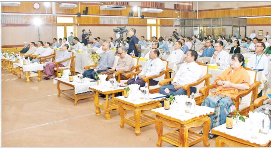
ပြည်ထောင်စုဝန်ကြီး ဦးမောင်မောင်အုန်း ပထဝီစီးပွားရေးနှင့် မြန်မာနိုင်ငံ(အခွင့်အလမ်းတွေ ဘယ်လိုရယူမလဲ) အလုပ်ရုံဆွေးနွေးပွဲတွင် အမှာစကားပြောကြားစဉ်။

တက်ရောက် အလုပ်ရုံဆွေးနွေးပွဲသို့ နိုင်ငံတော် စီမံအုပ်ချုပ်ရေးကောင်စီဥက္ကဋ္ဌရုံး ဝန်ကြီးဌာန(၁) ပြည်ထောင်စု ဝန်ကြီး ဦးကိုကိုလှိုင်၊ နိုင်ငံတော် စီမံအုပ်ချုပ်ရေးကောင်စီဥက္ကဋ္ဌရုံး ဝန်ကြီးဌာန(၂) ပြည်ထောင်စု ဝန်ကြီး ဦးအောင်နိုင်ဦး၊ ပြန်ကြား ရေးဝန်ကြီးဌာန ပြည်ထောင်စု ဝန်ကြီး ဦးမောင်မောင်အုန်း၊ အမြဲတမ်းအတွင်းဝန် ဦးမျိုးမြင့် မောင်၊ ဌာနဆိုင်ရာအကြီးအကဲ များ၊ မြန်မာရေးရာ လေ့လာရေး အဖွဲ့မှ သုတေသနပညာရှင်ဦးကိုကို (ကိုကို-စက်မှုတက္ကသိုလ်)၊ မြန်မာ လူမှုစီးပွားဖွံ့ဖြိုးမှု အဖွဲ့အစည်းမှ အမှုဆောင် ညွှန်ကြားရေးမှူး ဒေါက်တာဇော်ဦး၊ Financial Management၊ Vancouver၊ Canada ငွေကြေးစီမံခန့်ခွဲမှု ပညာရှင် ဦးဝိလျှံအောင်၊ ဝန်ကြီး ဌာနများမှ တာဝန်ရှိသူများနှင့် ဖိတ်ကြားထားသူများ တက်ရောက် ကြသည်။