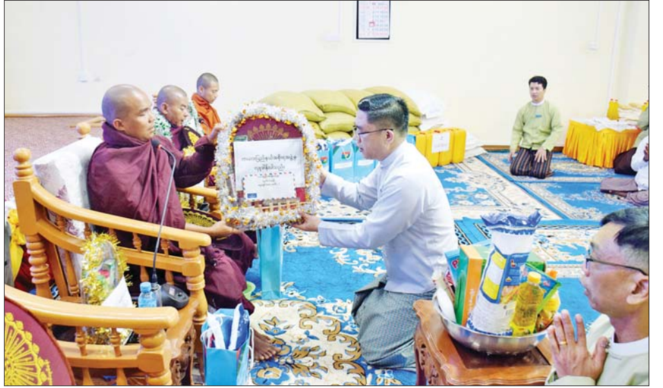
သူမြတ်များအား နေ့ဆွမ်း ဆက်ကပ်လှူဒါန်းခဲ့ကြောင်း သိရသည်။ အဆိုပါ ဆက်ကပ်လှူဒါန်းပွဲတွင် ကယားပြည်နယ်အစိုးရအဖွဲ့က လွိုင်ကော်မြို့နယ်အတွင်းရှိ ဘုန်းတော်ကြီးကျောင်း ၈၃ ကျောင်းနှင့် သီလရှင်ကျောင်း တစ်ကျောင်းတို့မှ သံဃာတော်အပါး ၂၃၀ နှင့် သီလရှင် နှစ်ပါးတို့အတွက် ဆွမ်းဆန်တော်၊ ဆီ၊ ဆား၊ ပဲ ဆက်ကပ်လှူဒါန်းမှု စုစုပေါင်း တန်ဖိုးငွေကျပ် ၁၇၆၆၉၂၀၀ ဖြစ်ကြောင်း သိရသည်။ (ပြန်/ဆက်)

ဝန်ကြီးချုပ်အမှုပြုသော ဧည့်ပရိသတ်အပေါင်းတို့က အခမ်းအနားကို “နမောတဿ” သုံးကြိမ်ရွတ်ဆို ဘုရားကန်တော့ခဲ့ကြပြီး တပ်ဦး ကျောင်းဆရာတော် အရှင်သူမြတ်ထံမှ ငါးပါးသီလခံယူဆောက်တည်၍ ပရိတ်တရားတော်များကို နာယူကြည်ညိုခဲ့ကြသည်။