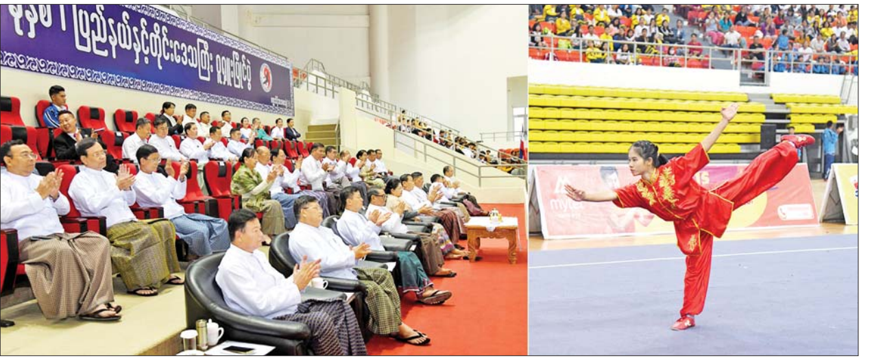
နိုင်ငံတော်စီမံအုပ်ချုပ်ရေး ကောင်စီအဖွဲ့ဝင်များနှင့် တာဝန်ရှိသူများ ပြိုင်ပွဲဝင်အားကစားသမားတစ်ဦး ယှဉ်ပြိုင်နေမှုကို ကြည့်ရှုအားပေးစဉ်။

ပြည်ထောင်စုဝန်ကြီးများ၊ ဒုတိယ ဝန်ကြီးများ၊ ဌာနဆိုင်ရာတာဝန် ရှိသူများ၊ မြန်မာနိုင်ငံ ဝူရှူးအဖွဲ့ ချုပ်ဥက္ကဋ္ဌနှင့် တာဝန်ရှိသူများ၊ ပြိုင်ပွဲဝင်အသင်းများမှ အုပ်ချုပ် သူ/ နည်းပြများနှင့် အားကစား သမားများ တက်ရောက်ကြသည်။ အခမ်းအနားတွင် မြန်မာနိုင်ငံ အိုလံပစ်ကော်မတီ ဥက္ကဋ္ဌ အားကစားနှင့် လူငယ်ရေးရာ ဝန်ကြီးဌာန ပြည်ထောင်စုဝန်ကြီး ဦးမင်းသိန်းဇံက ယခုပြိုင်ပွဲကို ပါဝင်ယှဉ်ပြိုင်ကြမည့် အားကစား သမား မောင်/မယ်များသည် မိမိ တို့၏ အစွမ်းအစအရည်အသွေး များကို အစွမ်းကုန်ဖော်ထုတ်ပြသ ပြီး မိမိတို့ကိုယ်စားပြု ယှဉ်ပြိုင်