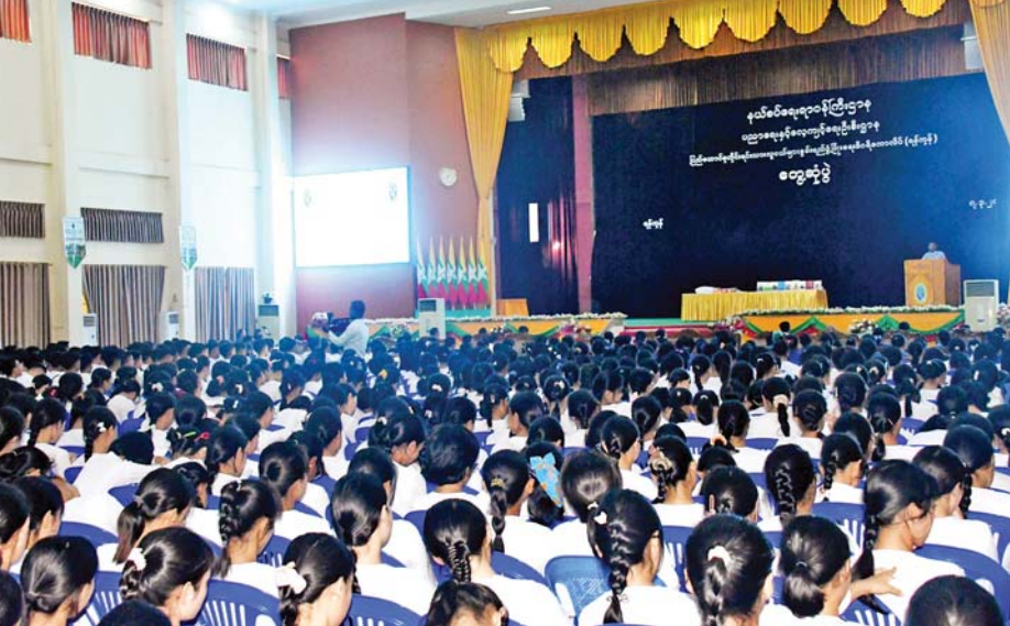
သားကျောင်းသား ကျောင်းသူများ အနေဖြင့် ပညာကြိုးစားပြီး ဒေသဖွံ့ဖြိုးတိုးတက်ရေးအတွက် ကျရာတာဝန်ကို ကျေပွန်စွာထမ်းဆောင်ကြရန်လိုကြောင်း၊ လူငယ်များသည် နိုင်ငံ၏အနာဂတ်ဖြစ်ပြီး အသိပညာ၊ အတတ်ပညာ ပြည့်ဝသော လူငယ်များဖြင့်သာ နိုင်ငံတော်ကို ဖွံ့ဖြိုးတိုးတက်အောင် တည်ဆောက်နိုင်မည်ဖြစ်ကြောင်း၊ ထို့ကြောင့် စာအုပ်စာပေများကို စဉ်ဆက်မပြတ်ဖတ်ရှုလေ့လာကြရန် တိုက်တွန်းလိုကြောင်း၊ သင်တန်းများတွင် အတတ်ပညာသာမက ဘက်ပေါင်းစုံမှ စနစ်တကျ လေ့ကျင့်သင်ကြား ပေးနေခြင်းဖြစ်၍ ဗလငါးတန်ပြည့်ဝပြီး မိမိဒေသနှင့် နိုင်ငံတော်အတွက် အကျိုးပြုနိုင်မည့် လူငယ်များဖြစ်အောင် ကြိုးစားကြစေလိုကြောင်း၊ မိမိတို့ဒေသများ တည်ငြိမ်အေးချမ်းရေးနှင့် ဖွံ့ဖြိုးတိုးတက်ရေးကို မျိုးချစ်စိတ်ဓာတ်၊ ပြည်ထောင်စုစိတ်ဓာတ်

ရန်ကုန် မတ် ၇ ပြန်ကြားရေး ဝန်ကြီးဌာန ဒုတိယဝန်ကြီး ဦးရဲတင့်သည် ယနေ့ မွန်လွှဲပိုင်းတွင် ရန်ကုန်မြို့ ပြည်ထောင်စု တိုင်းရင်းသား လူငယ်များ စွမ်းရည်ဖွံ့ဖြိုးရေး ဒီဂရီကောလိပ်၌ ကျောင်းသား ကျောင်းသူများ၊ ဆရာ ဆရာမများ နှင့် ဝန်ထမ်းများအား တွေ့ဆုံ၍ လူငယ်ရေးရာနှင့် ဗလငါးတန် ဖွံ့ဖြိုးရေးဆိုင်ရာများ ဆွေးနွေးမှာကြားသည်။ စာအုပ်စာပေဖတ်ရှုလေ့လာ ဒုတိယဝန်ကြီးက ဆွေးနွေးမှာကြားရာတွင် နိုင်ငံတော်အနေဖြင့် တိုင်းရင်းသားဒေသများနှင့် ကျေးလက်ဒေသများ လူ့စွမ်းအားအရင်းအမြစ် ဖွံ့ဖြိုးတိုးတက်ရေးအတွက် တိုင်းရင်းသားလူမျိုးများ ဖွံ့ဖြိုးရေး တက္ကသိုလ်နှင့် စွမ်းရည်ဖွံ့ဖြိုးရေး ဒီဂရီကောလိပ်များ၊ သင်တန်းကျောင်းများ ဖွင့်လှစ်သင်ကြားပေးလျက်ရှိကြောင်း၊ တိုင်းရင်း