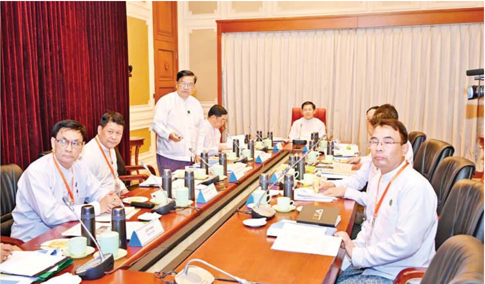
နိုင်ငံတော်စီမံအုပ်ချုပ်ရေးကောင်စီဥက္ကဋ္ဌ နိုင်ငံတော်ဝန်ကြီးချုပ် ဗိုလ်ချုပ်မှူးကြီးမင်းအောင်လှိုင်အား ပြည်ထောင်စုဝန်ကြီး ဒေါက်တာချာလီသန်း ရှင်းလင်းတင်ပြစဉ်။

ရှေးဖုံးမှ ညှိနှိုင်းဆွေးနွေးပွဲသို့ နိုင်ငံတော် စီမံအုပ်ချုပ်ရေးကောင်စီအဖွဲ့ဝင် ဒုတိယ ဗိုလ်ချုပ်ကြီး ညိုစော၊ သမဝါယမနှင့် ကျေးလက်ဖွံ့ဖြိုးရေး ဝန်ကြီးဌာန ပြည်ထောင်စုဝန်ကြီးဦးလှမိုး၊ စက်မှုဝန်ကြီး ဌာန ပြည်ထောင်စုဝန်ကြီး ဒေါက်တာ ချာလီသန်း၊ စီးပွားရေးနှင့် ကူးသန်း ရောင်းဝယ်ရေးဝန်ကြီးဌာန ပြည်ထောင်စု ဝန်ကြီး ဦးထွန်းအံ၊ ဒုတိယဝန်ကြီးများနှင့် ညွှန်ကြားရေးမှူးချုပ်များ တက်ရောက်ကြ သည်။