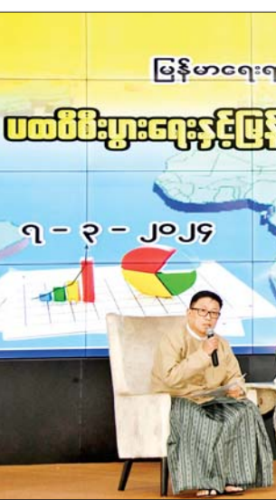
ပထဝီစီးပွားရေးနှင့် မြန်မာနိုင်ငံ(အခွင့်အလမ်းတွေ ဘယ်လိုရယူမလဲ) အလုပ်ရုံဆွေးနွေးပွဲ ကျင်းပစဉ်။

ဖော်ဆောင်နေမှုအင်အားကြီးနိုင်ငံ များသည်စီးပွားရေးဖော်ဆောင်ရာ တွင် မိမိနိုင်ငံအတွက် အမျိုးသား အကျိုးစီးပွား ထားရှိဆောင်ရွက်မှု၊ ပထဝီနိုင်ငံရေးတွင် သူနိုင် - ငါရှုံး သဘောတရားကို အခြေခံသော် လည်း ပထဝီစီးပွားရေးတွင် သူနိုင် - ငါနိုင် အကျိုးစီးပွားကို အခြေခံမှု၊