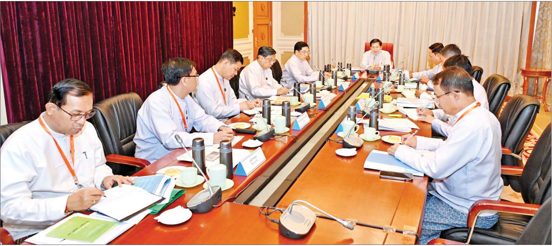
နိုင်ငံတော်စီမံအုပ်ချုပ်ရေးကောင်စီဥက္ကဋ္ဌ နိုင်ငံတော်ဝန်ကြီးချုပ် ဗိုလ်ချုပ်မှူးကြီး မင်းအောင်လှိုင် ဝါသီးနှံစိုက်ပျိုးထုတ်လုပ်မှုနှင့် ချည်မျှင်နှင့်အထည်အလိပ်လုပ်ငန်းများ ဖွံ့ဖြိုးတိုးတက်ရေး ညှိနှိုင်းဆွေးနွေးပွဲတွင် ဆွေးနွေးပြောကြားစဉ်။