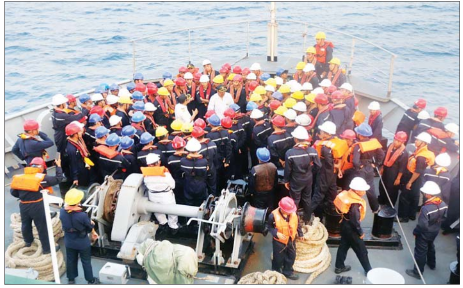
မြန်မာနိုင်ငံကုန်သွယ်ရေးကြောင်းကောလိပ် အရာရှိလောင်း ဒီပလိုမာသင်တန်းသားများအား ရေကြောင်းပညာရပ်ဆိုင်ရာများကို သက်ဆိုင်ရာကျွမ်းကျင်ဆရာများက သင်ကြားပေးစဉ်။

မြန်မာနိုင်ငံ ကုန်သွယ်ရေးကြောင်းကောလိပ် အနေဖြင့် မျိုးဆက်သစ်ရေကြောင်းအရာရှိလောင်း များ၊ သင်တန်းသားအသစ်များကို စဉ်ဆက်မပြတ် မွေးထုတ်ပေးလျက်ရှိရာ နိုင်ငံတော်အတွင်းရှိ လူ့စွမ်းအားအရင်းအမြစ်များကို ပြုစုပျိုးထောင်ပေး ရာတွင် တတ်စွမ်းသည့်ဘက်မှ ကြိုးပမ်းမျှော်မှန်း ဖော်ဆောင်ပေးလျက်ရှိနေပါသည်။ နိုင်ငံတော်နှင့် နိုင်ငံသားများ ဖွံ့ဖြိုးတိုးတက်လာစေရန်၊ နိုင်ငံတော် ၏ ရေကြောင်းဆိုင်ရာ အကျိုးစီးပွားများနှင့် နိုင်ငံခြားဝင်ငွေများ ရရှိနိုင်စေရန်အတွက် တစ်ဖက် တစ်လမ်းမှ အထောက်အကူပြုပေးနေသော ရေကြောင်းဘက်ဆိုင်ရာ အတတ်ပညာသင်ကောလိပ် တစ်ခုအဖြစ် ကမ္ဘာ့အလယ်တွင် ဂုဏ်သိက္ခာရှိရှိ အစဉ်ရပ်တည်ကာ နိုင်ငံတော်အပေါ် ခေတ်ကာလ အဆက်ဆက် ကျေးဇူးပြုလျက်ရှိနေမည်သာ ဖြစ်ပါ တော့သည်။ ။