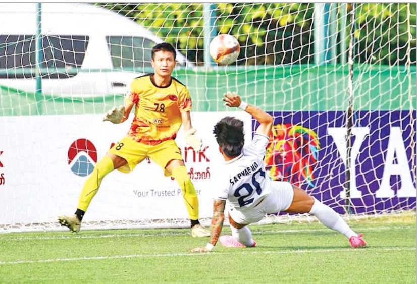
ရှမ်းယူနိုက်တက်အသင်းနှင့် Glory Goal အသင်း ယှဉ်ပြိုင်နေစဉ်။