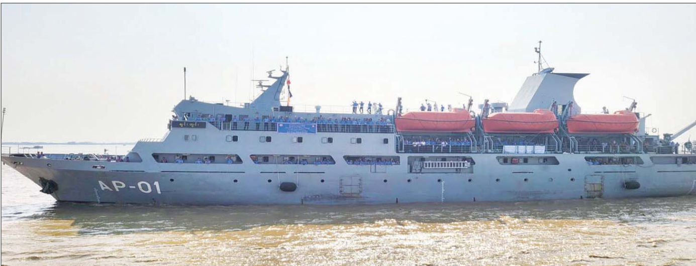
တပ်မတော်(ရေ) စစ်ရေယာဉ်(ချင်းတွင်း)ဖြင့် မြန်မာနိုင်ငံကုန်သွယ်ရေးကြောင်းကောလိပ် အရာရှိလောင်း ဒီပလိုမာသင်တန်းသားများ ပင်လယ်ပြင် လက်တွေ့လေ့ကျင့်ရေးခရီးစဉ် ထွက်ခွာစဉ်။

ချင်းတွင်းရေယာဉ်သည် ဖေဖော်ဝါရီလ ၂၅ ရက်နေ့ ညနေ ၅ နာရီခွဲတွင် ကိုကိုးကျွန်းမှ ပြန်လည်ထွက်ခွာ လာခဲ့ပြီး ဖေဖော်ဝါရီလ ၂၆ ရက်နေ့ နံနက် ၇ နာရီခွဲတွင် ဟိုင်းကြီးကျွန်း ပမ္မဝတီရေတပ်စခန်း ဌာနချုပ်ဆိပ်ခံ တံတားသို့ ဆိုက်ကပ်ခဲ့ပါသည်။ ယင်းနေ့နံနက်တွင် ပမ္မဝတီရေတပ်စခန်း ဌာနချုပ်ခန်းမ၌ ဒုတိယဌာန ချုပ်မှူးက အရာရှိလောင်းတို့အား ကြိုဆိုနှုတ်ခွန်း ဆက်စကားပြောကြားပြီး အခြားတာဝန်ရှိသူ များက ဟိုင်းကြီးကျွန်းဆိုင်ရာအချက်အလက်များ၊ မော်တင်စွန်းဘုရား၏ သမိုင်းကြောင်းများကို ပါဝါပွင့်များနှင့်တကွ ရှင်းလင်းပြသခဲ့ကြသည်။ ထို့နောက် ပမ္မဝတီရေတပ်စခန်းဌာနချုပ်၏ စီစဉ် ပေးမှုဖြင့် ဆံတော်ရှင်မော်တင်စွန်းဘုရားသို့ သွားရောက်ဖူးမြော်ကြပြီး ဘုရားဂေါပကလူကြီး များထံ အလှူငွေများ ပေးအပ်လှူဒါန်းခဲ့ကြသည်။ ထို့အပြင် သမိုင်းဝင်သူရဲကောင်း မင်းရဲကောင်းပုံ၏ ကျူးကျော်သူနယ်ချဲ့တို့အား ချေမှုန်းတိုက်ခိုက်ခဲ့ သောနေရာကိုလည်း ဝင်ရောက်လေ့လာခဲ့ကြကာ ညနေပိုင်းတွင် ပမ္မဝတီရေတပ်စခန်းက တည်ခင်း ဧည့်ခံသည့်ညစာစားပွဲသို့ တက်ရောက်ခဲ့ကြပါသည်။ ဖေဖော်ဝါရီလ ၂၇ ရက်နေ့ နံနက်ပိုင်းတွင် အရာ ရှိလောင်းများကိုယ်တိုင်ပါဝင်ကာ လှေလှော်ရွက်တိုက်