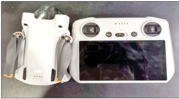
ရန်ကုန်အပြည်ပြည်ဆိုင်ရာလေဆိပ် လေဆိပ် (သွင်းကုန်)၌ ဖမ်းဆီးရမိမှုမှတ်တမ်းဓာတ်ပုံ။

နေပြည်တော် မတ် ၅ - တရားမဝင်ကုန်သွယ်မှုတိုက်ဖျက်ရေး ဦးဆောင်ကော်မတီ၏ ကြီးကြပ်ကွပ်ကဲမှုဖြင့် တရားမဝင် ကုန်သွယ်မှုများကို ဥပဒေနှင့်အညီ ထိရောက်စွာ တားဆီးအရေးယူနိုင်ရေး ဆောင်ရွက်လျက်ရှိရာ မတ် ၃ ရက်တွင် အကောက်ခွန်ဦးစီးဌာန၏ စီမံခန့်ခွဲမှုဖြင့် တာဝန်ကျ ပူးပေါင်းအဖွဲ့များက စစ်ဆေးမှုများ ဆောင်ရွက်ရာတွင် ရန်ကုန်အပြည်ပြည်ဆိုင်ရာလေဆိပ် လေဆိပ်(သွင်းကုန်)၌ ဝန်စည်များအတွင်းမှ တရားဝင်စာရွက်စာတမ်းအထောက်အထား တင်ပြနိုင်ခြင်းမရှိသည့် DJI Drone Mavic Air (Used) တစ်လုံး၊ Yun Yan Fitter စီးကရက် လေးတောင့်၊ ကျောက်စိမ်းဟု ယူဆရသော ရေနွေးကရားတစ်စုံ အပါအဝင် ကုန်ပစ္စည်းခြောက်မျိုး (စုစုပေါင်း ခန့်မှန်းတန်ဖိုးငွေကျပ် ၈၁၀၀၀၀)ကို သိမ်းဆည်းရမိခဲ့ပြီး အကောက်ခွန်လုပ်ထုံးလုပ်နည်းများနှင့်အညီ အရေးယူဆောင်ရွက်လျက်ရှိသည်။ ထို့အတူ မတ် ၃ ရက်တွင် မွန်ပြည်နယ်တရားမဝင်ကုန်သွယ်မှု တိုက်ဖျက်ရေးအထူးအဖွဲ့၏ စီမံခန့်ခွဲမှုဖြင့် တာဝန်ကျပူးပေါင်းအဖွဲ့က စစ်ဆေးမှုများ ဆောင်ရွက်ခဲ့ရာ ဇာသပြင်တံတားအနီး၌ ဇာသပြင်မှ မော်လမြိုင်မြို့သို့ မောင်းနှင်လာသော ယာဉ်နှစ်စီးပေါ်မှ တရားဝင် စာရွက်စာတမ်း အထောက်အထား တင်ပြနိုင်ခြင်းမရှိသည့် ပုစွန် တစ်ကောင် စားဆီ ၁၈လီတာပါ ပုံး ၂၀၀ (ခန့်မှန်းတန်ဖိုးငွေကျပ် ၉၈၀၀၀၀)၊ M1-150 အားဖြည့်အချိုရည် ပုလင်း ၁၅၀၀၀ (ခန့်မှန်းတန်ဖိုးငွေကျပ် ၉၀၀၀၀၀)နှင့် အဆိုပါပစ္စည်းများ တင်ဆောင်လာသည့် Mitsubishi Canter နှစ်စီး (ခန့်မှန်းတန်ဖိုးငွေကျပ် ၄၀၀၀၀၀၀)၊ စုစုပေါင်း ခန့်မှန်းတန်ဖိုးငွေကျပ် ၅၈၈၀၀၀၀ ကို သိမ်းဆည်းရမိခဲ့ပြီး အကောက်ခွန်လုပ်ထုံးလုပ်နည်းများနှင့်အညီ အရေးယူဆောင်ရွက်လျက် ရှိသည်။ ထို့ပြင် မတ် ၄ ရက်တွင် ကချင်ပြည်နယ်တရားမဝင်ကုန်သွယ်မှု တိုက်ဖျက်ရေးအထူးအဖွဲ့၏ စီမံခန့်ခွဲမှုဖြင့် တာဝန်ကျပူးပေါင်းအဖွဲ့က