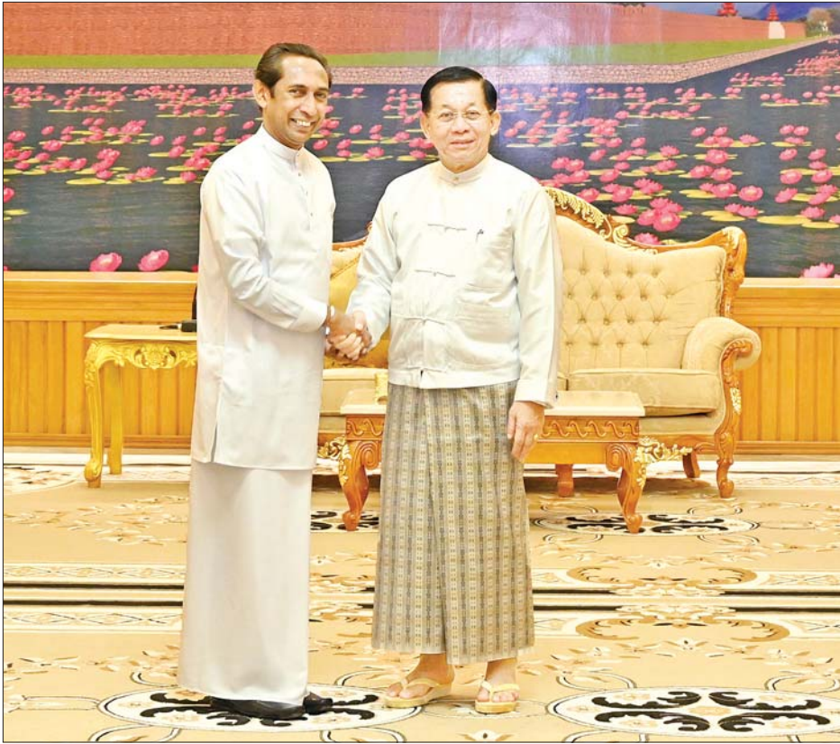
နိုင်ငံတော်စီမံအုပ်ချုပ်ရေးကောင်စီ ဥက္ကဋ္ဌ နိုင်ငံတော်ဝန်ကြီးချုပ် ဗိုလ်ချုပ်မှူးကြီး မင်းအောင်လှိုင် တာဝန်ပြန်ဆုံး၍ ပြန်လည်ထွက်ခွာမည့် မြန်မာနိုင်ငံဆိုင်ရာ သီရိလင်္ကာနိုင်ငံသံအမတ်ကြီး H.E. Mr. J.M.J.P. Bandara အား ရင်းရင်းနှီးနှီးနှုတ်ဆက်စဉ်။