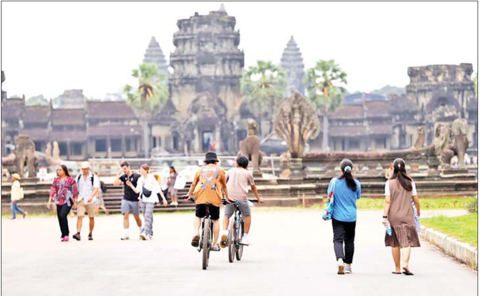
ကမ္ဘောဒီးယားနိုင်ငံသည် ၂၀၂၃ ခုနှစ်တွင် ဝင်ငွေ အမေရိကန်ဒေါ်လာ ၃ ဒသမ ၀၈ ဘီလီယံ နိုင်ငံခြားခရီးသွားဧည့်သည်ဝင်ရောက်မှု ၅ ဒသမ ရရှိခဲ့ကြောင်း သိရသည်။ ၄၅ သန်းရှိခဲ့ပြီး ခရီးသွားဝင်ရောက်မှုမှ စုစုပေါင်း ကိုးကား-ဆင်ဟွာ၊ ဘာသာပြန်-အလင်းသစ်

ကမ္ဘောဒီးယားနိုင်ငံသည် ၂၀၂၄ ခုနှစ်ကို ကမ္ဘောဒီးယား-တရုတ် အပြန်အလှန်ခရီးသွားရေးနှစ် အဖြစ် ဇန်နဝါရီလတွင် စတင်သတ်မှတ်ခဲ့ကြောင်း သိရသည်။ ခရီးသွားလုပ်ငန်းသည် ကမ္ဘောဒီးယား နိုင်ငံ၏ စီးပွားရေးကို အထောက်အကူပြုသည့် ကဏ္ဍ လေးခုအနက်မှ တစ်ခုဖြစ်သည်။