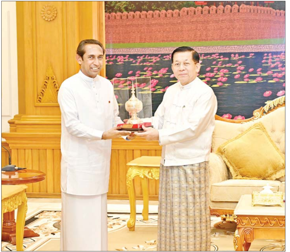
နိုင်ငံတော်စီမံအုပ်ချုပ်ရေးကောင်စီဥက္ကဋ္ဌ နိုင်ငံတော်ဝန်ကြီးချုပ် ဗိုလ်ချုပ်မှူးကြီး မင်းအောင်လှိုင်နှင့် မြန်မာနိုင်ငံဆိုင်ရာ သီရိလင်္ကာနိုင်ငံသံအမတ်ကြီး H.E. Mr. J.M.J.P. Bandara တို့ အမှတ်တရလက်ဆောင် ပစ္စည်းများ အပြန်အလှန်ပေးအပ်စဉ်။

* ရှေ့ဖုံးမှ သီရိလင်္ကာနိုင်ငံရှိ ထေရ်ကြီးဝါကြီး ဆရာတော်ကြီးများအား မြန်မာနိုင်ငံမှ သာသနာတော်ဆိုင်ရာ သို့မဟုတ် ဆက်ကပ်ခဲ့မှုအခြေအနေများ၊ ခရီးသွားလုပ်ငန်းများတိုးတက်ရေးအတွက် ပူးပေါင်းဆောင်ရွက်ရေးဆိုင်ရာကိစ္စရပ်များ၊ နှစ်နိုင်ငံအကြားကုန်သွယ်မှုများ မြှင့်တင်ရေးနှင့် ရင်းနှီးမြှုပ်နှံမှုများတွင် ပူးပေါင်းဆောင်ရွက်ရေးဆိုင်ရာ ကိစ္စရပ်များ၊ ပညာရေးဆိုင်ရာများတွင် အပြန်အလှန်ပူးပေါင်းဆောင်ရွက်ရေးဆိုင်ရာ ကိစ္စရပ်များ၊ မြန်မာနိုင်ငံအနေဖြင့် လွတ်လပ်ပြီး တရားမျှတသည့် ရွေးကောက်ပွဲကျင်းပနိုင်ရေး ကြိုတင်ပြင်ဆင်ဆောင်ရွက်လျက်ရှိသည့် အခြေအနေများနှင့်စပ်လျဉ်း၍ ရင်းနှီးပွင့်လင်းစွာ အမြင်ချင်းဖလှယ် ဆွေးနွေးခဲ့ကြသည်။ တွေ့ဆုံပွဲအပြီးတွင် နိုင်ငံတော်စီမံအုပ်ချုပ်ရေးကောင်စီ ဥက္ကဋ္ဌ နိုင်ငံတော်ဝန်ကြီးချုပ်နှင့် မြန်မာနိုင်ငံဆိုင်ရာ သီရိလင်္ကာနိုင်ငံ သံအမတ်ကြီးတို့သည် အမှတ်တရ လက်ဆောင်ပစ္စည်းများ အပြန်အလှန်ပေးအပ်ခဲ့ကြကြောင်း သိရသည်။ သတင်းစဉ်