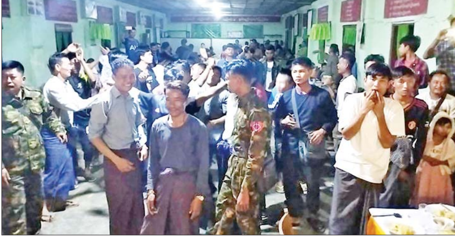
ကာကွယ်ရေးဦးစီးချုပ်ရုံး(ကြည်း)၊ ပြည်သူ့ဆက်ဆံရေးနှင့်စိတ်ဓာတ်စစ်ဆင်ရေး ညွှန်ကြားရေးမှူးရုံးကွပ်ကဲမှုအောက်ရှိ နယ်လှည့်ပြည်သူ့ဆက်ဆံရေး အဖွဲ့များမှ အရာရှိ၊ စစ်သည်၊ စစ်သမီးများနှင့် မြန်မာ့အသံနှင့် ရုပ်မြင်သံကြား(MRTV)မှ ဖျော်ဖြေရေးအဖွဲ့များက တိုင်းစစ်ဌာနချုပ်အသီးသီးရှိ

နေပြည်တော် မတ် ၅ တိုင်းဒေသကြီးနှင့် ပြည်နယ် အသီးသီးရှိ တိုင်းရင်းသားပြည်သူများ စိတ်အေးချမ်းသာစွာ နေထိုင်လုပ်ကိုင် စားသောက်နိုင်ရေးနှင့် အသက်အိုးအိမ် စည်းစိမ်ဥစ္စာ လုံခြုံမှုရှိစေရေးအတွက် နိုင်ငံတော်ကာကွယ်ရေးနှင့် လုံခြုံရေးတာဝန်များကို မိဝေးဖဝေး၊ မိသားစုများနှင့် ဝေးကွာ၍ နေ့မအား ညမနား စွမ်းစွမ်းတမ်း တာဝန်ထမ်းဆောင်လျက်ရှိရာမှ တပ်ရင်းဌာနချုပ်ရှိ မိသားစုဝင်များရှိရာသို့ ပြန်လည်စုဖွဲ့ လေ့ကျင့်လျက်ရှိသော တပ်မတော်သားများ စိတ်ပျော်ရွှင်ကြည်နူးချမ်းမြေ့စေရန်အတွက်