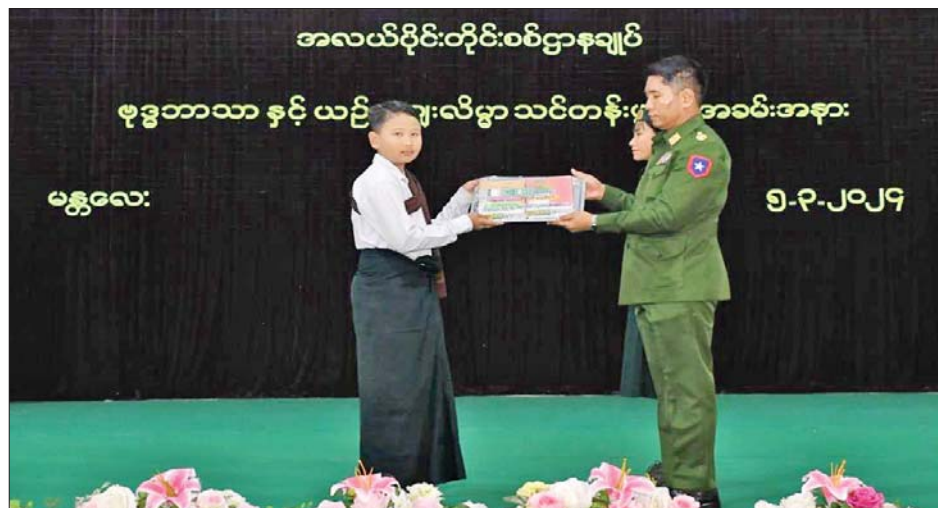
ဦးစွာ တိုင်းမှူးက သင်တန်းဖွင့် အမှာစကား ပြောကြား သည်။ ထို့နောက် တိုင်းမှူးနှင့် တာဝန်ရှိသူများက သင်တန်းသား သင်တန်းသူများအတွက် သင်ထောက်ကူပစ္စည်းများ ပေးအပ်ပြီး သင်တန်းသား သင်တန်းသူများအား ရင်းရင်းနှီးနှီး လိုက်လံနှုတ်ဆက်ကာ လိုအပ်သည်များ ညှိနှိုင်းဆောင်ရွက်ပေးသည်။ အလားတူ တိုင်းစစ်ဌာနချုပ် ကွပ်ကဲမှုအောက် တပ်နယ်၊ တပ်ရင်း/တပ်ဖွဲ့များ၌လည်း တပ်မတော်သား မိသားစုဝင် ကျောင်းသား ကျောင်းသူများအား အဆိုပါ သင်တန်းကို ဖွင့်လှစ်သင်ကြားပေးလျက်ရှိကြောင်း သိရသည်။ သတင်းစဉ်

နေပြည်တော် မတ် ၅ ကျောင်းသား ကျောင်းသူများအနေဖြင့် နွေရာသီ ကျောင်းပိတ်ရက်ကာလများတွင် အားလပ်ချိန်ကို အကျိုးရှိရှိအသုံးပြု မိမိတို့အတွက် အကျိုးရှိစေမည့် ယဉ်ကျေးလိမ္မာမှုများကို လေ့လာသင်ယူနိုင်ရန်၊ မိမိတို့ကိုးကွယ်ယုံကြည်မှုနှင့် စပ်လျဉ်းပြီး သိသင့်သိထိုက်သည့် ဘုရားရှိခိုးခြင်း၊ သီလဆောက်တည်ခြင်း၊ မိမိတို့ ဗုဒ္ဓမြတ်စွာဘုရားနှင့် ပတ်သက်သည့် သမိုင်းကြောင်းဆိုင်ရာ ဗုဒ္ဓဝင်နှင့် ဗုဒ္ဓဘာသာကို သက်ဝင်ယုံကြည်သူတိုင်း လက်ကိုင်ထားကျင့်သုံးရမည့် မင်္ဂလာသုတ်တော် အပါအဝင် အခြားသိသင့်သိထိုက်သည့် ဘာသာရေးဗဟုသုတများကို သိရှိစေရန် ရည်ရွယ်၍ ဗုဒ္ဓဘာသာနှင့်ယဉ်ကျေးလိမ္မာသင်တန်းကို ယနေ့နံနက်ပိုင်းတွင် အလယ်ပိုင်းတိုင်းစစ်ဌာနချုပ်ရှိ ရန်အောင်မြင်ခန်းမ၌ ဖွင့်လှစ်ခဲ့ရာ တိုင်းမှူး ဗိုလ်ချုပ်ကြည်ခိုင်နှင့် တာဝန်ရှိသူများ၊ အရာရှိ၊ စစ်သားစုဝင်များ၊ ဆရာ ဆရာမများ၊ သင်တန်းသား သင်တန်းသူများ တက်ရောက်ကြသည်။