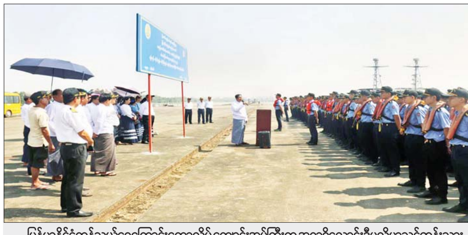
မြန်မာနိုင်ငံကုန်သွယ်ရေးကြောင်းကောလိပ်ကျောင်းအုပ်ကြီးက အရာရှိလောင်းဒီပလိုမာသင်တန်းသားများအား ပင်လယ်ပြင်လေ့ကျင့်ရေးခရီးစဉ်နှင့်ပတ်သက်၍ မှာကြားစဉ်။

ရေကြောင်းကုန်သွယ်မှု လုပ်ငန်းများသည် ပြည်တွင်း သယ်ယူပို့ဆောင်ရေးအတွက်သာမက ကမ္ဘာ့ကုန်သွယ်မှုများ၌ပါ နိုင်ငံစီးပွားရေးမြှင့်တင်မှု အခန်းကဏ္ဍတွင် အရေးပါပြီး စီးပွားရေးဖွံ့ဖြိုး တိုးတက်မှု၏ မောင်းနှင်အားအဖြစ် ကျောထောက် နောက်ခံပြုလျက်ရှိပါသည်။ ကမ္ဘာ့ကုန်သွယ်မှု၏ ၉၀ ရာခိုင်နှုန်းမှာလည်း ကုန်ကျစရိတ်အသက်သာဆုံး ဖြစ်သည့် ပင်လယ်ရေကြောင်းဖြင့်ပင် သယ်ယူ ပို့ဆောင်ပေးကြရသည့်အတွက် ပင်လယ်ရေကြောင်း ကုန်သွယ်မှုသည် နိုင်ငံတကာကုန်သွယ်မှုနှင့် ကမ္ဘာ့စီးပွားရေး၏ အသက်သွေးကြောတစ်ခုအဖြစ် အမြဲပင်တည်လျက်ရှိပါသည်။