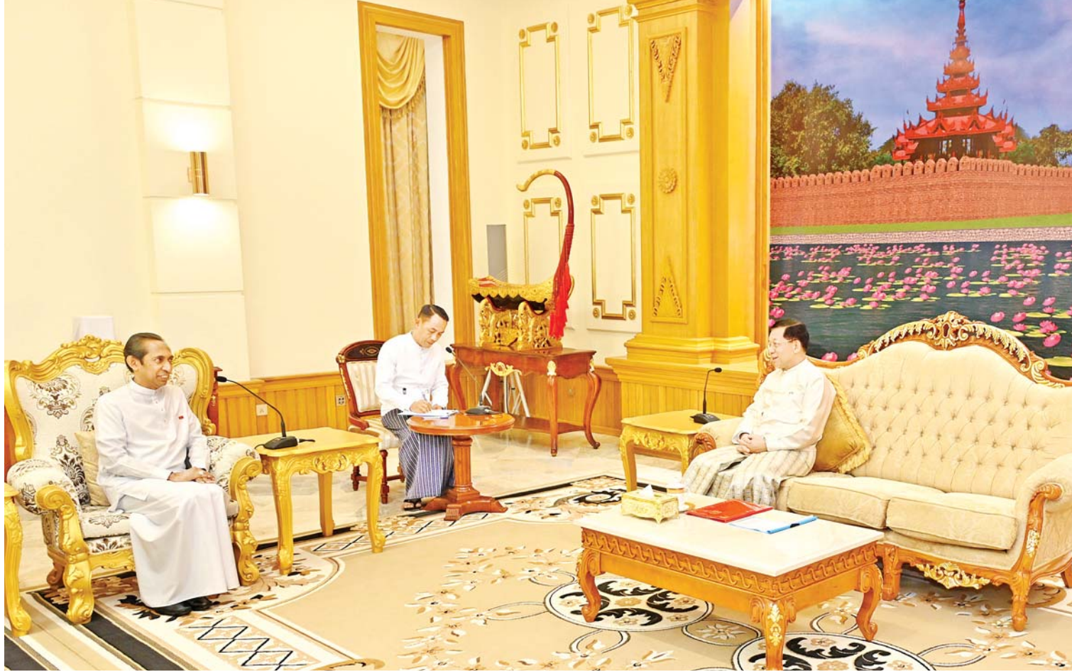
နိုင်ငံတော်စီမံအုပ်ချုပ်ရေးကောင်စီ ဥက္ကဋ္ဌ နိုင်ငံတော်ဝန်ကြီးချုပ် ဗိုလ်ချုပ်မှူးကြီး မင်းအောင်လှိုင် တာဝန်ပြီးဆုံး၍ ပြန်လည်ထွက်ခွာမည့် မြန်မာနိုင်ငံဆိုင်ရာ သီရိလင်္ကာနိုင်ငံသံအမတ်ကြီး H.E. Mr. J.M.J.P. Bandara အား လက်ခံတွေ့ဆုံစဉ်။

နေပြည်တော် မတ် ၅ နိုင်ငံတော်စီမံအုပ်ချုပ်ရေးကောင်စီ ဥက္ကဋ္ဌ နိုင်ငံတော်ဝန်ကြီးချုပ် ဗိုလ်ချုပ်မှူးကြီး မင်းအောင်လှိုင်သည် တာဝန်ပြီးဆုံး၍ ပြန်လည်ထွက်ခွာမည့် မြန်မာနိုင်ငံဆိုင်ရာ သီရိလင်္ကာနိုင်ငံ သံအမတ်ကြီး H.E. Mr. J.M.J.P. Bandara အား ယနေ့ နံနက်ပိုင်းတွင် နေပြည်တော်ရှိ နိုင်ငံတော်စီမံအုပ်ချုပ်ရေးကောင်စီ ဥက္ကဋ္ဌရုံး ဧည့်ခန်းမ၌ လက်ခံတွေ့ဆုံသည်။ အဆိုပါတွေ့ဆုံပွဲသို့ နိုင်ငံတော်စီမံအုပ်ချုပ်ရေးကောင်စီဥက္ကဋ္ဌ နိုင်ငံတော်ဝန်ကြီးချုပ်နှင့်အတူ ကောင်စီတွဲဖက်အတွင်းရေးမှူး ဒုတိယဗိုလ်ချုပ်ကြီး ရဲဝင်းဦး၊ ဒုတိယဝန်ကြီးချုပ်နှင့် နိုင်ငံခြားရေးဝန်ကြီးဌာန ပြည်ထောင်စုဝန်ကြီးဦးသန်းဆွေနှင့်တာဝန်ရှိသူတို့တက်ရောက်ကြသည်။ ထိုသို့တွေ့ဆုံရာတွင် နှစ်နိုင်ငံချစ်ကြည်ရင်းနှီးမှုနှင့် သံတမန်ဆက်ဆံရေးဆိုင်ရာ ကိစ္စရပ်များ၊ ဘာသာရေးဆိုင်ရာများတွင် အတူတကွအပြန်အလှန် ပူးပေါင်းဆောင်ရွက်လျက်ရှိသည့် အခြေအနေများ၊ မြန်မာနိုင်ငံမှ ရဟန်းသံဃာများနှင့် သာသနာ့ဥယျာဉ် သီလရှင်များ သီရိလင်္ကာနိုင်ငံတွင် ပညာသင်ကြားလျက်ရှိမှုနှင့် စာမျက်နှာ ၃ ကော်လံ ၁ သို့ *