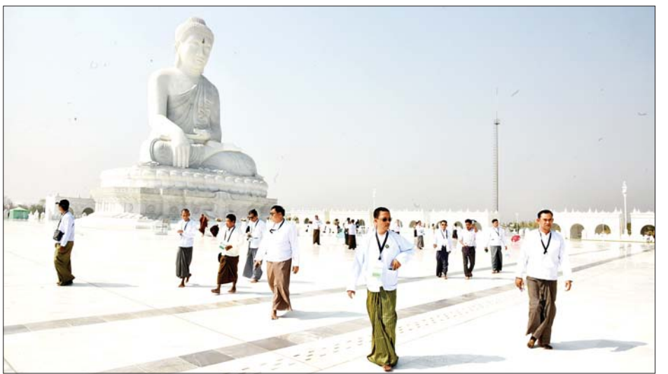
ထိုပြင် မာရဝိဇယဗုဒ္ဓရုပ်ပွားတော်မြတ်ကြီးအား များ လာရောက်ဖူးမြော်ကြည်ညိုလျက်ရှိကြောင်း အနယ်နယ်အရပ်ရပ်မှ ရဟန်းရှင်လူ ဘုရားဖူးပြည်သူ သိရသည်။ သတင်းစဉ်

အတွက် အလှူငွေများပေးအပ်လှူဒါန်းကြသည်။ ထို့နောက် ဗိသုကာလက်ရာများဖြင့် ခမ်းနားထည်ဝါစွာ တည်ထားပူဇော်ထားသည့် အဂ္ဂိမိပတိ သာသနာ့ဗိမာန်တော်ကြီး၊ ကျောက်စာရုံစေတီတော်များ၊ သုဓမ္မာဇရပ်များ၊ မုစလိန္နအိုင်နှင့် အခြားသာသနိကအဆောက်အအုံများကို ဆက်လက်ဖူးမြော်လေ့လာကြည့်ရှုခဲ့ကြသည်။ ထိုကဲ့သို့ တနင်္သာရီတိုင်းဒေသကြီးမှ လာရောက်ဖူးမြော်ကြည်ညိုကြသည့် ဂေါပကအဖွဲ့ဝင်များအား မာရဝိဇယဗုဒ္ဓရုပ်ပွားတော်မြတ်ကြီး ဂေါပကအဖွဲ့နှင့် ဗုဒ္ဓရုပ်ပွားတော်မြတ်ကြီး တည်ဆောက်ပူဇော်ခြင်းနှင့် ထိန်းသိမ်းခြင်းလုပ်ငန်းများတွင် ပါဝင်ဆောင်ရွက်ခဲ့ကြသည့် ကျွမ်းကျင်ပညာရှင်များက မာရဝိဇယဗုဒ္ဓရုပ်ပွားတော်မြတ်ကြီး အောင်မြင်စွာ တည်ထားပူဇော်နိုင်ရန် အဆင့်ဆင့်ဆောင်ရွက်ခဲ့ပုံများကို ဗီဒီယိုမှတ်တမ်းများဖြင့် ရှင်းလင်းပြောကြားခဲ့ကြသည်။