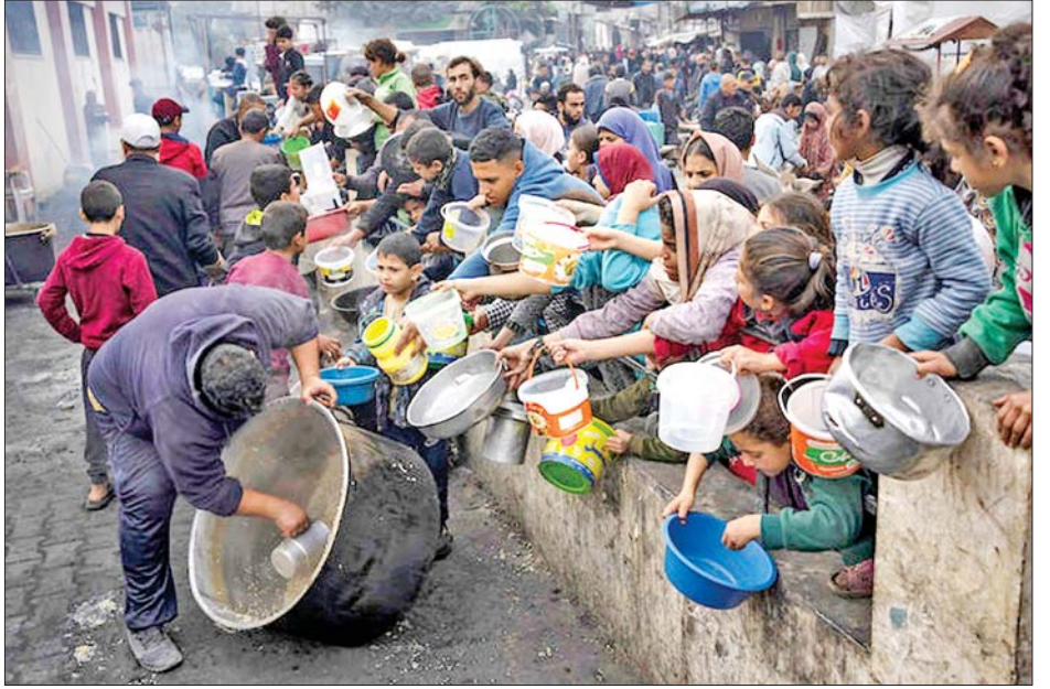
ရပ်စဲရေးအတွက် အရှိန်မြှင့်ဆောင်ရွက်လျက်ရှိကြောင်း သိရသည်။

လာမည့် သီတင်းပတ်ကုန်ခါနီးတွင် မွတ်စလင်ဘာသာဝင်များ၏ ဥပုသ်လရောက်ရှိမည်ဖြစ်သည့် အတွက် စေတနာ့ထောက်ပံ့ရေးအဖွဲ့များက အပစ်အခတ်