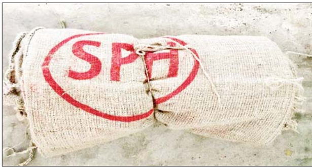
မွန်ပြည်နယ်၌ သိမ်းဆည်းရမိမှု။

တရားမဝင်ကုန်သွယ်မှုတိုက်ဖျက်ရေးဦးဆောင်ကော်မတီ၏ ကြီးကြပ်ကွပ်ကဲမှုဖြင့် တရားမဝင်ကုန်သွယ်မှုများကို ဥပဒေနှင့်အညီ ထိရောက်စွာ တားဆီးအရေးယူနိုင်ရေး ဆောင်ရွက်လျက်ရှိရာ ဖေဖော်ဝါရီ ၂၇ ရက်တွင် မကွေးတိုင်းဒေသကြီး တရားမဝင်ကုန်သွယ်မှုတိုက်ဖျက်ရေးအထူးအဖွဲ့၏ စီမံခန့်ခွဲမှုဖြင့် တာဝန်ကျပူးပေါင်းအဖွဲ့များက စစ်ဆေးမှုများဆောင်ရွက်ရာတွင် သရက်ခရိုင် ကံမမြို့နယ်နှင့် မင်းလှမြို့နယ်တို့၌ တရားမဝင် အခြားသစ် ၅ ဒသမ ၄၅ တန် (ခန့်မှန်းတန်ဖိုးငွေကျပ် ၁၅၂၄၆၂၆) ကို သစ်တောဥပဒေအရ လည်းကောင်း၊ မင်းလှမြို့ သင်ပုန်းပင်ကားလမ်းကွေ့အနီး၌ တရားမဝင် သယ်ဆောင်လာသည့် နွားထီး ၂၄ ကောင် (ခန့်မှန်းတန်ဖိုးငွေကျပ် ၂၄၀၀၀၀၀)ကို အရေးကြီးကုန်စည်နှင့်ဝန်ဆောင်မှုဥပဒေအရလည်းကောင်း (စုစုပေါင်း ခန့်မှန်းတန်ဖိုးငွေကျပ် ၂၅၅၂၄၆၂၆)ကို သိမ်းဆည်း အရေးယူဆောင်ရွက်လျက်ရှိသည်။