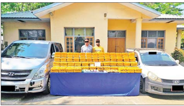
ပြစ်မှုကျူးလွန်သူများကို သိမ်းဆည်းရမိသည့် မူးယစ်ဆေးဝါးများနှင့်အတူ တွေ့ရစဉ်။

နောင်ချိုမြို့၌ ငွေကျပ်သိန်း ၇၆၀၀ ကျော်တန်ဖိုးရှိ စိတ်ကြွေးသွပ်ဆေးပြား ၁၂ ဒသမ ၉ သိန်းနှင့် စိတ်ပြောင်းဆေးဝါး Happy Water ၂ ဒသမ ၄၈ ကီလို သိမ်းဆည်းရမိခဲ့ကြောင်း မြန်မာနိုင်ငံ ရဲတပ်ဖွဲ့မှ သိရသည်။