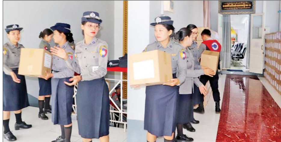
ပဲခူးတိုင်းဒေသကြီးအစိုးရအဖွဲ့နှင့် ပြည်ခရိုင်၊ နတ်တလင်းခရိုင်၊ သာယာဝတီခရိုင်အတွင်းရှိ ဈေးသူ ဈေးသားများက ဂုဏ်ပြုပေးအပ်သည့် စားသောက်ဖွယ်ရာများကို လုံခြုံရေးတပ်ဖွဲ့ဝင်များ၏ လက်ဝယ်အရောက် ဆက်လက်ပို့ဆောင်ရန် ဆောင်ရွက်နေစဉ်။

တက်ရောက် ထိုသို့ ပေးအပ်လျက်ရှိရာ ယနေ့တွင် အလုပ်သမားဝန်ကြီးဌာနမှ ဝန်ထမ်းမိသားစုများက စားသောက်ဖွယ်ရာများ ဂုဏ်ပြုပေးအပ်ခြင်းကို နေပြည်တော်တိုင်းစစ်ဌာနချုပ်ရှိ ပေါင်းလောင်းရိပ်သာ၌ ပြုလုပ်ရာ အလုပ်သမားဝန်ကြီးဌာန ပြည်ထောင်စုဝန်ကြီး ဦးမြင့်နောင်၊ တိုင်းမှူး ဗိုလ်ချုပ်စောသန်းလှိုင်၊ ဒုတိယဝန်ကြီးများနှင့် တိုင်းစစ်ဌာနချုပ်မှ တာဝန်ရှိသူများ တက်ရောက်ကြသည်။