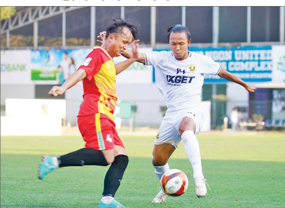
ရှမ်းယူနိုက်တက်အသင်းနှင့် Rainbow အသင်းတို့ ယှဉ်ပြိုင်ကစားကြစဉ်။