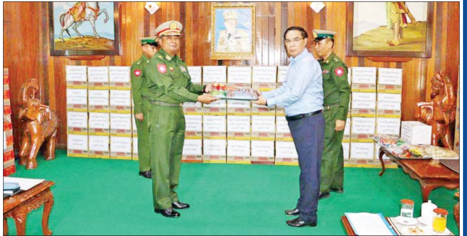
ပြည်ထောင်စုဝန်ကြီး ဦးမြင့်နောင် အလုပ်သမားဝန်ကြီးဌာနမှ ဝန်ထမ်းမိသားစုများက ငွေကျပ် ၁၂၇၃၅၀၀ တန်ဖိုးရှိ စားသောက်ဖွယ်ရာများအား နေပြည်တော် တိုင်းစစ်ဌာနချုပ် တိုင်းမှူး ဗိုလ်ချုပ် စောသန်းလှိုင်ထံ ဂုဏ်ပြုပေးအပ်စဉ်။