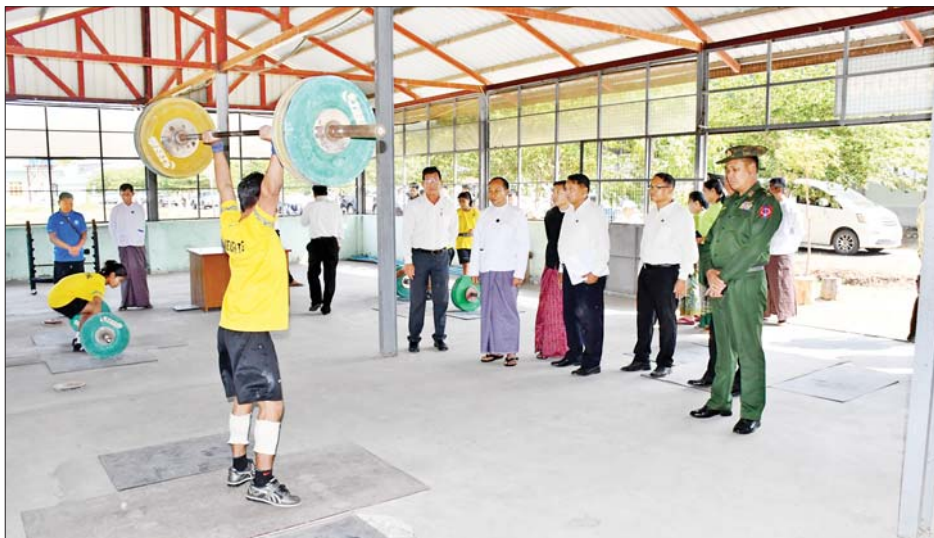
နိုင်ငံ့ဂုဏ်ဆောင် အားကစားသမားကောင်းများဖြစ် အောင် ကြိုးစားသင်ယူသွားကြရန် လိုအပ်ကြောင်း၊ မိမိတို့ တိုင်းဒေသကြီးအစိုးရအဖွဲ့အနေဖြင့်လည်း ကျောင်း၏လိုအပ်သည်များကို ပံ့ပိုးကူညီဆောင်ရွက်

စစ်ကိုင်းတိုင်းဒေသကြီး အားကစားနှင့်ကာယပညာသိပ္ပံ(မုံရွာ)ရှိ ကျောင်းသား ကျောင်းသူများ အတွက် ထောက်ပံ့ပေးအပ်ပွဲကို ယနေ့ နံနက်ပိုင်းတွင် အဆိုပါကျောင်းရှိ မိုးလုံလေလုံ အားကစားခန်းမ၌ ကျင်းပရာ တိုင်းဒေသကြီး ဝန်ကြီးချုပ် ဦးမြတ်ကျော်၊ တိုင်းဒေသကြီး/ခရိုင်/မြို့နယ် အဆင့်ဌာနဆိုင်ရာများ၊ ကျောင်းအုပ်ကြီးနှင့် နည်းပြများ၊ သင်တန်းသား သင်တန်းသူများ တက်ရောက်ကြသည်။