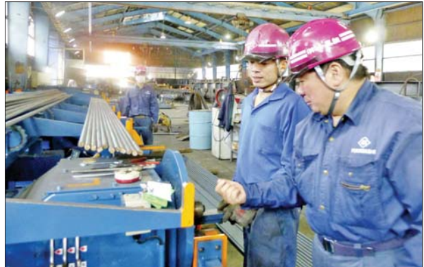
ဒီဇင်ဘာလကထက် သိသိသာသာ ကျဆင်းခဲ့ကြောင်း သိရသည်။ ယင်းသို့ အလုပ်လက်မဲ့နှုန်း

ဂျပန်နိုင်ငံ ပြည်တွင်းရေးရာနှင့် ဆက်သွယ်ရေး ဝန်ကြီးဌာန၏ အဆိုအရ ဇန်နဝါရီလ၏ အလုပ်လက်မဲ့နှုန်းသည် ၂၀၂၃ ခုနှစ်