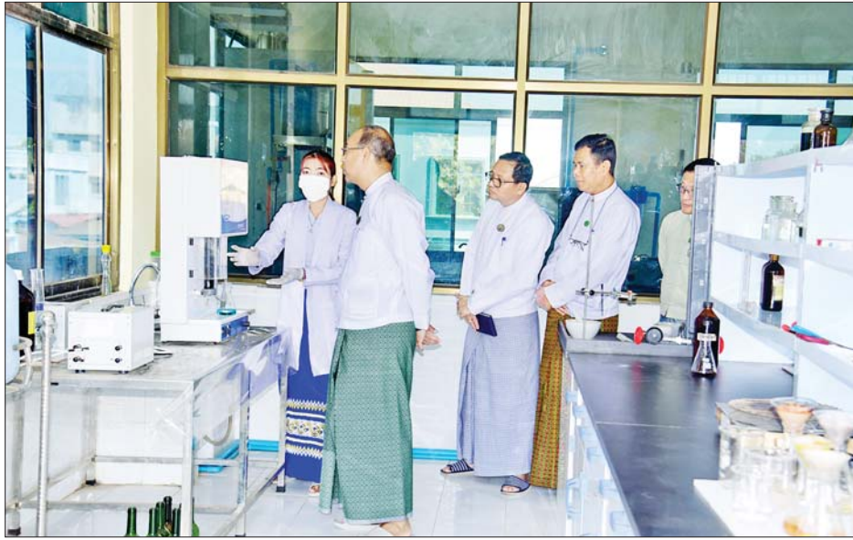
အသေးစားစက်မှုလုပ်ငန်းများ ပေါ်ထွန်းလာစေရေး အတွက် ရည်ရွယ်ဖွင့်လှစ်ခြင်းဖြစ်ကြောင်း ပြောကြား သည်။

လျှပ်စစ်သံဂဟေဆက် သင်တန်းဖွင့်ပွဲတွင် ရှမ်းပြည်နယ်ဝန်ကြီးချုပ် ဦးအောင်အောင်က ယခု အခြေခံလျှပ်စစ်သံဂဟေဆက်သင်တန်းကို လူငယ်၊ လူရွယ်များ အခြေခံလျှပ်စစ်သံဂဟေဆက်ပညာ တတ်မြောက်ပြီး ဝင်ငွေရရှိသောလုပ်ငန်း ထူထောင် လာနိုင်စေရန်၊ ဆောက်လုပ်ရေးလုပ်ငန်းများအတွက် ကျွမ်းကျင်လုပ်သားများ ပေါ်ထွက်လာစေရန်၊ လူ့စွမ်းအားအရင်းအမြစ်များ ပေါ်ထွက်လာစေရန်နှင့်