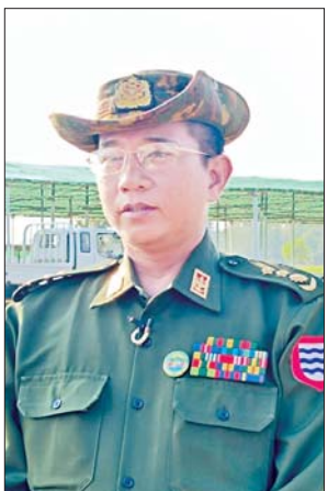
ဗိုလ်မှူးကြီးမိုးမင်းနိုင်

လက်ရှိအနေနဲ့ကတော့ တောင်သူလယ်သမားနေ့ကို ဒီနှစ်ရဲ့ ထူးခြားတဲ့ရာသီဥတု အယ်လ်နီညီဖြစ်တာရှိတယ်။ အယ်လ်နီညီဖြစ်တဲ့ အခါမှာ ရာသီဥတုကဆိုးရွားတဲ့အတွက်ကြောင့် သီးနှံတွေက ပျက်စီးဆုံးရှုံးနိုင်တဲ့အနေအထားတွေ ရှိနိုင်တယ်။ အဲဒီအတွက်ကြောင့် သီးနှံစိုက်ပျိုးတဲ့အခါမှာ ဟင်းသီးဟင်းရွက်စိုက်မယ်ဆိုရင် ဟင်းသီးဟင်းရွက်ကို တစ်မျိုးတည်းစိုက်တာမဟုတ်ဘဲနဲ့ အခုလက်ရှိအခင်းမှာ ရှိနေတဲ့ ဟာမျိုး ခရမ်းစိုက်မယ်၊ နေကြာစိုက်မယ်၊ ရုံးပတီစိုက်မယ် အစရှိတဲ့ ဒီလိုသီးနှံတွေကို ခွဲခွဲစိုက်မယ်ဆိုရင် သီးနှံတစ်မျိုးကရာသီဥတုကြောင့် ပျက်စီးဆုံးရှုံးရတဲ့အခါမှာ အခြားသောသီးနှံတွေကနေပြီးတော့ တောင်သူတွေအတွက် ဝင်ငွေတွေပြန်လည်ရရှိဖို့ဆိုပြီး ဖော်ထုတ်ထားတာရှိပါတယ်။ အလားတူပဲ ဒီဘက်မှာစိုက်ထားတဲ့ဟာဆိုရင် ပြောင်းရှိမယ်၊ နေကြာရှိမယ်၊ မြေထောက်ပဲရှိမယ်။ ဆီထွက်သီးနှံအနေနဲ့ဆိုရင် နေကြာရယ်၊ မြေပဲရယ်၊ နှမ်းရယ်ရှိမယ်။ အလားတူပဲ ပန်းတိုင်အထွက်နှုန်း ရရှိရေးအတွက်ဆိုပြီးတော့မှ ကျွန်တော်တို့ ဒီနှစ်တောင်သူလယ်သမားနေ့ပွဲမှာ တောင်သူတွေကို တိုက်ရိုက်ပြတဲ့အနေနဲ့ ကျွန်တော်တို့ တိုင်းဒေသကြီးအတွင်းမှာ အခုလက်ရှိ ပန်းတိုင်အထွက်နှုန်း ထွက်နေတဲ့ စပါး၊ ပြောင်း၊ မြေပဲ၊ နှမ်း၊ နေကြာ စတဲ့ဒီလိုနေရာလေးကနေပြီးတော့ ပန်းတိုင်အထွက်နှုန်း ရရှိတဲ့ဟာတွေကို တိုက်ရိုက်အနေနဲ့ပြသဖို့ ရည်ရွယ်ထားပါတယ်။ လက်ရှိအနေနဲ့ကတော့ ကျွန်တော်တို့ ဒီစိုက်ခင်းတော်တော်