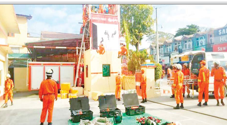
ပြည်မြို့နယ် မီးသတ်ဦးစီးမှူးရုံးတွင် တပ်စုအဆင့်လျှင်ဇာတ်တိုက်လေ့ကျင့်ခြင်းကို အရန်မီးသတ်တပ်ဖွဲ့ဝင်များ၊ ပရဟိတအသင်းများပူးပေါင်း၍ ဖေဖော်ဝါရီ ၂၉ ရက်က လေ့ကျင့်ဆောင်ရွက်စဉ်။ ခရိုင်(ပြန်/ဆက်)

နိုင်ငံတော်စီမံအုပ်ချုပ်ရေးကောင်စီသည် ယခင်ပြည်ထောင်စုအစိုးရအဖွဲ့ရုံးဝန်ကြီးဌာန၊ ဝန်ကြီးရုံး ညွှန်ကြားရေးမှူးချုပ်ဦးထက်အောင် ကို အားကစားနှင့်လူငယ်ရေးရာဝန်ကြီးဌာန၊ လူငယ်ရေးရာဦးစီးဌာန ညွှန်ကြားရေးမှူးချုပ်အဖြစ် တာဝန်ဝတ္တရားများကို စတင်ဆောင်ရွက်သည့် နေ့မှစ၍ ပြောင်းရွှေ့ခန့်ထားလိုက်သည်။