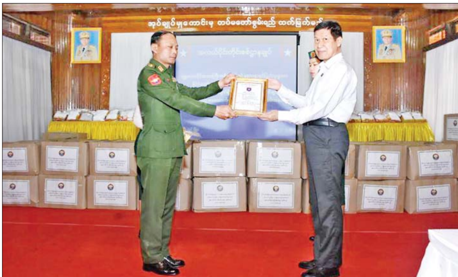
တိုင်းဒေသကြီးဝန်ကြီးချုပ် ဦးမျိုးအောင် တိုင်းဒေသကြီးအတွင်းရှိ စေတနာရှင်ပြည်သူများက ပေးအပ်လှူဒါန်းသည့် ငွေကျပ်သိန်း ၁၈၀ တန်ဖိုးရှိ စားသောက်ဖွယ်ရာများအား နယ်မြေခံတပ်နယ်မှ တာဝန်ရှိသူတစ်ဦးထံ ဂုဏ်ပြုပေးအပ်စဉ်။

အလားတူ မန္တလေးတိုင်းဒေသကြီးအတွင်းရှိ စေတနာရှင်ပြည်သူများက စားသောက်ဖွယ်ရာများ ပေးအပ်ခြင်းကို ပြင်ဦးလွင်မြို့ နယ်မြေခံသင်တန်း ကျောင်းရှိရန်ကြီးအောင်ခန်းမ၌ ပြုလုပ်ရာ တိုင်းဒေသကြီးဝန်ကြီးချုပ် ဦးမျိုးအောင်၊ အလယ်ပိုင်းတိုင်းစစ်ဌာနချုပ် တိုင်းမှူး ဗိုလ်ချုပ် ကြည်ခိုင်နှင့် တိုင်းဒေသကြီး ဝန်ကြီးများ၊ နယ်မြေခံတပ်နယ်မှ တာဝန်ရှိသူများ၊ ဖိတ်ကြားထားသူများ တက်ရောက်ကြသည်။ ထို့နောက် တိုင်းဒေသကြီးဝန်ကြီးချုပ်က တိုင်းဒေသကြီးအတွင်းရှိ စေတနာရှင်ပြည်သူများက ပေးအပ်လှူဒါန်းသည့် ငွေကျပ် သိန်း ၁၈၀ တန်ဖိုးရှိ စားသောက်ဖွယ်ရာများအား နယ်မြေခံတပ်နယ်မှ တာဝန်ရှိသူတစ်ဦးထံ ဂုဏ်ပြုပေးအပ်သည်။ ယင်းနောက် နယ်မြေခံတပ်နယ်မှ တာဝန်ရှိသူ တစ်ဦးက ဂုဏ်ပြုမှတ်တမ်းလွှာ ပြန်လည်ပေးအပ်ပြီး ကျေးဇူးတင်စကား ပြန်လည်ပြောကြားခဲ့သည်။ အဆိုပါ ဂုဏ်ပြုချီးမြှင့်ငွေနှင့် စားသောက်ဖွယ်ရာများအား လုံခြုံရေးတပ်ဖွဲ့ဝင်များ၏ လက်ဝယ် အရောက် ဆက်လက်ပို့ဆောင်ပေးသွားမည် ဖြစ်ကြောင်း သိရသည်။ သတင်းစဉ်