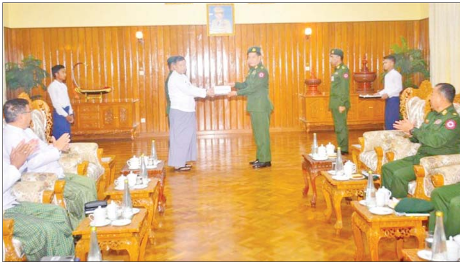
ပြည်ထောင်စုဝန်ကြီး ဦးတင်ဦးလွင် နေပြည်တော်တိုင်းစစ်ဌာနချုပ် တိုင်းမှူး ဗိုလ်ချုပ် စောသန်းလှိုင် ထံသို့ သာသနာရေးနှင့် ယဉ်ကျေးမှုဝန်ကြီးဌာနမှ ဝန်ထမ်းမိသားစုများက ပေးအပ်လှူဒါန်းသည့် ဂုဏ်ပြုချီးမြှင့်ငွေကျပ် သိန်း ၁၀၀ အား ပေးအပ်စဉ်။