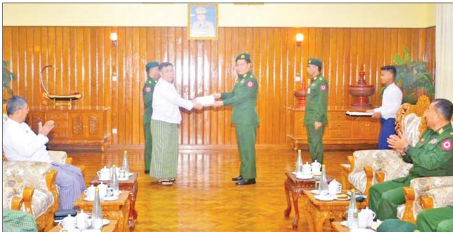
ပြည်ထောင်စုဝန်ကြီး ဒေါက်တာညွန့်ဖေ နေပြည်တော်တိုင်းစစ်ဌာနချုပ် တိုင်းမှူး ဗိုလ်ချုပ် စောသန်းလှိုင်ထံသို့ ပညာရေးဝန်ကြီးဌာနမှ ဝန်ထမ်းမိသားစုများက ပေးအပ်လှူဒါန်းသည့် ဂုဏ်ပြုချီးမြှင့်ငွေကျပ်သိန်း ၁၂၀ အား ပေးအပ်စဉ်။

ထိုသို့ ပေးအပ်လျက်ရှိရာ ယနေ့တွင် သာသနာရေးနှင့် ယဉ်ကျေးမှုဝန်ကြီးဌာနနှင့် ပညာရေးဝန်ကြီးဌာနတို့မှ ဝန်ထမ်းမိသားစုများက ဂုဏ်ပြုချီးမြှင့်ငွေနှင့် ယဉ်ကျေးမှုဝန်ကြီးဌာန ပြည်ထောင်စုဝန်ကြီး