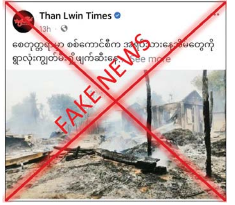
ဖက်အားပေးမီဒီယာများက ကောလာဟလသတင်းများဖြင့် သွေးထိုးလှုံ့ဆော်ပြီး နယ်မြေတည်ငြိမ်မှုပျက်ပြားစေရန်အတွက် လုပ်ကြံရေးသားနေခြင်းသာဖြစ်ကြောင်း သိရသည်။ သတင်းစဉ်

နေပြည်တော် ဖေဖော်ဝါရီ ၂၇ မကွေးတိုင်းဒေသကြီး စေတုတ္တရာမြို့နယ် လုံးကြီးကျေးရွာကို လုံခြုံရေးတပ်ဖွဲ့ဝင်များက ဖေဖော်ဝါရီ ၂၅ ရက်တွင် တိုက်ပွဲဖြစ်ပွားခြင်းမရှိဘဲ လက်နက်ကြီးများဖြင့် ပစ်ခတ်၍ နေအိမ်များကို မီးရှို့ဖျက်ဆီးခဲ့ကြောင်း သတင်းတု၊ သတင်းအမှားများကို တရားမဝင်ပြည်ပျက်မီဒီယာများက ပြည်သူများအထင်အမြင်လွှဲမှားစေရန် လုပ်ကြံရေးသားဖြန့်ဝေနေသည်ကို တွေ့ရှိရသည်။ အဆိုပါသတင်းနှင့်ပတ်သက်၍ သက်ဆိုင်ရာ လုံခြုံရေး တာဝန်ရှိသူတစ်ဦး၏ ပြောကြားချက်အရ