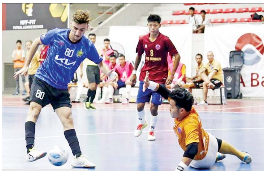
Generations FC အသင်းနှင့် ဖူဆယ်ချစ်သူအသင်းတို့ ယှဉ်ပြိုင်ကစားကြစဉ်။

ရန်ကုန် ဖေဖော်ဝါရီ ၂၇ MFF ဖူဆယ်လိဂ်-၁ ပြိုင်ပွဲ ပွဲစဉ်(၁၆)ကို ဖေဖော်ဝါရီ ၂၇ ရက် က ရန်ကုန်မြို့ သုဝဏ္ဏဘောလုံး ကွင်းရှိ MFF ဖူဆယ်အားကစားရုံ၌ ဆက်လက်ကျင်းပသည်။ ပွဲစဉ်(၁၆)တွင် လက်ရှိ ချန်ပီယံ VUC အသင်းက Winner Soccer အသင်းကို ငါးဂိုး-တစ်ဂိုး၊ ဖူဆယ်ချစ်သူအသင်းက Generations အသင်းကို သုံးဂိုး-နှစ်ဂိုး၊ Dream Team အသင်းက M2K အသင်းကို လေးဂိုး-နှစ်ဂိုး၊ MIU အသင်းက Futsal-19 အသင်းကို နှစ်ဂိုး-တစ်ဂိုး၊ လင်းလက် အသင်းက လက်ဝဲသုန္ဒရီအသင်းကို စာမျက်နှာ ၂၁ ကော်လံ ၅ သို့