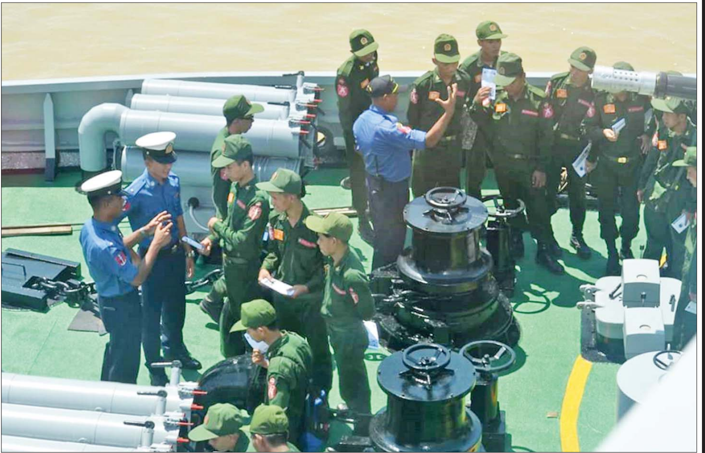
တက္ကသိုလ်လေ့ကျင့်ရေးတပ်(UTC) သင်တန်းသားများ စစ်မြေပြင် အင်ဂျင်နီယာဘာသာရပ်ကို လက်တွေ့သင်ကြားစဉ်။

ရန်ကုန်တက္ကသိုလ်ဖွင့်လှစ်ပြီးနောက် UTC သို့ တက်ရောက်ခဲ့ကြပြီး နိုင်ငံ့တာဝန်ကို ထမ်းဆောင်ခဲ့ ကြသည့် ပုဂ္ဂိုလ်များနည်းတူ ပြင်ပလောကတွင် နေထိုင်ခဲ့ကြသည့် UTC ကျောင်းသားဟောင်းများ လည်းရှိသည်။ အချို့မှာ သက်ရှိထင်ရှားမရှိတော့ပေ။ ၁၉၈၈ ခုနှစ် မတိုင်မီနှင့် ၁၉၈၈ ခုနှစ်နောက်ပိုင်းတွင် လည်း UTC သည် စစ်ပညာသင်ကြားလိုသည့် ကျန်းမာကြံ့ခိုင်သော ကျောင်းသား ကျောင်းသူများ ကို လေ့ကျင့်သင်ကြားပေးခဲ့သည်။ UTC သည် ကိုလိုနီခေတ်မှ ယနေ့တိုင် နိုင်ငံ့သားကောင်း များစွာကို လေ့ကျင့်မွေးထုတ်ပေးခဲ့ပြီး ရောင်စုံ ပန်းများ ဖူးပွင့်လျက်ရှိသည့် ပန်းဥယျာဉ်ကြီး တစ်ခုပမာ နိုင်ငံတော်တည်ဆောက်ရေးတွင်