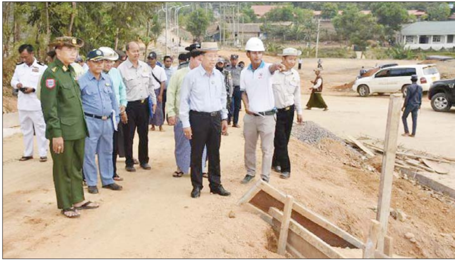
သည် ဟိုင်းကြီးကျွန်းမြို့ ဇီးချိုင်းကျေးရွာအုပ်စု တွင် ကျောင်းသား ကျောင်းသူများ အေးချမ်းစွာဖြေဆို အခြေခံပညာ အလယ်တန်းကျောင်း (မော်တင်) တွင် နေမှုကို သွားရောက်ကြည့်ရှုအားပေးသည်။ ၂၀၂၃-၂၀၂၄ ပညာသင်နှစ် Grade 5 နှစ်ဆုံးစာမေးပွဲ ထို့နောက် တိုင်းဒေသကြီးဝန်ကြီးချုပ်နှင့် အဖွဲ့