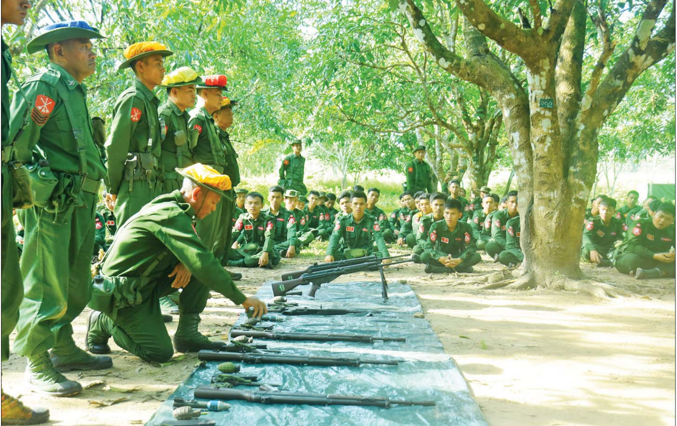
တက္ကသိုလ်လေ့ကျင့်ရေးတပ်(UTC) သင်တန်းသားများအား လက်နက်ငယ်ဘာသာရပ် သင်ကြားပေးစဉ်။