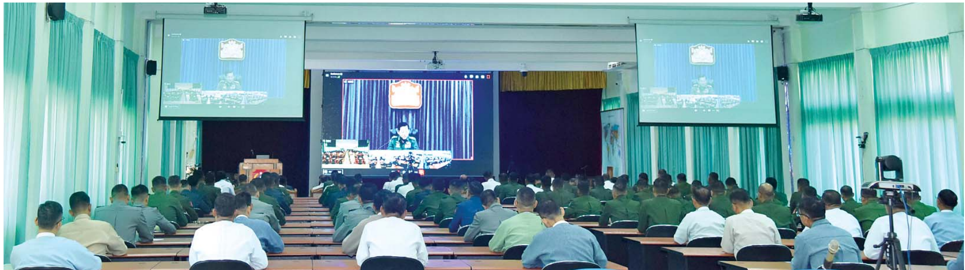
နိုင်ငံတော်စီမံအုပ်ချုပ်ရေးကောင်စီဥက္ကဋ္ဌ တပ်မတော်ကာကွယ်ရေးဦးစီးချုပ် ဗိုလ်ချုပ်မှူးကြီး မင်းအောင်လှိုင် နိုင်ငံတော်ကာကွယ်ရေးတက္ကသိုလ်မှ နည်းပြအရာရှိကြီးများနှင့် သင်တန်းသားအရာရှိကြီးများအား ဗီဒီယိုကွန်ဖရင့်ဖြင့် အမှာစကားပြောကြားစဉ်။

★ ရှေးဖုံးမှ ဦးစွာ နိုင်ငံတော်စီမံအုပ်ချုပ်ရေးကောင်စီဥက္ကဋ္ဌ တပ်မတော်ကာကွယ်ရေးဦးစီးချုပ်က နိုင်ငံတော်ကာကွယ်ရေးတက္ကသိုလ် တက်ရောက်ရန်အတွက် သင်တန်းသားများ ရွေးချယ်ရာတွင် ယခင်က တပ်မတော်အရာရှိကြီးများကိုသာ ရွေးချယ်ခဲ့သော်လည်း ယခုအချိန်တွင် အရပ်ဘက်နိုင်ငံ့ဝန်ထမ်း အရာရှိကြီးများကိုလည်း တက်ရောက်စေခဲ့ကြောင်း၊ လုပ်ငန်းများ ဆောင်ရွက်ရာတွင် နိုင်ငံရေး၊ စီးပွားရေး၊ အုပ်ချုပ်ရေးနှင့် ကာကွယ်ရေး စသည့် အမြင် လေးမြင်ဖြင့် ပြည့်စုံစွာ ထည့်သွင်းစဉ်းစား တွက်ချက်ဆောင်ရွက်နိုင်ခြင်းမရှိပါက နိုင်ငံတော်အတွက် လိုအပ်ချက်များ ဖြစ်ပေါ်လာနိုင်မည်ဖြစ်ကြောင်း၊ နိုင်ငံ့ဝန်ထမ်းအကြီးအကဲများသည် တာဝန်ထမ်းဆောင်ရာတွင် အထက်ပါ