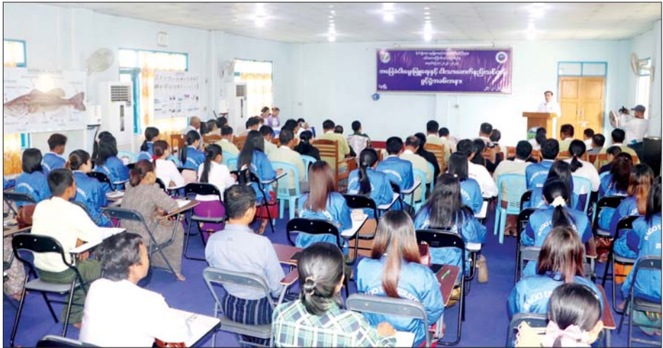
ငါးဖန်းမ စသည့် မျိုးပွားကန်များ ကို လှည့်လည်ကြည့်ရှုခဲ့သည်။ အဆိုပါ အခြေခံငါးမွေးမြူရေး နှင့် ငါးသားဖောက်နည်းသင်တန်း ကို ဖေဖော်ဝါရီ ၂၇ ရက်မှ ၂၈ ရက်အထိ ငါးလုပ်ငန်းရှင်များ၊ ပဲခူး တက္ကသိုလ် သတ္တဗေဒနောက်ဆုံး နှစ် ကျောင်းသား ကျောင်းသူများ၊ ဌာနတွင်းဝန်ထမ်းများ စုစုပေါင်း ၄၁ ဦး တက်ရောက်သင်ကြား မည်ဖြစ်ကြောင်း သိရသည်။ တိုင်းဒေသကြီး(ပြန်/ဆက်)

ရှေ့တိုက်ငါးဖမ်းဆီးမှုမရှိစေရေး ကြပ်မတ် ဆောင်ရွက်သွားရန် လိုအပ်ကြောင်း ပြောကြားခဲ့သည်။ ထို့နောက်သင်တန်းတက်ရောက် မည့် ငါးလုပ်ငန်းရှင်များ၊ ပဲခူး တက္ကသိုလ် သတ္တဗေဒနောက်ဆုံး နှစ် ကျောင်းသား ကျောင်းသူများ၊ ဌာနတွင်း ဝန်ထမ်းများအား ရင်းရင်းနှီးနှီး လိုက်လံနှုတ်ဆက် အားပေးခဲ့ပြီး သဘာဝငါးမျိုးများ ပြုန်းတီးမှုမရှိစေရေး မျိုးပွား ထုတ်လုပ်လျက်ရှိသည့် သဘာဝ ငါးရဲ့၊ ငါးခူး၊ ငါးကျည်း၊ ငါးပြေမ၊