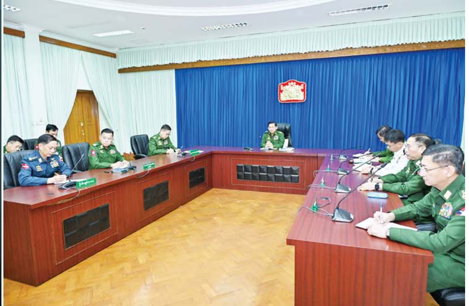
နိုင်ငံတော်စီမံအုပ်ချုပ်ရေးကောင်စီဥက္ကဋ္ဌ တပ်မတော်ကာကွယ်ရေးဦးစီးချုပ် ဗိုလ်ချုပ်မှူးကြီး မင်းအောင်လှိုင် နိုင်ငံတော်ကာကွယ်ရေးတက္ကသိုလ်မှ နည်းပြအရာရှိကြီးများနှင့် သင်တန်းသားအရာရှိကြီးများအား ဗီဒီယိုကွန်ဖရင့်ဖြင့် အမှာစကားပြောကြားစဉ်။