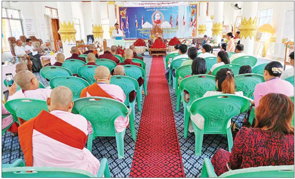
ထားတတ်စေရန် အမိအဖဆရာသမားတို့၏ သိရှိနားလည်အောင် ထပ်ဆင့်ရှင်းပြနိုင်စေရေး၊ ကျေးဇူးကို သိရှိနားလည်တုံ့ပြန်တတ်စေရန်အတွက် နိုင်ငံသားတိုင်း နိုင်ငံချစ်စိတ်ဖြင့်မားရေးတို့ကို လည်းကောင်း၊ ဦးအောင်ပြည့်စုံက နိုင်ငံတော် စစ်မှု နိုင်ငံတော် စစ်မှု လည်းကောင်း ဆွေးနွေးခဲ့ကြသည်။

မြို့ စာပေရေးရာများကို စိတ်ဝင်စားသည့် စာရေး ဆရာ၊ သတင်းမီဒီယာသမားများ၊ ရဟန်းသံဃာများ၊ သီလရှင်များ၊ မြို့ခံစာပေပညာရှင်များ တက်ရောက် ကြသည်။ ဟောပြောဆွေးနွေးပွဲတွင် ဥက္ကဋ္ဌ ဦးအုန်းမောင် (မြင်းမူမောင်နိုင်မိုး)က ယနေ့လူငယ်များ အတွေး အခေါ် သိမြင်မှန်ကန်စေမည့် စာကောင်းပေမန် များရေးသားနိုင်စေရေး၊ သတင်းတုသတင်းမှား များကို ပြည်သူများ ဆင်ခြင်သုံးသပ်နိုင်စေရေးနှင့် လတ်တလောပေါ်ပေါက်နေသော ကောလာဟလ သတင်းများကို မယုံကြည်ကြစေရေး၊ နိုင်ငံတော်မှ အတည်ပြုထုတ်ပြန်ထားသည့်ဥပဒေ၊ နည်းဥပဒေများ ကို လေးစားလိုက်နာကြစေရေးတို့ကို လည်းကောင်း၊ စာရေးဆရာ မောင်ငြိမ်းသူ(ကြို့ပင်ကောက်) က လူငယ်များအတွက် အရေးပါသည့်အချိန်ကို တန်ဖိုး