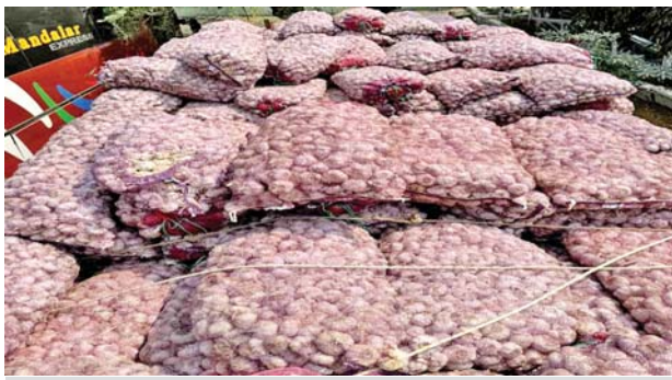
မန္တလေးတိုင်းဒေသကြီး၌ သိမ်းဆည်းရမိမှု။

နေပြည်တော် ဖေဖော်ဝါရီ ၂၅ တရားမဝင် ကုန်သွယ်မှု တိုက်ဖျက်ရေး ဦးဆောင်ကော်မတီ၏ ကြီးကြပ်ကွပ်ကဲမှုဖြင့် တရားမဝင် ကုန်သွယ်မှုများကို ဥပဒေနှင့်အညီ ထိရောက်စွာ တားဆီး အရေးယူနိုင်ရေး ဆောင်ရွက်လျက်ရှိရာ ဖေဖော်ဝါရီ ၂၂ ရက်တွင် အကောက်ခွန်ဦးစီးဌာန၏ စီမံခန့်ခွဲမှုဖြင့် တာဝန်ကျ ပူးပေါင်းအဖွဲ့များက စစ်ဆေးမှုများ ဆောင်ရွက်ရာတွင် မြန်မာ့စက်မှုဆိပ်ကမ်း၌ ကုန်သွယ်မှု သုံးလုံးအတွင်းမှ သွင်းကုန်ကြေညာလွှာတွင် ကြေညာထားသည့်နှင့် ကွဲလွဲစွာပါရှိလာသည့် RIALTO Porcelain Tile ၃၇၇၃ ဒသမ ၃၆ စတုရန်းမီတာ (ခန့်မှန်း တန်ဖိုးငွေကျပ် ၃၉၅၉၂၈၀) ကိုလည်းကောင်း၊ အေးရှားဝေါလ် ကုန်သွယ်မှု စစ်ဆေးရေးစခန်း၌ ကုန်သွယ်မှု တစ်လုံးအတွင်းမှ သွင်းကုန် ကြေညာလွှာတွင် ကြေညာထားသည်ထက် ပိုမိုပါရှိလာသည့် Plastic Packing Foil Printed For Soft Drink ကီလိုဂရမ် ၃၅၀၀ (ခန့်မှန်း တန်ဖိုးငွေကျပ် ၃၉၈၃၇၀၀) ကိုလည်းကောင်း စုစုပေါင်း ခန့်မှန်း တန်ဖိုးငွေကျပ် ၇၉၄၃၆၂၈၀ ကို သိမ်းဆည်းရမိခဲ့ပြီး အကောက်ခွန်လုပ်ထုံးလုပ်နည်းများနှင့်အညီ အရေးယူ ဆောင်ရွက်လျက်ရှိ သည်။ ထို့ပြင် ဖေဖော်ဝါရီ ၂၂ ရက်တွင်