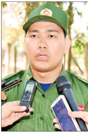
မောင်စွဲထက်အောင်