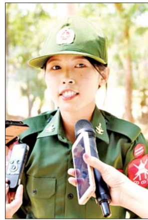
မအေးငြိမ်းသူ

ကျောင်းသူတိုင်း စစ်ပညာတတ်မြောက်မယ်၊ စိတ်ဓာတ်ပိုင်းဆိုင်ရာမှာ ခမ်းနားတဲ့စိတ်ဓာတ် ရှိနေမယ်ဆိုရင် ဘယ်နိုင်ငံကမှ စိုးမိုးစွက်ဖက်နိုင်မှာ မဟုတ်ပါဘူး။ အင်အားကောင်းတဲ့ နိုင်ငံတစ်နိုင်ငံအဖြစ် ရပ်တည်နေမှာပါ။ ပြည်သူတွေ ပူးပေါင်းပါဝင်ထောက်ပံ့ပေးမှသာ အင်အားကောင်းတဲ့ နိုင်ငံတစ်နိုင်ငံဖြစ်ပေါ်လာမှာပါ။ ကိုယ်ကိုယ်တိုင်လည်း ဝင်ရောက် တာဝန်ထမ်းဆောင်မှသာ စာနာနားလည်နိုင်မှာဖြစ်တာကြောင့် စိတ်ခွန်အားတွေနဲ့ ကြားပြီး တိုင်းပြည်ကာကွယ်ရေးမှာ များစွာ အထောက်အကူပြုနိုင်ပါစေလို့ တိုက်တွန်းလိုပါတယ်။