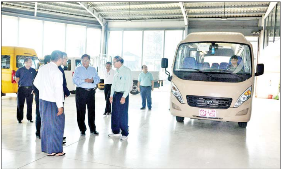
ပြည်ထောင်စုဝန်ကြီး ဒေါက်တာချာလီသန်း Daewoo Bus များအား လှည့်လည်ကြည့်ရှုစစ်ဆေးစဉ်။

နိုင်ရေးအတွက် အဖွဲ့များဖွဲ့စည်း၍ စနစ်တကျ ဆောင်ရွက်ရန်နှင့် တစ်ရက်လျှင် ၁၀ တန်အထိ ထုတ်လုပ်နိုင်သည့် စက်များ ထုတ်လုပ်နိုင်ရေးကြိုးပမ်းဆောင် ရွက်သွားရန်၊ ထုတ်လုပ်မည့် အသေးစား ပျော့ဖတ်ထုတ်စက် ၏ ဒီဇိုင်းရေးဆွဲနိုင်ရေးအတွက် ကြိုတင်စီမံဆောင်ရွက်ထားရန်၊ ဓာတ်ခွဲခန်းသုံး စက်ပစ္စည်း ကိရိယာများကိုလည်း ပြန်လည် စစ်ဆေး၍ ကောင်းမွန်အောင် ပြုပြင်ရန်၊ တစ်ရက်လျှင်တန် ၂၀ ထုတ်လုပ်နိုင်သည့် ကတ်ထူစက္ကူ စက်ရုံကို ပြန်လည်လည်ပတ်နိုင် ရေး ဆောင်ရွက်လျက်ရှိသဖြင့် စက်အရန်ပစ္စည်းများ ထုတ်လုပ် ပေးသည့် စက်ပစ္စည်းများ ပြုပြင် မွမ်းမံပေးရသည့် စက်ပစ္စည်းများ ကို ကောင်းမွန်အောင် ပြုပြင်ထား