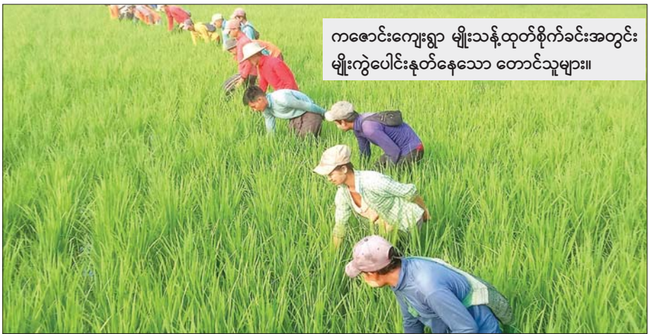
ကစောင်းကျေးရွာ မျိုးသန့်ထုတ်စိုက်ခင်းအတွင်း မျိုးကွဲပေါင်းနုတ်နေသော တောင်သူများ။

အထူးပြုတင်ပြရလျှင် ဖျာပုံ၊ ကျိုက်လတ်နှင့် ဘိုကလေးမြို့နယ်တို့သို့ နှစ်စပါးစိုက်ပျိုးမှု အကြောင်း ကွင်းဆင်းသွားရောက် သတင်းစကား ရယူခဲ့သော ခရီးစဉ်များသည်ကား အောင်မြင်စုံပြည် သောခရီး၊ မင်္ဂလာရှိသော ခရီးစဉ်များပင် ဖြစ်ပေ သည်။ ဤသို့အောင်မြင်ရှင်သန်စိုက်ပျိုးပြီးစီးခဲ့သော ရလဒ်ကောင်းများသည်ကား ဖျာပုံ၊ ကျိုက်လတ်နှင့် ဘိုကလေးမြို့နယ်တို့မှ နှစ်စပါးစိုက်ပျိုးရေးအား အားမာန်အပြည့်ဖြင့် ကြီးပမ်းစိုက်ပျိုးရေးအထုတ်မှု၏ အောင်ပွဲများသာဖြစ်ပါကြောင်း ရေးသားတင်ပြ လိုက်ရပါသည်။ ။