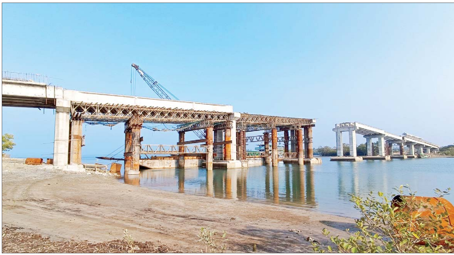
ချောင်းဝတံတားတည်ဆောက်ပြီးစီးမှုအခြေအနေကို တွေ့ရစဉ်။

ငပုတော ဖေဖော်ဝါရီ ၂၅ ဧရာဝတီတိုင်းဒေသကြီး အတွင်းရှိ ဒေသခံပြည်သူများ သွားလာရေး အဆင်ပြေလွယ်ကူစေရန်နှင့် ကုန်စည်စီးဆင်းမှုများ ဖွံ့ဖြိုးတိုးတက်လာစေရန်အတွက် ဧရာဝတီတိုင်းဒေသကြီးနှင့် ရခိုင်ပြည်နယ်ကို ဆက်သွယ်ပေးမည့် ချောင်းဝတံတားကို ဆောက်လုပ်ရေး ဝန်ကြီးဌာန တံတားဦးစီးဌာနက ဆောင်ရွက်လျက်ရှိရာ ယခုအခါ ရေ ရာခိုင်နှုန်း ဆောင်ရွက်ပြီးစီးနေပြီဖြစ်ကြောင်း ချောင်းဝတံတား တည်ဆောက်ရေး စီမံကိန်းလုပ်ငန်းခွင်မှ သိရသည်။ တစ်ဆက်တစ်စပ်တည်းဖြစ်သွားမည့် ဧရာဝတီတိုင်းဒေသကြီး ပုသိမ်ခရိုင် ငပုတောမြို့နယ် ငရုတ်ကောင်း-ဂေါ်ရန်ဂျီကျွန်းလမ်းပေါ်၌ တည်ဆောက်နေသော ချောင်းဝတံတား အား တံတားအထူးအဖွဲ့(၁၆)မှ ကျွမ်းကျင်အင်ဂျင်နီယာများနှင့် ကာယ၊ ဉာဏလုပ်သားများက တည်ဆောက်ရေးလုပ်ငန်းများ ဆောင်ရွက်လျက်ရှိသည်။ စာမျက်နှာ ၄ ကော်လံ ၁ သို့ ၀