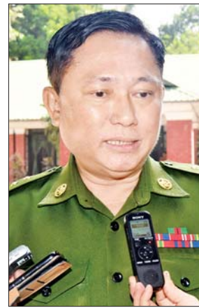
ဗိုလ်ကြီးမင်းဝင်းမွန်