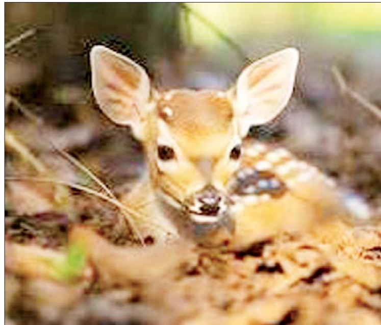
ကမ္ဘာတွင် မြန်မာတစ်နိုင်ငံတည်း၌ ကျက်စားနေထိုင်လျက်ရှိသည့် ဖက်ချေ နို့တိုက်သတ္တဝါကို တွေ့ရစဉ်။

မြန်မာနိုင်ငံမြောက်ပိုင်း ကချင်ပြည်နယ် ပူတာအိုခရိုင်တွင် ပင်လယ်ရေမျက်နှာပြင်အထက် ပေ ၁၈၀၀ အမြင့်တွင်တည်ရှိသည့် ရေခဲတောင်ဒေသ နောင်မွန်မြို့နယ်ရေယာဉ် ကမ္ဘာတွင် မြန်မာတစ်နိုင်ငံတည်း၌သာ ကျက်စားလျက်ရှိသည့် ဖက်ချေ(Leaf Deer or Leaf Muntjac)နို့တိုက်သတ္တဝါ ရှင်သန်လျက်ရှိကြောင်း ခါကာဘိုရာဇီတောရိုင်းတိရစ္ဆာန် ဘေးမဲ့တောအုပ်ချုပ်ရေးမှူးရုံးမှ သိရသည်။