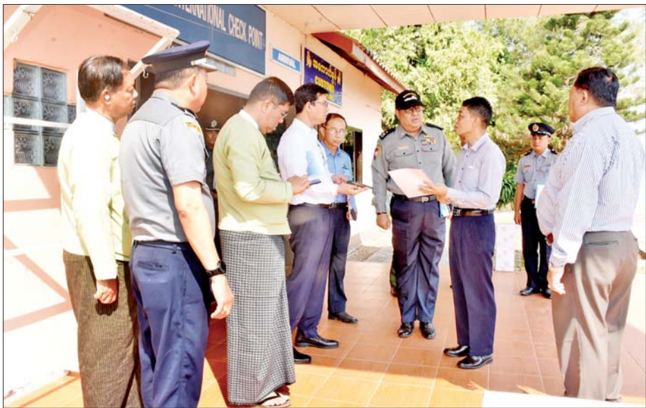
ကျိုင်းလပ်(မြန်မာ)-ကျိုင်းခတ်(လာအို) ချစ်ကြည်ရေးတံတားကို အသုံးပြု၍ မြန်မာ-လာအိုနှစ်နိုင်ငံ နယ်စပ်ကုန်သွယ်မှု ဖွံ့ဖြိုးတိုးတက်ရေးနှင့် တစ်ဆင့်ခံ ဖြတ်သန်းကုန်သွယ်မှု (Transit Trade) တိုးတက် ဖြစ်ထွန်းရေးတို့အတွက် ဌာနဆိုင်ရာဝန်ထမ်းများ အနေဖြင့် ဒေသရှိတိုင်းရင်းသား ပို့ကုန်သွင်းကုန် လုပ်ငန်းရှင်များနှင့် ပေါင်းစပ်ညှိနှိုင်းဆောင်ရွက်ကြ ရန် မှာကြားခဲ့ကြောင်း သိရသည်။ သတင်းစဉ်

ခြင်းများမရှိစေရေး အလေးထားဆောင်ရွက်ရန်တို့ကို မှာကြားသည်။ မွန်းလွဲပိုင်းတွင် ပြည်ထောင်စုဝန်ကြီးသည် မဲခေါင်အပြည်ပြည်ဆိုင်ရာ မြစ်တွင်းဆိပ်ကမ်း(ဝမ်ပုံ) ၌ တာဝန်ရှိသူများနှင့်တွေ့ဆုံပြီး မဲခေါင်မြစ်မှ သယ်ဆောင်လာသည့် ကုန်ပစ္စည်းကို စစ်ဆေးရာ၌ ကြန့်ကြာမှုမရှိစေရေးနှင့် မှန်ကန်သည့်ကုန်သွယ်မှု ဖြစ်စေရေး အလေးထားဆောင်ရွက်ရန်၊ ရေရှည် ဖွံ့ဖြိုးတိုးတက်အောင် ဆောင်ရွက်ရန်တို့ကိုမှာကြားကာ ကုန်သွယ်မှုလုပ်ငန်းများ ဆောင်ရွက်နေမှုကို ကြည့်ရှုစစ်ဆေးသည်။ ညနေပိုင်းတွင် ပြည်ထောင်စုဝန်ကြီးသည် အဖွဲ့ဝင်များနှင့်အတူ ကျိုင်းလပ်ကုန်သွယ်ရေးစခန်းနှင့် မြန်မာ-လာအို ချစ်ကြည်ရေးတံတားရှိ Border Control Facility (BCF) ဂိတ်၌ ကုန်သွယ်မှုလုပ်ငန်းများ ဆောင်ရွက်နေမှုကို ကြည့်ရှုစစ်ဆေးပြီး