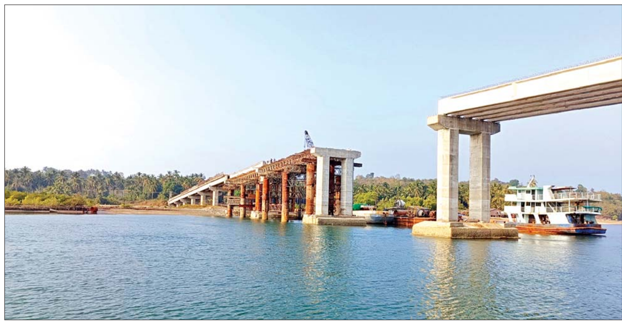
ချောင်းဝတံတား တည်ဆောက်ပြီးစီးမှုအခြေအနေကို တွေ့ရစဉ်။

○ ရှေ့ဖုံးမှ လက်ရှိ ငရုတ်ကောင်းမြို့မှ မြောက်ဘက်ပိုင်း ၄ မြို့နယ်အထိ ငရုတ်ကောင်း-ဆင်မ-ငွေဆောင်-ချောင်းသာ-ရွှေသောင်ယံ-မကျီးဇင်-ကျောက်ချွန်-၄ ကမ်းခြေပတ်လမ်းစီမံကိန်းကို လမ်းဦးစီးဌာနက ဆောင်ရွက်လျက်ရှိသောကြောင့် ချောင်းဝ တံတားသည်လည်း ကမ်းခြေပတ်လမ်း၏ တစ်စိတ်တစ်ပိုင်း ဖြစ်လာမည်ဖြစ်သည်။ အဆိုပါ ကမ်းခြေပတ်လမ်းနှင့် ချောင်းဝတံတား တည်ဆောက်ရေးစီမံကိန်း ဆောင်ရွက်ပြီးစီး ပြီးဆိုပါက ငရုတ်ကောင်း-တောင်ဘက်ပိုင်းရှိ ဂေါ်ရန်ကျိကျွန်းအထိ လမ်းများ တစ်ဆက်တစ်စပ်တည်း ဖြစ်သွားမည်ဖြစ်ကြောင်း တံတား တည်ဆောက်ရေး စီမံကိန်းကို တာဝန်ယူဆောင်ရွက်နေသည့် တံတားအထူးအဖွဲ့(၁၆)မှ သိရသည်။ လက်ရှိတည်ဆောက်နေသည့် ချောင်းဝတံတားအရှည်မှာ ပေ ၁၂၈၀ ရှိမည်ဖြစ်ပြီး တံတား၏ အပေါ်ထည် အမျိုးအစားမှာ PC