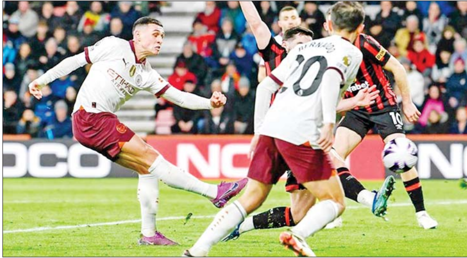
မှတ်တမ်းကောင်းတစ်ရပ်ကို ပိုင်ဆိုင်ခဲ့တာဖြစ်ပါတယ်။

လက်ရှိပရီမီယာလိဂ် ပွဲစဉ်(၂၆)အပြီးမှာ လီဗာပူးအသင်းက ရမှတ် ၆၀ ရရှိထားပြီး မန်စီးတီးအသင်းက ရမှတ် ၅၉ မှတ်ရရှိထားတာလည်း ဖြစ်ပါတယ်။ မန်စီးတီးအသင်းဟာ ဘုန်းမောက်အသင်းကို အနိုင်ရရှိခဲ့လို့ ဘုန်းမောက်အသင်းနဲ့ ယှဉ်ပြိုင်ကစားခဲ့တဲ့ ပရီမီယာလိဂ်ပွဲစဉ် ၁၄ ပွဲစလုံး အနိုင်ရရှိခဲ့တဲ့