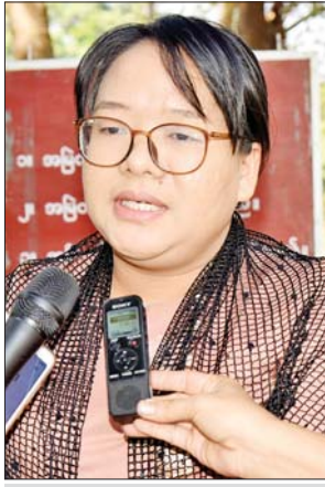
ဒေါ်မေသူငြိမ်း

UTC သင်တန်းဟာ အဓိကအနေနဲ့ ရုပ်ပိုင်းဆိုင်ရာနဲ့ စိတ်ဓာတ်