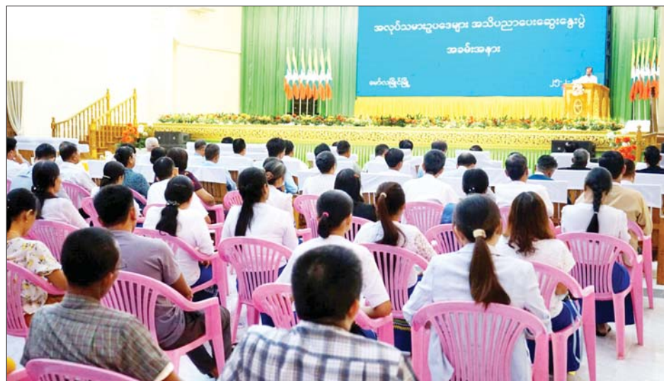
အလုပ်သမားဥပဒေများ အသိပညာပေးဆွေးနွေးပွဲ အခမ်းအနား

နေပြည်တော် ဖေဖော်ဝါရီ ၂၅ မြန်မာလုပ်သားထု ကျွမ်းကျင်မှုဖွံ့ဖြိုးတိုးတက် ရေးနှင့် အလုပ်သမားဥပဒေများ အသိပညာပေး ဆွေးနွေးပွဲအခမ်းအနားကို ယနေ့နံနက်ပိုင်းတွင် မွန်ပြည်နယ် မော်လမြိုင်မြို့ ပြည်နယ်အစည်းအဝေး ခန်းမ၌ကျင်းပရာ မွန်ပြည်နယ် ဝန်ကြီးချုပ် ဦးအောင်ကြည်သိန်း၊ အလုပ်သမားဝန်ကြီးဌာန ဒုတိယဝန်ကြီး ဦးဝင်းရှိန်၊ မွန်ပြည်နယ်လူမှုရေး ဝန်ကြီး ဦးစောကြည်နိုင်နှင့် အလုပ်သမားရေးရာ ဆိုင်ရာတာဝန်ရှိသူများ၊ ဌာနဆိုင်ရာများ တက်ရောက် ကြသည်။ အခမ်းအနားတွင် မွန်ပြည်နယ်ဝန်ကြီးချုပ်က အမှာစကားပြောကြားပြီး ဒုတိယဝန်ကြီးက မြန်မာ လုပ်သားထုကျွမ်းကျင်မှု ဖွံ့ဖြိုးတိုးတက်ရေးနှင့် အလုပ်သမားဥပဒေများနှင့်စပ်လျဉ်း၍ ရှင်းလင်း ပြောကြားရာ မြန်မာနိုင်ငံတွင် အရည်အချင်း ပြည့်ဝ သည့် လုပ်သားအင်အားထူဖွံ့ဖြိုး တိုးတက်စေရန်နှင့် အလုပ်အကိုင်အခွင့်အလမ်းများ ပိုမိုဖန်တီးပေးနိုင် ရေး ဆောင်ရွက်ပေးလျက်ရှိကြောင်း၊ မွန်ပြည်နယ် အတွင်း လျှပ်စစ်တပ်ဆင်မှုကျွမ်းကျင်၊ အဆောက်