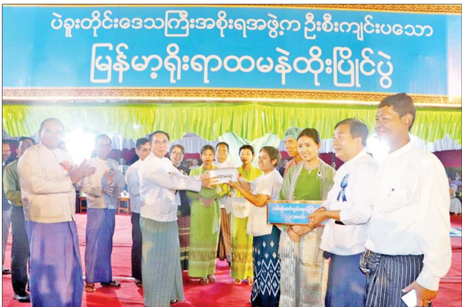
ရရှိသည့် တိုင်းဒေသကြီး လမ်းပန်းဆက်သွယ် ချီးမြှင့်ခဲ့ကြသည်။ ရေးရာဝန်ကြီးဌာန(ခ)အသင်းအတွက် ဂုဏ်ပြုဆု အဆိုပါ မြန်မာ့ရိုးရာထမနဲထိုးပြိုင်ပွဲတွင် ငွေကျပ် ၁၀ သိန်းနှင့် ဒိုင်အဖွဲ့များအတွက် စုစုပေါင်းပြိုင်ပွဲဝင်အသင်း ၄၆ သင်း ပါဝင်ယှဉ်ပြိုင် ဂုဏ်ပြုငွေကျပ် သုံးသိန်းတို့ကို တိုင်းဒေသကြီး ခွဲကြောင်း သိရသည်။ ဝန်ကြီးချုပ်ကလည်းကောင်း ဆုများ ပေးအပ် တိုင်းဒေသကြီး(ပြန်/ဆက်)

ယင်းနောက် ဂုဏ်ပြုအထူးဆုရရှိသော ပြိုင်ပွဲ ဝင် ခုနစ်သင်းအား ဆုငွေကျပ်နှစ်သိန်းစီနှင့် နှစ်သိမ့် ဆုရရှိသည့် ပြိုင်ပွဲဝင်အသင်း ၃၆ သင်းအား ဆုငွေ ကျပ်တစ်သိန်းစီတို့ကို တိုင်းဒေသကြီးဝန်ကြီးများနှင့် ပဲခူးတက္ကသိုလ် ပါမောက္ခချုပ်နှင့် တိုင်းဒေသကြီး အဆင့် ဌာနဆိုင်ရာများကလည်းကောင်း၊ တတိယ ဆုရရှိသည့် တိုင်းဒေသကြီး လူမှုရေးရာဝန်ကြီးဌာန (ခ)အသင်းအတွက် ဂုဏ်ပြုဆုငွေကျပ် ငါးသိန်းကို တိုင်းဒေသကြီး တရားလွှတ်တော်တရားသူကြီးချုပ် က လည်းကောင်း၊ ဒုတိယဆုရရှိသည့် တိုင်းဒေသ ကြီး သယံဇာတရေးရာဝန်ကြီးဌာန(ဃ) အသင်း အတွက် ဂုဏ်ပြုဆုငွေကျပ် ခုနစ်သိန်းကို တိုင်းဒေသ ကြီး ဝန်ကြီးချုပ်၏ဇနီးက လည်းကောင်း၊ ပထမဆု