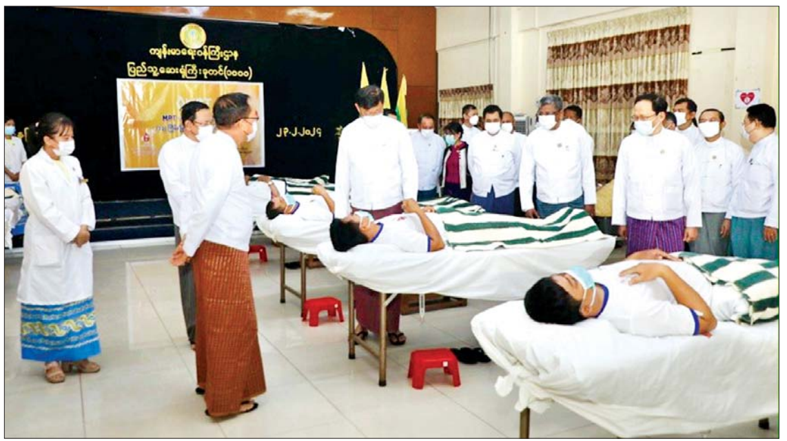
ကျင်းပပြုလုပ်ခဲ့ပြီး စုပေါင်းသွေးလှူဒါန်း သွေးလှူဒါန်းမှုများကို ၂၀၁၆ ခုနှစ်မှ (၁၃) ကြိမ်မြောက်ပြုဖြစ်ကြောင်း သိရ ၄၀၆ ဦး ပါဝင်သွေးလှူဒါန်းခဲ့ကာ စုပေါင်း စတင်စီစဉ်ဆောင်ရွက်ခဲ့ရာ ယခုအခါ သတင်းစဉ်

သက်ဆိုင်ပေးသည်။ ဒုတိယဝန်ကြီးများ၊ ဌာနကြီးမှူးများ၊ ဆေးရုံအုပ်ကြီးနှင့် တာဝန်ရှိသူများက လိုက်လံကြည့်ရှု အားပေးကြပြီး အားဖြည့်စားသောက် ဖွယ်ရာများနှင့် ဆေးဝါးများကို ပေးအပ် ကြသည်။ ထို့နောက် ပြည်ထောင်စုဝန်ကြီး ဒေါက်တာသက်ခိုင်ဝင်းက သွေးလှူဒါန်းမှု အတွက် ဂုဏ်ပြုမှတ်တမ်းလွှာကို ပေးအပ်ရာ ဒုတိယဝန်ကြီးချုပ်နှင့် ပြည်ထောင်စုဝန်ကြီး ဗိုလ်ချုပ်ကြီး မြထွန်းဦးက လက်ခံရယူပြီး အမှတ်တရ လက်ဆောင်များ ပြန်လည်ပေးအပ်သည်။ မြန်မာ့ဆက်သွယ်ရေးလုပ်ငန်း၏ (၁၃)ကြိမ်မြောက် စုပေါင်းသွေးလှူဒါန်း ပွဲကို နေပြည်တော်၊ ရန်ကုန်၊ မန္တလေး၊ တနင်္သာရီ၊ ရှမ်းပြည်နယ်(အရှေ့ပိုင်း)နှင့် ရှမ်းပြည်နယ် (မြောက်ပိုင်း)ရှိသက်ဆိုင်ရာ ဆေးရုံများနှင့် သွေးဌာနများတွင်