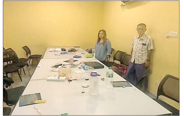
ကမာရွတ်မြို့နယ် (၈)ရပ်ကွက် ပြည်လမ်း လှည်းတန်းစင်တာ (၄)လွှာ အခန်း(၄၀၂)ရှိ ရုံးခန်းအား ဝင်ရောက်ရှာဖွေစဉ် တွေ့မြင်ရပုံ။