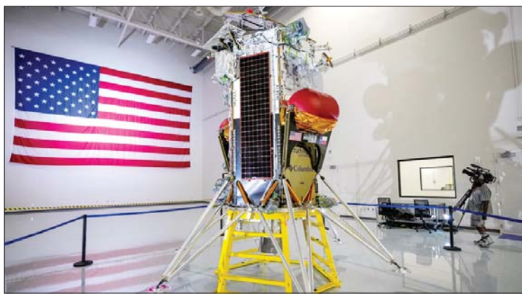
ပေါ်သို့ ဆင်းသက်ခဲ့ခြင်းဖြစ်ကြောင်း Intuitive Machines အာကာသစူးစမ်းလေ့လာရေးကုမ္ပဏီက ကြေညာခဲ့သည်။ Intuitive Machines အာကာသ စူးစမ်းလေ့လာရေးကုမ္ပဏီသည် လဆင်းယာဉ်ကို ဖေဖော်ဝါရီ ၁၅ ရက်တွင် အာကာသ

ဝါရှင်တန် ဖေဖော်ဝါရီ ၂၃ အမေရိကန်အာကာသစူးစမ်းလေ့လာရေးကုမ္ပဏီတစ်ခုက ၎င်း၏လဆင်းယာဉ်တစ်စင်းကို လမျက်နှာပြင်ပေါ်သို့ အောင်မြင်စွာ ဆင်းသက်နိုင်ခဲ့ကြောင်း ယမန်နေ့တွင် အတည်ပြုပြောကြားသည်။ ပထမဆုံး အောင်မြင်မှု အမေရိကန် ပုဂ္ဂလိကကုမ္ပဏီတစ်ခုက တီထွင်ဖန်တီးထားသည့် လဆင်းယာဉ်ကို လကမ္ဘာပေါ် ဆင်းသက်ရာတွင် ပထမဆုံး အောင်မြင်မှုလည်းဖြစ်ကြောင်း သိရသည်။ ဖေဖော်ဝါရီ ၂၂ ရက်တွင် ၎င်း၏ လဆင်းယာဉ် Odysseus သည် လကမ္ဘာ