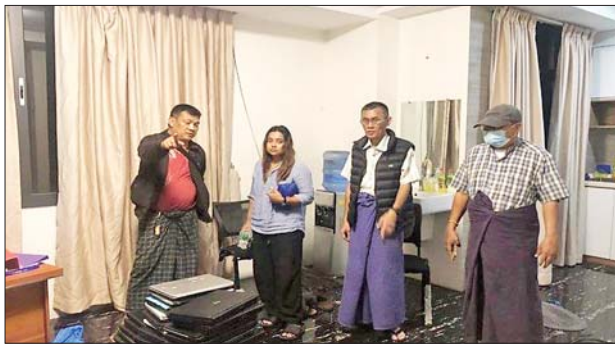
ဗဟန်းမြို့နယ် အနောက်ရွှေဂုံတိုင်လမ်း အမှတ်(၈၉/ဘီ) (၂)လွှာရှိ ရုံးခန်းအား ဝင်ရောက်ရှာဖွေစဉ် တွေ့မြင်ရပုံ။