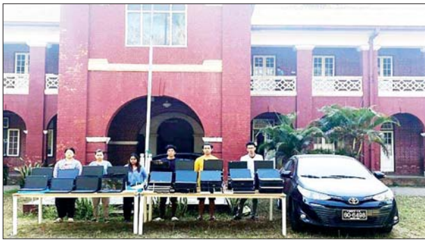
တရားမဝင် Online ငွေကြေးလိမ်လည်မှု ပြုလုပ်နေသည့် တရားခံများအား မော်တော်ယာဉ်တစ်စီး၊ Laptop များ၊ အခြားဆက်စပ်ပစ္စည်းများနှင့်အတူ ဖမ်းဆီးရမိစဉ်တွေ့မြင်ရပုံ။