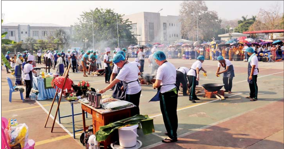
ကျင်းပရာ နိုင်ငံတော်စီမံအုပ်ချုပ်ရေးကောင်စီအဖွဲ့ဝင် ဦးဝဏ္ဏမောင်လွင်က ပထမဆုရရှိသည့်အသင်းကို လည်းကောင်း၊ ဒုတိယဝန်ကြီးချုပ်နှင့် ပြည်ထောင်စုဝန်ကြီး ဦးသန်းဆွေက ဒုတိယဆုရရှိသည့်အသင်းကို လည်းကောင်း၊ ဒုတိယဝန်ကြီး ဦးလွင်ဦးနှင့် ညွှန်ကြားရေးမှူးချုပ်များက တတိယဆုရရှိသည့်အသင်းနှင့် နှစ်သိမ့်ဆုရရှိသည့်အသင်းများကို လည်းကောင်း ဂုဏ်ပြုဆုများ ပေးအပ်ချီးမြှင့်ကြပြီး အခမ်းအနားကို ညနေပိုင်းတွင် အောင်မြင်စွာရပ်သိမ်းခဲ့ကြောင်း သိရသည်။ သတင်းစဉ်

အဆိုပါထမနဲထိုးပြိုင်ပွဲတွင် နိုင်ငံခြားရေးဝန်ကြီးဌာန ဝန်ထမ်းများက စည်ကားသိုက်မြိုက်စွာ ပါဝင်ဆင်နွှဲခဲ့ကြပြီး မြန်မာ့ရိုးရာယဉ်ကျေးမှု အစဉ်အလာအတိုင်း စည်းမျဉ်းစည်းကမ်း၊ အမှတ်ပေးသတ်မှတ်ချက်များနှင့်အညီ ယှဉ်ပြိုင်ကြသည်။ ပြိုင်ပွဲတွင် ပြိုင်ပွဲဝင်အသင်းများကို အမှတ်ပေးဒိုင်အဖွဲ့က အမှတ်ပေးစည်းမျဉ်းစည်းကမ်းများနှင့်အညီ စိစစ်အကဲဖြတ်အမှတ်ပေးကြရာ ဦးစီးဌာနရှစ်ခုမှ ပြိုင်ပွဲဝင်အသင်း ရှစ်သင်းအနက် ပထမဆုကို နိုင်ငံရေးရာဦးစီးဌာနကလည်းကောင်း၊ ဒုတိယဆုကို စီမံကိန်းနှင့် စီမံရေးရာဦးစီးဌာနက လည်းကောင်း၊ တတိယဆုကို သံတမန်ရေးရာဦးစီးဌာနက လည်းကောင်း ရရှိကြသည်။ ပြိုင်ပွဲများအပြီးတွင် ဆုပေးပွဲကို ဆက်လက်