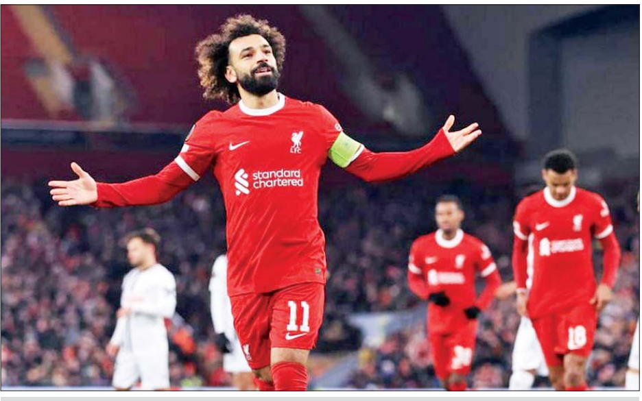
လီဗာပူးအသင်း ကစားသမားများ ရိုးသွင်းပြီး အောင်ပွဲခံနေစဉ်။

ယူရိုပါလိဂ် ၁၆ သင်းအဆင့်ပွဲစဉ်တွေကို မဲခွဲဆုံးဖြတ်ခဲ့ရာမှာ လီဗာပူးအသင်းက စပါတာပရက်အသင်းနဲ့ လည်းကောင်း၊ ဘရိုက်တန်အသင်းက ရိုးမားအသင်းနဲ့လည်းကောင်း အသီးသီးတွေ့ဆုံနေတာဖြစ်ပါတယ်။