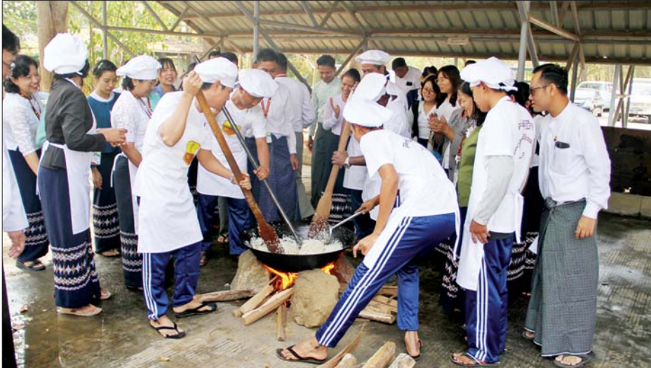
မှ ပြိုင်ပွဲဝင်အသင်းငါးသင်း၏ မြန်မာ့ရိုးရာစုပေါင်းထမနဲထိုး ပွဲသို့ စွမ်းအင်ဝန်ကြီးဌာန ပြည်ထောင်စုဝန်ကြီးနှင့်အတူ ဒုတိယမူကို ကြည့်ရှုအားပေးပြီး ဂုဏ်ပြုချီးမြှင့်ငွေများ ပေးအပ်သည်။ တာဝန်ရှိသူများ၊ ဝန်ကြီးဌာန ကြီးကြပ်မှုအောက်ရှိ ဦးစီးဌာန၊ လုပ်ငန်းများမှ ဝန်ထမ်းများနှင့် ဝန်ထမ်းမိသားစုများ တက်ရောက်အားပေးခဲ့ကြကြောင်း သိရသည်။ သတင်းစဉ်

နေပြည်တော် ဖေဖော်ဝါရီ ၂၃ မြန်မာ့ရိုးရာဓလေ့ယဉ်ကျေးမှု အစဉ်အလာကို ထိန်းသိမ်းတတ်စေရန်၊ ဝန်ထမ်းအချင်းချင်း စည်းလုံးညီညွတ်စွာဖြင့် ဝိုင်းဝန်းပူးပေါင်းဆောင်ရွက်တတ်စေရန်၊ တစ်ဦးနှင့်တစ်ဦးကူညီရိုင်းပင်းလို စိတ်များ ဖြစ်ပေါ်လာစေရန်နှင့် အဖွဲ့အစည်းစိတ်ဓာတ် ခိုင်မာအားကောင်းစေရန်ရည်ရွယ်၍ စွမ်းအင်ဝန်ကြီးဌာန၏ ၁၃၈၅ ခုနှစ် မြန်မာ့ရိုးရာစုပေါင်းထမနဲထိုး ပြိုင်ပွဲကို ယနေ့နံနက်ပိုင်းတွင် စွမ်းအင်ဝန်ကြီးဌာန စုပေါင်းကွင်း၌ စည်ကားသိုက်မြိုက်စွာ ကျင်းပသည်။ ဦးစွာ ပြည်ထောင်စုဝန်ကြီးဦးကိုကိုလွင်နှင့် တာဝန်ရှိသူများသည် ဝန်ကြီးဌာနကြီးကြပ်မှုအောက်ရှိ ဦးစီးဌာန၊ လုပ်ငန်းများ