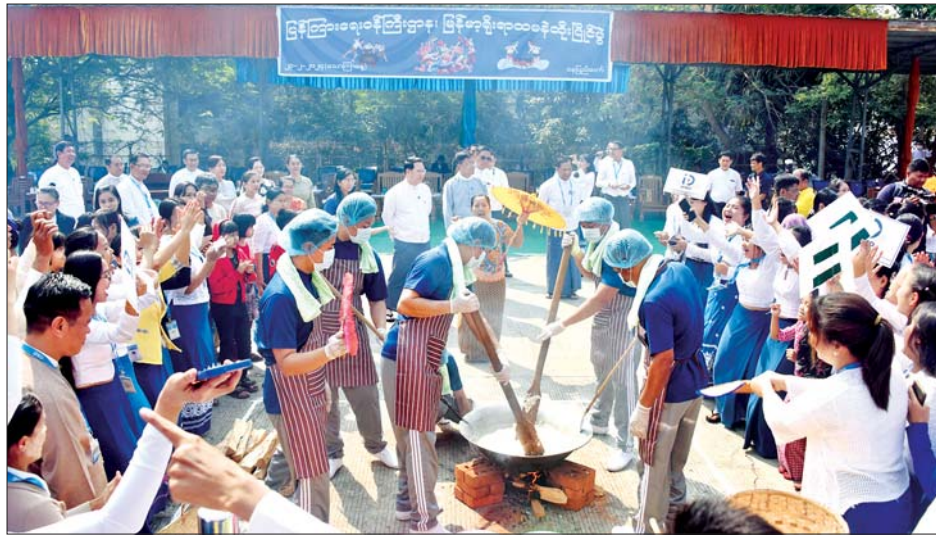
ပြည်ထောင်စုဝန်ကြီး ဦးမောင်မောင်အုန်းနှင့် တာဝန်ရှိသူများ မြန်မာ့ရိုးရာ ထမနဲထိုးယှဉ်ပြိုင်နေမှုကို ကြည့်ရှုအားပေးစဉ်။