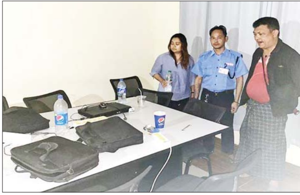
ဗဟန်းမြို့နယ် ကမ္ဘာ့အေးဘုရားလမ်း ပုလဲကွန်ဒို Building E (၅)လွှာ အခန်း(၅၀၁)ရှိ ရုံးခန်းအား ဝင်ရောက်ရှာဖွေစဉ် တွေ့မြင်ရပုံ။