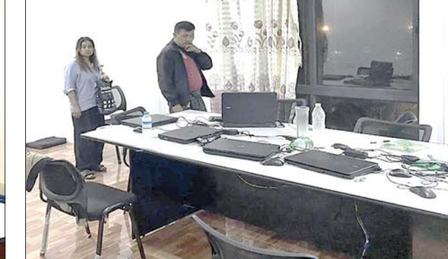
မရမ်းကုန်းမြို့နယ် Gandamar Residence (၆)လွှာ အခန်း (၆၀၂)ရှိ ရုံးခန်းအား ဝင်ရောက်ရှာဖွေစဉ် တွေ့မြင်ရပုံ။