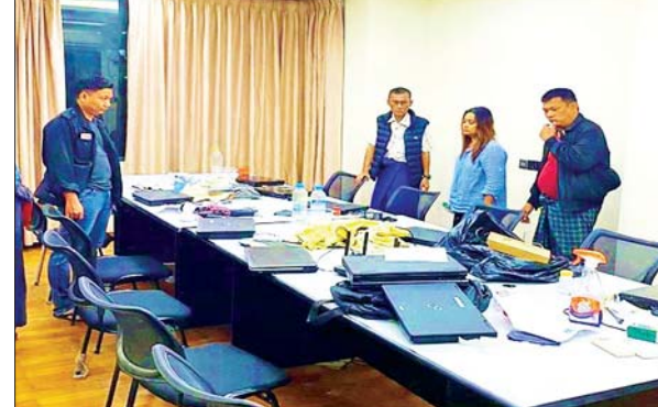
ဗဟန်းမြို့နယ် ရွှေဂုံတိုင် Excel Tower (၅)လွှာ အခန်း(၅၀၂) ရှိ ရုံးခန်းအား ဝင်ရောက်ရှာဖွေစဉ် တွေ့မြင်ရပုံ။