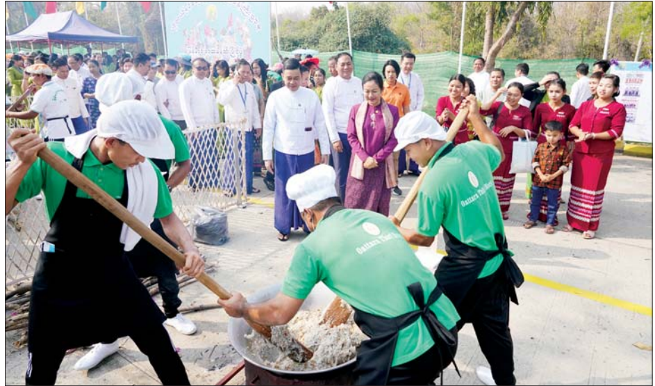
အခမ်းအနားတွင် ပြည်ထောင်စုဝန်ကြီးက ပြိုင်ပွဲဝင်အသင်းများအနေဖြင့် မြန်မာ့ရိုးရာဓလေ့များကို ထိန်းသိမ်းပြီး စည်းလုံးမှု၏စွမ်းအားနှင့် ညီညွတ်မျှတစွာ အကောင်းဆုံးပါဝင်ယှဉ်ပြိုင်ကြစေလိုကြောင်း၊ တစ်ကိုယ်ရေသန့်ရှင်းရေး၊ ကျန်းမာရေးနှင့် အစားအစာ ဘေးကင်းလုံခြုံရေးကို ဂရုပြုကြ၍ မိမိတို့ရရှိသည့် ကုန်ကြမ်းများနှင့် အချိန်ကိုကောင်းမွန်စွာ အသုံးပြုပြီး ပြိုင်ပွဲဝင်အချင်းချင်း၊ ဝန်ထမ်းအချင်းချင်း ပျော်ပျော်ရွှင်ရွှင် စည်းလုံးညီညွတ်စွာ အကောင်းဆုံး ယှဉ်ပြိုင်သွားကြရန် တိုက်တွန်း

နေပြည်တော် ဖေဖော်ဝါရီ ၂၃ (၁)လရာသီပွဲတော်များတွင်ပါဝင်သော မြန်မာ့ရိုးရာထမနဲထိုးပွဲကို ထိန်းသိမ်းမြှင့်တင်ဆောင်ရွက်ရန်၊ ဝန်ထမ်းများအချင်းချင်း ပူးပေါင်းဆောင်ရွက်တတ်မှု၊ စည်းလုံးညီညွတ်မှုရရှိစေရန်နှင့် အစိုးရနှင့် ပုဂ္ဂလိက ပူးပေါင်းဆောင်ရွက်မှုကို မြှင့်တင်နိုင်ရန် ရည်ရွယ်၍ ဟိုတယ်နှင့် ခရီးသွားလာရေးဝန်ကြီးဌာန၏ မြန်မာ့ရိုးရာထမနဲထိုးပြိုင်ပွဲ အခမ်းအနားကို ယနေ့မွန်းလွဲပိုင်းတွင် အဆိုပါဝန်ကြီးဌာန၌ ကျင်းပသည်။ တက်ရောက် အခမ်းအနားသို့ ဟိုတယ်နှင့် ခရီးသွားလာရေးဝန်ကြီးဌာန ပြည်ထောင်စုဝန်ကြီး ဒေါက်တာ သက်သက်ခိုင်၊ ဒုတိယဝန်ကြီး ဦးမြိုးဇော်စိုး၊ အမြဲတမ်းအတွင်းဝန်၊ ညွှန်ကြားရေးမှူးချုပ်၊ ဒုတိယအမြဲတမ်းအတွင်းဝန်၊ ဒုတိယညွှန်ကြားရေးမှူးချုပ်များ၊ ညွှန်ကြားရေးမှူးများနှင့် ဝန်ကြီးဌာနမှ အရာထမ်း၊ အမှုထမ်းများ၊ နေပြည်တော် ဟိုတယ်ဆိုင်ရာ လုပ်ငန်းရှင်များအသင်းနှင့် ခရီးသွားလုပ်ငန်းရှင်များအသင်းမှ တာဝန်ရှိသူများ တက်ရောက်ကြသည်။