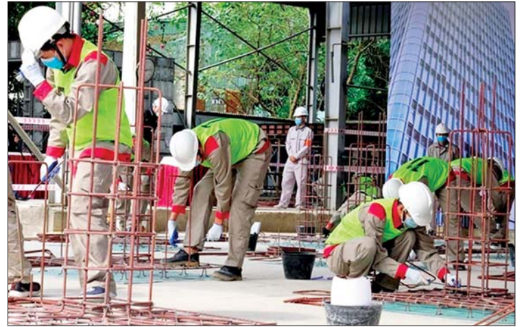
အလုပ်သင် သင်တန်းသားများအတွက် လက်ရှိစနစ်အားဖျက်သိမ်းကာ အစီအစဉ် သစ်တစ်ခုသို့ ပြောင်းလဲသွားရန် စီစဉ်ထားကြောင်း သိရသည်။ ကိုးကား - အင်န်အိတ်ချီကောဘာသာပြန် - စိုးသူရ

ပြင်ဆင်ထိန်းသိမ်းရေး လုပ်သားများကိုပါ ပြည်ပမှ ခေါ်ယူမည်ဖြစ်ပြီး ၎င်းအစီအစဉ်ကို လာမည့်လတွင် ကျင်းပမည့် အစိုးရအစည်းအဝေးတွင် အတည်ပြုမည်ဖြစ်သည်။ ဂျပန်နိုင်ငံ၌ လက်ရှိသတ်မှတ်ချက်များအရ ပြည်ပမှ နိုင်ငံခြားသားကျွမ်းကျင်ပညာရှင်များကို ဂျပန်နိုင်ငံတွင် ငါးနှစ် နေထိုင်ခွင့်ပြုထားပြီး ၎င်းလုပ်ငန်းကဏ္ဍများတွင် သူ့နာပြုလုပ်ငန်း၊ ဆောက်လုပ်ရေးလုပ်ငန်းနှင့် စိုက်ပျိုးရေးလုပ်ငန်းများ ပါဝင်သည်။ ဂျပန်နိုင်ငံအစိုးရက ပြည်ပမှ