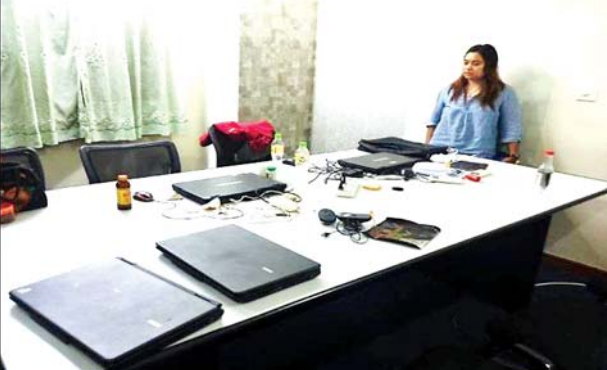
ကမာရွတ်မြို့နယ် အမှတ်(၈)ရပ်ကွက် Diamond Condo Tower A (၆)လွှာ အခန်း(၆၀၄)အား ဝင်ရောက်ရှာဖွေစဉ် တွေ့မြင်ရပုံ။