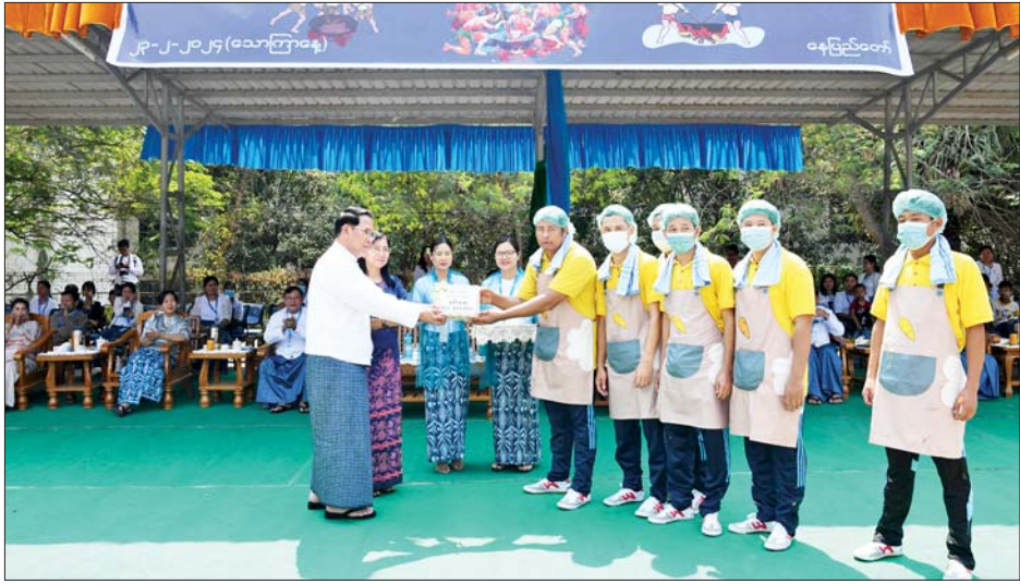
ပြည်ထောင်စုဝန်ကြီး ဦးမောင်မောင်အုန်းနှင့်ဇနီးတို့က ထမနဲထိုးပြိုင်ပွဲတွင် ဒုတိယဆုရရှိသည့် သတင်းနှင့်စာနယ်ဇင်းလုပ်ငန်းမှ ပြိုင်ပွဲဝင်များအား ဆုငွေများ ပေးအပ်ချီးမြှင့်စဉ်။