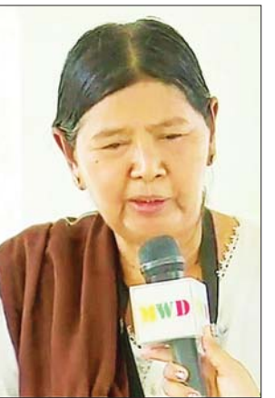
ရောက်လာတာပါ ရှင်းလင်းဆောင်မှာ ရှင်းပြတဲ့အတွက် ဘုရားကြီးကို စပြီးစကျင်ကျောက်

လေ့လာကြည့်ရှုခဲ့ကြပြီး အလှူငွေများ ပေးအပ်လှူဒါန်းကြသည်။ ထို့အတူ မာရဝိဇယဗုဒ္ဓရုပ်ပွားတော်မြတ်ကြီးအား အနယ်နယ်အရပ်ရပ်မှ ရဟန်းရှင်လူ ဘုရားဖူးပြည်သူများ လာရောက်ဖူးမြော်ကြည်ညိုလျက်ရှိသည်။ ယနေ့တွင် မာရဝိဇယဗုဒ္ဓရုပ်ပွားတော်မြတ်ကြီးအား လာရောက်ဖူးမြော်ခဲ့ကြသည့် အငြိမ်းစားနိုင်ငံတော်များနှင့် အုပ်ချုပ်မှုအဖွဲ့ဝင်များ၏ ရင်တွင်းစကားသံများအား ယခုလို ကြားသိခဲ့ရပါသည်။ မြို့နယ်ကနေ စီစဉ်ပေးလို့