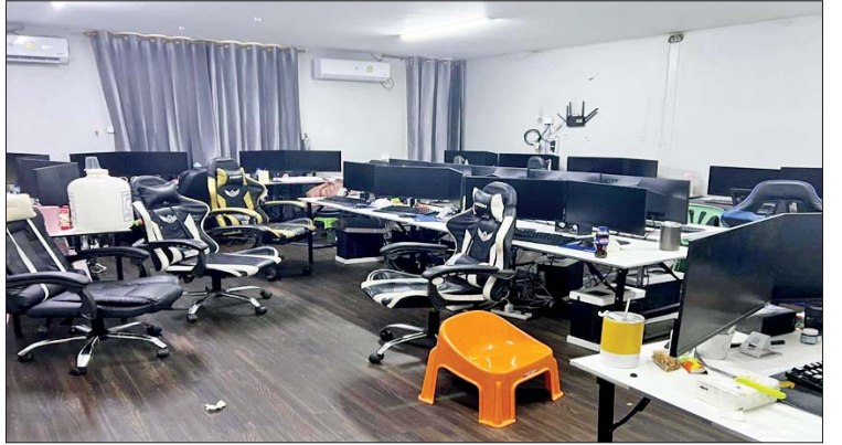
တရားမဝင်အွန်လိုင်းဂိမ်းနှင့် ငွေကြေးလိမ်လည်မှုများအသုံးပြုသည့် Desktop ကွန်ပျူတာပုံများ။