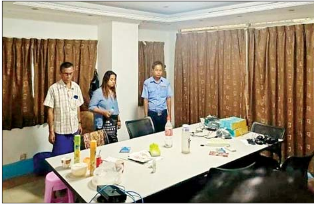
ဗိုလ်တထောင်မြို့နယ် ကမ်းနားလမ်း အမှတ်(၄၄/၅၆) MMG Tower (၆)လွှာ အခန်း(၆၀၄)ရှိ ရုံးခန်းအား ဝင်ရောက်ရှာဖွေစဉ် တွေ့မြင်ရပုံ။