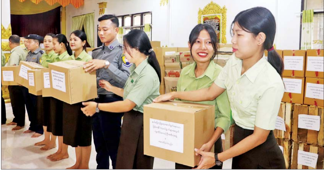
ဌာနဆိုင်ရာများ၊ လူမှုရေးအသင်းအဖွဲ့များနှင့် ဒေသခံပြည်သူများ စုပေါင်း၍ စားသောက်ဖွယ်ရာများအား ရှေ့တန်းရောက်လုံခြုံရေးတပ်ဖွဲ့ဝင်များထံသို့ပေးပို့မည့် မော်တော်ယာဉ်များပေါ်သို့ တင်ပေးနေကြစဉ်။