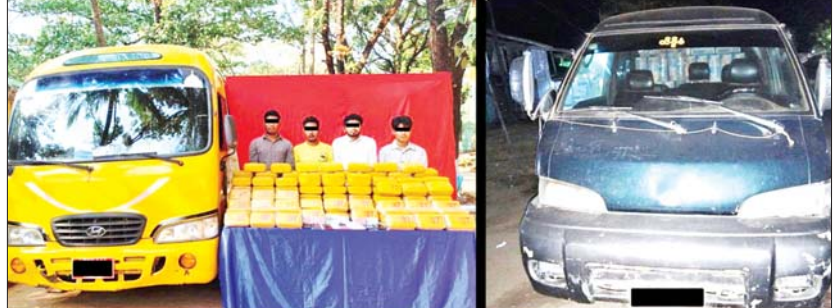
ပြစ်မှုကျူးလွန်သူများအား သိမ်းဆည်းရမိသည့် စိတ်ကြွေးသွပ်ဆေးပြားများနှင့်အတူ တွေ့ရစဉ်။

မူးယစ်ဆေးဝါးတားဆီးနှိမ်နင်းရေး ရဲတပ်ဖွဲ့ မှ တပ်ဖွဲ့ဝင်များပါဝင်သော ပူးပေါင်းအဖွဲ့သည် ဖေဖော်ဝါရီ ၁၅ ရက် နံနက် ၁၀ နာရီခွဲတွင် မွန်ပြည်နယ် ကျိုက်ထိုမြို့နယ် မရမ်းချောင် ကျေးရွာအနီးတွင် ဒိုက်ဦးမှ ဘားအံသို့ ခိုင်ဇော်