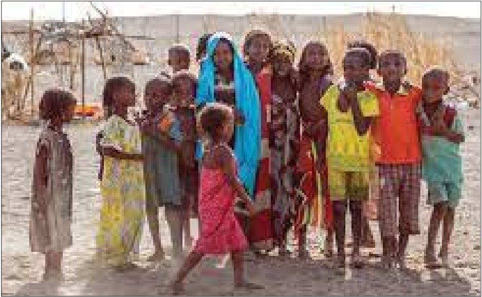
မလုံလောက်မှုနှင့် ရေကြီးရေလျှံမှုဆိုင်ရာကိစ္စရပ် အစီရင်ခံစာအရ သိရသည်။ များကြောင့် လိုအပ်ချက်များ တိုးမြှင့်လာခြင်း ကိုးကား-ဆင်ဟွာ၊ ဖြစ်ကြောင်း ကုလသမဂ္ဂကလေးများရန်ပုံငွေအဖွဲ့၏ ဘာသာပြန်-အလင်းသစ်

ကြုံတွေ့နေရသော အကျပ်အတည်းများ၏ ဆိုးရွားသော အကျိုးဆက်များကို ရှောင်ရှားနိုင်ရန်နှင့် အခြေခံစားနပ်ရိက္ခာလိုအပ်ချက်များ ဖြည့်ဆည်းပေးရန် အမေရိကန်ဒေါ်လာ ၅၃၅ သန်း လိုအပ်လျက်ရှိကြောင်းလည်း ကုလသမဂ္ဂကလေးများရန်ပုံငွေအဖွဲ့က ပြောကြားခဲ့သည်။ ထို့ပြင် မျိုးဆက်ပွားကျန်းမာရေးဝန်ဆောင်မှု ပေးခြင်း၊ ကလေးများအတွက် ကာကွယ်ဆေးထိုးနှံပေးခြင်းနှင့် လိုအပ်နေသော မိသားစုများအတွက် သန့်ရှင်းသောရေများ ပေးဆောင်ရန် ရန်ပုံငွေများ လိုအပ်နေကြောင်း ကုလသမဂ္ဂကလေးများရန်ပုံငွေအဖွဲ့က ဆိုသည်။ လတ်တလောဖြစ်ပွားနေသော မိုးခေါင်ရေရှားမှု၊ ပဋိပက္ခနှင့် ရောဂါကူးစက်မှုများသည် စားနပ်ရိက္ခာ