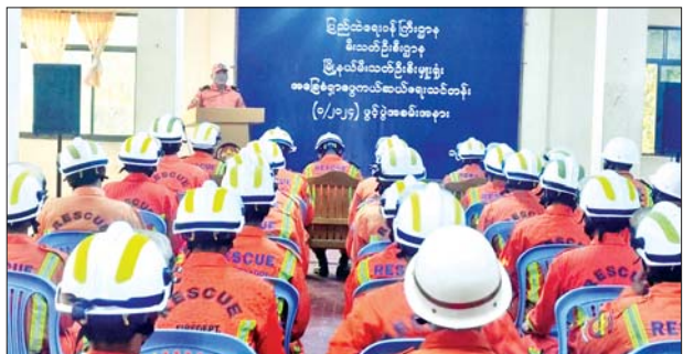
မြိုင်သဲရေပန် ဖြိုဖြတ်မှု အသိပညာပေး အခြေခံရှာဖွေကယ်ဆယ်ရေးသင်တန်း (၁/၂၀၂၄) ဖွင့်ပွဲအခမ်းအနား

တပ်စုများအပြင် အခြားတပ်ဖွဲ့ဝင်များကိုလည်း လေ့ကျင့်သင်ကြားပေးရန် လိုအပ်ကြောင်း၊ လေ့ကျင့်မှုများကို စဉ်ဆက်မပြတ်ဆောင်ရွက်သွားရန် နှင့် လေ့ကျင့်မှုကျွမ်းကျင်မှုများ ရှိလာမည်ဖြစ်ကြောင်း ပြောကြားခဲ့သည်။ အဆိုပါသင်တန်းဖွင့်ပွဲသို့ သင်တန်းမှူးများ၊ သင်တန်းသား သန္ဓေ မီးသတ်တပ်ဖွဲ့ဝင် ၅၀ နှင့် အရန်မီးသတ်တပ်ဖွဲ့ဝင် ၁၅ ဦးတို့တက်ရောက် ခဲ့ကြပြီး သင်တန်းတွင် စာတွေ့နှင့်လက်တွေ့သရုပ်ပြသခြင်းများဖြင့် သင်ကြားခဲ့ကြောင်း သိရသည်။ မြို့နယ်(ပြန်/ဆက်)