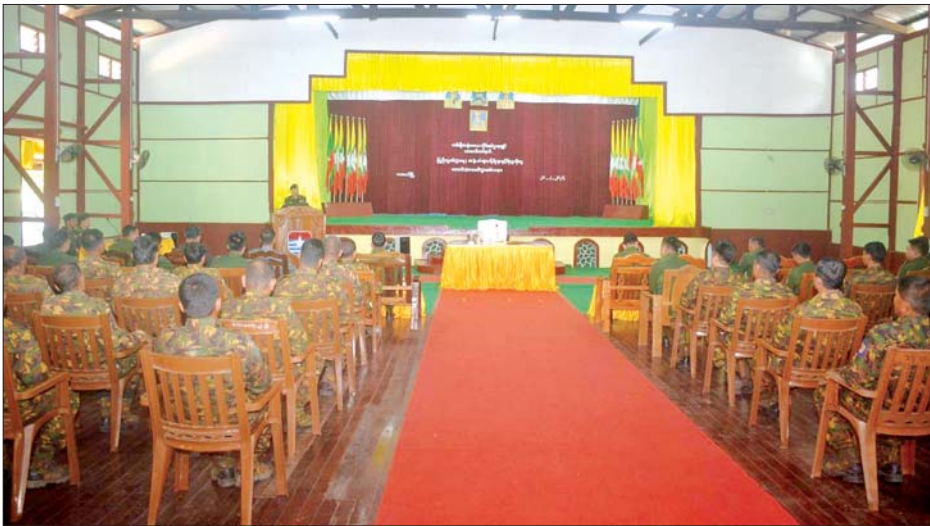
အတွက် ဆန်၊ ဆီနှင့် ချီးမြှင့်ငွေ အဖွဲ့က ပြည်သူ့စစ်(ဌာနေ)တပ်ဖွဲ့ လိုက်လံကြည့်ရှုအားပေးပြီး လိုအပ် များပေးအပ်ပြီး ရင်းရင်းနှီးနှီး ဝင်များအား လိုအပ်သည့် ကျန်းမာ သည်များ ညှိနှိုင်းဆောင်ရွက်ပေး လိုက်လံနှုတ်ဆက်သည်။ ရေး စစ်ဆေးပေးနေမှုများကို ခွဲကြောင်း သိရသည်။ ထို့ပြင် နယ်မြေခံဆေးကုသရေး တိုင်းမှူးနှင့် တာဝန်ရှိသူများက သတင်းစဉ်

နေပြည်တော် ဖေဖော်ဝါရီ ၂၀ တနင်္လာရက် တိုင်းဒေသကြီး ထားဝယ်မြို့ရှိ ပြည်သူ့စစ်(ဌာနေ) တပ်ဖွဲ့ဝင်များအား ယနေ့နံနက် ပိုင်းတွင် ကမ်းရိုးတန်းဒေသ တိုင်းစစ်ဌာနချုပ် တိုင်းမှူး ဗိုလ်မှူး ချုပ်ကျော်စွာဦးနှင့် တာဝန်ရှိသူ များက နယ်မြေခံတပ်နယ် အောင်ဆန်းခန်းမ၌ သွားရောက် တွေ့ဆုံသည်။