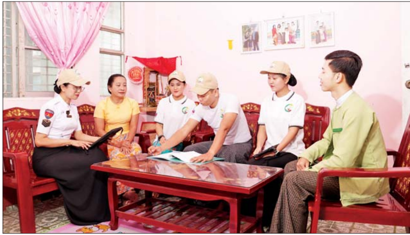
သန်းခေါင်စာရင်းကောက်ယူမှု မှတ်တမ်းဓာတ်ပုံ။

ပတ်သက်လို့ပြည်သူလူထုသိရှိအောင် ဘယ်လို စီမံဆောင်ရွက်နေသလဲဆိုတာ ရှင်းပြပေးပါဦး။