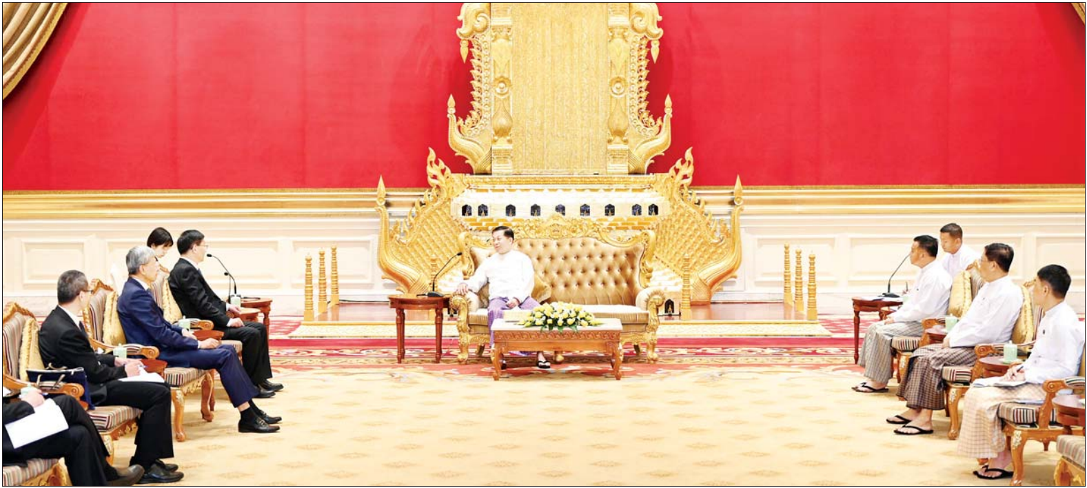
နိုင်ငံတော်စီမံအုပ်ချုပ်ရေးကောင်စီဥက္ကဋ္ဌ နိုင်ငံတော်ဝန်ကြီးချုပ် ဗိုလ်ချုပ်မှူးကြီးမင်းအောင်လှိုင်နှင့် တရုတ်နိုင်ငံ ယူနန်ပြည်နယ် ဒုတိယပါတီအတွင်းရေးမှူးနှင့် ပြည်နယ်အုပ်ချုပ်ရေးမှူး H.E. Mr. Wang Yubo ဦးဆောင်သည့် ကိုယ်စားလှယ်အဖွဲ့တို့ တွေ့ဆုံဆွေးနွေးစဉ်။

ဆောင်ရွက်သွားမည့် အခြေအနေ များ၊ မူးယစ်ဆေးဝါး တားဆီး ကာကွယ် နှိမ်နင်းရေးအတွက် နှစ်နိုင်ငံအကြား ပူးပေါင်း ဆောင်ရွက်သွားရန် လိုအပ်သည့် အခြေအနေများ၊ မြန်မာနိုင်ငံ၏