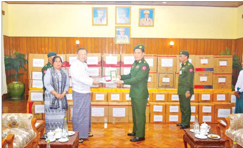
ပြည်ထောင်စုဝန်ကြီး ဒေါက်တာကံဇော် လုံခြုံရေးတပ်ဖွဲ့ဝင်များအတွက် ဂုဏ်ပြုချီးမြှင့်ငွေများနှင့် စားသောက်ဖွယ်ရာများကို တိုင်းမှူးထံပေးအပ်စဉ်။

ထိုသို့ ပေးအပ်လျက်ရှိရာ ယနေ့မွန်းလွဲပိုင်းတွင် ရင်းနှီးမြှုပ်နှံမှုနှင့် နိုင်ငံခြားစီးပွားဆက်သွယ်ရေး ဝန်ကြီးဌာနနှင့် နေပြည်တော်စည်ပင်သာယာရေး ကော်မတီတို့မှ ဝန်ထမ်းမိသားစုများက ဂုဏ်ပြု ချီးမြှင့်ငွေနှင့် စားသောက်ဖွယ်ရာများ ပေးအပ်ခြင်း ကို နေပြည်တော်တိုင်းစစ်ဌာနချုပ်ရှိ ပေါင်းလောင်း ရိပ်သာဥယျာဉ်လှုပ်ရာ ရင်းနှီးမြှုပ်နှံမှုနှင့် နိုင်ငံခြား စီးပွားဆက်သွယ်ရေးဝန်ကြီးဌာန ပြည်ထောင်စု ဝန်ကြီး ဒေါက်တာကံဇော်၊ တိုင်းမှူး ဗိုလ်ချုပ် စောသန်းလှိုင်နှင့် နေပြည်တော်စည်ပင်သာယာ ရေးကော်မတီ ဒုတိယမြို့တော်ဝန် ဦးမောင်မောင်၊ ဌာနဆိုင်ရာတာဝန်ရှိသူများ တက်ရောက်ကြ သည်။ ဦးစွာ ရင်းနှီးမြှုပ်နှံမှုနှင့် နိုင်ငံခြားစီးပွား ဆက်သွယ်ရေးဝန်ကြီးဌာနမှ ဝန်ထမ်းမိသားစု များက ပေးအပ်လှူဒါန်းသည့် ငွေကျပ် ၁၁၇၄၃၉၆၀ တန်ဖိုးရှိ စားသောက်ဖွယ်ရာများအား လည်း ကောင်း၊ နေပြည်တော်စည်ပင်သာယာရေး ကော်မတီမှ ဝန်ထမ်းမိသားစုများက ပေးအပ်လှူဒါန်း သည့် ဂုဏ်ပြုချီးမြှင့်ငွေကျပ်သိန်း ၅၀ နှင့် ငွေကျပ် ၆၃၄၅၅၀၀ တန်ဖိုးရှိ စားသောက်ဖွယ်ရာများ အားလည်းကောင်း ရင်းနှီးမြှုပ်နှံမှုနှင့် နိုင်ငံခြားစီးပွား ဆက်သွယ်ရေးဝန်ကြီးဌာန ပြည်ထောင်စုဝန်ကြီးနှင့် နေပြည်တော်စည်ပင်သာယာရေးကော်မတီ ဒုတိယ မြို့တော်ဝန်တို့က တိုင်းမှူးထံ ဂုဏ်ပြုပေးအပ်သည်။ ထို့နောက် တိုင်းမှူးက ဂုဏ်ပြုတမ်းလွှာ ပြန်လည် ပေးအပ်ပြီး ကျေးဇူးတင်စကား ပြန်လည်ပြောကြား သည်။ အဆိုပါ ဂုဏ်ပြုချီးမြှင့်ငွေများနှင့် စားသောက် ဖွယ်ရာများအား လုံခြုံရေးတပ်ဖွဲ့ဝင်များ၏ လက်ဝယ်အရောက် ဆက်လက်ပို့ဆောင်ပေးသွား မည်ဖြစ်ကြောင်း သိရသည်။ သတင်းစဉ်