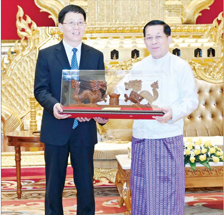
နိုင်ငံတော်စီမံအုပ်ချုပ်ရေးကောင်စီဥက္ကဋ္ဌ နိုင်ငံတော်ဝန်ကြီးချုပ် ဗိုလ်ချုပ်မှူးကြီးမင်းအောင်လှိုင်နှင့် တရုတ်နိုင်ငံ ယူနန်ပြည်နယ် ဒုတိယပါတီအတွင်းရေးမှူးနှင့် ပြည်နယ်အုပ်ချုပ်ရေးမှူး H.E. Mr. Wang Yubo တို့ အမှတ်တရလက်ဆောင်ပစ္စည်းများ အပြန်အလှန်ပေးအပ်စဉ်။