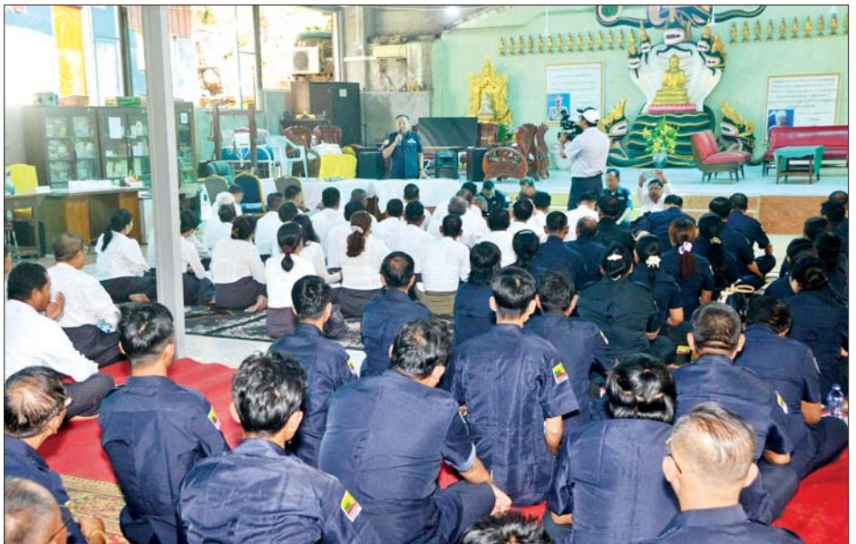
ရာ တာဝန်ရှိသူများက ပေးအပ်လှူဒါန်းကြသည်။ ပြောကြားကာ အခမ်းအနားကို ရုပ်သိမ်းခဲ့ကြောင်း ထို့နောက် YMBA (ဗဟို)ဥက္ကဋ္ဌက နိဂုံးချုပ်အမှာစကား သိရသည်။ သတင်းစဉ်

ရေးမှူးက ပြည်သူ့စစ်မှုထမ်းဥပဒေနှင့်ပတ်သက်၍ လည်းကောင်း၊ ဗုဒ္ဓဘာသာကလျာဏယုဝအသင်း YMBA (ဗဟို) တွဲဖက်အတွင်းရေးမှူး သဘာဝဘေးအန္တရာယ် ကူညီကယ်ဆယ်ရေးအဖွဲ့ခေါင်းဆောင်က သဘာဝဘေးအန္တရာယ် ကူညီကယ်ဆယ်ရေးလုပ်ငန်းများနှင့်ပတ်သက်၍လည်းကောင်း၊ ရန်ကင်းတိုင်းဒေသကြီး YMBA အသင်းဥက္ကဋ္ဌက ရန်ကင်းတိုင်းဒေသကြီး YMBA အသင်း၏ လုပ်ငန်းဆောင်ရွက်ထားရှိမှုများကိုလည်းကောင်း၊ မွန်ပြည်နယ် YMBA အသင်းဥက္ကဋ္ဌ သဘာဝဘေးအန္တရာယ်ကူညီကယ်ဆယ်ရေးဗဟိုအဖွဲ့ဝင်က သဘာဝဘေးအန္တရာယ်ကူညီကယ်ဆယ်ရေးလုပ်ငန်းများနှင့် ပတ်သက်၍လည်းကောင်း တင်ပြဆွေးနွေးကြသည်။ ယင်းနောက် တက်ရောက်လာကြသူများက သိရှိလိုသည်များကို မေးမြန်းဆွေးနွေးကြပြီး တိုင်းနှင့် ပြည်နယ် YMBA အသင်းများနှင့် စေတနာရှင်ပြည်သူများက လှူဒါန်းသည့် အဝတ်အထည်များကို YMBA (ဗဟို) ဥက္ကဋ္ဌနှင့် တာဝန်ရှိသူများထံ သက်ဆိုင်