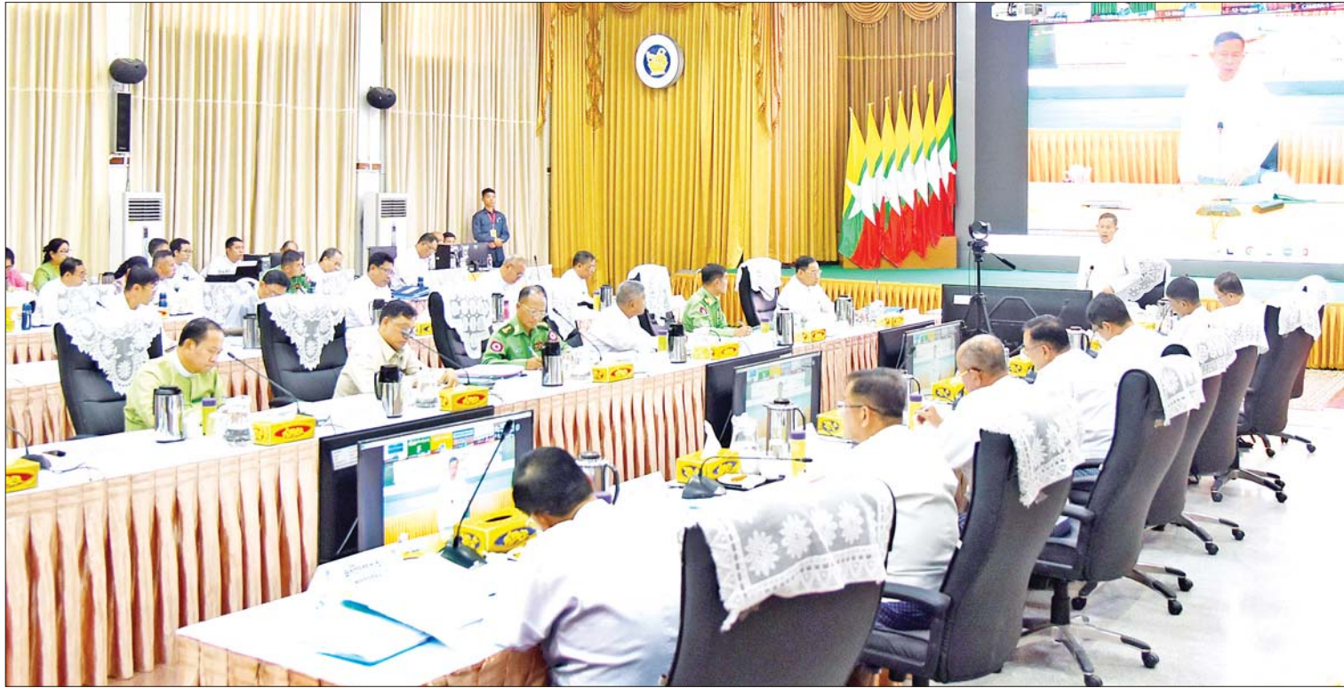
နိုင်ငံတော်စီမံအုပ်ချုပ်ရေးကောင်စီ ဒုတိယဥက္ကဋ္ဌ ဒုတိယဝန်ကြီးချုပ် ဒုတိယဗိုလ်ချုပ်မှူးကြီး စိုးဝင်း တရားမဝင်ကုန်သွယ်မှုတိုက်ဖျက်ရေးဦးဆောင်ကော်မတီ လုပ်ငန်းညှိနှိုင်းအစည်းအဝေး (၁/၂၀၂၄) တွင် အမှာစကားပြောကြားစဉ်။

နေပြည်တော် ဖေဖော်ဝါရီ ၁၉ တရားမဝင်ကုန်သွယ်မှုတိုက်ဖျက်ရေး ဦးဆောင်ကော်မတီ လုပ်ငန်းညှိနှိုင်းအစည်းအဝေး(၁/၂၀၂၄) ကို ယနေ့မုန်းလွဲပိုင်းတွင် နေပြည်တော်ရှိ စီးပွားရေးနှင့် ကူးသန်းရောင်းဝယ်ရေး ဝန်ကြီးဌာန ညီလာခံခန်းမ၌ကျင်းပရာ တရားမဝင်ကုန်သွယ်မှုတိုက်ဖျက်ရေး ဦးဆောင်ကော်မတီဥက္ကဋ္ဌ နိုင်ငံတော်စီမံအုပ်ချုပ်ရေးကောင်စီ ဒုတိယဥက္ကဋ္ဌ ဒုတိယဝန်ကြီးချုပ် ဒုတိယဗိုလ်ချုပ်မှူးကြီး စိုးဝင်း တက်ရောက် အမှာစကား ပြောကြားသည်။ အစည်းအဝေးသို့ ပြည်ထောင်စုဝန်ကြီးများဖြစ်ကြသည့် ဒုတိယဗိုလ်ချုပ်ကြီးရာပြည့်၊ ဦးဝင်းရှိန်နှင့် ဦးထွန်းအုံး၊ ဒုတိယဝန်ကြီးများ၊ နေပြည်တော်ကောင်စီဝင်၊ အခွန်အယူခံခုံအဖွဲ့ဥက္ကဋ္ဌ၊ အမြဲတမ်းအတွင်းဝန်များ၊ ညွှန်ကြားရေးမှူးချုပ်များ၊ အသင်းအဖွဲ့များမှ ဥက္ကဋ္ဌများနှင့် တာဝန်ရှိသူများ တက်ရောက်ကြပြီး တိုင်းဒေသကြီးနှင့် ပြည်နယ် တရားမဝင်စာမျက်နှာ ၄ ကော်လံ ၁ သို့ ❖