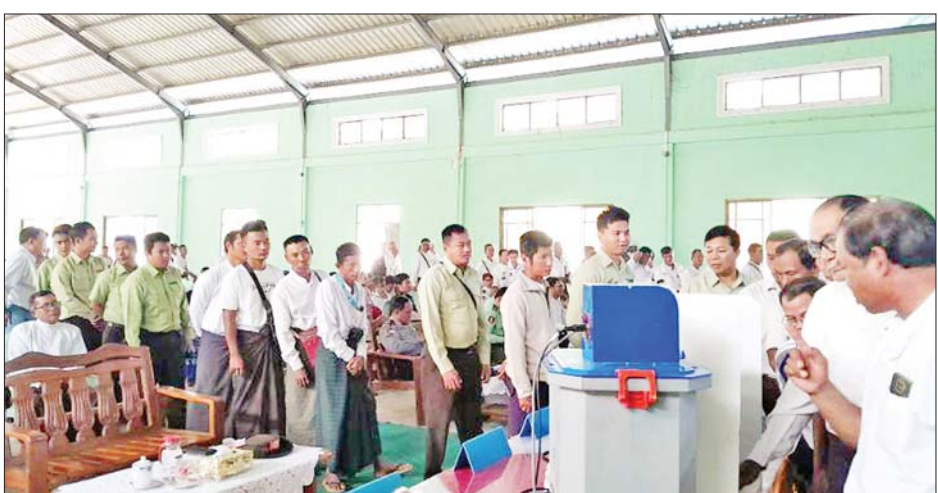
ပိုမိုကောင်းမွန်စေမည့် အကြံပြု စက်ဖြင့် လက်တွေ့စမ်းသပ်မဲပေးခြင်းအစီအစဉ်ကိုဧရာဝတီ မြန်မာ အီလက်ထရောနစ်မဲပေးစက်ဖြင့် လက်တွေ့စမ်းသပ်မဲပေးလေ့လာခြင်းအစီအစဉ်ကိုဧရာဝတီ မြန်မာ အီလက်ထရောနစ်မဲပေးစက်ဖြင့် လက်တွေ့စမ်းသပ်မဲပေးလေ့လာခြင်း ဆောင်ရွက်လျက် ရှိပြီး မြန်မာ-အိန္ဒိယနယ်စပ်ကုန်သွယ်မှုတွင် ရူပီး/ကျပ် တိုက်ရိုက်ငွေပေးချေမှုစနစ် အသုံးပြုဆောင်ရွက်နိုင်ရေးကို ဆက်လက်စိစစ်ဆောင်ရွက်လျက်ရှိကြောင်း၊ Core Banking စနစ် အကောင်အထည်ဖော်ဆောင်ရွက်နိုင်ရေး ဆက်လက်ကြိုးပမ်းဆောင်ရွက်ရမည်ဖြစ်ကြောင်း၊ ဆက်လက်ပြီး ဒစ်ဂျစ်တယ်ဘဏ်လုပ်ငန်းစနစ်ကိုလည်း တိုးချဲ့ဆောင်ရွက်ကြရန်ဖြစ်ကြောင်း၊ Centralized e-Pension စနစ်ကို ယခုဘဏ္ဍာရေးနှစ်တွင် ဘဏ်ခွဲပေါင်း ၆၇ ဘဏ်၌ အသုံးပြုလာနိုင်ပြီဖြစ်၍ အငြိမ်းစားဝန်ထမ်းများအနေဖြင့် ပင်စင်လစာများကို Centralized e-Pension စနစ်ဆောင်ရွက်နေသည့် ဘဏ်ခွဲများတွင် ဝန်ဆောင်ခအခမဲ့ဖြင့် အဆင်ပြေချောမွေ့စွာ ထုတ်ယူနိုင်သည့်အတွက် မြန်မာ့စီးပွားရေးဘဏ်၏

ပုသိမ် ဖေဖော်ဝါရီ ၁၉ ဧရာဝတီ တိုင်းဒေသကြီး နယ်မြေ မဲဆန္ဒရှင်ပြည်သူများ မြန်မာအီလက်ထရောနစ် မဲပေးစက်ဖြင့် လက်တွေ့စမ်းသပ်မဲပေးလေ့လာသည့် အသိပညာပေးအစီအစဉ်အား ဆောင်ရွက်လျက် ရှိရာ ယနေ့တွင် အင်္ဂုပျိုမြို့နယ် ရပ်ကွက်/ကျေးရွာအုပ်စု ၈၃ ခုမှ ပြည်သူ ၅၀၉ ဦး၊ ညောင်တုန်းမြို့နယ် ရပ်ကွက်/ကျေးရွာအုပ်စု ၅၄ ခုမှ ပြည်သူ ၆၅၆ ဦး စုစုပေါင်း ၁၁၆၅ ဦးတက်ရောက်ပြီးလက်တွေ့စမ်းသပ်မဲပေးလေ့လာကြသည်။ တိုင်းဒေသကြီး၊ ခရိုင်နှင့် မြို့နယ်ရွေးကောက်ပွဲ ကော်မရှင်အဖွဲ့ခွဲများမှ တာဝန်ရှိသူများက MEVM စက်ဖြင့် စမ်းသပ်မဲပေးမှု အဆင့်ဆင့်ကို ရှင်းလင်းပြသ ဆောင်ရွက်ကြပြီး တက်ရောက်လာသူများအရ နောင်ကျင်းပမည့် ရွေးကောက်ပွဲများ အတွက် တိုက်ရိုက်ငွေပေးချေမှုစနစ်ကို အသုံးပြုလျက် ရှိပြီး မြန်မာ-အိန္ဒိယနယ်စပ်ကုန်သွယ်မှုတွင် ရူပီး/ကျပ် တိုက်ရိုက်ငွေပေးချေမှုစနစ် အသုံးပြုဆောင်ရွက်နိုင်ရေးကို ဆက်လက်စိစစ်ဆောင်ရွက်လျက်ရှိကြောင်း၊ Core Banking စနစ် အကောင်အထည်ဖော်ဆောင်ရွက်နိုင်ရေး ဆက်လက်ကြိုးပမ်းဆောင်ရွက်ရမည်ဖြစ်ကြောင်း၊ ဆက်လက်ပြီး ဒစ်ဂျစ်တယ်ဘဏ်လုပ်ငန်းစနစ်ကိုလည်း တိုးချဲ့ဆောင်ရွက်ကြရန်ဖြစ်ကြောင်း၊ Centralized e-Pension စနစ်ကို ယခုဘဏ္ဍာရေးနှစ်တွင် ဘဏ်ခွဲပေါင်း ၆၇ ဘဏ်၌ အသုံးပြုလာနိုင်ပြီဖြစ်၍ အငြိမ်းစားဝန်ထမ်းများအနေဖြင့် ပင်စင်လစာများကို Centralized e-Pension စနစ်ဆောင်ရွက်နေသည့် ဘဏ်ခွဲများတွင် ဝန်ဆောင်ခအခမဲ့ဖြင့် အဆင်ပြေချောမွေ့စွာ ထုတ်ယူနိုင်သည့်အတွက် မြန်မာ့စီးပွားရေးဘဏ်၏