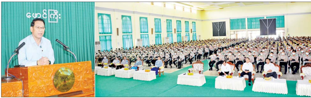
ပြည်ထောင်စုဝန်ကြီး ဦးမောင်မောင်အုန်း နိုင်ငံ့ဝန်ထမ်းတက္ကသိုလ်(အောက်မြန်မာပြည်)ဖောင်ကြီးရှိ နိုင်ငံ့ဝန်ထမ်းသင်တန်းသား သင်တန်းသူများအား တားဆီးကာကွယ်မီဒီယာအဆိပ်သင့်အန္တရာယ်နှင့် နိုင်ငံတော်တည်ဆောက်ရေးနှင့် မီဒီယာ၏အခန်းကဏ္ဍ ခေါင်းစဉ်ဖြင့် ဆွေးနွေးပြောကြားစဉ်။

နေပြည်တော် ဖေဖော်ဝါရီ ၁၉ ပြန်ကြားရေး ဝန်ကြီးဌာန ပြည်ထောင်စုဝန်ကြီး ဦးမောင် မောင်အုန်းသည် ယနေ့နံနက်ပိုင်း တွင် နိုင်ငံ့ဝန်ထမ်းတက္ကသိုလ် (အောက်မြန်မာပြည်)ရှိ ရတနာ သိင်္ဃာန်းမ၌ တားဆီးကာကွယ် မီဒီယာအဆိပ်သင့်အန္တရာယ်နှင့် နိုင်ငံတော်တည်ဆောက်ရေးနှင့် မီဒီယာ၏အခန်းကဏ္ဍ ခေါင်းစဉ် ဖြင့်သင်တန်းသား သင်တန်းသူများ အား ဆွေးနွေးပြောကြားသည်။ ဦးစွာ တားဆီးကာကွယ်မီဒီယာ အဆိပ်သင့်အန္တရာယ်နှင့် နိုင်ငံ တော်တည်ဆောက်ရေးနှင့် မီဒီယာ ၏အခန်းကဏ္ဍ မှတ်တမ်းဗီဒီယို များကို ပြသသည်။ ထို့နောက်ပြည်ထောင်စုဝန်ကြီး က ဆွေးနွေးပြောကြားရာတွင်