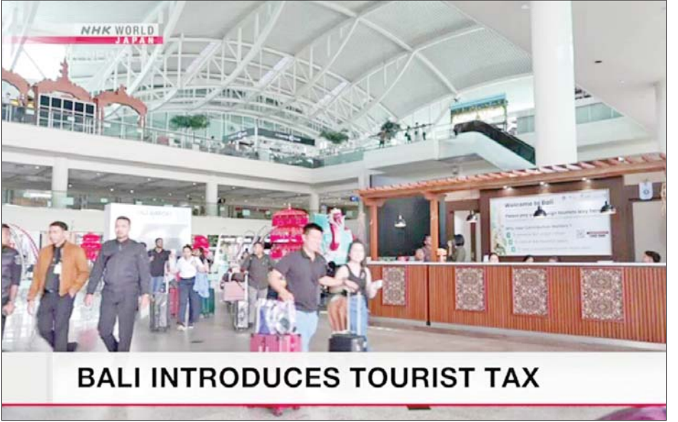
BALI INTRODUCES TOURIST TAX