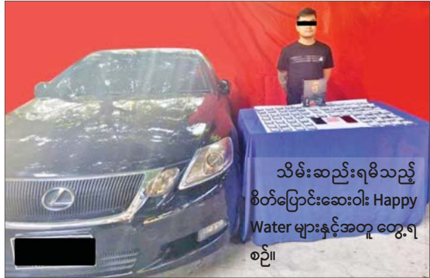
သိမ်းဆည်းရမိသည့် စိတ်ပြောင်းဆေးဝါး Happy Water များနှင့်အတူ တွေ့ရစဉ်။

သက်ဆိုင်ရာစခန်းများ၌ တရားဥပဒေနှင့်အညီ ဖမ်းဆီးထိန်းသိမ်း အမှုဖွင့်လှစ်အရေးယူခြင်းများ ဆောင်ရွက်ခဲ့သည်။ ထိုကဲ့သို့ CRPH၊ NUG နှင့် ယင်းတို့၏ လက်ဝေခံအဖွဲ့အစည်းများ၊ ယင်းတို့နှင့် ဆက်သွယ်နေသော အဖွဲ့အစည်းများ၊ လူပုဂ္ဂိုလ်များသည် နိုင်ငံတော်တည်ငြိမ်အေးချမ်းရေးကို ပျက်ပြားစေရန်နှင့် အစိုးရယန္တရားများ ပျက်ပြားစေရန် ရည်ရွယ်လျက် လှုံ့ဆော်ခြင်း၊ ဝါဒဖြန့်ခြင်းများ ပြုလုပ်ခဲ့မှုအပေါ် အားပေးကူညီခြင်းပြုလုပ်ခဲ့သူများအား ဥပဒေနှင့်အညီ ထိရောက်စွာ အရေးယူသွားမည်ဖြစ်ကြောင်း နှင့် ထိုသို့ လှုံ့ဆော်သူ၊ ဝါဒဖြန့်သူများအား ဆက်လက်ဖော်ထုတ်အရေးယူသွားမည်ဖြစ်ကြောင်း သိရသည်။ သတင်းစဉ်