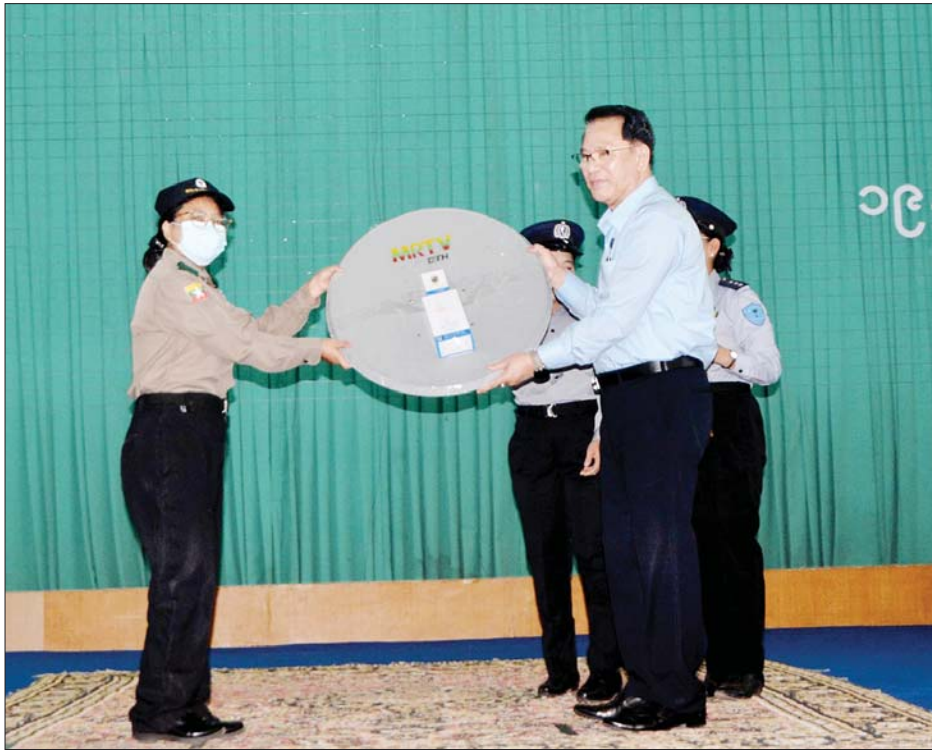
ပြည်ထောင်စုဝန်ကြီး ဦးမောင်မောင်အုန်း ကံစမ်းမဲပေါက်သည့် သင်တန်းသူတစ်ဦးအား MRTV DTH စလောင်း ပေးအပ်စဉ်။

အဆိုပါဆွေးနွေးပွဲသို့ ပြန်ကြား ရေးဝန်ကြီးဌာနမှ ညွှန်ကြားရေး မှူးချုပ်များ၊ နိုင်ငံ့ဝန်ထမ်း တက္ကသိုလ် (အောက်မြန်မာပြည်) ဖောင်ကြီးမှ ပါမောက္ခချုပ်နှင့် ဒုတိယပါမောက္ခချုပ်များ၊ ပါမောက္ခ များ၊ ဌာနမှူးများ၊ နိုင်ငံ့ဝန်ထမ်း တက္ကသိုလ်(အောက်မြန်မာပြည်) တွင် သင်တန်းတက်ရောက်နေ သော အရာထမ်းလောင်း(အထူး) သင်တန်းအမှတ်စဉ်(၁၁)၊ အရာ ထမ်းအခြေခံသင်တန်း အမှတ်စဉ် (၂၁၉)၊ စာရေးဝန်ထမ်းကြီးကြပ် သင်တန်းအမှတ်စဉ်(၉၄)နှင့် စာရေး ဝန်ထမ်းသင်တန်း အမှတ်စဉ် (၂၀၈)တို့မှ နိုင်ငံ့ဝန်ထမ်း သင်တန်းသား သင်တန်းသူဦးရေ စုစုပေါင်း ၈၆၀ တို့ တက်ရောက် ကြပြီး သင်တန်းကာလမှာ သင်တန်းအမှတ်စဉ် အလိုက် ရက်သတ္တ(၄ ပတ်မှ ၁၆ ပတ်)အထိ ကြာမြင့်မည်ဖြစ်ကြောင်း သိရ သည်။ သတင်းစဉ်