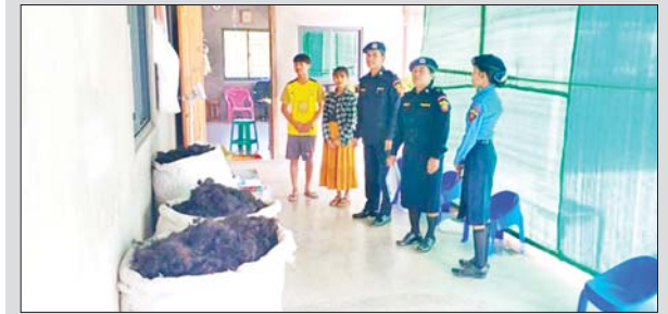
မိတ္ထီလာခရိုင် မီးသတ်ဦးစီးဌာနက ဖေဖော်ဝါရီ ၁၅ ရက်တွင် မိတ္ထီလာမြို့နယ် ကန်တောင်ကျေးရွာနှင့် ပျဉ်သာကျေးရွာတို့ရှိ ဆိပ် ရောင်းဝယ်ရေးအလုပ်ရုံအား မီးဘေးကြိုတင်ကာကွယ်ရေး လိုက်လံ စစ်ဆေးစဉ်။ ခရိုင်မီးသတ်