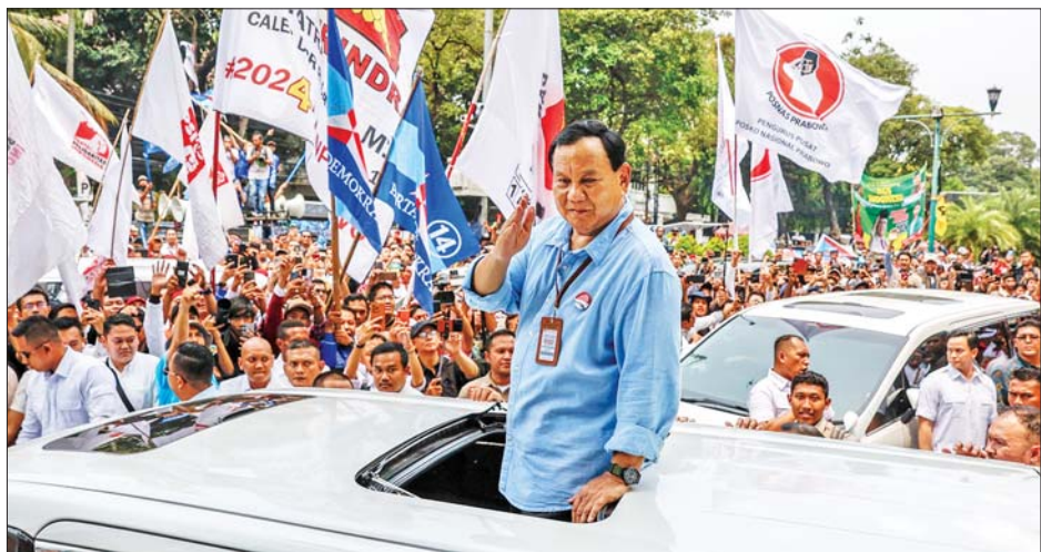
ဂျကာတာ နေရာပြောင်းရွှေ့ရေး အစီအစဉ်ကို တစ်စိတ်တစ်ပိုင်း ပြန်လည်သုံးသပ်ပြီး နိုင်ငံ၏ စီးပွားရေးကွာဟမှုကို ပြန်လည် ထိန်းကျောင်းပြုပြင်သွားမည်ဖြစ်ကြောင်း ကတိပြုခဲ့သည်။ ကိုးကား - ဆင်ဟွာ၊ အင်န်အိတ်ချီကေ ဘာသာပြန် - အောင်ကျော်ကျော်

လက်ရှိတွင် ဆန္ဒမဲ ၉၀ ရာခိုင်နှုန်းကို ရေတွက်ပြီးနောက် ပရာဘိုဝိုဆူဘီရန်တို့သည် ထောက်ခံမဲ ၅၈ ရာခိုင်နှုန်းကို ရရှိထားပြီး ၎င်း၏ပြိုင်ဘက် နှစ်ဦးဖြစ်သည့် အန်နီဘက်စ်ဝိဒန်နှင့် ဂျန်ဂျာပရာနိုတို့က ထောက်ခံမဲ ၂၅ ရာခိုင်နှုန်းနှင့် ၁၆ ဒေသ ၅ ရာခိုင်နှုန်း အသီးသီး ရရှိထားကြောင်း သိရသည်။ အင်ဒိုနီးရှားအမျိုးသား ရွေးကောက်ပွဲကော်မရှင်သည် ရွေးကောက်ပွဲ၏ တရားဝင်ရလဒ်များကို မတ်လလယ်တွင် ထုတ်ပြန်ကြေညာမည်ဖြစ်ကြောင်း သိရသည်။ ပရာဘိုဝိုက သမ္မတ ဂျိုကိုဝိဒိုဒို၏ မူဝါဒများကို ဆက်လက်အကောင်အထည်ဖော်ရန် ကတိပြုထားသည်။ ဂျန်ဂျာပရာနိုက သမ္မတဂျိုကိုဝိဒိုဒို၏ အဓိက မူဝါဒဖြစ်သည့် နိုင်ငံ၏မြို့တော်ကို နေရာရွှေ့ပြောင်းရန် စီစဉ်ထားကြောင်းလည်း ပြောကြားသည်။ အလားတူ အန်နီဘက်စ်ဝိဒန်က မြို့တော်