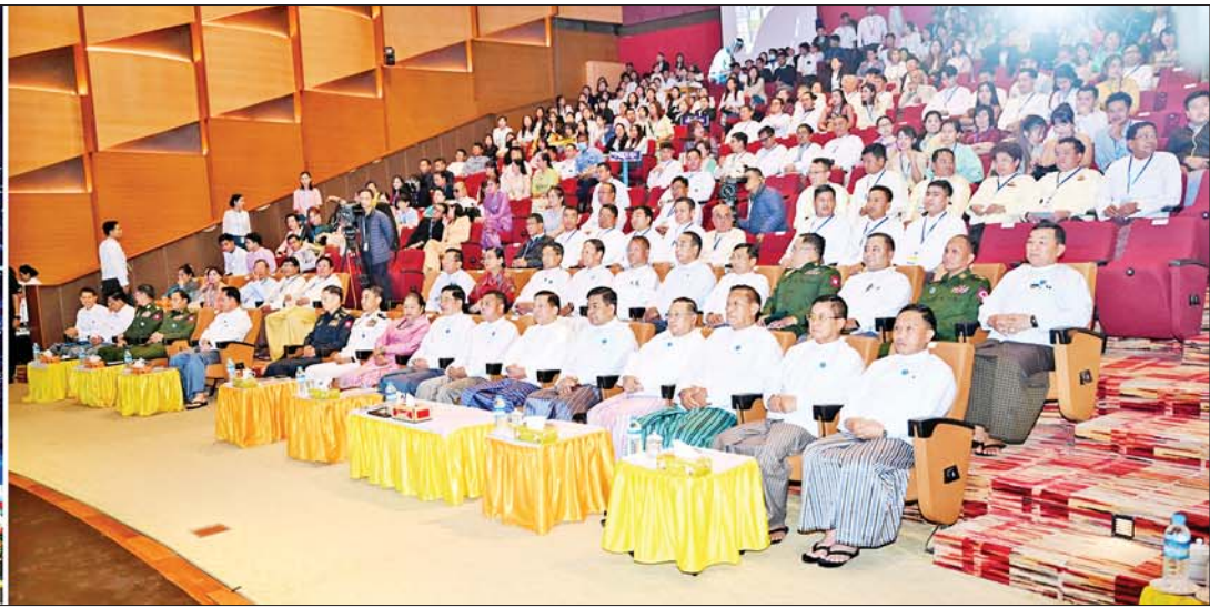
နိုင်ငံတော်စီမံအုပ်ချုပ်ရေးကောင်စီဥက္ကဋ္ဌ နိုင်ငံတော်ဝန်ကြီးချုပ် ဗိုလ်ချုပ်မှူးကြီးမင်းအောင်လှိုင်နှင့် အဖွဲ့ဝင်များ အနုပညာရှင်များ၏ ဖျော်ဖြေတင်ဆက်မှုများကို ကြည့်ရှုအားပေးစဉ်။