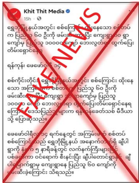
အကြမ်းဖက်သမားများက တိုက်ပွဲများတွင် ထိခိုက်သေဆုံးမှုများပြားနေခြင်းကြောင့် တိုက်ခိုက်လိုစိတ်များ

ဆောင်ရွက်လျက်ရှိသည့် လုံခြုံရေးပူးပေါင်းအဖွဲ့များကို PDF အမည်ခံ အကြမ်းဖက်သမားများက လက်နက်ကြီး၊ လက်နက်ငယ်များဖြင့် ပစ်ခတ်မှုကြောင့် ဖေဖော်ဝါရီ ၁၄ ရက်တွင် သင်တောကျေးရွာအနီး၌ တိုက်ပွဲဖြစ်ပွားခဲ့ပြီး လုံခြုံရေးပူးပေါင်းအဖွဲ့များ၏ ပြန်လည်တိုက်ခိုက်မှုကြောင့် အကြမ်းဖက်သမားများ ထိခိုက်သေဆုံးမှုများရှိခဲ့ကြောင်း မြေပြင်သတင်းပေးပို့ချက်များအရ သိရသည်။ တရားမဝင် ပြည်ပျက်မီဒီယာများအနေဖြင့် နိုင်ငံအတွင်း အလုံးစုံပျက်သုဉ်းရေးကို ဦးတည်လုပ်ဆောင်နေပြီး PDF အမည်ခံ အကြမ်းဖက်အဖွဲ့များ၏ အကြမ်းဖက်လုပ်ရပ်များကို ပြည်သူများအား သတင်းအမှောင်ချပြီး တစ်ဖက်သတ်စွဲစွဲရေးသားချက်များကိုသာ အမြဲထုတ်လွှင့်နေလျက်ရှိသည်။ ယခုဖြစ်စဉ်သည်လည်း PDF အမည်ခံ အကြမ်းဖက်အဖွဲ့များကို ပြည်သူများက ကြောက်ရွံ့ထိတ်လန့်လာပြီး လက်ခံနိုင်ခြင်းမရှိသည်ကို တန်ပြန်ဝါဒဖြန့်ဆောင်ရွက်ခြင်းနှင့် မြေပြင်တွင်လည်း PDF အမည်ခံ