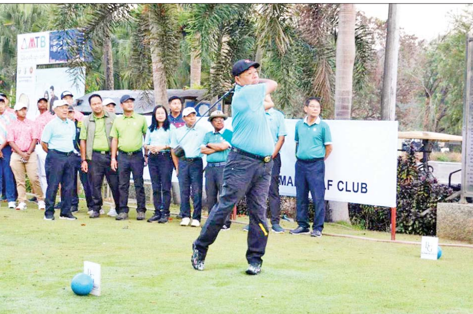
မြန်မာနိုင်ငံ ဂေါက်သီးအားကစားအဖွဲ့ချုပ် ဥက္ကဋ္ဌ ဦးကိုကိုအေး ဂေါက်သီးရိုက်၍ ပြိုင်ပွဲအားဖွင့်လှစ်ပေးစဉ်။

ရန်ကုန် ဖေဖော်ဝါရီ ၁၅ မြန်မာနိုင်ငံ ဂေါက်သီးအားကစားအဖွဲ့ချုပ်က ကြီးမှူးကျင်းပသော (President Cup) ဥက္ကဋ္ဌဖလား ဂေါက်သီးရိုက်ပြိုင်ပွဲ၏ မျိုးဆက်သစ် လူငယ်အဆင့် ပြိုင်ပွဲ ဖွင့်ပွဲအခမ်းအနားနှင့် ပထမနေ့ကို ဖေဖော်ဝါရီ ၁၅ ရက် နံနက်ပိုင်းက ရန်ကုန်မြို့ (၉)မိုင် ပြည်လမ်း ရှိ မြန်မာဂေါက်သီးရိုက်အသင်း၌ ကျင်းပရာ မြန်မာ နိုင်ငံဂေါက်သီးအားကစားအဖွဲ့ချုပ်၊ Junior Golf Myanmar (JGM)၊ မြန်မာဂေါက်သီးရိုက်အသင်းတို့မှ အမှုဆောင်အဖွဲ့ဝင်များ၊ ပြိုင်ပွဲဝင် အားကစားသမား များနှင့် ဖိတ်ကြားထားသူများ တက်ရောက်ကြသည်။ ရည်ရွယ်ကျင်းပ ဖွင့်ပွဲအခမ်းအနားတွင် မြန်မာနိုင်ငံ ဂေါက်သီး အားကစားအဖွဲ့ချုပ် နာယက ဦးအောင်ကြည်၊ ဥက္ကဋ္ဌ ဦးကိုကိုအေး၊ မြန်မာဂေါက်သီးရိုက်အသင်းဥက္ကဋ္ဌ ဒေါက်တာချိုထွန်း၊ Junior Golf Myanmar (JGM) ဥက္ကဋ္ဌ ဦးမြင့်အောင်၊ မြန်မာနိုင်ငံဂေါက်သီးအားကစား အဖွဲ့ချုပ် စာမျက်နှာ ၁၆ ကော်လံ ၁ သို့ *