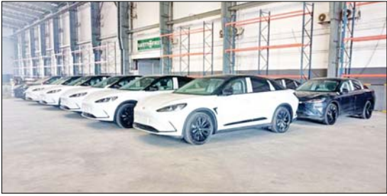
ရောက်ရှိလာသဖြင့် ယနေ့တွင် လုပ်ထုံးလုပ်နည်းနှင့်အညီ ထုတ်ယူခွင့်ပြုခဲ့ကြောင်း သိရသည်။ သတင်းစဉ်

အမျိုးသားအဆင့် လျှပ်စစ်သုံးယာဉ်နှင့် ဆက်စပ်လုပ်ငန်း များ ဖွံ့ဖြိုးတိုးတက်ရေးဦးဆောင်ကော်မတီ၏ ခွင့်ပြုချက်ဖြင့် Asia Pacific Automaker Corporation Co., Ltd. မှ တင်သွင်း လာသော တရုတ်နိုင်ငံထုတ် Dongfeng E70 အမျိုးအစား လျှပ်စစ်သုံးမော်တော်ယာဉ်များ၊ Aung Gabar Motor Services Co., Ltd. မှ တင်သွင်းလာသော တရုတ်နိုင်ငံထုတ် BAIC ARCFOX α S အမျိုးအစား လျှပ်စစ်သုံးမော်တော်ယာဉ်များနှင့် လျှပ်စစ်သုံးယာဉ်အားသွင်းစက်များ ရန်ကုန်ဆိပ်ကမ်းသို့