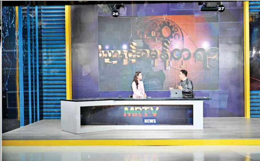
နိုင်ငံတော် စီမံအုပ်ချုပ်ရေးကောင်စီဥက္ကဋ္ဌ နိုင်ငံတော်ဝန်ကြီးချုပ် ဗိုလ်ချုပ်မှူးကြီးမင်းအောင်လှိုင် မြန်မာ့အသံနှင့် ရုပ်မြင်သံကြားအတွင်း ပြန်ကြားရေးနှင့် ထုတ်လွှင့်ရေးလုပ်ငန်းဆောင်ရွက်နေမှုများကို ကြည့်ရှုစဉ်။