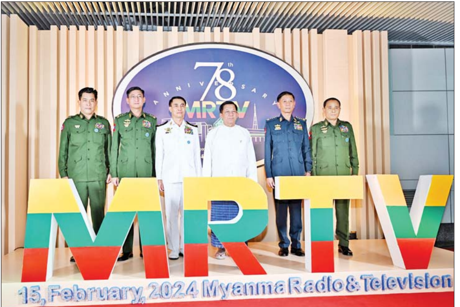
နိုင်ငံတော်စီမံအုပ်ချုပ်ရေးကောင်စီဥက္ကဋ္ဌ နိုင်ငံတော်ဝန်ကြီးချုပ် ဗိုလ်ချုပ်မှူးကြီးမင်းအောင်လှိုင် အခမ်းအနားတက်ရောက်လာကြသူများနှင့်အတူ စုပေါင်းမှတ်တမ်းတင် ဓာတ်ပုံရိုက်စဉ်။