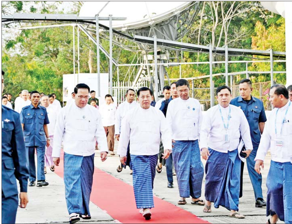
နိုင်ငံတော်စီမံအုပ်ချုပ်ရေးကောင်စီဥက္ကဋ္ဌ နိုင်ငံတော်ဝန်ကြီးချုပ် ဗိုလ်ချုပ်မှူးကြီးမင်းအောင်လှိုင် မြန်မာ့အသံနှင့် ရုပ်မြင်သံကြားအတွင်း လှည့်လည်ကြည့်ရှုစဉ်။

ယင်းနောက် နိုင်ငံတော်စီမံအုပ်ချုပ်ရေးကောင်စီဥက္ကဋ္ဌ နိုင်ငံတော်ဝန်ကြီးချုပ်အား ပြန်ကြားရေးဝန်ကြီးဌာန ပြည်ထောင်စုဝန်ကြီးက မြန်မာ့အသံနှင့်