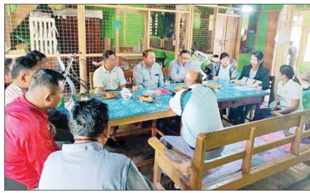
ကျင်းပသည်။ အဆိုပါယာဉ်လိုင်းများ အထူး ခရီးသွား အာမခံလုပ်ငန်းချုပ်ဆိုရာ တွင် ခရီးသွားပြည်သူများ အကျိုးငှာ ခရီးသွားပြည်သူတစ်ဦး လျှင် ပရီမီယံကျပ် ၃၀၀ ကျခံရပြီး ခရိုင်(ပြန်/ဆက်)

ရမည်းသင်း ဖေဖော်ဝါရီ ၁၅ မန္တလေး တိုင်းဒေသကြီး ရမည်းသင်းခရိုင် မြန်မာ့အာမခံ လုပ်ငန်းနှင့် ရမည်းသင်းမြို့ ရွှေစည်တော် အဆင့်မြင့်ခရီးသွား ပို့ဆောင်ရေးတို့သည် ခရီးသွား ပြည်သူတို့ အကျိုးပြုနိုင်ရန် အဝေး ပြေးအမြန်လမ်းမကြီးများဆိုင်ရာ ယာဉ်လိုင်းများ အထူးခရီးသွား အာမခံလုပ်ငန်း သဘောတူ စာချုပ် လက်မှတ်ရေးထိုးခြင်းကို ယမန်နေ့နံနက်က ရမည်းသင်းမြို့ မော်တော်ယာဉ် လိုင်းပေါင်းစုံရုံး၌