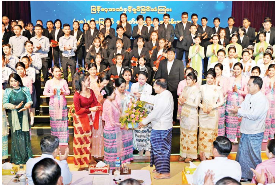
နိုင်ငံတော်စီမံအုပ်ချုပ်ရေးကောင်စီဥက္ကဋ္ဌ နိုင်ငံတော်ဝန်ကြီးချုပ် ဗိုလ်ချုပ်မှူးကြီးမင်းအောင်လှိုင် ဖျော်ဖြေတင်ဆက်ခဲ့ကြသည့် အနုပညာရှင်များနှင့် ဖျော်ဖြေရေးအဖွဲ့များအား ဂုဏ်ပြုပန်းခြင်း ပေးအပ်စဉ်။