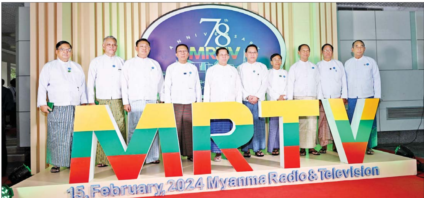
နိုင်ငံတော်စီမံအုပ်ချုပ်ရေးကောင်စီဥက္ကဋ္ဌ နိုင်ငံတော်ဝန်ကြီးချုပ် ဗိုလ်ချုပ်မှူးကြီးမင်းအောင်လှိုင် အခမ်းအနားတက်ရောက်လာကြသူများနှင့်အတူ စုပေါင်းမှတ်တမ်းတင်ဓာတ်ပုံရိုက်စဉ်။

နိုင်ငံတော်စီမံအုပ်ချုပ်ရေးကောင်စီအနေဖြင့်