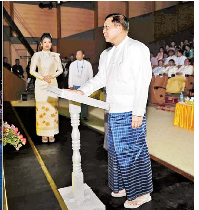
နိုင်ငံတော်စီမံအုပ်ချုပ်ရေးကောင်စီဥက္ကဋ္ဌ နိုင်ငံတော်ဝန်ကြီးချုပ် ဗိုလ်ချုပ်မှူးကြီးမင်းအောင်လှိုင် မြန်မာ့အသံနှင့်ရုပ်မြင်သံကြား DVB-T2 စနစ်တွင် HD Quality ရုပ်သံနှစ်လိုင်းမှ ကိုးလိုင်းတိုးချဲ့၍ ရုပ်သံလိုင်း ၁၁ လိုင်းဖြင့် အဆင့်မြှင့်တင်ထုတ်လွှင့်မှုနှင့် MRTV DTH Platform တွင် ရုပ်သံနှစ်လိုင်းမှ ၁၂ လိုင်းတိုးချဲ့၍ ရုပ်သံလိုင်း ၁၉ လိုင်းထုတ်လွှင့်မှုတို့အား စက်ခလုတ်နှိပ်ဖွင့်လှစ်ပေးစဉ်။