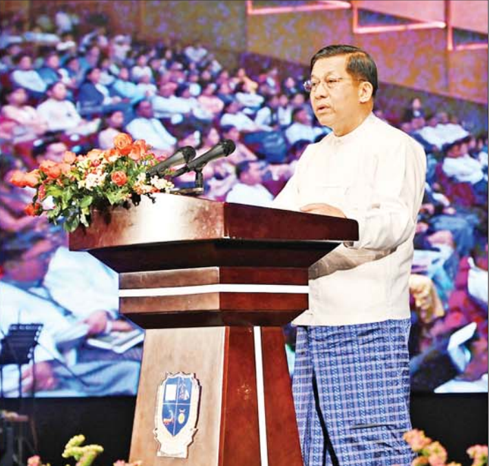
နိုင်ငံတော်စီမံအုပ်ချုပ်ရေးကောင်စီဥက္ကဋ္ဌ နိုင်ငံတော်ဝန်ကြီးချုပ် ဗိုလ်ချုပ်မှူးကြီးမင်းအောင်လှိုင် ပြန်ကြားရေးဝန်ကြီးဌာန မြန်မာ့အသံနှင့်ရုပ်မြင်သံကြား၏ (၇၈)နှစ်မြောက် နှစ်ပတ်လည်နေ့အခမ်းအနားတွင် အမှာစကား ပြောကြားစဉ်။

နေပြည်တော် ဖေဖော်ဝါရီ ၁၅ မြန်မာနိုင်ငံ၏ ပထမဦးဆုံးသော မီဒီယာဌာနကြီးတစ်ခုဖြစ်သည့် ပြန်ကြားရေးဝန်ကြီးဌာန မြန်မာ့အသံနှင့်ရုပ်မြင်သံကြား၏ (၇၈)နှစ် မြောက်နှစ်ပတ်လည်နေ့အခမ်းအနားကို ယနေ့မွန်းလွဲပိုင်းတွင် နေပြည်တော် တပ်ကုန်းမြို့ရှိ မြန်မာ့အသံနှင့် ရုပ်မြင်သံကြားရုံးချုပ်၌ ကျင်းပ