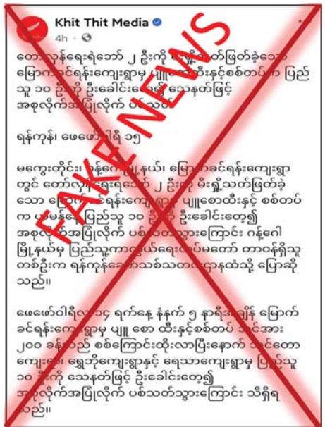
မရှိတော့သည့်အတွက် ထိုသို့ဝါဒဖြန့်မှုများ လုပ်ဆောင်ခြင်းသာဖြစ်ကြောင်း သိရသည်။ သတင်းစဉ်