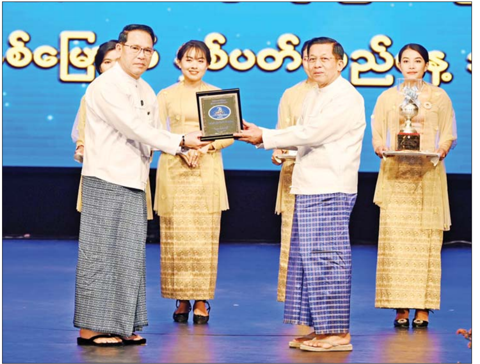
နိုင်ငံတော်စီမံအုပ်ချုပ်ရေးကောင်စီဥက္ကဋ္ဌ နိုင်ငံတော်ဝန်ကြီးချုပ် ဗိုလ်ချုပ်မှူးကြီးမင်းအောင်လှိုင် မြန်မာ့အသံနှင့်ရုပ်မြင်သံကြားအတွက် ဂုဏ်ပြုချီးမြှင့်ငွေများ ချီးမြှင့်ပေးအပ်စဉ်။