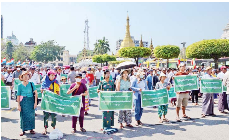
ရည်ရွယ်ချက်များကို အမျိုးသားရေးအင်အားစုမှ ထောက်ခံပါသည်ဟု တစ်ခဲနက် ဆန္ဒထုတ်ဖော်ကာ တာဝန်ရှိသူများက ဟောပြောဆွေးနွေးခြင်းများ ပြင်းချမ်းစွာ လူစုခွဲခဲ့ကြကြောင်း သိရသည်။ ဆောင်ရွက်ပြီး ပြည်သူ့စစ်မှုထမ်းဥပဒေအား ကြိုဆို သတင်းစဉ်

ယင်းနောက် မျိုးချစ်ပြည်သူများက နိုင်ငံတော် အလံအား အလေးပြုခြင်း၊ နိုင်ငံတော်သီချင်းအား သံပြိုင်သီဆိုခြင်း၊ ဇာတိမာန်သီချင်းအား သံပြိုင်သီဆို ခြင်း၊ ပြည်သူ့စစ်မှုထမ်းဥပဒေပြဋ္ဌာန်းရခြင်း၏