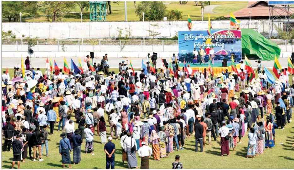
အောင်မြေသာစံမြို့နယ်၌ ပြည်သူ့စစ်မှုထမ်းဥပဒေအား ကြိုဆိုထောက်ခံပွဲပြုလုပ်စဉ်။