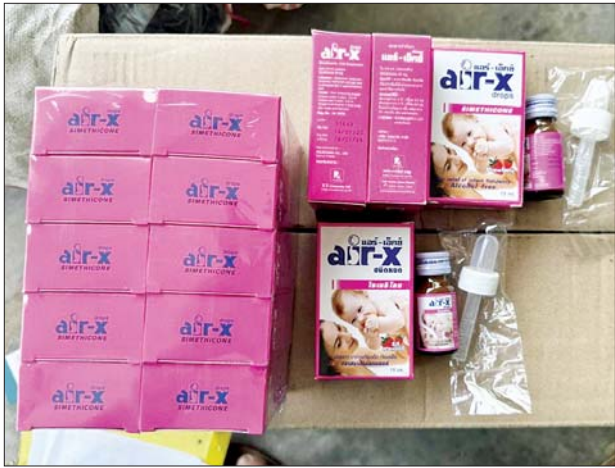
ပဲခူးတိုင်းဒေသကြီး၌ သိမ်းဆည်းရမိမှု မှတ်တမ်းဓာတ်ပုံ။

တရားမဝင်ကုန်သွယ်မှုတိုက်ဖျက်ရေး ဦးဆောင်ကော်မတီ၏ ကြီးကြပ်ကွပ်ကဲမှုဖြင့် တရားမဝင်ကုန်သွယ်မှုများကို ဥပဒေနှင့်အညီ ထိရောက်စွာ တားဆီးအရေးယူနိုင်ရေး ဆောင်ရွက်လျက်ရှိရာ ဧရာဝတီ တိုင်းဒေသကြီး တရားမဝင်ကုန်သွယ်မှုတိုက်ဖျက်ရေး အထူးအဖွဲ့၏ စီမံခန့်ခွဲမှုဖြင့် တာဝန်ကျပူးပေါင်းအဖွဲ့များက စစ်ဆေးမှုများဆောင်ရွက် ခဲ့ရာ ဖေဖော်ဝါရီ ၉ ရက်တွင် မြန်အောင်ခရိုင် အင်္ဂုမြို့နယ်အတွင်း၌ တရားမဝင် ကျွန်းသစ် သူညီ ဒသမ ၅၈၆ တန် (ခန့်မှန်းတန်ဖိုးငွေကျပ် ၄၂၅၀၀) နှင့် ပုသိမ်ခရိုင် ပုသိမ်မြို့နယ်အတွင်း၌ တရားမဝင် အခြားသစ် ၅ ဒသမ ၃၇၅ တန် (ခန့်မှန်းတန်ဖိုးငွေကျပ် ၃၁၇၃၅၆ ကျပ်)ကို လည်းကောင်း၊ ဖေဖော်ဝါရီ ၁၀ ရက်တွင် ပုသိမ်ခရိုင် ပုသိမ်မြို့နယ်အတွင်း၌ တရားမဝင် အခြားသစ် သူညီ ဒသမ ၆၉၇ တန် (ခန့်မှန်းတန်ဖိုးငွေကျပ် ၃၄၈၆၀၀)နှင့် မအူပင်ခရိုင် ညောင်တုန်းမြို့နယ်၌ တရားမဝင်အခြားသစ် ၆ ဒသမ ၀၁၀ တန် (ခန့်မှန်းတန်ဖိုးငွေကျပ် ၄၂၀၇၂၈ ကျပ်)ကို လည်းကောင်း စုစုပေါင်းခန့်မှန်းတန်ဖိုးငွေကျပ် ၁၁၂၉၁၈၄ ကျပ်ကို သိမ်းဆည်း ရမိခဲ့ပြီး သစ်တောဥပဒေနှင့်အညီ အရေးယူဆောင်ရွက်လျက်ရှိသည်။