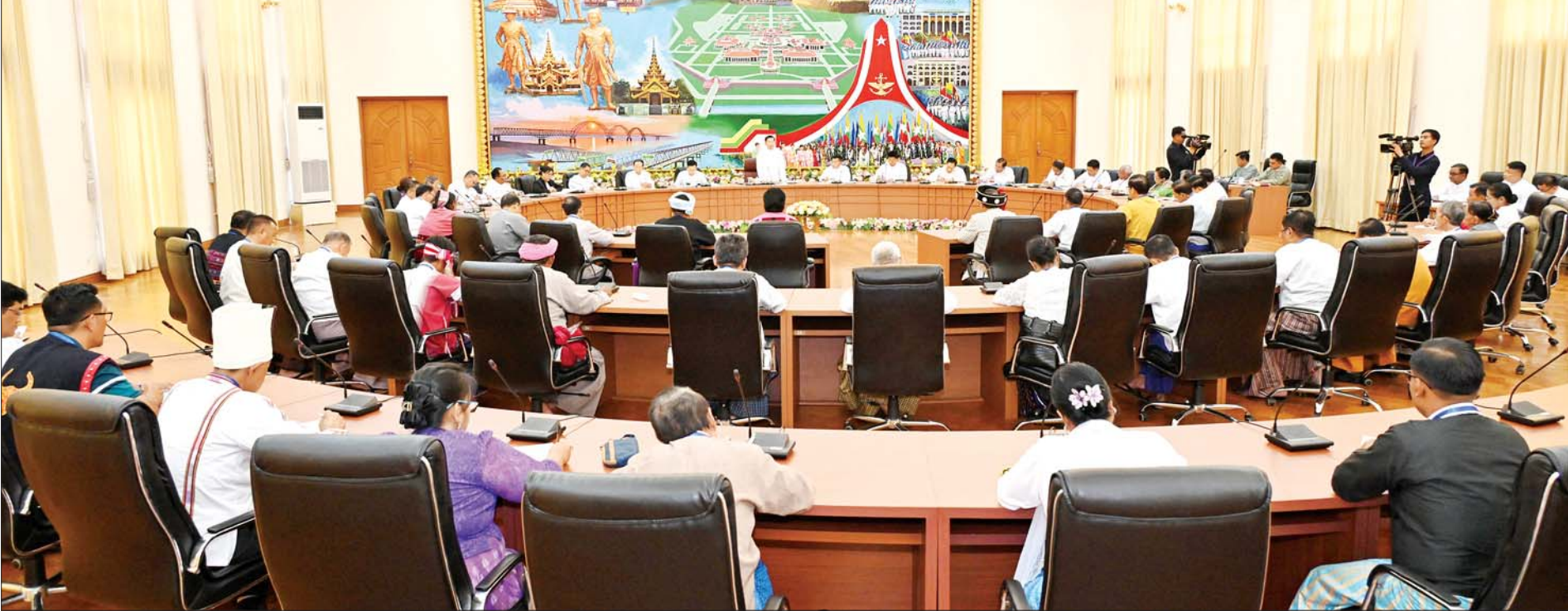
နိုင်ငံတော်စီမံအုပ်ချုပ်ရေးကောင်စီဥက္ကဋ္ဌ နိုင်ငံတော်ဝန်ကြီးချုပ် ဗိုလ်ချုပ်မှူးကြီး မင်းအောင်လှိုင် မှတ်ပုံတင်ခွင့်ပြုပြီး နိုင်ငံရေးပါတီများမှ တာဝန်ရှိသူများနှင့် တွေ့ဆုံဆွေးနွေးစဉ်။