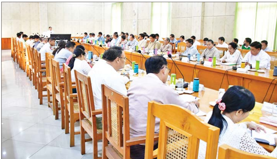
မျိုးကောင်းမျိုးသန့်များ၊ သွင်းအားစုများ၊ စိုက်ပျိုးရေးဖော်ဆောင်နိုင်ရေးအတွက် တောင်သူများအား အသိပညာပေးခြင်းလုပ်ငန်းများ၊ ကုန်ထုတ်ကဏ္ဍတိုးမြှင့်ထုတ်လုပ်နိုင်ရေးအတွက် အသိပညာပေးလုပ်ငန်းများ စနစ်တကျသုံးစွဲပြီး ပန်းတိုင်အထွက်နှုန်းများ တိုးတက်ထွက်ရှိရေး၊ အဆင့်မြင့်လယ်ယာများ

ဦးစွာနေပြည်တော်ကောင်စီဥက္ကဋ္ဌ ဦးသန်းထွန်းဦးက စပါးအပါအဝင် သီးနှံအထွက်နှုန်းများ တိုးတက်ရေးအတွက် မိရိုးဖလာစိုက်ပျိုးနည်းမှ သိပ္ပံနည်းကျ စိုက်ပျိုးနည်းစနစ်များ မှန်ကန်စွာစိုက်ပျိုးနိုင်ရေး