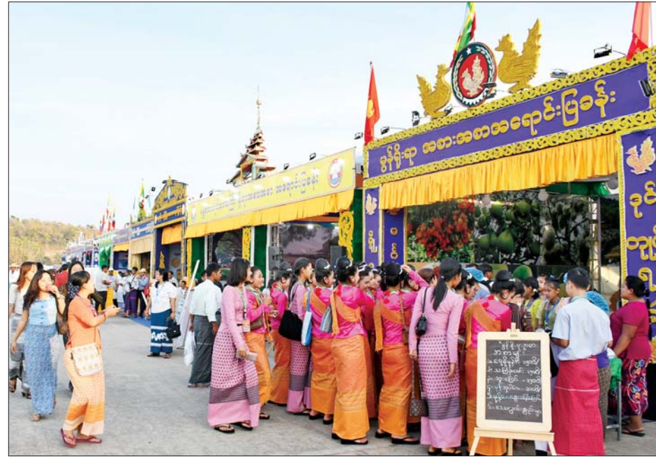
လေ့လာကြည့်ရှုကြသည့် ပြည်သူများကလည်း တိုင်းရင်းသားရိုးရာယဉ်ကျေးမှုအဖွဲ့များနှင့် အတူပါဝင်ဆင်နွှဲကြသည်ကိုလည်း တွေ့ရသည်။ ပြခန်းများအတွင်း ရိုးရာယဉ်ကျေးမှုဆိုင်ရာ ဗဟုသုတများ၊ ဒေသန္တရဗဟုသုတများ၊ တိုင်းဒေသကြီးနှင့် ပြည်နယ်အလိုက် အထင်ကရနေရာများ၊ ဒေသတွင်းလူမှုစီးပွားဘဝဖွံ့ဖြိုးတိုးတက်ရေးဆောင်ရွက်ချက်များနှင့် ဒေသအလိုက် ရိုးရာအစားအစာများနှင့် MSME ထုတ်ကုန်များအကြောင်းကို အသိပညာဗဟုသုတရရှိအောင် ခင်းကျင်းပြသထားမှုကို ဝင်ရောက်လေ့လာ ကြည့်ရှုကြသူများဖြင့်လည်း စည်ကားလျက်ရှိသည်ကို တွေ့ရသည်။

စိတ်ဝင်စားစွာဖြင့် လာရောက်လေ့လာခဲ့ကြရာ ပြခန်းအလိုက် တာဝန်ရှိသူများက MSME လုပ်ငန်းများ ဖွံ့ဖြိုးတိုးတက်ရေးအတွက် သတင်း အချက်အလက်နှင့် နည်းပညာများ မျှဝေပေးခြင်း၊ ပြည်တွင်း/ပြည်ပ ဈေးကွက်များသို့ မိမိတို့လုပ်ကိုင်နေသည့် လုပ်ငန်းများအလိုက် လက်လှမ်းမီစေရန်နှင့် ယှဉ်ပြိုင်နိုင်မှုစွမ်းရည်မြှင့်တင်ရေးအတွက် စေ့စပ်လုပ်ငန်းများအလိုက် ကြံတွေ့ရမည့်အခက်အခဲများနှင့် ဖြေရှင်းဆောင်ရွက်နည်းများကို အသိပညာပေးဆွေးနွေးမှုဝေပေးကြရာ လုပ်ငန်းရှင်များအပြင် အသိပညာဗဟုသုတရရှိလိုသည့် ပြည်သူများဖြင့်လည်း စည်ကားခဲ့သည်။