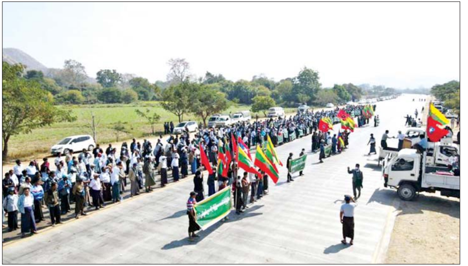
ကျောက်ဆည်မြို့၌ ပြည်သူ့စစ်မှုထမ်းဥပဒေအား ကြိုဆိုထောက်ခံပွဲပြုလုပ်စဉ်။