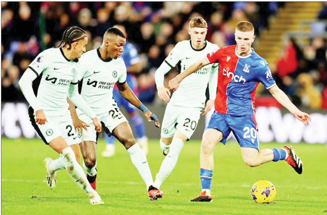
ခရစ္စတယ်ပဲလေ့စ်အသင်းနှင့် ချယ်လ်ဆီးအသင်းတို့ ယှဉ်ပြိုင်ကစားကြစဉ်။