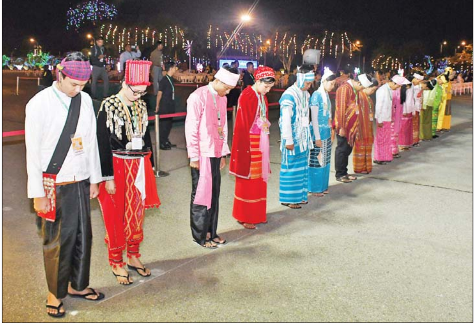
(၇၇) နှစ်မြောက် ပြည်ထောင်စုနေ့ နိုင်ငံတော်အလံတင်အခမ်းအနားတွင် တိုင်းရင်းသား တိုင်းရင်းသူများ နိုင်ငံတော်အလံအား အလေးပြုကြစဉ်။

ဆက်လက်၍ နိုင်ငံတော်စီမံအုပ်ချုပ်ရေးကောင်စီ ဒုတိယ ဥက္ကဋ္ဌသည် တက်ရောက်လာကြသူများနှင့်အတူ ပြည်ထောင်စု သမ္မတမြန်မာနိုင်ငံတော်အလံကို အလေးပြုရာ ဂုဏ်ပြုတပ်ဖွဲ့က