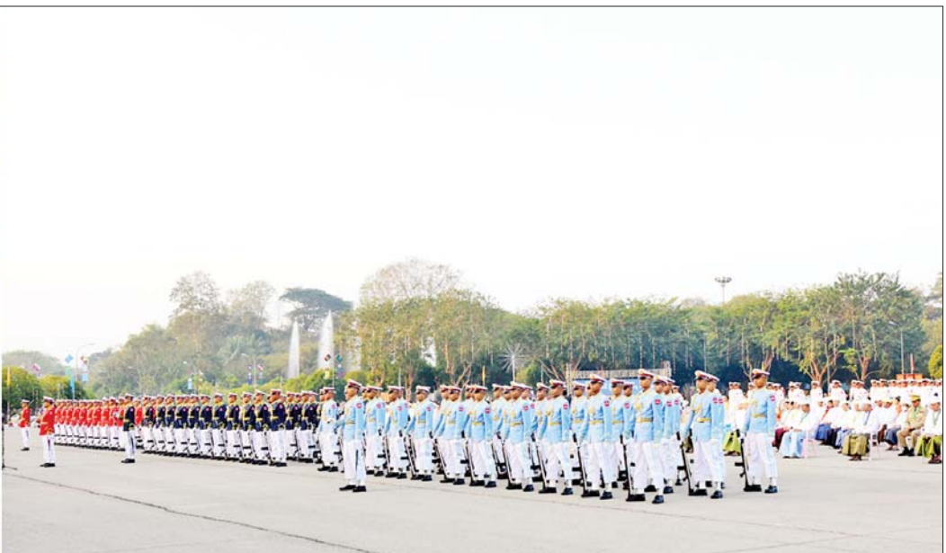
နိုင်ငံတော်စီမံအုပ်ချုပ်ရေးကောင်စီဥက္ကဋ္ဌ နိုင်ငံတော်ဝန်ကြီးချုပ် ဗိုလ်ချုပ်မှူးကြီး သတိုးမဟာသရေစည်သူ သတိုးသီရိပျံချို မင်းအောင်လှိုင်ထံမှ ပေးပို့သည့် (၇၇)နှစ်မြောက် ပြည်ထောင်စုနေ့သဝဏ်လွှာကို နိုင်ငံတော်စီမံအုပ်ချုပ်ရေးကောင်စီ ဒုတိယဥက္ကဋ္ဌ ဒုတိယဝန်ကြီးချုပ် ဒုတိယဗိုလ်ချုပ်မှူးကြီး သီရိပျံချို မဟာသရေစည်သူ စိုးဝင်းက ဖတ်ကြားစဉ်။

နေပြည်တော် ဖေဖော်ဝါရီ ၁၂ ၂၀၂၄ ခုနှစ် (၇၇)နှစ်မြောက် ပြည်ထောင်စုနေ့ နိုင်ငံတော်အလံတင် အခမ်းအနားနှင့် နိုင်ငံတော်အလံအလေးပြုပွဲ အခမ်းအနားကို ယနေ့နံနက်ပိုင်းတွင် နေပြည်တော် မြို့တော်ခန်းမ ဥပစာရင်ပြင်၌ ကျင်းပရာ နိုင်ငံတော်စီမံအုပ်ချုပ်ရေးကောင်စီ ဒုတိယဥက္ကဋ္ဌ ဒုတိယဝန်ကြီးချုပ် ဒုတိယဗိုလ်ချုပ်မှူးကြီး သီရိပျံချို မဟာသရေစည်သူ စိုးဝင်း တက်ရောက်၍ နိုင်ငံတော်စီမံအုပ်ချုပ်ရေးကောင်စီဥက္ကဋ္ဌ နိုင်ငံတော်ဝန်ကြီးချုပ် ဗိုလ်ချုပ်မှူးကြီး သတိုးမဟာသရေစည်သူ သတိုးသီရိပျံချို မင်းအောင်လှိုင်ထံမှ ပေးပို့သော ပြည်ထောင်စုနေ့သဝဏ်လွှာကို ဖတ်ကြားသည်။