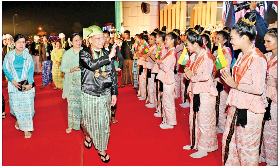
နိုင်ငံတော်စီမံအုပ်ချုပ်ရေးကောင်စီဥက္ကဋ္ဌ နိုင်ငံတော်ဝန်ကြီးချုပ် ဗိုလ်ချုပ်မှူးကြီး သတိုးမဟာသရေစည်သူ သတိုးသီရိသုဓမ္မ မင်းအောင်လှိုင်နှင့် ဇနီး ဒေါ်ကြူကြူလှတို့ (၇၇)နှစ်မြောက် ပြည်ထောင်စုနေ့အထိမ်းအမှတ် ဂုဏ်ပြုညစာစားပွဲတွင် ကပြဖျော်ဖြေခဲ့ကြသည့် တိုင်းရင်းသားရိုးရာယဉ်ကျေးမှုအဖွဲ့များကို ဂုဏ်ပြုပန်းခြင်းပေးအပ်ပြီး ရင်းရင်းနှီးနှီးနှုတ်ဆက်စဉ်။