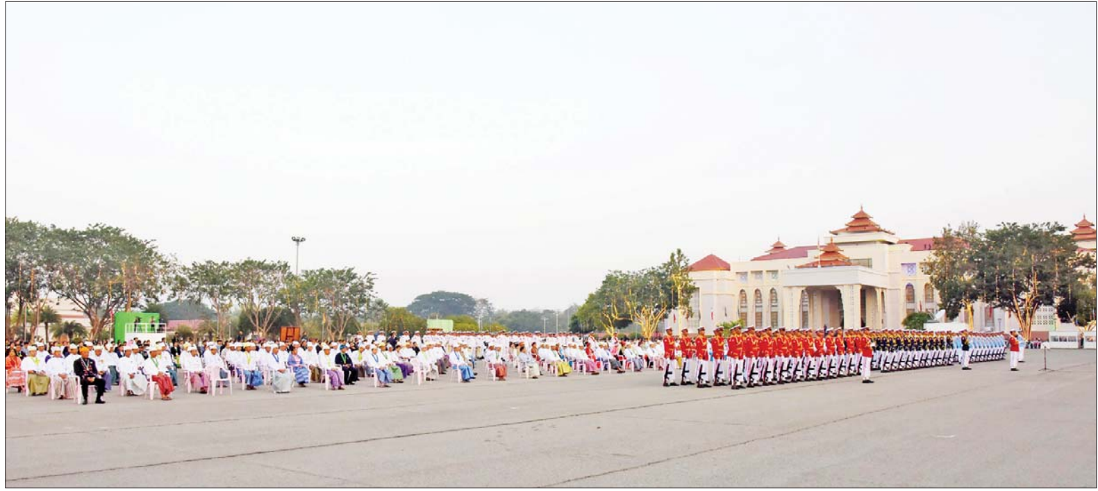
(၇၇)နှစ်မြောက် ပြည်ထောင်စုနေ့ နိုင်ငံတော်အလံအလေးပြုပွဲအခမ်းအနားသို့ တက်ရောက်လာကြသူများကို တွေ့ရစဉ်။

အတွက် တိုင်းရင်းသားပြည်သူအားလုံးက ဝိုင်းဝန်းကြိုးပမ်းဆောင်ရွက်ရေး၊ ခေတ်မီဖွံ့ဖြိုးတိုးတက်သော နိုင်ငံတော်ဖြစ်ပေါ်လာရေးနှင့် ဒီမိုကရေစီနှင့် ဖက်ဒရယ်စနစ်ကို အခြေခံသည့် ပြည်ထောင်စုကြီးပေါ်ထွန်းလာရေး၊ တိုင်းရင်းသားအားလုံး ဝိုင်းဝန်းဆောင်ရွက်ရေးဟူသည့် အမျိုးသားရေး ဦးတည်ချက် (၅) ရပ်ဖြင့် အနှစ်သာရပြည့်ဝစွာကျင်းပခြင်း ဖြစ်သည်။