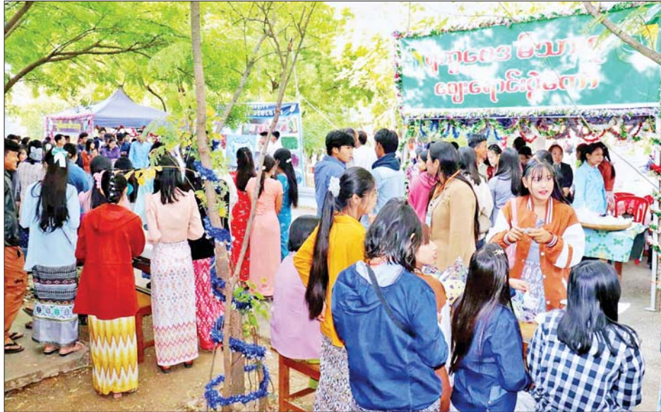
ပခုက္ကူတက္ကသိုလ်၌ (၇၇)နှစ်မြောက်ပြည်ထောင်စုနေ့အထိမ်းအမှတ် အထူးပြုဘာသာရပ်ပေါင်းစုံ ဈေးရောင်းပွဲတော် ကျင်းပစဉ်။