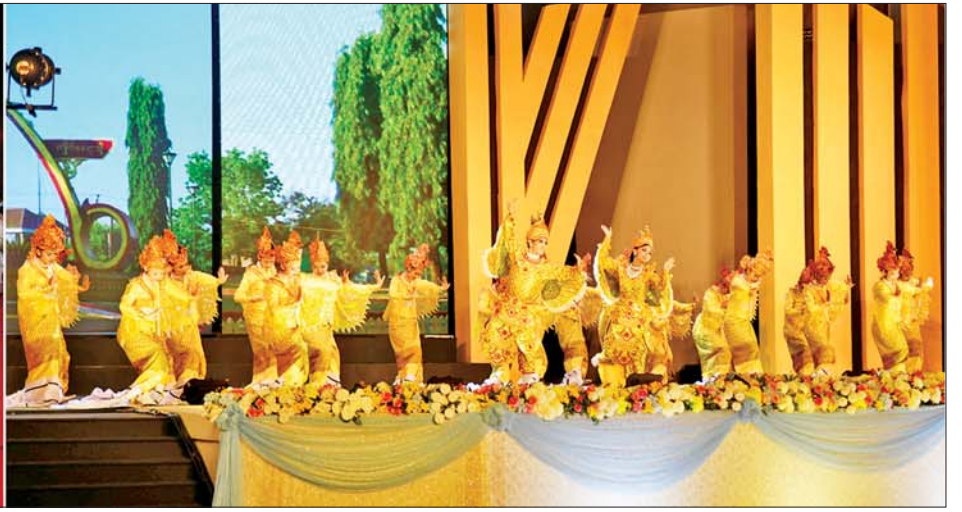
နိုင်ငံတော်စီမံအုပ်ချုပ်ရေးကောင်စီဥက္ကဋ္ဌ နိုင်ငံတော်ဝန်ကြီးချုပ် ဗိုလ်ချုပ်မှူးကြီး သတိုးမဟာသရေစည်သူ သတိုးသီရိသုဓမ္မ မင်းအောင်လှိုင်နှင့် ဇနီး ဒေါ်ကြူကြူလှတို့ (၇၇)နှစ်မြောက် ပြည်ထောင်စုနေ့အထိမ်းအမှတ် ဂုဏ်ပြုညစာစားပွဲသို့ တက်ရောက်လာကြသူများနှင့်အတူ တိုင်းရင်းသားရိုးရာယဉ်ကျေးမှုအဖွဲ့များ၏ တိုင်းရင်းသားရိုးရာအကပဒေသာများဖြင့် ဖျော်ဖြေတင်ဆက်မှုများကို ကြည့်ရှုအားပေးစဉ်။