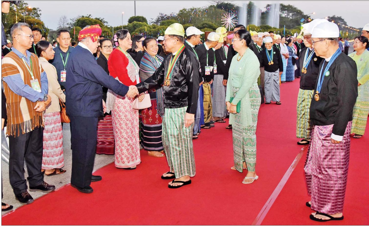
နိုင်ငံတော်စီမံအုပ်ချုပ်ရေးကောင်စီဥက္ကဋ္ဌ နိုင်ငံတော်ဝန်ကြီးချုပ် ဗိုလ်ချုပ်မှူးကြီး သတိုးမဟာသရေစည်သူ သတိုးသီရိသုဓမ္မ မင်းအောင်လှိုင်နှင့် ဇနီး ဒေါ်ကြူကြူလှတို့ (၇၇)နှစ်မြောက် ပြည်ထောင်စုနေ့အထိမ်းအမှတ် ဂုဏ်ပြုညစာစားပွဲသို့ တက်ရောက်လာကြသည့် NCA စာချုပ် လက်မှတ်ရေးထိုးထားသည့် တိုင်းရင်းသားလက်နက်ကိုင် အဖွဲ့အစည်းများမှ ခေါင်းဆောင်များနှင့် ကိုယ်စားလှယ်များအား ရင်းရင်းနှီးနှီး နှုတ်ဆက်စဉ်။

နေပြည်တော် ဖေဖော်ဝါရီ ၁၂ ပြည်ထောင်စုသမ္မတမြန်မာနိုင်ငံတော် နိုင်ငံတော်စီမံအုပ်ချုပ်ရေးကောင်စီဥက္ကဋ္ဌ နိုင်ငံတော်ဝန်ကြီးချုပ် ဗိုလ်ချုပ်မှူးကြီး သတိုးမဟာသရေစည်သူ သတိုးသီရိသုဓမ္မ မင်းအောင်လှိုင်နှင့် ဇနီးဒေါ်ကြူကြူလှတို့က တည်ခင်းဧည့်ခံသည့် ၂၀၂၄ ခုနှစ် (၇၇)နှစ်မြောက် ပြည်ထောင်စုနေ့ အထိမ်းအမှတ်ဂုဏ်ပြုညစာစားပွဲ အခမ်းအနားကို ယနေ့ညပိုင်းတွင် နေပြည်တော်ရှိမြို့တော်ခန်းမ ဥပစာရင်ပြင်၌ ကျင်းပသည်။ ဦးစွာ နိုင်ငံတော်စီမံအုပ်ချုပ်ရေးကောင်စီဥက္ကဋ္ဌ နိုင်ငံတော်ဝန်ကြီးချုပ် ဗိုလ်ချုပ်မှူးကြီး သတိုးမဟာသရေစည်သူ သတိုးသီရိသုဓမ္မ မင်းအောင်လှိုင်နှင့် ဇနီး ဒေါ်ကြူကြူလှတို့သည် ညနေ ၆ နာရီတွင် ဂုဏ်ပြုညစာစားပွဲ အခမ်းအနားကျင်းပမည့် မြို့တော်ခန်းမ ဥပစာရင်ပြင်သို့ ရောက်ရှိကြရာ နိုင်ငံတော်စီမံအုပ်ချုပ်ရေးကောင်စီ ဒုတိယဥက္ကဋ္ဌ ဒုတိယဝန်ကြီးချုပ် ဒုတိယဗိုလ်ချုပ်မှူးကြီး သီရိပျံချီ မဟာသရေစည်သူ စိုးဝင်းနှင့် ဇနီး ဒေါ်သန်းသန်းနွယ်၊ ပြည်ထောင်စုရွေးကောက်ပွဲကော်မရှင်ဥက္ကဋ္ဌ ဦးကိုကိုနှင့် ဇနီး၊ ပြည်ထောင်စုဝန်ကြီးများနှင့် ဇနီးများ၊ နေပြည်တော်ကောင်စီဥက္ကဋ္ဌဦးသန်းထွန်း၊ ဦးနှင့်ဇနီးတို့က ကြိုဆိုနှုတ်ဆက်ကြသည်။ စာမျက်နှာ ၃ ကော်လံ ၁ သို့ ၀