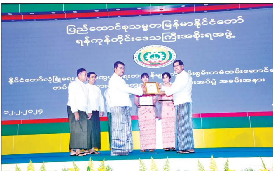
အဆိုပါအခမ်းအနားတွင် စေတနာရှင်၊ အလှူရှင် ၅၀၅ ဦး၏ အလှူငွေစုစုပေါင်းမှာ စေတနာရှင်၊ အလှူရှင် ၉၉ ဦး၏ လှူဒါန်းငွေကျပ် ၁၀၀၀၂၇၀၀၀ လက်ခံရရှိခဲ့ကြောင်းနှင့် ၁၁၂၇၂၅၆၀၀ဖြစ်ကြောင်း သိရသည်။ သတင်းစဉ်

များမှ တာဝန်ရှိသူများနှင့် စေတနာရှင်၊ အလှူရှင်များ တက်ရောက်ကြသည်။ ထို့နောက် ရန်ကုန်တိုင်းဒေသကြီးအစိုးရအဖွဲ့၊ ရန်ကုန်မြို့တော် စည်ပင်သာယာရေးကော်မတီ၊ တိုင်းဒေသကြီးသယံဇာတရေးရာဝန်ကြီးဌာန၊ ဌာန ဆိုင်ရာများ၊ တိုင်းဒေသကြီးအမျိုးသမီးရေးရာအဖွဲ့၊ ခရိုင်၊ မြို့နယ် အထွေထွေအုပ်ချုပ်ရေးအဖွဲ့ရုံးများ၊ လူမှုရေးအသင်းအဖွဲ့များနှင့် ကုမ္ပဏီများမှ စေတနာ ရှင် အလှူရှင်များက အလှူငွေများပေးအပ်လှူဒါန်း ကြရာ တိုင်းဒေသကြီးဝန်ကြီးချုပ်နှင့် တိုင်းမှူးတို့က လက်ခံရယူပြီး ဂုဏ်ပြုမှတ်တမ်းလွှာများ ပြန်လည် ပေးအပ်၍ တိုင်းဒေသကြီးဝန်ကြီးချုပ်က ကျေးဇူးတင် စကားပြောကြားသည်။