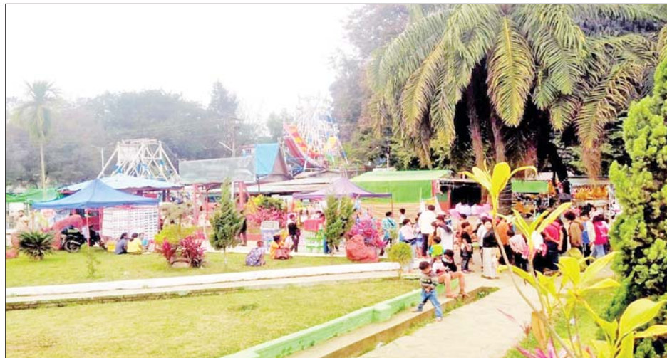
လားရှိုးမြို့၌ (၇၇)နှစ်မြောက် ပြည်ထောင်စုနေ့တွင် အပန်းဖြေအနားယူကြသူများဖြင့် စည်ကားလျက်ရှိသည်ကို တွေ့ရစဉ်။