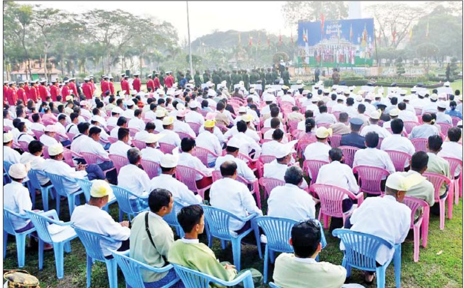
အရှေ့တောင်တိုင်းစစ်ဌာနချုပ်နယ်မြေ၌ (၇၇)နှစ်မြောက် ပြည်ထောင်စုနေ့အခမ်းအနား ကျင်းပစဉ်။