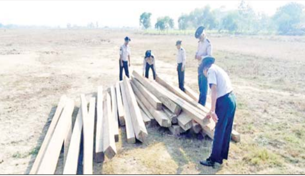
ပဲခူးတိုင်းဒေသကြီး တရားမဝင်ကုန်သွယ်မှုတိုက်ဖျက်ရေးအထူး အဖွဲ့ သစ်တောဦးစီးဌာနမှ သိမ်းဆည်းရမိမှု မှတ်တမ်းဓာတ်ပုံ။

နေပြည်တော် ဖေဖော်ဝါရီ ၁၂ တရားမဝင် ကုန်သွယ်မှု တိုက်ဖျက်ရေး ဦးဆောင်ကော်မတီ ၏ ကြီးကြပ်ကွပ်ကဲမှုဖြင့် တရား မဝင် ကုန်သွယ်မှုများကို ဥပဒေ နှင့်အညီ ထိရောက်စွာတားဆီး အရေးယူနိုင်ရေး ဆောင်ရွက် လျက်ရှိရာ ဖေဖော်ဝါရီ ၉ ရက် တွင် ရန်ကုန်တိုင်းဒေသကြီး တရားမဝင်ကုန်သွယ်မှုတိုက်ဖျက် ရေးအထူးအဖွဲ့၏ စီမံခန့်ခွဲမှုဖြင့် တာဝန်ကျ ပူးပေါင်းအဖွဲ့က စစ်ဆေးမှုများ ဆောင်ရွက်ရာ တွင် မင်္ဂလာဒုံမြို့နယ် စုစံ စက်သုံးဆီအရောင်းဆိုင်အနီး၌ တရားမဝင် ကျွန်းသစ် ၅ ဒဿမ ၀၈၆ တန် စုစုပေါင်း ခန့်မှန်းတန်ဖိုး ငွေကျပ် ၉၆၂၉၁၈ ကို သိမ်းဆည်း ရမိခဲ့ပြီး သစ်တောဥပဒေနှင့်အညီ အရေးယူ ဆောင်ရွက်လျက်ရှိ သည်။