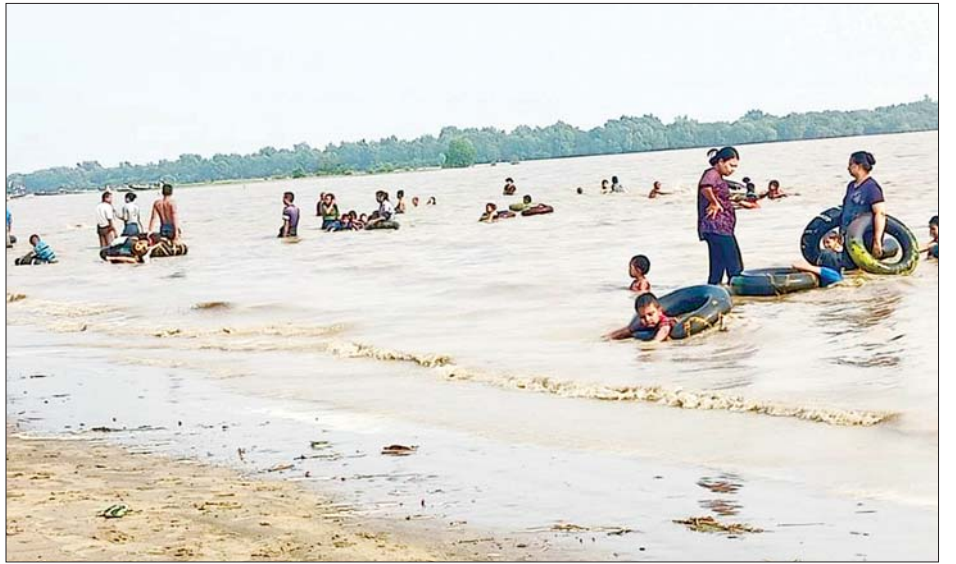
ဆယ်အိမ်တန်းကမ်းခြေ၌ လာရောက်အပန်းဖြေအနားယူကြသူများဖြင့် စည်ကားနေသည်ကို ရုံးပိတ်ရက်ကာလဖြစ်သော (၇၇)နှစ်မြောက် ပြည်ထောင်စုနေ့ ညနေပိုင်းက တွေ့ရစဉ်။