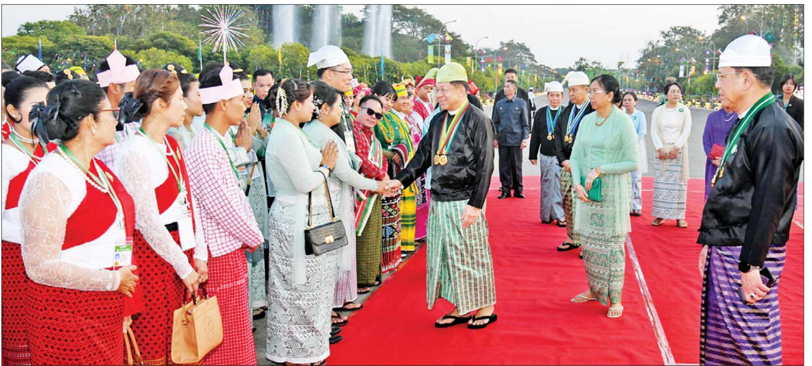
နိုင်ငံတော်စီမံအုပ်ချုပ်ရေးကောင်စီဥက္ကဋ္ဌ နိုင်ငံတော်ဝန်ကြီးချုပ် ဗိုလ်ချုပ်မှူးကြီး သတိုးမဟာသရေစည်သူ သတိုးသီရိသုဓမ္မ မင်းအောင်လှိုင်နှင့် ဇနီး ဒေါ်ကြူကြူလှတို့ (၇၇)နှစ်မြောက် ပြည်ထောင်စုနေ့အထိမ်းအမှတ် ဂုဏ်ပြုညစာစားပွဲသို့ တက်ရောက်လာကြသည့် တိုင်းဒေသကြီးနှင့် ပြည်နယ်များမှ တိုင်းရင်းသားရိုးရာယဉ်ကျေးမှုအဖွဲ့များအား ရင်းရင်းနှီးနှီးနှုတ်ဆက်စဉ်။

ထိုနောက် နိုင်ငံတော်စီမံအုပ်ချုပ်ရေးကောင်စီဥက္ကဋ္ဌ နိုင်ငံတော်ဝန်ကြီးချုပ်နှင့် ဇနီး၊ ကောင်စီဒုတိယဥက္ကဋ္ဌ ဒုတိယဝန်ကြီးချုပ်နှင့် ဇနီးတို့သည် ဂုဏ်ပြုညစာစားပွဲသို့ တက်ရောက်လာကြသည့် တိုင်းဒေသကြီးနှင့် ပြည်နယ်များမှ တိုင်းရင်းသားရိုးရာယဉ်ကျေးမှုအဖွဲ့များ၊ နိုင်ငံရေးပါတီများမှ ဥက္ကဋ္ဌများနှင့် ကိုယ်စားလှယ်များ၊ NCAစာချုပ် လက်မှတ်ရေးထိုးထားသည့် တိုင်းရင်းသားလက်နက်ကိုင်အဖွဲ့အစည်းများမှ ခေါင်းဆောင်များနှင့် ကိုယ်စားလှယ်များ၊ တိုင်းဒေသကြီးနှင့် ပြည်နယ်များမှ စီးပွားရေးရာ ဝန်ကြီးများနှင့် တိုင်းရင်းသားလူမျိုးရေးရာဝန်ကြီးများ၊ တိုင်းဒေသကြီးနှင့် ပြည်နယ်များမှ MSME လုပ်ငန်းရှင်များ၊ ကာကွယ်ရေး ဦးစီးချုပ်ရုံးမှ အဆင့်မြင့် တပ်မတော်အရာရှိကြီးများနှင့် ဇနီးများ၊ ပြည်ထောင်စုဝန်ကြီးများ၊ ပြည်ထောင်စုအဆင့်ပုဂ္ဂိုလ်များနှင့် ဇနီးများ၊ နိုင်ငံတော်စီမံအုပ်ချုပ်ရေးကောင်စီဝင်များနှင့် ဇနီးများ၊ ကောင်စီအတွင်းရေးမှူးနှင့် ဇနီးတို့ကို ရင်းရင်းနှီးနှီး လိုက်လံနှုတ်ဆက်ကြသည်။