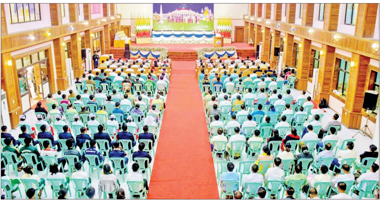
စစ်တွေမြို့၌ကျင်းပသည့် (၇၇)နှစ်မြောက် ပြည်ထောင်စုနေ့အခမ်းအနားတွင် နိုင်ငံတော်စီမံအုပ်ချုပ်ရေးကောင်စီဥက္ကဋ္ဌ နိုင်ငံတော်ဝန်ကြီးချုပ် ဗိုလ်ချုပ်မှူးကြီး သတိုးမဟာသရေစည်သူ သတိုးသီရိသုဗ္ဗ မင်းအောင်လှိုင်ထံမှ ၂၀၂၄ ခုနှစ် (၇၇)နှစ်မြောက် ပြည်ထောင်စုနေ့အခမ်းအနားသို့ပေးပို့သည့် သဝဏ်လွှာကို နိုင်ငံတော်စီမံအုပ်ချုပ်ရေးကောင်စီအဖွဲ့ဝင် ဒေါက်တာဘရွှေက ဖတ်ကြားစဉ်။

စစ်တွေ ဖေဖော်ဝါရီ ၁၂ (၇၇)နှစ်မြောက် ပြည်ထောင်စုနေ့အခမ်းအနားကို ယနေ့နံနက်ပိုင်းတွင် စစ်တွေမြို့ နိုင်ငံတော်စီမံအုပ်ချုပ်ရေးကောင်စီ အဖွဲ့ဝင် ဒေါက်တာဘရွှေ အားကစားနှင့် လူငယ်ရေးရာ ဝန်ကြီးဌာန ပြည်ထောင်စုဝန်ကြီး ဦးမင်းသိန်းဇံ၊ ရခိုင်ပြည်နယ်ဝန်ကြီးချုပ် ဦးထိန်လင်းနှင့်ဇနီး၊ တိုင်းရင်းသား လူမျိုးများရေးရာ ဝန်ကြီးဌာန ဒုတိယဝန်ကြီး ဦးဇော်အေးမောင်၊ သာသနာရေးနှင့် ယဉ်ကျေးမှု ဝန်ကြီးဌာန ဒုတိယဝန်ကြီး ဒေါ်နန္ဒာ၊ ပြည်နယ်အစိုးရအဖွဲ့ဝင် များ၊ ဌာနဆိုင်ရာများ၊ မြို့မ၊ မြို့ဖ များ၊ သင်တန်းသား သင်တန်းသူ များ၊ ဆရာ ဆရာမများ၊ ကျောင်း သား ကျောင်းသူများနှင့် ဖိတ်ကြား ထားသူများ တက်ရောက်ကြ သည်။