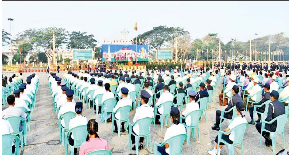
ရန်ကုန်တိုင်းဒေသကြီး၌ (၇၇)နှစ်မြောက် ပြည်ထောင်စုနေ့အခမ်းအနား ကျင်းပစဉ်။