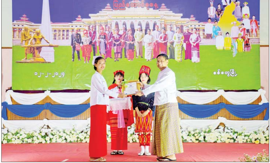
နိုင်ငံတော်စီမံအုပ်ချုပ်ရေးကောင်စီအဖွဲ့ဝင် ဒေါက်တာဘရွှေ အဆင့်မြင့်ပညာအဆင့် စာစီစာကုံး ပြိုင်ပွဲတွင် ဆုရရှိသူတစ်ဦးအား ဆုပေးအပ်ချီးမြှင့်စဉ်။

ဆက်လက်၍ ဒုတိယဝန်ကြီး ဦးဇော်အေးမောင်က ဝန်ထမ်းများ လိုက်နာဆောင်ရွက်ရမည့် ကိစ္စ များ လုံခြုံရေးကိစ္စများနှင့် ပတ်သက်၍ ရှင်းလင်းပြောကြား ပြီး ပြည်နယ်ဝန်ကြီးချုပ်က ပြည်နယ်အစိုးရအဖွဲ့မှ ပြည်ထောင်စု နိုင်ငံတော်စီမံအုပ်ချုပ်ရေးကောင်စီဝင်က နိဂုံးချုပ်အမှာ စကား ပြောကြားသည်။