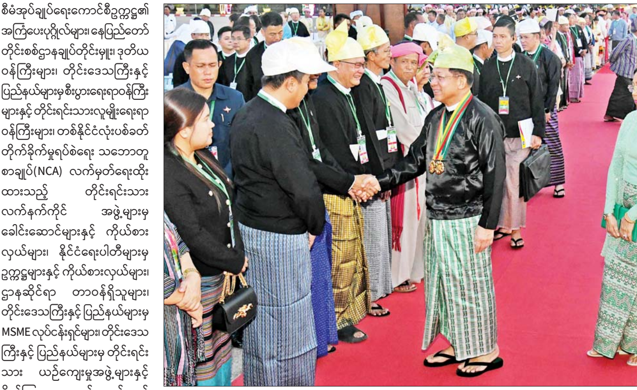
နိုင်ငံတော်စီမံအုပ်ချုပ်ရေးကောင်စီဥက္ကဋ္ဌ နိုင်ငံတော်ဝန်ကြီးချုပ် ဗိုလ်ချုပ်မှူးကြီး သတိုးမဟာသရေစည်သူ သတိုးသီရိသုဓမ္မ မင်းအောင်လှိုင်နှင့် ဇနီး ဒေါ်ကြူကြူလှတို့ (၇၇)နှစ်မြောက် ပြည်ထောင်စုနေ့အထိမ်းအမှတ် ဂုဏ်ပြုညစာစားပွဲသို့ တက်ရောက်လာကြသူများအား ရင်းရင်းနှီးနှီး နှုတ်ဆက်စဉ်။

ရင်းရင်းနှီးနှီး နှုတ်ဆက် နိုင်ငံတော်စီမံအုပ်ချုပ်ရေးကောင်စီဥက္ကဋ္ဌ နိုင်ငံတော်ဝန်ကြီးချုပ် ဗိုလ်ချုပ်မှူးကြီး သတိုးမဟာသရေစည်သူ သတိုးသီရိသုဓမ္မ မင်းအောင်လှိုင်နှင့် ဇနီး ဒေါ်ကြူကြူလှတို့ (၇၇)နှစ်မြောက် ပြည်ထောင်စုနေ့ အထိမ်းအမှတ် ဂုဏ်ပြုညစာစားပွဲသို့ တက်ရောက်လာကြသည့် နိုင်ငံရေးပါတီများမှ ဥက္ကဋ္ဌများနှင့် ကိုယ်စားလှယ်များအား ရင်းရင်းနှီးနှီး နှုတ်ဆက်စဉ်။