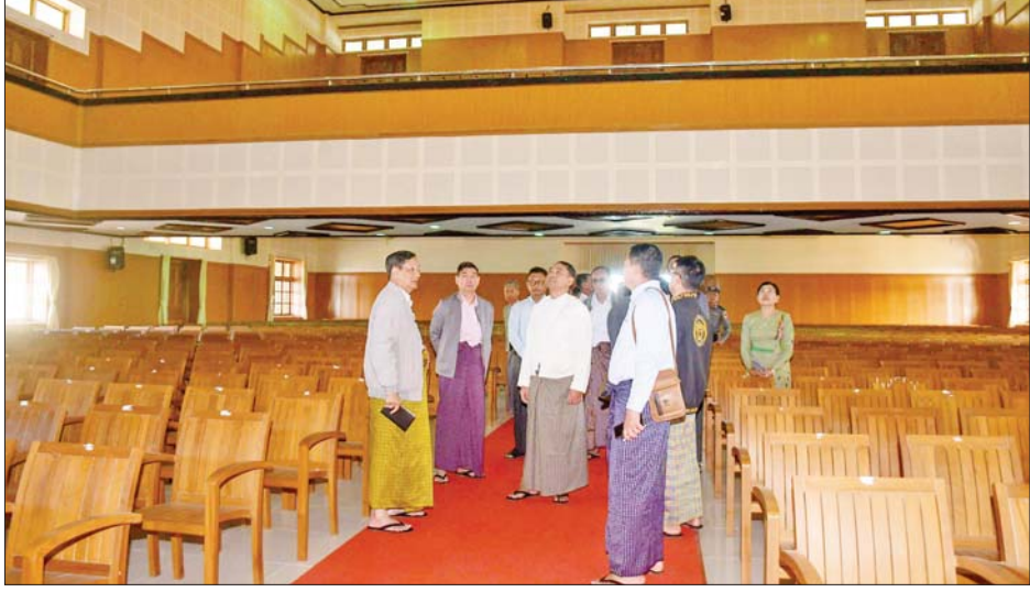
နိုင်ငံတော်စီမံအုပ်ချုပ်ရေးကောင်စီအဖွဲ့ဝင် ဒေါက်တာဘရွှေနှင့်တာဝန်ရှိသူများ စစ်တွေတက္ကသိုလ် အတွင်း မိခါမုနိတိုင်းတိုက်ခတ်မှုကြောင့် ထိခိုက်ပျက်စီးသွားသော ဘွဲ့နှင်းသဘင်ဆောင်ပြုပြင်ပြီးစီးမှု အခြေအနေများကို ကြည့်ရှုစစ်ဆေးစဉ်။

သည့် အခက်အခဲများကို ရှင်းလင်း တင်ပြကြရာ ပြည်နယ်ဝန်ကြီးချုပ် က ပြည်နယ်အစိုးရအဖွဲ့အနေဖြင့် ဝန်ထမ်းများ သက်သာချောင်ချိ ရေးအတွက် အတတ်နိုင်ဆုံး ကြိုးစား ဆောင်ရွက်ပေးသွားမည် ဖြစ်ကြောင်း အားပေးစကား ပြောကြားသည်။ ယင်းနောက် ဒုတိယဝန်ကြီးများ နှင့် ပြည်နယ်အစိုးရအဖွဲ့ဝင်များက တင်ပြချက်များအပေါ် ပြန်လည် ရှင်းလင်းဆွေးနွေးကြပြီး နိုင်ငံ တော်စီမံအုပ်ချုပ်ရေးကောင်စီ အဖွဲ့ဝင် ဒေါက်တာဘရွှေက နိဂုံး ချုပ်အမှာစကား ပြောကြားသည်။ ဆက်လက်၍ နိုင်ငံတော်စီမံ အုပ်ချုပ်ရေး ကောင်စီဝင်သည် စစ်တွေတက္ကသိုလ်သို့ သွားရောက် ပြီး တက္ကသိုလ်အတွင်း ဆိုင်ကလုန်း မုနိတိုင်း(မိခါ) တိုက်ခတ်မှုကြောင့် ထိခိုက် ပျက်စီးသွားသော တက္ကသိုလ်ပင်မဆောင်နှင့် ဘွဲ့နှင်း သဘင်ဆောင် ပြုပြင်ပြီးစီးမှုအခြေ အနေများကို ကြည့်ရှုစစ်ဆေး၍ ပါမောက္ခချုပ်၊ ဒုတိယပါမောက္ခချုပ် နှင့် ပါမောက္ခ၊ ဌာနမှူးများ၊ တွဲဖက်ပါမောက္ခများ၊ ကထိက များနှင့်တွေ့ဆုံပြီး ရခိုင်ပြည်နယ် အတွင်း ဖြစ်ပွားနေသည့် လက်နက်ကိုင် ပဋိပက္ခများ၏ အခြေအနေ၊ ဒေသတည်ငြိမ် အေးချမ်းရေး၊ တရားဥပဒေစိုးမိုး ရေး ဆောင်ရွက်မှုအခြေအနေ များကို ရှင်းလင်းပြောကြားသည်။ ထို့နောက် စစ်တွေတက္ကသိုလ် ပါမောက္ခချုပ် ဒေါက်တာ ခင်မောင် ဇော်၊ ဒုတိယပါမောက္ခချုပ်နှင့် ပါမောက္ခ၊ ဌာနမှူးများက တက္ကသိုလ်အတွင်း ကျောင်းသား ကျောင်းသူများ တက်ရောက်ပညာ သင်ကြားနေမှုနှင့် အဝေးသင် ကျောင်းသား ကျောင်းသူများ တက်ရောက်နေမှု အခြေအနေများ ကို ရှင်းလင်းတင်ပြကြရာ နိုင်ငံတော် စီမံအုပ်ချုပ်ရေးကောင်စီ အဖွဲ့ဝင် ဒေါက်တာဘရွှေက ပေါင်းစပ် ညှိနှိုင်းပေးခဲ့ကြောင်း သိရသည်။ သတင်းစဉ်