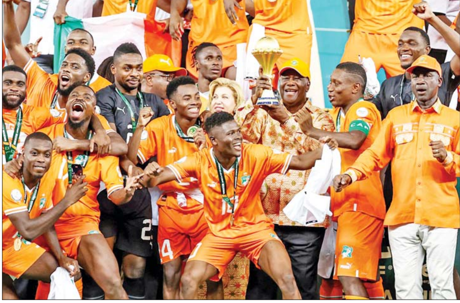
အိုင်ဗရီကိုစံအသင်းကစားသမားများ အောင်ပွဲခံနေစဉ်။

နိုင်ဂျီးရီးယားအသင်းနဲ့ အိုင်ဗရီကိုစံအသင်းတို့ ဖေဖော်ဝါရီ ၁၁ ရက်ညပိုင်းက ယှဉ်ပြိုင်ကစားခဲ့တဲ့ အာဖရိကနိုင်ငံများဖလား နောက်ဆုံး ဗိုလ်လုပွဲစဉ်မှာ အိမ်ရှင်အိုင်ဗရီကိုစံအသင်းက နိုင်ဂျီးရီးယားအသင်းကို အနိုင်ရရှိခဲ့တာကြောင့် အာဖရိကနိုင်ငံများဖလားကို ရယူဆွတ်ခူးနိုင်ခဲ့ပြီဖြစ်ပါတယ်။ အဲဒီပွဲစဉ်မှာ နိုင်ဂျီးရီးယားအသင်းက ပထမပိုင်းပွဲကစားချိန် ၃၈ မိနစ်မှာ ထရစ်အက်ကွန်ရဲ့ သွင်းဂိုးနဲ့ ဦးဆောင်ဂိုးစတင်ရရှိခဲ့ပေမယ့် ဒုတိယပိုင်းပွဲကစားချိန် ၆၂ မိနစ်မှာ ကက်စီနဲ့ ၈၁ မိနစ်မှာ ဟယ်လ်လာတို့က တစ်ဂိုးစီ သွင်းယူခဲ့လို့ အိုင်ဗရီကိုစံအသင်းက စာမျက်နှာ ၁၆ ကော်လံ ၁ သို့ ❑