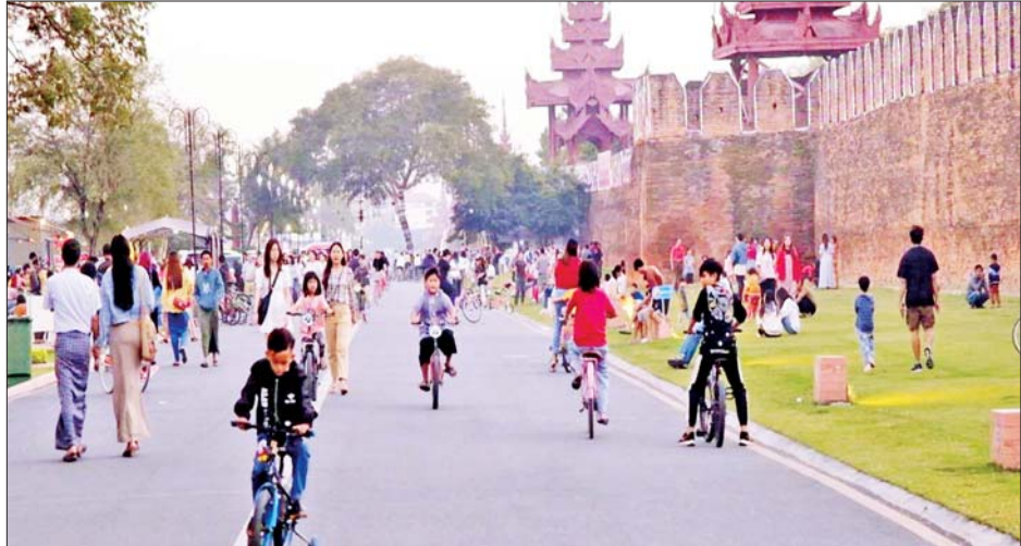
မန္တလေးမြို့၌ (၇၇)နှစ်မြောက် ပြည်ထောင်စုနေ့တွင် အပန်းဖြေအနားယူကြသူများဖြင့် စည်ကားလျက်ရှိသည်ကို တွေ့ရစဉ်။