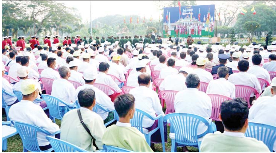
ပြည်နယ်အစိုးရအဖွဲ့ဝင် ဝန်ကြီးများနှင့်ဇနီးများ၊ ဖိတ်ကြားထားသည့်ဧည့်သည်တော်များ တက်ရောက် ခဲ့သည်။

ထို့နောက် ၂၀၂၄ ခုနှစ် (၇၇)နှစ်မြောက် ပြည်ထောင်စုနေ့အထိမ်းအမှတ် သဝဏ်လွှာ ဖတ်ကြားခြင်း အခမ်းအနားကို နံနက် ၇ နာရီတွင် ဆက်လက်ကျင်းပရာ အခမ်းအနားသို့ မွန်ပြည်နယ် ဝန်ကြီးချုပ်ဦးအောင်ကြည်သိန်း၊ အရှေ့တောင်တိုင်း စစ်ဌာနချုပ်တိုင်းမှူး ဗိုလ်မှူးချုပ်စိုးမင်းနှင့်ဇနီး၊ ပြည်နယ် တရားလွှတ်တော် တရားသူကြီးချုပ်၊