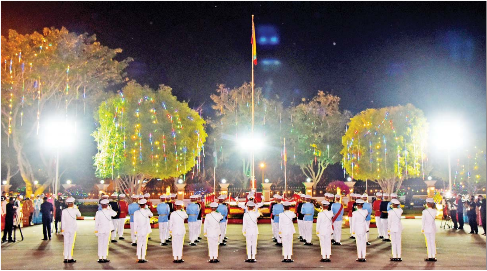
(၇၇)နှစ်မြောက် ပြည်ထောင်စုနေ့ နိုင်ငံတော်အလံတင်အခမ်းအနား ကျင်းပစဉ်။

(၇၇)နှစ်မြောက် ပြည်ထောင်စုနေ့ကို ပြည်ထောင်စုကြီး ထာဝစဉ် တည်တံ့ ခိုင်မြဲရေးအတွက် တိုင်းရင်းသားပြည်သူအားလုံးက ပြည်ထောင်စု စိတ်ဓာတ်ဖြင့် ကာကွယ် စောင့်ရှောက်ရေး၊ တိုင်းပြည်တည်ငြိမ်အေးချမ်းရေးနှင့် တရားဥပဒေစိုးမိုးရေးတို့ အပြည့်အဝ ရရှိစေရန်အတွက် နိုင်ငံတော်အစိုးရ တပ်မတော်နှင့် ပြည်သူ့အတူတကွ လက်တွဲ ကြိုးပမ်းဆောင်ရွက်ရေး၊ တိုင်းရင်းသားပြည်သူအားလုံး၏ လူမှုစီးပွားဘဝ ဖွံ့ဖြိုးတိုးတက်ရေးအတွက် တိုင်းရင်းသားပြည်သူ တစ်ရပ်လုံး အကျိုးဝင်သော စိုက်ပျိုးမွေးမြူရေးကို အခြေခံသည့် ကုန်ထုတ်လုပ်ငန်းများနှင့် MSME အခန်းကဏ္ဍတို့ မြှင့်တင်ဆောင်ရွက်ရေး၊ နိုင်ငံတော်၏ အမျိုးသားရေး ရည်မှန်းချက်ဖြစ်သည့် တိုင်းပြည်သာယာဝပြောရေးနှင့် စားရေရိက္ခာဖူလုံရေး