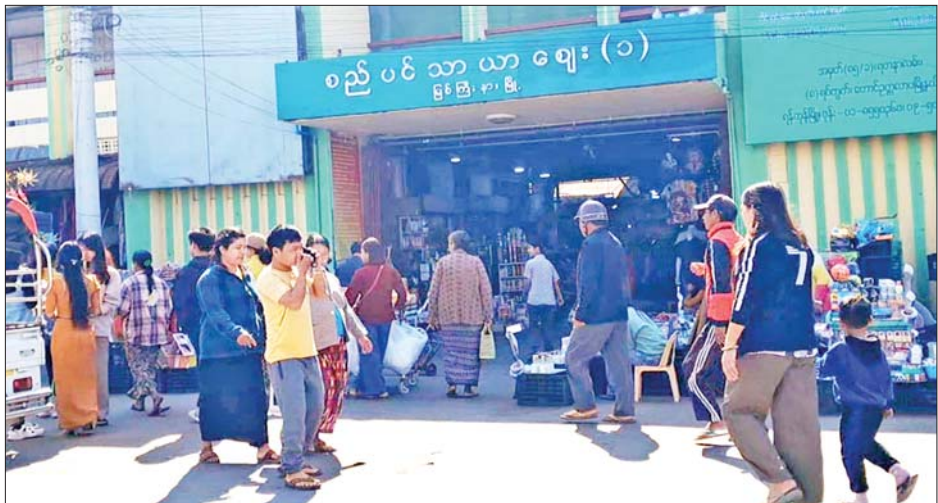
မြစ်ကြီးနားမြို့ စည်ပင်သာယာရေးဈေး(၁)၌ (၇၇)နှစ်မြောက် ပြည်ထောင်စုနေ့တွင် ဈေးရောင်းဈေးဝယ်များဖြင့် စည်ကားလျက်ရှိသည်ကို တွေ့ရစဉ်။