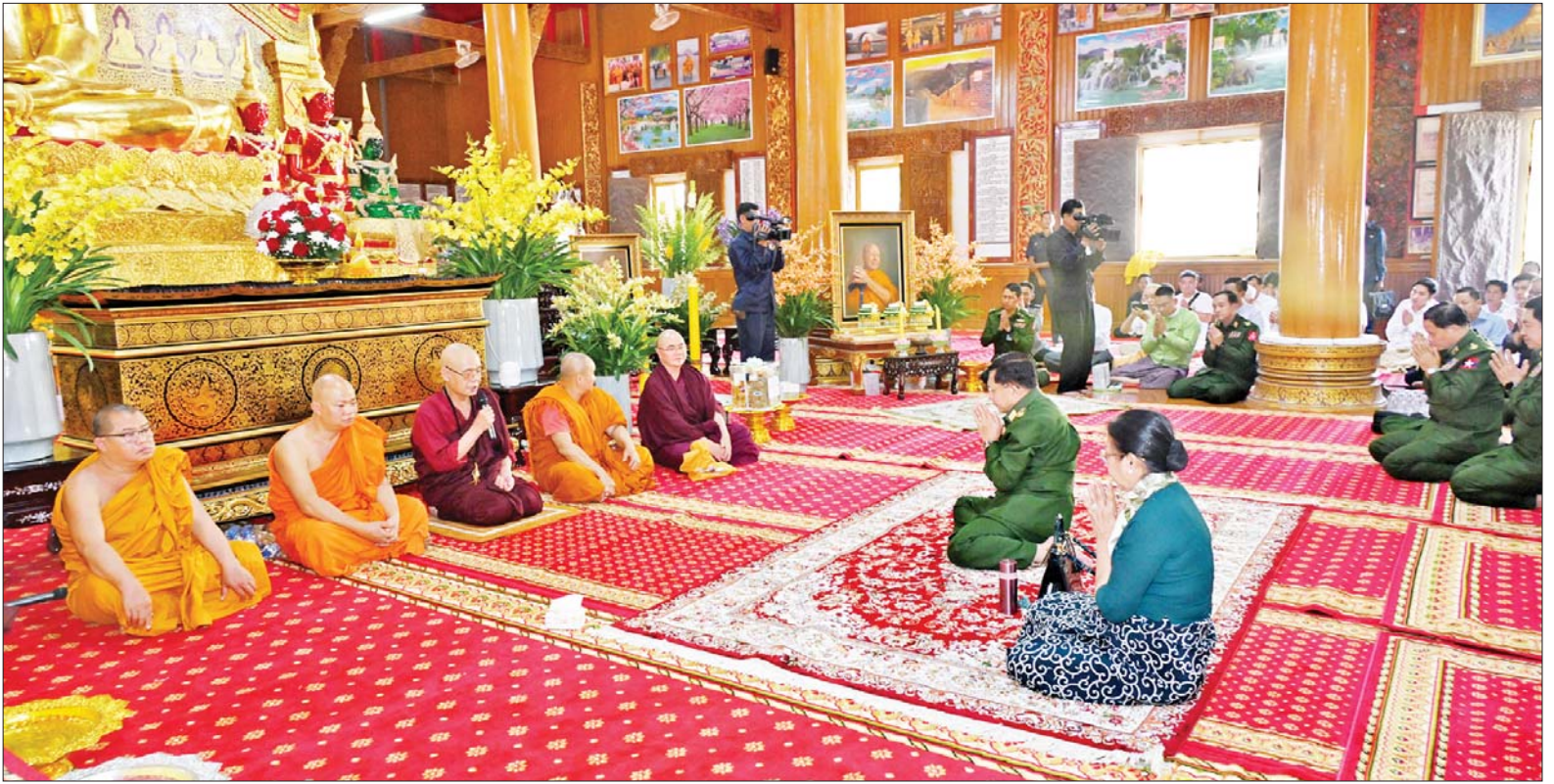
နိုင်ငံတော်စီမံအုပ်ချုပ်ရေးကောင်စီဥက္ကဋ္ဌ တပ်မတော်ကာကွယ်ရေးဦးစီးချုပ် ဗိုလ်ချုပ်မှူးကြီးမင်းအောင်လှိုင်နှင့် ဇနီး ဒေါ်ကြူကြူလှတို့ ဝစီပိတ်ဆရာတော်ကြီးထံမှ ငါးပါးသီလခံယူဆောက်တည်ကြစဉ်။

ဦးစွာ နိုင်ငံတော်စီမံအုပ်ချုပ်ရေးကောင်စီဥက္ကဋ္ဌ တပ်မတော်ကာကွယ်ရေးဦးစီးချုပ်နှင့် ဇနီး၊ အဖွဲ့ဝင်များသည် နဂါးနှစ်ကောင်ကျောင်းတိုက် ပဓာနနာယကဆရာတော်ကြီး၏ ဥတုဇရပ်ကလာပ်တော်အား ဖူးမြော်ကြည်ညိုကြသည်။ ထို့နောက် ဆရာတော်ကြီး၏ အန္တိမအဂ္ဂိဈာပနကျင်းပရေး နာယကအဖွဲ့တွင်ပါဝင်သည့် သီလဓမ္မကုန်းသာတောကျောင်းတိုက်ဦးစီးပဓာနနာယက (ဝစီပိတ်) ဆရာတော်ဘဒ္ဒန္တကောဝိဒ အမှူးပြုသည့် ဆရာတော်ကြီးများအား ဖူးမြော်ကြည်ညိုပြီး ဆရာတော်ဘုရားကြီး၏ အန္တိမအဂ္ဂိဈာပနပူဇာသဘင်အခမ်းအနားပြုလုပ်မည့်အခြေအနေများကို လျှောက်ထားဆွေးနွေး၍ ဆရာတော်ကြီးသည် နိုင်ငံ့ဥသျှောင် အမိပတ်ဆရာတော်ကြီးများတွင် ပါဝင်သဖြင့် အန္တိမအဂ္ဂိဈာပနပူဇာသဘင် အခမ်းအနားအား စည်ကားသိုက်မြိုက်စွာနှင့် အခမ်းနားဆုံးဖြစ်အောင် ကျင်းပနိုင်ရေး၊ ရုပ်ဝေးမှလာရောက်သည့် ဆရာတော်၊ သံဃာတော်များ၊ သာသနာ့နွယ်ဝင်သီလရှင်များနှင့် အများပြည်သူများ သွားလာရေး၊ တည်းခိုနေထိုင်ရေးနှင့် စားသောက်ရေးတို့ အဆင်ပြေချောမွေ့မှုရှိစေရေး၊ သောက်သုံး