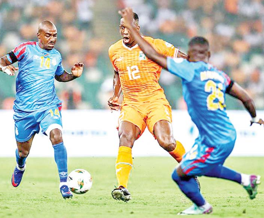
အိုင်ဗရီကို့စ်အသင်းနှင့် ကွန်ဂိုအသင်းတို့ ယှဉ်ပြိုင်ကစားကြစဉ်။

အိုင်ဗရီကို့စ်အသင်းနဲ့ ကွန်ဂိုအသင်းတို့ ဖေဖော်ဝါရီ ၇ ရက်ညပိုင်းက ယှဉ်ပြိုင်ကစားခဲ့တဲ့ အာဖရိကနိုင်ငံများဖလားပြိုင်ပွဲ ဆီမီးဖိုင်နယ် အဆင့်ပွဲစဉ်မှာ အိုင်ဗရီကို့စ်အသင်းက တစ်ဂိုး-ဂိုးမရှိနဲ့ အနိုင်ရရှိခဲ့တာကြောင့် အာဖရိကနိုင်ငံများဖလားနောက်ဆုံးဗိုလ်လုပွဲကို တက်လှမ်းခွင့် ရရှိခဲ့ပြီဖြစ်ပါတယ်။