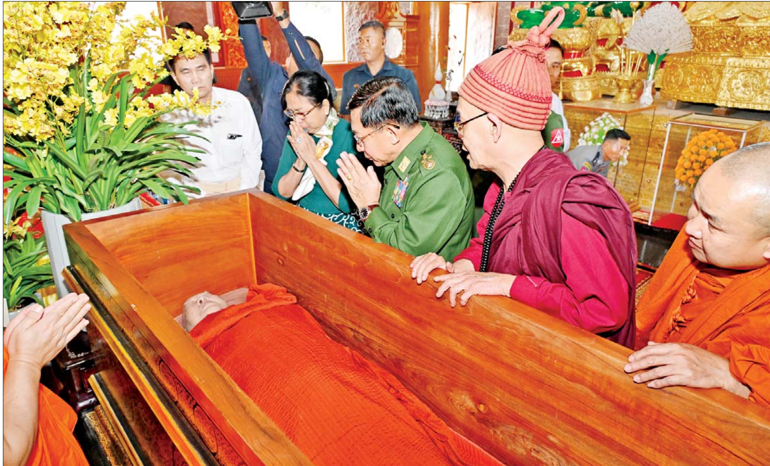
နိုင်ငံတော်စီမံအုပ်ချုပ်ရေးကောင်စီဥက္ကဋ္ဌ တပ်မတော်ကာကွယ်ရေးဦးစီးချုပ် ဗိုလ်ချုပ်မှူးကြီး မင်းအောင်လှိုင်နှင့် ဇနီး ဒေါ်ကြူကြူလှ တာချီလိတ်မြို့ နဂါးနှစ်ကောင် ကျောင်းတိုက် ပဓာနနာယက ဆရာတော်ကြီး၏ ဥတုဇရုပ်ကလာပ်တော်အား ဖူးမြော်ကြည့်ညိစဉ်။

ဆရာတော်ဘုရားကြီး၏ ဥတုဇ ရုပ်ကလာပ်တော်အား နဂါးနှစ်ကောင် ကျောင်းတိုက်၌ ပူဇော်ထားရှိရာ နိုင်ငံတော်စီမံအုပ်ချုပ်ရေးကောင်စီဥက္ကဋ္ဌ တပ်မတော် ကာကွယ်ရေးဦးစီးချုပ် ဗိုလ်ချုပ်မှူးကြီး မင်းအောင်လှိုင်နှင့် ဇနီး ဒေါ်ကြူကြူလှတို့သည် ကာကွယ်ရေး ဦးစီးချုပ်ရုံးမှ ဒုတိယဗိုလ်ချုပ်ကြီး ရဲဝင်းဦးနှင့် ဇနီး၊ ကာကွယ်ရေး ဦးစီး ချုပ်ရုံးမှ အဆင့်မြင့်တပ်မတော်အရာရှိ ကြီးများနှင့် ဇနီးများ၊ ဤဝံဒေသတိုင်းစစ် ဌာနချုပ်တိုင်းမှူးနှင့် တာဝန်ရှိသူများ လိုက်ပါ၍ ယနေ့မွန်းလွဲပိုင်းတွင် သွားရောက်ဖူးမြော်ကြည့်ညိသည်။ စာမျက်နှာ ၃ ကော်လံ ၁ သို့ ★