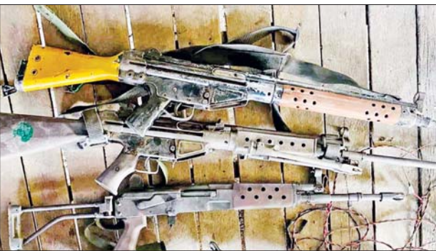
KNLA အဖွဲ့နှင့် PDF အမည်ခံအကြမ်းဖက်သမားများ ခိုအောင်းခဲ့သည့် အဆောက်အအုံအတွင်းမှ သိမ်းဆည်းရမိခဲ့သည့် လက်နက်၊ ခဲယမ်းများ မှတ်တမ်းဓာတ်ပုံများ။