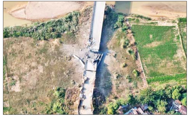
KNLA အဖွဲ့နှင့် PDF အမည်ခံအကြမ်းဖက်သမားများက တပ်မတော်စစ်ကြောင်းများ အချိန်မီမရောက်ရှိစေရန်အတွက် အများပြည်သူသွားလာအသုံးပြုလျက်ရှိသော ကျွဲပွဲ- ဧရပ်ကြီးသွားကားလမ်းပေါ်ရှိ မြို့ဆိုးတံတားအား မိုင်းထောင်ဖောက်ခွဲခဲ့သည့် မှတ်တမ်းဓာတ်ပုံများ။