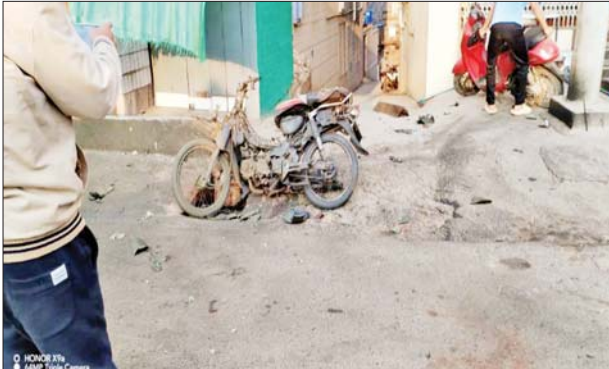
မိုင်းပေါက်ကွဲမှုဖြစ်ပွားခဲ့သည့် ဆိုင်ကယ်။