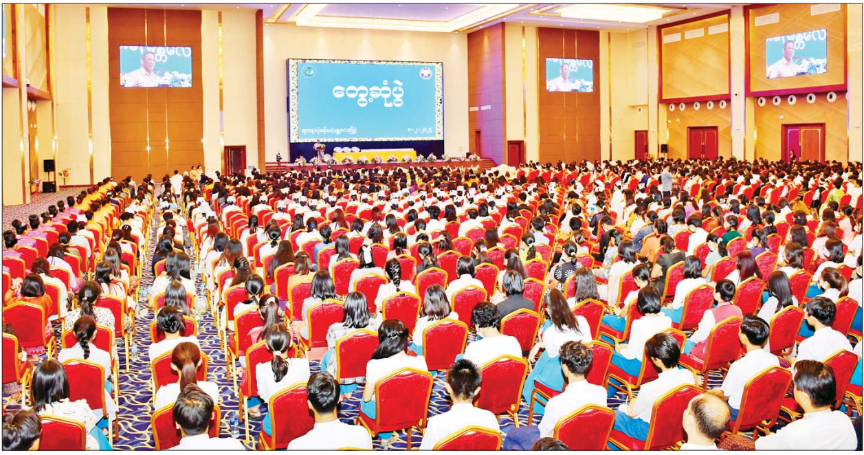
ပြည်ထောင်စုဝန်ကြီး ဦးမောင်မောင်အုန်း မန္တလေးမြို့ရှိ တက္ကသိုလ်ကျောင်းသား ကျောင်းသူများအား တားဆီးကာကွယ် မီဒီယာအဆိပ်သင့်အန္တရာယ်နှင့် နိုင်ငံတော်တည်ဆောက်ရေးနှင့် မီဒီယာ၏အခန်းကဏ္ဍ ခေါင်းစဉ်ဖြင့် ဆွေးနွေးပြောကြားစဉ်။

မန္တလေး ဖေဖော်ဝါရီ ၈ ပြန်ကြားရေး ဝန်ကြီးဌာန ပြည်ထောင်စုဝန်ကြီး ဦးမောင်မောင်အုန်းသည် ယနေ့မွန်းလွဲပိုင်းတွင် မန္တလေးမြို့ ရတနာပုံခန်းမ၌ကျင်းပသည့် မန္တလေးရှိ တက္ကသိုလ်နှင့် ကောလိပ်များမှ ကျောင်းသား ကျောင်းသူများအား “တားဆီးကာကွယ်မီဒီယာအဆိပ်သင့်မှုအန္တရာယ်” နှင့် “နိုင်ငံတော်တည်ဆောက်ရေးနှင့် မီဒီယာ၏အခန်းကဏ္ဍ” ဆွေးနွေးပွဲသို့ တက်ရောက် ဆွေးနွေးပြောကြားသည်။