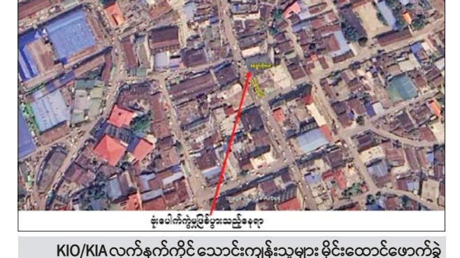
KIO/KIA လက်နက်ကိုင် သောင်းကျန်းသူများ မိုင်းထောင်ဖောက်ခွဲ ခဲ့သည့် လားရှိုးမြို့ ရပ်ကွက်(၇)၊ နယ်မြေ(၁၁)၊ သုခလမ်းရှိ စန်းရွှင် ဟိုတယ် တည်နေရာပြပုံ။