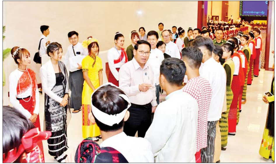
ပြည်ထောင်စုဝန်ကြီး ဦးမောင်မောင်အုန်း မန္တလေးမြို့ရှိ တက္ကသိုလ်ကျောင်းသား ကျောင်းသူများအား ရင်းရင်းနှီးနှီးနှုတ်ဆက်စဉ်။

ပါမောက္ခချုပ်များ၊ ဒုတိယပါမောက္ခချုပ်များ၊ ပါမောက္ခများ၊ ဆရာ ဆရာမကြီးများ၊ ကျောင်းသား ကျောင်းသူများနှင့် စုပေါင်းမှတ်တမ်းတင် ဓာတ်ပုံရိုက်ပြီး ဆွေးနွေးပွဲသို့ တက်ရောက်လာကြသည့် ကျောင်းသားကျောင်းသူများအား ရင်းရင်းနှီးနှီး လိုက်လံနှုတ်ဆက်သည်။ အဆိုပါ ဆွေးနွေးပွဲသို့ မန္တလေးတိုင်းဒေသကြီးအတွင်းရှိ မန္တလေးတက္ကသိုလ်၊ ရတနာပုံတက္ကသိုလ်၊ နိုင်ငံခြားဘာသာ တက္ကသိုလ်၊ နည်းပညာတက္ကသိုလ်(မန္တလေး)၊ ဆေးတက္ကသိုလ်၊ သူနာပြုတက္ကသိုလ်၊ ဆေးဝါးတက္ကသိုလ်၊ မန္တလေး သတင်းအချက်အလက်နှင့် နည်းပညာတက္ကသိုလ်၊ တိုင်းရင်းဆေးတက္ကသိုလ်၊ ဆေးဘက်ဆိုင်ရာနည်းပညာတက္ကသိုလ် (ပုသိမ်ကြီး)၊ ဆေးဘက်ဆိုင်ရာဆေးတက္ကသိုလ်နှင့် ပညာရေးဒီဂရီကောလိပ်တို့မှ ပါမောက္ခချုပ်များ၊ ဆရာ ဆရာမများနှင့် ကျောင်းသား ကျောင်းသူများ စုစုပေါင်း တက္ကသိုလ်ကောလိပ် ၂၂ခု တို့မှ ကျောင်းသား ကျောင်းသူ စုစုပေါင်း ၁၀၉၀ တက်ရောက်ခဲ့ကြသည်။ ညနေပိုင်းတွင် ပြည်ထောင်စုဝန်ကြီးသည် Mingalar