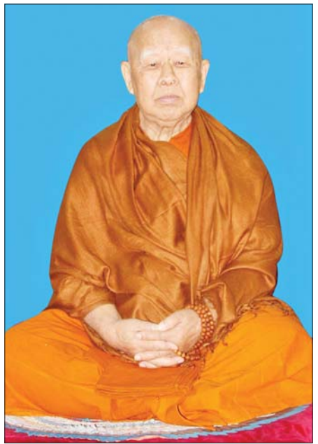
တံဆိပ်တော်တို့ကို ဆက်ကပ်လှူဒါန်းခဲ့ပြီး နိုင်ငံတော်အစိုးရက ၂၀၂၁ ခုနှစ်တွင် “အဘိဓဇမဟာရဋ္ဌဂုရု” ဘွဲ့တံဆိပ်တော်ဖြင့် ဆက်ကပ်လှူဒါန်းခဲ့ပါသည်။

ဤသို့လျှင် ဗုဒ္ဓသာသနာအကျိုးကို ထက်သန်သောဝီရိယဖြင့် သယ်ပိုးဆောင်ရွက်တော်မူခဲ့သော ပရဟိတတာဝဟဂုဏ်၊ သာသနာ့ဟိတရေဂုဏ်၊ ခမာဇောဂရိယဂုဏ်၊ သာသနာ့ရာဝဟဂုဏ်၊ အဂ္ဂမဟာပဏ္ဍိတလဒ္ဓလ္လနဂုဏ်၊ ရတ္တညုမဟာနာယကဂုဏ်၊ ပိဋကတ္တယဆေကဂုဏ်၊ ဂန္ထရုဇာဟုသစ္စဂုဏ်၊ ဗဟုဇနဟိတ သုခဝဟဂုဏ်၊ ဂန္ထရုဇာဟုဂုဏ်၊ လဇ္ဇိပေသလ သိက္ခာကာမဂုဏ် စသည်တို့နှင့် ပြည့်စုံတော်မူခြင်းတို့ကြောင့် နိုင်ငံတော်အစိုးရက ဆရာတော်ကြီးအား ၂၀၀၅ ခုနှစ်တွင် “အဘိဓဇ အဂ္ဂမဟာသဒ္ဓမ္မဇောတိက” ဘွဲ့တံဆိပ်တော်၊ ထိုင်းနိုင်ငံ မဟာချူလာလောင်ကွန်း တက္ကသိုလ်က ၂၀၀၉ ခုနှစ်တွင် (Homorry Ph.D, Degree From Mahachulalongkornrajavidyalaya University, Bangkok, Thailand) ဘွဲ့၊ ထိုင်းနိုင်ငံ ဘုရင်မင်းမြတ်က ၂၀၁၀ ပြည့်နှစ်တွင် ရတနာရံသီဘွဲ့