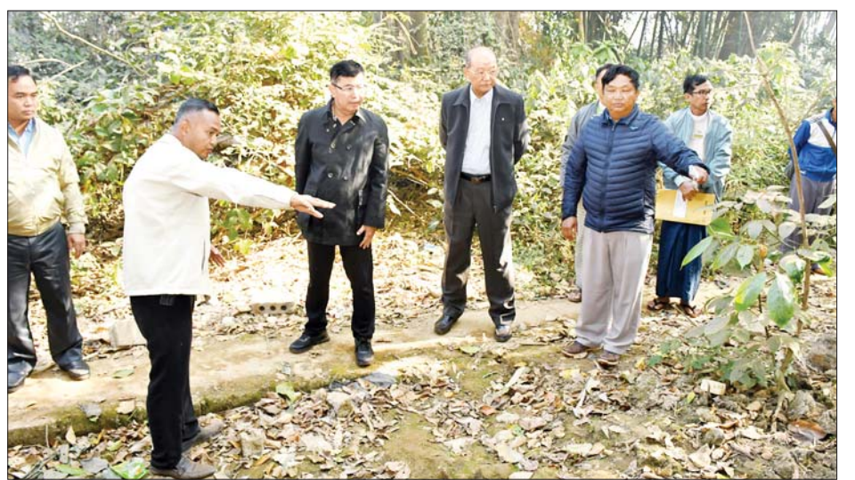
ရေဂိုက်လိုင်းများ သွယ်တန်းရေး ရန် ကိစ္စရပ်များကို ဆွေးနွေး ပေါင်းစပ်ညှိနှိုင်း ဖြည့်ဆည်းပေးခဲ့ နှင့် လျှပ်စစ်မီးတပ်ဆင်သွယ်တန်း မှာကြားပြီး လိုအပ်သည်များကို ကြောင်း သိရသည်။ သတင်းစဉ်

ရှိရာနေရာအား သွားရောက် ကြည့်ရှုစစ်ဆေးစဉ် ရှမ်းပြည်နယ် တိုင်းရင်းသားရေးရာနှင့် သက်မွေး ပညာသင်တန်း စင်တာအတွက် သစ်ပင်ထောင် ရေထွက်ဧရိယာ နေရာတွင် ဂါလန် ၅၀၀၀ ဆံ့ ရေစု ကန် တည်ဆောက်သွားရေး၊ ရေတင်မော်တာ စက်တပ်ဆင် သွားရေး၊ သစ်ပင်ထောင်ရေထွက် နေရာမှ သင်တန်းစင်တာသို့