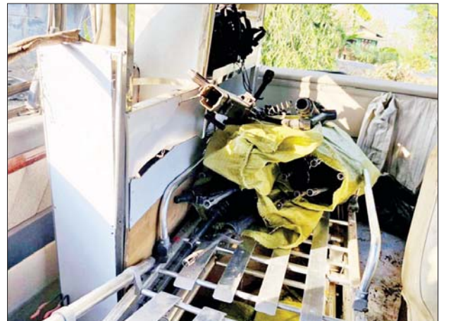
KNLA အဖွဲ့နှင့် PDF အမည်ခံအကြမ်းဖက်သမားများက လက်နက်၊ ခဲယမ်းများ သယ်ဆောင်လာသည့် ပရဟိတအမည်ခံ အလင်း စေတမန်ယာဉ်အား သိမ်းဆည်းရမိခဲ့သည့် မှတ်တမ်းဓာတ်ပုံများ။