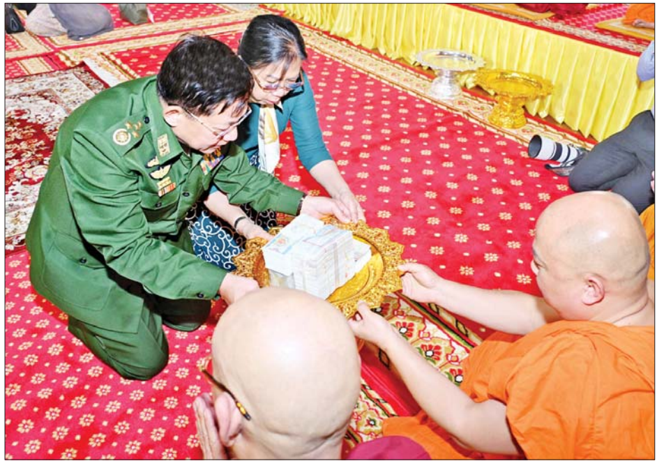
နိုင်ငံတော်စီမံအုပ်ချုပ်ရေးကောင်စီဥက္ကဋ္ဌ တပ်မတော်ကာကွယ်ရေးဦးစီးချုပ် ဗိုလ်ချုပ်မှူးကြီးမင်းအောင်လှိုင်နှင့် ဇနီး ဒေါ်ကြူကြူလှတို့ ဆရာတော်ကြီးများထံ အန္တိမအဂ္ဂိဈာပန ပူဇာသဘင်အခမ်းအနားကျင်းပပြုလုပ်နိုင်ရေး အလှူတော်ငွေများ ဆက်ကပ်လှူဒါန်းစဉ်။

★ ဆရာတော်ကြီး၏ သက်တမ်းတစ်လျှောက် ထိုကဲ့သို့ သာသနာပြုလုပ်ငန်းများနှင့် လူထုအကျိုးပြုလုပ်ငန်းများ စွမ်းစွမ်းတစ်ဆောင်ရွက်တော်မူခဲ့မှုများကြောင့် နိုင်ငံတော်မှ ၁၉၉၂ ခုနှစ်တွင် အဂ္ဂမဟာပဏ္ဍိတဘွဲ့တံဆိပ်တော်၊ ၂၀၀၁ ခုနှစ်တွင် အဂ္ဂမဟာသဒ္ဓမ္မဇောတိကဇောဘွဲ့တံဆိပ်တော်၊ ၂၀၀၅ ခုနှစ်တွင် အဘိဓဇအဂ္ဂမဟာသဒ္ဓမ္မဇောတိကဘွဲ့တံဆိပ်တော်၊ ၂၀၂၁ ခုနှစ်တွင် အဘိဓဇမဟာရဋ္ဌဂုရု ဘွဲ့တံဆိပ်တော်တို့ကို ဆက်ကပ်ချီးမြှင့်ခဲ့သကဲ့သို့ အိမ်နီးချင်းနိုင်ငံဖြစ်သည့် ထိုင်းနိုင်ငံမှ ဆက်ကပ်ချီးမြှင့်သည့် ဘွဲ့တံဆိပ်တော်များကိုလည်း ဆက်ကပ်ခံခဲ့ရကြောင်း၊ ဆရာတော်ကြီးသည် သက်တော် ၉၆၊ ဝါတော် ၇၇ ဝါ အရောက်တွင် ဘဝနတ်ထံ ပျံလွန်တော်မူခဲ့ခြင်းဖြစ်