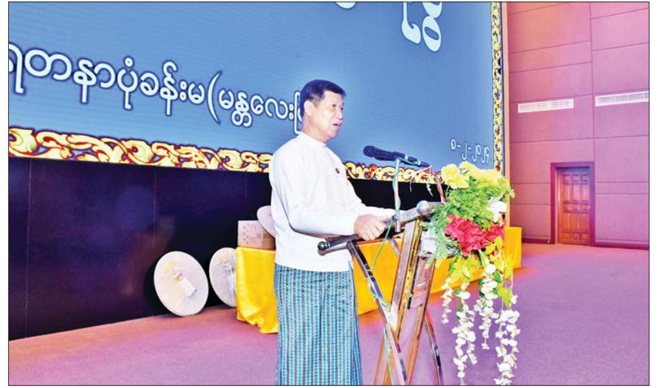
မန္တလေးတိုင်းဒေသကြီးဝန်ကြီးချုပ် ဦးမျိုးအောင် ဆွေးနွေးပြောကြားစဉ်။

မီဒီယာ၏အခန်းကဏ္ဍ” မှတ်တမ်းဗီဒီယိုကို ပြသသည်။ ထို့နောက် ပြည်ထောင်စုဝန်ကြီးက ယနေ့ခေတ်သည် နည်းပညာခေတ် ဖြစ်သဖြင့် လူငယ်များ အနေဖြင့် နည်းပညာနှင့် နေ့စဉ် ထိတွေ့ဆက်သွယ် ဆက်ဆံရကြောင်း၊ နည်းပညာခေတ်တွင် သတင်းများသည် အကန့်အသတ်မရှိ ထွက်ပေါ်လာကြောင်း၊ အချို့သောသတင်းမီဒီယာများသည် နိုင်ငံကို အမှောင်ထဲသို့ကျအောင် ချောက်ချလျက်ရှိသည်ကို တွေ့ရကြောင်း၊ သတင်းတု၊ သတင်းမှားများကြောင့်