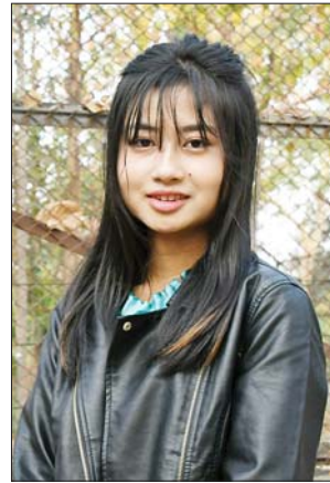
မမြပုလဲသွယ်

မိစ္ဆာလင်း (မွန်ပြည်နယ်တိုင်းရင်းသားရိုးရာ ယဉ်ကျေးမှုအဖွဲ့) (၇၇)နှစ်မြောက် ပြည်ထောင်စုနေ့ အခမ်းအနားမှာ ကျွန်မတို့အဖွဲ့အနေနဲ့ “ပျံသန်းကြမည့် နေ့ရက်ဆီ” ဆိုတဲ့ တေးသီချင်းနဲ့ ကပြဖျော်ဖြေတင်ဆက်မှာဖြစ်ပါတယ်။ အခုလို တိုင်းရင်းသားပေါင်းစုံနဲ့ တွေ့ဆုံခွင့်ရတဲ့အတွက် ပျော်ရွှင်မိပါတယ်။ တာဝန်ရှိပုဂ္ဂိုလ်တွေ စိစဉ်ဆောင်ရွက်ပေးမှုတွေကြောင့် မနေ့ကဆို သတင်းစာနဲ့တီဗွီမှာပဲ အမြဲတမ်းတွေ့နေရတဲ့ မာရဝိဇယဗုဒ္ဓရုပ်ပွားတော်မြတ်ကြီးကို ကိုယ်တိုင် ကိုယ်ကျ သွားရောက်ဖူးမြော်ခွင့်ရခဲ့တာဟာ အိမ်မက်တစ်ခုလိုပဲ။ တကယ်ဖူးမြော်ရတဲ့အချိန်မှာလည်း ရင်ထဲမှာ အေးချမ်းပြီး ပျော်ရွှင်မိပါတယ်။ ဒီနေ့မှာတော့ နေပြည်တော်က တိရစ္ဆာန်ဥယျာဉ်၊ အမျိုးသားအထိမ်းအမှတ်ဥယျာဉ်၊ စစ်သမိုင်းပြတိုက်၊ အမျိုးသားပြတိုက်နဲ့ မြို့မဈေးကြီးကို သွားရောက်လေ့လာခဲ့ကြတယ်။ ဒီလိုမျိုး တိုင်းရင်းသားတွေ စုံစုံညီညီတွေ့ရဖို့ဆိုတာကလည်း မလွယ်ပါဘူး။