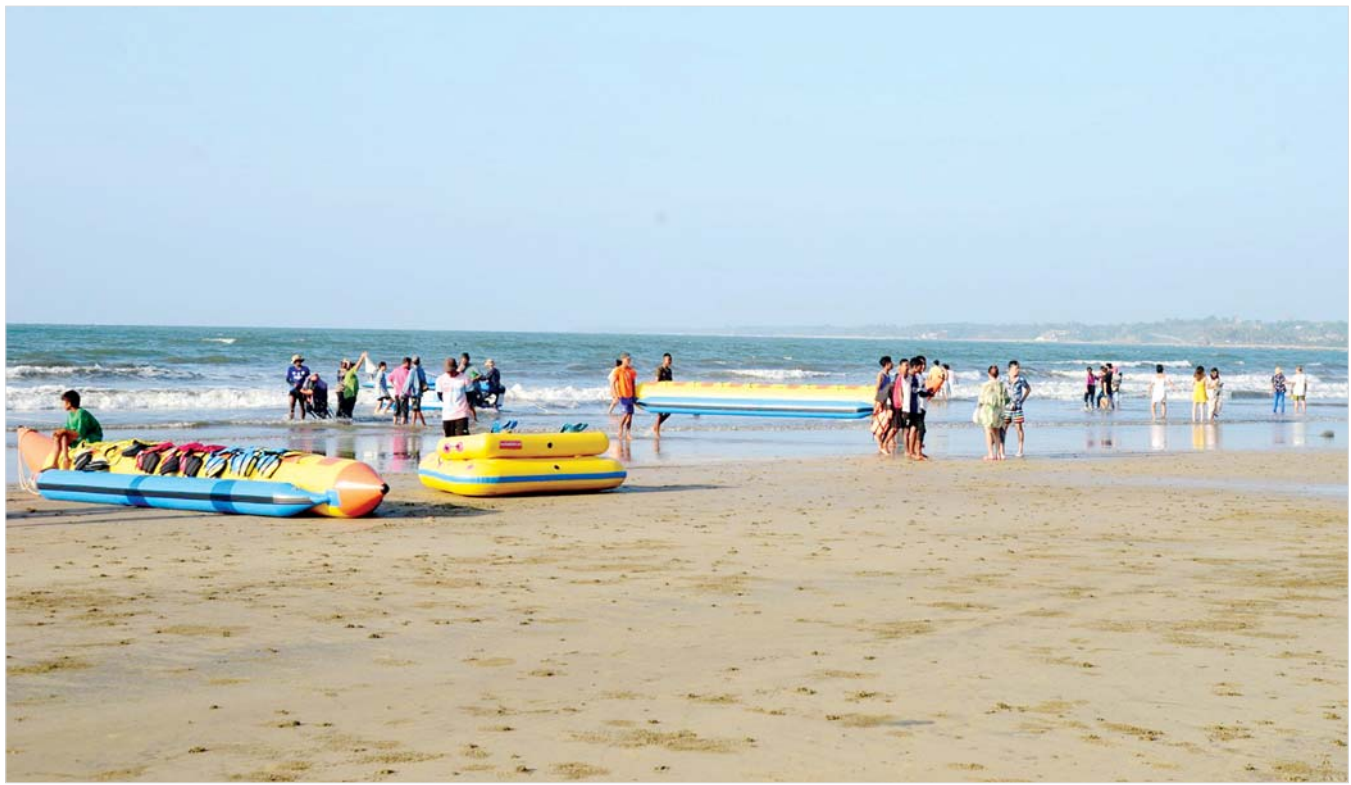
ချောင်းသာကမ်းခြေသို့ လာရောက်အပန်းဖြေအနားယူကြသူများကို တွေ့ရစဉ်။

နိုင်ငံတော်စီမံအုပ်ချုပ်ရေးကောင်စီ ရှေ့လုပ်ငန်းစဉ် (၅) ရပ် ၁။ လွတ်လပ်ပြီး တရားမျှတသော ပါတီစုံ ဒီမိုကရေစီ အထွေထွေရွေးကောက်ပွဲ အောင်မြင်စွာ ကျင်းပနိုင်ရေး ပြည်ထောင်စုတစ်ဝန်းလုံး တည်ငြိမ်အေးချမ်း၍ တရားဥပဒေစိုးမိုးရေး အပြည့်အဝရရှိလာအောင် အလေးထားဆောင်ရွက်သွားမည်။ ၂။ တိုင်းရင်းသားပြည်သူ တစ်ရပ်လုံးနှင့် အကျိုးဝင်သော စိုက်ပျိုးမွေးမြူရေးကိုအခြေခံသည့် ကုန်ထုတ်လုပ်ငန်းများအား မြှင့်တင်၍ နိုင်ငံစီးပွားမြှင့်တင်ရေးနှင့် ပြည်သူ့ထုတ်ကုန်တစ်ရပ်လုံး၏ လူမှုစီးပွားဘဝ မြှင့်တင်ရေး ဆက်လက်ကြိုးပမ်းဆောင်ရွက်သွားမည်။ ၃။ နိုင်ငံတော်၏ ပကတိအနှစ်သာရဖြစ်သော ပြည်တွင်းငြိမ်းချမ်းရေးနှင့် ရရှိထားသည့် ပြည်တွင်းငြိမ်းချမ်းရေး ရလဒ်များ တည်ငြိမ်မှုရှိစေရေးအတွက် (NCA) ပါ သဘောတူညီချက်များအတိုင်း ဖြစ်နိုင်သမျှ အလေးထားလုပ်ဆောင်သွားမည်။ ၄။ စစ်မှန်စည်းကမ်းပြည့်ဝသည့် ပါတီစုံဒီမိုကရေစီ စနစ်ခိုင်မာစေရေးနှင့် ဒီမိုကရေစီနှင့် ဖက်ဒရယ်စနစ်ကို အခြေခံသည့် ပြည်ထောင်စုတည်ဆောက်ရေး လုပ်ငန်းစဉ်များကို အရှိန်အဟုန်ဖြင့် ဆက်လက်ဆောင်ရွက်သွားမည်။ ၅။ ဆန္ဒမဲပေးပိုင်ခွင့်ရှိသူအားလုံး၏ အခွင့်အရေးများ နှစ်နာမရှိစေရေးနှင့် နည်းလမ်းကျန် မှန်ကန်မှုရှိသည့် အထွေထွေရွေးကောက်ပွဲတစ်ရပ်ဖြစ်စေရေး ဆောင်ရွက်ခြင်း၊ အရေးပေါ်ကာလဆိုင်ရာ ပြဋ္ဌာန်းချက်များနှင့်အညီ ဆောင်ရွက်ခြင်းတို့ပြီးစီးပါက လွတ်လပ်ပြီး တရားမျှတသော ပါတီစုံဒီမိုကရေစီ အထွေထွေရွေးကောက်ပွဲကျင်းပ၍ ထွက်ပေါ်လာသည့်အစိုးရအား နိုင်ငံတော်တာဝန် လွှဲအပ်နိုင်ရေး ဆက်လက်ဆောင်ရွက်သွားမည်။