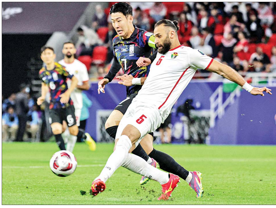
တောင်ကိုရီးယားအသင်းနှင့် ဂျော်ဒန်အသင်းတို့ ယှဉ်ပြိုင်ကစားကြစဉ်။

ဂျော်ဒန်အသင်းနဲ့ တောင်ကိုရီးယားအသင်းတို့ ဖေဖော်ဝါရီ ၆ ရက်ညပိုင်းက ယှဉ်ပြိုင်ကစားခဲ့တဲ့ အာရှဖလားဆီမီဖိုင်နယ်အဆင့် ပွဲစဉ်မှာ ဂျော်ဒန်အသင်းက တောင်ကိုရီးယားအသင်းကို အနိုင် ရရှိခဲ့တာကြောင့် အာရှဖလား နောက်ဆုံး ဗိုလ်လုပွဲအဆင့်ကို တက်လှမ်းခွင့် ရရှိခဲ့ပြီဖြစ်ပါတယ်။