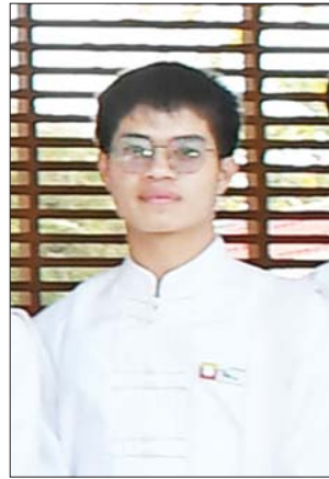
ဝေယံမျိုး