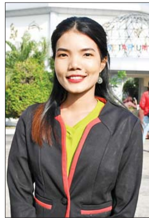
ယမင်းလှိုင်