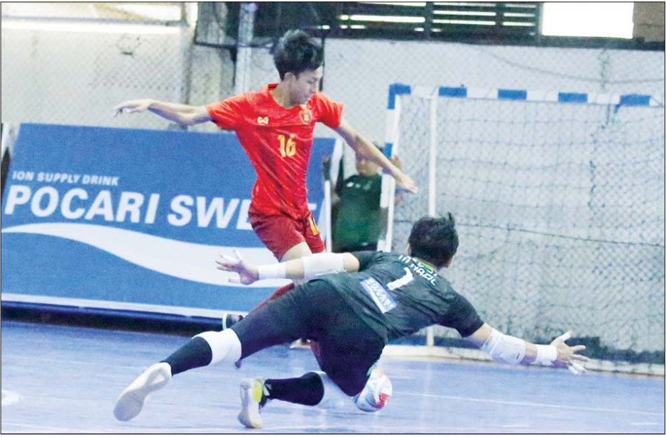
မြန်မာ့လက်ရွေးစင် ဖူဆယ်အသင်းနှင့် အင်ဒိုနီးရှားလိဂ်ချန်ပီယံ Bintang Timur FC အသင်းတို့ ယှဉ်ပြိုင်ကစားကြစဉ်။

ရန်ကုန် ဖေဖော်ဝါရီ ၇ ၂၀၂၄ အာရှဖလား ဖူဆယ်ပြိုင်ပွဲ အကြို ပြင်ဆင်မှုအဖြစ် အင်ဒိုနီးရှားနိုင်ငံ၌ လေ့ကျင့်နေသည့် မြန်မာ့လက်ရွေးစင် ဖူဆယ် အသင်းသည် ပထမဆုံးခြေစမ်းပွဲ အဖြစ် ဖေဖော်ဝါရီ ၇ ရက်က အင်ဒိုနီးရှားလိဂ်ချန်ပီယံ Bintang Timur FC အသင်းနှင့် ယှဉ်ပြိုင် ကစားရာ ၁၁ ဂိုး-တစ်ဂိုးဖြင့် အရေးနိမ့်ခဲ့သည်။ မြန်မာ့လက်ရွေးစင် ဖူဆယ် အသင်းသည် အင်ဒိုနီးရှားခြေစမ်း ခရီးစဉ် ပထမဆုံးခြေစမ်းပွဲတွင် ဂိုးပြတ် အရေးနိမ့်ခဲ့ခြင်းဖြစ် သည်။ မြန်မာအသင်းသည် ပထမ ပိုင်းတွင် သုံးဂိုးပြတ်အရေးနိမ့် နေပြီး ဒုတိယပိုင်းတွင် ရှစ်ဂိုးပေး စာမျက်နှာ ၁၆ ကော်လံ ၁၁၅