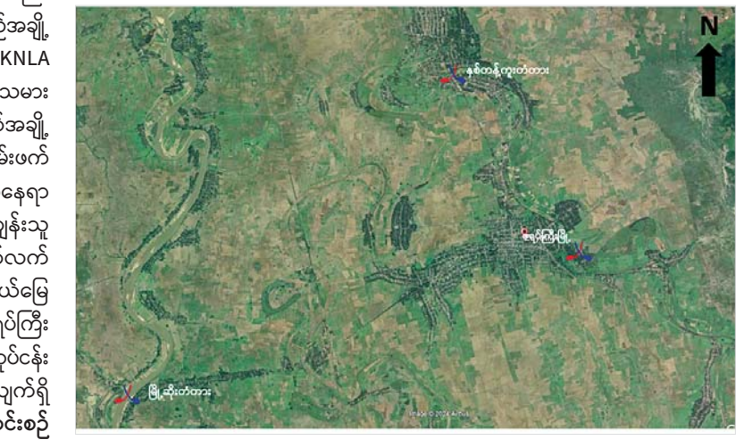
ဇရပ်ကြီးမြို့ရှိ နယ်မြေခံတပ်ရင်းအား KNLA အဖွဲ့နှင့် PDF အမည်ခံအကြမ်းဖက်သမားများက အင်အားအလုံးအရင်းဖြင့် ဝင်ရောက်တိုက်ခိုက်ခဲ့သည့် နေရာပြပုံ။

များစွာဖြင့် မွန်းလွဲ ၂ နာရီခန့်တွင် အနောက်ဘက်နှင့် မြောက်ဘက်တို့သို့ ဖရိုဖရဲဖြင့် ဆုတ်ခွာထွက်ပြေးသွားခဲ့သည်။ ဖြစ်စဉ်တွင် မိမိဘက်မှ စစ်သည်အချို့ ကျဆုံး၊ ထိခိုက်ဒဏ်ရာရရှိခဲ့ပြီး KNLA အဖွဲ့နှင့် PDF အမည်ခံအကြမ်းဖက်သမားများ၏ အလောင်းလက်နက်အချို့ သိမ်းဆည်းရမိခဲ့ကာ အဆိုပါအကြမ်းဖက်သမားများ ဆုတ်ခွာထွက်ပြေးရာနေရာများသို့ တပ်မတော်မှ သောင်းကျန်းသူချေမှုန်းမှုစစ်ဆင်ရေးများကို ဆက်လက်ဆောင်ရွက်လျက်ရှိကြောင်းနှင့် နယ်မြေတည်ငြိမ်အေးချမ်းရေးအတွက် ဇရပ်ကြီးမြို့အတွင်း လိုအပ်သော လုံခြုံရေးလုပ်ငန်းများ ဆက်လက်ဆောင်ရွက်လျက်ရှိကြောင်း သိရသည်။ သတင်းစဉ်