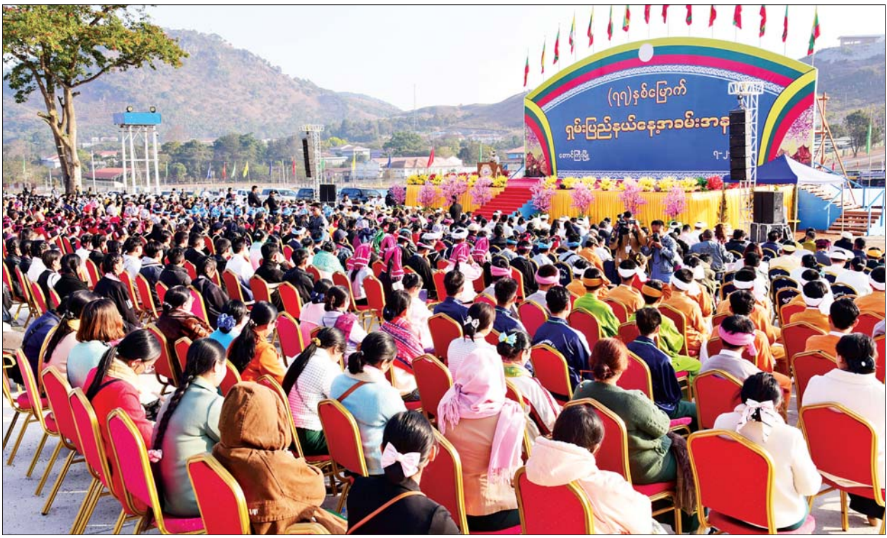
(၇၇) နှစ်မြောက် ရှမ်းပြည်နယ်နေ့အခမ်းအနားကို တောင်ကြီးမြို့ အဝေရာမီးပုံးပျံကွင်း၌ ကျင်းပစဉ်။

တက်ရောက် အခမ်းအနားသို့ နိုင်ငံတော်စီမံအုပ်ချုပ်ရေးကောင်စီအဖွဲ့ဝင်များ ဖြစ်ကြသည့် ဒေါက်တာဘရွှေနှင့် ခွန်စုံလွင်၊ ပြည်ထောင်စုဝန်ကြီးများဖြစ်ကြသည့် ဦးမင်းသိန်းဇံ၊ ဒေါက်တာစိုးဝင်း၊ Jeng Phang နော်တောင်၊ ရှမ်းပြည်နယ်ဝန်ကြီးချုပ် ဦးအောင်အောင်၊ ဒုတိယဝန်ကြီးများ၊ ပြည်နယ်အစိုးရအဖွဲ့ဝင်ဝန်ကြီးများ၊ ဖိတ်ကြားထားသူများ၊ တိုင်းရင်းသားရိုးရာယဉ်ကျေးမှုအဖွဲ့များ၊ ဒေသခံတိုင်းရင်းသားညီအစ်ကိုမောင်နှမများ တက်ရောက်ကြသည်။