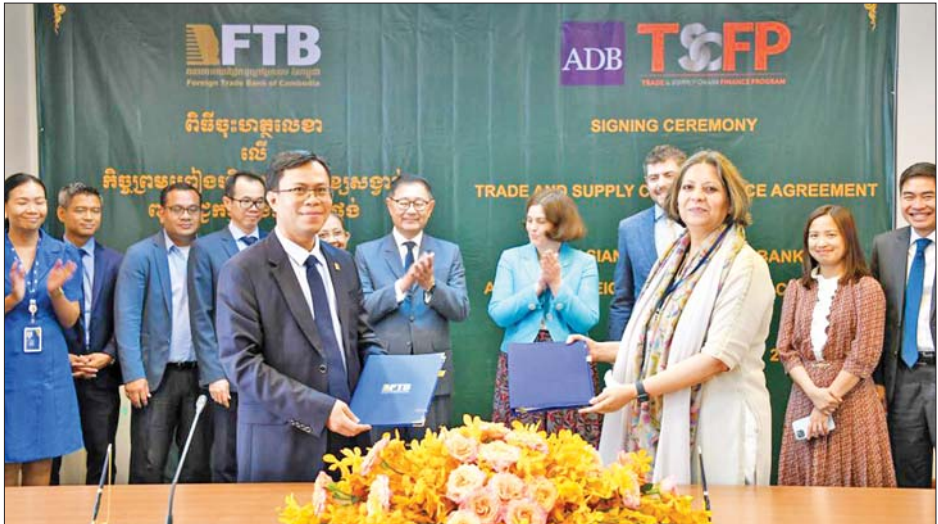
ကမ္ဘောဒီးယား နိုင်ငံခြားကုန်သွယ်မှုဘဏ်သည် အာရှဖွံ့ဖြိုးရေးဘဏ်နှင့် ကုန်သွယ်မှုဆိုင်ရာ အသိပညာနှင့် ကျွမ်းကျင်မှုများ မြှင့်တင်ရေး ဆောင်ရွက်နေပြီး ယင်းအစီအစဉ်သည် နိုင်ငံခြားကုန်သွယ်မှုဘဏ်အတွက် စွမ်းရည်များ တည်ဆောက်ရာတွင် အထောက်အပံ့ဖြစ်စေကြောင်း ၎င်းက ပြောကြားခဲ့သည်။ ကိုးကား - ဆင်ဟွာ ဘာသာပြန် - စိုးသူရ

ကမ္ဘောဒီးယားရှိ လုပ်ငန်းအားလုံး၏ ၉၉ ရာခိုင်နှုန်းကို ကိုယ်စားပြုသည့် ကုန်သွယ်မှုနှင့် အသေးစား၊ အငယ်စား၊ အလတ်စားစီးပွားရေးလုပ်ငန်းများကို ပံ့ပိုးပေးရေးအတွက် မိတ်ဖက်ဘဏ်များမှတစ်ဆင့် ဘဏ္ဍာငွေများ ပံ့ပိုးပေးခြင်းအားဖြင့် ဈေးကွက်ကွာဟချက်များကို ဖြည့်ဆည်းပေးနိုင်မည်ဖြစ်ကြောင်း ကမ္ဘောဒီးယားနိုင်ငံခြားကုန်သွယ်မှုဘဏ် အမှုဆောင်အရာရှိချုပ် ဒစ်ဆီချယ်လ်က မှတ်ချက်ပြု ပြောကြားခဲ့သည်။