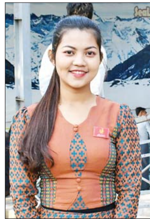
မိစ္ဆာလင်း