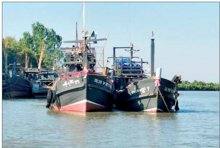
တတိုင်းရနှင့် လမင်းမေတ္တာ-၇ အမည်ရှိ တရားမဝင်လှေတို့၏ ဦးပိုင်းအား တွေ့မြင်ရပုံ။