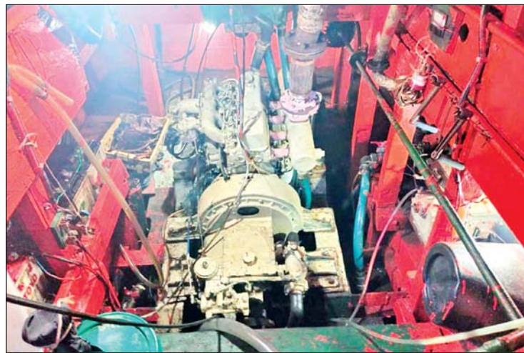
လမင်းမေတ္တာ-၇ အမည်ရှိ တရားမဝင်လှေ၏ စက်မကြီးအား တွေ့မြင်ရပုံ။