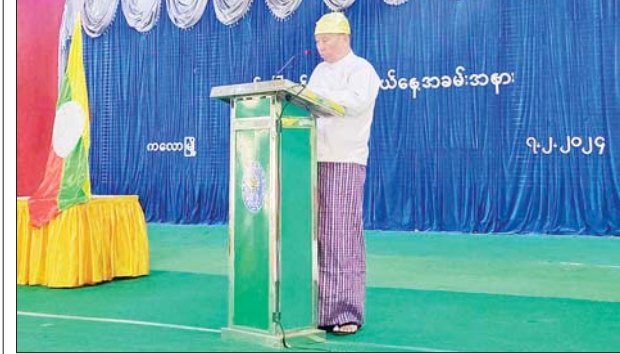
ဖေဖော်ဝါရီ ၇ ရက်က ကလေးမြို့၌ ကျင်းပသည့် (၇၇)နှစ်မြောက် ရှမ်းပြည်နယ်နေ့ အခမ်းအနားတွင် နိုင်ငံတော်စီမံအုပ်ချုပ်ရေးကောင်စီဥက္ကဋ္ဌ နိုင်ငံတော်ဝန်ကြီးချုပ် ဗိုလ်ချုပ်မှူးကြီးမင်းအောင်လှိုင်ထံမှပေးပို့သော သဝဏ်လွှာကို ကလေးခရိုင်စီမံအုပ်ချုပ်ရေးအဖွဲ့ဥက္ကဋ္ဌ ဦးစိုးမြင့် ဖတ်ကြားစဉ်။ သတင်းစဉ်

ဟု ဦးရဲမင်းအောင်က ပြောသည်။ ထိုသို့ ဆောင်ရွက်ရာတွင် တစ်ဧကလျှင် လေးသိန်းနှုန်းဖြင့် တစ်ဦးချင်း ပိုင်ဆိုင်မှုဧကအလိုက် စိုက်ပျိုးစရိတ်ချေးငွေထုတ်ချေးပေးရန် အစီအစဉ်များလုပ်ဆောင်နေကြောင်းလည်း ၎င်းက ပြောသည်။ “ဆန်စပါးစိုက်ပျိုးထုတ်လုပ်တဲ့ တောင်သူတွေအတွက် နိုင်ငံတော်ဘဏ်ကနေ စိုက်ပျိုးစရိတ်ချေးငွေပေးတာရှိတယ်။ ပုဂ္ဂလိကဘဏ်တွေနဲ့ချိတ်ဆက်ပြီးတော့စတင်ပြီး ပုဂ္ဂလိကဘဏ်ကနေ တစ်ဧကကို လေးသိန်းနှုန်းပေးဖို့တောင်သူကြီးတွေ ဧကရှိသလောက် ၁၅ ဧကရှိတယ်။ ဧက ၂၀ ရှိတယ်စသဖြင့်ဧကရှိသလောက်ကို စိုက်ပျိုးစရိတ်ချေးငွေပေးဖို့အစီအစဉ်များလည်း လုပ်နေတာတွေရှိပါတယ်”ဟု ဦးရဲမင်းအောင်က ပြောသည်။ မြန်မာနိုင်ငံဆန်စပါးအသင်းချုပ်အနေဖြင့် ပုဂ္ဂလိကဘဏ်များနှင့် ချိတ်ဆက်၍ ကာလတိုချေးငွေကို ဧကစုစုပေါင်းတစ်သိန်းအထိ ထုတ်ချေးပေးရန် လျာထားဆောင်ရွက်ခြင်းဖြစ်ကြောင်း သိရသည်။ MT