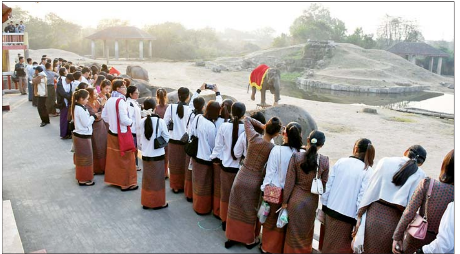
အဆိုပါ တိုင်းရင်းသားရိုးရာယဉ်ကျေးမှုအဖွဲ့တွင် ကချင်ပြည်နယ်မှ ၃၅ ဦး၊ ကယားပြည်နယ်မှ ၄၀၊ ကရင်ပြည်နယ်မှ ၄၀၊ ချင်းပြည်နယ်မှ ၄၀၊ မွန်ပြည်နယ်မှ ၃၇ ဦး၊ ဧရာဝတီတိုင်းဒေသကြီးမှ ၃၅ ဦး၊ ရခိုင်ပြည်နယ်မှ ၃၁ ဦးနှင့် ရှမ်းပြည်နယ်မှ ၄၀ တို့ပါဝင်၍ ၂၀၂၄ ခုနှစ် (၇၇)နှစ်မြောက် ပြည်ထောင်စုနေ့အခမ်းအနားတွင် တိုင်းရင်းသားရိုးရာယဉ်ကျေးမှုအကဲဖြင့် ကပြဖျော်ဖြေတင်ဆက်သွားကြမည်ဖြစ်ကြောင်း သိရသည်။ သတင်းစဉ်

ကောင်များ၊ ပင်လယ်ဖျံ၊ ပင်ပွင့်ငှက်ကလေးများနှင့် ငါးပြတိုက်တို့ကို စိတ်ဝင်တစား လေ့လာကြည့်ရှုကြသည်။ ယင်းနောက် နက္ခတ်တာရာပြခန်းအတွင်း ပြသထားသည့် ဂြိုဟ်၊ လ၊ ကမ္ဘာများအကြောင်း၊ စကြဝဠာကြီးအတွင်းရှိ ထူးခြားဆန်းပြားလှသော အရာများ၊ ကြယ်တာရာများ၏ ဖွဲ့စည်းတည်ရှိပုံ၊ ကမ္ဘာကြီး၏ ဆွဲငင်အားစသည့် နက္ခတ်တာရာ သိပ္ပံဆိုင်ရာ ဗဟုသုတတိုးပွားဖွယ်ရာ အကြောင်းများကို ကြည့်ရှုလေ့လာကြပြီး စကြဝဠာဆိုင်ရာ ပညာပေးဗီဒီယိုကို ကြည့်ရှုကြသည်။ ဆက်လက်၍ လေ့လာရေးအဖွဲ့သည် အမျိုးသားအထိမ်းအမှတ်ဥယျာဉ်၊ စစ်သမိုင်းပြတိုက်နှင့် အမျိုးသားပြတိုက်၊ နေပြည်တော်မြို့မဈေးတို့ကို ဆက်လက်သွားရောက်လေ့လာကြသည်။