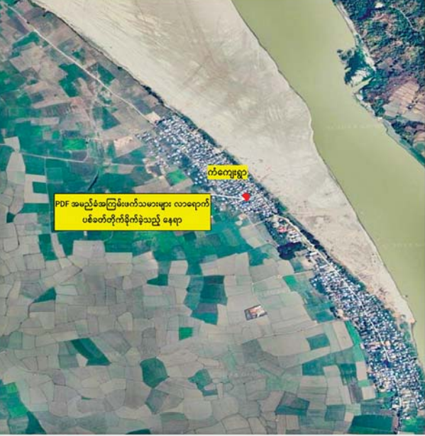
PDF အမည်ခံအကြမ်းဖက်သမားများက မင်းကင်းမြို့နယ် ကံကျေးရွာအတွင်းသို့ လက်နက်ကြီး၊ လက်နက်ငယ်များဖြင့် လာရောက်ပစ်ခတ်တိုက်ခိုက်ခဲ့သည့်နေရာပြပုံ။

နေပြည်တော် ဖေဖော်ဝါရီ ၇ စစ်ကိုင်းတိုင်းဒေသကြီး မင်းကင်းမြို့နယ် ကံကျေးရွာအတွင်းသို့ PDF အမည်ခံ အကြမ်းဖက်သမားများက ယနေ့နံနက်ပိုင်းတွင်