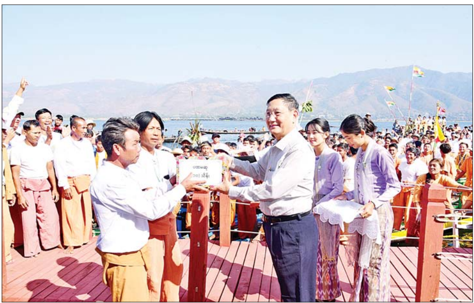
နိုင်ငံတော်စီမံအုပ်ချုပ်ရေး ကောင်စီအဖွဲ့ဝင် ဒေါက်တာ ဘရွှေ ပထမဆုများရရှိသည့် လှေလှော်အသင်းအား ဆု ပေးအပ်ချီးမြှင့်စဉ်။

သမီး (၄၆) တက်လှော်ပြိုင်ပွဲ၊ အမျိုးသား အမျိုးသမီးရာကော် လှေလှော်အသင်းများ ယှဉ်ပြိုင် လှော်ခတ်ကြရာ နိုင်ငံတော်စီမံ အုပ်ချုပ်ရေးကောင်စီ အဖွဲ့ဝင် များ၊ ပြည်ထောင်စုဝန်ကြီးများ၊ ဧည့်သည်တော်များနှင့် ဒေသခံ တိုင်းရင်းသား ပြည်သူများက ကြည့်ရှုအားပေးကြသည်။ ပေးအပ်ချီးမြှင့် ပြိုင်ပွဲများအပြီးတွင် ဆုပေးပွဲ ကို ဆက်လက်ကျင်းပရာ နှစ်သိမ့် ဆု၊ ဒုတိယဆုနှင့် ပထမဆုများရရှိ ကြသည့် လှေလှော်အသင်းများကို ဒုတိယဝန်ကြီးများ၊ တရုတ်သံရုံးမှ သံမှူးကြီး၊ ရှမ်းပြည်နယ်ဝန်ကြီး ချုပ်၊ ပြည်ထောင်စုဝန်ကြီးများနှင့် နိုင်ငံတော် စီမံအုပ်ချုပ်ရေး ကောင်စီအဖွဲ့ဝင်များက ဆုများ ပေးအပ်ချီးမြှင့်ကြသည်။ ထို့နောက် နိုင်ငံတော်စီမံ အုပ်ချုပ်ရေးကောင်စီ အဖွဲ့ဝင် များ၊ ပြည်ထောင်စုဝန်ကြီးများနှင့် တာဝန်ရှိသူများသည် သမိုင်းဝင် အင်းလေးဖောင်တော်ဦးဘုရားသို့ သွားရောက်ဖူးမြော် ကြည့်ညိုကြ ကာ ရွှေသင်္ကန်းနှင့် လှူဖွယ်ဝတ္ထု များ ဆက်ကပ်လှူဒါန်းခဲ့ကြ ကြောင်း သိရသည်။ သတင်းစဉ်