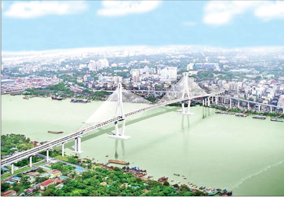
မြန်မာ-ကိုရီးယား ချစ်ကြည်ရေး (ဒလ)တံတား တည်ဆောက်ပြီးပါက တွေ့ရမည့်ပုံ။

ကိုရီးယားနိုင်ငံမှ သံမဏိကြိုးဆိုင်တံတားများ ဥပမာအားဖြင့် ကိုရီးယားနိုင်ငံတွင် ဆောက်လုပ်ထားသော သံမဏိကြိုးဆိုင် (Cable-Stayed) တံတားအမျိုးအစားဖြစ်သည့် Yeosu Bridge သည် ဆင်ခြေလျှောတံတား (Ramp Bridge) တွင် လျှောစောက်(Gradient) 7.5 % ရှိပြီး Bukhang တံတား၏ ဆင်ခြေလျှောတံတား(Ramp Bridge)