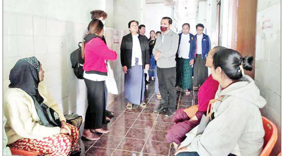
ကျန်းမာရေးဝန်ကြီးဌာန ဒုတိယဝန်ကြီး ပါမောက္ခ ဒေါက်တာအေးထွန်း စစ်ထွန်းပြည်သူ့ဆေးရုံကြီး၌ ကြည့်ရှုစစ်ဆေးစဉ်။

ဌာနများ ဆောင်ရွက်နေမှုနှင့် ဓာတ်ရောင်ခြည်ကုသ ရေးလုပ်ငန်းများကို ကြည့်ရှုစစ်ဆေးသည်။ ထို့နောက် ဆေးရုံအုပ်ကြီး၊ အထူးကုဆရာ ဝန်ကြီးများနှင့် တွေ့ဆုံကာ အထူးကု ပြင်ပလူနာဌာန အဆင့်မြှင့်တင်နိုင်ရေးနှင့် ဓာတ်ရောင်ခြည်ကုသမှု များ ပိုမိုတိုးတက်ဆောင်ရွက်နိုင်ရေးနှင့်ပတ်သက်၍ ညှိနှိုင်းဆွေးနွေးကာ တင်ပြချက်များအပေါ် ဖြည့်ဆည်း ဆောင်ရွက်ပေးသည်။ ယင်းနောက် ဒုတိယဝန်ကြီးနှင့် အဖွဲ့သည် ဆေးတက္ကသိုလ်(တောင်ကြီး)သို့ ရောက်ရှိပြီး ပါမောက္ခချုပ် ပါမောက္ခ ဒေါက်တာလှဝင်းမြင့်နှင့် ဘာသာရပ်ဆိုင်ရာ ပါမောက္ခ/ဌာနမှူးများ၊ သင်ကြား ရေးဆိုင်ရာ အထူးကုဆရာဝန်ကြီးများနှင့် တွေ့ဆုံ၍ ဆေးပညာသင်ကြားရေးလုပ်ငန်းများ အဆင်ပြေစွာ ဆောင်ရွက်နိုင်ရေးအတွက် လိုအပ်သည်များ ညှိနှိုင်း ဖြည့်ဆည်းပေးသည်။ ဆက်လက်၍ တောင်ကြီးမြို့ သူနာပြုသင်တန်း ကျောင်းသို့ရောက်ရှိပြီး စာသင်ဆောင်၊ သင်တန်းသား သင်တန်းသူ အဆောင်များသို့ လှည့်လည်ကြည့်ရှု စစ်ဆေးကာ သင်တန်းသား သင်တန်းသူများ နေထိုင် စားသောက်မှု အဆင်ပြေစွာဖြင့် သင်ယူမှုများ ဆောင်ရွက်နိုင်ရေးအတွက် လိုအပ်သည်များ မှာကြားဖြည့်ဆည်းပေးခဲ့ကြောင်း သိရသည်။ သတင်းစဉ်