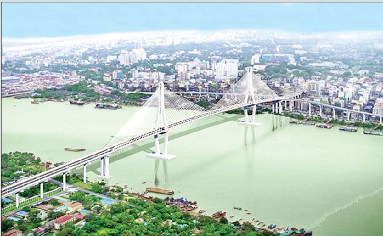
မြန်မာ-ကိုရီးယား ချစ်ကြည်ရေး (ဒလ)တံတား တည်ဆောက်ပြီးပါက တွေ့ရမည့်ပုံ။