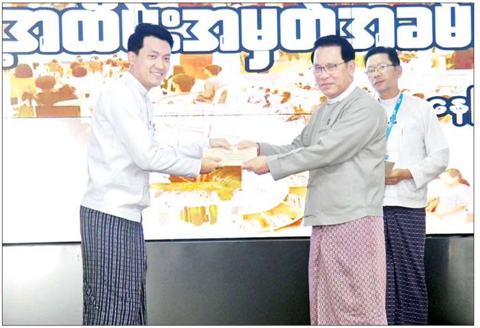
ပြည်ထောင်စုဝန်ကြီး ဦးမောင်မောင်အုန်း ညွှန်ကြားရေးမှူးချုပ်အဖွဲ့ဝင်များကို ခန့်အပ်လွှာပေးအပ်စဉ်။

ယင်းနောက် ပြည်ထောင်စုဝန်ကြီး ဦးမောင်မောင်အုန်းက ညွှန်ကြားရေးမှူးချုပ်အဖွဲ့ဝင်များအား လွှာများ ပေးအပ်သည်။