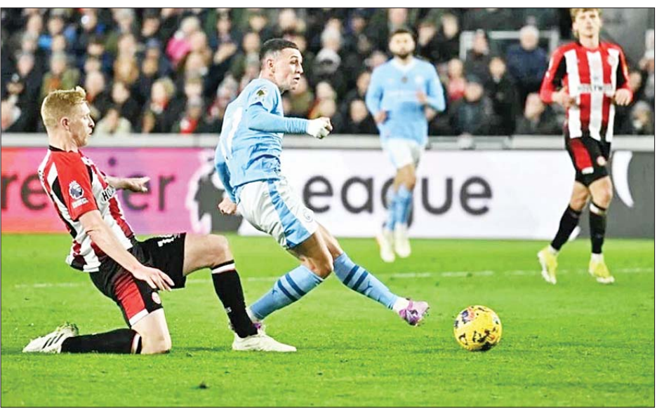
ပရီမီယာလိဂ်ပွဲစဉ်(၂၃) အဖြစ် ဘရန့်ဖွဲ့ဒ်အသင်းနှင့် မန်စီးတီးအသင်းတို့ ယှဉ်ပြိုင်ကစားကြစဉ်။

ရန်ကုန် ဖေဖော်ဝါရီ ၆ မြန်မာနိုင်ငံဂေါက်သီးအားကစားအဖွဲ့ချုပ်က ကြီးမှူးကျင်းပသော (President Cup) ဥက္ကဋ္ဌဖလား ဂေါက်သီးရိုက်ပြိုင်ပွဲ၏ Tour Pro နှင့် Senior Pro အဆင့်ပြိုင်ပွဲ ဖွင့်ပွဲအခမ်းအနားကို ယနေ့နံနက်ပိုင်းက ရန်ကုန်တိုင်းဒေသကြီး မင်္ဂလာဒုံမြို့နယ်ရှိ မြို့တော်ဂေါက်ကွင်း (ငွေသော်တာ)၌ ပြုလုပ်သည်။ စာမျက်နှာ ၁၈ ကော်လံ ၅ သို့ ❖