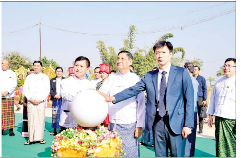
နိုင်ငံတော်စီမံအုပ်ချုပ်ရေးကောင်စီအဖွဲ့ဝင် ဒေါက်တာဘရွှေ၊ ခွန်စုံလွင်နှင့် သံမှူးကြီး ဒေါက်တာကျန်းကျိဟုန်တို့က ကမ္ဘည်းမော်ကွန်းကျောက်စာကို စက်ခလုတ်နှိပ် ဖွင့်လှစ်ပေးစဉ်။

တက်ရောက် အခမ်းအနားသို့ နိုင်ငံတော်စီမံ အုပ်ချုပ်ရေး ကောင်စီအဖွဲ့ဝင်များ ဖြစ်ကြသည့် ဒေါက်တာဘရွှေနှင့် ခွန်စုံလွင်၊ ပြည်ထောင်စုဝန်ကြီး များဖြစ်ကြသည့် ဦးမင်းသိန်း၊ ဒေါက်တာစိုးဝင်း၊ Jeng Phang နော်တောင်၊ ရှမ်းပြည်နယ် ဝန်ကြီးချုပ် ဦးအောင်အောင်၊ မြန်မာနိုင်ငံဆိုင်ရာ တရုတ် သံရုံးမှ သံမှူးကြီး ဒေါက်တာ ကျန်းကျိဟုန်၊ ဒုတိယ ဝန်ကြီး ဒေါက်တာအေးထွန်း၊ ဦးဇော်အေး မောင်နှင့် ရှမ်းပြည်နယ်