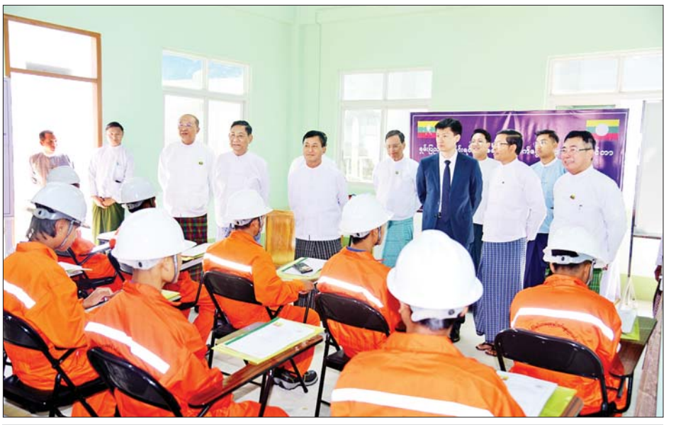
နိုင်ငံတော်စီမံအုပ်ချုပ်ရေးကောင်စီအဖွဲ့ဝင် ဒေါက်တာဘရွှေ၊ ခွန်စုံလွင်နှင့်တာဝန်ရှိသူများ မော်တော် ဆိုင်ကယ်စက်ပြင်သင်တန်းမှ နည်းပြများနှင့် သင်တန်းသားများကို ရင်းရင်းနှီးနှီးတွေ့ဆုံစဉ်။