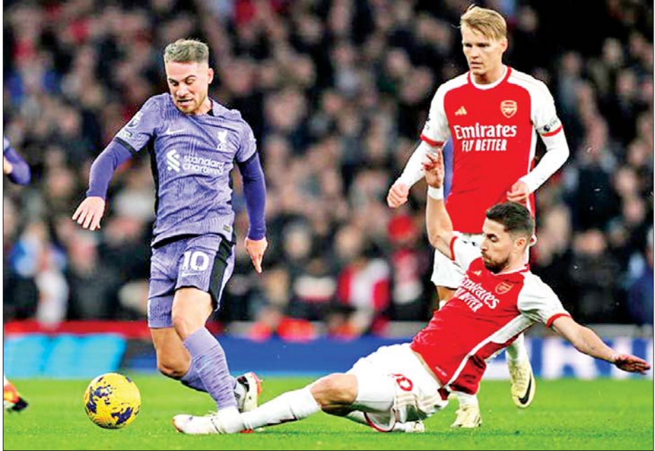
လီဗာပူးအသင်းနှင့် အာဆင်နယ်အသင်းတို့ ယှဉ်ပြိုင်ကစားကြစဉ်။

ပရီမီယာလိဂ် ပွဲစဉ်(၂၃)ရဲ့ ဖေဖော်ဝါရီ ၄ ရက် ညပိုင်း အကောင်းဆုံး ပွဲစဉ်တွေထဲက တစ်ပွဲဖြစ်တဲ့ အာဆင်နယ်အသင်း နဲ့ လီဗာပူးအသင်းတို့ ပွဲစဉ်မှာ အိမ်ရှင်အဖြစ် ဧည့်ခံကစားခဲ့ရတဲ့ အာဆင်နယ်အသင်းက လီဗာပူး အသင်းကို သုံးဂိုး-တစ်ဂိုးနဲ့ အနိုင် ရရှိခဲ့ပါတယ်။ အာဆင်နယ်အသင်းနဲ့ လီဗာပူး အသင်းတို့ပွဲစဉ်မှာ အာဆင်နယ် အသင်းအတွက် သွင်းဂိုးတွေကို ပထမပိုင်းပွဲကစားချိန် ၁၄ မိနစ်မှာ ဆာကာ၊ ၆၇ မိနစ်မှာ မာတီနယ်လီ နဲ့ သာမန်ပွဲကစားချိန် မိနစ် ၉၀ အပြီး နာကျင်အချိန်ပို နှစ်မိနစ်မှာ ထရော့ဆက်ဒ်တို့က တစ်ဂိုးစီ သွင်းယူပေးခဲ့ပြီး လီဗာပူးအသင်း စာမျက်နှာ ၁၇ ကော်လံ ၃ သို့ ✱