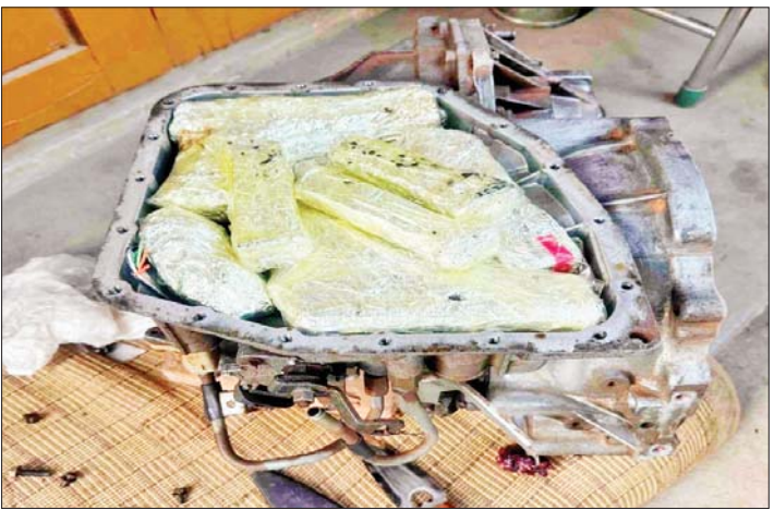
အောင်မြေသာစံမြို့နယ် မင်းတဲအိကင်းရပ်ကွက်၌ သိမ်းဆည်းရမိခဲ့သည့် လက်နက်/ခဲယမ်းများ၏ မှတ်တမ်းဓာတ်ပုံ။