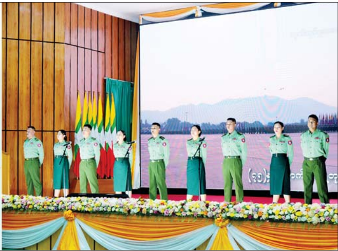
နိုင်ငံတော်စီမံအုပ်ချုပ်ရေးကောင်စီဒုတိယဥက္ကဋ္ဌ ဒုတိယတပ်မတော်ကာကွယ်ရေးဦးစီးချုပ် ကာကွယ်ရေးဦးစီးချုပ်(ကြည်း) ဒုတိယဗိုလ်ချုပ်မှူးကြီး စိုးဝင်း (၇၅)နှစ်မြောက် စိန်ရတု ဆက်သွယ်ရေးတပ်ဖွဲ့နေ့ ဂုဏ်ပြုသီချင်းဖြင့် ဆက်သွယ်ရေးတပ်ဖွဲ့ဝင်များ၏ ဖျော်ဖြေတင်ဆက်မှုကို ကြည့်ရှုအားပေးစဉ်။

ကိုတည်ဆောက်နိုင်ခဲ့ပြီး စစ်ဘက်၊ နယ်ဘက် နှစ်ရပ်လုံးတွင် အသုံးပြုနိုင်ခဲ့သည့်အတွက် Information Communication Technology ဟုခေါ်သည့် ICT ကဏ္ဍတွင် တစ်ဟုန်ထိုး တိုးတက်မြှင့်တင်လာခဲ့သည်ကို တွေ့ကြုံရမည်ဖြစ်ကြောင်း။ ထို့အပြင် ဆက်သွယ်ရေးတပ်ဖွဲ့အနေနှင့် မျက်မှောက်ခေတ်စစ်ပွဲများတွင် မရှိမဖြစ်အရေးပါသည့် Electronic Warfare (EW)