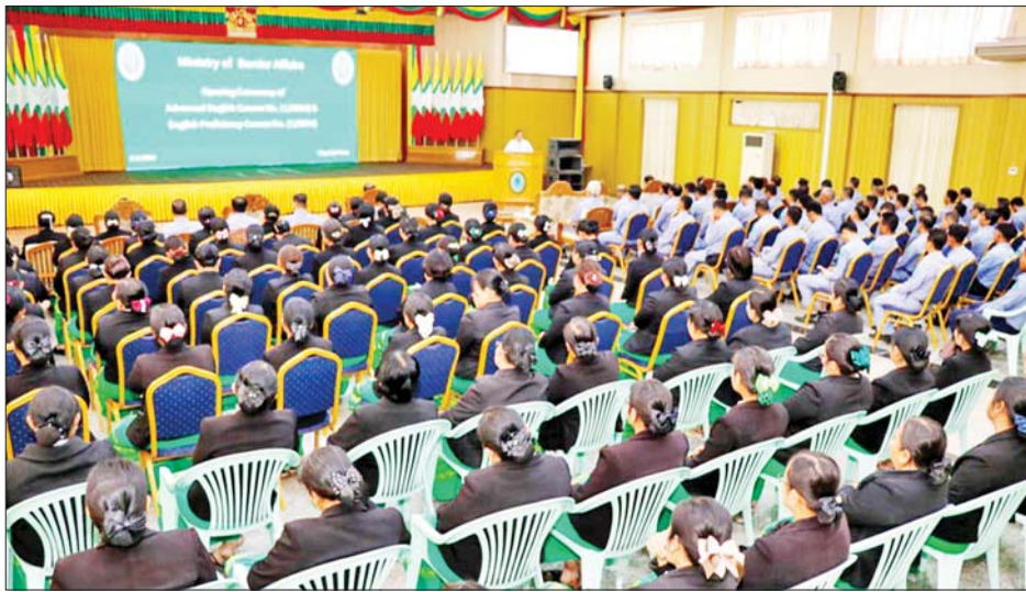
ဦးစွာ ပြည်ထောင်စုဝန်ကြီးက အဆင့်မြင့် အင်္ဂလိပ်စာသင်တန်းသို့ တက်ရောက်ကြမည့် သင်တန်းသား သင်တန်းသူများအနေဖြင့် ပြီးခဲ့သည့် အင်္ဂလိပ်စာစွမ်းရည် တိုးတက်ရေးသင်တန်းအမှတ်စဉ် (၁/၂၀၂၃) မှ သင်ကြားတတ်မြောက်ခဲ့သည့် အခြေခံ ကောင်းများကိုအရင်းခံ၍ ယခင်ကထက် ပိုမိုထူးချွန် ထက်မြက်အောင် လေ့လာသင်ယူသွားကြရန် လိုအပ် မည် ဖြစ်ပါကြောင်း၊ အလားတူ အင်္ဂလိပ်စာ တိုးတက်

နေပြည်တော် ဖေဖော်ဝါရီ ၅ နယ်စပ်ရေးရာဝန်ကြီးဌာန ဝန်ကြီးရုံးနှင့် ဦးစီးဌာနများတွင် တာဝန်ထမ်းဆောင်လျက်ရှိသည့် ဝန်ထမ်းများ၏ စွမ်းဆောင်ရည်မြှင့်တင်ရေးအတွက် အဆင့်မြင့်အင်္ဂလိပ်စာသင်တန်းအမှတ်စဉ် (၁/၂၀၂၄)နှင့် အင်္ဂလိပ်စာစွမ်းရည် တိုးတက်ရေးသင်တန်း အမှတ်စဉ် (၁/၂၀၂၄) ဖွင့်ပွဲ အခမ်းအနားကို ယနေ့မနက် ၉ နာရီခွဲတွင် ဝန်ကြီးဌာန စာတန်းခန်းမ၌ ကျင်းပသည်။