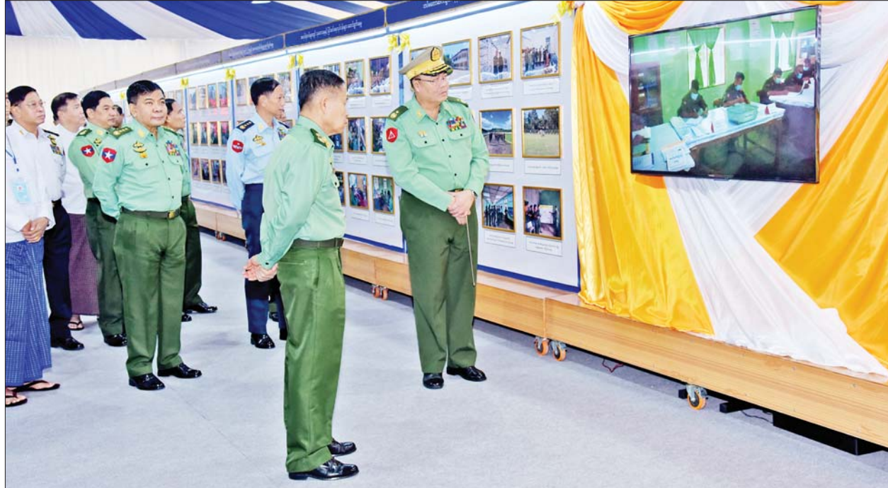
နိုင်ငံတော်စီမံအုပ်ချုပ်ရေးကောင်စီဒုတိယဥက္ကဋ္ဌ ဒုတိယတပ်မတော်ကာကွယ်ရေးဦးစီးချုပ် ကာကွယ်ရေးဦးစီးချုပ်(ကြည်း) ဒုတိယဗိုလ်ချုပ်မှူးကြီး စိုးဝင်း (၇၅)နှစ်မြောက် စိန်ရတု ဆက်သွယ်ရေးတပ်ဖွဲ့နေ့ အထိမ်းအမှတ်ပြခန်းများကို လှည့်လည်ကြည့်ရှုစဉ်။

စိန်ရတု ဆက်သွယ်ရေးတပ်ဖွဲ့နေ့ အထိမ်းအမှတ် မှတ်တမ်း Documentary Video ကို ပြသသည်။ ထို့နောက် (၇၅)နှစ်မြောက် စိန်ရတု ဆက်သွယ်ရေးတပ်ဖွဲ့နေ့ ဂုဏ်ပြုသီချင်းဖြင့် ဆက်သွယ်ရေးတပ်ဖွဲ့ဝင်များက ဖျော်ဖြေတင်ဆက်သည်။ ယင်းနောက် နိုင်ငံတော်စီမံအုပ်ချုပ်ရေးကောင်စီ ဒုတိယဥက္ကဋ္ဌ ဒုတိယတပ်မတော်ကာကွယ်ရေးဦးစီးချုပ် ကာကွယ်ရေးဦးစီးချုပ်(ကြည်း)ထံ ဆက်သွယ်ရေးညွှန်ကြားရေးမှူးက (၇၅)နှစ်မြောက် စိန်ရတုဆက်သွယ်ရေးတပ်ဖွဲ့နေ့ အထိမ်းအမှတ်လက်ဆောင်ကို နေရာအရောက် ဂါရဝပြုပေးအပ်သည်။