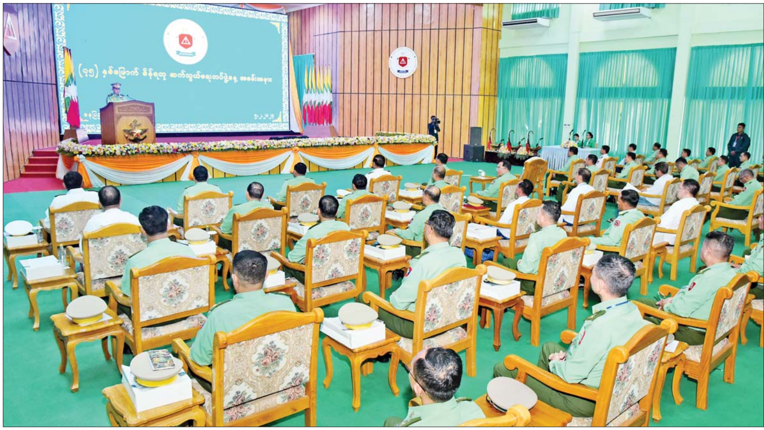
နိုင်ငံတော်စီမံအုပ်ချုပ်ရေးကောင်စီဒုတိယဥက္ကဋ္ဌ ဒုတိယတပ်မတော်ကာကွယ်ရေးဦးစီးချုပ် ကာကွယ်ရေးဦးစီးချုပ်(ကြည်း) ဒုတိယဗိုလ်ချုပ်မှူးကြီး စိုးဝင်း (၇၅)နှစ်မြောက် စိန်ရတုဆက်သွယ်ရေးတပ်ဖွဲ့နေ့အခမ်းအနားတွင် ဂုဏ်ပြုအမှာစကားပြောကြားစဉ်။

နေပြည်တော် ဖေဖော်ဝါရီ ၅ (၇၅)နှစ်မြောက် စိန်ရတုဆက်သွယ်ရေးတပ်ဖွဲ့နေ့အခမ်းအနားကို ယနေ့ နံနက်ပိုင်းတွင် နေပြည်တော်စစ်ကြောရေးနှင့်တည်ခိုရေးစခန်းရှိ ဆင်ဖြူရှင်ခန်းမ၌ ကျင်းပရာ နိုင်ငံတော်စီမံအုပ်ချုပ်ရေးကောင်စီ ဒုတိယဥက္ကဋ္ဌ ဒုတိယတပ်မတော်ကာကွယ်ရေးဦးစီးချုပ် ကာကွယ်ရေးဦးစီးချုပ်(ကြည်း) ဒုတိယဗိုလ်ချုပ်မှူးကြီး စိုးဝင်း တက်ရောက်ချီးမြှင့်သည်။ အဆိုပါ (၇၅)နှစ်မြောက် စိန်ရတုဆက်သွယ်ရေးတပ်ဖွဲ့နေ့ အခမ်းအနားသို့ နိုင်ငံတော် စီမံအုပ်ချုပ်ရေးကောင်စီ ဒုတိယဥက္ကဋ္ဌ ဒုတိယတပ်မတော်ကာကွယ်ရေးဦးစီးချုပ် ကာကွယ်ရေးဦးစီးချုပ်(ကြည်း)နှင့်အတူ နိုင်ငံတော်စီမံအုပ်ချုပ်ရေးကောင်စီအဖွဲ့ဝင်များ၊ ပြည်ထောင်စုဝန်ကြီးများ၊ ကာကွယ်ရေးဦးစီးချုပ်ရုံးမှ အဆင့်မြင့် တပ်မတော်အရာရှိကြီးများ၊ နေပြည်တော်တိုင်းစစ်ဌာနချုပ် တိုင်းမှူး၊ အငြိမ်းစား ဆက်သွယ်ရေးတပ်ဖွဲ့ဝင် အရာရှိကြီးများ၊ တာဝန်ရှိသူများနှင့် ဖိတ်ကြားထားသူများ တက်ရောက်ကြသည်။ စာမျက်နှာ ၃ ကော်လံ ၁ သို့ ။