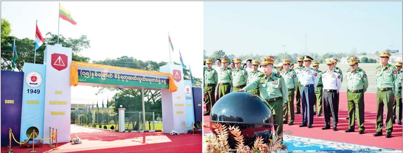
နိုင်ငံတော်စီမံအုပ်ချုပ်ရေးကောင်စီဒုတိယဥက္ကဋ္ဌ ဒုတိယတပ်မတော်ကာကွယ်ရေးဦးစီးချုပ် ကာကွယ်ရေးဦးစီးချုပ် (ကြည်း) ဒုတိယဗိုလ်ချုပ်မှူးကြီး စိုးဝင်း (၇၅)နှစ်မြောက် စိန်ရတု ဆက်သွယ်ရေးတပ်ဖွဲ့နေ့ အထိမ်းအမှတ်ဆိုင်းဘုတ်အား စက်ခလုတ်နှိပ်ဖွင့်လှစ်ပေးစဉ်။

☆ ရှေ့ဖွဲ့မှ ဦးစွာ ညှိနှိုင်းကွပ်ကဲရေးမှူး (ကြည်း၊ ရေလေ) ဗိုလ်ချုပ်ကြီး မောင်မောင်အေး၊ တိုင်းမှူး ဗိုလ်ချုပ် စောသန်းလှိုင်နှင့် ဆက်သွယ်ရေး ညွှန်ကြားရေးမှူး ဗိုလ်ချုပ် ထွန်းထွန်းဦးတို့က (၇၅)နှစ်မြောက် စိန်ရတု ဆက်သွယ်ရေးတပ်ဖွဲ့နေ့ အခမ်းအနားကို ဖဲကြိုးဖြတ် ဖွင့်လှစ်ပေးသည်။ ထို့နောက် နိုင်ငံတော်စီမံအုပ်ချုပ်ရေးကောင်စီဒုတိယဥက္ကဋ္ဌ ဒုတိယ တပ်မတော်ကာကွယ်ရေး ဦးစီးချုပ် ကာကွယ်ရေးဦးစီးချုပ် (ကြည်း)က (၇၅)နှစ်မြောက် စိန်ရတုဆက်သွယ်ရေးတပ်ဖွဲ့နေ့ အထိမ်းအမှတ် ဆိုင်းဘုတ်အား စက်ခလုတ်နှိပ် ဖွင့်လှစ်ပေးပြီး တက်ရောက်လာကြသူများနှင့် အတူ စုပေါင်းမှတ်တမ်းတင် ဓာတ်ပုံရိုက်ကြသည်။