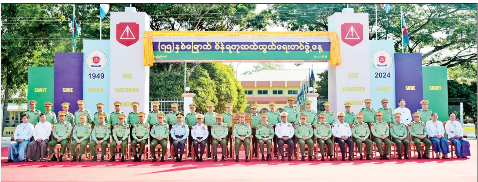
နိုင်ငံတော်စီမံအုပ်ချုပ်ရေးကောင်စီဒုတိယဥက္ကဋ္ဌ ဒုတိယတပ်မတော်ကာကွယ်ရေးဦးစီးချုပ် ကာကွယ်ရေးဦးစီးချုပ် (ကြည်း) ဒုတိယဗိုလ်ချုပ်မှူးကြီး စိုးဝင်း (၇၅)နှစ်မြောက် စိန်ရတု ဆက်သွယ်ရေးတပ်ဖွဲ့နေ့အခမ်းအနား တက်ရောက်လာကြသူများနှင့်အတူ စုပေါင်းမှတ်တမ်းတင်ဓာတ်ပုံရိုက်စဉ်။

ဂုဏ်ပြုအမှာစကားပြောကြား ယင်းနောက် နိုင်ငံတော် စီမံအုပ်ချုပ်ရေးကောင်စီ ဒုတိယ ဥက္ကဋ္ဌ ဒုတိယတပ်မတော်ကာကွယ် ရေးဦးစီးချုပ် ကာကွယ်ရေးဦးစီး ချုပ် (ကြည်း)က (၇၅)နှစ်မြောက် စိန်ရတု ဆက်သွယ်ရေးတပ်ဖွဲ့နေ့ အထိမ်းအမှတ်ဂုဏ်ပြု အမှာစကား ပြောကြားရာတွင် ယနေ့သည် မြန်မာ့လွတ်လပ်ရေး ကြိုးပမ်းမှု သမိုင်းကာလတွင် မြန်မာ့ တပ်မတော် စတင်ဖွဲ့စည်းခဲ့စဉ်က တပ်မတော်၏အစိတ်အပိုင်းတစ်ခု အဖြစ်ပါဝင်ခဲ့သည့် ဆက်သွယ်ရေး တပ်ဖွဲ့၏ (၇၅)နှစ်မြောက် စိန်ရတု နေ့ ရက်မြတ်အခါသမယပင်ဖြစ် ကြောင်း၊ တပ်မတော် စတင်တည် ထောင်ချိန်မှ ယနေ့ကာလအထိ ဆက်သွယ်ရေးတပ်ဖွဲ့ အနေဖြင့် “မြန်မာမည်၊ မှန်ကန်သေချာရမည်၊ လုံခြုံမှုရှိရမည်၊ အီလက်ထရောနစ် စစ်ဆင်ရေးကိုအောင်မြင်စွာဆင်နွှဲ နိုင်ရမည်” ဆိုသည့် ဆောင်ပုဒ် အတိုင်း အကောင်းဆုံး ကျေပွန် အောင် စွမ်းဆောင်နိုင်ခဲ့ကြသည် ကို တွေ့ရှိကြောင်း။