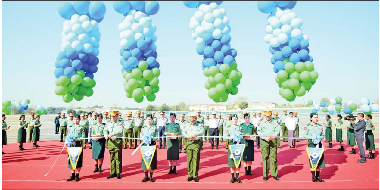
ညှိနှိုင်းကွပ်ကဲရေးမှူး (ကြည်း၊ ရေ လေ)ဗိုလ်ချုပ်ကြီးမောင်မောင်အေး၊ တိုင်းမှူးဗိုလ်ချုပ်စောသန်းလှိုင်နှင့် ဆက်သွယ်ရေးညွှန်ကြားရေးမှူး ဗိုလ်ချုပ်ထွန်းထွန်းဦးတို့က (၇၅)နှစ်မြောက် စိန်ရတု ဆက်သွယ်ရေးတပ်ဖွဲ့နေ့ အခမ်းအနားကို ဖဲကြိုးဖြတ်ဖွင့်လှစ်ပေးကြစဉ်။

ထိုသို့သော အခြေအနေတွင် ကျန်ရှိသည့် အချက်ပြဆက်သွယ် ရေး အရာရှိ စစ်သည်အနည်းငယ် သည် ပျက်စီးဆုံးရှုံးခဲ့သည့် ဆက်သွယ်ရေး စက်ပစ္စည်းများကို မနားမနေ ကြိုးစားပြုပြင်ပြီး အဆက်အသွယ် ပြန်လည်ရရှိ အောင် ကြိုးပမ်းဆောင်ရွက်ခဲ့ ကြကြောင်း၊ ထို့ကြောင့် ၁၉၄၉ ခုနှစ် ဖေဖော်ဝါရီလ ၅ ရက်တွင် မြန်မာနိုင်ငံတစ်ဝန်းလုံး ရေဒီယို ဆက်သွယ်မှုများ ပြန်လည်ရရှိခဲ့ ကြောင်း၊ တပ်မတော်တစ်ရပ်လုံး ဆက်သွယ်မှု ပြန်လည်ရရှိခဲ့သည့် ၁၉၄၉ ခုနှစ် ဖေဖော်ဝါရီ ၅ ရက် သည် ဆက်သွယ်ရေးတပ်ဖွဲ့၏ နေ့ထူးနေ့မြတ်ဖြစ်သည့်အတွက် “ဆက်သွယ်ရေးတပ်ဖွဲ့နေ့”အဖြစ် သတ်မှတ်ခဲ့ခြင်းပင်ဖြစ်ကြောင်း။ လွတ်လပ်ရေးရပြီးနောက် တိုးချဲ့ ဖွဲ့စည်းလာသည့် ဆက်သွယ်ရေး တပ်များကို ကွပ်ကဲနိုင်ရန်အတွက် ၁၉၅၆ ခုနှစ် ဇန်နဝါရီ ၁ ရက်တွင် အချက်ပြ ဆက်သွယ်ရေး ညွှန်ကြားရေးမှူးရုံးကို စတင် ဖွဲ့စည်းခဲ့ပြီး ၁၉၅၈ ခုနှစ် ဇူလိုင် ၁ ရက်မှစတင်ကာ ဆက်သွယ်ရေး ညွှန်ကြားရေးမှူးရုံးအဖြစ် အမည် ပြောင်းလဲ သတ်မှတ်ခဲ့ကြောင်း။ ဆက်သွယ်ရေး တပ်ဖွဲ့သည် နိုင်ငံတော်အတွက် အရေးပေါ် အခြေအနေ ကြုံတွေ့လာသည့် အချိန်တိုင်း အဓိကပင်မတာဝန် ဖြစ်သည့် ဆက်သွယ်မှုမပြတ် တောက်စေရေး ဆောင်ရွက်ခြင်း သာမက စာမျက်နှာ ၄ သို့ >>>