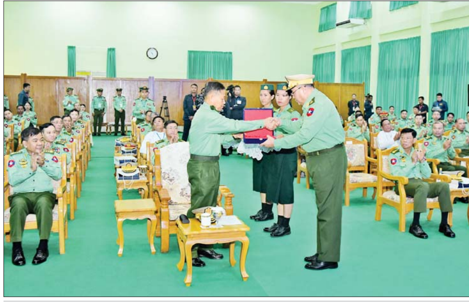
နိုင်ငံတော်စီမံအုပ်ချုပ်ရေးကောင်စီဒုတိယဥက္ကဋ္ဌ ဒုတိယတပ်မတော်ကာကွယ်ရေးဦးစီးချုပ် ကာကွယ်ရေးဦးစီးချုပ်(ကြည်း) ဒုတိယဗိုလ်ချုပ်မှူးကြီး စိုးဝင်းထံ ဆက်သွယ်ရေးညွှန်ကြားရေးမှူး ဗိုလ်ချုပ်ထွန်းထွန်းဦးက (၇၅)နှစ်မြောက် စိန်ရတု ဆက်သွယ်ရေးတပ်ဖွဲ့နေ့ အထိမ်းအမှတ်လက်ဆောင်ကို ဂါရဝပြုပေးအပ်စဉ်။

ထိုနောက် နိုင်ငံတော်စီမံအုပ်ချုပ်ရေးကောင်စီ ဒုတိယဥက္ကဋ္ဌ ဒုတိယတပ်မတော်ကာကွယ်ရေးဦးစီးချုပ် ကာကွယ်ရေးဦးစီးချုပ်(ကြည်း)က တက်ရောက်လာကြသည့် အငြိမ်းစားဆက်သွယ်ရေးတပ်ဖွဲ့ဝင်အရာရှိကြီးများအား ရင်းရင်းနှီးနှီး နှုတ်ဆက်ပြီး တက်ရောက် လာကြသူများနှင့်အတူ (၇၅)နှစ်မြောက်စိန်ရတု ဆက်သွယ်ရေးတပ်ဖွဲ့နေ့ အထိမ်းအမှတ် ပြခန်းများအတွင်း လှည့်လည်ကြည့်ရှုခဲ့ကြကြောင်း သိရသည်။ သတင်းစဉ်