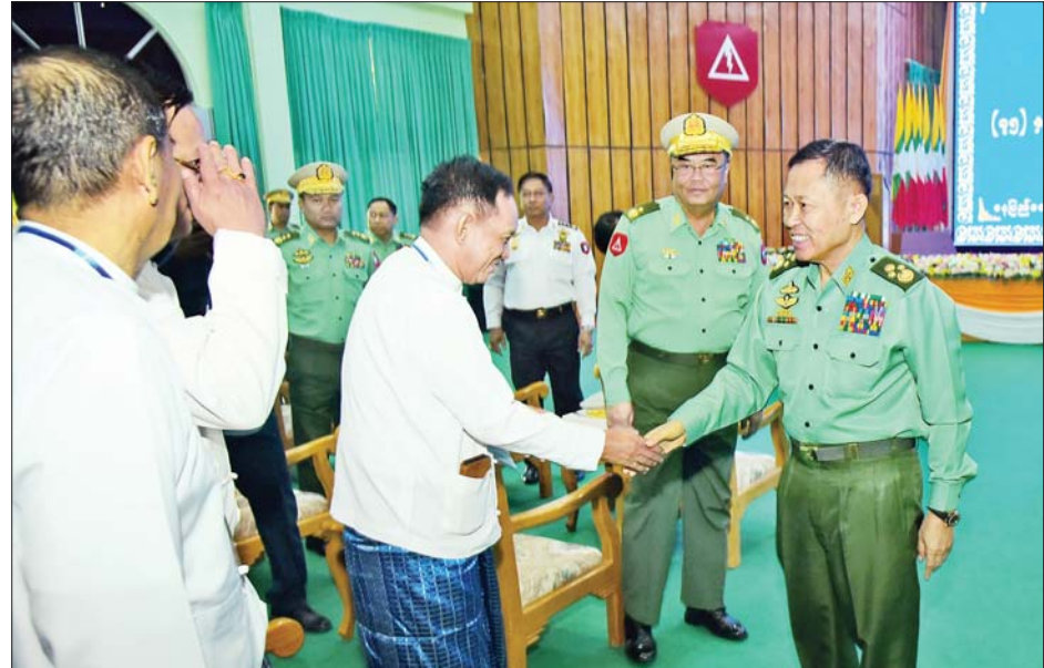
နိုင်ငံတော်စီမံအုပ်ချုပ်ရေးကောင်စီဒုတိယဥက္ကဋ္ဌ ဒုတိယတပ်မတော်ကာကွယ်ရေးဦးစီးချုပ် ကာကွယ်ရေးဦးစီးချုပ်(ကြည်း) ဒုတိယဗိုလ်ချုပ်မှူးကြီး စိုးဝင်း တက်ရောက်လာကြသည့် အငြိမ်းစားဆက်သွယ်ရေးတပ်ဖွဲ့ဝင် အရာရှိကြီးများအား ရင်းရင်းနှီးနှီး နှုတ်ဆက်စဉ်။