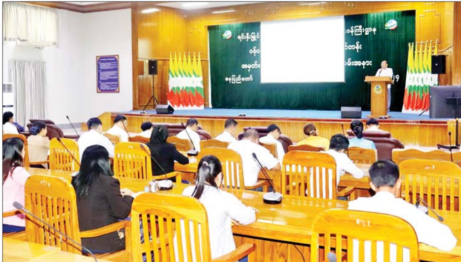
(MSMEs) နှင့် ကုန်သည်နှင့်စက်မှုလုပ်ငန်းရှင်များ သာမက ရင်းနှီးမြှုပ်နှံမှု၊ စက်မှုလုပ်ငန်း၊ ကုမ္ပဏီ အကြား လွတ်လပ်သော စီးပွားရေးလုပ်ငန်းများ ဥပဒေဆိုင်ရာ အကြောင်းအရာများပါဝင်သဖြင့် ချိတ်ဆက်ပူးပေါင်းဆောင်ရွက်နေမှုဆိုင်ရာ အကြောင်းအရာများ ဝန်ထမ်းများအနေဖြင့် စိတ်ပါဝင်စားစွာဖြင့်

နေပြည်တော် ဖေဖော်ဝါရီ ၂ သောကြာနေ့စကားပိုင်း (Friday Talk)၏ အမှတ်စဉ် (၄၄) ဆွေးနွေးပွဲကို ယနေ့မုန်းလွဲပိုင်းတွင် ရင်းနှီးမြှုပ်နှံမှုနှင့် နိုင်ငံခြားစီးပွားဆက်သွယ်ရေး ဝန်ကြီးဌာန ရုံးအမှတ် (၁)၌ ကျင်းပသည်။ ဆွေးနွေးပွဲသို့ ရင်းနှီးမြှုပ်နှံမှုနှင့် နိုင်ငံခြားစီးပွား ဆက်သွယ်ရေးဝန်ကြီးဌာန ပြည်ထောင်စုဝန်ကြီး ဒေါက်တာကဇော်၊ နိုင်ငံခြားစီးပွားဆက်သွယ်ရေး ဦးစီးဌာန ညွှန်ကြားရေးမှူးချုပ်၊ ဒုတိယအမြဲတမ်း အတွင်းဝန်နှင့် ဌာနဆိုင်ရာတာဝန်ရှိသူများ၊ အရာထမ်း၊ အမှုထမ်းများ တက်ရောက်ကြပြီး ရင်းနှီးမြှုပ်နှံမှုနှင့် ကုမ္ပဏီများညွှန်ကြားမှုဦးစီးဌာန ရုံးချုပ်နှင့် တိုင်း ဒေသကြီးနှင့် ပြည်နယ်ဦးစီးမှူးရုံးများမှ တာဝန်ရှိ သူများက အွန်လိုင်းဖြင့်တက်ရောက်ကြသည်။ ဦးစွာ ပြည်ထောင်စုဝန်ကြီးက ယနေ့ဆွေးနွေး တင်ပြမည့်အကြောင်းအရာတွင် RCEP စာချုပ်ဝင် နိုင်ငံများအကြား ပုဂ္ဂလိကစက်မှုလုပ်ငန်းများ