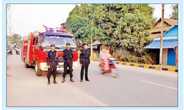
မွန်ပြည်နယ် ချောင်းဆုံမြို့နယ် မီးသတ်ဦးစီးဌာနက မီးဘေး အန္တရာယ် ကြိုတင်ကာကွယ်နိုင်ရေး အသိပေးနှိုးဆော်ခြင်းများကို ဇန်နဝါရီ ၃၁ ရက်က ချောင်းဆုံမြို့နယ် မြို့ပေါ်ရပ်ကွက်နှင့် ကျေးရွာ များသို့ ကွင်းဆင်းဆောင်ရွက်စဉ်။ မြို့နယ်(ပြန်/ဆက်)

လပွတ္တာ ဖေဖော်ဝါရီ ၂ ရောဝတီတိုင်းဒေသကြီး လပွတ္တာမြို့နယ် ၃ မိုင်မြို့ရှိ ခရိုင်မီးသတ် ဦးစီးမှူးရုံးတွင် ဇန်နဝါရီ ၂၉ ရက်မှစ၍ ဖွင့်လှစ်သင်ကြားလျက်ရှိသည့် ခရိုင်အဆင့်ရှိ မီးသတ်တပ်ဖွဲ့ဝင်များ ရှာဖွေကယ်ဆယ်ရေး (မွမ်းမံ) သင်တန်းကို ဆက်လက်သင်ကြား လေ့ကျင့်လျက်ရှိကြောင်း သိရ သည်။ သင်ကြားပို့ချ အဆိုပါသင်တန်းကို ဇန်နဝါရီ ၂၉ ရက်မှ ဖေဖော်ဝါရီ ၂၃ ရက်အထိ ဖွင့်လှစ်ခြင်းဖြစ်ပြီး လပွတ္တာခရိုင်အတွင်းရှိ လပွတ္တာနှင့် မော်လမြိုင် ကျွန်းမြို့နယ်များမှ မီးသတ်တပ်ဖွဲ့ဝင် သင်တန်းသား ၅၀ ဖြင့် ကြိုခိုင်ရေး လေ့ကျင့်ခန်း၊ ကြိုးချည်နည်း၊ ရေတွင်းအသက်ကယ်ဆယ်နည်း၊ မျောက်ကူးနည်းစနစ်၊ ပက်လက်ကူးနည်းစနစ်၊ ရှဉ့်ကူးနည်းစနစ်၊ နှစ်ယောက်တွဲကြိုးဆင်းခြင်း၊ ဇောက်ထိုးဆင်းခြင်း၊ ခုန်ဆင်းနည်း စနစ်များ သင်ကြားပို့ချလျက်ရှိကြောင်း သိရသည်။ ခရိုင်(ပြန်/ဆက်)