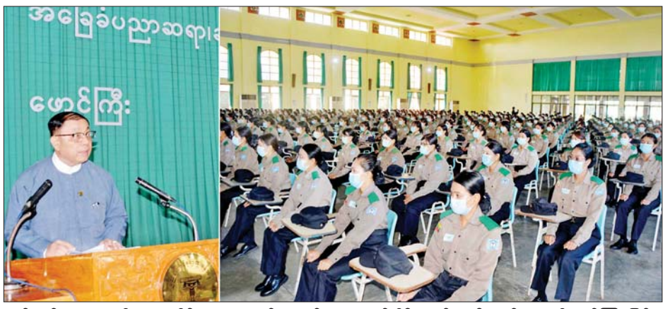
သင်တန်းသူ ၃၆၉ ဦး စုစုပေါင်း ၄၀၀ တက်ရောက် ဖေဖော်ဝါရီ ၂ ရက်အထိ ရက်သတ္တငါးပတ်ကြာမြင့်ခဲ့ ကြပြီး သင်တန်းကာလမှာ ဇန်နဝါရီ ၁ ရက်မှ ကြောင်း သိရသည်။ သတင်းစဉ်

အခြေခံပညာဆရာ ဆရာမများ အထူးမွမ်းမံ သင်တန်းအမှတ်စဉ်(၁၀၄)သို့ သင်တန်းသား ၃၁ ဦး၊