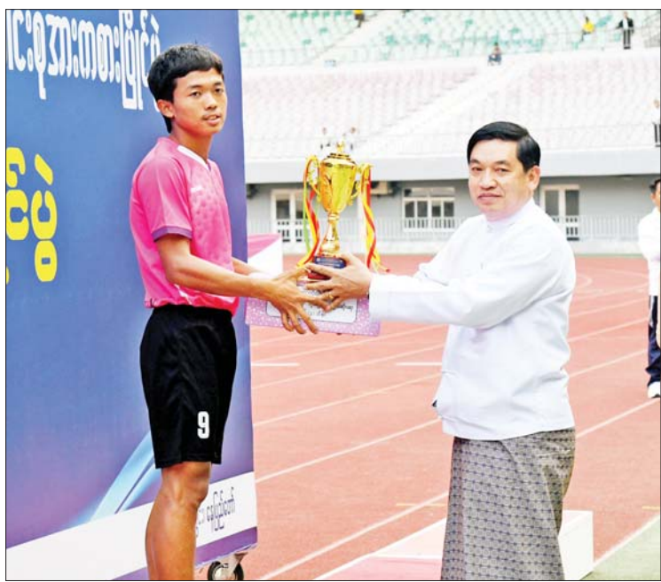
နိုင်ငံတော်စီမံအုပ်ချုပ်ရေးကောင်စီအဖွဲ့ဝင် ဒုတိယဗိုလ်ချုပ်ကြီး ညိုစော တစ်ဦးချင်း အကောင်းဆုံးဆုရရှိသူတစ်ဦးအား ဆုတံဆိပ်နှင့် ဂုဏ်ပြုဆုငွေ ပေးအပ်ချီးမြှင့်စဉ်။