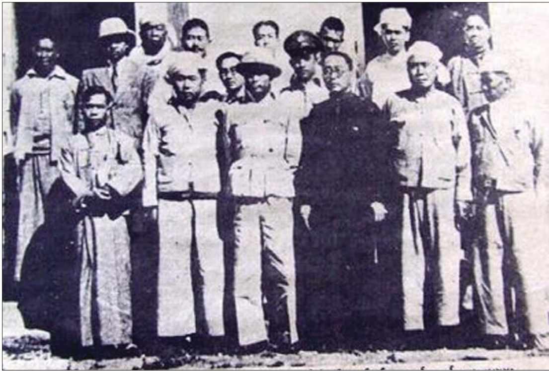
ဗိုလ်ချုပ်အောင်ဆန်းနှင့် တိုင်းရင်းသားကိုယ်စားလှယ်များ။

ဗြိတိသျှတို့က မြန်မာနိုင်ငံကို သိမ်းပိုက်ပြီးသည့်အခါ ရေရှည်အုပ်ချုပ်ခွင့်ရရှိစေရန် တိုင်းရင်းသားများကို သွေးခွဲအုပ်ချုပ်ခဲ့သည်။ ဗြိတိသျှတို့၏ အုပ်ချုပ်ရေးပရိယာယ်ကြောင့် တိုင်းရင်းသားအချင်းချင်း သံသယများဖြင့် ရင်းနှီးမှုအားနည်း၊ သွေးကွဲခဲ့ရသည်။ အင်္ဂလိပ်တို့ သိမ်းပိုက်ခံရသည့် မူလနှစ် ၇၀ ဝန်းကျင်အထိ မြေပြန့်သားနှင့် တောင်တန်းသားတို့ တစ်ကြိမ်မျှပူးပေါင်း၍ လွတ်လပ်ရေးကို မကြိုးပမ်းခဲ့ဖူးကြ။ ဖက်ဆစ်ကို တော်လှန်ကြရာမှာ တိုင်းရင်းသားအားလုံးပေါင်းစည်းမိသည်။ ထိုမှတစ်ဖန် အင်္ဂလိပ်တို့ တော်လှန်ခဲ့ကြချိန်တွင်တော့ လွတ်လပ်ရေးဖခင် ဗိုလ်ချုပ်အောင်ဆန်းနှင့် ခေါင်းဆောင်များ၏ ဦးဆောင်မှုဖြင့် တောင်ပေါ်မြေပြန့်မခွဲခြားဘဲ လွတ်လပ်ရေးပန်းတိုင်သို့ ရောက်ရှိခဲ့သည်။ သို့သော် တစုတစည်းတည်း လွတ်လပ်ရေးရရှိလာခဲ့ခြင်းသည် လွယ်ကူသည့်ခရီးတော့မဟုတ်ခဲ့။ ခက်ခဲကြမ်းတမ်းလှသည်။