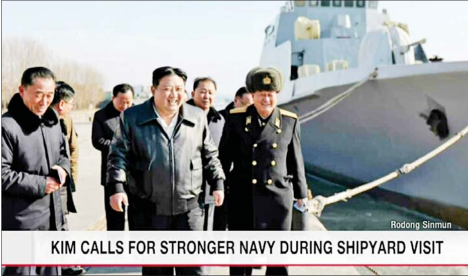
KIM CALLS FOR STRONGER NAVY DURING SHIPYARD VISIT