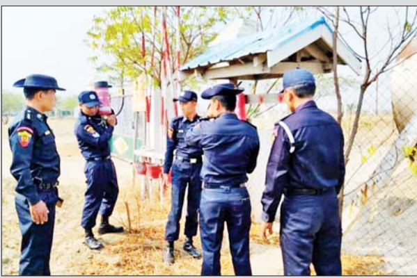
မန္တလေးတိုင်းဒေသကြီး ဝမ်းတွင်းမြို့နယ်၌ မြို့နယ်မီးသတ် ဦးစီးဌာနက ဇန်နဝါရီ ၃၀ ရက်တွင် မြို့နယ်အတွင်း မီးဘေးလုံခြုံရေး ကွင်းဆင်းစစ်ဆေးခြင်းများနှင့်ပတ်သက်၍ မီးဘေးအန္တရာယ် ကင်းဝေးစေရေး၊ မီးဘေးကြိုတင်ကာကွယ်ရေးအတွက် လိုက်နာ ဆောင်ရွက်ရမည့်အချက်များ၊ မီးသတ်ဆေးဘူးအသုံးပြုပုံနှင့် လက်တွေ့ မီးငြိမ်းသတ်ခြင်းများကို အသိပညာပေးဆွေးနွေးခြင်းများ ဆောင်ရွက် စဉ်။