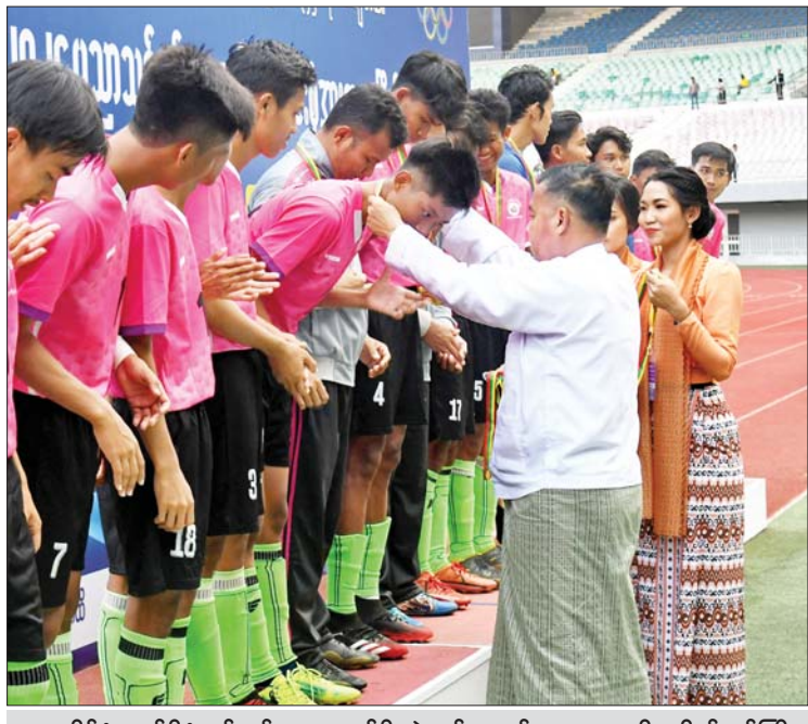
နိုင်ငံတော်စီမံအုပ်ချုပ်ရေးကောင်စီ တွဲဖက်အတွင်းရေးမှူး ဒုတိယဗိုလ်ချုပ်ကြီး ရဲဝင်းဦး ပထမဆုရရှိသည့် နေပြည်တော်ဇုန်အသင်းအား တစ်ဦးချင်း ဆုတံဆိပ်များ ပေးအပ်ချီးမြှင့်စဉ်။