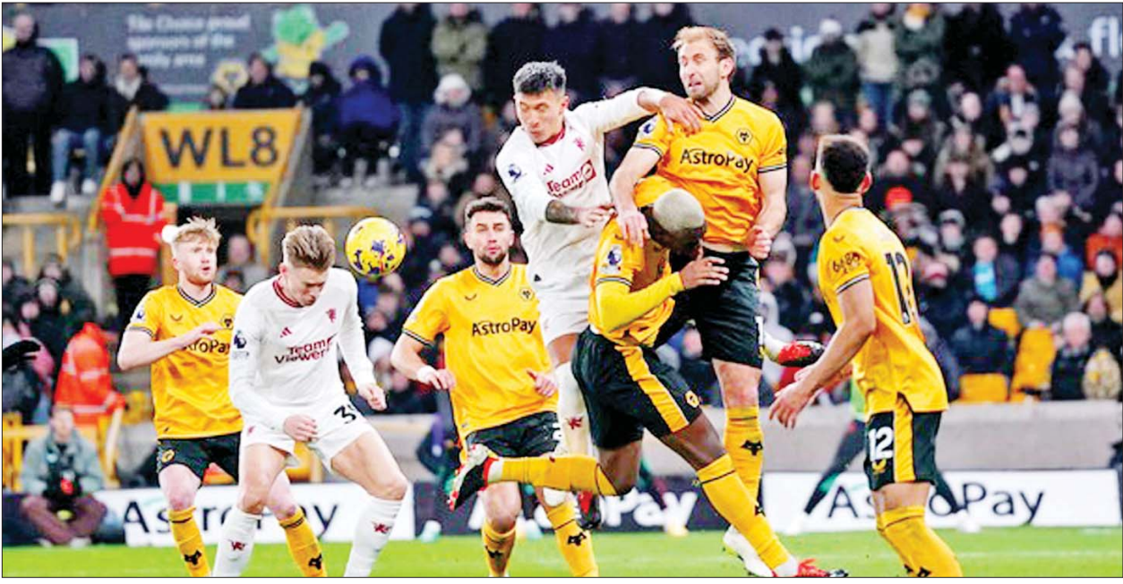
ဝုလ်ဗာဟမ်တန်အသင်းနှင့် မန်ယူအသင်းတို့ ယှဉ်ပြိုင်ကစားကြစဉ်။