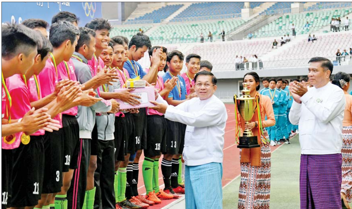
နိုင်ငံတော်စီမံအုပ်ချုပ်ရေးကောင်စီဥက္ကဋ္ဌ နိုင်ငံတော်ဝန်ကြီးချုပ် ဗိုလ်ချုပ်မှူးကြီးမင်းအောင်လှိုင် ပထမဆုရရှိသည့် နေပြည်တော်ဇုန်အသင်းအား ဂုဏ်ပြုဆုငွေ ပေးအပ်ချီးမြှင့်စဉ်။