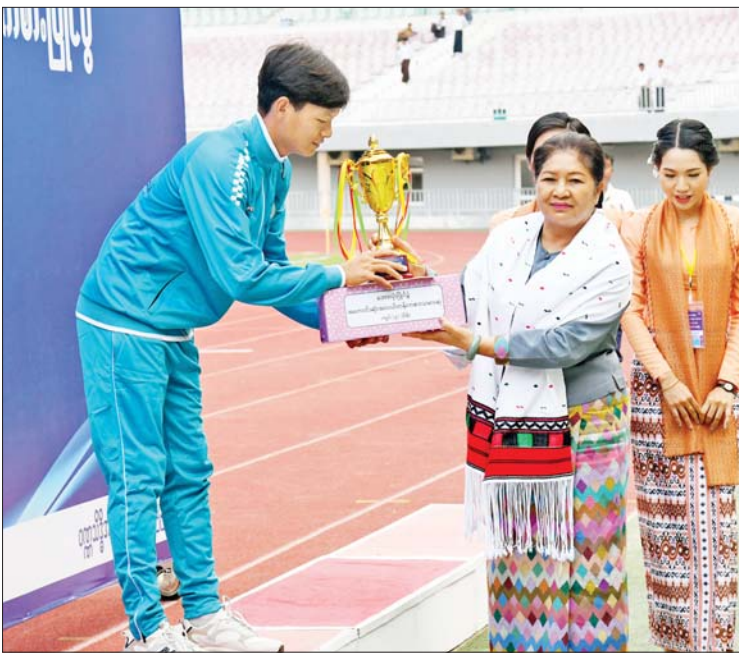
နိုင်ငံတော်စီမံအုပ်ချုပ်ရေးကောင်စီအဖွဲ့ဝင် ဒေါ်ဒွေဘူ တစ်ဦးချင်း အကောင်းဆုံး ဆုရရှိသူတစ်ဦးအား ဆုတံဆိပ်နှင့် ဂုဏ်ပြုဆုငွေ ပေးအပ်ချီးမြှင့်စဉ်။