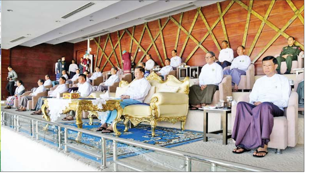
နိုင်ငံတော်စီမံအုပ်ချုပ်ရေးကောင်စီဥက္ကဋ္ဌ နိုင်ငံတော်ဝန်ကြီးချုပ် ဗိုလ်ချုပ်မှူးကြီး မင်းအောင်လှိုင် နည်းပညာတက္ကသိုလ်များနှင့် ကွန်ပျူတာတက္ကသိုလ်များ၏ တက္ကသိုလ်ပေါင်းစုံ အားကစားပြိုင်ပွဲ ဘောလုံးပြိုင်ပွဲ ဗိုလ်လုပွဲအဖြစ် နေပြည်တော်ဇုန်နှင့် မိတ္ထီလာဇုန်အသင်းတို့ ယှဉ်ပြိုင်ကစားမှုကို ကြည့်ရှုအားပေးစဉ်။