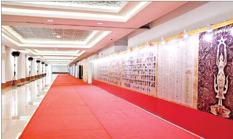
အလှဓာတ်ပုံရိုက်ကူးခြင်းများ ဆောင်ရွက်နိုင် ရန်အတွက် ဂုဏ်ပြုခံလျှောက်လမ်း ပြင်ဆင်ထား မှုကို တွေ့ရစဉ်။