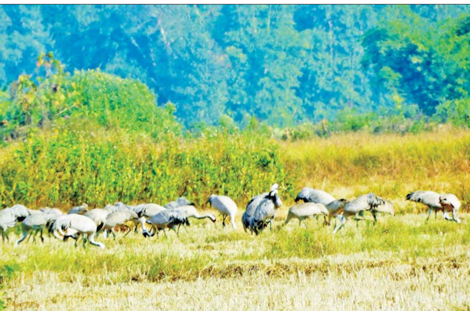
အင်းတော်ကြီးကန်ဘေးမဲ့တော၌ ရူးပါးမျိုးစိတ်ငှက်များကိုတွေ့ရစဉ်။

❖ ကျောဖုံးမှ အမျိုးသားဥယျာဉ်ကြီးများကို ထိန်းသိမ်းခြင်းသည် ဇီဝအဝန်းနယ်မြေကို တည်ထောင်နိုင်ခြင်းဖြစ်ပြီး လူနှင့်သဘာဝသဟာဇာတဖြစ်တည်မှုကို ပေါင်းစည်းပေးခြင်းဖြစ်၍ သာယာလှပသောကမ္ဘာကြီး တည်တံ့ဖွံ့ဖြိုးမှုအကျိုးကျေးဇူးကို ခံစားရရှိစေနိုင်မည်ဖြစ်သည်။ ဇီဝရပ်ဝန်းထူထောင်ခြင်းသည် ဇီဝမျိုးစုံမျိုးကွဲများ ရေရှည်တည်တံ့မှုကို ဖြစ်ထွန်းစေလျက်ရှိပြီး ဇီဝမျိုးစုံမျိုးကွဲများရှင်သန်ရာ အမျိုးသားဥယျာဉ်ကြီးများ တည်တံ့ခိုင်မြဲမှုသည် လူသားတို့အတွက် စီးပွားရေး၊ လူမှုရေးနှင့် ဂေဟဗေဒစနစ်များ ဖွံ့ဖြိုးတိုးတက်မှုနှင့် ဆက်နွယ်လျက်ရှိရာ ကမ္ဘာ့လူသန်း ၅၅၀ ကျော်၏ ဘဝများနှင့်လည်း သက်ဆိုင်လျက်ရှိကြောင်း သုတေသနပညာရှင်များက သုံးသပ်ထုတ်ပြန်ထားသည်။