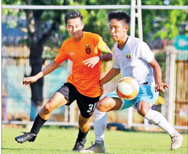
မြန်မာ့လက်ရွေးစင်အသင်းနှင့် အား/ကာသိပွဲအသင်းတို့ ခြေစမ်းပွဲကစားစဉ်။

မြန်မာ့လက်ရွေးစင်အသင်းသည် ပထမအကြိမ်လေ့ကျင့်ရာတွင် ခြေစမ်းပွဲနှစ်ပွဲ ကစားခဲ့ပြီး စာမျက်နှာ ၁၅ ကော်လံ ၄ သို့ ❖