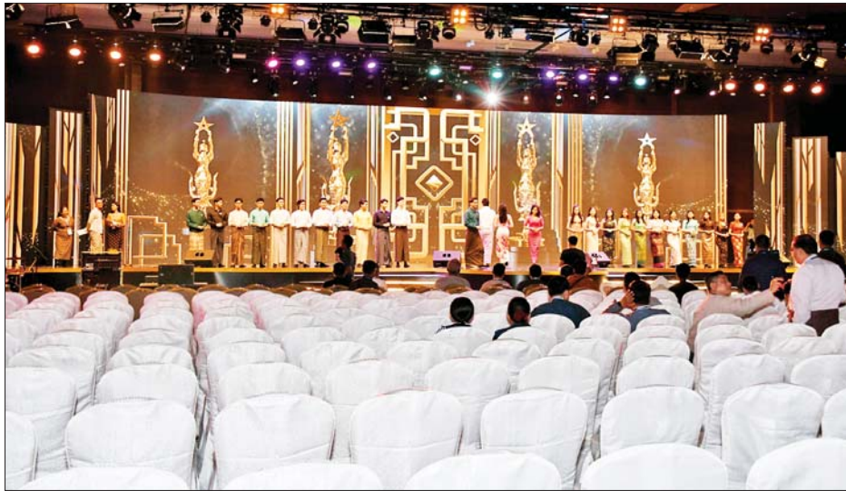
အကယ်ဒမီရွှေကြိုများ၏ ကဏ္ဍအလိုက် တင်ဆက်မည့် အစီအစဉ်များကို ကြိုတင်ဇာတ်တိုက်လေ့ကျင့်စဉ်။

အဆိုပါ အခမ်းအနားကျင်းပမည့် မြန်မာအပြည် ပြည်ဆိုင်ရာ ကွန်ဗင်းရှင်းဗဟိုဌာန(၁) ကျောက်စိမ်း ခန်းမ၌ ပြန်ကြားရေးဝန်ကြီးဌာန၊ မြန်မာနိုင်ငံ ရုပ်ရှင် အစည်းအရုံးနှင့် Forever Group တို့ ပူးပေါင်း၍ အကယ်ဒမီဆုပေးပွဲစင်မြင့်အား Curve LED များ အသုံးပြု၍လည်းကောင်း၊ အကယ်ဒမီရွှေစင်ရုပ်တု များကို ခမ်းနားထည်ဝါစွာ ဖော်ကျူး၍လည်းကောင်း၊ နိုင်ငံတကာအဆင့်မီ မီးအလင်းအမှောင်စနစ်များ၊ အသံစနစ်များဖြင့်လည်းကောင်း၊ ခမ်းနားထည်ဝါစွာ ပြင်ဆင်ဆောင်ရွက်ထားပြီး မြန်မာနိုင်ငံဂီတအစည်း အရုံးမှ စီစဉ်ဆောင်ရွက်သည့် The Drive Band နှင့် နိုင်ငံကျော်တေးသံရှင်များ၏ ဖျော်ဖြေတင်ဆက်မှု