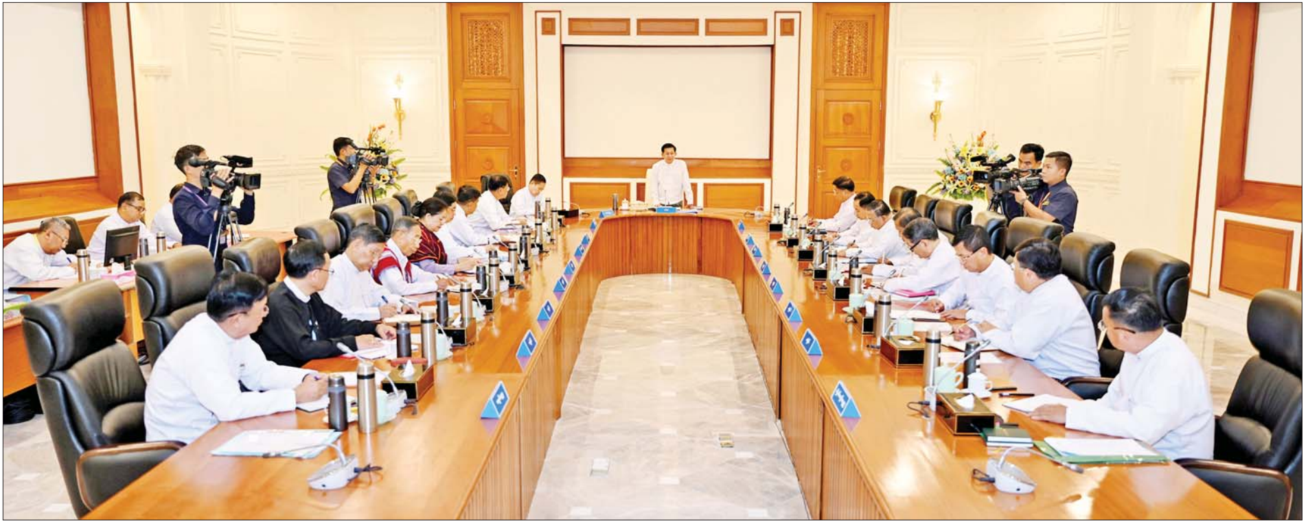
နိုင်ငံတော်စီမံအုပ်ချုပ်ရေးကောင်စီဥက္ကဋ္ဌ နိုင်ငံတော်ဝန်ကြီးချုပ် ဗိုလ်ချုပ်မှူးကြီးမင်းအောင်လှိုင် နိုင်ငံတော်စီမံအုပ်ချုပ်ရေးကောင်စီ အစည်းအဝေး(၁/၂၀၂၄)တွင် အမှာစကားပြောကြားစဉ်။