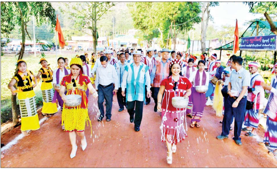
ဘဏ္ဍာနှစ်တွင် ကျေးလက်ကုန်ထုတ်လမ်း ၃၆ လမ်း၊ ပေါင်း ၄၇၂ ပေ၊ ကျေးလက်ရေပေးဝေရေးလုပ်ငန်း ၄၆ ခု၊ ဆီထွက်သီးနှံဧရိယာ နှစ်ခုတွင် စိုက်ပျိုးရေးရရှိရေးလုပ်ငန်း ၄၆ ခု၊ စီမံကိန်းလုပ်ငန်းများအနေဖြင့် ကျေးလက်ကုန်ထုတ်တံတား ၇၁ စင်း၊ အရည်ပေ

အဆိုပါကုန်ထုတ်လမ်းသည် စိုက်ဧက ၃၀၀ ကျော်ကို အကျိုးပြုနိုင်မည်ဖြစ်ပြီး ပြည်နယ်အစိုးရအဖွဲ့ရန်ပုံငွေကျပ် ၁၃၅ ဒသမ ၁၃၅ သန်းဖြင့် အရည်ပေ ၅၂၈၀၊ အကျယ် ၁၆ ပေ၊ ဒု ၃ ပေ ၉ လက်မ၊ Box Culvert သုံးစင်းတို့ကို ဆောင်ရွက်ပြီးစီး၍ ဖွင့်လှစ်ခြင်းဖြစ်ကာ ပြည်နယ် ကျေးလက်ဒေသဖွံ့ဖြိုးတိုးတက်ရေးဦးစီးဌာနအနေဖြင့် ၂၀၂၃-၂၀၂၄