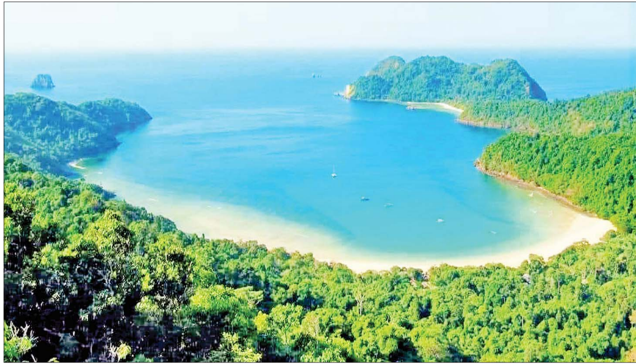
လန်ပီအထွေအမျိုးသားဥယျာဉ်၏အလှကိုတွေ့ရစဉ်။

(နိုင်ငံတော်စီမံအုပ်ချုပ်ရေးကောင်စီဥက္ကဋ္ဌ နိုင်ငံတော် ဝန်ကြီးချုပ် ဗိုလ်ချုပ်မှူးကြီး မင်းအောင်လှိုင်၏ ၂၀၂၃ ခုနှစ်၊ ဩဂုတ်လ ၈ ရက်နေ့တွင် ပြည်ထောင်စုအဆင့် ပုဂ္ဂိုလ်များ၊ ပြည်ထောင်စုဝန်ကြီးဌာနများမှ တာဝန်ရှိသူများနှင့် တွေ့ဆုံအမှာစကားပြောကြားမှုမှ ကောက်နုတ်ချက်)