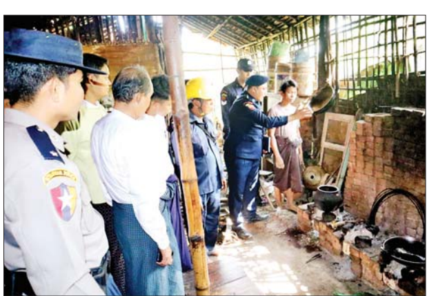
မှု ရှိ/မရှိ ကြည့်ရှုစစ်ဆေးခဲ့ကြပြီး ပြည်သူများအား ဆွေးနွေးမှာကြား မီးဘေးအန္တရာယ် ကြိုတင် ခဲ့ကြောင်း သိရသည်။ ကာကွယ်ရေးအတွက် ရပ်ကွက်နေ ခရိုင်(ပြန်/ဆက်)