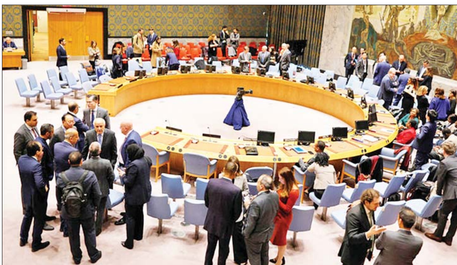
၎င်း၏စွမ်းရည်တို့ကို မည်သည့်အဖွဲ့အစည်းကမျှ ပြောကြားသည်။ ကိုးကား - အင်န်အိတ်ချ်ကေဘာသာပြန် - အောင်ကျော်ကျော်

နိုင်ငံများက အေဂျင်စီ၏ လုပ်ငန်းလည်ပတ်ပုံ၊ ဝန်ထမ်းများ၏ စီမံခန့်ခွဲပုံနှင့် ရာဇဝတ်မှုကျူးလွန်သူများကို ကုလသမဂ္ဂ အရာရှိများက မည်သို့ အရေးယူကိုင်တွယ်ဖြေရှင်းမှုများ ဆောင်ရွက်မည်ကို စောင့်ကြည့်လျက်ရှိကြောင်းနှင့် ထိရောက်စွာ ကိုင်တွယ်ဖြေရှင်းမှုမရှိပါက ၎င်းတို့၏ ကူညီထောက်ပံ့မှုများကို ပေးမည်မဟုတ်ကြောင်း အမေရိကန်သံအမတ်ကြီး လင်ဒါ သောမက်စ် ဂရင်းဖီးလ်က ပြောကြားသည်။ သို့သော် ဂါဇာရှိ ကုလသမဂ္ဂ၏ အကြီးတန်း လူသားချင်းစာနာမှုဆိုင်ရာ ညှိနှိုင်းရေးမှူး ဆီဂရတ် ကာရ်က ရန်ပုံငွေမရရှိခြင်းကြောင့် အရပ်သားများ၏ အသက်ကို ခြိမ်းခြောက်လျက်ရှိကြောင်း ပြောကြားခဲ့သည်။ ကုလသမဂ္ဂ ကယ်ဆယ်ရေးနှင့် လုပ်ငန်းအဖွဲ့အေဂျင်စီ၏ ဂါဇာကမ်းမြောင်းဒေသရှိ အသိပညာနှင့်