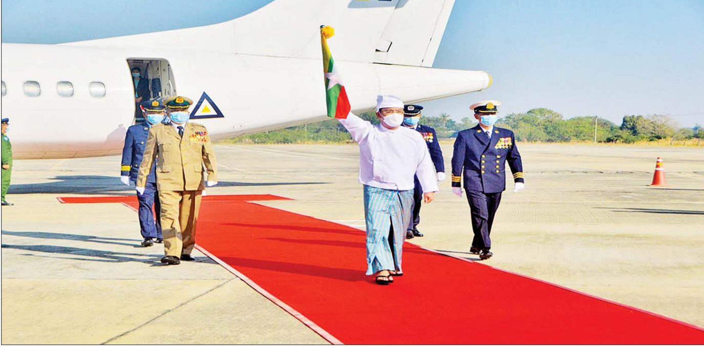
(၇၇)နှစ်မြောက် စိန်ရတုပြည်ထောင်စုနေ့အခမ်းအနားတွင် ပြည်ထောင်စုအလံတော်အား ရန်ကုန်မြို့မှ နေပြည်တော်သို့ သယ်ဆောင်လာစဉ်။

လက်ဆင့်ကမ်းသယ်ဆောင် နှစ်သစ်၏ ဇန်နဝါရီလကုန်၍ ဖေဖော်ဝါရီ လဆန်းပြီဆိုလျှင်ဖြင့် ရန်ကုန်မြို့တော်ခန်းမတွင် တစ်နှစ်တာရပ်နားခဲ့သော ပြည်ထောင်စုအလံတော် သည် ပြည်နယ်နှင့် တိုင်းအသီးသီးသို့ စတင် လှည့်လည်ပါတော့သည်။ ပြည်ထောင်စုအလံတော် ကို ပြည်ထောင်စုနယ်မြေအသီးသီးမှ တိုင်းရင်းသား ပြည်သူများ၊ လူထုလူတန်းစားအဖွဲ့အစည်းများက အလံတော်ညီအိပ်ရပ်နားရာနေရာသို့ လက်ဆင့် ကမ်း သယ်ဆောင်ကြသည်။