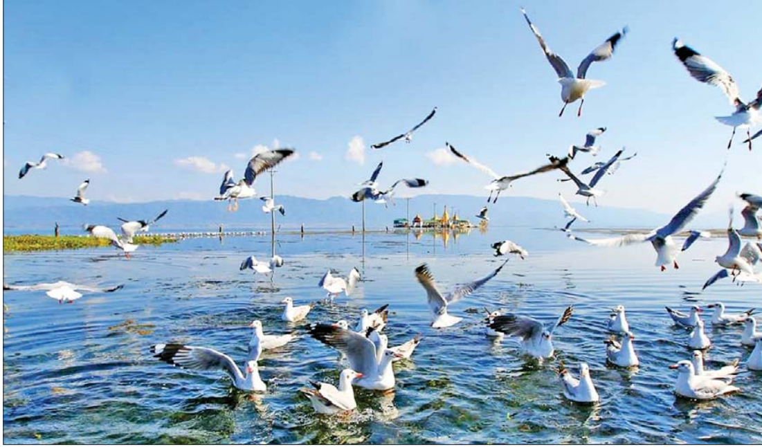
အင်းတော်ကြီးတောရိုင်းတိရစ္ဆာန်ဘေးမဲ့တော။

များအပေါ် အကျိုးပြုမှုများကို သိမြင် နိုးကြားလာစေရန်နှင့် ရေဝပ်ဒေသများ ထိန်းသိမ်းကာကွယ်ခြင်း၊ စီမံအုပ်ချုပ်ခြင်းနှင့် အကျိုးရှိစွာ အသုံးပြုခြင်း (Wise Use) လုပ်ငန်းများတွင် ပူးပေါင်းပါဝင်မှု အားကောင်းလာစေရန် ရည်ရွယ်ပြီး ကမ္ဘာ့ရေဝပ်ဒေသများနေ့ အထိမ်းအမှတ် အခမ်းအနားများ၊ အသိပညာပေးရေး လှုပ်ရှားမှုများကို ကမ္ဘာတစ်ဝန်း ကျင်းပ