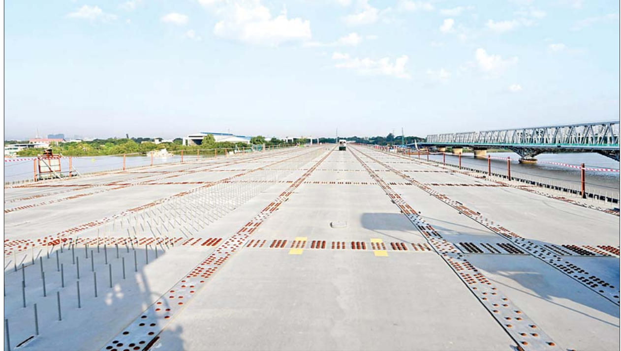
ပဲခူးမြစ်ကူးတံတား(သန်လျင်တံတားအမှတ်-၃) တည်ဆောက်ပြီးစီးမှုကို ၂၀၂၃ ခုနှစ် ဒီဇင်ဘာ ၁၇ ရက်က တွေ့ရစဉ်။

နိုင်ငံတော်စီမံအုပ်ချုပ်ရေးကောင်စီ ရှေ့လုပ်ငန်းစဉ်(၅)ရပ် ၁။ လွတ်လပ်ပြီးတရားမျှတသော ပါတီစုံဒီမိုကရေစီအထွေထွေ ရွေးကောက်ပွဲ အောင်မြင်စွာကျင်းပနိုင်ရေး ပြည်ထောင်စု တစ်ဝန်းလုံးတည်ငြိမ်အေးချမ်း၍ တရားဥပဒေစိုးမိုးရေး အပြည့်အဝရရှိလာအောင် အလေးထားဆောင်ရွက်သွားမည်။ ၂။ တိုင်းရင်းသားပြည်သူတစ်ရပ်လုံးနှင့်အကျိုးဝင်သော စိုက်ပျိုး မွေးမြူရေးကိုအခြေခံသည့် ကုန်ထုတ်လုပ်ငန်းများအား မြှင့်တင်၍ နိုင်ငံစီးပွားမြှင့်တင်ရေးနှင့် ပြည်သူ့ထုတ်ကုန်တစ်ရပ်လုံး ၏ လူမှုစီးပွားဘဝမြှင့်တင်ရေး ဆက်လက်ကြိုးပမ်းဆောင်ရွက် သွားမည်။ ၃။ နိုင်ငံတော်၏ပကတိအနှစ်သာရဖြစ်သော ပြည်တွင်းငြိမ်းချမ်း ရေးနှင့် ရရှိထားသည့် ပြည်တွင်းငြိမ်းချမ်းရေးရလဒ်များ တည်ငြိမ်မှုရှိစေရေးအတွက် (NCA)ပါ သဘောတူညီချက်များ အတိုင်း ဖြစ်နိုင်သမျှ အလေးထားလုပ်ဆောင်သွားမည်။ ၄။ စစ်မှန်စည်းကမ်းပြည့်ဝသည့် ပါတီစုံဒီမိုကရေစီစနစ်ခိုင်မာ စေရေးနှင့် ဒီမိုကရေစီနှင့် ဖက်ဒရယ်စနစ်ကို အခြေခံသည့် ပြည်ထောင်စုတည်ဆောက်ရေးလုပ်ငန်းစဉ်များကို အရှိန် အဟုန်ဖြင့် ဆက်လက်ဆောင်ရွက်သွားမည်။ ၅။ ဆန္ဒမဲပေးပိုင်ခွင့်ရှိသူအားလုံး၏ အခွင့်အရေးများ နှစ်နာမှု မရှိစေရေးနှင့် နည်းလမ်းကျန် မှန်ကန်မှုရှိသည့် အထွေထွေ ရွေးကောက်ပွဲတစ်ရပ်ဖြစ်စေရေး ဆောင်ရွက်ခြင်း၊ အရေးပေါ် ကာလဆိုင်ရာ ပြဋ္ဌာန်းချက်များနှင့်အညီ ဆောင်ရွက်ခြင်းတို့ ပြီးစီးပါက လွတ်လပ်ပြီး တရားမျှတသော ပါတီစုံဒီမိုကရေစီ အထွေထွေရွေးကောက်ပွဲကျင်းပ၍ ထွက်ပေါ်လာသည့်အစိုးရ အား နိုင်ငံတော်တာဝန် လွှဲအပ်နိုင်ရေး ဆက်လက်ဆောင်ရွက် သွားမည်။