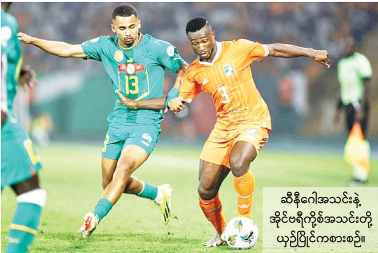
ဆီနီဂေါအသင်းနဲ့ အိုင်ဗရီကို့စ်အသင်းတို့ ယှဉ်ပြိုင်ကစားစဉ်။

ဆီနီဂေါအသင်းနဲ့ အိုင်ဗရီကို့စ်အသင်းတို့ ဇန်နဝါရီ ၂၉ ရက် ညပိုင်းက ယှဉ်ပြိုင်ကစားခဲ့တဲ့ အာဖရိကနိုင်ငံများဖလား ၁၆ သင်းအဆင့်ပွဲစဉ်မှာ အိုင်ဗရီကို့စ်အသင်းက ဆီနီဂေါအသင်းကို ပင်နယ်တီအဆုံးအဖြတ်မှာ အနိုင်ရရှိခဲ့တာကြောင့် ကွာတားဖိုင်နယ်အဆင့်ကို တက်လှမ်းခွင့်ရရှိခဲ့ပြီ ဖြစ်ပါတယ်။ ဆီနီဂေါအသင်းနဲ့ အိုင်ဗရီကို့စ်အသင်းတို့ပွဲစဉ်မှာ သာမန်ပွဲကစားချိန်အတွင်းမှာ တစ်ဖက်တစ်ရိုးစီ သရေရလဒ် ထွက်ပေါ်ခဲ့ပြီး ပင်နယ်တီအဆုံးအဖြတ် စာမျက်နှာ ၁၆ ကော်လံ ၁ သို့ *