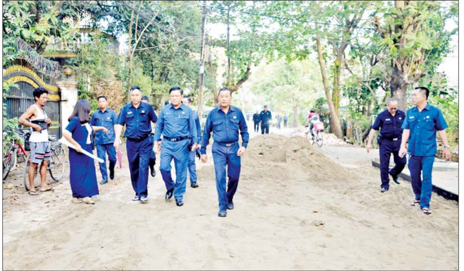
ရှိသည့် ရေအရည်အသွေး စီမံခန့်ခွဲမှု ဗဟိုဓာတ်ခွဲခန်း ကြည့်ရှုစစ်ဆေးပြီး လိုအပ်သည်များ မှာကြားခဲ့အဆောက်အအုံ တည်ဆောက်ခြင်းစီမံကိန်းတို့ကို ကြောင်း သိရသည်။ သတင်းစဉ်

သည် ဒဂုံမြို့သစ်(မြောက်ပိုင်း)မြို့နယ် (၁၆) ရပ်ကွက် ပြည်ထောင်စုလမ်း မြို့ဦးစေတီရှေ့ ဆရာစံလမ်းနှင့် မီးရထားသံလမ်းကြား ကွန်ကရစ်လမ်းသား တိုးချဲ့ခင်းကျင်းရန် စက်ယန္တရားများဖြင့် မြေသားပြုပြင်ဆောင်ရွက်နေမှု၊ ဒဂုံမြို့သစ်(ဆိပ်ကမ်း)မြို့နယ် သရက်ပင်ချောင်ကျေးရွာတွင် အကောင်အထည်ဖော်ဆောင်ရွက်လျက်ရှိသည့် မြေဧရိယာ ၁၈၇ ဒဿမ ၃ ဧကကျယ်ဝန်းသည့် သရက်ပင်ချောင် နောက်ဆုံးစွန့်ပစ်အမှိုက်ပုံ (Final Disposal Site-FDS) တည်ဆောက်ရေး စီမံကိန်းဝင်းအတွင်း အမှိုက်ကန် တည်ဆောက်နေမှုနှင့် ပဲတီစိမ်းငါးဧကနှင့် နွေစပါး (နံ့ကောက်) ခုနစ်ဧကစိုက်ပျိုးထားရှိမှု၊ သာကေတမြို့နယ် မြင်တော်သာလမ်းတွင် တည်ဆောက်လျက်