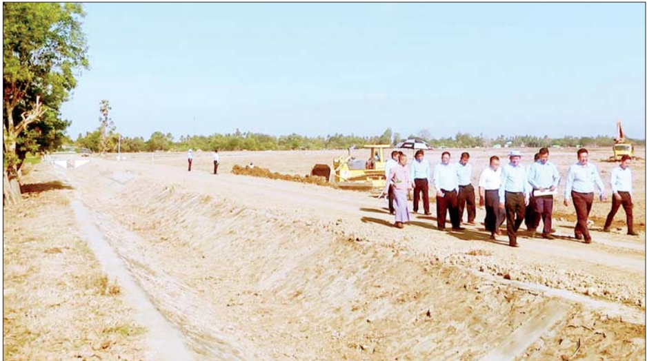
၂၀၂၃ ဘဏ္ဍာနှစ်တွင် စိုက်ပျိုးမြေဧက ၃၂၀၀ ကို အကျိုးပြုနိုင်ခဲ့ပြီး ယနေ့အထိ လုပ်ငန်း ၆၅ ရာခိုင်နှုန်း ပြီးစီးပြီဖြစ်ကာ မတ် ၁ ရက်တွင် လုပ်ငန်းအားလုံး ပြီးစီးပါက စိုက်ပျိုးမြေ ဧက ၂၈၀၀ ကို စိုက်ပျိုးရေး တိုးမြှင့်ပေးနိုင်မည်ဖြစ်၍ မဒန်းဆည်ရေသောက် စနစ်အတွင်းရှိ စိုက်ပျိုးမြေဧရိယာ စုစုပေါင်း ဧက ၆၀၀၀ ကို အကျိုးပြုနိုင်မည်ဖြစ်ကြောင်း သိရ သည်။ သတင်းစဉ်

အတွင်း ယနေ့အထိ စနစ်ကျလယ်ယာမြေ ၁၃၉၃၇ ဒဿမ ၈၉ ဧက ဖော်ထုတ်ပြီးဖြစ်ကြောင်း သိရသည်။ ထိုမှတစ်ဆင့် ဒုတိယဝန်ကြီးနှင့်အဖွဲ့သည် လယ်ဝေးမြို့နယ် မဒန်းရေလွှဲဆည်နှင့် ဇလာလေယာဉ်ကွင်းအကြား ဆောင်ရွက်လျက်ရှိသည့် မဒန်းဆည်ရေသောက်စနစ် တည်ဆောက်ခြင်း လုပ်ငန်းခွင်ကို ကြည့်ရှုစစ်ဆေးပြီး တာဝန်ရှိသူများကို လုပ်ငန်းဆိုင်ရာ လိုအပ်ချက်များ ဆွေးနွေးမှာကြားသည်။ မဒန်းဆည်ရေသောက်စနစ်လုပ်ငန်းများတွင် ပါဝင်သည့် လယ်ယာမြေလျော်ကြေး ပေးချေခြင်း လုပ်ငန်း၊ မြေကြီးလုပ်ငန်း၊ တူးမြောင်းအဆောက်အအုံ လုပ်ငန်း၊ လိုင်နစ်စီခြင်းနှင့် ကန့်ကားခင်းခြင်းလုပ်ငန်းများကို ဘဏ္ဍာနှစ်အလိုက် ဆောင်ရွက်ခဲ့ရာ ၂၀၂၂-