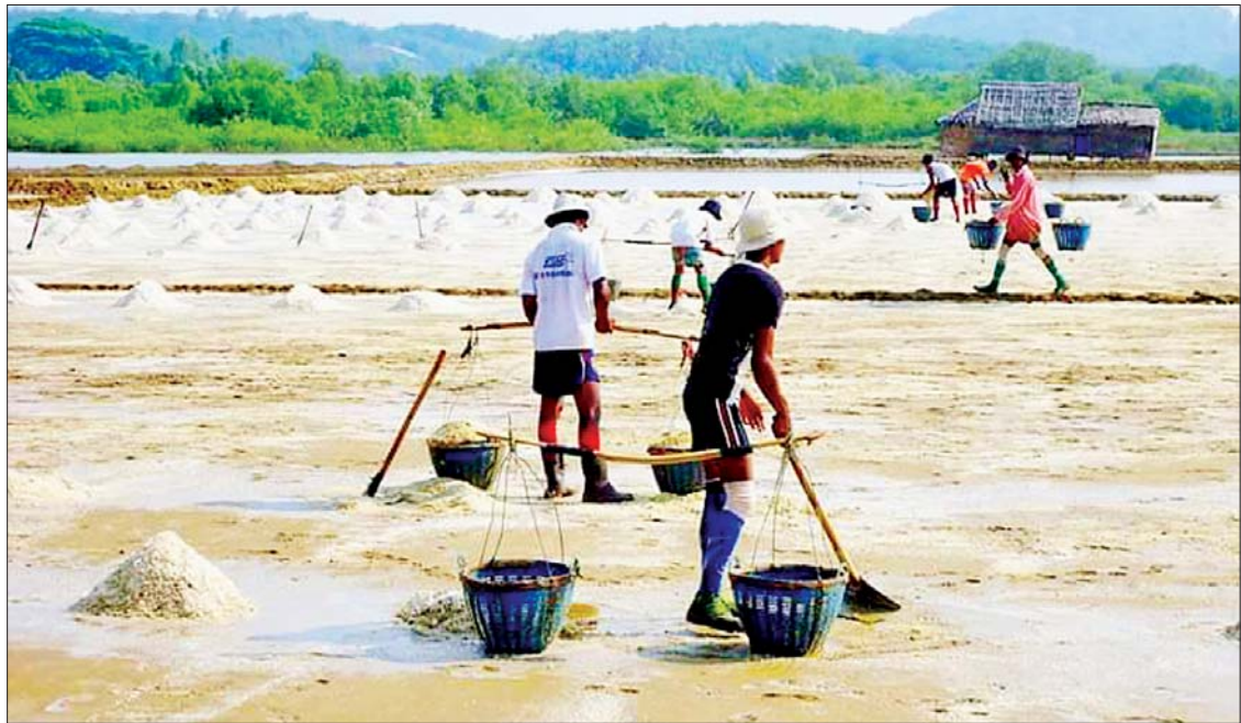
ဧရာဝတီတိုင်းဒေသကြီးရှိ နေလှန်းဆားထုတ်လုပ်မှုလုပ်ငန်းခွင်တစ်ခုကို တွေ့ရစဉ်။