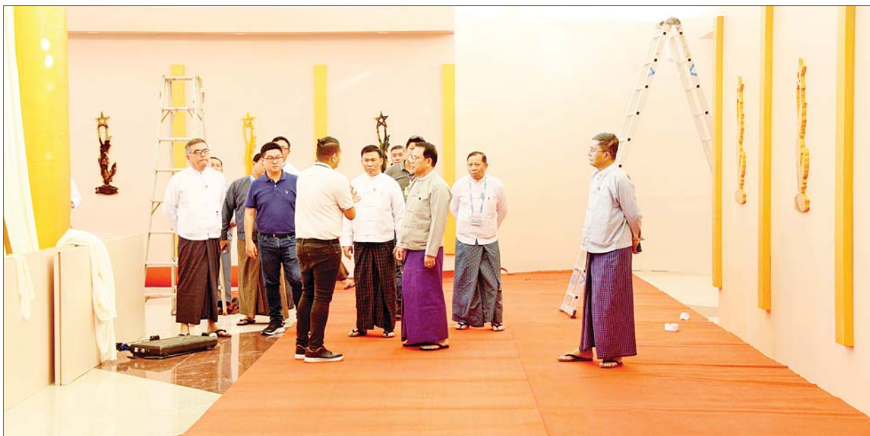
ရေးမုခ်ဦး၊ ဂုဏ်ပြုခံလျှောက်လမ်းဆောင်ရွက်ပြီးစီးမှု အခြေအနေများကိုလည်းကောင်း၊ ရုပ်ရှင်

နေပြည်တော် ဇန်နဝါရီ ၃၀ ပြန်ကြားရေး ဝန်ကြီးဌာန ပြည်ထောင်စုဝန်ကြီး ဦးမောင်မောင်အုန်းသည် ဒုတိယဝန်ကြီး ဦးရဲတင့်၊ သက်ဆိုင်ရာ လုပ်ငန်းကော်မတီ၊ ဆက်ကော်မတီများမှ တာဝန်ရှိသူများနှင့်အတူ ယနေ့ညနေပိုင်းတွင် နေပြည်တော် မြန်မာ အပြည်ပြည်ဆိုင်ရာ ကွန်ဗင်းရှင်းဗဟိုဌာန (၁) သို့ သွားရောက်ပြီး ၂၀၂၃ ခုနှစ်အတွက် မြန်မာ့ရုပ်ရှင် ထူးချွန်ဆုချီးမြှင့်ပွဲ အခမ်းအနား ကြိုတင်ပြင်ဆင်ဆောင်ရွက်ထားရှိမှုများကို ကြည့်ရှုစစ်ဆေးသည်။ ဦးစွာ ပြည်ထောင်စုဝန်ကြီးသည် မြန်မာအပြည်ပြည်ဆိုင်ရာ ကွန်ဗင်းရှင်းဗဟိုဌာန (၁) တွင် တည်ဆောက်လုပ်ကိုင်သော ရုပ်ရှင်အနုပညာရှင်များအတွက် ကြိုဆို