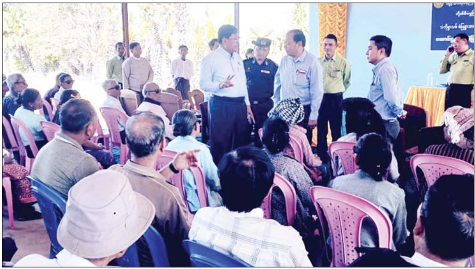
ရွာများအားလုံးရှိ မျက်စိအတွင်းတိမ်လူနာများကို ဆက်လက်ရှာဖွေကုသခြင်း လုပ်ငန်းများကို စဉ်ဆက်မပြတ် ဆောင်ရွက်သွားမည်ဖြစ်ကြောင်း သိရသည်။ ခရိုင်(ပြန်/ဆက်)

ကျန်းမာရေးဝန်ကြီးဌာန ပြည်ထောင်စုဝန်ကြီး၏ အဓိကမျှော်မှန်းချက်ဖြစ်သော မျက်စိအတွင်းတိမ်ကင်းစင်ရွာများ ပေါ်ပေါက်လာစေရေးအတွက် မကွေးတိုင်းဒေသကြီး မကွေးမြို့နယ် သံဘိုရွာသစ်(စံပြ)ရွာအား မြန်မာတစ်နိုင်ငံလုံးမှာ ပထမဦးဆုံး မျက်စိအတွင်းတိမ်ကင်းစင်ရွာအဖြစ် ကြေညာနိုင်အောင် တိုင်းဒေသကြီးအစိုးရအဖွဲ့၊ တိုင်းဒေသကြီးပြည်သူ့ကျန်းမာရေးနှင့် ကုသရေးဦးစီးဌာနမှူး၊ ပြည်သူ့ကျန်းမာရေးဝန်ထမ်းများ၊ ခွဲစိတ်ကုသပေးခဲ့ကြသော မင်းဘူးဆေးရုံအုပ်ကြီး၊ မျက်စိအထူးကုဆရာဝန်ကြီးများနှင့် ခရိုင်/မြို့နယ်အုပ်ချုပ်ရေးအဖွဲ့ဝင်များ ပူးပေါင်းဆောင်ရွက်ခဲ့ကြသည်။ ထို့ပြင် မကွေးတိုင်းဒေသကြီးအတွင်းရှိ စံပြရွာများနှင့် အခြား