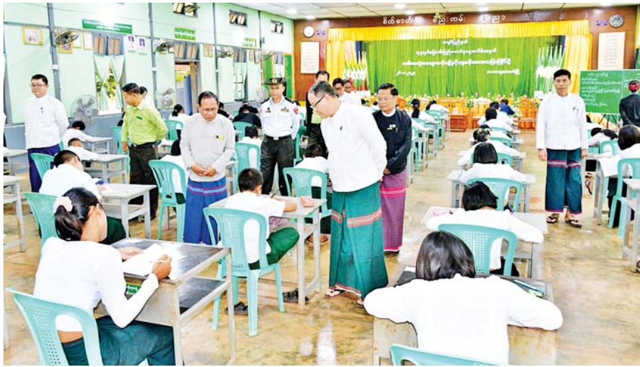
မည့် (၇၇)နှစ်မြောက် ပြည်ထောင်စုနေ့အခမ်းအနားတွင် ဆုများပေးအပ်ချီးမြှင့်သွားမည်ဖြစ်ကြောင်း သိရသည်။

(၇၇)နှစ်မြောက် ပြည်ထောင်စုနေ့အထိမ်းအမှတ် အခြေခံပညာအဆင့် အထက်တန်း၊ အလယ်တန်း၊ မူလတန်းအဆင့် စာစီစာကုံး၊ ကဗျာ၊ ပန်းချီနှင့် ကျပန်းစကားပြောပြိုင်ပွဲကို ဇန်နဝါရီ ၂၆ ရက် နံနက်ပိုင်းက ဘားအံမြို့ အမှတ်(၄)အခြေခံပညာအထက်တန်းကျောင်း၌ကျင်းပရာ ကရင်ပြည်နယ်ဝန်ကြီးချုပ် ဦးစောမြင့်ဦးနှင့် တာဝန်ရှိသူများ ကြည့်ရှုအားပေးခဲ့ကြသည်။