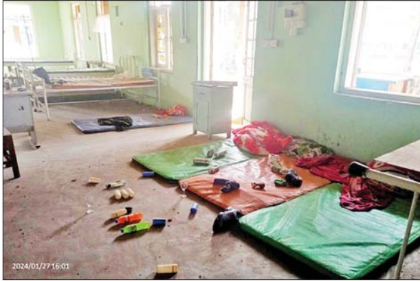
အကြမ်းဖက်သောင်းကျန်းသူများက မိုးမိတ်မြို့ရှိပြည်သူ့ဆေးရုံအတွင်း ခံစစ်စခန်းပြုလုပ်ကာ ဆေးရုံအဆောက်အအုံအား ဖျက်ဆီးသွားခဲ့သည့် မှတ်တမ်းဓာတ်ပုံ။