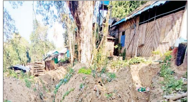
အကြမ်းဖက်သောင်းကျန်းသူများက မိုးမိတ်မြို့ရှိ လူနေအဆောက်အအုံများအတွင်း ခံစစ်စခန်းပြုလုပ်ခဲ့သည့် မှတ်တမ်းဓာတ်ပုံ။

လုံခြုံရေးတပ်ဖွဲ့ဝင်များအနေဖြင့် မိုးမိတ်မြို့အတွင်း နေရပ်စွန့်ခွာဒေသခံပြည်သူများ ပြန်လည်ဝင်ရောက်နေထိုင်နိုင်ရေးနှင့် အပျက်အစီးများ ဖယ်ရှားရှင်းလင်းပေးခြင်း၊ စာသင်ကျောင်း ပျက်စီးမှုများကို ပြန်လည်ပြုပြင်ပေးခြင်း၊ မိုင်းရှင်းလင်းပေးခြင်းများ စသည့်အကြမ်းဖက်သမားများကြောင့် ယိုယွင်းပျက်စီးခဲ့သည့်မြို့ ပြန်လည်ထူထောင်ရေးလုပ်ငန်းများကို ဒေသခံပြည်သူများနှင့်အတူ အမြန်ဆုံး ဆက်လက်ဆောင်ရွက်ပေးနိုင်ရေး စီမံဆောင်ရွက်လျက်ရှိကြောင်း သိရသည်။