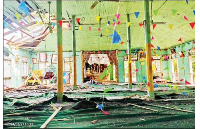
အကြမ်းဖက်သောင်းကျန်းသူများက မိုးမိတ်မြို့ရှိ ဘာသာရေးအဆောက်အအုံများအား အကာအကွယ်ရယူခဲ့ပြီး ဖျက်ဆီးသွားခဲ့သည့် မှတ်တမ်းဓာတ်ပုံ။

အအုံများကို အကာအကွယ်ပြု၍ ဘန်ကာများဆောက်လုပ်တိုက်ခိုက်ခဲ့ခြင်း၊ အကြမ်းဖက်လုပ်ရပ်များ ပြုလုပ်ခဲ့ခြင်းတို့ကြောင့် မြို့တွင်းရှိ အဆောက်အအုံများစွာ ပျက်စီးဆုံးရှုံးခဲ့ရပြီး ၎င်းတို့ထောင်ထားခဲ့သည့် မိုင်းများကြောင့် အများပြည်သူများ ထိခိုက်ဒဏ်ရာရရှိမှု မရှိစေရေးအတွက် လုံခြုံရေးတပ်ဖွဲ့ဝင်များက မိုင်းရှင်းလင်းခြင်းလုပ်ငန်းများကို နေရာအလိုက်၊ လမ်းများအလိုက် စနစ်တကျ ဆက်လက်ဆောင်ရွက်လျက်ရှိသည်။