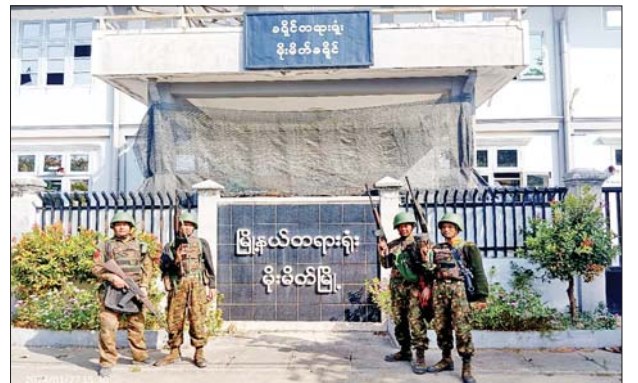
မိုးမိတ်မြို့အား လုံခြုံရေးတပ်ဖွဲ့ဝင်များက ပြန်လည်ထိန်းချုပ်သိမ်းပိုက်နိုင်ခဲ့သည့် မှတ်တမ်းဓာတ်ပုံ။