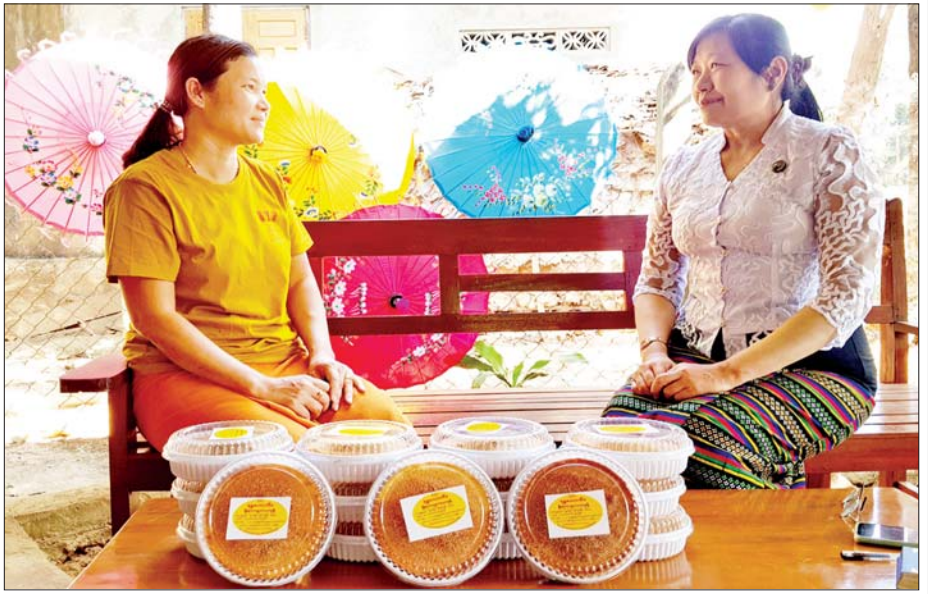
ပေါ့ပြင်ပကတော့ မသိကြသေးတော့ သိပ်မရောင်းရဘူး။ ဈေးကွက်က ရွာလောက်နဲ့ပဲ အဆင်မပြေ

ဖြေ။ ။ ဒီမုန့်က စားသုံးသူတွေကို အန္တရာယ်ဖြစ်စေမယ့် ဓာတုပစ္စည်းတွေ လုံးဝမသုံးထားပါဘူး။ သဘာဝပစ္စည်းတွေဖြစ်တဲ့ ဂျုံ၊ ကြက်ဥ၊ နို့ဆီ၊ သကြား၊ အုန်းနို့ ဒါတွေကိုပဲ အဓိကသုံးထားပါတယ်။ ရွာမှာကတော့ အချို့က ကြက်ဥ နေရာမှာ ဘဲဥကိုသုံးတယ်။ ကိုယ့်အကြိုက်နဲ့ကိုယ် ထည့်သုံးကြတယ်။ ဒီမုန့်ကတော့ ဒီမုန့်ကို လက်ဆောင်ပစ္စည်းအနေနဲ့ရယ်။ အလှူအတန်းတွေ အတွက်ရယ် ဝယ်ကြတာများတယ်။ ဒီမုန့်က လူကြိုက်များပါတယ်။ ကျွန်မတို့က လုပ်ငန်းအသေး