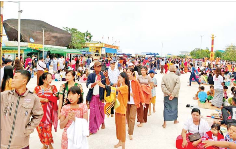
ကျိုက်ထီးရိုးစေတီတော်မြတ်ကြီးသို့ ဘုရားဖူးလာရောက်ကြသူများကို တွေ့ရစဉ်။