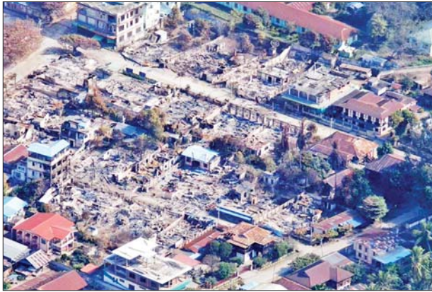
အကြမ်းဖက်သောင်းကျန်းသူများ ပြန်လည်ဆုတ်ခွာထွက်ပြေးသွားစဉ် မိုးမိတ်မြို့အတွင်းရှိ လူနေအိမ်များ၊ ဌာနဆိုင်ရာအဆောက်အအုံများအား မီးရှို့ဖျက်ဆီးသွားခဲ့သည့် မှတ်တမ်းဓာတ်ပုံ။

KIA၊ TNLA အဖွဲ့နှင့် PDF အမည်ခံ အကြမ်းဖက်သမားများအနေဖြင့် လူနေအိမ်များ၊ ဘာသာရေးအဆောက်အအုံများ၊ ဌာနဆိုင်ရာအဆောက်