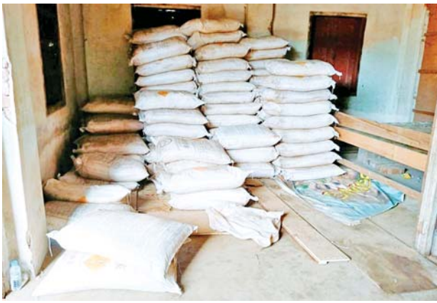
ကချင်ပြည်နယ်၌ ဖမ်းဆီးရမိမှု။

နေပြည်တော် ဇန်နဝါရီ ၂၈ တရားမဝင် ကုန်သွယ်မှု တိုက်ဖျက်ရေးဦးဆောင်ကော်မတီ ၏ ကြီးကြပ်ကွပ်ကဲမှုဖြင့် တရားမဝင် ကုန်သွယ်မှုများကို ဥပဒေနှင့် အညီ ထိရောက်စွာ တားဆီးရေး ယူနိုင်ရေး ဆောင်ရွက်လျက်ရှိရာ ဇန်နဝါရီ ၂၆ ရက်တွင် တနင်္သာရီ တိုင်းဒေသကြီး တရားမဝင် ကုန်သွယ်မှု တိုက်ဖျက်ရေးအထူး အဖွဲ့၏ စီမံခန့်ခွဲမှုဖြင့် တာဝန်ကျ ပူးပေါင်းအဖွဲ့က စစ်ဆေးမှုများ ဆောင်ရွက်ရာတွင် ထားဝယ်မြို့နယ် ထိန်သစ်ရပ်ကွက်၌ တရားမဝင် ခဲသတ္တု ၅၅၆၄ ကီလိုဂရမ် (ခန့်မှန်းတန်ဖိုး ငွေကျပ် ၁၅၅၉၀၀၀)နှင့် ကော့သောင်း မြို့နယ် ခမောက်ကြီးကျေးရွာ၌ တရားမဝင်ခဲသတ္တု ၆၉၇ ကီလိုဂရမ် (ခန့်မှန်းတန်ဖိုး ငွေကျပ် ၁၃၈၀၀၀) တို့ကို မြန်မာ့သတ္တု တွင်း ဥပဒေအရလည်းကောင်း၊ စုစုပေါင်း ခန့်မှန်းတန်ဖိုးငွေ ၂၂၈၇၃၀၉၅ ကျပ်ကို သိမ်းဆည်း အရေးယူ ဆောင်ရွက်လျက်ရှိ သည်။ အရေးယူဆောင်ရွက်လျက်ရှိ ထိုအတူ ဇန်နဝါရီ ၂၆ ရက်တွင် ကချင်ပြည်နယ် တရားမဝင် ကုန်သွယ်မှု တိုက်ဖျက်ရေးအထူး အဖွဲ့၏ စီမံခန့်ခွဲမှုဖြင့် တာဝန်ကျ ပူးပေါင်းအဖွဲ့က စစ်ဆေးမှုများ ဆောင်ရွက်ရာတွင် မြစ်ကြီးနား မြို့ တပ်ကုန်းရပ်ကွက်၌ တရားမဝင် စာရွက်စာတမ်းအထောက်အထား တင်ပြနိုင်ခြင်း မရှိသည့် နိုင်လွန်ငါးဖမ်းပိုက် ကီလိုဂရမ် ၁၆၀၀၊ နိုင်လွန်ကြိုး ကီလိုဂရမ် ၆၈၀ အပါအဝင် ကုန်ပစ္စည်းလေးမျိုး (ခန့်မှန်း တန်ဖိုးငွေ ၁၈၈၇၃၀၉၅ ကျပ်)နှင့် အဆိုပါပစ္စည်းများ တင်ဆောင် ထားသည့် Isuzu Truck တစ်စီးနှင့် Toyota Hiace တစ်စီး (ခန့်မှန်း တန်ဖိုးငွေကျပ် ၄၅၀၀၀၀၀) တို့ကို အကောက်ခွန်လုပ်ထုံး လုပ်နည်းများအရလည်းကောင်း၊ မြိတ်မြို့နယ်၌ လိုင်စင်မဲ့ Honda