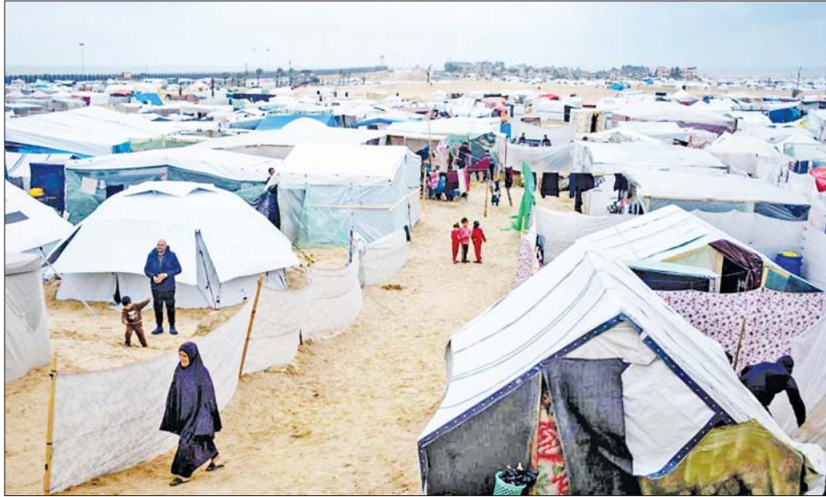
UNRWA ဝန်ထမ်းများကို စုံစမ်းစစ်ဆေးမှုများ ပြုလုပ်လျက်ရှိကြောင်း သိရသည်။

ကုလသမဂ္ဂကယ်ဆယ်ရေးနှင့် လုပ်ငန်းများ ဆောင်ရွက်ရေးအဖွဲ့သည် အစွဲအမိတ်အပေါ်မှ ပေးပို့သည့် သတင်းအချက်အလက်များအပေါ် ကိုးကားပြီး