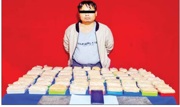
ထန်းငြိမ်း(ခ)ဖက်တီးကို သိမ်းဆည်းရမိသည့် ဘိန်းဖြူများနှင့် အတူ တွေ့ရစဉ်။