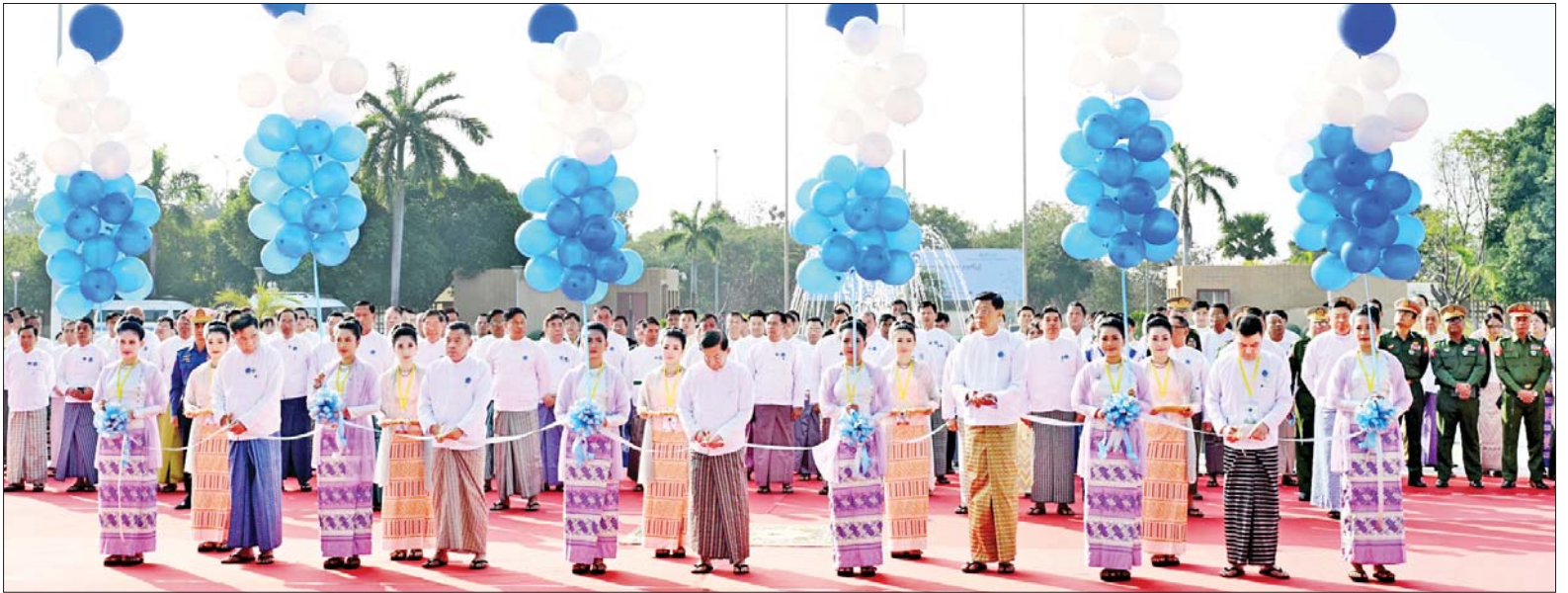
နိုင်ငံတော်စီမံအုပ်ချုပ်ရေးကောင်စီဥက္ကဋ္ဌ နိုင်ငံတော်ဝန်ကြီးချုပ် ဗိုလ်ချုပ်မှူးကြီးမင်းအောင်လှိုင်၊ ကောင်စီတွဲဖက်အတွင်းရေးမှူး ဒုတိယဗိုလ်ချုပ်ကြီး ရဲဝင်းဦး၊ မြန်မာနိုင်ငံ ကွန်ပျူတာပညာဖွံ့ဖြိုးရေးကောင်စီဥက္ကဋ္ဌ ဒုတိယဝန်ကြီးချုပ်နှင့် ပို့ဆောင်ရေးနှင့် ဆက်သွယ်ရေးဝန်ကြီးဌာန ပြည်ထောင်စုဝန်ကြီး ဗိုလ်ချုပ်ကြီးမြထွန်းဦး၊ သိပ္ပံနှင့်နည်းပညာ ဝန်ကြီးဌာန ပြည်ထောင်စုဝန်ကြီး ဒေါက်တာမျိုးသိန်းကျော်နှင့် မြန်မာနိုင်ငံ ကွန်ပျူတာအသင်းချုပ်ကြီးဦးမင်းဇေယျာလှိုင်တို့က မြန်မာနိုင်ငံကွန်ပျူတာအသင်းချုပ်နှင့် ကွန်ပျူတာအသင်းများ၏ (၂၅)နှစ်ပြည့် ငွေရတုအထိမ်းအမှတ် ဖွင့်ပွဲအခမ်းအနားကို ဖဲကြိုးဖြတ်ဖွင့်လှစ်ပေးကြစဉ်။

ထို့နောက် နိုင်ငံတော်စီမံ အုပ်ချုပ်ရေးကောင်စီ ဥက္ကဋ္ဌ နိုင်ငံတော်ဝန်ကြီးချုပ်နှင့် အခမ်း အနား တက်ရောက်လာကြသူများ သည် ခင်းကျင်းပြသထားသည့် ကွန်ပျူတာ နည်းပညာပြခန်းများ ကို ပြခန်းတစ်ခုချင်းစီအလိုက်