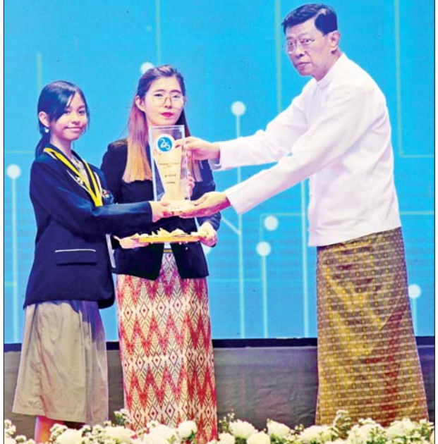
မြန်မာနိုင်ငံ ကွန်ပျူတာပညာဖွံ့ဖြိုးရေးကောင်စီဥက္ကဋ္ဌ ဒုတိယ ဝန်ကြီးချုပ်နှင့် ပြည်ထောင်စုဝန်ကြီး ဗိုလ်ချုပ်ကြီးမြထွန်းဦး ICT ပြိုင်ပွဲတွင် ဆုရရှိခဲ့သူတစ်ဦးအား ဆုပေးအပ်ချီးမြှင့်စဉ်။

များကို အန္တရာယ်ကင်းစွာ စနစ် တကျ အသုံးပြုနိုင်ရန်အတွက် သုံးစွဲသူတစ်ဦးချင်းတွင် လုံလောက် သည့် အသိပညာဗဟုသုတရှိရန် လိုအပ်သကဲ့သို့ စောင့်ထိန်းရမည့် ကျင့်ဝတ် စည်းကမ်းများကို လည်း လိုက်နာကြရန်နှင့် ဥပဒေ ပိုင်းအရလည်း လိုအပ်သည့် ဥပဒေ၊ စည်းမျဉ်းစည်းကမ်းများ ပြဋ္ဌာန်းပေးရမည် ဖြစ်ပါကြောင်း၊ မြန်မာနိုင်ငံ ကွန်ပျူတာအသင်း ချုပ်အနေဖြင့် ပြည်သူများ၏ သတင်းနည်းပညာ လုံခြုံစိတ်ချ ရမှုကိုမျှော်မြင်ပတ်စောင့်ကြည့် ပြီး ထိန်းသိမ်းနိုင်ရန်အတွက် အဆင့်ဆင့် ဖွဲ့စည်းထားသည့် အဖွဲ့အစည်းများမှ တစ်ဆင့် အများပြည်သူကို အသိပညာများ ပေးခြင်းနှင့် လိုအပ်သည့်ဥပဒေ များ ဖြည့်စွက်ခြင်း၊ ပြင်ဆင်ခြင်း၊ ထုတ်ပြန်ခြင်း လုပ်ငန်းစဉ်များ တွင်လည်း သက်ဆိုင်ရာဌာနအဖွဲ့ အစည်းများနှင့် ဆက်လက် ပူးပေါင်းဆောင်ရွက်ပေးသွားကြ ရန်ကိုလည်း တိုက်တွန်းမှာကြား လိုပါကြောင်း။