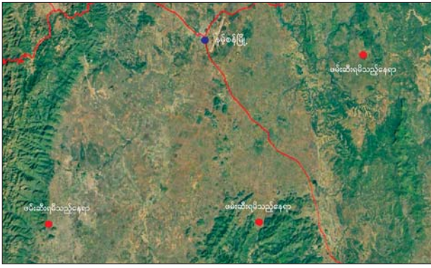
နမ့်စန်မြို့ပတ်ဝန်းကျင်တစ်ဝိုက်၌ တရားမဝင် တရုတ်နိုင်ငံသားများ ဖမ်းဆီးရမိသည့်နေရာပြပုံ။

နေပြည်တော် ဇန်နဝါရီ ၂၆ - နိုင်ငံတော် အစိုးရအနေဖြင့် နယ်စပ်ဒေသများ အပါအဝင် နိုင်ငံတော် တည်ငြိမ်အေးချမ်းရေးနှင့် တရားဥပဒေစိုးမိုးရေးကို အလေးထား ဆောင်ရွက်လျက်ရှိပြီး အချို့သောပြည်ပနိုင်ငံသားများအနေဖြင့် နယ်စပ်ဒေသများမှတစ်ဆင့် မြန်မာနိုင်ငံအတွင်းသို့ တရားမဝင် ဝင်ရောက်နေထိုင် လျက်ရှိကြောင်း သိရှိရသည့် အတွက် အုပ်ချုပ်ရေးအဖွဲ့အစည်းများက လိုအပ်သည့် စိစစ်မှုများ ပြုလုပ်ကာ ဥပဒေနှင့်အညီ ဆောင်ရွက်နိုင်ရေး သက်ဆိုင်ရာ နိုင်ငံများသို့ ပြန်လည်လွှဲပြောင်းပေးအပ်လျက်ရှိပါသည်။ ဖမ်းဆီးရမိ ထိုသို့ ဆောင်ရွက်လျက်ရှိရာ ရှမ်းပြည်နယ်(တောင်ပိုင်း) နမ့်စန်မြို့ပတ်ဝန်းကျင်တွင် တရားမဝင် တရုတ်နိုင်ငံသားများ ရောက်ရှိနေကြောင်း သတင်းပေးပို့မှုများအရ