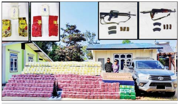
ပြစ်မှုကျူးလွန်သူများကို သိမ်းဆည်းရမိသည့် မူးယစ်ဆေးဝါးများ လက်နက်ခဲယမ်းများနှင့်အတူ တွေ့ရစဉ်။

တရားမဝင်မိဒီယာများသို့ သတင်းပေးကာ နိုင်ငံတော်အစိုးရနှင့် တပ်မတော်အပေါ် ပြည်သူများက အထင်အမြင် လွှဲမှားစေရန် ရည်ရွယ်ပြီး ဝါဒဖြန့်သတင်း အမှားများကို လူမှုကွန်ရက်တွင် ဖြန့်ဝေနေကြောင်း၊ နိုင်ငံတော် အစိုးရအနေဖြင့် နိုင်ငံတစ်ဝန်း အွန်လိုင်း လိမ်လည်မှုများနှင့် အခြား တရားမဝင်လုပ်ငန်း လုပ်ဆောင်သူများ၊ တရားမဝင် ဝင်ရောက်နေထိုင်မှုများ မရှိစေရေးအတွက် သက်ဆိုင်ရာ တရားဥပဒေ စိုးမိုးရေးအဖွဲ့များက စိစစ်ဖော်ထုတ်အရေးယူ ဆောင်ရွက်မှုများ ပြုလုပ်လျက်ရှိကြောင်းနှင့် အိမ်နီးချင်းနိုင်ငံများနှင့်လည်း စဉ်ဆက်မပြတ် ဆက်သွယ်၍ တက်ကြွစွာ ပူးပေါင်း ဆောင်ရွက်လျက်ရှိကြောင်း ပြည်သူများသိရှိနိုင်ရေး သတင်းထုတ်ပြန်ထားသည်။