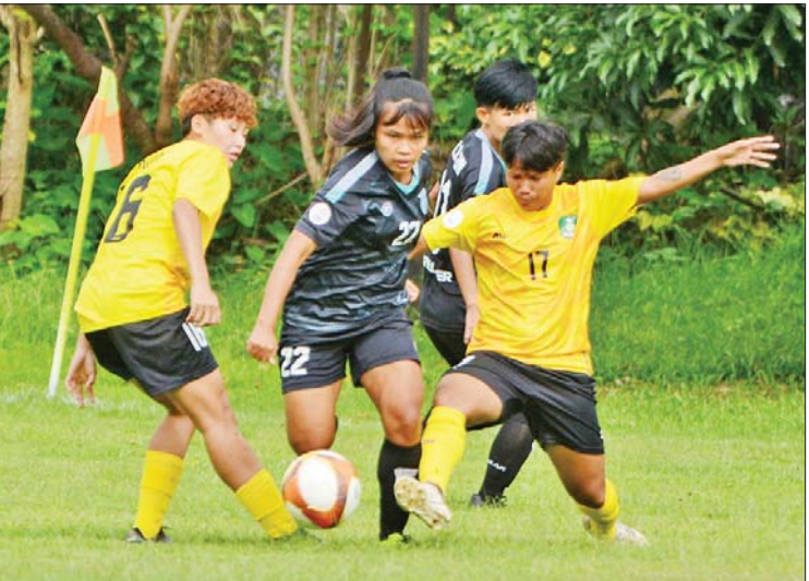
မြဝတီအမျိုးသမီးအသင်းနှင့် ISPE အမျိုးသမီးအသင်းတို့ ယှဉ်ပြိုင်ကစားကြစဉ်။

ရန်ကုန် ဇန်နဝါရီ ၂၆ မြန်မာနေရှင်နယ်လိဂ်သည် လာမည့် ရာသီတွင် ကျင်းပရန်စီစဉ်ထားသည့် လိဂ်ပြိုင်ပွဲများအနက်မြန်မာအမျိုးသမီးလိဂ် ပြိုင်ပွဲကို အစောဆုံးကျင်းပမည်ဖြစ်သည်။ မြန်မာနေရှင်နယ်လိဂ်သည် လာမည့် ရာသီတွင် လိဂ်ပြိုင်ပွဲလေးခုကျင်းပရန် စီစဉ်ထားပြီး MNL ပြိုင်ပွဲကိုသာ ကမ္ဘာ့ ဘောလုံးအဖွဲ့ချုပ်နှင့် အာရှဘောလုံး အဖွဲ့ချုပ်က သတ်မှတ်ထားသည့် ဘောလုံးပြကွဲဒီဇိုအတိုင်း ကျင်းပမည်ဖြစ် သော်လည်း ကျန်ပြိုင်ပွဲများဖြစ်သည့် MNL-2 ပြိုင်ပွဲ၊ မြန်မာအမျိုးသမီးလိဂ် ပြိုင်ပွဲနှင့် MNL ယူ-၂၀ ပြိုင်ပွဲကိုမူ ၂၀၂၄ ခုနှစ်အတွင်း အပြီးကျင်းပမည်ဖြစ်သည်။ စာမျက်နှာ ၁၈ ကော်လံ ၁ သို့ ❁