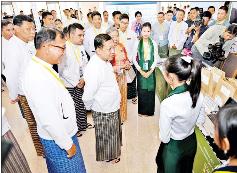
နိုင်ငံတော်စီမံအုပ်ချုပ်ရေးကောင်စီဥက္ကဋ္ဌ နိုင်ငံတော်ဝန်ကြီးချုပ် ဗိုလ်ချုပ်မှူးကြီးမင်းအောင်လှိုင် ခင်းကျင်းပြသထားသည့် ကွန်ပျူတာနည်းပညာပြခန်းများကို လှည့်လည်ကြည့်ရှုစဉ်။

နိုင်ငံတော် အနေဖြင့် e-Government စနစ်ကို အောင်မြင်စွာ အကောင်အထည် ဖော်ဆောင် နိုင်ရေးအတွက် “e-Government ဦးဆောင် ကော်မတီ”ကို ဖွဲ့စည်းထားပြီး ဦးဆောင်ကော်မတီက ချမှတ် ထားသည့် မူဝါဒ၊ လမ်းညွှန်ချက် များနှင့်အညီ ထိရောက်အောင်မြင် စွာ အကောင်အထည်ဖော် ဆောင်နိုင်ရေးအတွက် “e-ID စနစ် လုပ်ငန်းကော်မတီ”၊ “e-Government အကောင် အထည်ဖော်ရေး လုပ်ငန်း ကော်မတီ”တို့ကို ပြင်ဆင်ဖွဲ့စည်း ဆောင်ရွက်လျက်ရှိပါကြောင်း။ စာမျက်နှာ ၄ သို့ ☆