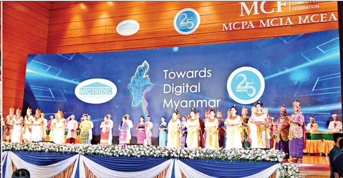
နိုင်ငံတော်စီမံအုပ်ချုပ်ရေးကောင်စီဥက္ကဋ္ဌ နိုင်ငံတော်ဝန်ကြီးချုပ် ဗိုလ်ချုပ်မှူးကြီးမင်းအောင်လှိုင် မြန်မာနိုင်ငံ ကွန်ပျူတာအသင်းချုပ်နှင့် ကွန်ပျူတာအသင်းများ၏ (၂၅)နှစ်ပြည့် ငွေတုအထိမ်းအမှတ် ဖွင့်ပွဲ အခမ်းအနားကို ဒစ်ဂျစ်တယ်နည်းပညာအသုံးပြု ဖွင့်လှစ်ပေးစဉ်။

★ စာမျက်နှာ ၃ မှ နိုင်ငံတော်အတွက် အခြေခံ ကျပြီး အရေးကြီးဆုံးလုပ်ငန်းစဉ် တစ်ခုဖြစ်သည့် နိုင်ငံအတွင်း နေထိုင်သူ တစ်ဦးချင်းစီကို ဒစ်ဂျစ်တယ် နည်းပညာအသုံးပြု ပြီး Unique ID (UID) တစ်ခုစီနှင့် မှတ်ပုံတင်ထားရှိရေး e-ID စနစ် ကို ကူးပြောင်းနိုင်ရေးအတွက် National Database စနစ် တည်ဆောက်ရေး ဦးဆောင် ကော်မတီကို ဖွဲ့စည်းခဲ့ပြီး လက်တွေ့အကောင်အထည်ဖော် ဆောင်ရွက်လျက်ရှိနေပါကြောင်း၊ ၂၀၂၄ ခုနှစ်တွင် ဆောင်ရွက်မည့် သန်းခေါင်စာရင်း ကောက်ယူ ရေး လုပ်ငန်းများတွင်လည်း Computer-Assisted Personal Interviewing(CAPI) စနစ်ကို ကျင့်သုံးသွားမည်ဖြစ်ပါကြောင်း။ ဒစ်ဂျစ်တယ်