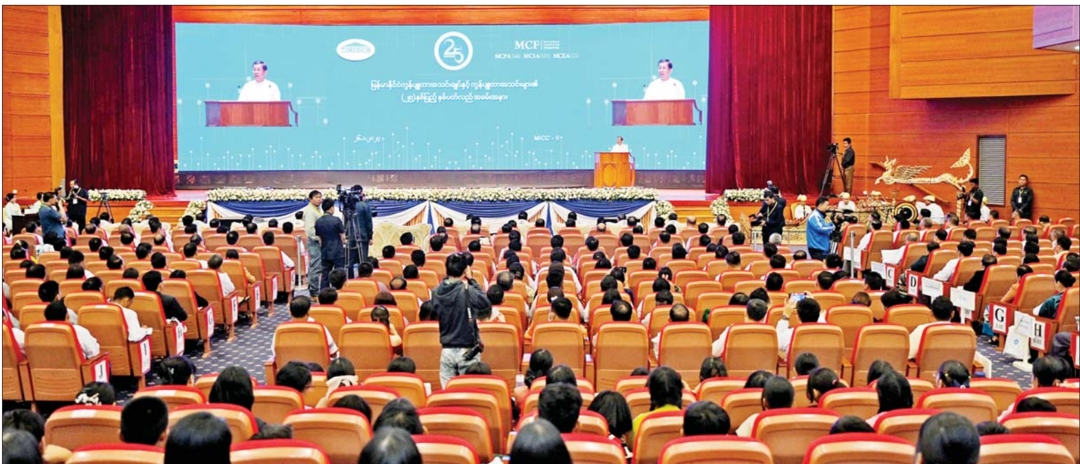
နိုင်ငံတော်စီမံအုပ်ချုပ်ရေးကောင်စီဥက္ကဋ္ဌ နိုင်ငံတော်ဝန်ကြီးချုပ် ဗိုလ်ချုပ်မှူးကြီးမင်းအောင်လှိုင် မြန်မာနိုင်ငံ ကွန်ပျူတာအသင်းချုပ်နှင့် ကွန်ပျူတာအသင်းများ၏ (၂၅)နှစ်ပြည့် ငွေတုအထိမ်းအမှတ် ဖွင့်ပွဲအခမ်းအနားတွင် အမှာစကားပြောကြားစဉ်။

★ စာမျက်နှာ ၃ မှ နိုင်ငံတော်အတွက် အခြေခံ ကျပြီး အရေးကြီးဆုံးလုပ်ငန်းစဉ် တစ်ခုဖြစ်သည့် နိုင်ငံအတွင်း နေထိုင်သူ တစ်ဦးချင်းစီကို ဒစ်ဂျစ်တယ် နည်းပညာအသုံးပြု ပြီး Unique ID (UID) တစ်ခုစီနှင့် မှတ်ပုံတင်ထားရှိရေး e-ID စနစ် ကို ကူးပြောင်းနိုင်ရေးအတွက် National Database စနစ် တည်ဆောက်ရေး ဦးဆောင် ကော်မတီကို ဖွဲ့စည်းခဲ့ပြီး လက်တွေ့အကောင်အထည်ဖော် ဆောင်ရွက်လျက်ရှိနေပါကြောင်း၊ ၂၀၂၄ ခုနှစ်တွင် ဆောင်ရွက်မည့် သန်းခေါင်စာရင်း ကောက်ယူ ရေး လုပ်ငန်းများတွင်လည်း Computer-Assisted Personal Interviewing(CAPI) စနစ်ကို ကျင့်သုံးသွားမည်ဖြစ်ပါကြောင်း။ ဒစ်ဂျစ်တယ်