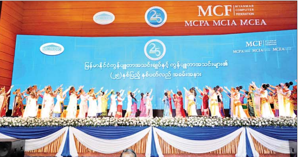
နိုင်ငံတော်စီမံအုပ်ချုပ်ရေးကောင်စီဥက္ကဋ္ဌ နိုင်ငံတော်ဝန်ကြီးချုပ် ဗိုလ်ချုပ်မှူးကြီးမင်းအောင်လှိုင်နှင့် အခမ်းအနားတက်ရောက်လာကြသူများ သာသနာရေးနှင့်ယဉ်ကျေးမှုဝန်ကြီးဌာန အနုပညာဦးစီးဌာနမှ အနုပညာရှင်များက တေးသရုပ်ဖော်အကအလှများဖြင့် ဖျော်ဖြေတင်ဆက်မှုကို ကြည့်ရှုအားပေးကြစဉ်။