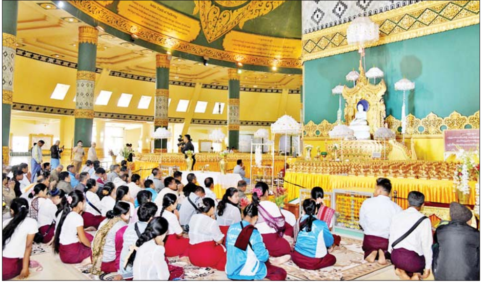
ကြိုးပမ်းမှုသမိုင်း၌ နိုင်ငံတော်အတွက် အသက်ကို စွန့်လွှတ်၍ မှန်ကန်ရဲရဲစွာ ဆောင်ရွက်ခဲ့သည့် သူရဲကောင်းတို့၏ ကွန်းခိုရာဗိမာန်ဖြစ်သည့် သူရဲ ကောင်းဗိမာန် (နေပြည်တော်)သို့ ရောက်ရှိကြပြီး ကျဆုံးလေပြီးသော တပ်မတော်သား သူရဲကောင်း များအား ဂါရဝပြုအလေးပြုကြပြီး ဗိမာန်အတွင်း လှည့်လည်ကြည့်ရှု လေ့လာခဲ့ကြသည်။ သတင်းစဉ်

လေးပါး၊ မဂ္ဂင် ရှစ်ပါးနှင့် ၂၄ ပစ္စည်းတို့ကို ကြေးပန်း တည်း၊ ရွှေဝေလွန်းတို့ဖြင့် သွန်းလုပ်ပူဇော်ထားရှိမှု များကို လေ့လာကြည့်ရှုကြပြီး စေတီတော်ပရိဝုဏ် အရှေ့မြောက်ထောင့်ရှိ ဘုရားစေတီတော်အတွင်းရှိ ဂန္ဓကုဋ် ကျောင်းဆောင်တော်အတွင်းရှိ မဟာဆုတောင်းပြည့် ဘုရားကြီးကို ဖူးမြော်ကြည်ညိုကြသည်။ ထို့နောက် ဘုရားဖူးလာ ဂေါပကအဖွဲ့ဝင်များ သည် စေတီတော်အရှေ့ဘက်မုခ်ရှိ ရတနာဆင်ဖြူ တော် ထိန်းသိမ်းစောင့်ရှောက်ရေး ဥယျာဉ်သို့ သွားရောက်ပြီး ၂၀၂၂ ခုနှစ်တွင် ပေါ်ထွန်းလာသော ဆင်ဖြူတော်လေး “ရန္ဒနန္ဒက” နှင့် ဆင်ဖြူတော်များ ကို အစားအစာများ ကျွေးမွေးကြသည်။ ဆက်လက်၍ ဘုရားဖူးလာ ဂေါပကအဖွဲ့ဝင်များ သည် နိုင်ငံတော်၏ လွတ်လပ်ရေးထိန်းသိမ်းမှုနှင့် အချုပ်အခြာအာဏာတည်တံ့ခိုင်မြဲရေးတည်ဆောက်