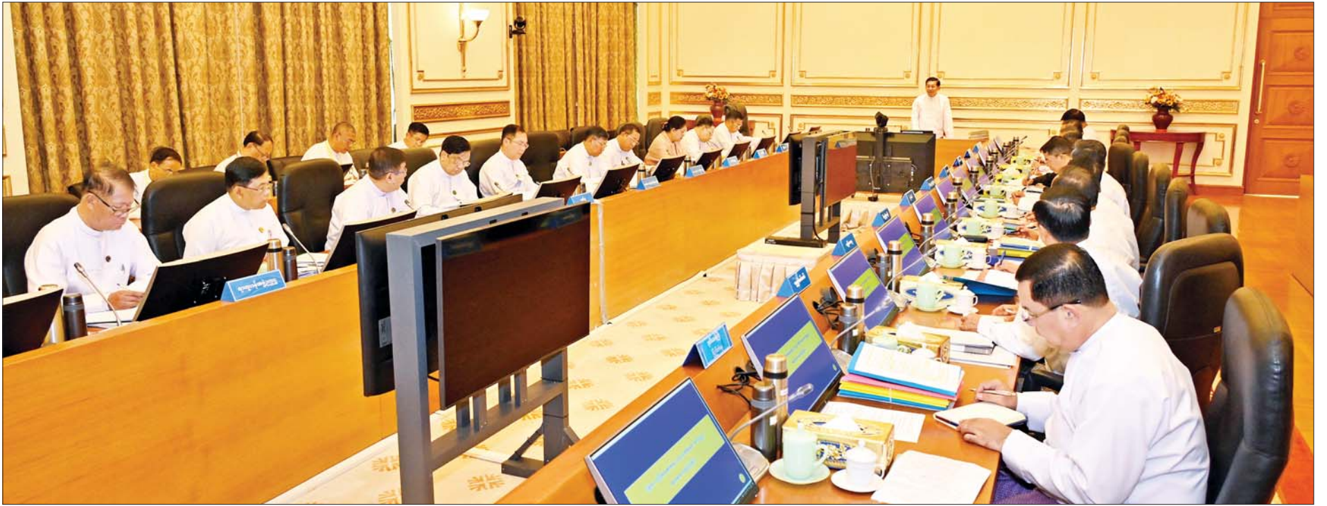
နိုင်ငံတော်စီမံအုပ်ချုပ်ရေးကောင်စီဥက္ကဋ္ဌ နိုင်ငံတော်ဝန်ကြီးချုပ် ဗိုလ်ချုပ်မှူးကြီးမင်းအောင်လှိုင် ပြည်ထောင်စုသမ္မတမြန်မာနိုင်ငံတော် လုံခြုံရေး၊ တည်ငြိမ်အေးချမ်းရေးနှင့် တရားဥပဒေစိုးမိုးရေးကော်မတီ အစည်းအဝေးအမှတ်စဉ်(၁/၂၀၂၄)တွင် အမှာစကားပြောကြားစဉ်။