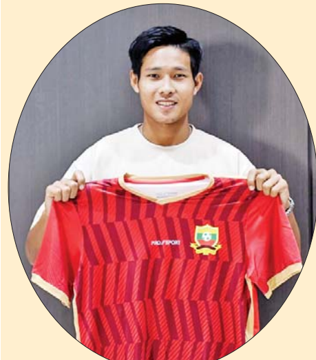
ရှမ်းယူနိုက်တက်အသင်း တိုက်စစ်မှူး ကောင်းမြတ်သူ။

ဇန်နဝါရီ ၂၁ ရက် ညပိုင်းက ဘုန်းမောက်အသင်းနဲ့ လီဗာပူး အသင်းတို့ ယှဉ်ပြိုင်ကစားခဲ့တဲ့ ပရီမီယာလိဂ် ပွဲစဉ်(၂၁)မှာ လီဗာပူးအသင်းက ဘုန်းမောက် အသင်းကို လေးဂိုးပြတ်နဲ့ အနိုင် ရရှိခဲ့တာကြောင့် ပရီမီယာလိဂ် အမှတ်ပေးဇယား ထိပ်ဆုံးမှာ ငါးမှတ်ဖြတ်ကာ ဆက်လက် ဦးဆောင်နိုင်ခဲ့ပါတယ်။ ဘုန်းမောက်အသင်းနဲ့ လီဗာပူး အသင်းတို့ပွဲစဉ်မှာ လီဗာပူး အသင်းအတွက် သွင်းဂိုးတွေကို ပွဲကစားချိန် ၄၉ မိနစ်နဲ့ သာမန် ပွဲကစားချိန်အပြီး နာကျင်အချိန်ပို သုံးမိနစ်တို့မှာ ဒါဝင်နူနက်ဇ်က နှစ်ဂိုး၊ မိနစ် ၇၀ နဲ့ ၇၉ မိနစ်တို့မှာ ဂျီတာကနှစ်ဂိုး အသီးသီးသွင်းယူ ပေးခဲ့တာဖြစ်ပါတယ်။ လီဗာပူးအသင်းဟာ တိုက်စစ် များ မိုဟာမက် ဆာလာအီဂျစ် အသင်းနဲ့အတူ အာဖရိကနိုင်ငံများ စာမျက်နှာ ၁၇ ကော်လံ ၃ သို့