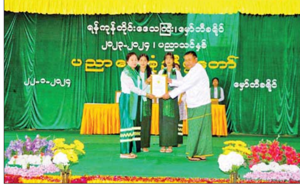
မှော်ဘီ ဇန်နဝါရီ ၂၂ ရန်ကုန်တိုင်းဒေသကြီး ၂၀၂၃-၂၀၂၄ ပညာသင်နှစ် ပညာရေးစုံညီပွဲတော်အခမ်းအနားကို ယနေ့နံနက် ၉ နာရီက အမှတ်(၂) အခြေခံပညာအထက်တန်းကျောင်း ရွှေရတနာခန်းမ၌ ကျင်းပသည်။