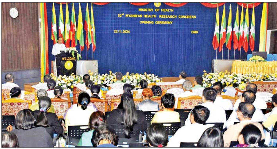
ပြည်ထောင်စုဝန်ကြီး ပါမောက္ခဒေါက်တာသက်ခိုင်ဝင်း (၅၂) ကြိမ်မြောက် မြန်မာနိုင်ငံကျန်းမာရေး ဆိုင်ရာသုတေသနညီလာခံ ဖွင့်ပွဲအခမ်းအနားတွင် အမှာစကားပြောကြားစဉ်။

ညီလာခံသို့ တင်သွင်းမည့်စာတမ်းများတွင် ကိုဗစ်ကပ်ရောဂါနှင့်ပတ်သက်သည့် မြန်မာနိုင်ငံ၌ ရင်ဆိုင်တွေ့ကြုံခဲ့ရသော ကိုဗစ်ကပ်ရောဂါဆိုင်ရာ ပြည်သူ့လူထု၏ ကျန်းမာရေးအသိပညာ၊ ရောဂါ ကာကွယ်မှုနှင့် ကာကွယ်ဆေးထိုးနှံမှုအခြေအနေများ၊ ကူးစက်နိုင်သောဆေးယဉ်ပါးတီဘီရောဂါဆိုင်ရာ သုတေသနစာတမ်းများ၊ မကူးစက်တတ်သော ရောဂါများအားကာကွယ်ခြင်း၊ ထိန်းချုပ်ခြင်းဆိုင် ရာဆွေးနွေးပွဲများ၊ ကျန်းမာရေးဝန်ကြီးဌာန လက်အောက်ရှိ ပြည်သူ့ကျန်းမာရေးဦးစီးဌာန၊