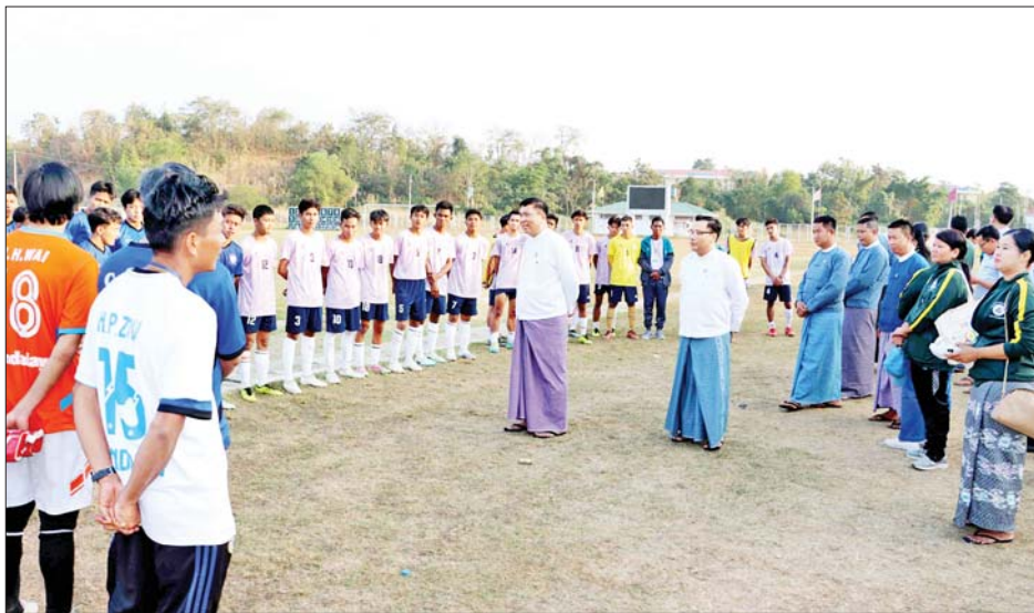
နံနက် ၇ နာရီခွဲတွင် ဝဏ္ဏသိဒ္ဓိအားကစားကွင်း အမှတ် (၁) ၌ အုပ်စု(ခ) ပွဲစဉ်ဖြစ်သော နေပြည်တော် ဇန်နဝါရီ မြစ်ကြီးနားဇန်နဝါရီမှ ဘောလုံးအသင်းများ ယှဉ်ပြိုင်ကစားကြရာ နေပြည်တော်ဇန်နဝါရီ မြစ်ကြီးနားဇန်နဝါရီမှ ဝဏ္ဏသိဒ္ဓိအားကစားကွင်း အမှတ် (၁) ၌ အုပ်စု(ခ) ပွဲစဉ်ဖြစ်သော ဇန်နဝါရီ နှစ်ဂိုး- တစ်ဂိုးဖြင့်လည်းကောင်း၊ ညနေပိုင်းတွင် ကွင်းအမှတ်(၁) ၌ အုပ်စု(ခ) ပွဲစဉ်ဖြစ်သော