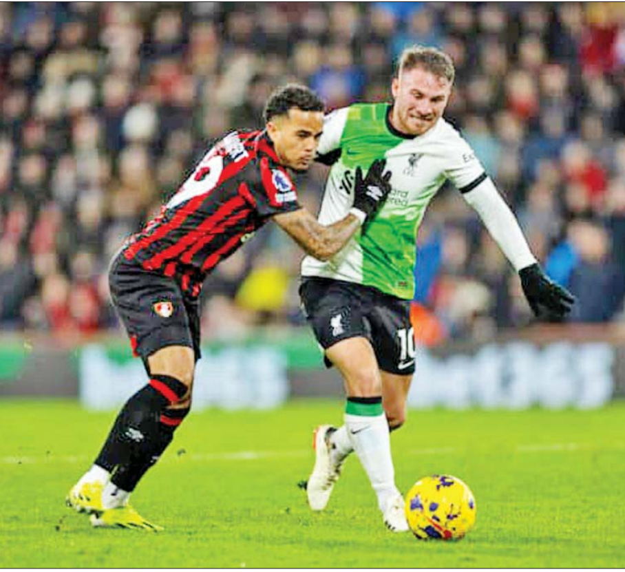
လီဗာပူးအသင်းနှင့် ဘုန်းမောက်အသင်းတို့ ယှဉ်ပြိုင်ကစားကြစဉ်။

ဇန်နဝါရီ ၂၁ ရက် ညပိုင်းက ဘုန်းမောက်အသင်းနဲ့ လီဗာပူး အသင်းတို့ ယှဉ်ပြိုင်ကစားခဲ့တဲ့ ပရီမီယာလိဂ် ပွဲစဉ်(၂၁)မှာ လီဗာပူးအသင်းက ဘုန်းမောက် အသင်းကို လေးဂိုးပြတ်နဲ့ အနိုင် ရရှိခဲ့တာကြောင့် ပရီမီယာလိဂ် အမှတ်ပေးဇယား ထိပ်ဆုံးမှာ ငါးမှတ်ဖြတ်ကာ ဆက်လက် ဦးဆောင်နိုင်ခဲ့ပါတယ်။ ဘုန်းမောက်အသင်းနဲ့ လီဗာပူး အသင်းတို့ပွဲစဉ်မှာ လီဗာပူး အသင်းအတွက် သွင်းဂိုးတွေကို ပွဲကစားချိန် ၄၉ မိနစ်နဲ့ သာမန် ပွဲကစားချိန်အပြီး နာကျင်အချိန်ပို သုံးမိနစ်တို့မှာ ဒါဝင်နူနက်ဇ်က နှစ်ဂိုး၊ မိနစ် ၇၀ နဲ့ ၇၉ မိနစ်တို့မှာ ဂျီတာကနှစ်ဂိုး အသီးသီးသွင်းယူ ပေးခဲ့တာဖြစ်ပါတယ်။ လီဗာပူးအသင်းဟာ တိုက်စစ် များ မိုဟာမက် ဆာလာအီဂျစ် အသင်းနဲ့အတူ အာဖရိကနိုင်ငံများ စာမျက်နှာ ၁၇ ကော်လံ ၃ သို့