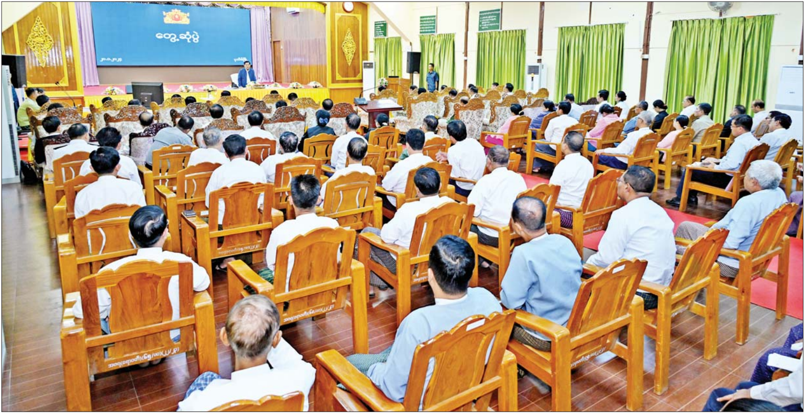
နိုင်ငံတော်စီမံအုပ်ချုပ်ရေးကောင်စီဥက္ကဋ္ဌ နိုင်ငံတော်ဝန်ကြီးချုပ် ဗိုလ်ချုပ်မှူးကြီး မင်းအောင်လှိုင် ဧရာဝတီတိုင်းဒေသကြီး တိုင်းဒေသကြီးအဆင့် ဌာနဆိုင်ရာတာဝန်ရှိသူ များနှင့် မြို့မိမြို့ဖများအား တွေ့ဆုံအမှာစကား ပြောကြားစဉ်။

စီမံအုပ်ချုပ်ရေးကောင်စီ ဥက္ကဋ္ဌ နိုင်ငံတော်ဝန်ကြီးချုပ်နှင့် အတူ ကောင်စီ တွဲဖက်အတွင်းရေးမှူး ဒုတိယဗိုလ်ချုပ်ကြီး ရဲဝင်းဦး၊ ကောင်စီဝင် ဗိုလ်ချုပ်ကြီး မြထွန်းဦး၊ ဒုတိယဗိုလ်ချုပ်ကြီး ညီစော၊ မန်းငြိမ်းမောင်၊ ဒေါက်တာ ဘရွှေ၊ ပြည်ထောင်စုဝန်ကြီးများ ဖြစ်ကြသည့် ဦးမင်းနောင်၊ ဦးလှမိုး၊ ဦးခင်မောင်ရီ၊ ဦးမျိုးသန့်၊ ဒေါက်တာညွန့်ဖေ၊ ဧရာဝတီတိုင်း ဒေသကြီးဝန်ကြီးချုပ် ဦးတင် မောင်ဝင်း၊ ကာကွယ်ရေးဦးစီးချုပ် ရုံးမှ အဆင့်မြှင့်တင်မတော်အရာရှိ ကြီးများ၊ အနောက်တောင်တိုင်း စစ်ဌာနချုပ်တိုင်းမှူး ဗိုလ်မှူးချုပ် ဝေလင်း၊ ဧရာဝတီတိုင်းဒေသကြီး အစိုးရအဖွဲ့ ဌာနဆိုင်ရာတာဝန်ရှိ သူများ တက်ရောက်ကြသည်။