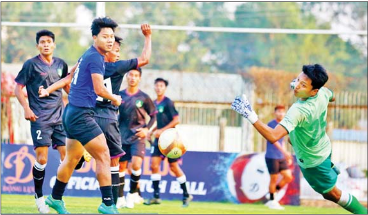
မြန်မာ့လက်ရွေးစင်အသင်းနှင့် မြဝတီအသင်းတို့ ယှဉ်ပြိုင်ကစားကြစဉ်။

ရန်ကုန် ဇန်နဝါရီ ၂၀ ၂၀၂၆ ကမ္ဘာ့ဖလား အာရှဇုန်ခြေစမ်းပွဲအတွက် လေ့ကျင့်ပြင်ဆင်နေသည့် မြန်မာ့လက်ရွေးစင်အသင်းသည် ဒုတိယခြေစမ်းပွဲအဖြစ် ဇန်နဝါရီ ၂၀ ရက်က သုဝဏ္ဏလေ့ကျင့်ရေးကွင်း၌ မြန်မာနေရှင်နယ်လိဂ်ကလပ် မြဝတီအသင်းနှင့် ခြေစမ်းကစားရာ လေးဂိုး-နှစ်ဂိုးဖြင့် အနိုင်ရခဲ့သည်။ စာမျက်နှာ ၂၃ ကော်လံ ၁ သို့ □