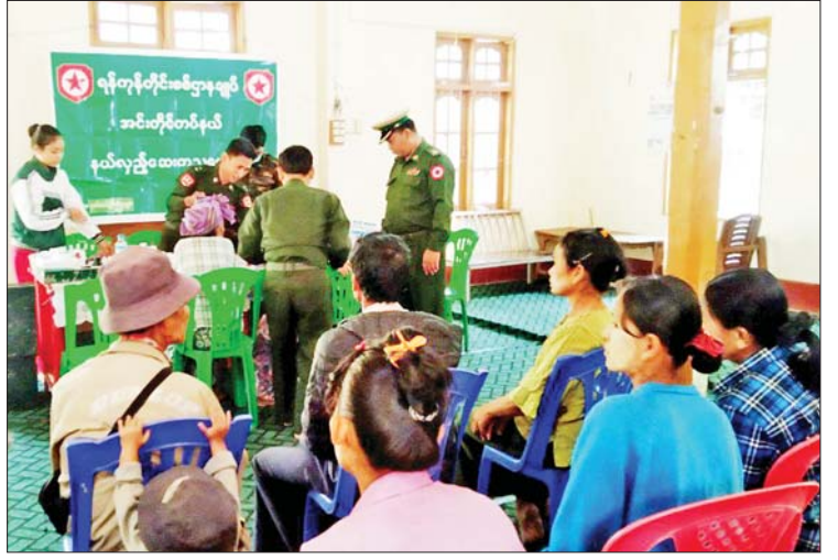
ကုသရန်လိုအပ်သော လူနာများအား သက်ဆိုင်ရာ တိုင်းစစ်ဌာနချုပ်များမှ နယ်မြေခံ တပ်မတော်ဆေးရုံများသို့ တာဝန်ရှိသူများက သွားရောက်ကြည့်ရှု အားပေးပြီး လိုအပ်သည်များ ညှိနှိုင်း ဆောင်ရွက်ပေးခဲ့ကြောင်း သိရသည်။ သတင်းစဉ်

ဆေးကုသရေးအဖွဲ့များက ခွဲစိတ်ကုသမှု ဆိုင်ရာ ရောဂါ၊ အရိုးအကြောရောဂါ၊ အာရုံကြောအားနည်းရောဂါ၊ အဆစ် အမြစ်ရောင်ရောဂါ၊ သွေးတိုးရောဂါ၊ ဆီးချိုရောဂါ၊ အသက်ရှူလမ်းကြောင်း ဆိုင်ရာရောဂါ၊ မျက်စိရောဂါ၊ သွားနှင့် ခံတွင်းရောဂါ၊ ကလေးရောဂါ၊ သားဖွား မီးယပ်ရောဂါ၊ အထွေထွေရောဂါတို့နှင့် ပတ်သက်၍ လိုအပ်သည့် ကျန်းမာရေး စောင့်ရှောက်မှုလုပ်ငန်းများ ဆောင်ရွက် ပေးခြင်း၊ ECG စက်ဖြင့် နှလုံးသွေးကြော ရောဂါ စမ်းသပ်စစ်ဆေးခြင်း၊ တီဗီ ဓာတ်မှန်ရိုက်ကူး၍ ရောဂါရှာဖွေခြင်း၊ ဆီးချို/သွေးချို စစ်ဆေးပေးခြင်းတို့ကို ဆောင်ရွက်ပေးပြီး ဆေးရုံတက်ရောက်