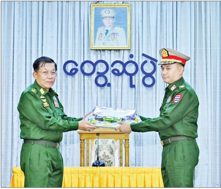
နိုင်ငံတော်စီမံအုပ်ချုပ်ရေးကောင်စီဥက္ကဋ္ဌ တပ်မတော်ကာကွယ်ရေးဦးစီးချုပ် ဗိုလ်ချုပ်မှူးကြီးမင်းအောင်လှိုင် အနောက်တောင်တိုင်းစစ်ဌာနချုပ် ပုသိမ်တပ်နယ်မှ အရာရှိ၊ စစ်သည်၊ မိသားစုများအတွက် စားသောက်ဖွယ်ရာပစ္စည်းများ ပေးအပ်စဉ်။

တပ်မတော်သားများအနေဖြင့် စစ်စည်းကမ်းနှင့်အညီ နေထိုင်ကျင့်ကြံရမည်ဖြစ်ပြီး တစ်ဦးချင်းနှင့် အဖွဲ့အစည်းအပေါ် ထိခိုက်