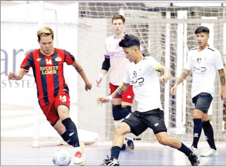
VUC အသင်းနှင့် လက်ဝဲသုန္ဒရအသင်းတို့ ယှဉ်ပြိုင်ကစားကြစဉ်။

ရန်ကုန် ဇန်နဝါရီ ၂၀ MFF ဖူဆယ်လိဂ်-၁ ပြိုင်ပွဲပွဲစဉ် (၁၁) ကို ဇန်နဝါရီ ၂၀ ရက်က ရန်ကုန်မြို့ သုဝဏ္ဏဘောလုံးကွင်းရှိ MFF ဖူဆယ်အားကစားရုံ၌ကျင်းပရာ လက်ရှိချန်ပီယံ VUC အသင်း ၁၁ ပွဲဆက် အနိုင်ရခဲ့သည်။ ပွဲစဉ် (၁၁) တွင် VUC အသင်းက လက်ဝဲသုန္ဒရအသင်းကို ငါးဂိုး-ဂိုးမရှိ၊ Winner Soccer အသင်းက ဖူဆယ်ချစ်သူအသင်းကို နှစ်ဂိုး-တစ်ဂိုး၊ MIU အသင်းက လင်းလက်အသင်းကို လေးဂိုး-တစ်ဂိုး၊ Futsal-19 အသင်းက Dream Team အသင်းကို နှစ်ဂိုး-ဂိုးမရှိ၊ Generations အသင်းက M2K အသင်းကို ငါးဂိုး-ဂိုးမရှိဖြင့် အနိုင်ရခဲ့သည်။ ပွဲစဉ် (၁၁) အပြီးတွင် VUC အသင်းက ရမှတ် ၃၃ မှတ်ဖြင့် ဦးဆောင်နေပြီး MIU အသင်းက ၂၅ မှတ်၊ Winner Soccer အသင်းနှင့် Generations အသင်းတို့က ၂၃ မှတ်၊ Futsal-19 အသင်းက စာမျက်နှာ ၂၂ ကော်လံ ၅ သို့ ၀