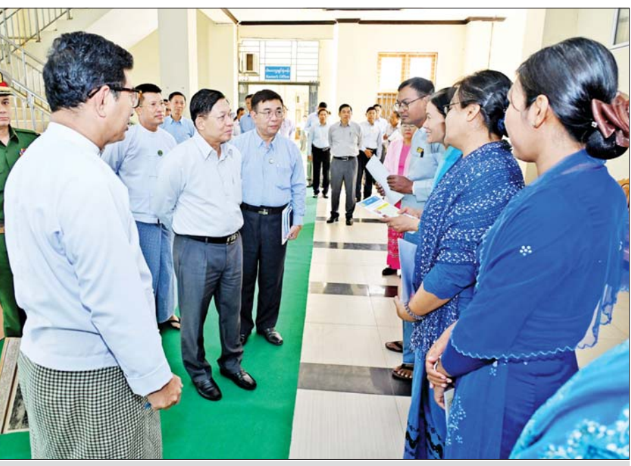
နိုင်ငံတော်စီမံအုပ်ချုပ်ရေးကောင်စီဥက္ကဋ္ဌ နိုင်ငံတော်ဝန်ကြီးချုပ် ဗိုလ်ချုပ်မှူးကြီးမင်းအောင်လှိုင် ပုသိမ်တက္ကသိုလ်မှ ဆရာ ဆရာမများအား ရင်းနှီးနှေးနှေး နှုတ်ဆက်စဉ်။

ဆွေးနွေးပြောကြား နိုင်ငံတော် စီမံအုပ်ချုပ်ရေး ကောင်စီဥက္ကဋ္ဌ နိုင်ငံတော်ဝန်ကြီး ချုပ်က ပညာရေးကဏ္ဍဖွံ့ဖြိုး တိုးတက်ရေးအတွက် လိုအပ် သည့်များ ဆွေးနွေးပြောကြားရာ တွင် ပုသိမ်တက္ကသိုလ်သည် သက်တမ်း(၆၅) နှစ်ရှိပြီဖြစ်သည့် တက္ကသိုလ်တစ်ခုဖြစ်ပြီး သင်ကြား မှုပိုင်းဆိုင်ရာများတွင် ရန်ကုန် တက္ကသိုလ်၊ မန္တလေးတက္ကသိုလ်တို့ နှင့် ရင်ပေါင်တန်းနိုင်ရမည်ဖြစ် ကြောင်း၊ တက္ကသိုလ်ပညာရပ် သည် အတတ်ပညာကို သင်ကြား ပေးသည်ဖြစ်သဖြင့် ကျောင်းသား ကျောင်းသူများအနေဖြင့် ၎င်းတို့ ဘဝတွင် အဆင်ပြေစွာ ရပ်တည် နိုင်သည်အထိ သင်ကြားပေး နိုင်ရန်လိုကြောင်း၊ အခြေခံပညာ မူလတန်း၊ အခြေခံပညာအထက် တန်းကျောင်းတို့တွင် တွေ့ကြုံခဲ့ရ သည့်ပတ်ဝန်းကျင်နှင့် တက္ကသိုလ် တွင် တွေ့ကြုံရသည့်ပတ်ဝန်းကျင် သည် များစွာကွာခြားမှုရှိပြီး