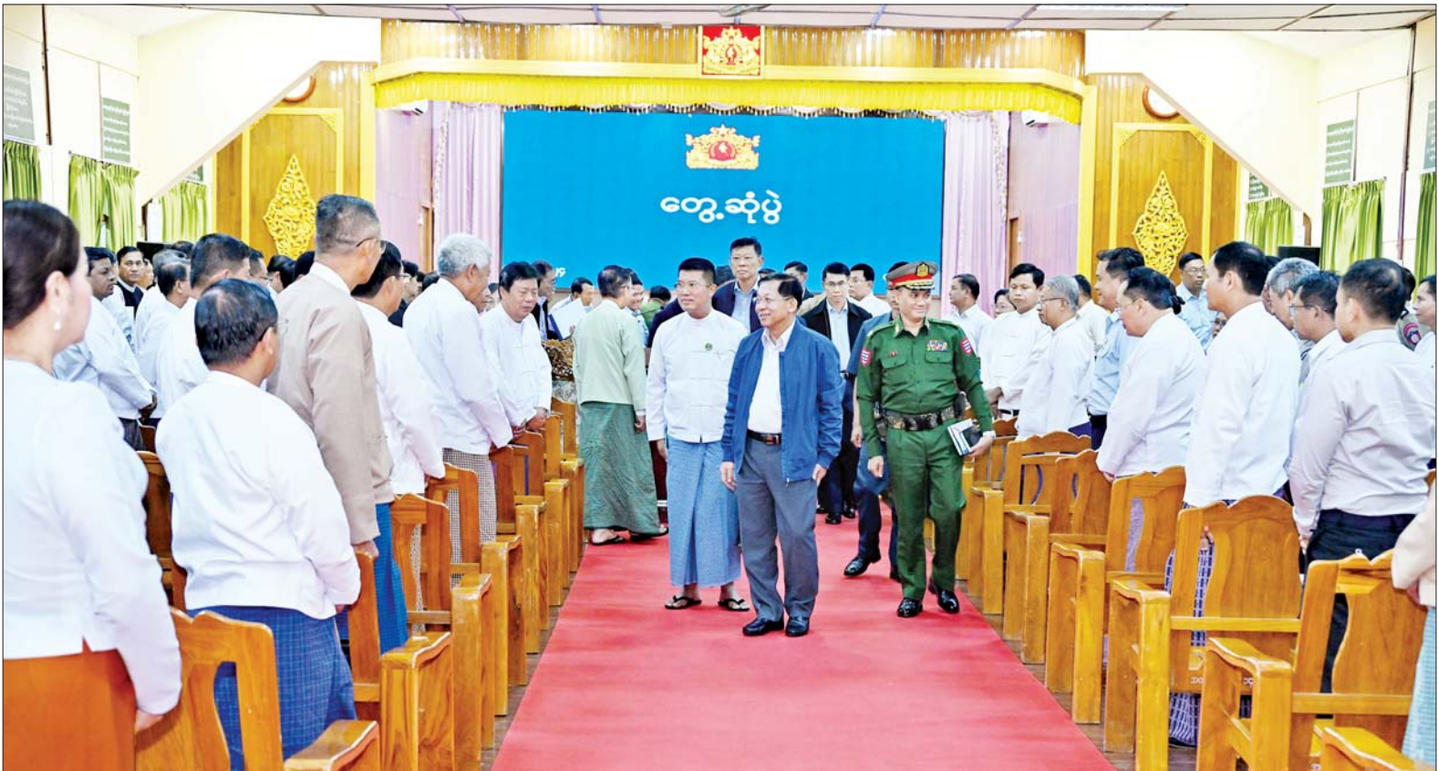
နိုင်ငံတော်စီမံအုပ်ချုပ်ရေးကောင်စီဥက္ကဋ္ဌ နိုင်ငံတော်ဝန်ကြီးချုပ် ဗိုလ်ချုပ်မှူးကြီးမင်းအောင်လှိုင် ဌာနဆိုင်ရာတာဝန်ရှိသူများနှင့် မြို့မိမြို့ဖများအား ရင်းရင်းနှီးနှီး နှုတ်ဆက်စဉ်။

ကြိုဆိုနှုတ်ဆက် ဦးစွာ နိုင်ငံတော်စီမံအုပ်ချုပ်ရေး ကောင်စီဥက္ကဋ္ဌ နိုင်ငံတော်ဝန်ကြီး ချုပ်နှင့် အဖွဲ့ဝင်များသည် ဧရာဝတီ တိုင်းဒေသကြီး ပုသိမ်လေဆိပ်သို့ ရောက်ရှိကြရာ တိုင်းဒေသကြီး ဝန်ကြီးချုပ် ဦးတင်မောင်ဝင်း၊ အနောက်တောင်တိုင်း စစ်ဌာနချုပ် တိုင်းမှူး ဗိုလ်မှူးချုပ် ဝေလင်းနှင့် အဖွဲ့ဝင်များက ကြိုဆိုနှုတ်ဆက် ကြသည်။ စာမျက်နှာ ၃ ကော်လံ ၁ သို့ ❁