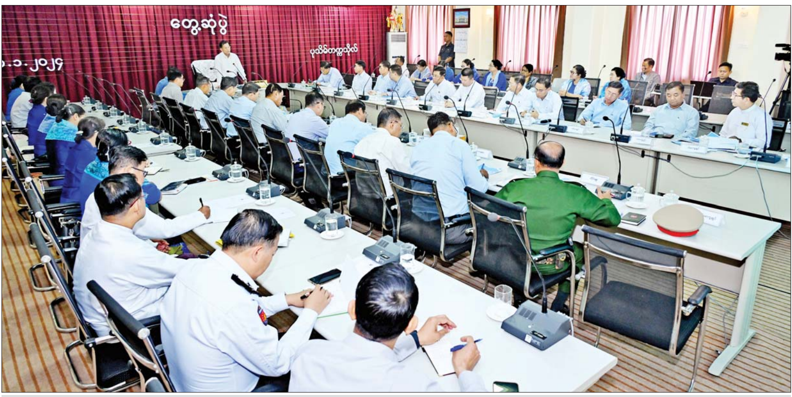
နိုင်ငံတော်စီမံအုပ်ချုပ်ရေးကောင်စီဥက္ကဋ္ဌ နိုင်ငံတော်ဝန်ကြီးချုပ် ဗိုလ်ချုပ်မှူးကြီးမင်းအောင်လှိုင် ပုသိမ်တက္ကသိုလ် ပါမောက္ခချုပ်၊ ဒုတိယပါမောက္ခချုပ်များ၊ ဆရာ ဆရာမများနှင့် တွေ့ဆုံအမှာစကား ပြောကြားစဉ်။

နေပြည်တော် ဇန်နဝါရီ ၂၀ နိုင်ငံတော် စီမံအုပ်ချုပ်ရေး ကောင်စီဥက္ကဋ္ဌ နိုင်ငံတော် ဝန်ကြီးချုပ် ဗိုလ်ချုပ်မှူးကြီး မင်းအောင်လှိုင်သည် ခရီးစဉ်တွင် လိုက်ပါလာသည့် အဖွဲ့ဝင်များ၊ ဧရာဝတီတိုင်းဒေသကြီး ဝန်ကြီး ချုပ် အနောက်တောင်တိုင်းစစ်ဌာနချုပ် တိုင်းမှူးတို့လိုက်ပါ၍ ယနေ့ နံနက်ပိုင်းတွင် ဧရာဝတီတိုင်း ဒေသကြီး ပုသိမ်မြို့ရှိ ပုသိမ် တက္ကသိုလ်သို့ သွားရောက်ကြည့်ရှု စစ်ဆေးသည်။