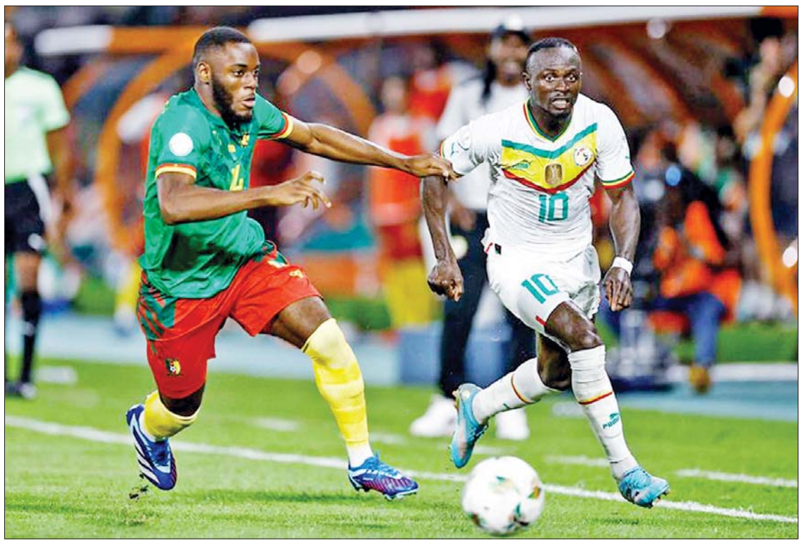
ဆီနီဂေါအသင်းနှင့် ကင်မရွန်းအသင်းတို့ ယှဉ်ပြိုင်ကစားကြစဉ်။

အာဖရိကနိုင်ငံများဖလား လက်ရှိချန်ပီယံ ဆီနီဂေါအသင်းဟာ ဇန်နဝါရီ ၁၉ ရက် ညပိုင်းက ယှဉ်ပြိုင်ကစားခဲ့တဲ့ အာဖရိကနိုင်ငံများဖလား အုပ်စု(C)ရဲ့ ပွဲစဉ်တစ်ပွဲဖြစ်တဲ့ ကင်မရွန်းအသင်းနဲ့ ပွဲစဉ်မှာ ကင်မရွန်းအသင်းကို သုံးဂိုး-တစ်ဂိုးနဲ့ အနိုင်ရရှိခဲ့တာကြောင့် (၁၆) သင်းအဆင့်ကို တက်လှမ်းခွင့်ရရှိခဲ့ပြီ ဖြစ်ပါတယ်။