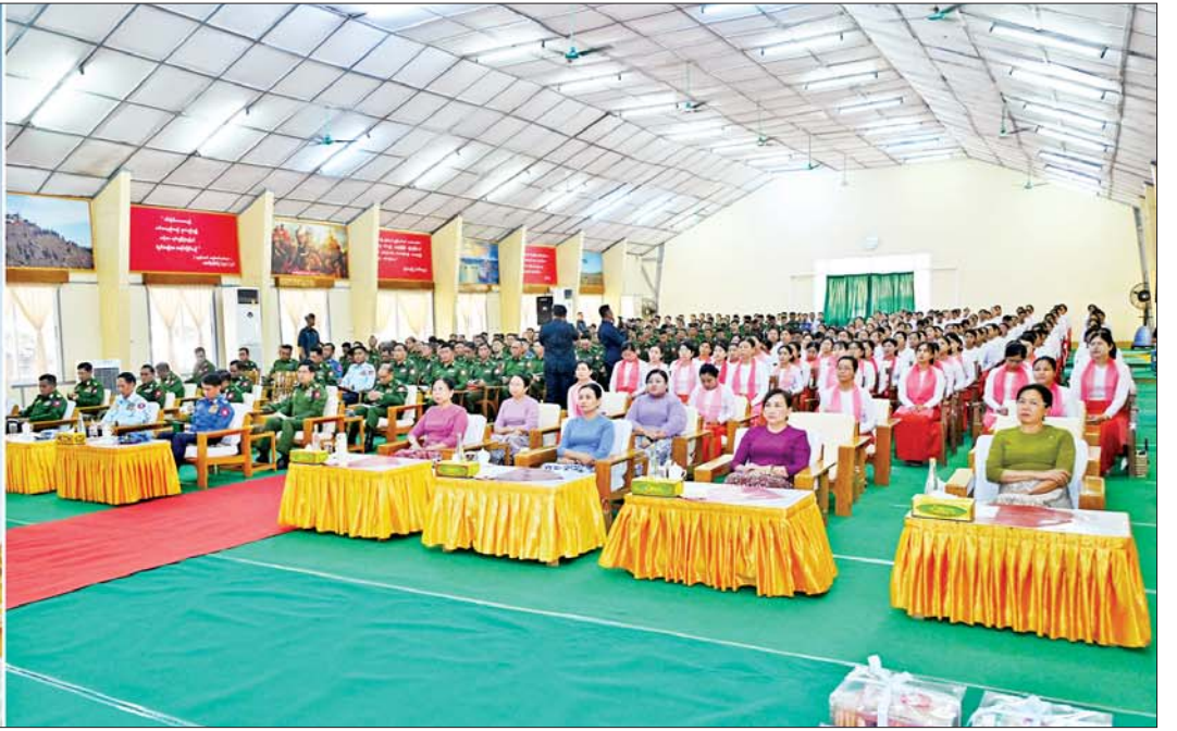
နိုင်ငံတော်စီမံအုပ်ချုပ်ရေးကောင်စီဥက္ကဋ္ဌ တပ်မတော်ကာကွယ်ရေးဦးစီးချုပ် ဗိုလ်ချုပ်မှူးကြီးမင်းအောင်လှိုင် အနောက်တောင်တိုင်းစစ်ဌာနချုပ် ပုသိမ်တပ်နယ်မှ အရာရှိ၊ စစ်သည်၊ မိသားစုများအား တွေ့ဆုံအမှာစကားပြောကြားစဉ်။