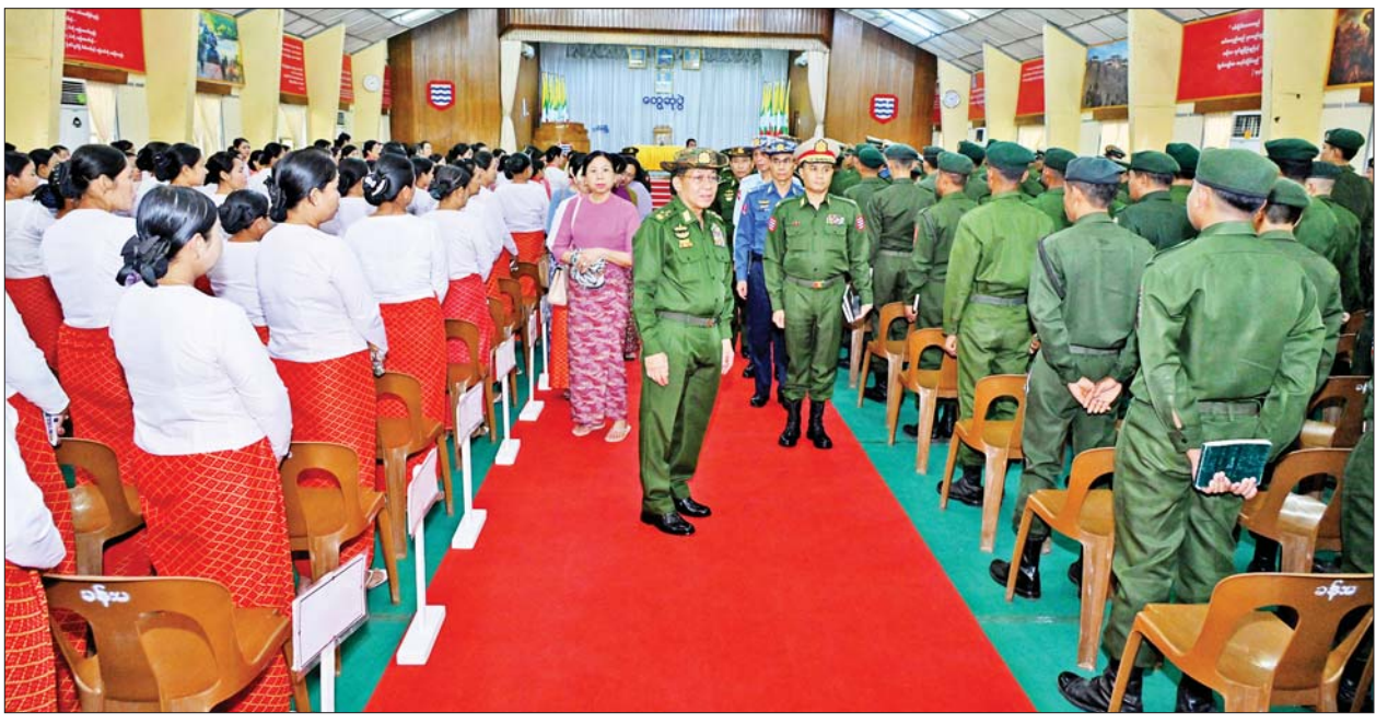
နိုင်ငံတော်စီမံအုပ်ချုပ်ရေးကောင်စီဥက္ကဋ္ဌ တပ်မတော်ကာကွယ်ရေးဦးစီးချုပ် ဗိုလ်ချုပ်မှူးကြီးမင်းအောင်လှိုင် အနောက်တောင်တိုင်းစစ်ဌာနချုပ် ပုသိမ်တပ်နယ်မှ အရာရှိ၊ စစ်သည်၊ မိသားစုများအား ရင်းရင်းနှီးနှီးနှုတ်ဆက်စဉ်။

လူတိုင်းသည် တိုးတက်မှုကို လိုလားကြပြီး ဘဝဖြတ်သန်းမှုတွင် အောင်မြင်စွာဖြင့် ဖြတ်သန်းလိုကြကြောင်း၊ မိမိတို့တစ်ဦးချင်းအလိုက် အောင်မြင်တိုးတက်စေရေး မိမိကိုယ်မိမိ စနစ်ကျကျစွာ နေထိုင်လုပ်ကိုင်ခြင်း၊ ကြိုးစားအားထုတ်ခြင်း၊ မိမိကိုယ်ကိုနှင့် မိမိပတ်ဝန်းကျင်ကို ကောင်းမွန်အောင် နေထိုင်ခြင်းတို့ဖြင့် ဆောင်ရွက်ကြရမည်ဖြစ်ကြောင်း၊ ကြိုးစားအားထုတ်မှုတိုင်း အတွက် ထိုက်သင့်သည့် အခွင့်အလမ်းများလည်း ရရှိလာနိုင်မည်ဖြစ်သည်ကို နားလည် သဘောပေါက်ကြရန်လိုကြောင်း၊ မိမိကိုယ်ကို ကောင်းအောင်နေထိုင်ခြင်းဖြင့် မိမိမိသားစုတွင်လည်း ကောင်းမွန်သည့် အမှုအကျင့်များ၊ အလေ့အကျင့်ကောင်းများ ရရှိလာမည်ဖြစ်ကြောင်း၊ မိမိတို့ကို မိဘများက