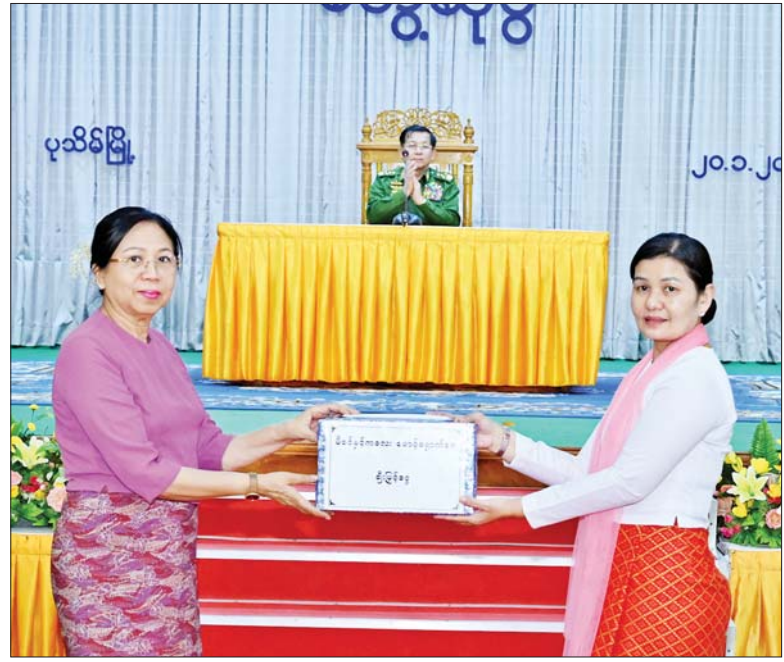
နိုင်ငံတော်စီမံအုပ်ချုပ်ရေးကောင်စီဥက္ကဋ္ဌ တပ်မတော်ကာကွယ်ရေးဦးစီးချုပ် ဗိုလ်ချုပ်မှူးကြီးမင်းအောင်လှိုင်၏ ဇနီး ဒေါ်ကြူကြူလှ အနောက်တောင်တိုင်းစစ်ဌာနချုပ် ပုသိမ်တပ်နယ် မိခင်နှင့် ကလေးစောင့်ရှောက်ရေးအသင်းအတွက် ချီးမြှင့်ငွေများ ပေးအပ်စဉ်။

စေနိုင်သည့် လုပ်ကိုင်ပြုမူနေထိုင်မှုများကို ရှောင်ကြဉ်ကြရန်လိုကြောင်း၊ အသောက်အစား အပျော်အပါးများကြောင့် မိမိတို့တစ်ဦးချင်းစွမ်းဆောင်ရည်များနှင့် မိမိတို့၏မိသားစု၊ အဖွဲ့အစည်းအပေါ်တွင် ထိခိုက်မှုမရှိအောင် ထိန်းထိန်းသိမ်းသိမ်း နေထိုင်ကြရမည်ဖြစ်ကြောင်း၊ တစ်ဦးချင်းကိုယ်စီ အသိတရား၊ ဆင်ခြင်တုံတရားများဖြင့် ထိန်းသိမ်းနေထိုင်ခြင်းဖြင့် မိမိကိုယ်မိမိ တည်ဆောက်ကြရမည်ဖြစ်ကြောင်း။