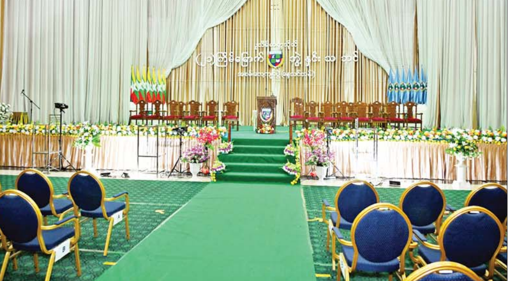
နိုင်ငံတော်စီမံအုပ်ချုပ်ရေးကောင်စီဥက္ကဋ္ဌ နိုင်ငံတော်ဝန်ကြီးချုပ် ဗိုလ်ချုပ်မှူးကြီးမင်းအောင်လှိုင် ပုသိမ်တက္ကသိုလ် ဘွဲ့နှင်းသဘင်ခန်းမကို ကြည့်ရှုစစ်ဆေးစဉ်။