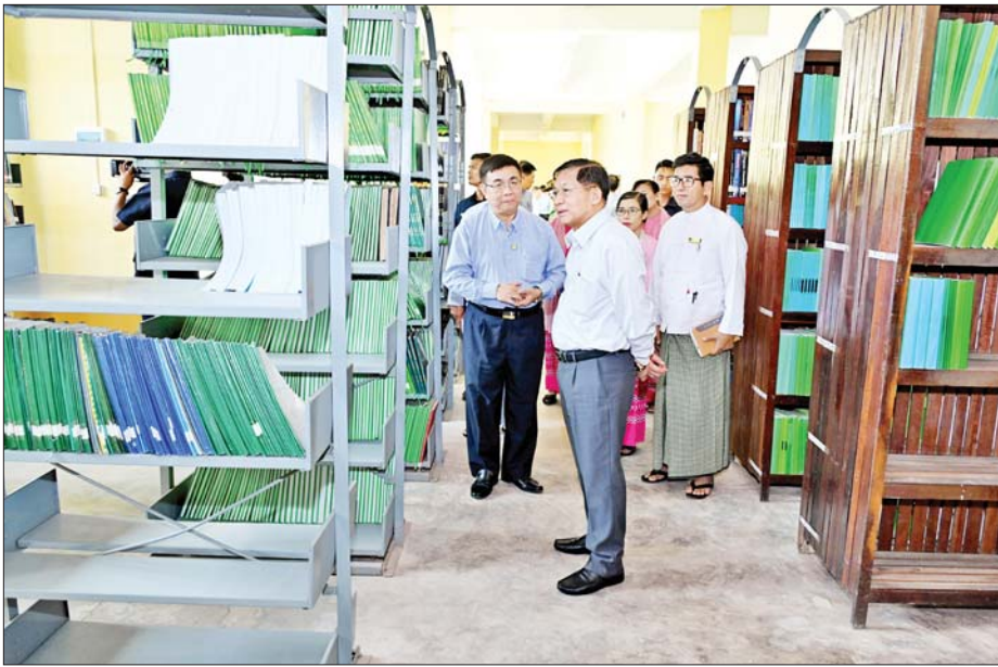
နိုင်ငံတော်စီမံအုပ်ချုပ်ရေးကောင်စီဥက္ကဋ္ဌ နိုင်ငံတော်ဝန်ကြီးချုပ် ဗိုလ်ချုပ်မှူးကြီးမင်းအောင်လှိုင် ပုသိမ်တက္ကသိုလ် စာကြည့်တိုက်အတွင်း ကြည့်ရှုစစ်ဆေးစဉ်။

* စာမျက်နှာ ၅ မှ တွေးခေါ်လေ့လာသင်ကြားခြင်း (Studying)ကို အဓိကထားဆောင်ရွက်ကြခြင်းဖြစ်ကြောင်း၊ တက္ကသိုလ် တက်ရောက်စဉ် ပတ်ဝန်းကျင်မှရရှိသည့် အတွေ့အမြင်ပဟုသုတနှင့် သင်ကြားမှုမှ ရရှိသည့် တွေးခေါ်မြော်မြင်နိုင်မှုတို့ကို ၎င်းတို့၏ လက်တွေ့ဘဝတွင် အသုံးပြု၍ အောင်မြင်စွာ ဖြတ်သန်းနိုင်ရမည်ဖြစ်ကြောင်း၊ ထို့ကြောင့် ကျောင်းသားကျောင်းသူများ အတွေးအခေါ်မှန်ကန်ကောင်းမွန်စေရေးနှင့် ပညာရပ်များကို မှန်ကန်စွာ တတ်မြောက်စေရေး စနစ်တကျ သင်ကြားပေးကြရန်နှင့် အခြေခံစိတ်ဓာတ်ကောင်းများ ရရှိရေးအလေးထား ဆောင်ရွက်ကြရန်လိုကြောင်း။