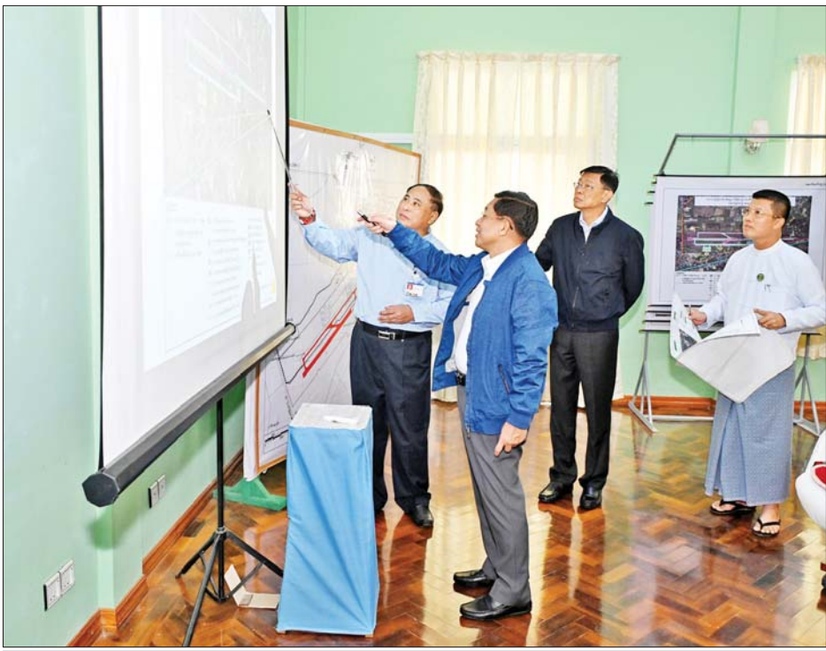
နိုင်ငံတော်စီမံအုပ်ချုပ်ရေးကောင်စီဥက္ကဋ္ဌ နိုင်ငံတော်ဝန်ကြီးချုပ် ဗိုလ်ချုပ်မှူးကြီးမင်းအောင်လှိုင် ပုသိမ်လေဆိပ်နှင့် လေယာဉ်ပြေးလမ်း အဆင့်မြှင့်တင်ခြင်းလုပ်ငန်းများ ဆောင်ရွက်နေမှုနှင့်ပတ်သက်၍ လိုအပ်သည်များ မှာကြားစဉ်။

★ စာမျက်နှာ ၃ မှ ရေကြောင်းကိုသာ အဓိကအသုံးပြု၍ ဆောင်ရွက်ခဲ့ကြကြောင်း၊ လက်ရှိ အချိန်တွင်လည်း ရေကြောင်း ခရီးသွားလာရေး၊ ရေကြောင်းကုန်စည် ကူးသန်း ရောင်းဝယ်ရေးလုပ်ငန်းများ ပိုမို ဖွံ့ဖြိုးတိုးတက်စေရေး စီမံဆောင်ရွက်လျက်ရှိကြောင်း၊ ဒေသတွင်းရှိ ရထားပို့ဆောင်ရေးခရီးစဉ်များကိုလည်း အကျိုးရှိရှိ အသုံးပြုစေလိုကြောင်း၊ ပို့ဆောင်ရေးစနစ်များတွင် လေကြောင်းဖြင့် သယ်ယူပို့ဆောင်ခြင်း၊ ရေကြောင်းဖြင့် သယ်ယူပို့ဆောင်ခြင်း၊ မော်တော်ယာဉ်ဖြင့် သယ်ယူပို့ဆောင်ခြင်းနှင့် မီးရထားဖြင့် သယ်ယူပို့ဆောင်ခြင်းဟူ၍ရှိပြီး မီးရထားဖြင့် သယ်ယူပို့ဆောင်ခြင်းသည် စရိတ်စက သက်သာစွာဖြင့် ခရီးသည်အများအပြားကို လိုရာခရီးကို ပို့ဆောင်ပေးနိုင်သကဲ့သို့ ကုန်စည် အမြောက်အမြားကိုလည်း ရထားလမ်းကွန်ရက်ရှိရာ ဒေသအသီးသီးကို စရိတ်ကုန်ကျမှု အနည်းဆုံးဖြင့် အချိန်တိုအတွင်း ပို့ဆောင် ပေးနိုင်သောကြောင့် အားပေး ဆောင်ရွက်သွားကြရန် လိုပြီး အကျိုးရှိစွာ အသုံးပြုရန် လိုကြောင်း။