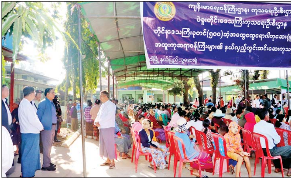
ဝေါမြို့နယ်အတွင်း ဒေသခံပြည်သူများအား အထူးကုဆရာဝန်ကြီးများဖြင့် နယ်လှည့်ကွင်းဆင်းဆေးကုသမှု သွားရောက်ကြည့်ရှုအားပေးသည်။

ဝေါ ဇန်နဝါရီ ၂၀ ပဲခူးတိုင်းဒေသကြီးဝန်ကြီးချုပ် ဦးမျိုးဆွေဝင်းသည် ယနေ့နံနက်ပိုင်းက ဝေါမြို့နယ်အတွင်း ဒေသခံပြည်သူများအား အထူးကုဆရာဝန်ကြီးများဖြင့် နယ်လှည့်ကွင်းဆင်းဆေးကုသမှုကို သွားရောက်ကြည့်ရှုအားပေးသည်။