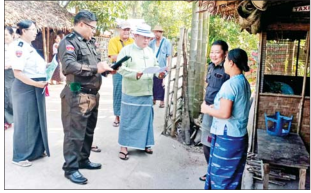
ညီညွတ်မှုဖြင့် ရှေ့သို့၍ ပြည်ထောင်စုရဲ့ပန်းတိုင်ဆီ။