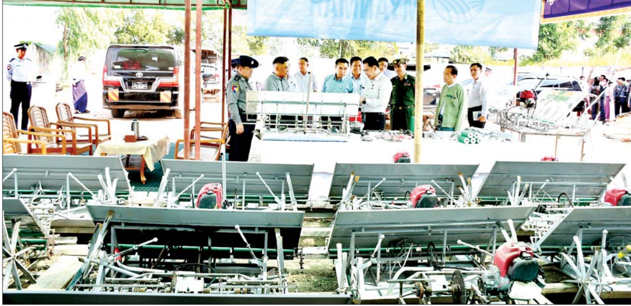
ပြည်ထောင်စုဝန်ကြီး ဦးမောင်မောင်အုန်း Agro Future Myanmar Co.,Ltd. က ထုတ်လုပ်လျက်ရှိသော လက်ဆွဲကောက်စိုက်စက် ထုတ်လုပ်ရောင်းချနေမှုကို ကြည့်ရှုအားပေးစဉ်။

စနစ်ဖြင့် ရောင်းချမှု၊ ယုံကြည် စိတ်ချရမှုတို့ကြောင့် မြန်မာနိုင်ငံ အရပ်ရပ်မှ ဝယ်ယူအားပေးလျက်ရှိ ကြောင်း သိရသည်။ ထို့နောက် ပဲခူးမြို့ ညောင်အင်း စက်မှုဇုန်ရုံ Bago Sports Gloves Co.,Ltd. သို့ သွားရောက် ၍ အားကစားလက်အိတ်များ ထုတ်လုပ်နေမှုကို ကြည့်ရှုလေ့လာ သည်။