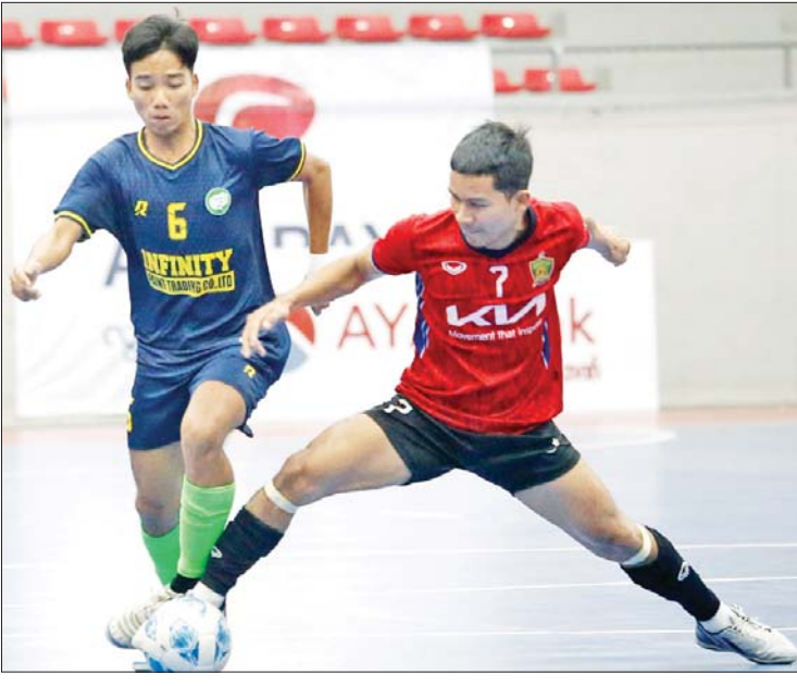
ဖူဆယ်ချစ်သူအသင်းနှင့် Futsal-19 အသင်းတို့ ယှဉ်ပြိုင်ကစားကြစဉ်။

ရန်ကုန် ဇန်နဝါရီ ၁၇ MFF ဖူဆယ်လိဂ်-၁ ပြိုင်ပွဲ ဒုတိယ အကျော့ ပထမဆုံးရက်သတ္တပတ် ဖြစ်သည့် ပွဲစဉ်(၁၀)ကို ဇန်နဝါရီ ၁၇ ရက် က MFF ဖူဆယ်အားကစားရုံ၌ ဆက်လက် ကျင်းပသည်။ ဒုတိယအကျော့ အဖွင့်ရက်သတ္တပတ် တွင် ဇယားထိပ်ဆုံးမှ လက်ရှိချန်ပီယံ VUC အသင်း အမှားအယွင်းမရှိ ၁၀ ပွဲ ဆက်တိုက်အနိုင်ရခဲ့ပြီး ပထမအကျော့ အပြီး ဒုတိယအကျော့ ရပ်တည်နေသည့် Generations အသင်းသည် ရှုံးပွဲဆက်ခံ သဖြင့် ဒုတိယအကျော့ကို MIU အသင်းအား လွှဲပြောင်းပေးခဲ့ရသည်။ ပွဲစဉ် (၁၀) တွင် MIU အသင်းက Dream Team အသင်းကို သုံးဂိုး-ဂိုးမရှိ VUCအသင်းက M2K အသင်း ကိုလေးဂိုး-ဂိုးမရှိ ဖူဆယ်ချစ်သူအသင်းက စာမျက်နှာ ၁၆ ကော်လံ ၃ သို့ ❖