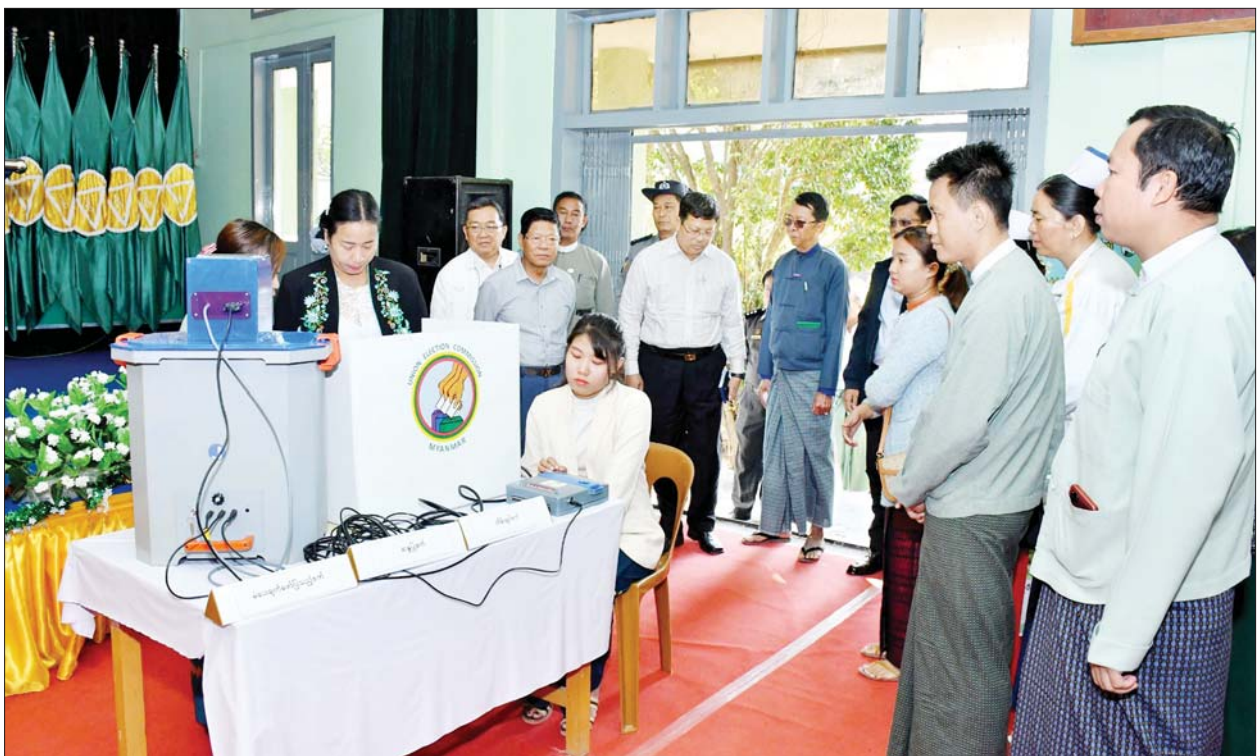
ပြည်ထောင်စုရွေးကောက်ပွဲ ကော်မရှင်သည် MYANMAR ELECTRONIC VOTING MACHINE (MEVM)စက်ဖြင့် လက်တွေ့စမ်းသပ်မဲပေးလေ့လာခြင်း အသိပညာပေးလုပ်ငန်းများကို နေပြည်တော်ရှိ ဝန်ကြီးဌာနများနှင့် အဖွဲ့အစည်းများ၊ ရန်ကုန်တိုင်းဒေသကြီးအတွင်း မြို့နယ်များရှိ ဌာနဆိုင်ရာဝန်ထမ်းများ၊ နိုင်ငံရေးပါတီများမှ ကိုယ်စား

ထို့နောက် ပြည်ထောင်စုရွေးကောက်ပွဲကော်မရှင် ဥက္ကဋ္ဌသည် မန္တလေးခရိုင် ရွေးကောက်ပွဲကော်မရှင်အဖွဲ့ခွဲရုံး၌ တိုင်းဒေသကြီး၊ မန္တလေးခရိုင်နှင့် မြို့နယ်များမှ ရွေးကောက်ပွဲအရာရှိများကို တွေ့ဆုံ၍ လူဝင်မှုကြီးကြပ်ရေးနှင့် ပြည်သူ့အင်အားဝန်ကြီးဌာနမှ ပေးပို့သည့် အသက် ၁၈ နှစ်နှင့်အထက် လူဦးရေစာရင်းများအား CVLMS (CENTRAL VOTERS LIST MANAGEMENT SYSTEM) ဆော့ဝဲလ်စနစ်အတွင်း ထည့်သွင်းနေမှု၊ မြန်မာအီလက်ထရောနစ်မဲပေးစက်ဖြင့် မဲဆန္ဒရှင်ပြည်သူများ စမ်းသပ်သရုပ်ပြမဲပေးခြင်း အသိပညာပေးလုပ်ငန်းများနှင့်စပ်လျဉ်း၍ ဆောင်ရွက်ရန်ကိစ္စရပ်များကို မှာကြားသည်။