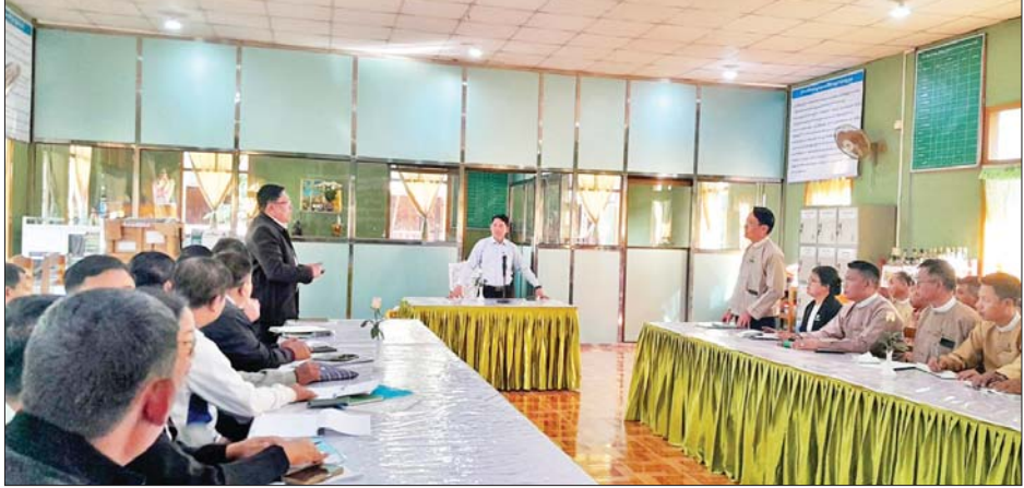
ဆွေးနွေးတင်ပြကြရာ ပြည်ထောင်စုဝန်ကြီးက လိုအပ်သည်များကို ဖြည့်ဆည်းပေါင်းစပ် ဆောင်ရွက်ပေးကာ နိဂုံးချုပ်စကား ပြောကြားခဲ့သည်။ ဆက်လက်၍ ပြည်ထောင်စုဝန်ကြီးက စိုက်ပျိုးရေးသိပ္ပံပညာရှင် မြက်ဖြတ်စက် တစ်ခု၊ ဟုမ္မလင်းမြို့နယ်တောင်သူအစုအဖွဲ့အလိုက် အသုံးပြုရန် နှီးဖြာစက်တစ်လုံး ထောက်ပံ့ပေးအပ်ခဲ့ကြောင်း သိရသည်။ သတင်းစဉ်