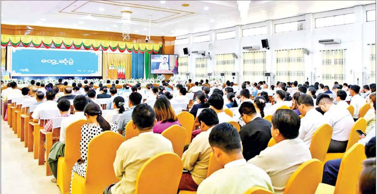
ပြည်ထောင်စုဝန်ကြီး ဦးမောင်မောင်အုန်း ပဲခူးတိုင်းဒေသကြီးရှိ ဌာနဆိုင်ရာဝန်ထမ်းများ၊ ပဲခူးတက္ကသိုလ်မှ ဆရာ ဆရာမများနှင့် ကျောင်းသား ကျောင်းသူများ၊ လူမှုရေးအသင်းအဖွဲ့များမှ တာဝန်ရှိသူများအား သတင်းတု၊ သတင်းမှားများ တိုက်ဖျက်ရေးလုပ်ငန်းများ ဆွေးနွေးပြောကြားစဉ်။

ပြည်ပသြဇာခံယူနေသော မီဒီယာ ကြီးများက မိမိတို့နိုင်ငံနှင့် ပြည်သူ များကို သတင်းမှားများ ထုတ်လွှင့် ကာ တိုင်းဖျက်ပြည်ဖျက်လုပ်ရပ် များ ဆောင်ရွက်နေကြသည်ကို ပြည်သူများအားလုံးက ဝေဖန် ပိုင်းခြားသိမြင်ကြရန် လိုအပ်ပါ ကြောင်း၊ ပြည်သူများအနေဖြင့် သတင်းမှန်များ သိရှိစေရန်အတွက် မိမိတို့ဝန်ကြီးဌာနက ထုတ်ပြန် သည့် သတင်းစာများ၊ Website များ၊ လူမှုကွန်ရက်စာမျက်နှာများ ၌ ဖတ်ရှုပေးကြရန် လိုအပ်ပါ ကြောင်း၊ ၁၉၈၈ ခုနှစ်တွင်လည်း ပြည်ပမီဒီယာကြီးများက သတင်း တု၊ သတင်းမှားများ လွှင့်ထုတ် ကာ အချင်းချင်းစည်းလုံးညီညွတ် မှုပြုကြွအောင်၊ တည်ငြိမ်အေးချမ်း မှုပျက်ပြားအောင် ဆောင်ရွက် ခဲ့ကြသည်ကို သင်ခန်းစာယူကြ ရမည်ဖြစ်ပါကြောင်း။