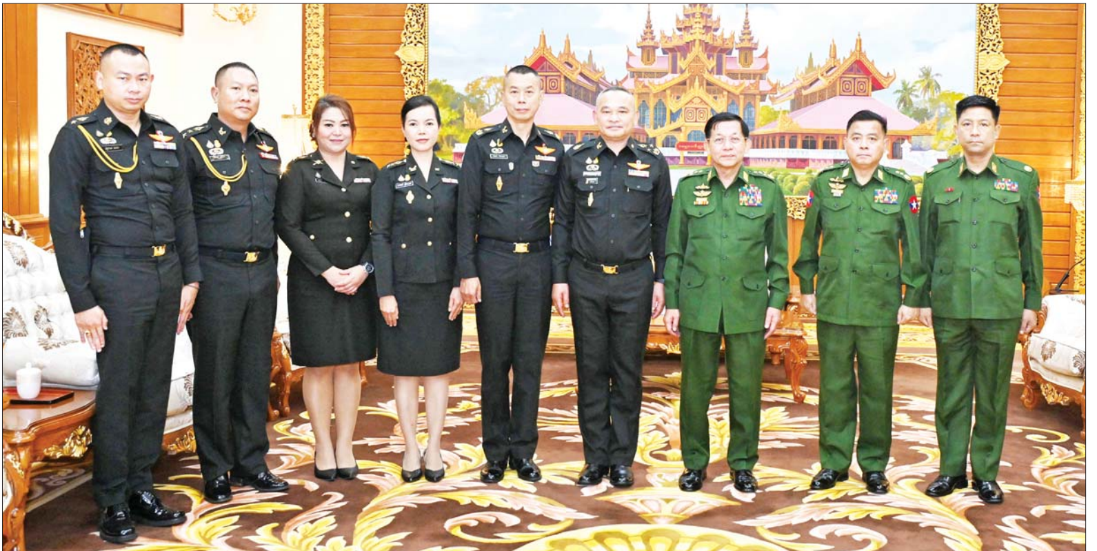
နိုင်ငံတော်စီမံအုပ်ချုပ်ရေးကောင်စီဥက္ကဋ္ဌ တပ်မတော်ကာကွယ်ရေးဦးစီးချုပ် ဗိုလ်ချုပ်မှူးကြီး မင်းအောင်လှိုင် ထိုင်းဘုရင့်ကြည်းတပ်ဦးစီးချုပ်ရုံး အကြံပေးဘုတ်အဖွဲ့ဥက္ကဋ္ဌ General Kittisak Boonprathamchai ဦးဆောင်သည့် ကိုယ်စားလှယ်အဖွဲ့နှင့်အတူ စုပေါင်းမှတ်တမ်းတင်ဓာတ်ပုံရိုက်စဉ်။

ထိုသို့ တွေ့ဆုံဆွေးနွေးရာတွင် နှစ်နိုင်ငံနှင့် နှစ်နိုင်ငံတပ်မတော် နှစ်ရပ်အကြား ရှိရင်းစွဲချစ်ကြည် ရင်းနှီးမှုနှင့် ပူးပေါင်းဆောင်ရွက် မှုများ တိုးမြှင့်ခိုင်မာစေရေး ဆက်လက်ဆောင်ရွက်သွားမည့် အခြေအနေများ၊ တပ်မတော် နှစ်ရပ်အကြား ချစ်ကြည်ရေးခရီး စဉ်များ အပြန်အလှန်သွားရောက် ခြင်း၊ ယဉ်ကျေးမှုအဖွဲ့အချင်းချင်း ထိတွေ့ဆက်ဆံခြင်းတို့ကို ဆောင် ရွက်လျက်ရှိသည့် အခြေအနေများ၊ နှစ်နိုင်ငံ နယ်စပ်ဒေသများ၌ တည်ငြိမ်အေးချမ်းရေး၊ တရား ဥပဒေစိုးမိုးရေး၊ အကြမ်းဖက်မှု တိုက်ဖျက်ရေး၊ သတင်းအချက် အလက်များ ဖလှယ်ရေးတို့တွင် ဆက်လက် ပူးပေါင်းဆောင်ရွက် သွားမည့် အခြေအနေများနှင့် ပတ်သက်၍ ခင်မင်ရင်းနှီးစွာအမြင် ချင်း ဖလှယ်ဆွေးနွေးခဲ့ကြသည်။ တွေ့ဆုံပွဲအပြီးတွင် နိုင်ငံတော် စီမံအုပ်ချုပ်ရေးကောင်စီ ဥက္ကဋ္ဌ တပ်မတော် ကာကွယ်ရေးဦးစီး ချုပ်နှင့် ထိုင်းဘုရင့်ကြည်းတပ် ဦးစီးချုပ်ရုံး အကြံပေးဘုတ်အဖွဲ့ ဥက္ကဋ္ဌတို့သည် အမှတ်တရ