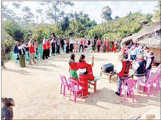
မြို့နယ်(ပြန်/ဆက်)

ထို့နောက် နာဂရိုးရာအခမ်းအနားသို့ တက်ရောက်ကြသည့် ဌာနဆိုင်ရာများ၊ ပွဲတော်လာပရိသတ်များကို နာဂရိုးရာ အစားအစာများဖြင့် ဧည့်ခံကျွေးမွေးပြီး ညနေ ၆ နာရီတွင် နာဂတိုင်းရင်းသား မျိုးနွယ်စုလေးမျိုးက အကပဒေသာများနှင့် ခေတ်သစ်အကများဖြင့် ဖျော်ဖြေတင်ဆက်ခဲ့ကြောင်း သိရသည်။