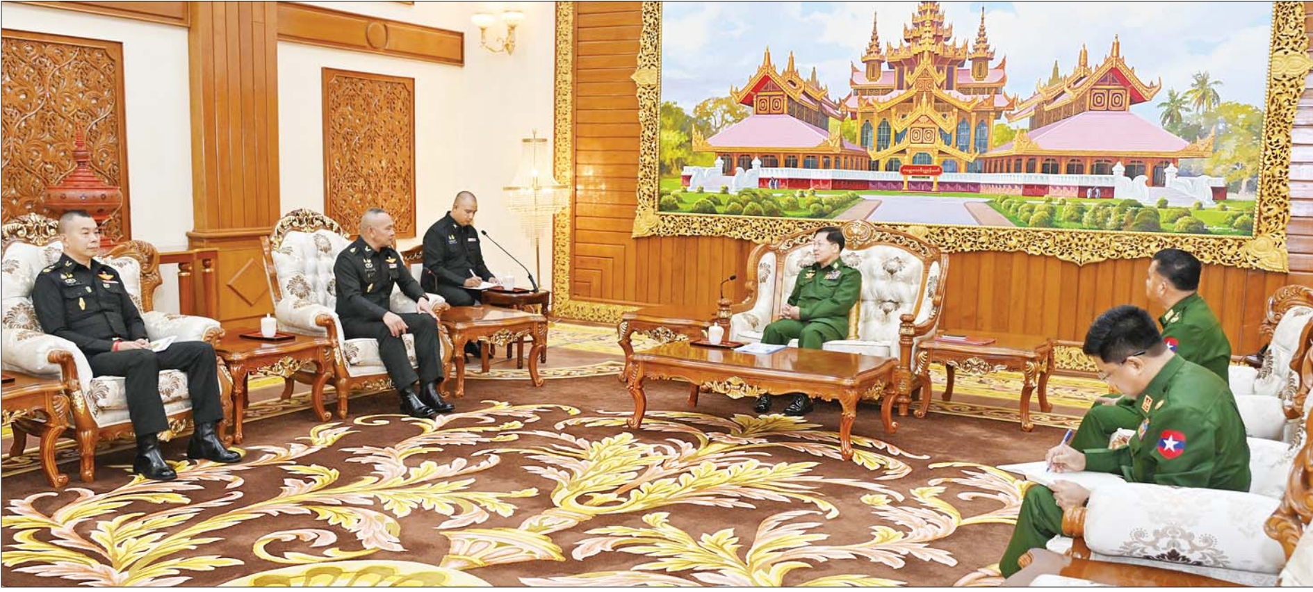
နိုင်ငံတော်စီမံအုပ်ချုပ်ရေးကောင်စီဥက္ကဋ္ဌ တပ်မတော်ကာကွယ်ရေးဦးစီးချုပ် ဗိုလ်ချုပ်မှူးကြီး မင်းအောင်လှိုင် ထိုင်းဘုရင့်ကြည်းတပ်ဦးစီးချုပ်ရုံး အကြံပေးဘုတ်အဖွဲ့ဥက္ကဋ္ဌ General Kittisak Boonprathamchai ဦးဆောင်သည့် ကိုယ်စားလှယ်အဖွဲ့အား လက်ခံတွေ့ဆုံစဉ်။