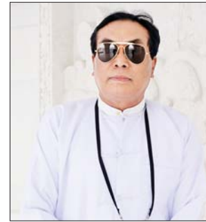
ဦးသိန်းအောင်