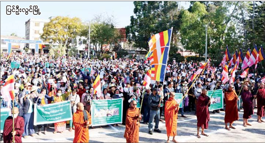
ပြင်ဦးလွင်မြို့

အသီးသီးကလည်း ကန့်ကွက် ရှုတ်ချသည့် ကြေညာချက်များ ထုတ်ပြန်ထားရှိကြောင်း သိရ သတင်းစဉ်