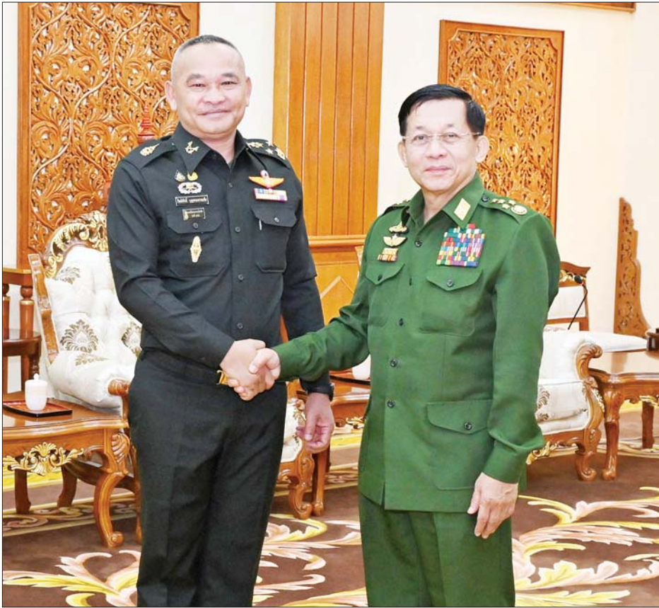
နိုင်ငံတော်စီမံအုပ်ချုပ်ရေးကောင်စီဥက္ကဋ္ဌ တပ်မတော်ကာကွယ်ရေးဦးစီးချုပ် ဗိုလ်ချုပ်မှူးကြီး မင်းအောင်လှိုင် ထိုင်းဘုရင့်ကြည်းတပ်ဦးစီးချုပ်ရုံး အကြံပေးဘုတ်အဖွဲ့ဥက္ကဋ္ဌ General Kittisak Boonprathamchai အား ရင်းရင်းနှီးနှီးနှုတ်ဆက်စဉ်။