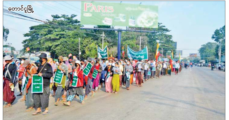
တောင်ငူမြို့