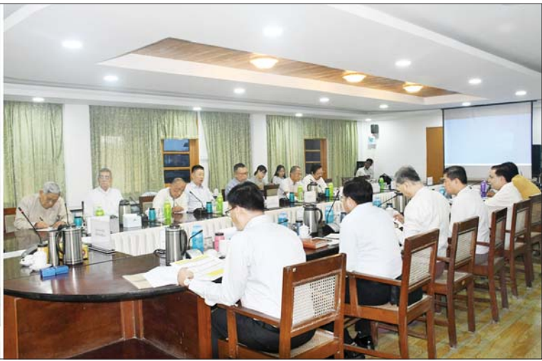
ပြည်ထောင်စုဝန်ကြီး ဦးမောင်မောင်အုန်း ၂၀၂၃ ခုနှစ်အတွက် မြန်မာ့ရုပ်ရှင်ထူးချွန်ဆုချီးမြှင့်ပွဲအခမ်းအနား အောင်မြင်စွာ ကျင်းပနိုင်ရေး မြန်မာနိုင်ငံရုပ်ရှင်အစည်းအရုံး၊ မြန်မာနိုင်ငံဂီတအစည်းအရုံးတို့မှ တာဝန်ရှိသူများနှင့် တွေ့ဆုံဆွေးနွေးပွဲတွင် အမှာစကားပြောကြားစဉ်။

မြန်မာနိုင်ငံဂီတ အစည်းအရုံး(ဗဟို)ဥက္ကဋ္ဌ ဦးလွင်မြင့်နှင့် တက်ရောက်လာကြသူများက ၂၀၂၃ ခုနှစ်အတွက် မြန်မာ့ရုပ်ရှင်ထူးချွန်ဆုချီးမြှင့်ပွဲအခမ်းအနား အောင်မြင်စွာ ကျင်းပနိုင်ရေးနှင့် စပ်လျဉ်း၍ ဝိုင်းဝန်း