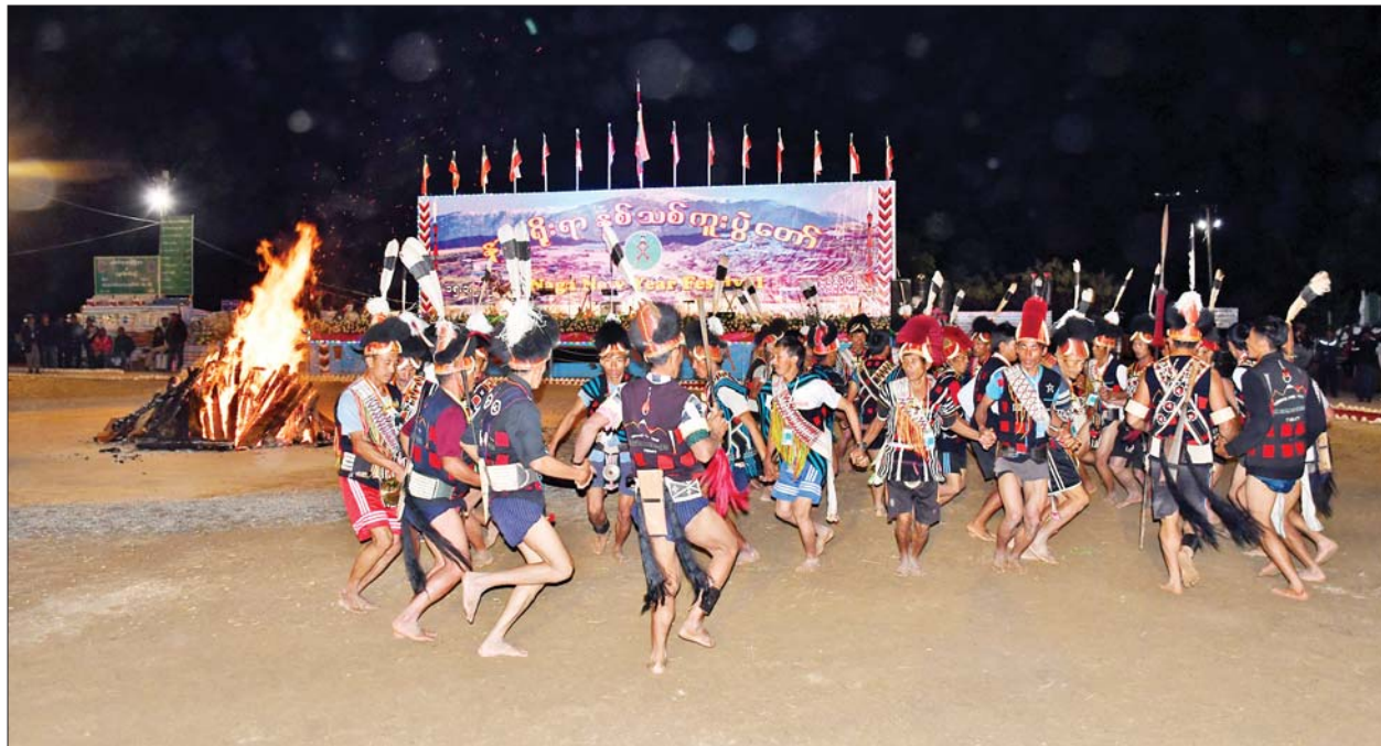
၂၀၂၄ ခုနှစ် နာဂရိုးရာ နှစ်သစ်ကူးပွဲတော် မီးပုံပွဲတွင် နာဂရိုးရာမျိုးနွယ်စုများအလိုက် ရိုးရာအကများဖြင့် ကပြဖျော်ဖြေနေစဉ်။

ဖဲကြိုးဖြတ်ဖွင့်လှစ်ပေး ဦးစွာ နိုင်ငံတော်စီမံအုပ်ချုပ်ရေး ကောင်စီအဖွဲ့ဝင် ဒုတိယဝန်ကြီး