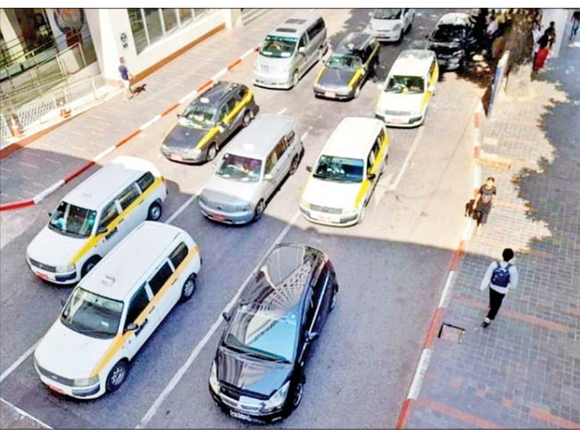
ဘေးနှစ်ဖက်ကိုယ်ထည်တွင် အဝါရောင်လှိုင်း Sticker တပ်ဆင်ပြေးဆွဲနေသည့် City Taxi ယာဉ်များကို တွေ့ရစဉ်။

ရန်ကုန် ဇန်နဝါရီ ၁၅ ရန်ကုန်တိုင်းဒေသကြီးအတွင်း ခရီးသည် တင်ဆောင်ပြေးဆွဲလျက်ရှိသည့် City Taxi ယာဉ်များ ဘေးနှစ်ဖက်ကိုယ်ထည်တွင် အဝါရောင်လှိုင်း Sticker တပ်ဆင်ရန် ညွှန်ကြားထားရာ ဇန်နဝါရီ ၁၅ ရက်အထိ စာရင်းများအရ အဝါရောင်လှိုင်း Sticker တပ်ဆင်ပြီးစီးမှု ၈၆ ရာခိုင်နှုန်း တပ်ဆင်ပြီးစီး နေပြီဖြစ်ပြီး ခန့်မှန်းယာဉ်အစီးရေ ၅၀၀၀၀ အထိရှိပြီဖြစ်ကြောင်း ရန်ကုန်တိုင်းဒေသကြီး ပုဂ္ဂလိကသယ်ယူပို့ဆောင်ရေး ကြီးကြပ်မှု ကော်မတီ (YRTC)မှ သိရသည်။ City Taxi ယာဉ်များအား အခြားသော ယာဉ်များနှင့် ကွဲပြားပြီး ထင်သာမြင်သာ ရှိစေရန်၊ လုံခြုံမှုရှိစေရန်၊ ယာဉ်အန္တရာယ်၊ လမ်းအန္တရာယ်ကင်းရှင်းစေရန်နှင့် နိုင်ငံတကာ Taxi ယာဉ်များနည်းတူ “City Taxi ယာဉ်များ ၏ စာမျက်နှာ ၃ ကော်လံ ၁ သို့ ○