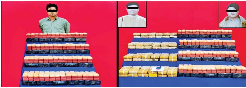
ပြစ်မှုကျူးလွန်သူများအား သိမ်းဆည်းရမိသည့် မူးယစ်ဆေးဝါးများနှင့်အတူ တွေ့ရစဉ်

နေပြည်တော် ဇန်နဝါရီ ၁၅ မန္တလေးတိုင်းဒေသကြီး၌ ငွေကျပ် ၄ ဒသမ ၉၄၅ ဘီလီယံတန်ဖိုးရှိ စိတ်ကြွေးသွပ်ဆေးပြား ၁၆ သိန်းကျော်နှင့် ဘိန်းဖြူ ၁၀၀ ကီလိုကျော် သိမ်းဆည်းရမိခဲ့ကြောင်း မြန်မာနိုင်ငံရဲတပ်ဖွဲ့မှ သိရသည်။