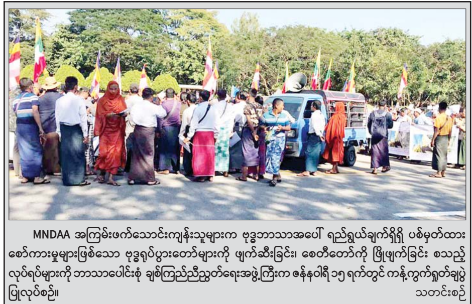
MNDAA အကြမ်းဖက်သောင်းကျန်းသူများက ဗုဒ္ဓဘာသာအပေါ် ရည်ရွယ်ချက်ရှိရှိ ပစ်မှတ်ထားစော်ကားမှုများဖြစ်သော ဗုဒ္ဓရုပ်ပွားတော်များကို ဖျက်ဆီးခြင်း၊ စေတီတော်ကို ဖြိုဖျက်ခြင်း စသည့် လုပ်ရပ်များကို ဘာသာပေါင်းစုံ ချစ်ကြည်ညီညွတ်ရေးအဖွဲ့ကြီးက ဇန်နဝါရီ ၁၅ ရက်တွင် ကန့်ကွက်ရှုတ်ချပွဲ ပြုလုပ်စဉ်။ သတင်းစဉ်