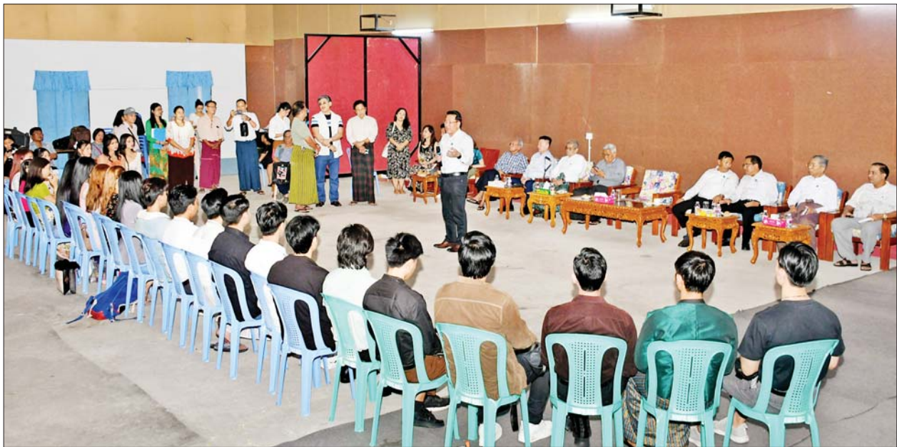
ပြည်ထောင်စုဝန်ကြီး ဦးမောင်မောင်အုန်း မြန်မာနိုင်ငံရုပ်ရှင်အစည်းအရုံး၌ လေ့ကျင့်ဆောင်ရွက်နေသည့် ရွှေကြိုမောင်မယ်များအား တွေ့ဆုံအားပေးစကားပြောကြားစဉ်။

ရန်ကုန် ဇန်နဝါရီ ၁၅ ပြန်ကြားရေး ဝန်ကြီးဌာန ပြည်ထောင်စု ဝန်ကြီး ဦးမောင်မောင်အုန်းသည် ယနေ့ မွန်းလွဲပိုင်းတွင် ရန်ကုန်မြို့ ဗဟန်းမြို့နယ် ဝက်ပါလမ်းရှိ မြန်မာနိုင်ငံ ရုပ်ရှင်အစည်းအရုံး တွင် ၂၀၂၃ ခုနှစ်အတွက် မြန်မာ့ ရုပ်ရှင်ထူးချွန်ဆုချီးမြှင့်ပွဲ၌ ပါဝင် ဆောင်ရွက်ကြမည့် ရွှေကြိုလူငယ် မောင်မယ်များ လေ့ကျင့် ဆောင်ရွက်နေမှုကို လည်းကောင်း၊ ဗဟန်းမြို့နယ် ဖိုတိုလစ်သိုပုံနှိပ် စက်ရုံတွင် ကျောင်းသုံးစာအုပ်များ ပုံနှိပ်ဆောင်ရွက်နေမှုနှင့် မင်္ဂလာ တောင်ညွန့် မြို့နယ်တွင် တည်ဆောက်မည့် စာဆိုဗိမာန် အဆောက်အအုံ မြေနေရာတို့ကို လည်းကောင်း သွားရောက် ကြည့်ရှုစစ်ဆေးသည်။