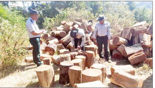
ပဲခူးတိုင်းဒေသကြီး၌ ဖမ်းဆီးရမိမှု။

နေပြည်တော် ဇန်နဝါရီ ၁၅ တရားမဝင် ကုန်သွယ်မှု တိုက်ဖျက်ရေး ဦးဆောင်ကော်မတီ၏ ကြီးကြပ်ကွပ်ကဲမှုဖြင့် တရားမဝင်ကုန်သွယ်မှုများကို ဥပဒေနှင့်အညီ ထိရောက်စွာတားဆီးအရေးယူနိုင်ရေး ဆောင်ရွက်လျက်ရှိရာ ဇန်နဝါရီ ၁၃ ရက်တွင် နေပြည်တော်ကောင်စီနယ်မြေ တရားမဝင်ကုန်သွယ်မှု တိုက်ဖျက်ရေးအထူးအဖွဲ့၏ စီမံခန့်ခွဲမှုဖြင့် တာဝန်ကျ ပူးပေါင်းအဖွဲ့က စစ်ဆေးမှုများ ဆောင်ရွက်ခဲ့ရာ ပျဉ်းမနန်းမြို့နယ်၌ တရားမဝင် အခြားသစ် သုည ဒသမ ၃၀၀ တန် (ခန့်မှန်းတန်ဖိုးငွေ ၃၂၁၂၂ ကျပ်) ကို သိမ်းဆည်းရမိခဲ့ပြီး သစ်တော ဥပဒေနှင့်အညီ အရေးယူဆောင်ရွက်လျက်ရှိသည်။