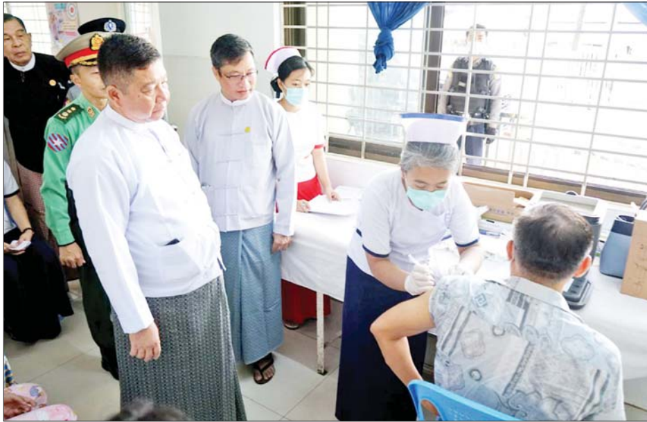
နံနက်ပိုင်းတွင် (Pfizer)ကိုဗစ်-၁၉ ရောဂါ ကာကွယ်ဆေး ထပ်ဆောင်းထိုးနှံခြင်းကို ပြည်နယ်ဝန်ကြီးချုပ်၊ ပြည်နယ်တရားလွှတ်တော် တရားသူကြီးချုပ်၊ ပြည်နယ်ဝန်ကြီးများ၊ သက်ကြီးရွယ်အိုဘိုးဘွားများ၊

မော်လမြိုင် ဇန်နဝါရီ ၁၅ ကိုဗစ်-၁၉ ရောဂါ ကာကွယ်ဆေးထိုးနှံခြင်းသည် အဓိကအခန်းကဏ္ဍတွင် ပါဝင်သည့် လုပ်ငန်းတစ်ရပ်ဖြစ်သောကြောင့် မွန်ပြည်နယ်အတွင်းရှိ မြို့နယ်အသီးသီးတို့၌ သံဃာတော်များ၊ သာသနာ့ နှယ်ဝင်သီလရှင်များ၊ ဘာသာရေးခေါင်းဆောင်များ အပါအဝင် လူမျိုးမရွေး ဘာသာမရွေး ဒေသခံပြည်သူများ၊ အကျဉ်းသား၊ အကျဉ်းသူများ၊ မသန်စွမ်းသူများ၊ နာတာရှည်ရောဂါအခံရှိသူများ၊ ပြည်သူများ၊ အသက် ငါးနှစ်မှ (၁၂)နှစ်အထက် အခြေခံပညာမူလတန်း၊ အလယ်တန်းနှင့် အထက်တန်းအဆင့် ကျောင်းသား ကျောင်းသူများစသည့် ဦးတည်အုပ်စုများသတ်မှတ်၍ မော်လမြိုင် ပြည်သူ့ဆေးရုံများမှ ဆရာဝန်များ၊ သူနာပြုများ၊ ကျန်းမာရေးဝန်ထမ်းများနှင့် စေတနာ့ ဝန်ထမ်းများက ကာကွယ်ဆေးထိုးခြင်း လုပ်ငန်းများကို စဉ်ဆက်မပြတ် ဆောင်ရွက်ပေးလျက်ရှိသည်။ ထိုသို့ ဆောင်ရွက်လျက်ရှိရာ ဇန်နဝါရီ ၁၅ ရက်