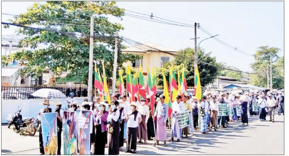
စော်ကားနေသည့် အကြမ်းဖက်သမားများ (ကျရှုံးပါစေ)၊ စေတီပုထိုး၊ ဆင်းတုတော်များကို ဖျက်ဆီးနေကြသည့် အကြမ်းဖက်သမားများ (ကျရှုံးပါစေ)” စသည့် ကြွေးကြော်သံများ၊ ဆိုင်းဘုတ်များကို ဆောင်ရွက် ငြိမ်းချမ်းစွာ ဆန္ဒထုတ်ဖော်ခဲ့ကြကြောင်း သိရသည်။ သတင်းစဉ်

ဦးဆောင်သူများက ဗုဒ္ဓဘာသာအပေါ် ဖျက်ဆီးရန် လုပ်ဆောင်နေမှုများကို ကန့်ကွက်ကြောင်း ဟောပြောကြသည်။ ထို့နောက် ကန့်ကွက်ရှုတ်ချပွဲသို့ တက်ရောက်လာကြသူများက “ဗုဒ္ဓဘာသာကို စော်ကားဖျက်ဆီးနေကြသည့် အကြမ်းဖက်သမားများအား (ဆန့်ကျင်ကြ)၊ စေတီပုထိုးနှင့် ဗုဒ္ဓဆင်းတုတော်များအား ဖျက်ဆီးနေကြသည့် အကြမ်းဖက်သမားများနှင့် သာသနာဖျက်များအား (ဆန့်ကျင်ကြ)၊ လူမျိုးရေးခွဲခြား၊ သာသနာကို စော်ကားဖျက်ဆီးနေသူများအား (ဆန့်ကျင်ကြ)၊ အကြမ်းဖက်အားပေး လောက်ကောင်များအား (အလိုမရှိ)၊ သာသနာဖျက် အကြမ်းဖက်သမားများအား (အလိုမရှိ)၊ ဗုဒ္ဓသာသနာကို ဖျက်ဆီး