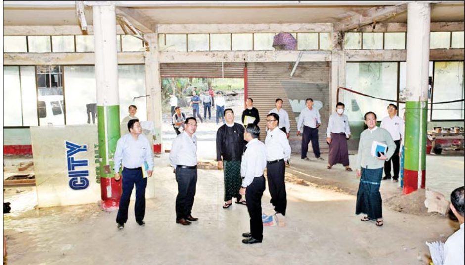
ပြည်ထောင်စုဝန်ကြီး ဦးမောင်မောင်အုန်း မင်္ဂလာတောင်ညွန့်မြို့နယ် ဥယျာဉ်ရပ်ကွက်ရှိ စာဆိုဗိမာန် အဆောက်အအုံ တည်ဆောက်မည့်မြေနေရာအား ကြည့်ရှုစဉ်။

ရန် ကြိုးစားကြစေလိုကြောင်း ပြောကြားကာ ရွှေကြိုလူငယ် မောင်မယ်များအား ရင်းရင်းနှီးနှီး နှုတ်ဆက်သည်။ ထို့နောက် ဗဟန်းမြို့နယ် ငါးထပ်ကြီးဘုရားလမ်းရှိ ပုံနှိပ်ရေး နှင့်ထုတ်ဝေရေးဦးစီးဌာန ဖိုတို လစ်သိုပုံနှိပ်စက်ရုံသို့ သွားရောက် နိုင်ငံကိုအကျိုးပြုသည့် နိုင်ငံ့ သားကောင်းများ ဖြစ်ပေါ်လာမည် ဖြစ်ကြောင်း။