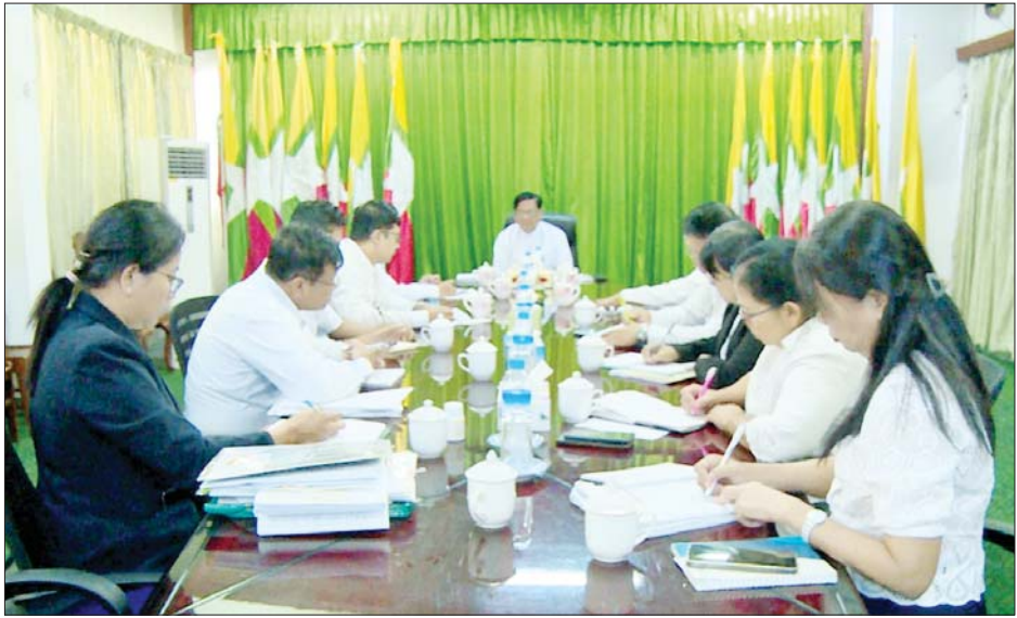
လုပ်ငန်းစဉ်များကို တတ်စွမ်းသရွေ့ ဖြည့်ဆည်းဆောင်ရွက်ပေးရန်နှင့် ပူးပေါင်းဆောင်ရွက်လျက်ရှိသည့် မိတ်ဖက်အဖွဲ့အစည်းများနှင့် ညှိနှိုင်းပေါင်းစပ်၍ လူမှုတာဝန်သိမှုလုပ်ငန်း (Corporate Social Responsibility - CSR) များကို ဆောင်ရွက်ပေးရန် မှာကြား၍ ဝန်ထမ်းများ၏ တင်ပြချက်များကို ညှိနှိုင်းပေါင်းစပ်ဆောင်ရွက်ပေးခဲ့ကြောင်း သိရသည်။ သတင်းစဉ်

ဆောင်ရွက်ရာတွင် ထုတ်ပြန်ထားသည့် ဥပဒေ၊ နည်းဥပဒေ၊ လုပ်ထုံးလုပ်နည်း၊ အမိန့်ညွှန်ကြားချက်များနှင့်အညီ လိုက်နာဆောင်ရွက်ရန် ပြည်ပမှ ဆေးဝါးတင်သွင်းမှု လျှော့ချနိုင်ရေးအတွက် ကုန်ထုတ်လုပ်မှုလုပ်ငန်းများ တိုးမြှင့်ဆောင်ရွက်နိုင်ရေး စီမံဆောင်ရွက်ရန်၊ စက်ရုံ၌ ရှိပြီးဖြစ်သည့် နည်းပညာများ တိမ်ကောပျောက်ပျက်မှုမရှိစေရေး ဆင့်ပွားသင်တန်းများ ဖွင့်လှစ်ရန်နှင့် မျိုးဆက်သစ်လူငယ်များကိုလည်း လေ့ကျင့်သင်ကြားပေးထုတ်ရန်၊ ကုန်ထုတ်လုပ်မှုလုပ်ငန်းများ အရှိန်အဟုန်မပျက်ဆောင်ရွက်နိုင်ရေးအတွက် လိုအပ်မည့် စက်အရန်ပစ္စည်းများကို ကြိုတင်ဝယ်ယူဖြည့်တင်းထားရန်၊ ဈေးကွက်အတွင်း လိုအပ်သောဆေးဝါးများ ထုတ်လုပ်ပေးနိုင်ရေးအတွက် ဈေးကွက်သုတေသနလုပ်ငန်းများ ဆောင်ရွက်ရန်၊ ဝန်ထမ်းများ၏ သက်သာချောင်ချိရေး