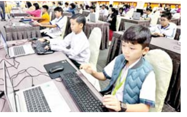
စာမျက်နှာ » ၅

ကျွန်တော်တို့နိုင်ငံဟာ ဗုဒ္ဓဘာသာကို အထွတ်အမြတ်ထား ကိုးကွယ်တဲ့နိုင်ငံဖြစ်တဲ့အတွက်ကြောင့် အခုလို မြတ်ဗုဒ္ဓရဲ့ ရုပ်ပွားတော်မြတ်ကြီးကို ပူးမြော်ရတာက ကျွန်တော်တို့အတွက် ထူးကဲတဲ့လက်တစ်ပါး ဖြစ်ပါတယ်