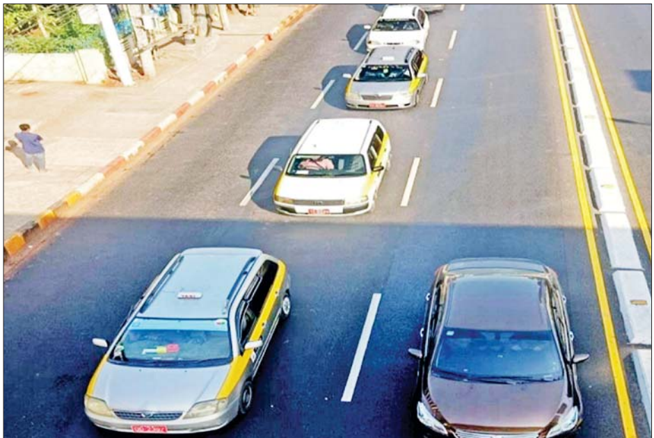
ဘေးနှစ်ဖက်ကိုယ်ထည်တွင် အဝါရောင်လိုင်း Sticker တပ်ဆင်ပြေးဆွဲနေသည့် City Taxi ယာဉ်များကို တွေ့ရစဉ်။

ဆောင်းဝင်လာတော့ ဆောင်းရဲ့အအေးဓာတ်နဲ့ ထပ်ရှိနေသေးတော့ အပင်တွေက ပေါက်အားများ တယ်။ ညောင်ပင်တွေဆိုလည်း ဆေးထိုးသတ်ရ တယ်”ဟု ၎င်းကဆိုသည်။ ပုဂံဒေသသို့ ပြည်တွင်း၊ ပြည်ပ ခရီးသွားဝင်ရောက်မှုများလည်း ရှိနေပြီး လမ်းကောင်းမွန်ရေး၊ ဘုရားများကိုလည်း ကြည့်ညို သပွယ်ဖွယ်ဖြစ်စေရန် သာသနာရေးနှင့်ယဉ်ကျေးမှု ဝန်ကြီးဌာန ပြည်ထောင်စုဝန်ကြီးက လမ်းညွှန်ချက် ပေးထားပြီး တိုင်းဒေသကြီးအစိုးရအဖွဲ့၏ ကြပ်မတ် မှုဖြင့် ဌာနဆိုင်ရာများပူးပေါင်း၍ ရဟန်း၊ သံဃာတော် များ ဦးဆောင်သည့် ပရဟိတအဖွဲ့များက ပူးပေါင်း ဆောင်ရွက်လျက်ရှိကြောင်း သိရသည်။ MT