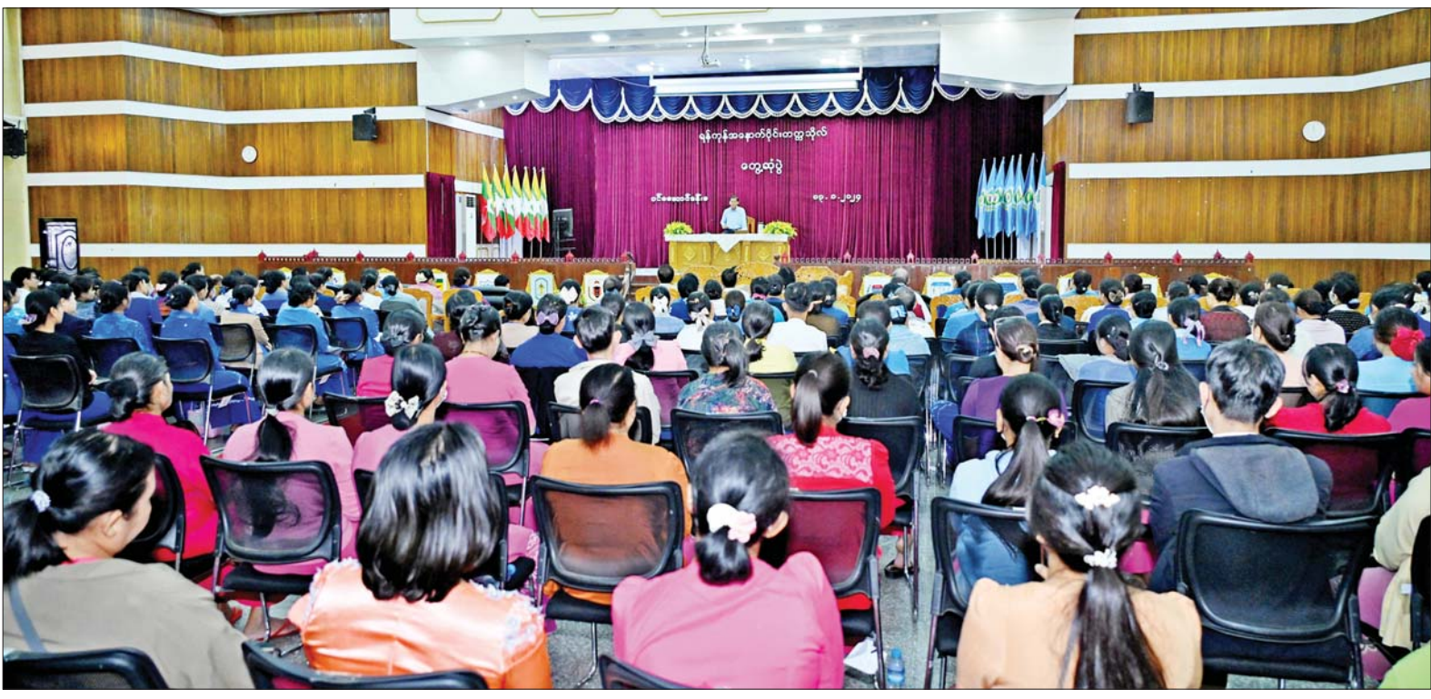
နိုင်ငံတော်စီမံအုပ်ချုပ်ရေးကောင်စီဥက္ကဋ္ဌ နိုင်ငံတော်ဝန်ကြီးချုပ် ဗိုလ်ချုပ်မှူးကြီးမင်းအောင်လှိုင် ရန်ကုန်အနောက်ပိုင်းတက္ကသိုလ်၌ ပါမောက္ခချုပ်၊ ဆရာ ဆရာမများနှင့် ကျောင်းသား ကျောင်းသူများအား တွေ့ဆုံအမှာစကားပြောကြားစဉ်။

နေပြည်တော် ဇန်နဝါရီ ၁၃ နိုင်ငံတော် စီမံအုပ်ချုပ်ရေး ကောင်စီဥက္ကဋ္ဌ နိုင်ငံတော်ဝန်ကြီး ချုပ်ဗိုလ်ချုပ်မှူးကြီး မင်းအောင်လှိုင် သည် ခရီးစဉ်တွင် လိုက်ပါလာသည့် အဖွဲ့ဝင်များလိုက်ပါ၍ ယနေ့ နံနက်ပိုင်းတွင် ရန်ကုန်တိုင်း ဒေသကြီး လှိုင်သာယာမြို့နယ်ရှိ ရန်ကုန်အနောက်ပိုင်း နည်းပညာ တက္ကသိုလ်နှင့် ထန်းတပင်မြို့နယ် ရှိ ရန်ကုန်အနောက်ပိုင်းတက္ကသိုလ် တို့သို့ သွားရောက်ကြည့်ရှုစစ်ဆေး သည်။