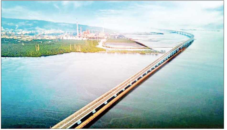
တံတားဖွင့်ပွဲအခမ်းအနားသို့ အိန္ဒိယနိုင်ငံ တိုက်ရိုက်အထွတ်ထွေအဖွဲ့အစည်းနှင့် အဖွဲ့အစည်းများ ပူးပေါင်းပါဝင်ခဲ့သည်။ အဖွဲ့အစည်းများ ပူးပေါင်းပါဝင်ခဲ့သည်။ တံတားဖွင့်ပွဲအခမ်းအနားသို့ အိန္ဒိယနိုင်ငံ တိုက်ရိုက်အထွတ်ထွေအဖွဲ့အစည်းနှင့် အဖွဲ့အစည်းများ ပူးပေါင်းပါဝင်ခဲ့သည်။ အဖွဲ့အစည်းများ ပူးပေါင်းပါဝင်ခဲ့သည်။ တံတားဖွင့်ပွဲအခမ်းအနားသို့ အိန္ဒိယနိုင်ငံ တိုက်ရိုက်အထွတ်ထွေအဖွဲ့အစည်းနှင့် အဖွဲ့အစည်းများ ပူးပေါင်းပါဝင်ခဲ့သည်။ အဖွဲ့အစည်းများ ပူးပေါင်းပါဝင်ခဲ့သည်။

အဆိုပါတံတားကို ၂၀၁၈ ခုနှစ်တွင် စတင် တည်ဆောက်ခဲ့သည်။ ကုန်ကျစရိတ်၏ ၇၀ ရာခိုင်နှုန်းကျော်သည် ဂျပန်အပြည်ပြည်ဆိုင်ရာ ပူးပေါင်းဆောင်ရွက်ရေးအေဂျင်စီမှ ချေးငွေ ယန်း ၂၄၂ ဘီလီယံ (ဒေါ်လာ ၁ ဒသမ ၇ ဘီလီယံ) ခန့်ရှိသည်။ အိန္ဒိယဝန်ကြီးချုပ် မိုဒီက ပင်လယ်ကူးတံတားကို ဇန်နဝါရီ ၁၂ ရက်တွင် ဖွင့်လှစ်ခဲ့ပြီး အဆိုပါ တံတားတည်ဆောက်ရေးတွင် ဂျပန်အစိုးရ၏ ပူးပေါင်းဆောင်ရွက်မှုအတွက် ကျေးဇူးတင်ရှိကြောင်း ပြောကြားသည်။ မွမ်ဘိုင်းမြို့သည် အိန္ဒိယနိုင်ငံ၏ အကြီးဆုံး စီးပွားရေးမြို့တော်ဖြစ်သည်။ လူဦးရေ ၁၈ သန်းခန့် နေထိုင်လျက်ရှိပြီး ယခုဖွင့်လှစ်ခဲ့သည့်တံတားသည် ယာဉ်ကြောပိတ်ဆို့မှုနှင့် လေထုညစ်ညမ်းမှုကို သက်သာစေမည်ဖြစ်သည်။