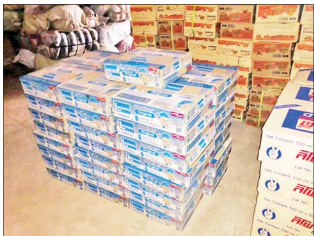
ရန်ကုန်တိုင်းဒေသကြီးမှ သိမ်းဆည်းရမိမှု။

နေပြည်တော် ဇန်နဝါရီ ၁၃ တရားမဝင်ကုန်သွယ်မှုတိုက်ဖျက်ရေး ဦးဆောင်ကော်မတီ၏ ကြီးကြပ်ကွပ်ကဲမှုဖြင့် တရားမဝင်ကုန်သွယ်မှုများကို ဥပဒေနှင့်အညီ ထိရောက်စွာ တားဆီးအရေးယူနိုင်ရေး ဆောင်ရွက်လျက်ရှိရာ ဇန်နဝါရီ ၁၂ ရက်တွင် ရန်ကုန်တိုင်းဒေသကြီး တရားမဝင်ကုန်သွယ်မှုတိုက်ဖျက်ရေးအထူးအဖွဲ့၏ စီမံခန့်ခွဲမှုဖြင့် တာဝန်ကျူးပေါင်းအဖွဲ့က စစ်ဆေးမှုများ ဆောင်ရွက်ရာတွင် အမှတ်(၃)လမ်းဆုံ၌ မော်လမြိုင်မြို့မှ ရန်ကုန်မြို့သို့ မောင်းနှင်လာသော ယာဉ်တစ်စီးပေါ်မှ တရားဝင်စာရွက်စာတမ်း အထောက်အထားတင်ပြနိုင်ခြင်းမရှိသည့် Lactasoy ပဲနီဘူး ၂၇၀၀၊ Spy Wine ပုလင်း ၂၂၈၀ အပါအဝင် ကုန်ပစ္စည်းခြောက်မျိုး (ခန့်မှန်း တန်ဖိုးငွေကျပ် ၉၃၅၄၀၀၀)နှင့် အဆိုပါပစ္စည်းများ တင်ဆောင်လာသည့် Mitsubishi Fuso Bus တစ်စီး (ခန့်မှန်းတန်ဖိုးငွေကျပ် ၁၈၀၀၀၀၀) စုစုပေါင်း ခန့်မှန်းတန်ဖိုးငွေကျပ် ၂၇၃၅၄၀၀၀ ကို သိမ်းဆည်းရမိခဲ့ပြီး အကောက်ခွန်လုပ်ထုံးလုပ်နည်းများနှင့်အညီ အရေးယူဆောင်ရွက်လျက်ရှိသည်။