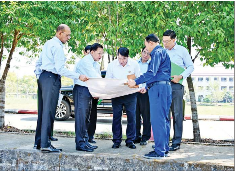
နိုင်ငံတော်စီမံအုပ်ချုပ်ရေးကောင်စီဥက္ကဋ္ဌ နိုင်ငံတော်ဝန်ကြီးချုပ် ဗိုလ်ချုပ်မှူးကြီးမင်းအောင်လှိုင် ရန်ကုန်အနောက်ပိုင်းတက္ကသိုလ် ပရိဝုဏ်အတွင်း အရိပ်ရအပင်ကြီးများ စိုက်ပျိုးရေး၊ သန့်ရှင်းသာယာလှပရေးနှင့် ဥပဓိရုပ်ကောင်းမွန်စေရေးအတွက် လိုအပ်သည်များ လမ်းညွှန်မှာကြားစဉ်။