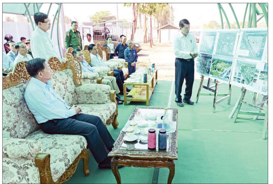
နိုင်ငံတော်စီမံအုပ်ချုပ်ရေးကောင်စီဥက္ကဋ္ဌ နိုင်ငံတော်ဝန်ကြီးချုပ် ဗိုလ်ချုပ်မှူးကြီးမင်းအောင်လှိုင် အား မြို့တော်ဝန် ဦးဗိုလ်ဌေးက ဘုရင့်နောင်တံတားပန်းခြံနှင့် ဘုရင့်နောင်ပန်းခြံတည်ဆောက်ရေး စီမံကိန်းလုပ်ငန်း ဆောင်ရွက်နေမှုအခြေအနေများကို ရှင်းလင်းတင်ပြစဉ်။

မြို့ပြနှင့် စက်မှုလုပ်ငန်းများ ဖွံ့ဖြိုးတိုးတက်စေရေး ကြိုးပမ်းဆောင်ရွက် ဆွေးနွေးတင်ပြမှုများအပေါ် နိုင်ငံတော်စီမံ အုပ်ချုပ်ရေးကောင်စီဥက္ကဋ္ဌ နိုင်ငံတော်ဝန်ကြီးချုပ်က လှိုင်သာယာမြို့နယ်ကို ယခုထက်ပိုမိုဖွံ့ဖြိုးတိုးတက် စေရေးနှင့် စက်မှုလုပ်ငန်းများ ဖွံ့ဖြိုးတိုးတက်စေရေး အတွက် လိုအပ်သည်များ ဖြည့်ဆည်းဆောင်ရွက်ပေး နိုင်ရန် လာရောက်ခြင်းဖြစ်ကြောင်း၊ လှိုင်သာယာမြို့ နယ်ကို အဆင့်မြင့်တင်နိုင်ရေးအတွက် ဆောင်ရွက် လျက်ရှိကြောင်း၊ ထိန်းပင်အမှိုက်ပုံမှ လျှပ်စစ်ဓာတ်အား