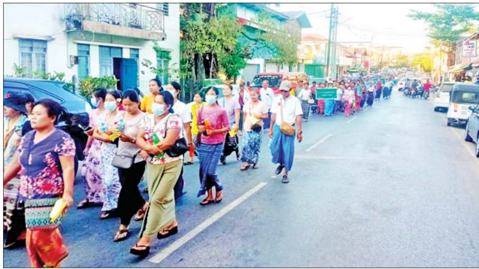
ကျွန်ုပ်တို့ စေတီပုထိုးနှင့် ဗုဒ္ဓဆင်းတုတော်များအား သာသနာပျက်များအား ဆန့်ကျင်၍ အကြမ်းဖက်ပျက်ဆီးနေကြသည့် အကြမ်းဖက်သမားများနှင့် အားပေး လေ့လာကောင်းများအား အလိုမရှိ၊ ဗုဒ္ဓ

ဘားအံ ဇန်နဝါရီ ၁၃ ဗုဒ္ဓဘာသာဝင်များ၏ အထွတ်အမြတ်ထားရာ စေတီပုထိုးများ၊ ဗုဒ္ဓဆင်းတုတော်များအား ပျက်ဆီးစော်ကားနေသည့် အကြမ်းဖက်သောင်းကျန်းသူများနှင့် သာသနာပျက်မိစ္ဆာများအား ကန့်ကွက်ရှုတ်ချပွဲကို ဘားအံမြို့ အမှတ်(၁)ရပ်ကွက် အမှတ်(၁)အခြေခံပညာအထက်တန်းကျောင်း အားကစားကွင်း၌ ယနေ့ညနေ ၄ နာရီ မိနစ် ၂၀ တွင် ကျင်းပသည်။