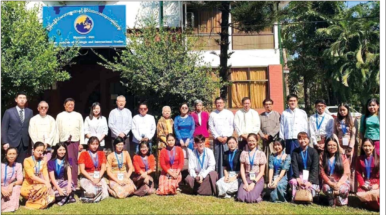
မြန်မာနိုင်ငံမဟာဗျူဟာနှင့် နိုင်ငံတကာလေ့လာရေးအဖွဲ့နှင့် မဲခေါင်ဒေသ လေ့လာရေးဆိုင်ရာ ကမ္ဘာ့စင်တာတို့ ပူးပေါင်း၍ မြန်မာလူငယ်များအတွက် စွမ်းရည်တည်ဆောက်မှုသင်တန်းကို ၂၀၂၃ ခုနှစ် ဒီဇင်ဘာလ ၂၇ ရက်နေ့မှ ၂၈ ရက်နေ့အထိ ရန်ကုန်မြို့ရှိ မြန်မာနိုင်ငံ မဟာဗျူဟာနှင့် နိုင်ငံတကာလေ့လာရေးအဖွဲ့ရုံး၌ ကျင်းပရာ သင်တန်းသို့ တက်ရောက်သူများအား တွေ့ရစဉ်။

စွမ်းဆောင်ရည်တည်ဆောက်ခြင်းအတွက် မရှိမဖြစ်အရေးကြီး သည့် အချက်သည် အပေါ်ယံပြောင်းလဲခြင်းထက် အတွင်းသဏ္ဍာန် ပြောင်းလဲခြင်းဖြစ်သော စိတ်ထားနှင့် ခံယူချက်များ ပြောင်းလဲရေးပင် ဖြစ်သည်။ အနာဂတ်မျိုးဆက်သစ်များဖြစ်ကြသော ကျောင်းသား အရွယ် လူငယ်များမှစ၍ စွမ်းဆောင်ရည်တည်ဆောက်ခြင်းဖြင့် အရည်