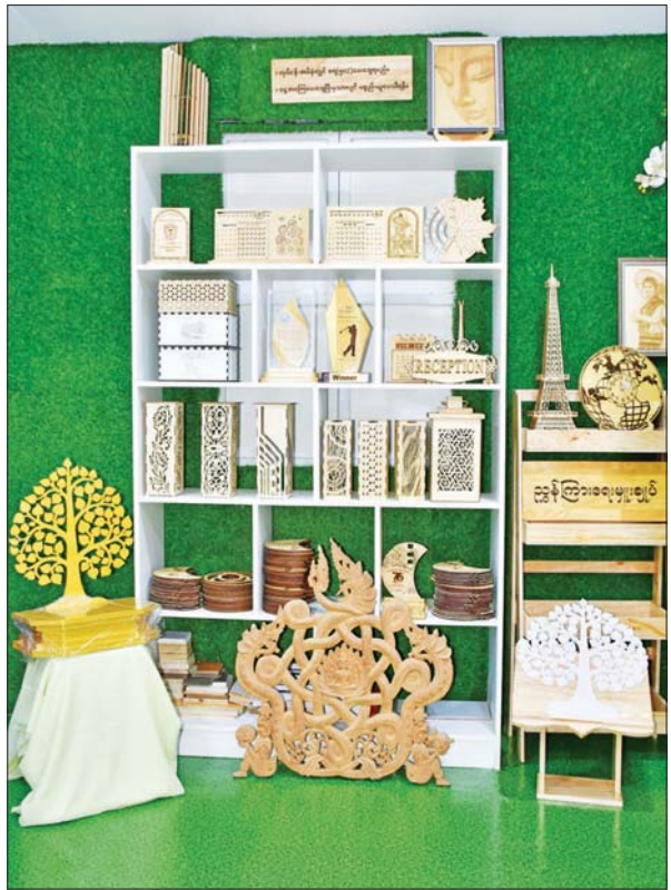
CNC သစ်ထွင်းလေဆာပန်းချီဖြင့် ထုတ်လုပ်အလှဆင်ထားသော အသုံးအဆောင်များ။