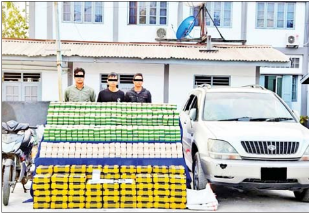
သိမ်းဆည်းရမိသည့် ဘိန်းဖြူများနှင့်အတူ တွေ့ရစဉ်။

နေပြည်တော် ဇန်နဝါရီ ၁၃ မန္တလေး တိုင်းဒေသကြီး ချမ်းမြသာစည် မြို့နယ်၌ ငွေကျပ်သိန်း ၄၄၀၀ တန်ဖိုးရှိ ဘိန်းဖြူ ၁၇ ဒသမ ၆ ကီလို သိမ်းဆည်းရမိခဲ့ကြောင်း သိရသည်။