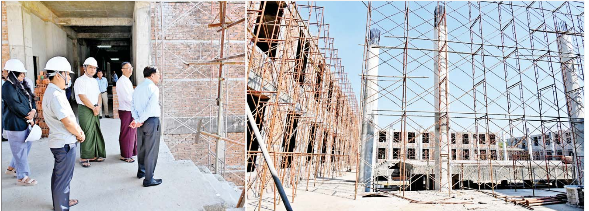
နိုင်ငံတော်စီမံအုပ်ချုပ်ရေးကောင်စီဥက္ကဋ္ဌ နိုင်ငံတော်ဝန်ကြီးချုပ် ဗိုလ်ချုပ်မှူးကြီးမင်းအောင်လှိုင် ရန်ကုန်အနောက်ပိုင်းနည်းပညာတက္ကသိုလ်အတွင်း ကြည့်ရှုစစ်ဆေးစဉ်။

»» စာမျက်နှာ ၄ မှ ဖွင့်လှစ်ပေးခဲ့ကြောင်း၊ သို့သော် အချို့တက္ကသိုလ်များ၌ ပညာသင်ကြားမှုများ နည်းပါးသည်ကိုတွေ့ရသဖြင့် မိမိတို့နိုင်ငံအတွက် အဓိကလိုအပ်သည့် ဘာသာရပ်များနှင့် မဖြစ်မနေသင်ကြားရမည့် သာသနာ့ရပ်များကို ဦးစားပေးသင်ကြားပေးနိုင်ရေး ဆောင်ရွက်ပေးခဲ့ကြောင်း၊ မိမိအနေဖြင့် ကွန်ပျူတာတက္ကသိုလ်နှင့် နည်းပညာတက္ကသိုလ်များကို ပိုမိုကျယ်ပြန့်သည့် သင်ကြားသင်ယူမှုနယ်ပယ်များ ထည့်သွင်းဆောင်ရွက်နိုင်သော Polytechnic University များအဖြစ် ဆောင်ရွက်နိုင်ရေး ဆွေးနွေးဆောင်ရွက်ခဲ့ကြောင်း၊ နိုင်ငံတော်၏ ပညာရေးလိုအပ်ချက်ကို ဖြည့်ဆည်းပေးနိုင်ရန်အတွက် ပညာရှင်များနှင့် ဆွေးနွေးဆောင်ရွက်သွားရမည်ဖြစ်ကြောင်း။ မိမိတို့နိုင်ငံသည် စိုက်ပျိုးရေးနှင့် မွေးမြူရေးကို အဓိကဆောင်ရွက်သည့် နိုင်ငံဖြစ်သော်လည်း စိုက်ပျိုးမွေးမြူရေး ပညာရှင်များ မွေးထုတ်ပေးနိုင်သည့် တက္ကသိုလ်နည်းပါးကြောင်း၊ ထို့ကြောင့်