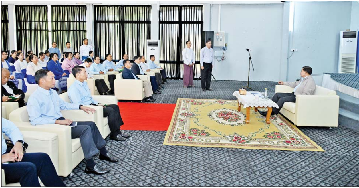
နိုင်ငံတော်စီမံအုပ်ချုပ်ရေးကောင်စီဥက္ကဋ္ဌ နိုင်ငံတော်ဝန်ကြီးချုပ် ဗိုလ်ချုပ်မှူးကြီးမင်းအောင်လှိုင်အား ရန်ကုန်အနောက်ပိုင်း နည်းပညာ တက္ကသိုလ်၌ တာဝန်ရှိသူတစ်ဦးက ရှင်းလင်းတင်ပြစဉ်။

ထို့ကြောင့် မိမိတို့နိုင်ငံ၏ ပညာ ရေးကို မဖြစ်မနေ မြှင့်တင် ဆောင်ရွက်ရမည် ဖြစ်သဖြင့် မိမိတို့တာဝန်ယူချိန်တွင် ပညာရည် မြှင့်တင်ရေးအဖြစ် KG + 9 အဆင့် အထိ မဖြစ်မနေသင်ကြားရန် မူဝါဒချမှတ်ဆောင်ရွက်ခဲ့ကြောင်း၊ KG + 9 တက်ရောက်အောင်မြင်သူ များအနေဖြင့် စိုက်ပျိုးမွေးမြူရေး