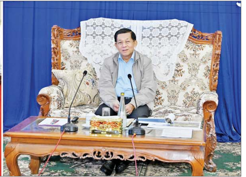
နိုင်ငံတော်စီမံအုပ်ချုပ်ရေးကောင်စီဥက္ကဋ္ဌ နိုင်ငံတော်ဝန်ကြီးချုပ် ဗိုလ်ချုပ်မှူးကြီးမင်းအောင်လှိုင် လှိုင်သာယာမြို့ မြို့ပြဖွံ့ဖြိုးတိုးတက်ရေး တာဝန်ရှိသူများနှင့် တွေ့ဆုံအမှာစကားပြောကြားစဉ်။