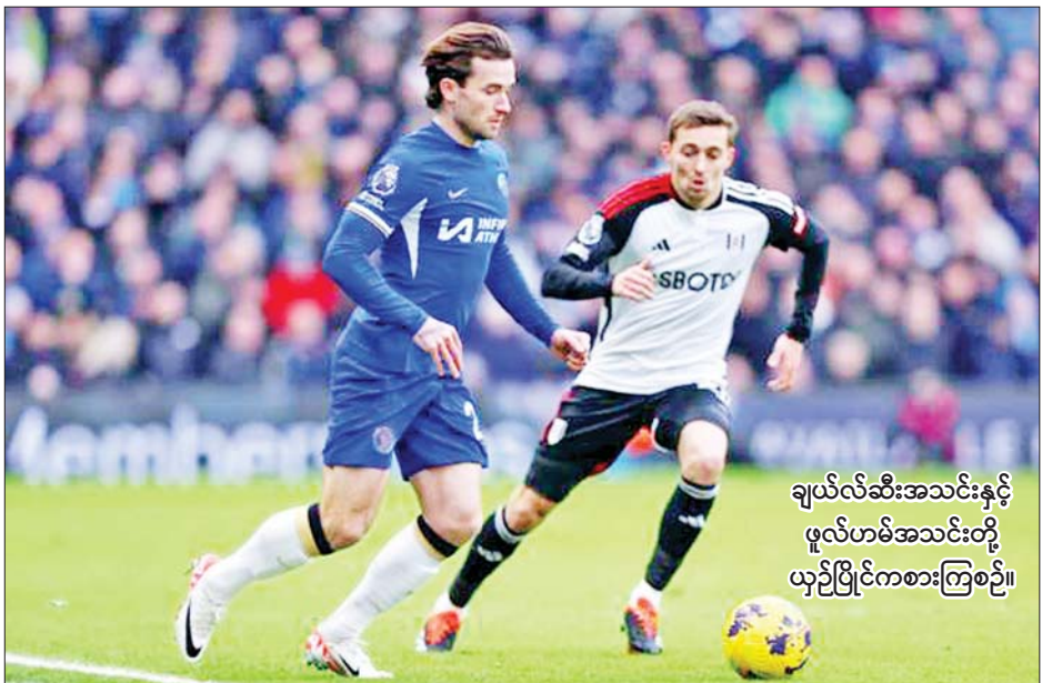
ချယ်လ်ဆီးအသင်းနှင့် ဖူလ်ဟမ်အသင်းတို့ ယှဉ်ပြိုင်ကစားကြစဉ်။

ပရီမီယာလိဂ် ပွဲစဉ်(၂၁)ရဲ့ ဇန်နဝါရီ ၁၃ ရက် ညပိုင်းအစောဆုံးပွဲစဉ်အဖြစ် အိမ်ကွင်း စတမ်းဖို့ဒ်ဘရစ်ချ်မှာ ယှဉ်ပြိုင်ကစားခဲ့ရတဲ့ ချယ်လ်ဆီးအသင်းနဲ့ ဖူလ်ဟမ်အသင်းတို့ပွဲစဉ်မှာ ချယ်လ်ဆီးအသင်းက ဖူလ်ဟမ်အသင်းကို တစ်ဂိုး-ဂိုးမရှိနဲ့ အနိုင်ရရှိခဲ့ပါတယ်။ အဲဒီပွဲစဉ်မှာ ချယ်လ်ဆီးအသင်းအတွက် တစ်လုံးတည်းသော အနိုင်ဂိုးကို ပထမပိုင်း ပွဲကစားချိန်အပြီး နာကျင်အချိန်ပို လေးမိနစ်မှာ ရရှိခဲ့တဲ့ ပင်နယ်တီသွင်းဂိုးကို ပယ်လ်မာက ဂိုးအဖြစ် ပြောင်းလဲစာမျက်နှာ ၂၄ ကော်လံ ၁ သို့ ၀