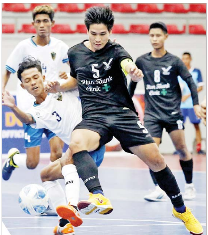
M-Million FC အသင်းနှင့် Seven FC အသင်းတို့ ယှဉ်ပြိုင်ကစားကြစဉ်။

ရန်ကုန် ဇန်နဝါရီ ၁၃ MFF ဖူဆယ်လိဂ်-၂ ပြိုင်ပွဲ ပွဲစဉ် (၃) ကို ဇန်နဝါရီ ၁၃ ရက်က ရန်ကုန်မြို့ သုဝဏ္ဏဘောလုံးကွင်းရှိ MFF ဖူဆယ်အားကစားရုံ၌ ဆက်လက်ကျင်းပသည်။ နိုင်ငံပွဲဆက် ပွဲစဉ် (၃) တွင် Black Cross အသင်းက SGF အသင်းကို လေးဂိုး-သုံးဂိုး၊ YRG အသင်းက Sun Far အသင်းကို သုံးဂိုး-နှစ်ဂိုး၊ TG United အသင်းက Maryar အသင်းကို ခုနစ်ဂိုး-သုံးဂိုး၊ ရွှေပြည်သာ အသင်းက Noka United အသင်းကို သုံးဂိုး-တစ်ဂိုး၊ M-Million အသင်းက Seven အသင်းကို ငါးဂိုး-နှစ်ဂိုး၊ KKY အသင်းက Golden Yoma အသင်းကို လေးဂိုးပြတ်ဖြင့် အနိုင်ရခဲ့သည်။ နှစ်ပွဲဆက်အနိုင်ရထားသည့် အသင်းများအနက် ရွှေပြည်သာအသင်းနှင့် Black Cross အသင်းသာ နိုင်ငံပွဲဆက်ခဲ့ပြီး Golden Yoma အသင်းမှာမူ ရှုံးပွဲကြုံတွေ့ခဲ့သည်။ သတင်း - ရှိုင်းထက်ဇော်