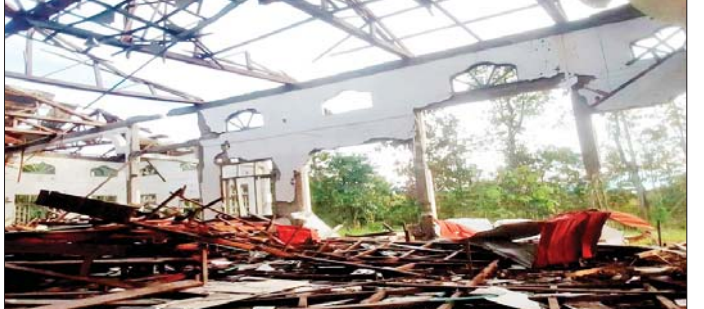
စက်တင်ဘာ ၂၆ ရက်တွင် KNPP နှင့် PDF အမည်ခံ အကြမ်းဖက်သမားများက ကယားပြည်နယ် ပန်တီန်းမြို့ရှိ ကက်သလစ်ဘုရားရှိခိုးကျောင်းအား လက်နက်ကြီးများဖြင့် ပစ်ခတ်ခဲ့သဖြင့် ပျက်စီးနေသည့် မှတ်တမ်းဓာတ်ပုံ။