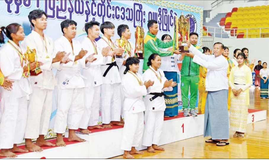
နိုင်ငံတော်စီမံအုပ်ချုပ်ရေးကောင်စီအဖွဲ့ဝင် ပိုးရယ်အောင်သိန်း စုပေါင်းတံခွန်စိုက်ဆုပေးလေးရရှိသည့် ကချင်ပြည်နယ်အသင်းအား တံခွန်စိုက်ဆုပေးလေး ပေးအပ်စဉ်။

ထို့နောက် နိုင်ငံတော်စီမံအုပ်ချုပ်ရေးကောင်စီအဖွဲ့ဝင် ပိုးရယ်အောင်သိန်းက စုပေါင်းတံခွန်စိုက် ဆုပေးလေးနှင့် ကချင်ပြည်နယ် အသင်းကို တံခွန်စိုက်ဆုပေးလေး ပေးအပ်သည်။