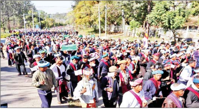
ဘုရားစေတီပုထိုးများနှင့် ဘာသာရေးဆိုင်ရာအဆောက်အအုံများကို ဖျက်ဆီးမှုအပေါ် တောင်းကြီးမြှင့်တင် ကန့်ကွက်ရှုတ်ချပွဲပြုလုပ်စဉ်။