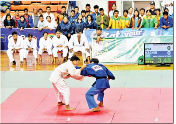
နိုင်ငံတော်စီမံအုပ်ချုပ်ရေးကောင်စီအဖွဲ့ဝင်များ ၂၀၂၃-၂၀၂၄ ခုနှစ် ပြည်နယ်နှင့် တိုင်းဒေသကြီး ဂျူဒိုပြိုင်ပွဲ အသင်းလိုက်ဗိုလ်လုပွဲစဉ်အဖြစ် ကချင်ပြည်နယ်အသင်းနှင့် ဧရာဝတီတိုင်းဒေသကြီးအသင်းတို့ ယှဉ်ပြိုင်နေမှုကို ကြည့်ရှုအားပေးစဉ်။

ကြည့်ရှုအားပေး ဦးစွာ ၂၀၂၃-၂၀၂၄ ခုနှစ် ပြည်နယ်နှင့် တိုင်းဒေသကြီး ဂျူဒိုပြိုင်ပွဲ အသင်းလိုက်ဗိုလ်လုပွဲစဉ် အဖြစ် ကချင်ပြည်နယ်အသင်းနှင့် ဧရာဝတီတိုင်းဒေသကြီးအသင်းတို့ ယှဉ်ပြိုင်နေမှုကို ကြည့်ရှုအားပေးကြသည်။ ထို့နောက် ဆုချီးမြှင့်ပွဲကို