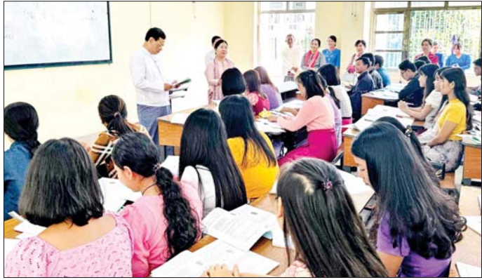
တာဝန်ပညာထူးချွန်မှုတို့ကို အလေးထားသင်ကြား များက ဆောင်ရွက်ရမည့် တာဝန်ဝတ္တရားများကို လေ့ကျင့်ကာ စည်းကမ်းလိုက်နာမှုနှင့် ပြုမူနေထိုင်မှု ရှင်းလင်းပြောကြားကာ ဆရာ ဆရာမ၊ သင်တန်းသား တွင် စံနမူနာဖြစ်စေရေး လမ်းညွှန်ပြသပေးရန် သင်တန်းသူများကို ရင်းရင်းနှီးနှီး တွေ့ဆုံတိုင်ဆက် မှာကြားပြီး နိုင်ငံတော်က ပံ့ပိုးစောင့်ရှောက်ပေးနေ ခဲ့ကြောင်း သိရသည်။ သတင်းစဉ်

ကျောင်းသူများ အမှန်တကယ်အကျိုးရှိထိရောက်စွာ အသုံးပြုရန်မှာကြားသည်။ ယင်းနောက်စာကြည့်တိုက်နှင့် ကွန်ပျူတာဌာန သို့ရောက်ရှိကာ ဝန်ထမ်းဆိုင်ရာအချက်အလက်များ လစဉ်မှတ်တမ်းပြုစု ထိန်းသိမ်းထားရှိမှုများနှင့် အွန်လိုင်းစာကြည့်တိုက်တို့ကို ကြည့်ရှုစစ်ဆေးသည်။ ဆက်လက်၍ ဒုတိယဝန်ကြီးနှင့်အဖွဲ့သည် လှည်းကူးပညာရေးဒီဂရီကောလိပ်သို့ ရောက်ရှိ ကာ ပညာအားမာန်ခန်းမ၌ ကျောင်းအုပ်ကြီး၊ ဆရာ ဆရာမများ၊ ကျောင်းသား ကျောင်းသူများနှင့် တွေ့ဆုံ ၍ ပညာရေးဒီဂရီကောလိပ်မှ ဘွဲ့ရရှိပြီးနောက် အခြေခံပညာကျောင်းများတွင် တပည့် ကျောင်းသား ကျောင်းသူများကို ပြန်လည်သင်ကြားပို့ချပေးမည့် ဆရာ ဆရာမလောင်းများဖြစ်သဖြင့် ဘာသာရပ် ကျွမ်းကျင်မှု သင်ပြနည်းတတ်ကျွမ်းမှု အားကစားနှင့်