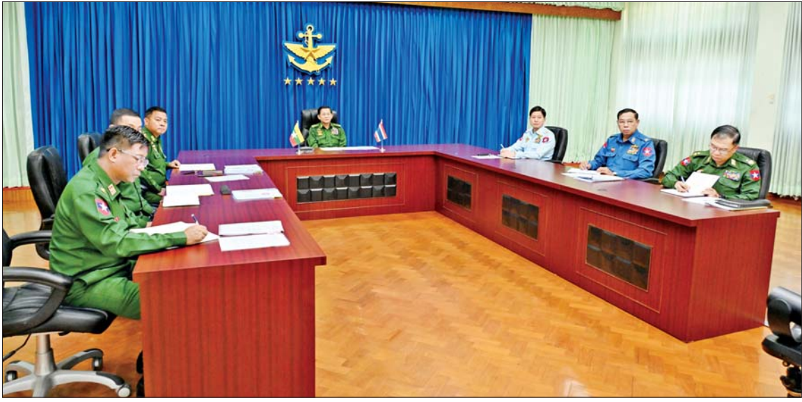
နိုင်ငံတော်စီမံအုပ်ချုပ်ရေးကောင်စီဥက္ကဋ္ဌ တပ်မတော်ကာကွယ်ရေးဦးစီးချုပ် ဗိုလ်ချုပ်မှူးကြီး မင်းအောင်လှိုင် ထိုင်းဘုရင့်တပ်မတော်ကာကွယ်ရေးဦးစီးချုပ် General Songwit Noonpackdee နှင့် Video Conferencing ဖြင့် တွေ့ဆုံဆွေးနွေးပွဲသို့ တက်ရောက်စဉ်။

အမြင်ချင်းဖလှယ်ဆွေးနွေး ထိုသို့ တွေ့ဆုံဆွေးနွေးရာတွင် နှစ်နိုင်ငံနှင့် နှစ်နိုင်ငံ တပ်မတော် နှစ်ရပ်အကြား ဆက်ဆံရေးနှင့် ချစ်ကြည်ရင်းနှီးမှုနှင့် ပူးပေါင်းဆောင်ရွက်မှုများကို တိုးမြှင့်ဆောင်ရွက်သွားနိုင်မည့် အခြေအနေများ၊ နယ်စပ်ကုန်သွယ်မှုများ လုံခြုံရေးအခြေအနေများ၊ အဆင်ပြေစေရေးအတွက် နှစ်နိုင်ငံအကြား နိုင်ငံရေးအရ တပ်မတော်နှစ်ရပ်အကြား လုံခြုံရေးအရ ပူးပေါင်းဆောင်ရွက်သွားမည့်အခြေအနေများ၊ မူးယစ်ဆေးဝါးတားဆီး နှိမ်နင်းရေးနှင့် အကြမ်းဖက်မှု တိုက်ဖျက်ရေး၊ တရားမဝင်ကုန်သွယ်မှုတိုက်ဖျက်ရေး၊ သတင်းအချက်အလက် ဖလှယ်ရေး၊ နှစ်နိုင်ငံနယ်စပ်ဒေသများ၌ တည်ငြိမ်အေးချမ်းရေး၊ အွန်လိုင်းလောင်းကစားမှုနှင့် ငွေကြေးလိမ်လည်မှုများတိုက်ဖျက်ရေးတို့တွင် ပူးပေါင်းဆောင်ရွက်လျက်ရှိသည့် အခြေအနေများ၊ အထူးသဖြင့် နှစ်နိုင်ငံနယ်စပ် မြဝတီမြို့အနီး၌ အွန်လိုင်း လောင်းကစားမှုနှင့် ငွေကြေး