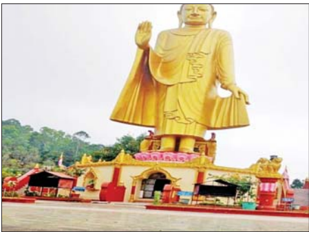
ဒီဇင်ဘာ ၄ ရက်တွင် MNDA ပူးပေါင်းအကြမ်းဖက်သောင်းကျန်းသူများက ရှမ်းပြည်နယ်(မြောက်ပိုင်း) မုဆယ်မြို့ရှိ ရပ်တော်မုဘုရားနှင့် မိဂဒါမဟာစေတီကို Drone များအသုံးပြု၍ Drop Bomb ဖြင့် ပစ်ချခဲ့သဖြင့် ပျက်စီးခဲ့သည့် မှတ်တမ်းဓာတ်ပုံ။

နေပြည်တော် ဇန်နဝါရီ ၁၂ အကြမ်းဖက်သောင်းကျန်းသူများသည် တိုင်းဒေသကြီးနှင့် ပြည်နယ်အချို့တွင် ဗုဒ္ဓဘာသာ မြန်မာနိုင်ငံသားများ အထွတ်အမြတ်ထားရာ ဘုရား၊ စေတီ၊ ပုထိုးများအပေါ်အဝင် အခြားဘာသာရေးဆိုင်ရာ အဆောက်အအုံများ၊ ဘုရားရှိခိုးကျောင်းများကို Drone များအသုံးပြု၍ Drop Bomb များ ပစ်ချတိုက်ခိုက်ခြင်း၊ လက်နက်ကြီးများဖြင့် ပစ်ခတ်တိုက်ခိုက်ခြင်း၊ ဘာသာရေးဆိုင်ရာ အဆောက်အအုံများအတွင်းသို့ ဝင်ရောက်နေရာယူ၍ အခိုင်အမာခံစစ်စခန်း ပြုလုပ်ခြင်း စသည့် အဖျက်အမှောင့်လုပ်ငန်းများဖြင့် ဗုဒ္ဓဘာသာအပေါ် ရည်ရွယ်ချက်ရှိရှိ ပစ်မှတ်ထားတိုက်ခိုက်ခြင်းများ လုပ်ဆောင်လျက်ရှိသည်။ ထိုသို့လုပ်ဆောင်လျက်ရှိရာ ၂၀၂၃ ခုနှစ် ဧပြီ ၂၁ ရက်တွင် PDF အမည်ခံ အကြမ်းဖက်သမား