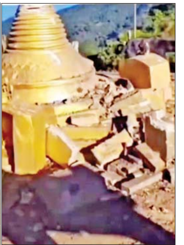
၂၀၂၄ ခုနှစ် ဇန်နဝါရီ ၈ ရက်တွင် MNDA ပူးပေါင်းအကြမ်းဖက်သောင်းကျန်းသူများက ရှမ်းပြည်နယ်(မြောက်ပိုင်း) လောက်ကိုင်မြို့နယ် စီအေအေကျေးရွာ၏မြောက်ဘက် ပွိုင့်-၂၅၀၂ တောင်ကုန်း (ဆင်ဦးကင်းကုန်း)ပေါ်ရှိ စေတီတစ်ဆူအား သံတူဖြင့် ထုရိုက်ဖျက်ဆီးနေသည့် မှတ်တမ်းဓာတ်ပုံ။