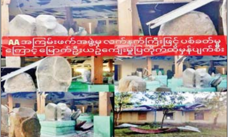
ဒီဇင်ဘာ ၂၅ ရက်တွင် AA အကြမ်းဖက်သောင်းကျန်းသူများက မြောက်ဦးမြို့ ယဉ်ကျေးမှု ပြတိုက်အား လက်နက်ကြီးများဖြင့် ပစ်ခတ်ခဲ့သဖြင့် ပျက်စီးခဲ့သည့် မှတ်တမ်းဓာတ်ပုံ။

ဒီဇင်ဘာ ၁၃ ရက်တွင် TNLA အကြမ်းဖက်သောင်းကျန်းသူများက နမ့်ခမ်းမြို့ ပေါက်တိုက်မရပ်ကွက်ရှိ ဧယျာသုခ ဘုန်းတော်ကြီးကျောင်းအား လက်နက်ကြီးများဖြင့် ပစ်ခတ်ခဲ့သဖြင့် ပျက်စီးခဲ့သည့် မှတ်တမ်းဓာတ်ပုံ။