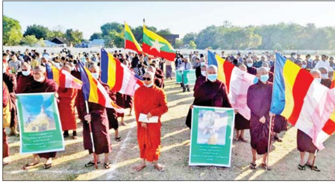
ဘုရားစေတီပုထိုးများနှင့် ဘာသာရေးဆိုင်ရာအဆောက်အအုံများကို ဖျက်ဆီးမှုအပေါ် ကျောက်ပန်းတောင်းမြှင့်တင် ကန့်ကွက်ရှုတ်ချပွဲပြုလုပ်စဉ်။