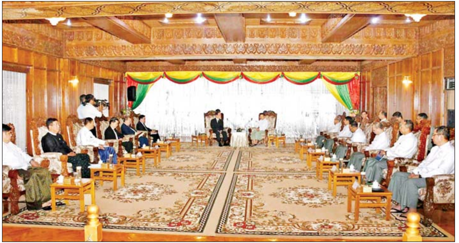
ဆိုင်ရာအထူးကိုယ်စားလှယ်နှင့် မှတ်ပုံတင်ခွင့်ပြုပြီး နိုင်ငံရေးပါတီများ တွေ့ဆုံခဲ့ကြပြီး ရွေးကော်မရှင်ဆိုင်ရာကိစ္စရပ်များနှင့်စပ်လျဉ်း၍ လည်းကောင်း၊ နိုင်ငံရေးပါတီဆိုင်ရာ ကိစ္စရပ်များနှင့်စပ်လျဉ်း၍လည်းကောင်း မေးမြန်းဆွေးနွေးခဲ့ကြသည်။ အဆိုပါတွေ့ဆုံပွဲအခမ်းအနားသို့ ပြည်ထောင်စုရွေးကော်မရှင်

ဆက်လက်၍ ရန်ကုန်တိုင်းဒေသကြီးအစိုးရအဖွဲ့ရုံး မင်္ဂလာခန်းမ၌ ပြည်ထောင်စုရွေးကော်မရှင်ကော်မရှင်၊ အာဆီယံဥက္ကဋ္ဌ၏ မြန်မာနိုင်ငံ