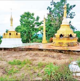
ဇူလိုင် ၂ ရက်တွင် KNLA နှင့် PDF အမည်ခံ အကြမ်းဖက်သမားများက ဥကရစ်ထနယ်မြေအတွင်းရှိ စေတီပုထိုးနှင့် ဘာသာရေးအဆောက်အအုံများအတွင်း ဝင်ရောက်နေရာယူကာ ဆက်သွယ်ရေးမြောင်းများ၊ ပစ်ကျင်းများပြုလုပ်၍ ခံစစ်စခန်းပြုလုပ်ခဲ့သည့် မှတ်တမ်းဓာတ်ပုံ။